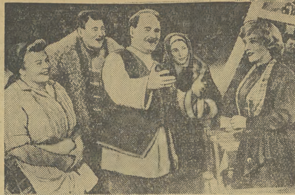
PIEŚŃ O ZIEMI SYBERYJSKIEJ — film odznaczony na Międzynarodowym Festiwalu Filmowym w Mariańskich Łaźniach

LONDYN. Według doniesienia agencji Reutera z Lake Success, rzecznik rządu brytyjskiego oświadczył, że rząd Wielkiej Brytanii nie będzie mógł poprzeć wniosku rządu Izrael o przyjęcie tego państwa do Organizacji Narodów Zjednoczonych.