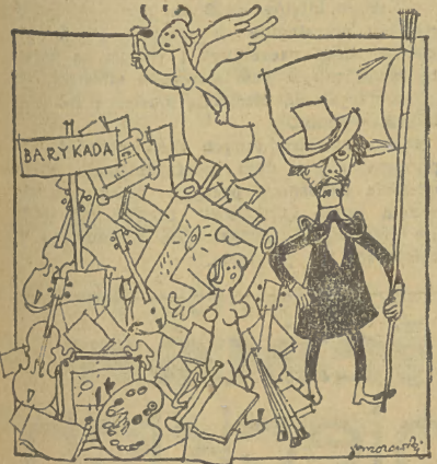
Kongres Intelektualistów we Wrocławiu stworzy barykadę pokoju i wolności