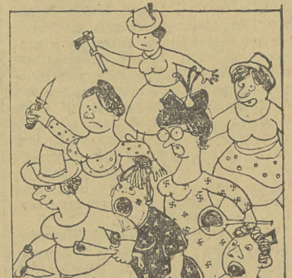
W Bizonii gospodynie niemieckie zbuntowały się przeciw wyższym cenom