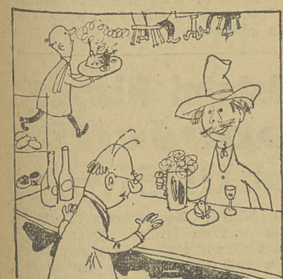
Żalwa wypadły doskonale! Wzrasta także produkcja piwa

Rozbijające jednostki związkowej z kół chrześcijańsko-demokratycznych wypowiedziały się przeciw temu strajkowi.