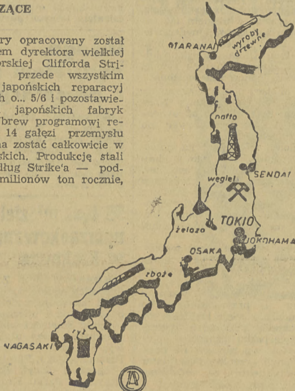
Mapka produkcyjna Japonii

Pierwsza rocznica ogłoszenia niepodległości Indii została uczczona w Bombaju, Delhi i Kalkucie tylko oficjalnymi uroczystościami. Na wielu domach wywieszono czarne flagi na znak rozczarowania szerokich mas ludności niedotrzymaniem przez W. Brytanię zobowiązania udzielenia Indiom zupełnej niezależności i swobody. (x)