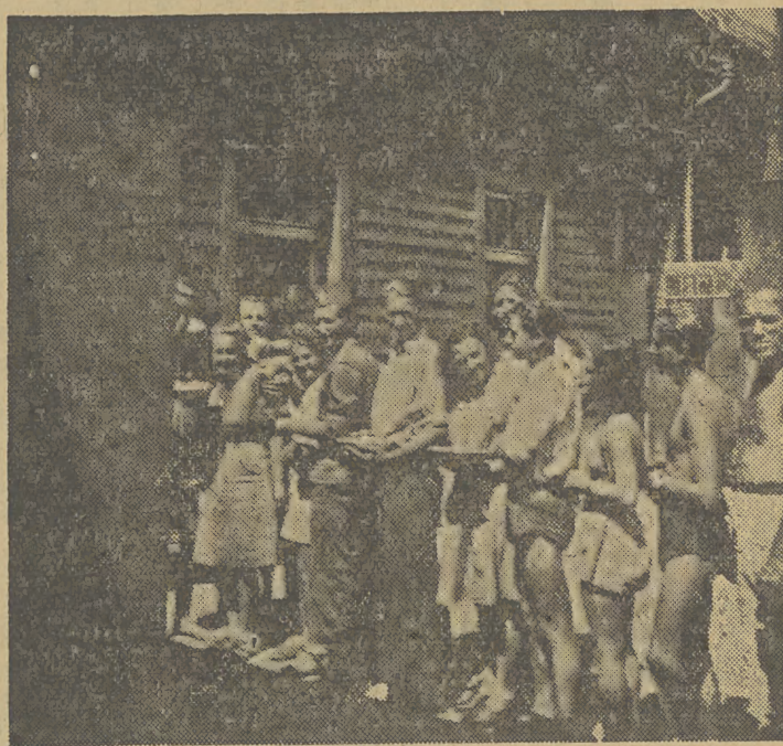
(patrz art. na stronie 4-tej)

Na początku było niezbyt dobrze, ale pokonałmy trudności