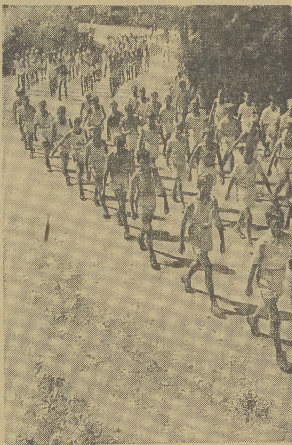
II Kompania obozowa grupami maszeruje na ćwiczenia