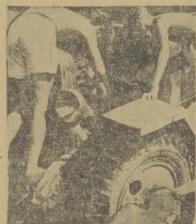
Obozowy samochód popsul się. Chłopcy ochoczo przystępują do naprawy

patrz na nas na wartowni trochę z ukosa, że tacy mali idą do generała. Generał wita się z nami, podając nam wszystkim rękę i pozwala mówić. Pa-