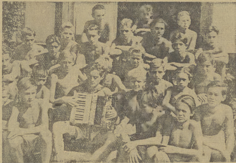
Miło jest posłuchać muzyki