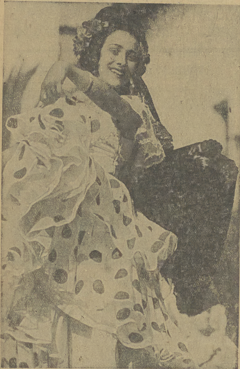
Ognista Włoszka tańczy

Jedni tańczą i spekulują, inni napróżno szukają pracy