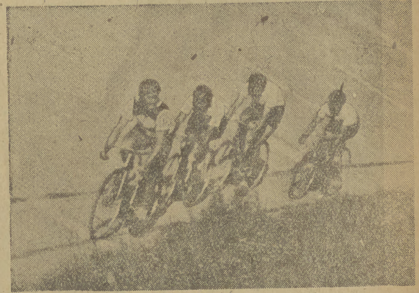
Kolarska reprezentacja Krakowa