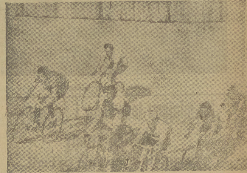
Na moment przed udecką