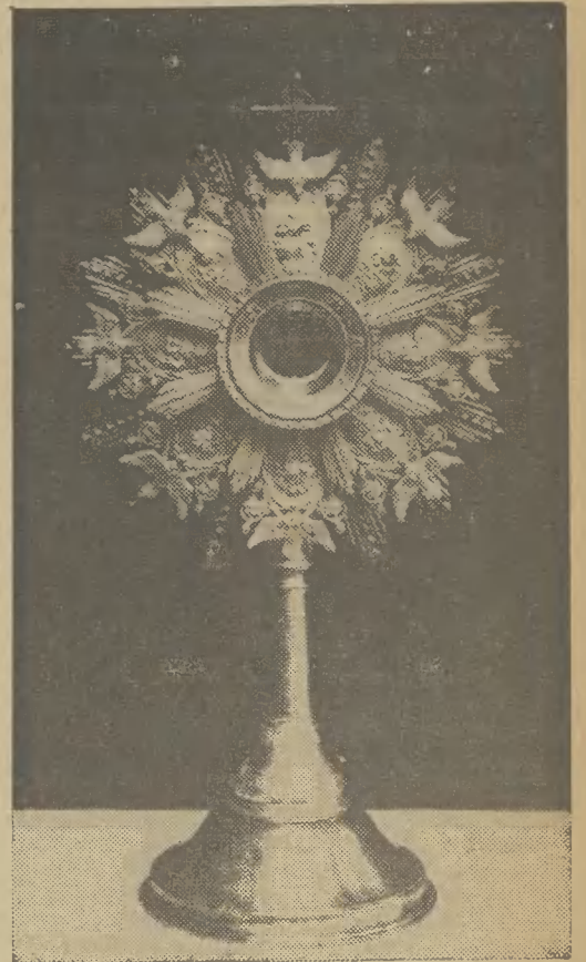
Monstrancja wykonana w pracowni brzoźniczo-cyzylerskiej H. Sztorca (do artykułu na str. 7-mej)