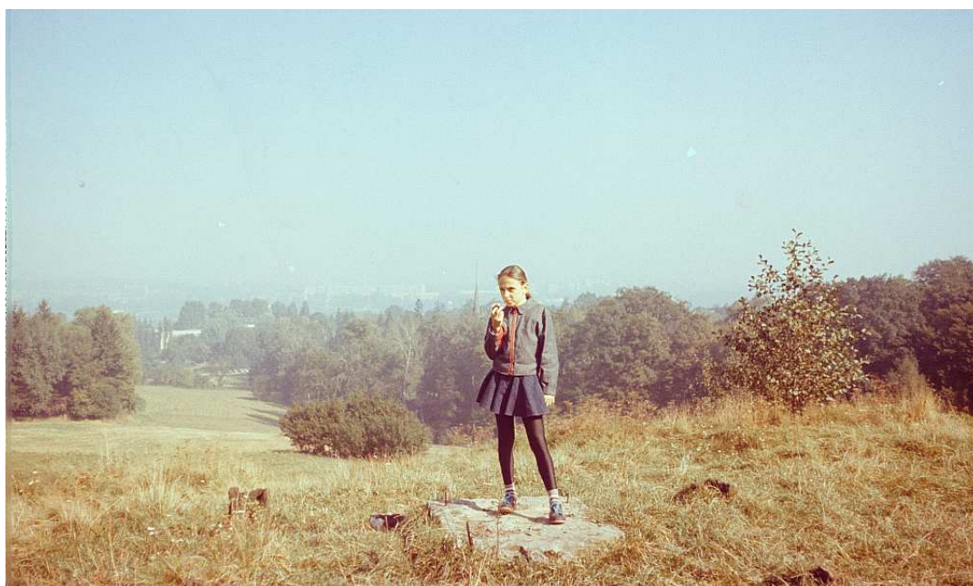
Fot. nr 53. Lato 1992.