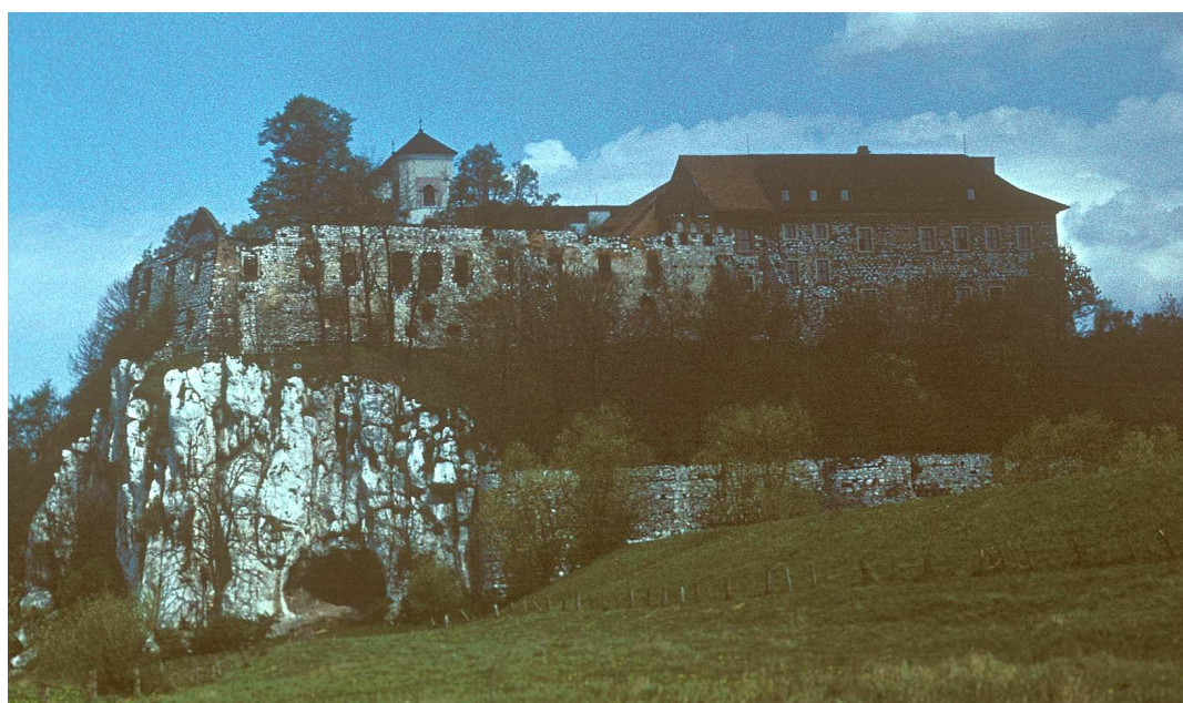
Fot. nr 75. Wiosna 1989.