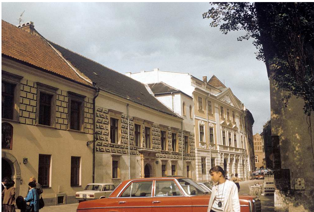
Fot. nr 14 (14-16). Końcowy fragment ulicy Kanoniczej – widoki od strony Wawelu i ulicy Podzamcze. Lato 1992.