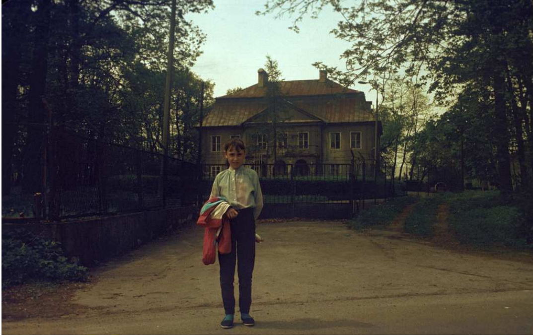
Fot. nr 116 (116-117). Dwór Marchwickich przy ulicy Podedworze 30, chyba już opuszczony przez Izbę Dziecka MO. Wiosna 1992