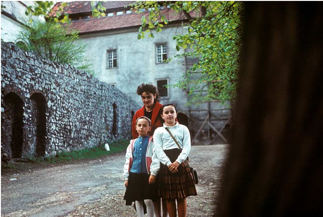
Fot. nr 76. Przy drodze do klasztoru Benedyktynów. Wiosna 1989.