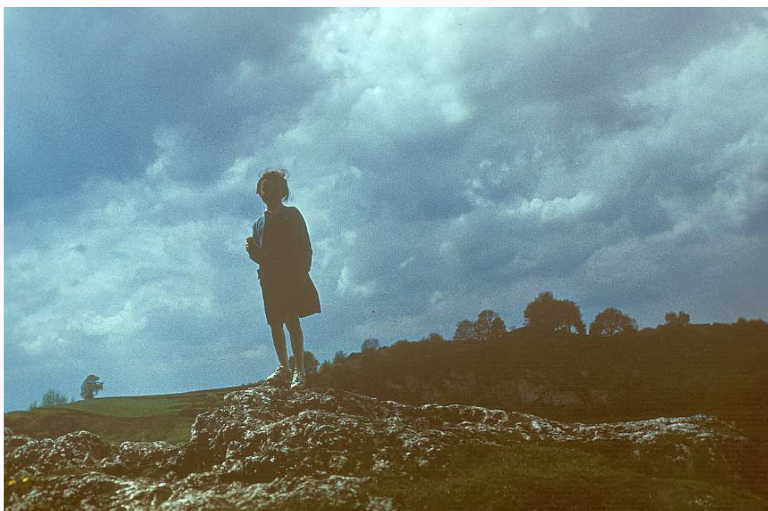
Fot. nr 79. Wiosna 1989.