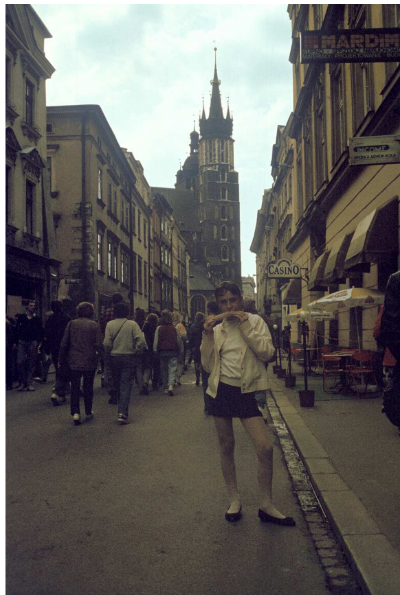
Fot. nr 4. Wzdłuż ulicy Floriańskiej. Lato 1992.