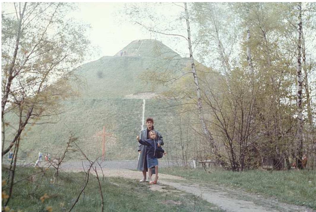
Fot. nr 59 (59-62). Z Kopcem Piłsudskiego w tle. Wiosna 1990.