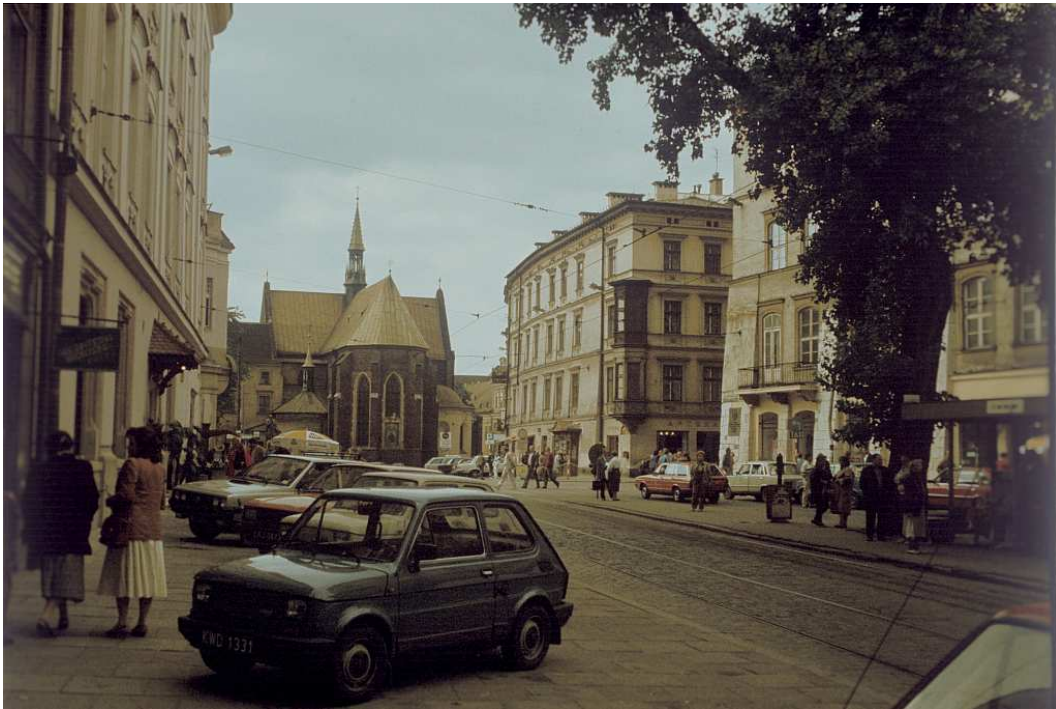
Fot. nr 24. Plac Dominikański – widok w stronę kościoła Franciszkanów. Lato 1992.