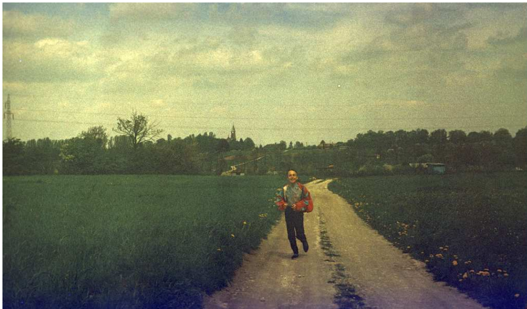
Fot. nr 126. Fragment „ulicy” do Luboni od strony Rajska. W tle kościół parafialny na styku ulic: Cechowej i Niebieskiej. Wiosna 1992.