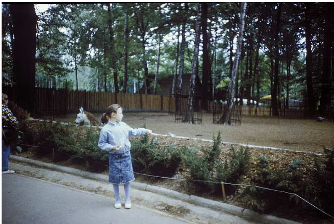
Fot. nr 67. Lato 1990.