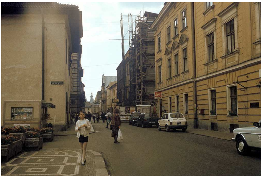
Fot. nr 33. Wzdłuż ulicy Szpitalnej. Ujęcie spod ówczesnego Hotelu Pod Złotą Kotwicą (dziś na powrót Pollera) i Placu św. Ducha. Lato 1992.