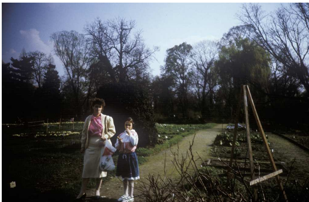
Fot. nr 37 (37-39). Początkowy fragment Ogródu od strony ulicy Kopernika. Wiosna 1991.