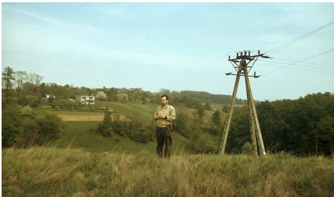
Fot. nr 122 (122-123). Dolina Malinówki we fragmencie pomiędzy Soboniowicami, a Kosocicami. W tle fort Kosocice Zachód (50 ½ W). Wiosna 1992.