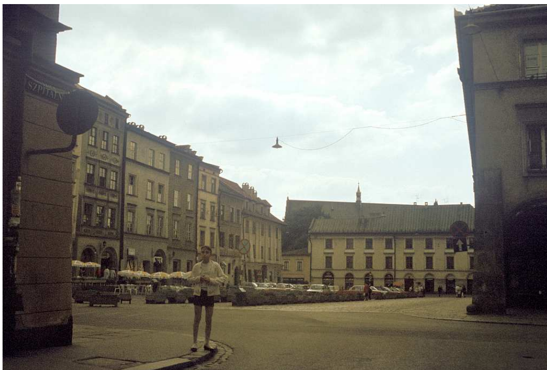
Fot. nr 31. Mały Rynek – widok z wylotu ulicy Szpitalnej. Lato 1992.