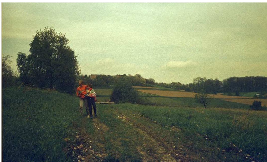
Fot. nr 133. Widok ze zbocza Malinówki od strony Soboniowic w kierunku fortu Kosocice Zachód i ulicy Osterwy. Wiosna 1992.