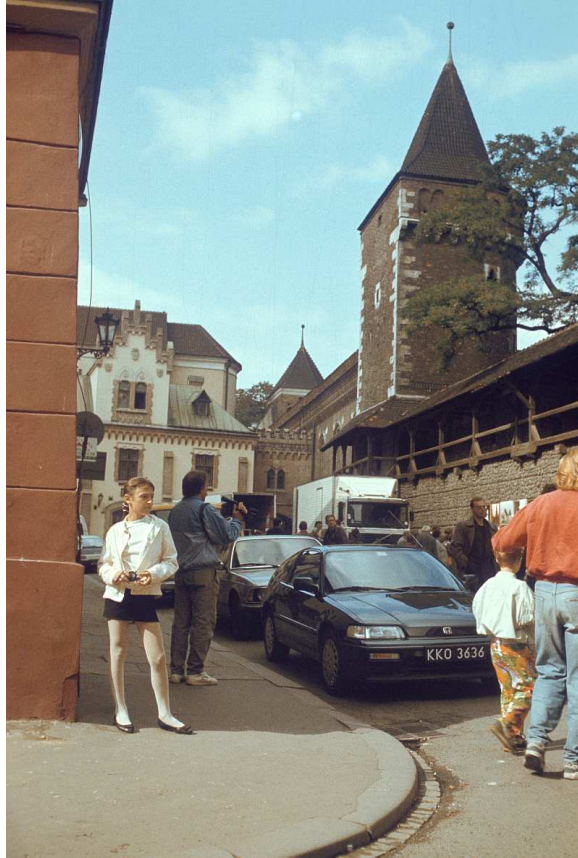
Fot. nr 3. Wzdłuż murów obronnych i ulicy Pijarskiej. Lato 1992.