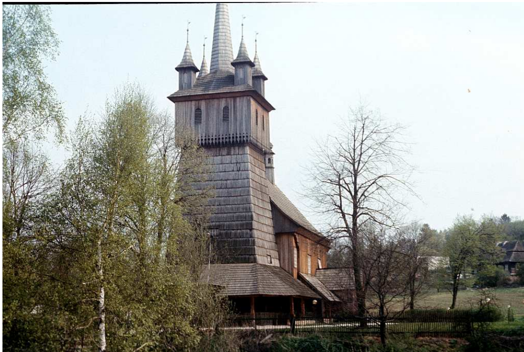
Fot. nr 48. Drugi ze spalonych kościołów. Wiosna 1990.