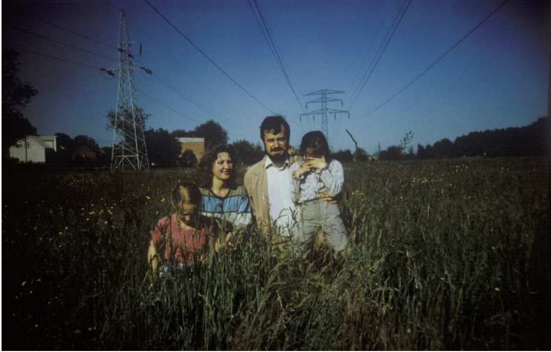
Fot. nr 112. Lato 1990.