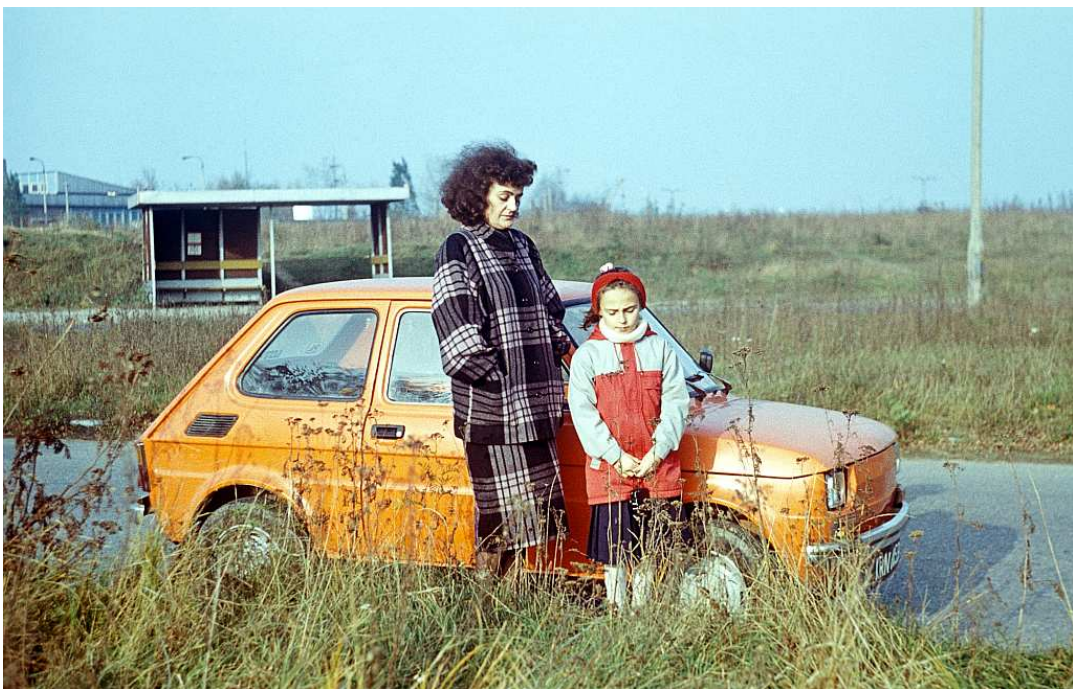
Fot. nr 107. Na przystanku autobusowym linii 103 przy Domu Pogodnej Jesieni. Początek 1989.