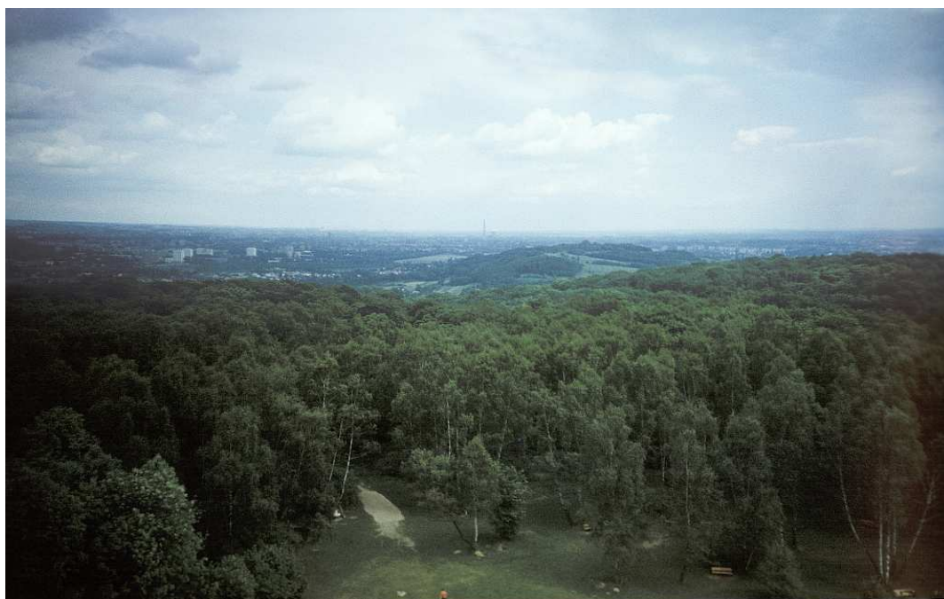
Fot. nr 64. Panorama w stronę Sikornika i Kopca Kościuszki. Lato 1990.