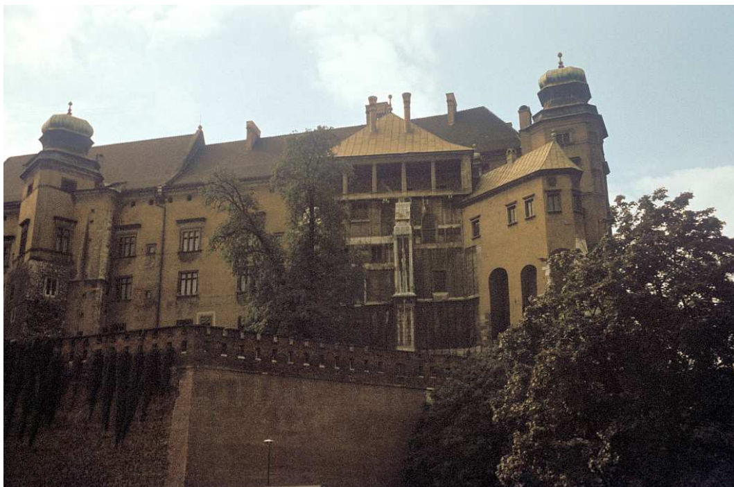
Fot. nr 18. Wschodnie skrzydło zamku królewskiego na Wawelu, z Kurzą Stopką i Pawilonem Gotyckim. Lato 1992