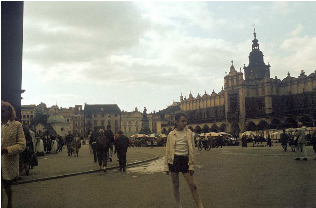
Fot. nr 28. Rynek Główny w ujęciu z wylotu ulicy Floriańskiej. Lato 1992.