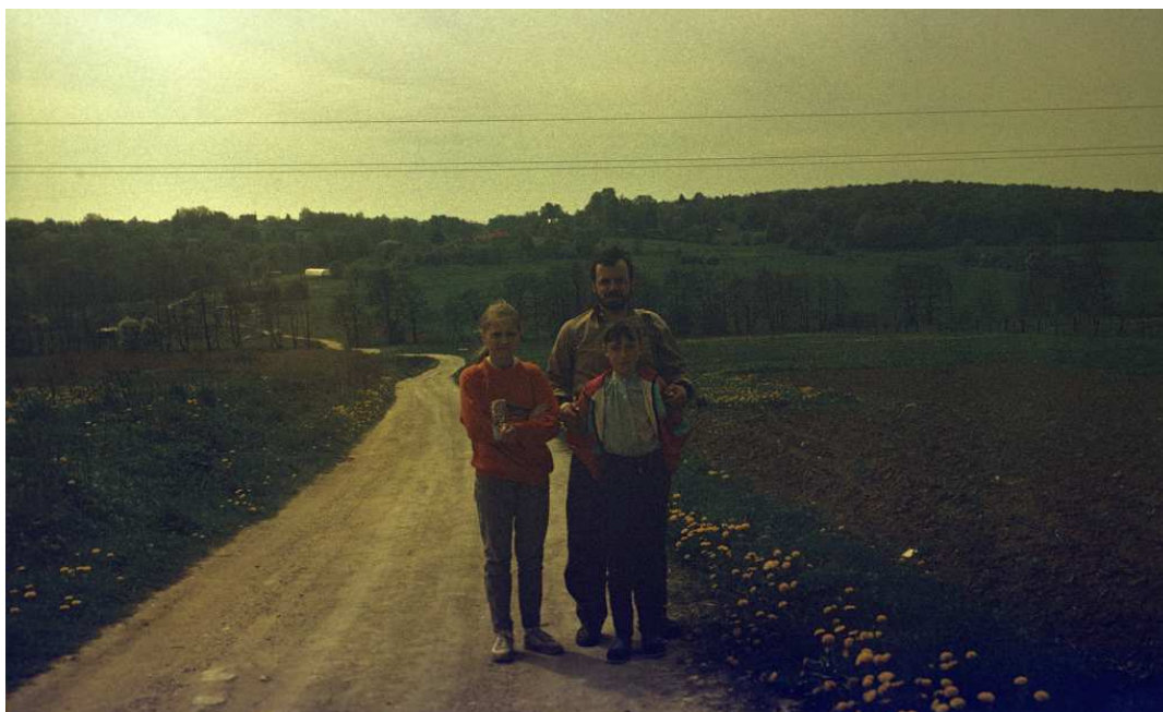
Fot. nr 125. Wiosna 1992.