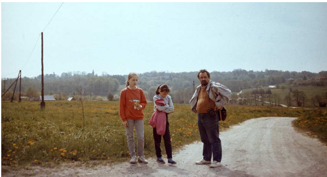
Fot. nr 124 (124-125). Wzdłuż „ulicy” do Luboni w stronę wzniesienia Kosocic (z lewej) i Rajska .Widoki z ulicy Niebieskiej na Piaskach. Wiosna 1992.