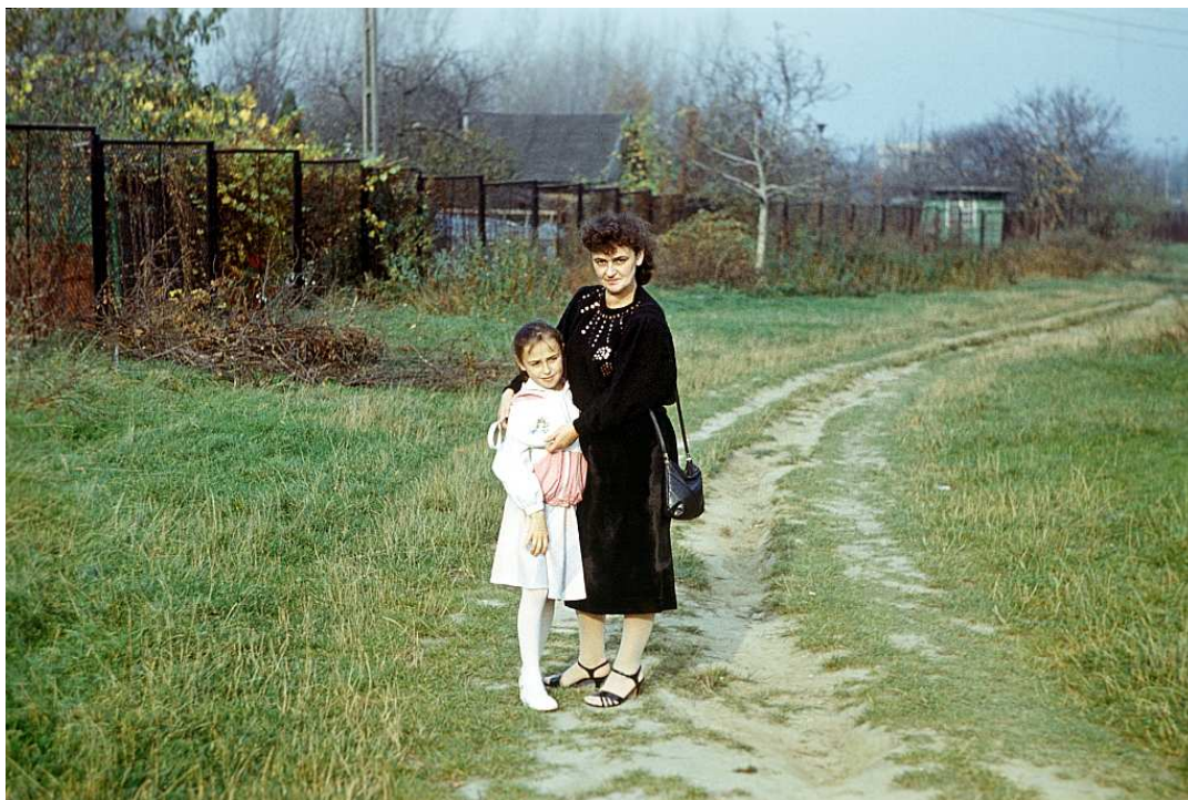
Fot. nr 80 (80-81). Na polnym jeszcze przedłużeniu ulicy Nowosądeckiej, kiedy ogródki działkowe funkcjonowały tu w najlepsze. Jesień 1989.