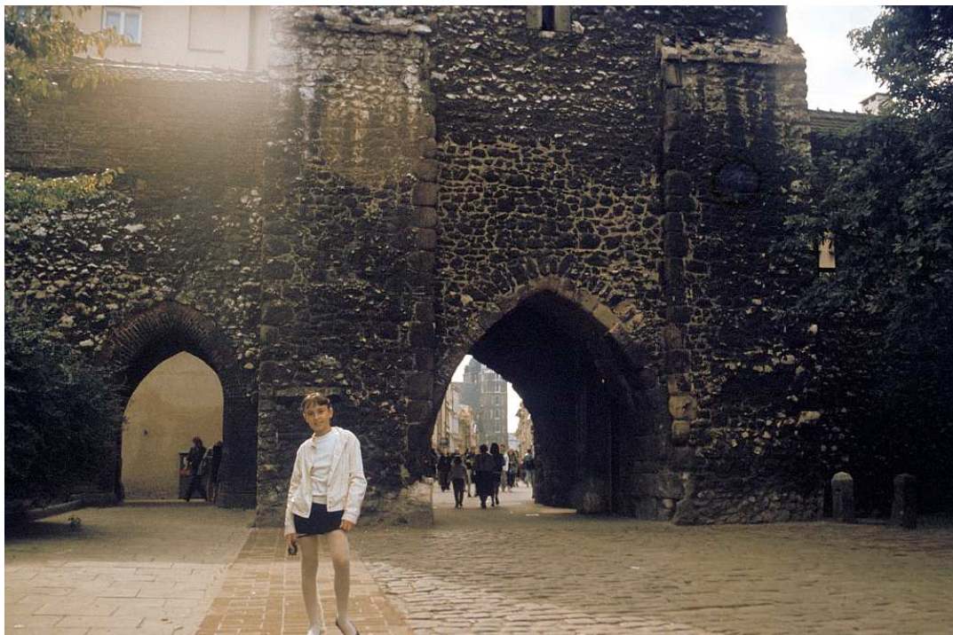
Fot. nr 2. Przed Bramą Floriańską. Lato 1992.