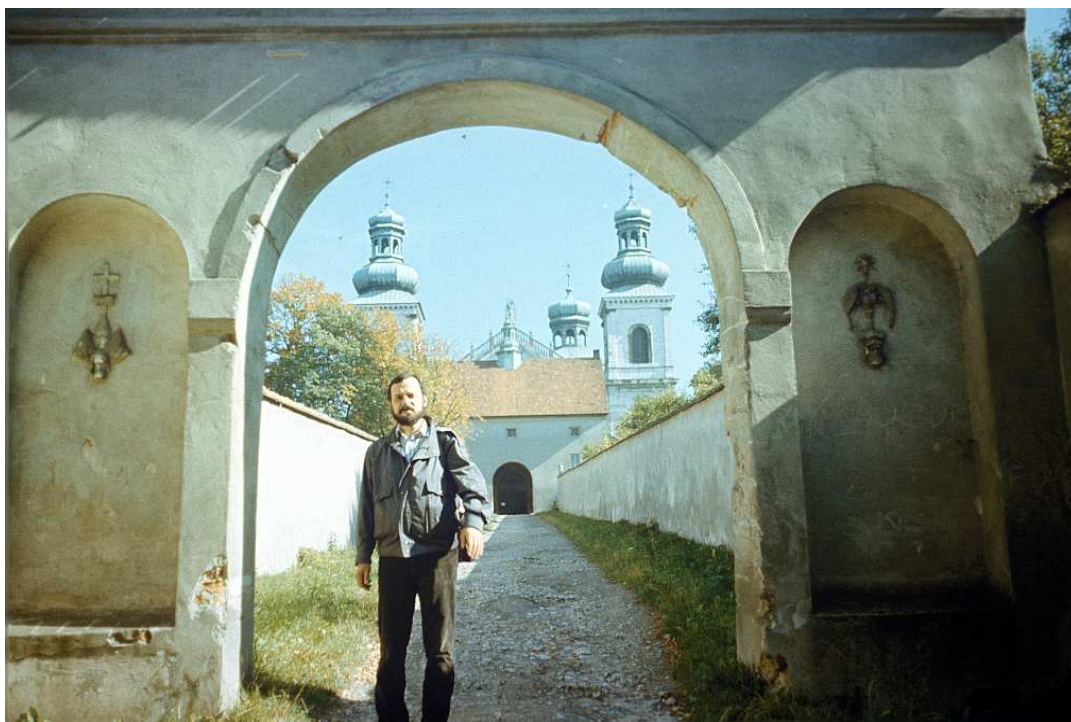
Fot. nr 71. Wiosna 1992.