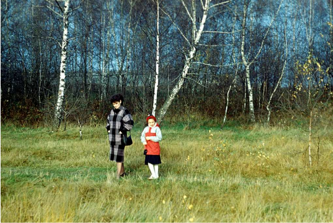
Fot. nr 108 (108-110). Przy wzrastającym lasku wzdłuż ulicy Jakubowskiego. Początek 1989.