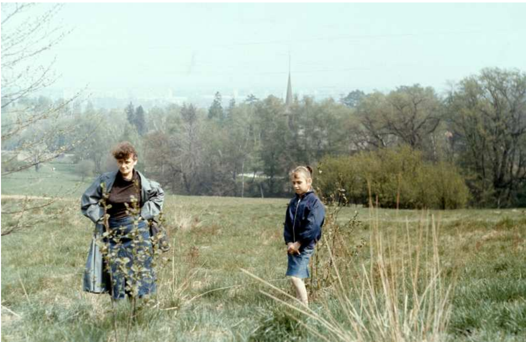
Fot. nr 51 (51-53). Widoki ze szczytu Wesołej Polany, z wieżą drugiego ze spalonych kościołów w tle. Wiosna 1990.