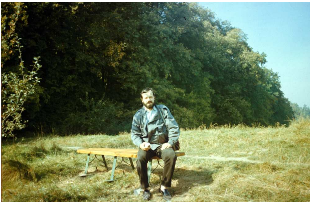
Fot. nr 53 (53-54). Szczyt Wesołej Polany. Lato 1992.