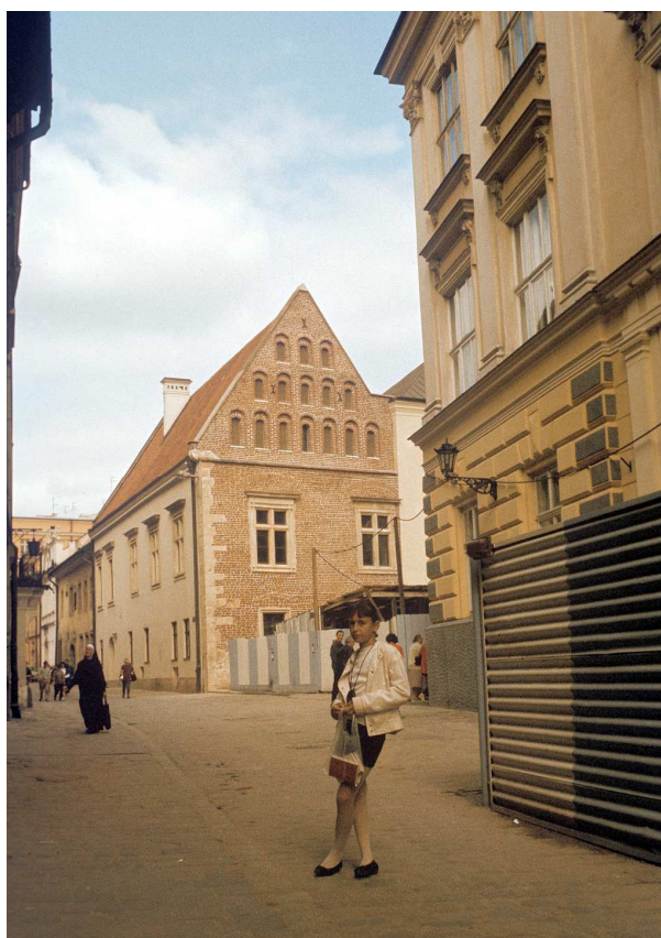
Fot. nr 14. Ulica Kanonicza na styku z Placem Wita Stwosza. Lato 1992.