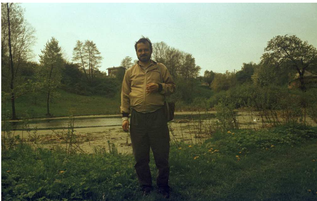
Fot. nr 129. Wiosna 1992.