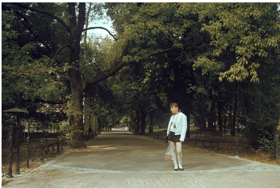
Fot. nr 6. Na Plantach przy kościele Franciszkanów. Lato 1992.