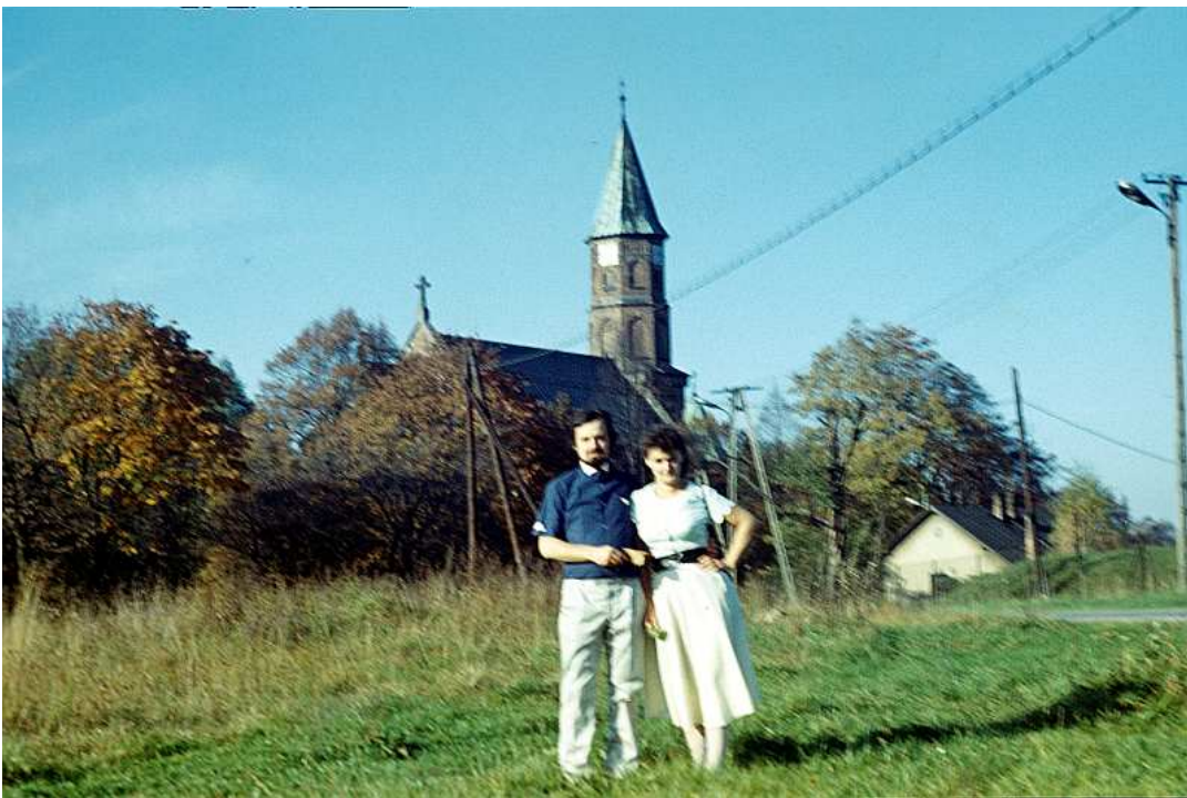
Fot. nr 119 (119-120). Kościół parafialny na Piaskach Wielkich – widoki z sąsiedztwa „ulicy” Do Luboni. Koniec lata 1989.