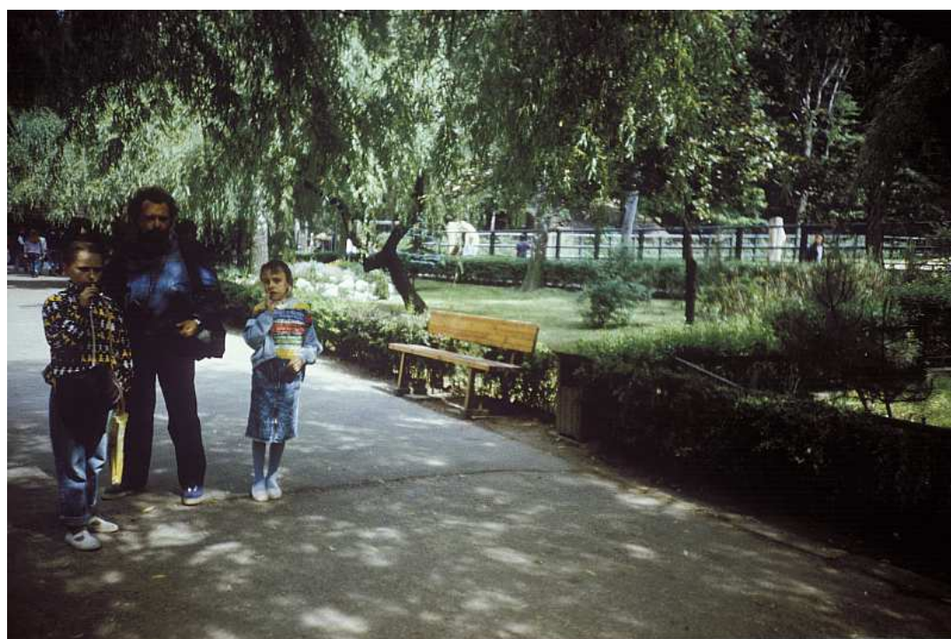
Fot. nr 66 (66-68). Trzy migawki z ZOO. Lato 1990.