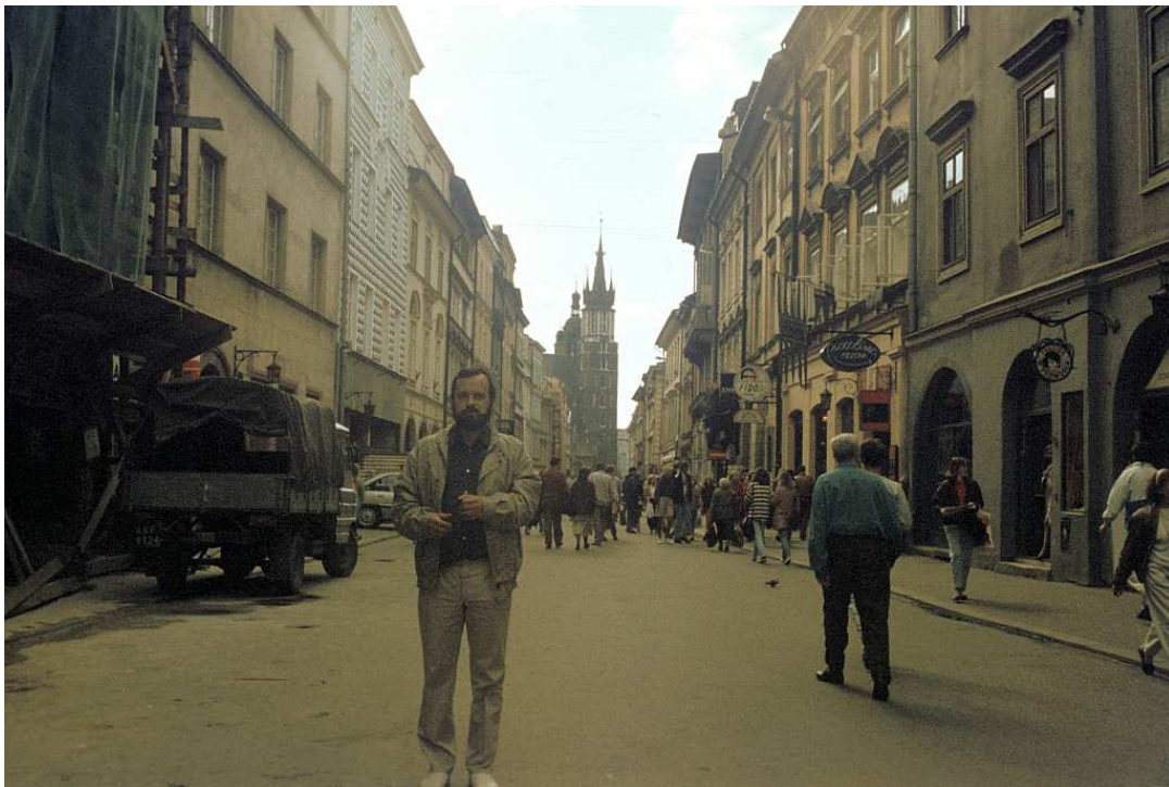
Fot. nr 1. Na ulicy Floriańskiej. Lato 1992.