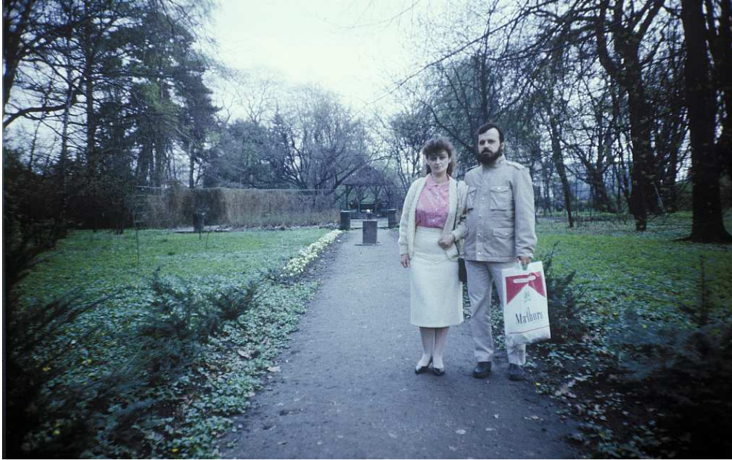
Fot. nr 44. Fragment Ogrodu pomiędzy starym stawem, a ulicą Żółkiewskiego. Wiosna 1991.