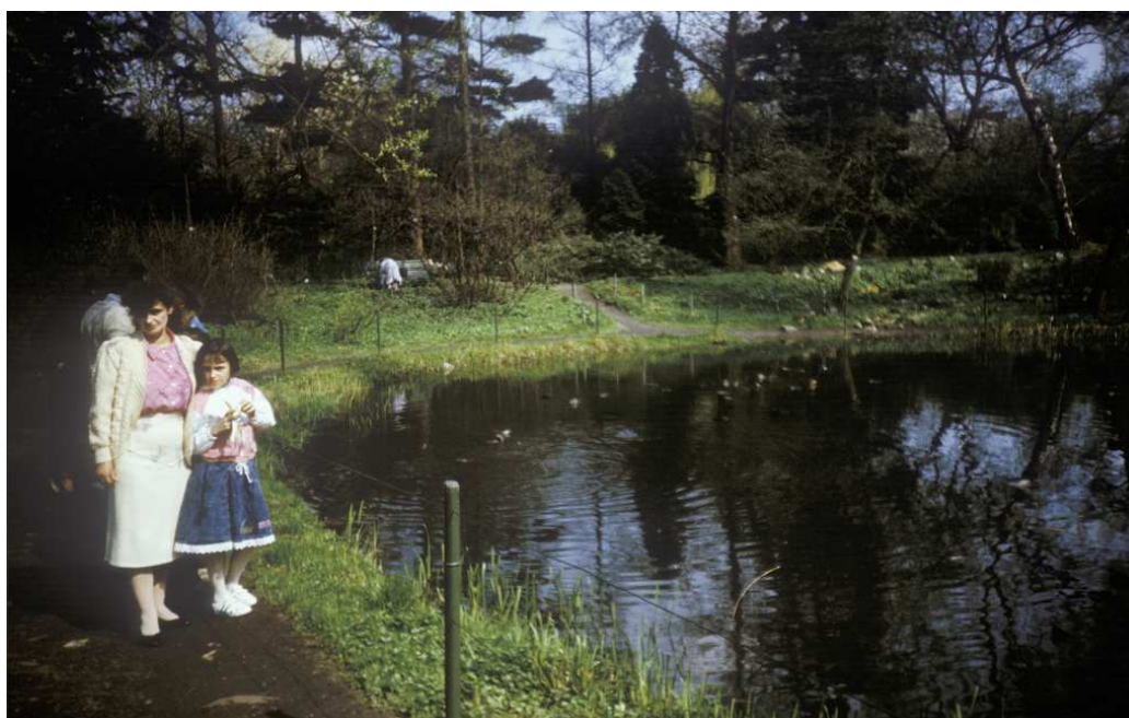
Fot. nr 43. Wiosna 1991.