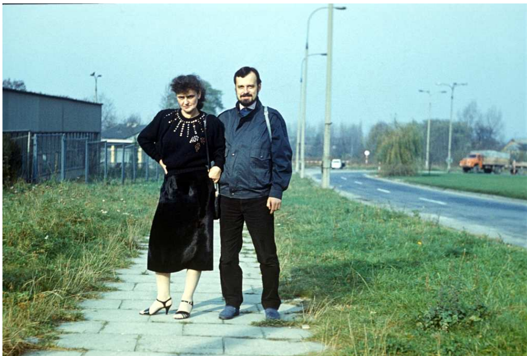
Fot. nr 82. Początkowy odcinek ulicy Nowosądeckiej, który kończył się na ulicy Na Kozłówce. Jesień 1989.