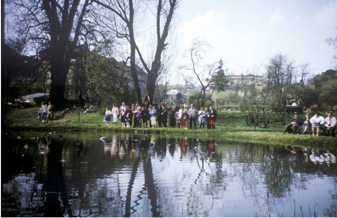
Fot. nr 40 (40-43). Nad starym stawem. Wiosna 1991.