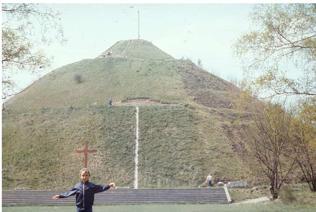
Fot. nr 60. Wiosna 1990.