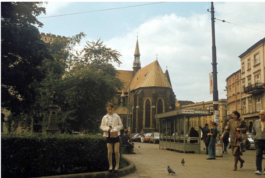
Fot. nr 25. Dawny Plac Wiosny Ludów, dziś na powrót Wszystkich Świętych. Lato 1992.