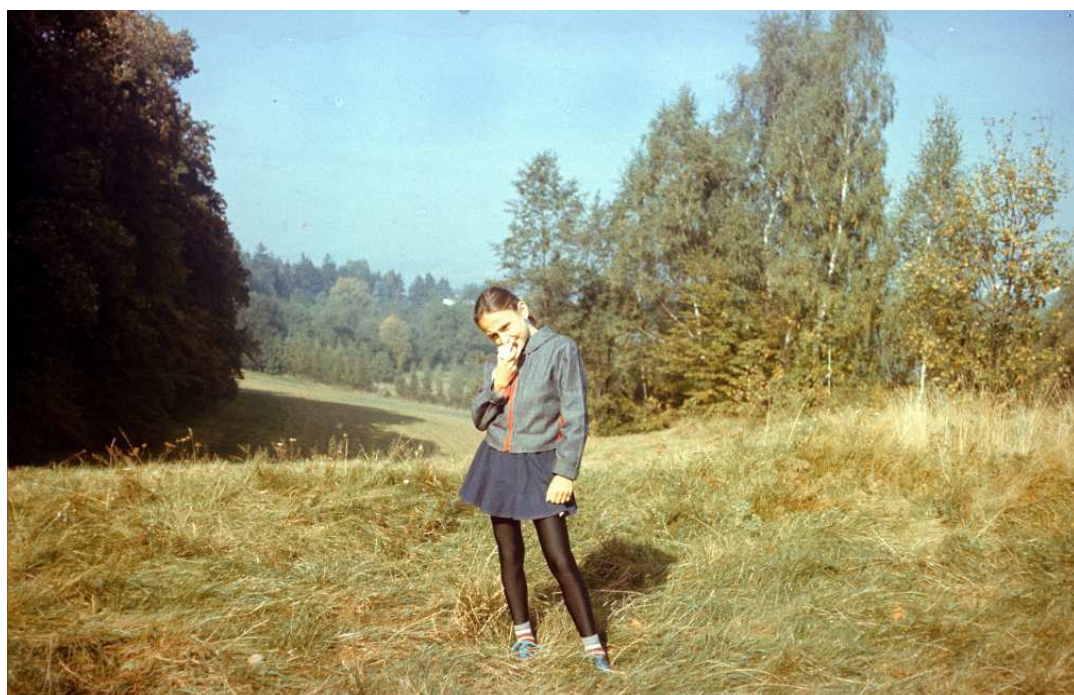
Fot. nr 54. Niczym niezakrzaczony szczyt Wesołej Polany. Z prawej z lekka porośnięte zbocze kanionu skalnego. Lato 1992.