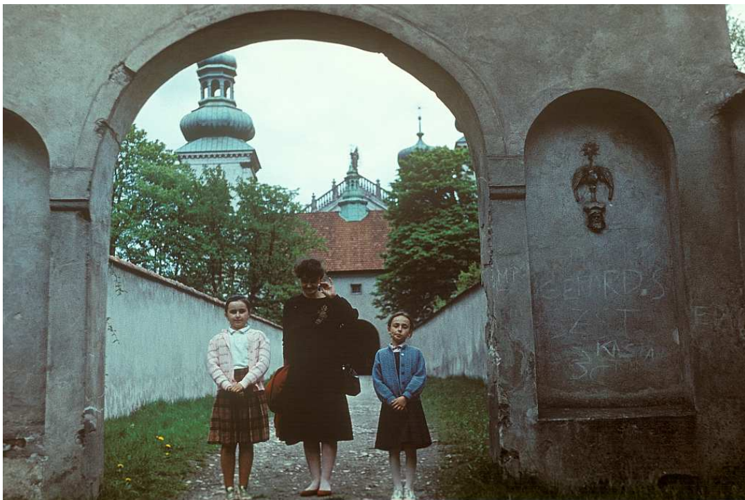
Fot. nr 69 (69-72). Krakowska klasyka – wieże kościoła Kamedułów spod arkad bramy wejściowej. Wiosna 1989.