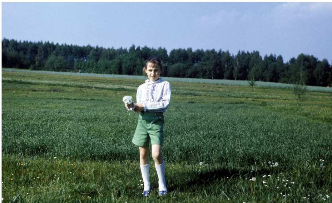
Fot. nr 104. Lato 1990.