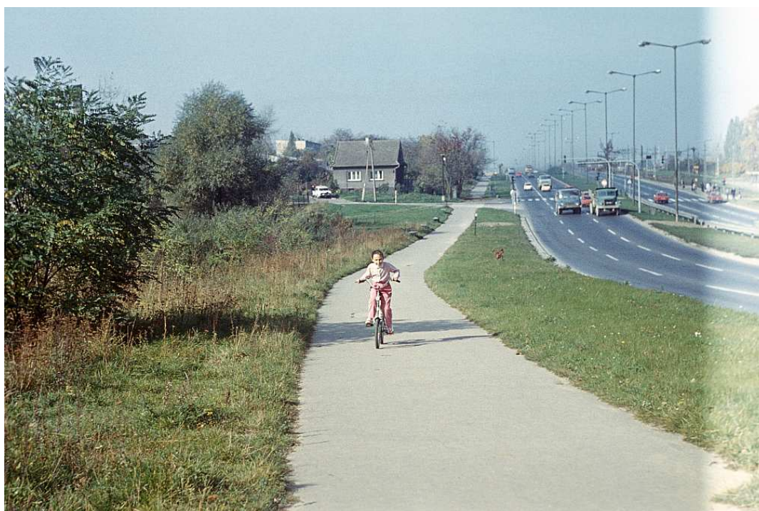
Fot. nr 91. Ulica Wielicka powyżej ulicy Facimiech. Lato 1989.