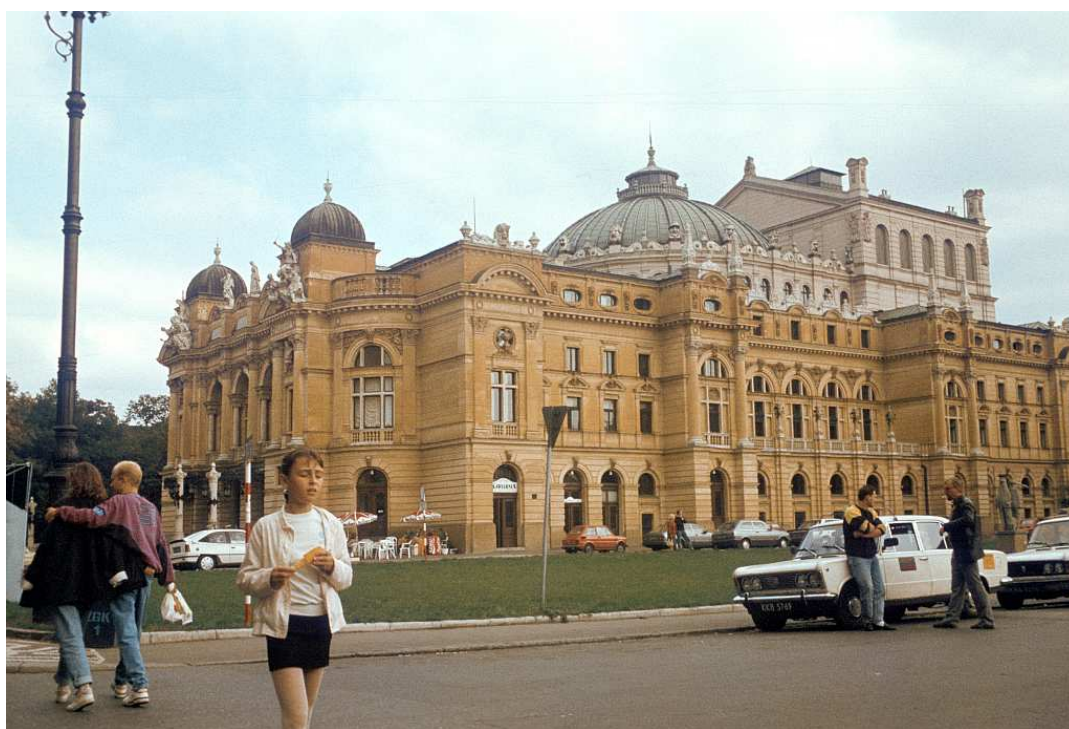
Fot. nr 35. Teatr Słowackiego. Lato 1992.