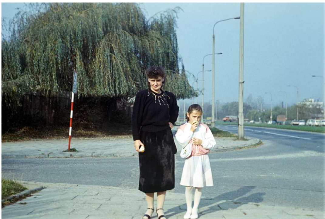
Fot. nr 83. Przy przełęczce pomiędzy ulicami Nowosądecką i Dauna. Jesień 1989.