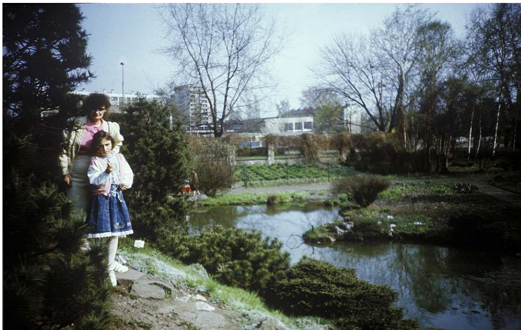
Fot. nr 45. Przy stawie w sąsiedztwie palmiarni. Wiosna 1991.