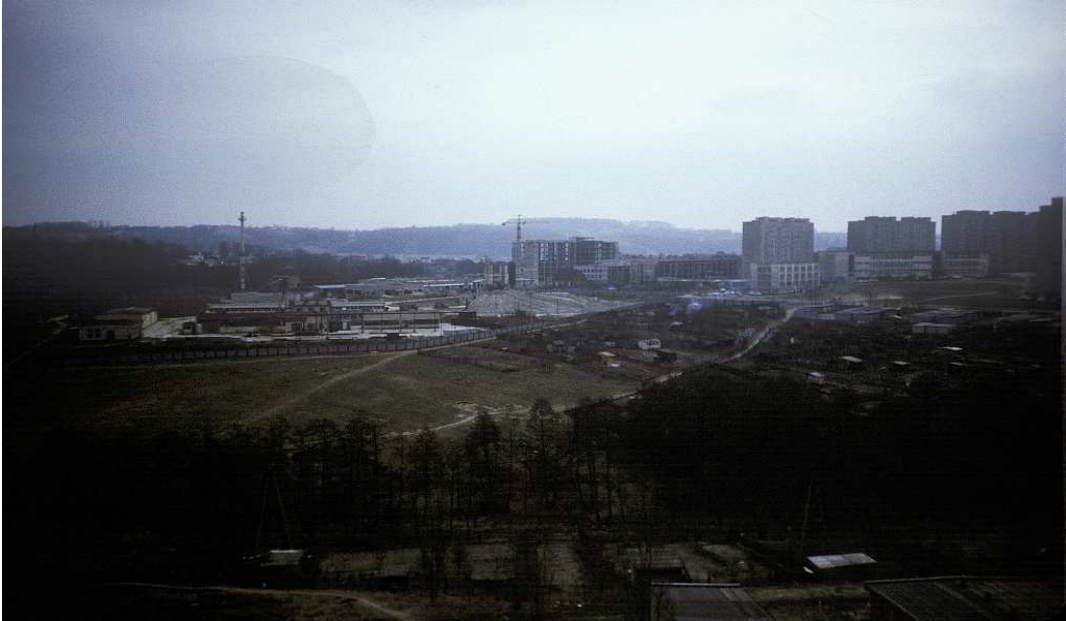
Fot. nr 86. Wiosna 1991.