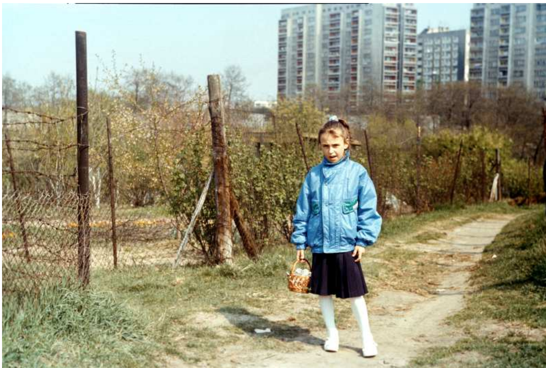
Fot. nr 115. Ogródki działkowe w sąsiedztwie Drwinki. W tle bloki z ulicy Spółdzielców 15 i 17. Wiosna 1990.