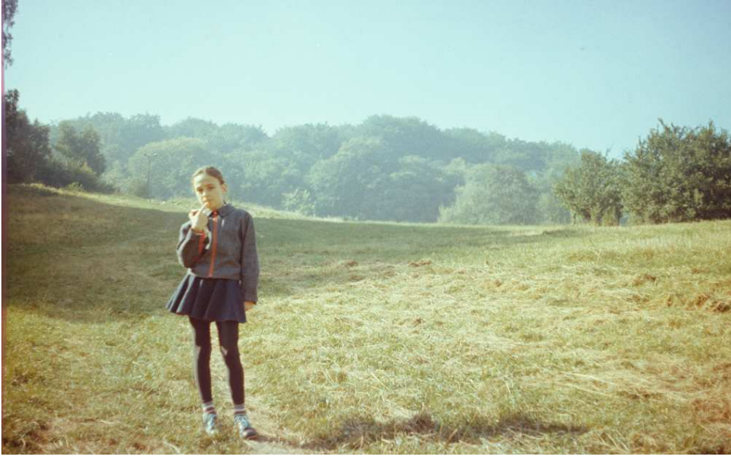
Fot. nr 50. Wesoła Polana. Tu widok z dołu w kierunku Sowińca. Lato 1992.