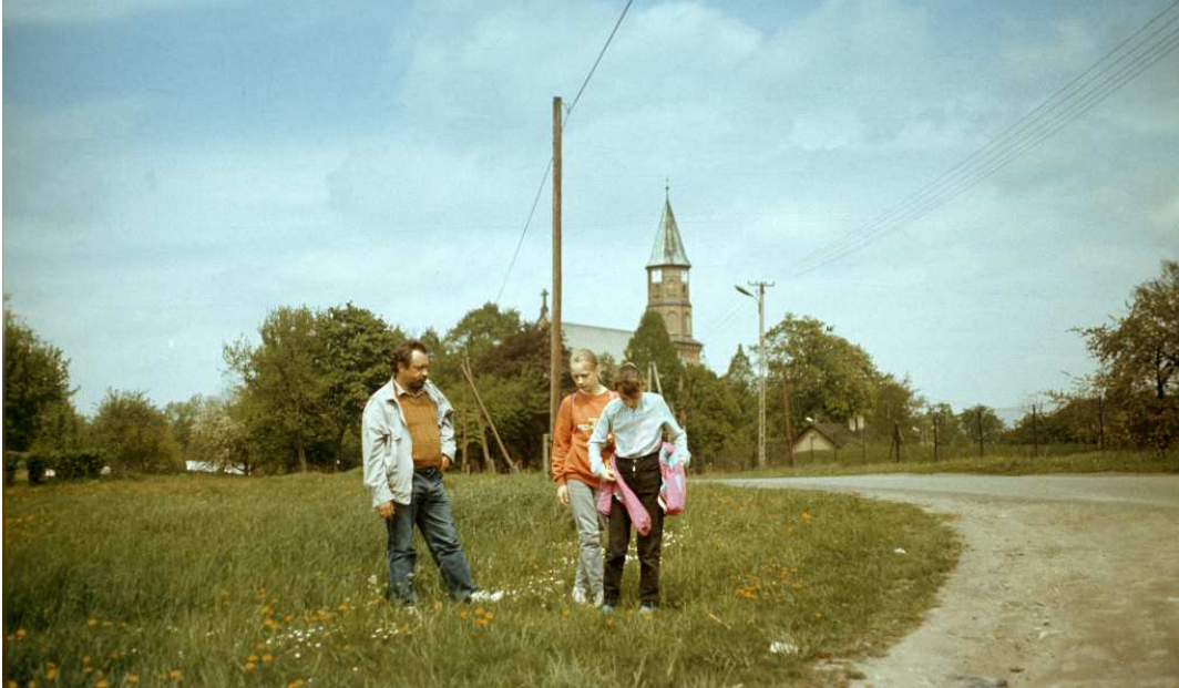
Fot. nr 120. Wiosna 1992.