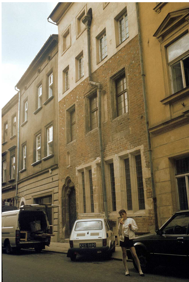
Fot. nr 32. Początkowy fragment ulicy Szpitalnej o parzystych numerach. Lato 1992.