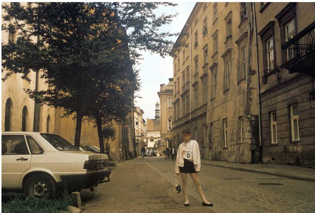
Fot. nr 9. Wzdłuż ulicy Poselskiej. Lato 1992.