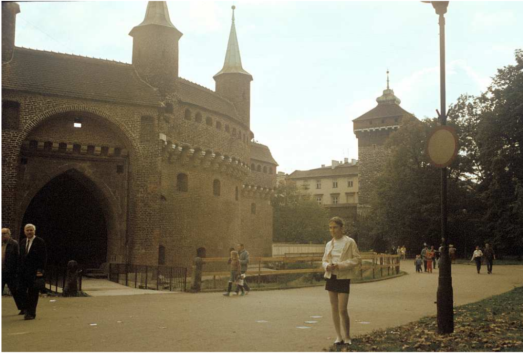
Fot. nr 2. Pod Barbakanem. Lato 1992.