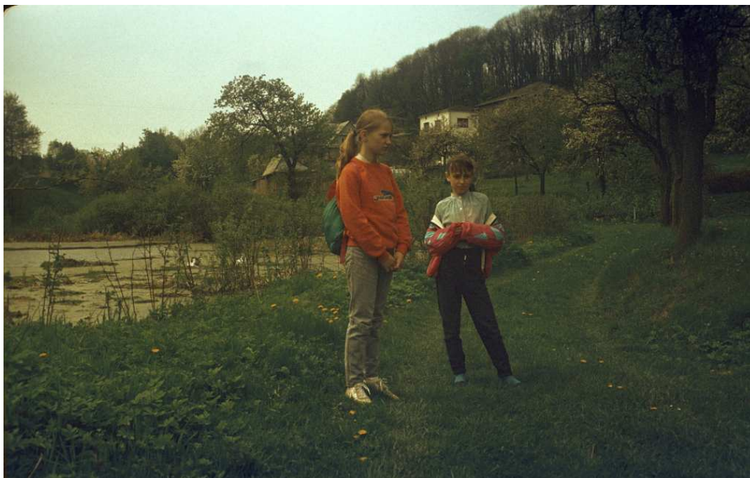
Fot. nr 128 (128-129). Nad stawem przy ulicy Nad Fosą. Tu w tle fort nr 51 Rajsko. Wiosna 1992.