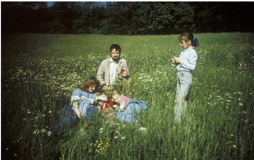
Fot. nr 113. Lato 1990.