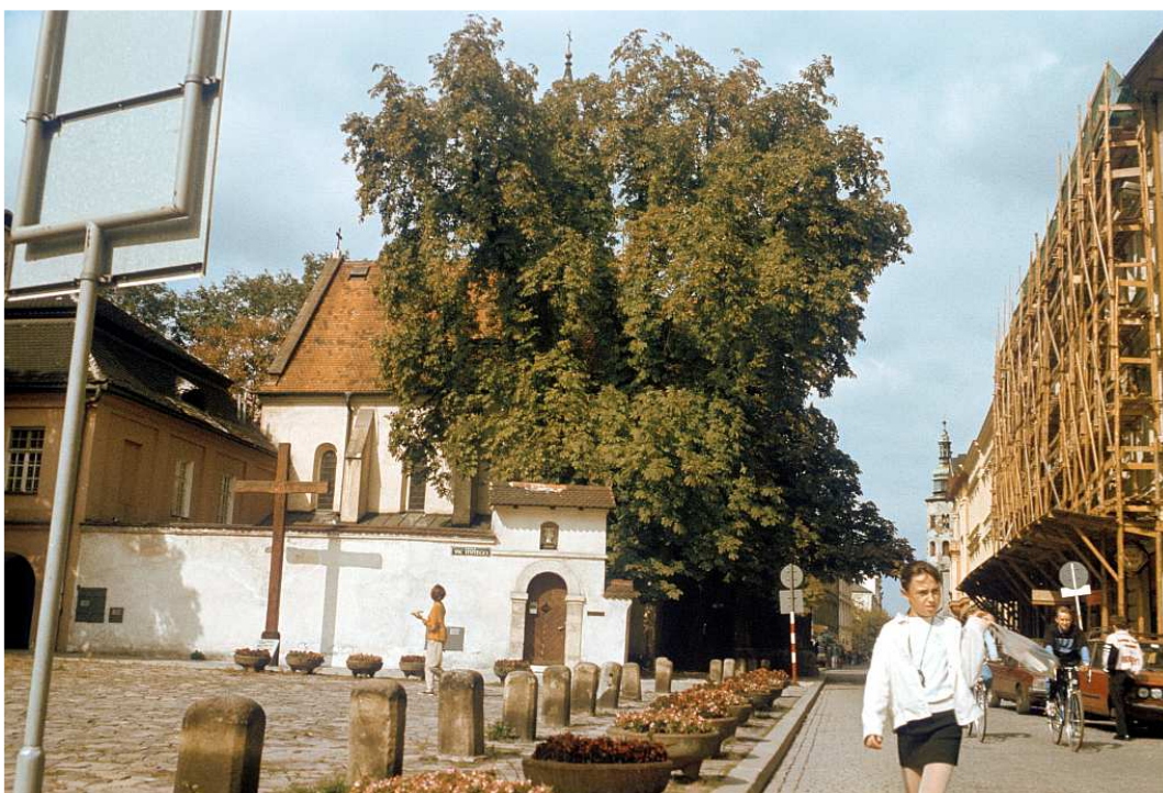
Fot. nr 19. Końcowy odcinek ulicy Grodzkiej. Lato 1992.