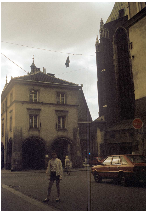
Fot. nr 30. Prądatówka Kościoła Mariackiego – widok z wylotu ulicy Szpitalnej. Lato 1992.