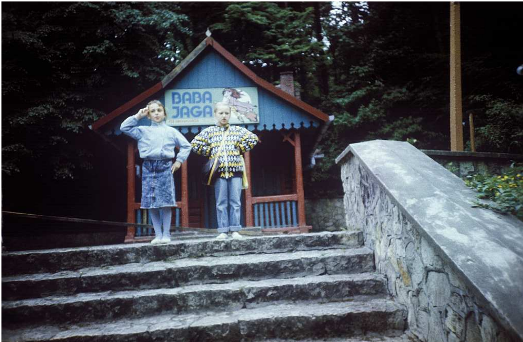
Fot. nr 57. Pod kawiarenką Baba Jaga. Lato 1990.