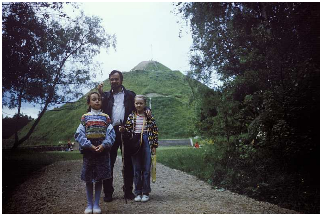
Fot. nr 61. Lato 1990.