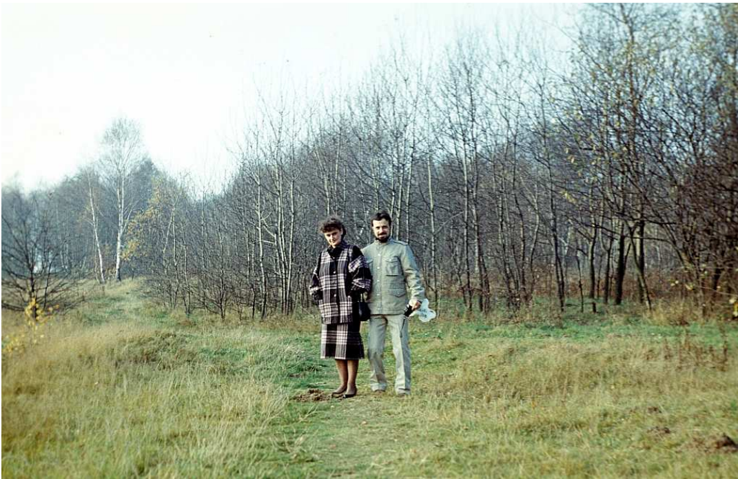
Fot. nr 109. Początek 1989.