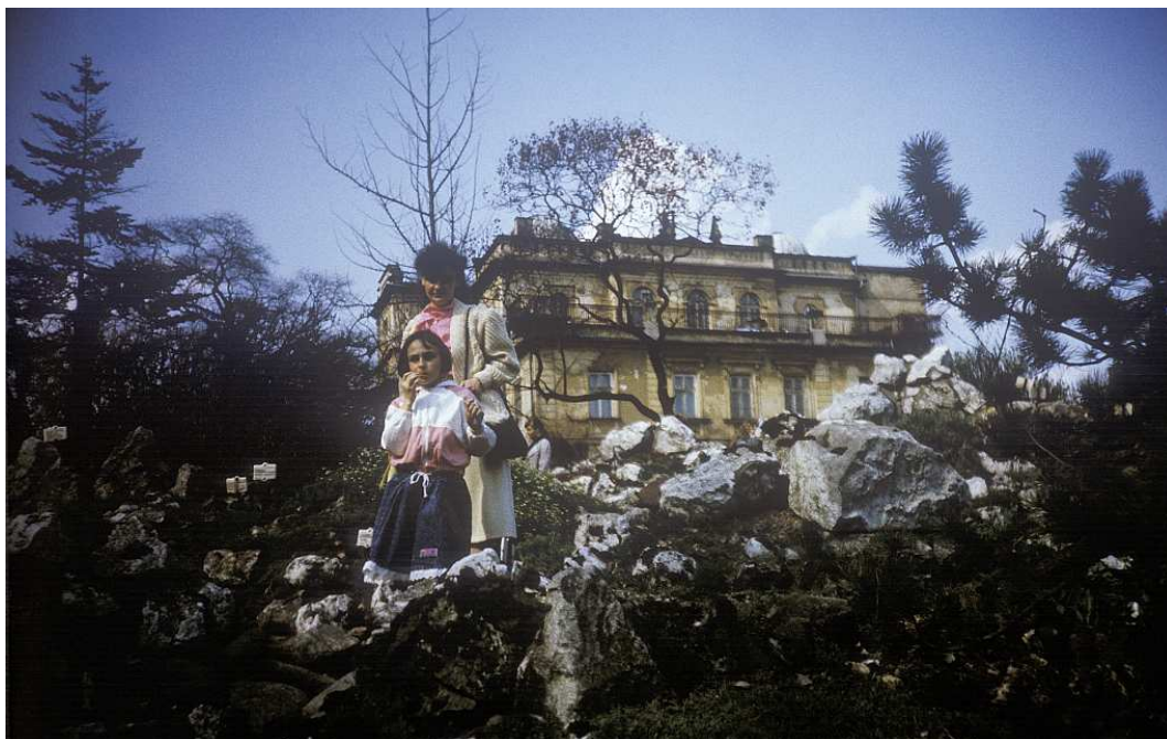
Fot. nr 36. Z budynkiem dawnego obserwatorium astronomicznego w tle. Wiosna 1991.