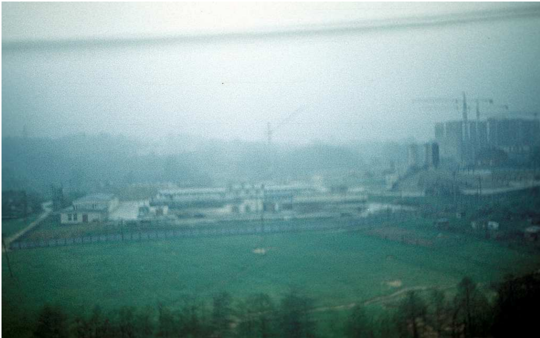
Fot. nr 85 (85-86). Widoki z wieżowca przy końcu ulicy Spółdzielców w stronę Piasków Wielkich, osiedla Piaski Nowe oraz będącego w budowie szpitala podgórskiego przy obecnej ulicy Bochenka. Lato 1989.