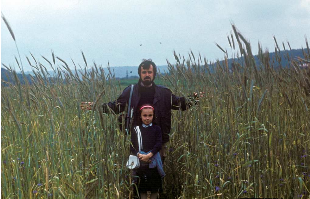
Fot. nr 106. Na przecince pomiędzy łąkami. W tle dolina Malinówki pomiędzy Krzyszkowicami i Kosocicami. Lato 1989.