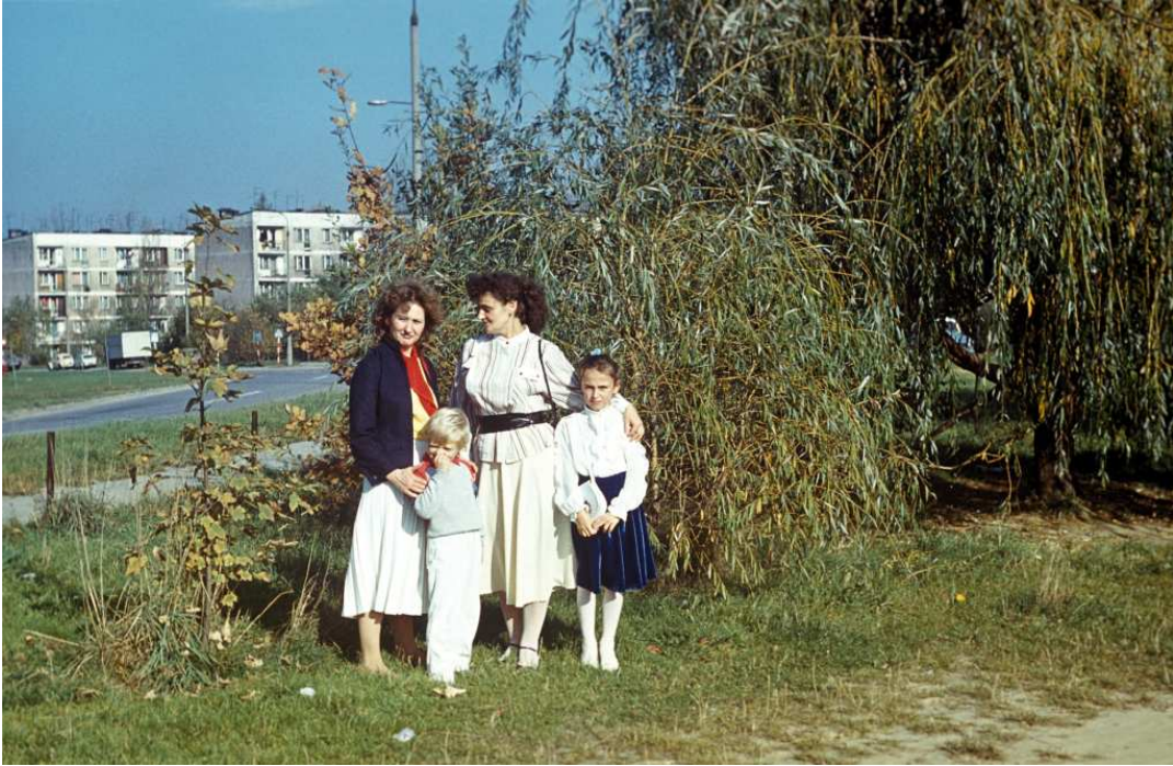
Fot. nr 84. Widok z końcowego odcinka ulicy Dauna w stronę ulicy Nowosądeckiej. Lato 1989.