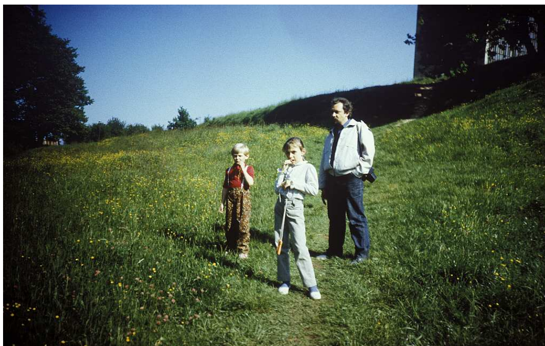
Fot. nr 89. Kwietna łąka u stóp „akademików” AM. Lato 1990.