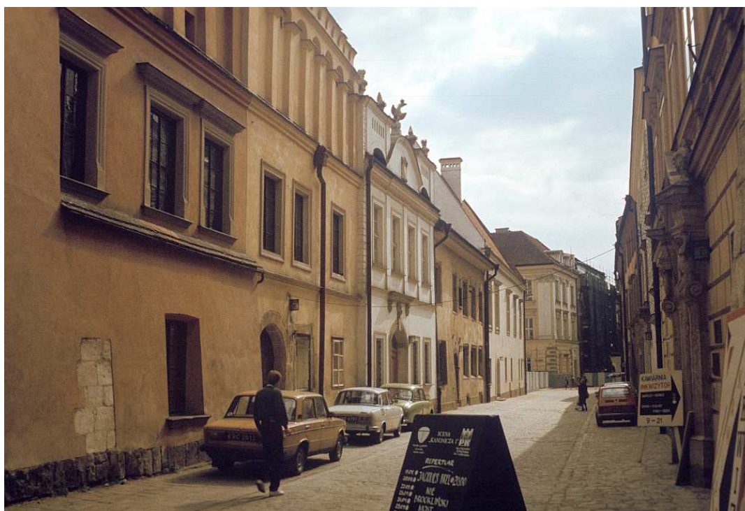
Fot. nr 10 (10-12). Ulica Kanonicza – widoki od strony ulicy Senackiej. Lato 1992.