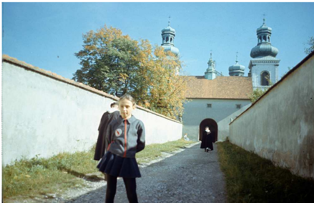
Fot. nr 72. Wiosna 1992