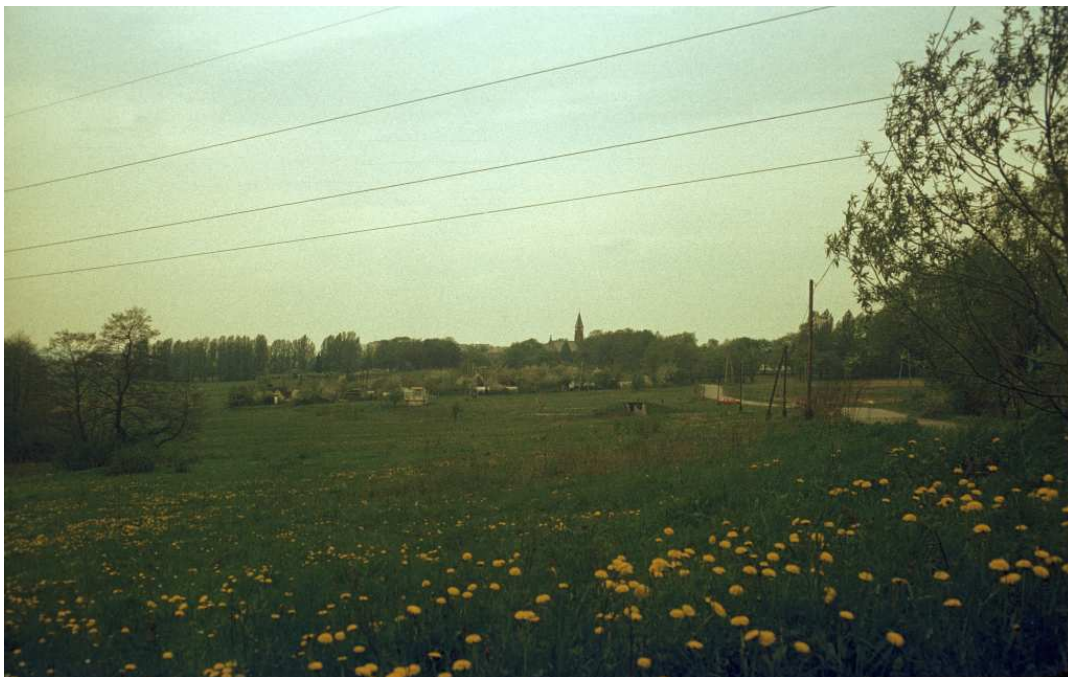
Fot. nr 121. Łąki, pola uprawne i ogródki działkowe na styku Rajska (na pierwszym planie) i Piasków Wielkich (w głębi), wzdłuż „ulicy” Do Luboni. Wiosna 1992.