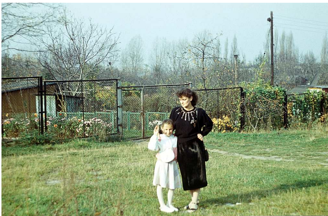
Fot. nr 81. Jesień 1989