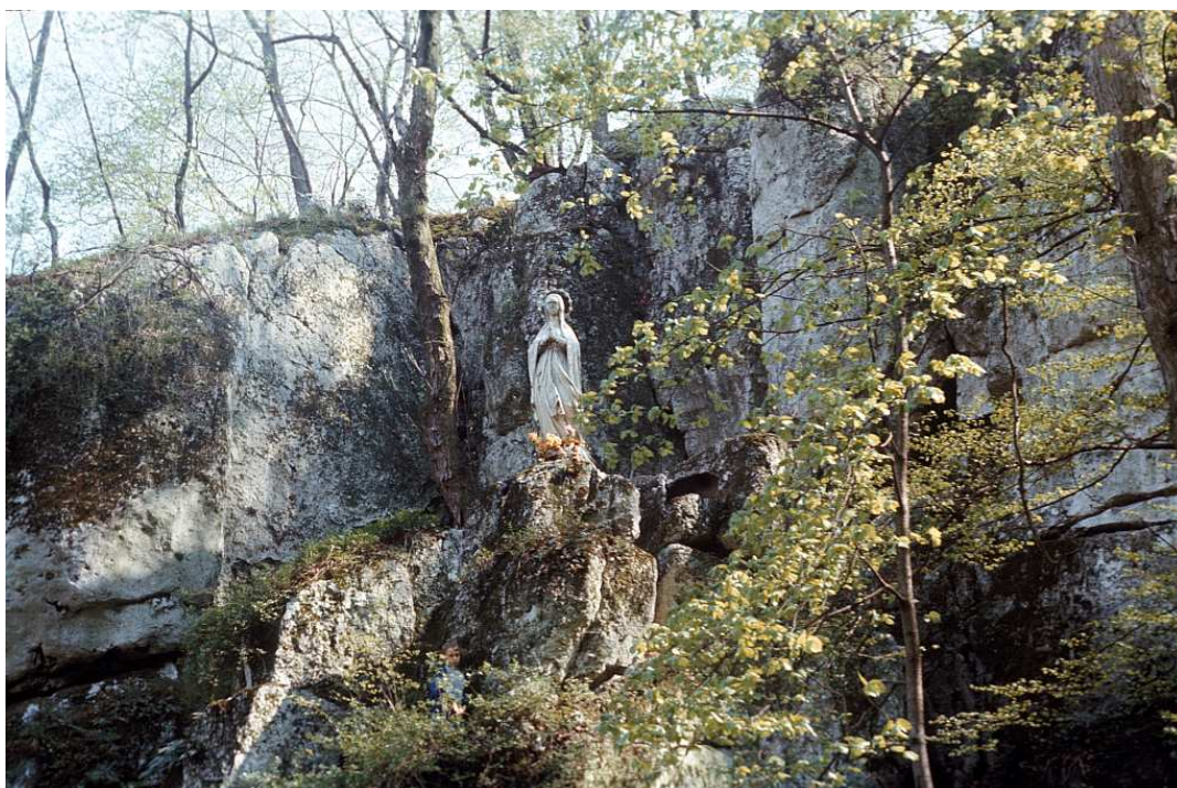
Fot. nr 56. Przez dziesięciolecia zmieniał się tylko jej kolor. Wiosna 1990.