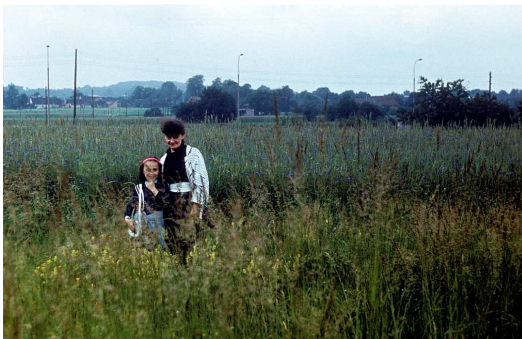
Fot. nr 95. Pole uprawne pomiędzy ulicą Kostaneckiego, a placem budowy Wydziału Farmacji AM. W tle Piaski Wielkie. Lato 1989.