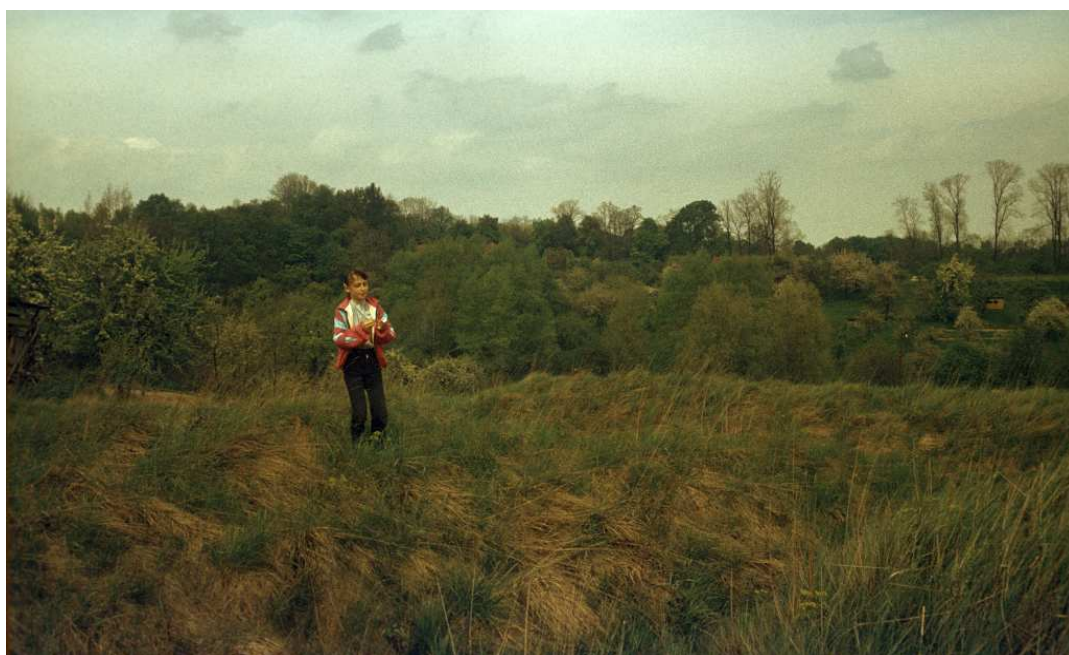
Fot. nr 131. Przy szanctu ziemnym (IS VII-3) przy ulicy Kuryłowicza W tle garb wzdłuż ulicy Osterwy. Wiosna 1992.