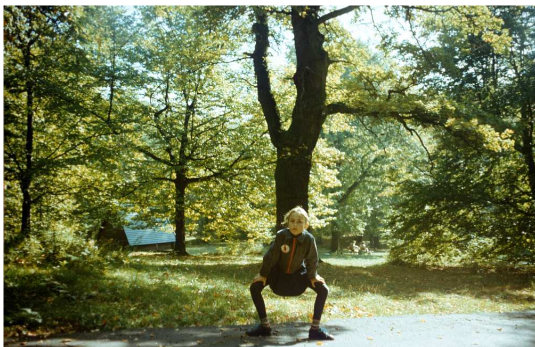
Fot. nr 73. Polana Pod Dębina. Wiosna 1992.