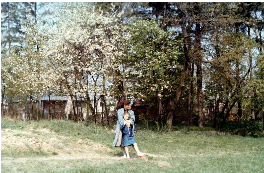
Fot. nr 49. Na skraju Wesolej Polany. Wiosna 1990.