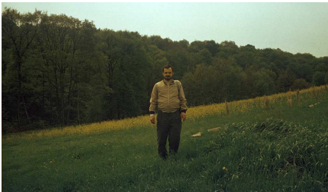
Fot. nr 132. W dolinie Malinówki na zboczu Rajska. Wiosna 1992.