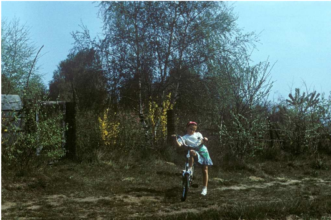
Fot. nr 100. Przy ogródkach działkowych przylegających do brzozonego lasu. Wiosna 1989.