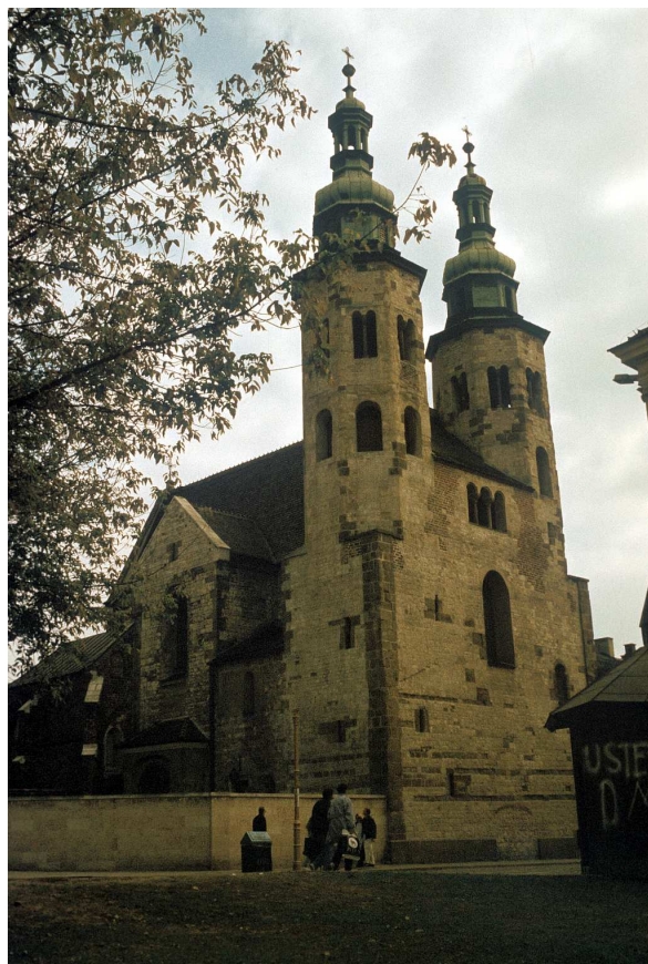
Fot. nr 20. Kościół św. Andrzeja. Lato 1992.