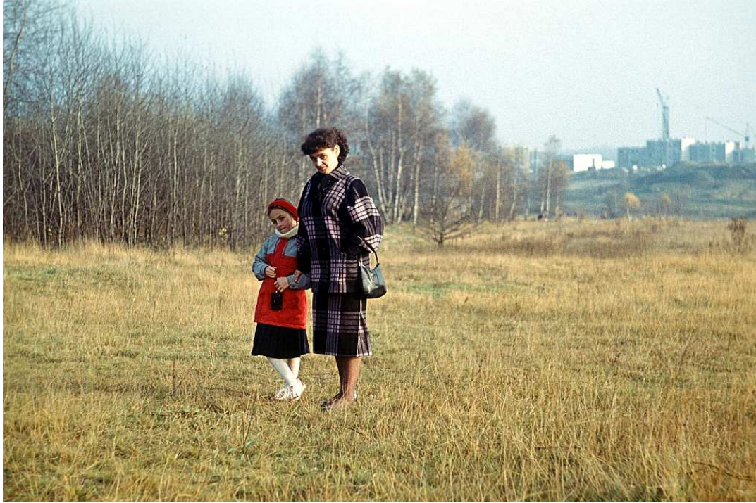
Fot. nr 110. W tle trwa rozbudowa osiedla Rząka. Początek 1989.