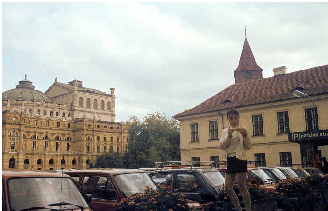
Fot. nr 34. Plac św. Ducha i Teatr Słowackiego. Widok spod Domu Pod Krzyżem. Lato 1992.