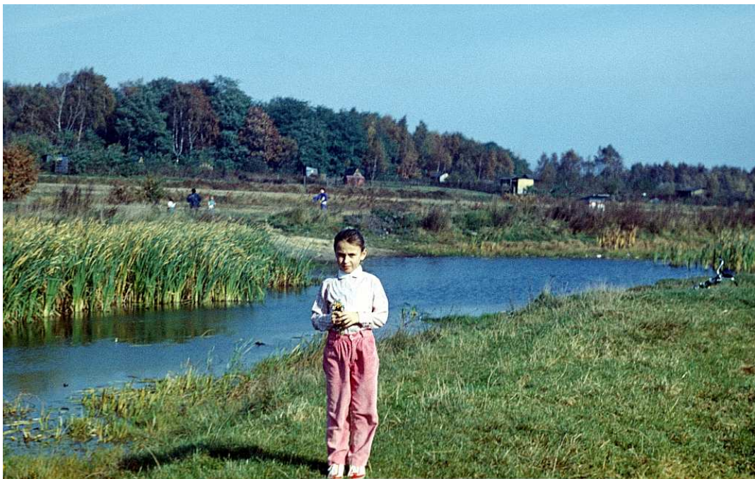
Fot. nr 99. Nad większym z rżączkich stawów. W tle ogródki działkowe i bujny już las na styku ulic: Kostaneckiego i Jakubowskiego, wycięty w styczniu 2013. Koniec lata 1989.