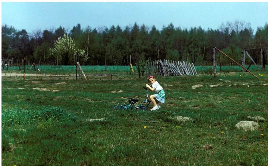
Fot. nr 101. Ogródek działkowy w sąsiedztwie Domu Pogodnej Jesieni. Wiosna 1989.