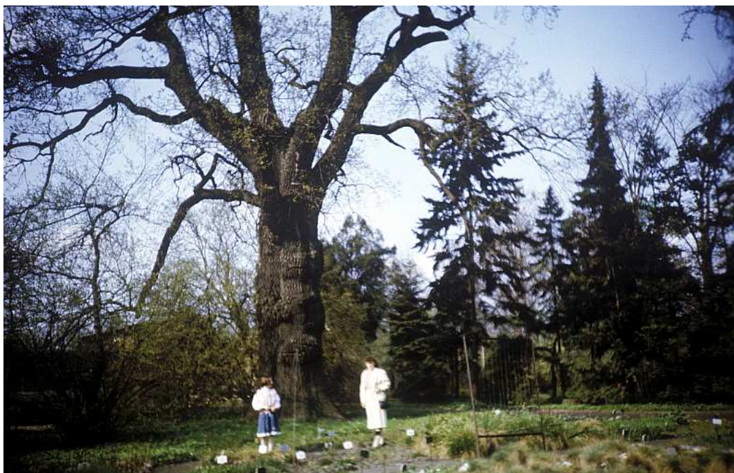
Fot. nr 39. Pod zabytkowym dębem. Wiosna 1991.