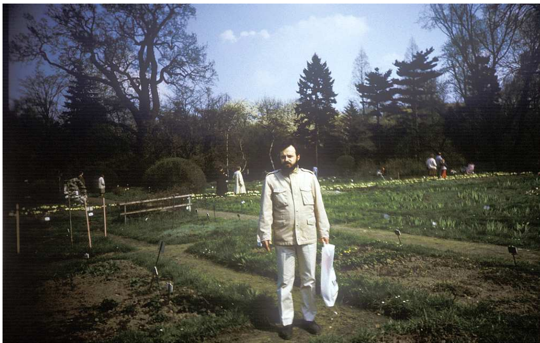
Fot. nr 38. Wiosna 1991.