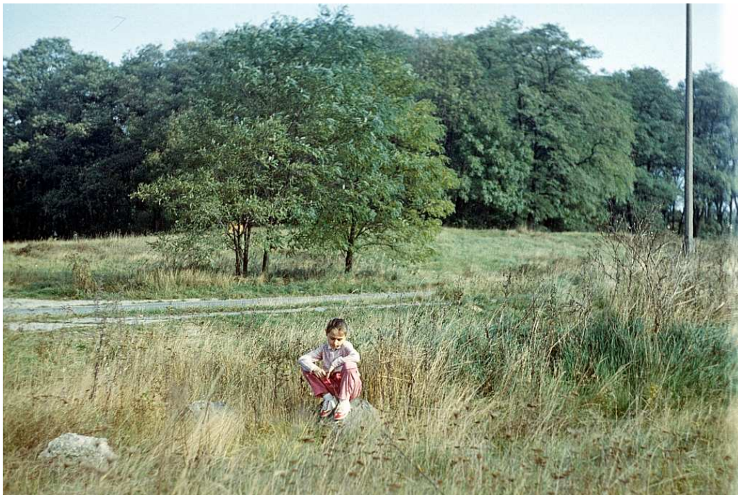
Fot. nr 96 (96-97). Widoki na fort Prokocim z ulicy Kostaneckiego. Lato 1989.