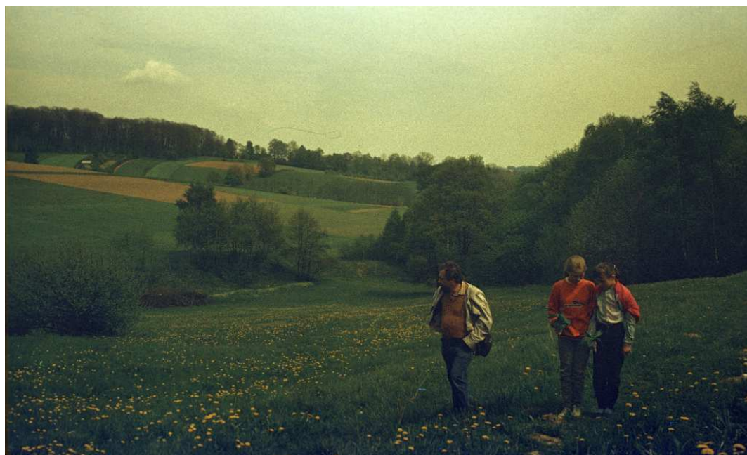
Fot. nr 123. Wiosna 1992.