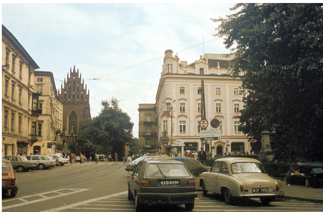
Fot. nr 23. Plac Dominikański – widok z dawnego Placu Wiosny Ludów. Lato 1992.