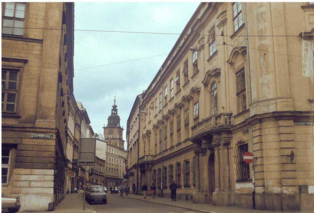
Fot. nr 26. Wzdłuż ulicy Brackiej w stronę Rynku Głównego. Lato 1992.