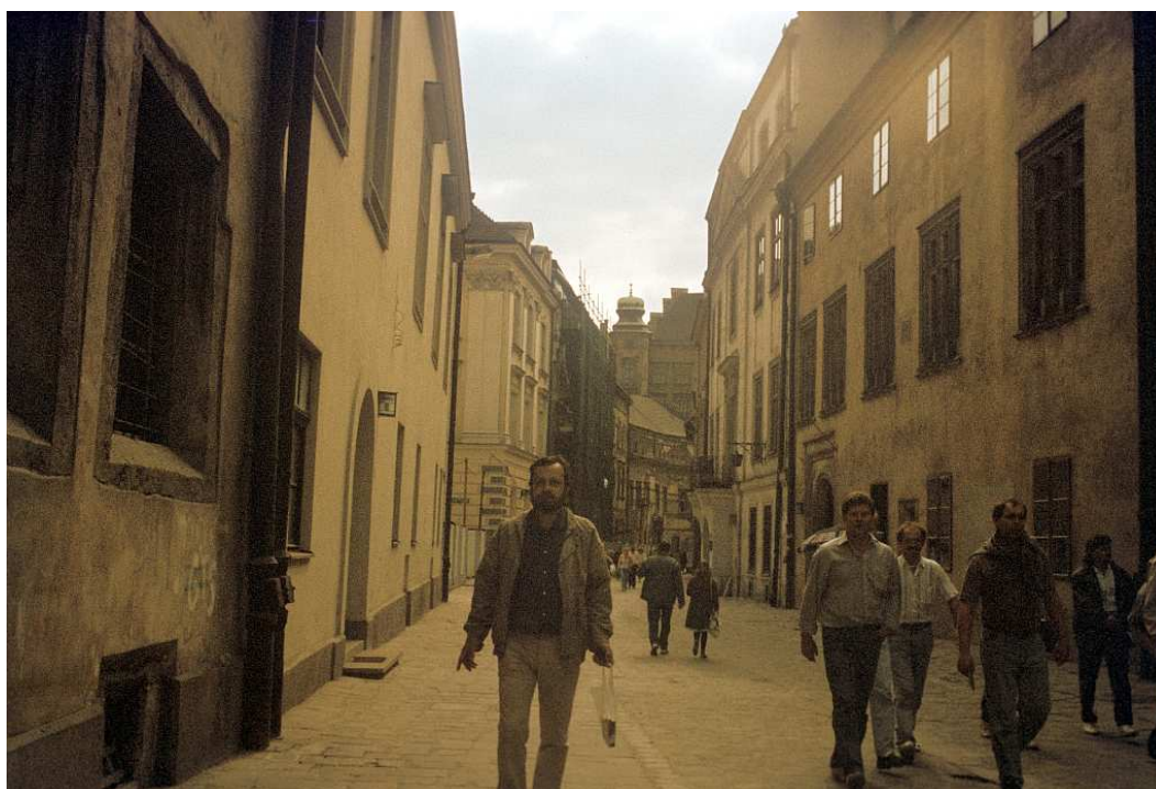
Fot. nr 12.. Lato 1992.