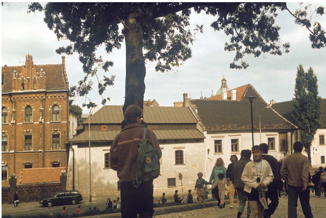
Fot. nr 16. Lato 1992.