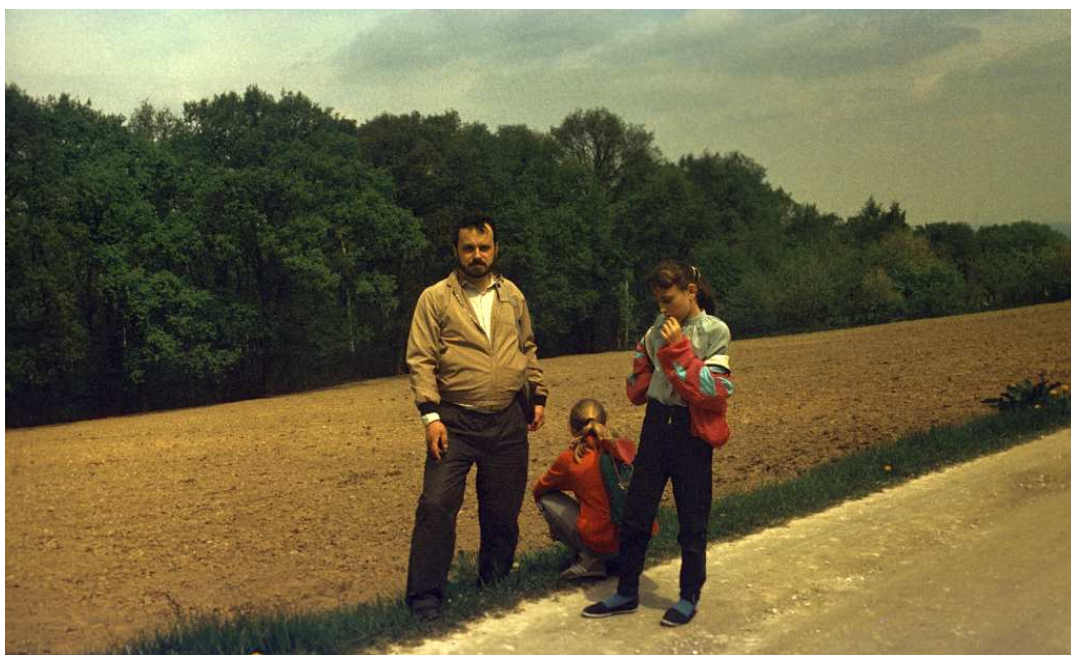
Fot. nr 127. Pola uprawne wzdłuż ulicy Szczawnickiej. Dziś jest tu dom na domu. Wiosna 1992.