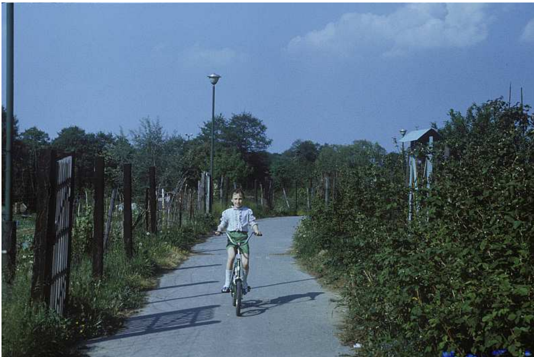
Fot. nr 93. Gdzie się podziały te ogródki działkowe?. Lato 1990.