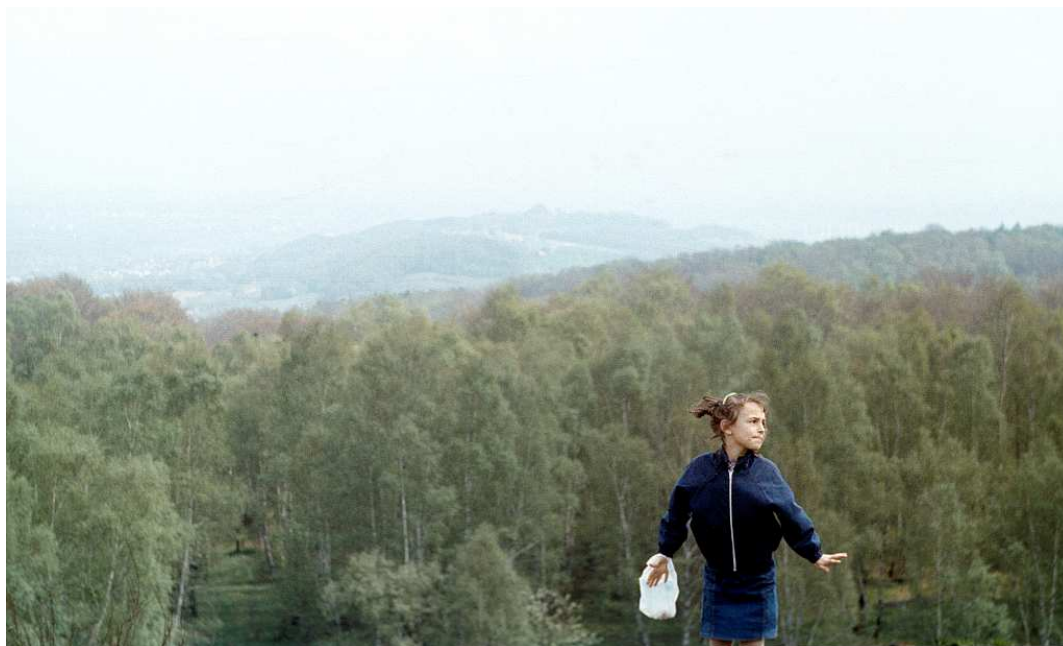
Fot. nr 63 (63-65). Ujęcia ze szczytu Kopca Piłsudskiego, tu w stronę Kopca Kościuszki. Wiosna 1990.