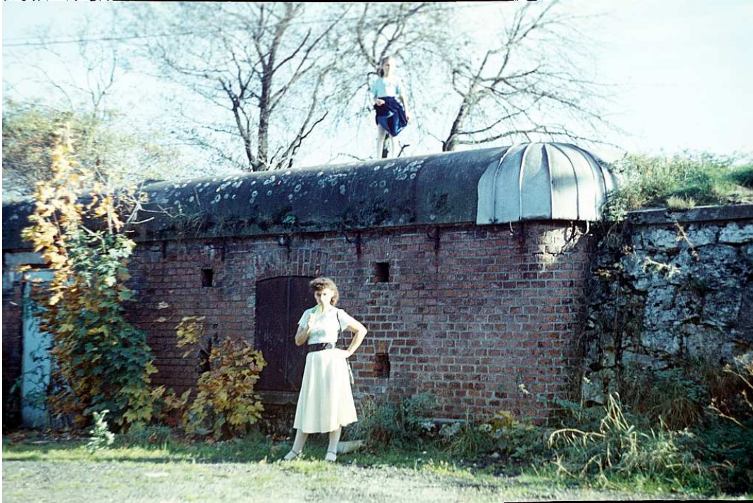
Fot. nr 118. Schron amunicyjny na początku ulicy Niebieskiej. Koniec lata 1989.