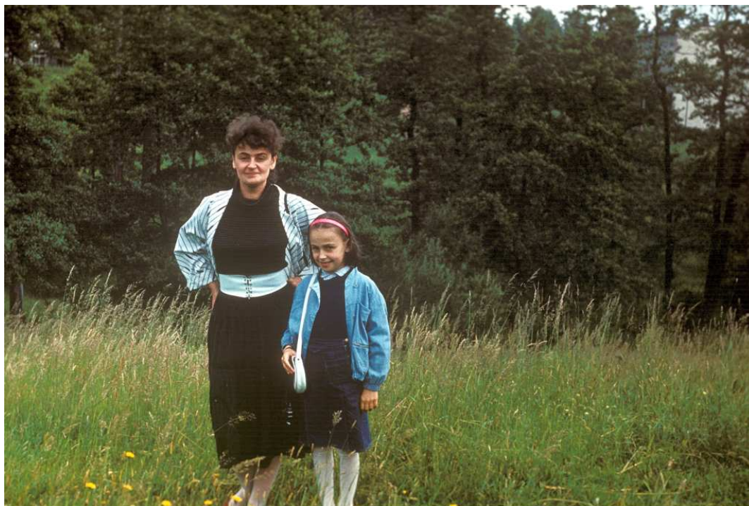
Fot. nr 90. Na górcie pod „akademikami”. Lato 1989.