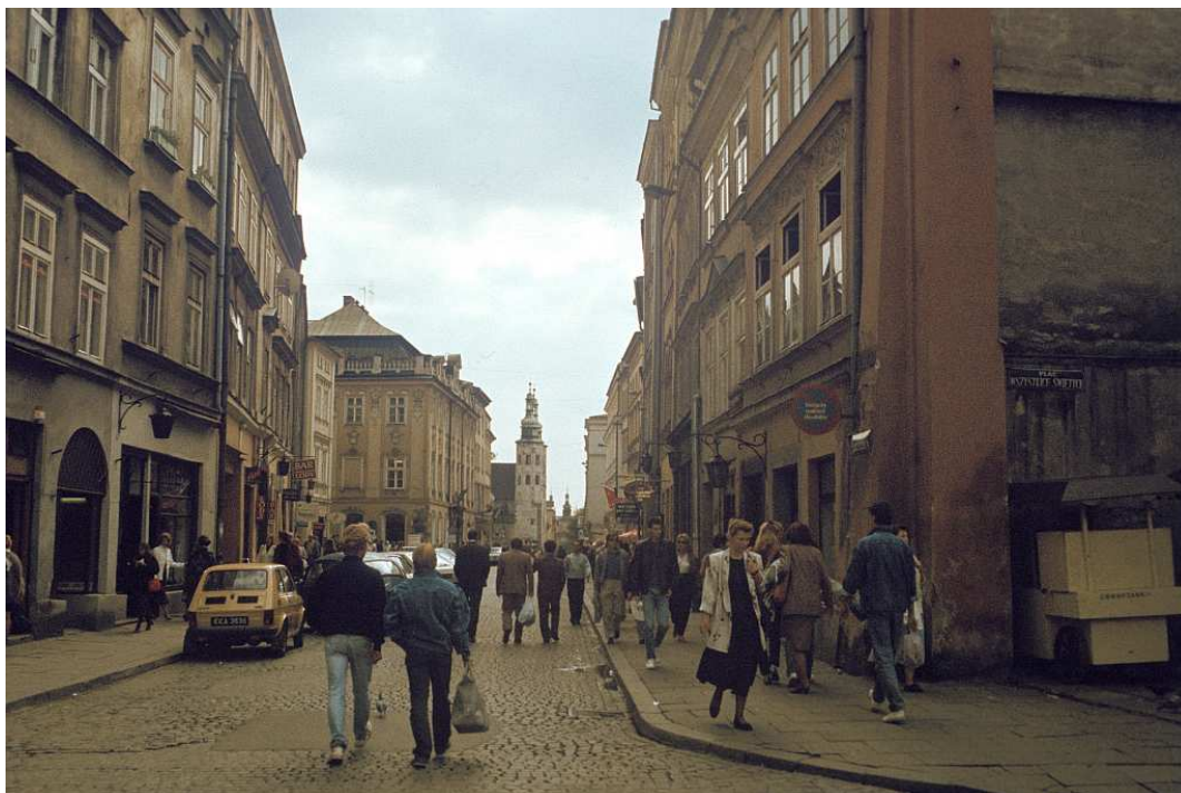
Fot. nr 22. Wzdłuż ulicy Grodzkiej – ujęcie z Placu Wiosny Ludów (dziś Wszystkich Świętych). Lato 1992.