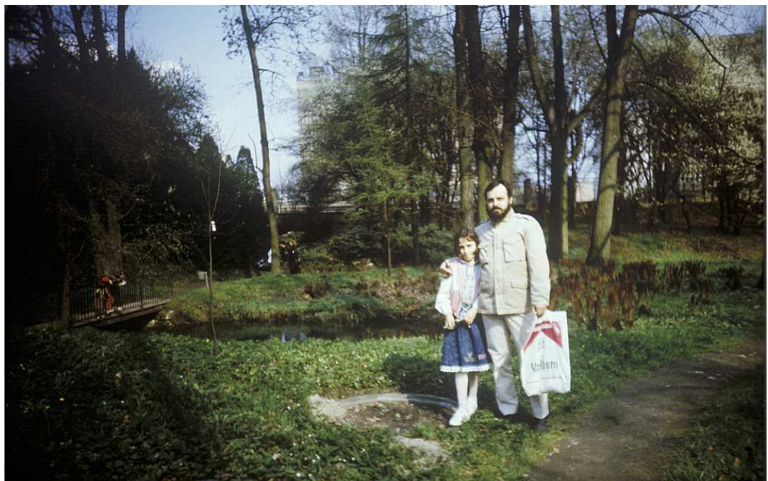
Fot. nr 41. Wiosna 1991.