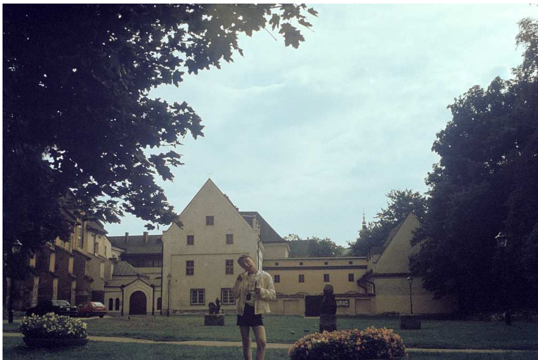
Fot. nr 5. Przed klasztorem Franciszkanów. Lato 1992.