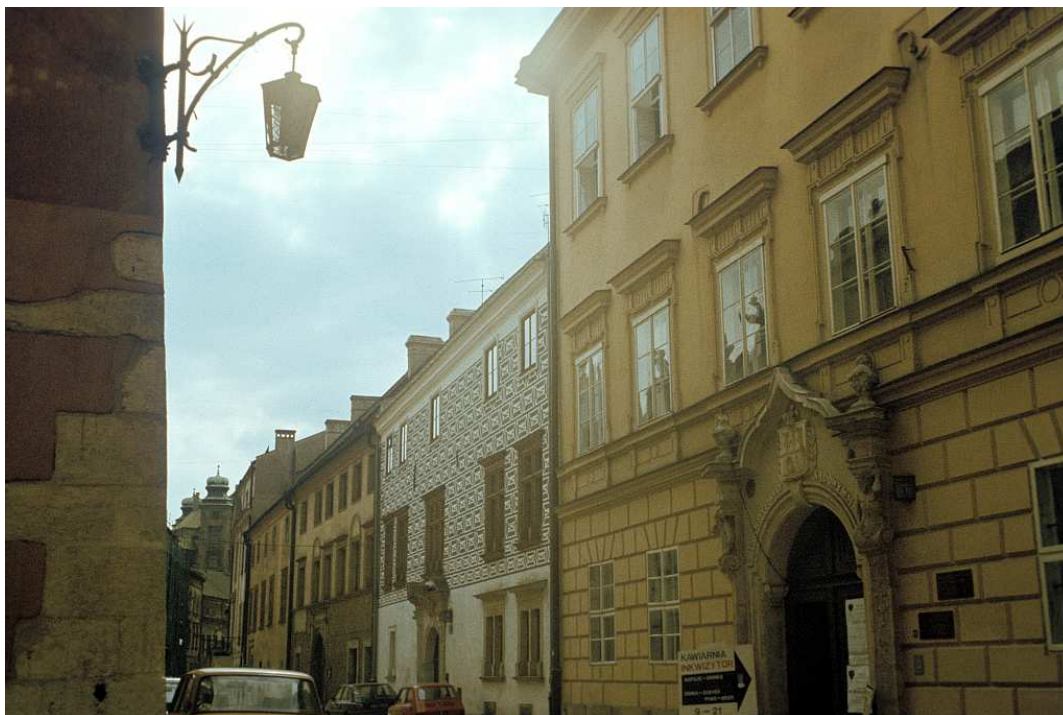
Fot. nr 11. Lato 1992.