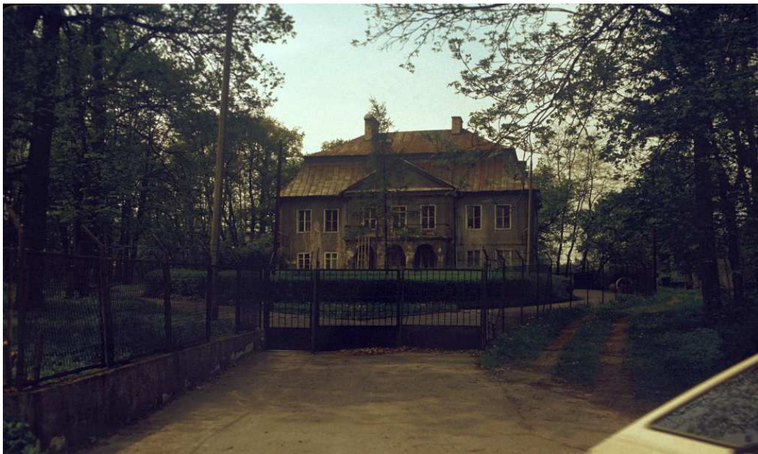
Fot. nr 117. Wiosna 1992