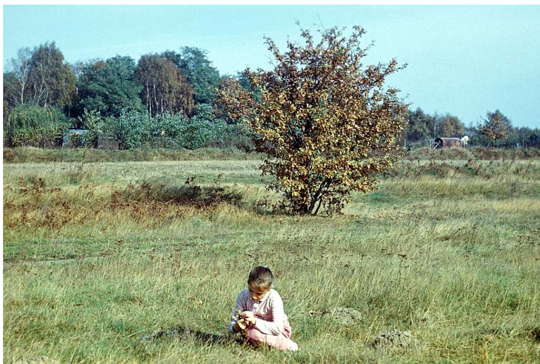
Fot. nr 103. Koniec lata 1989.