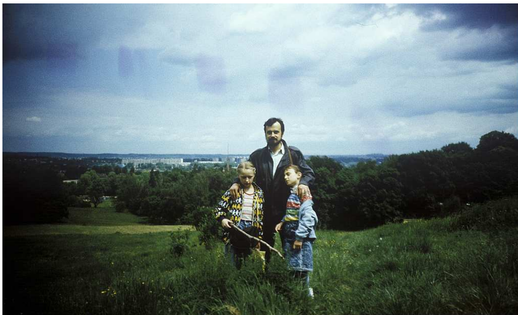
Fot. nr 52. Lato 1990.