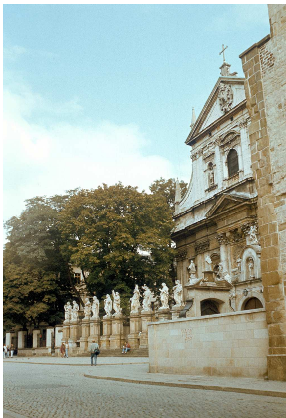
Fot. nr 21. Figury dwunastu apostołów przed kościołem św. Piotra i Pawła. Lato 1992.