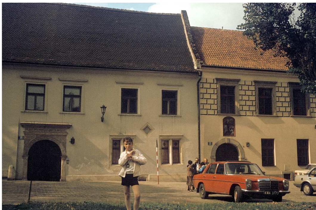
Fot. nr 15. Lato 1992.