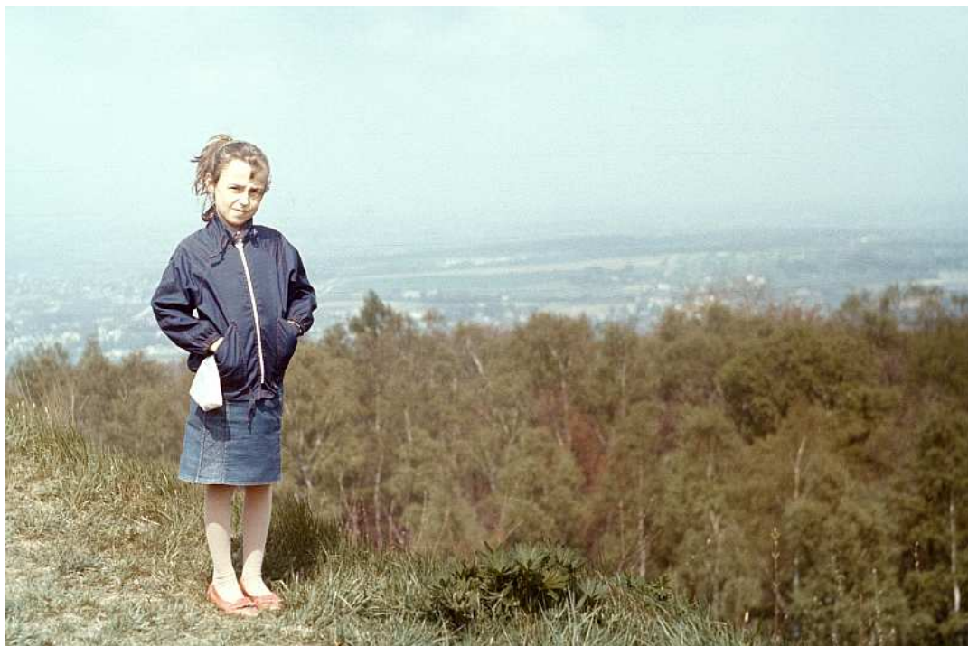
Fot. nr 65. W stronę Mydlnik. Wiosna 1990.