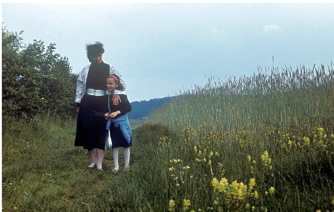
Fot. nr 105. Przy polnej ścieżce przy ogródkach działkowych. W tle lasek krzyszkowicki. Lato 1989.