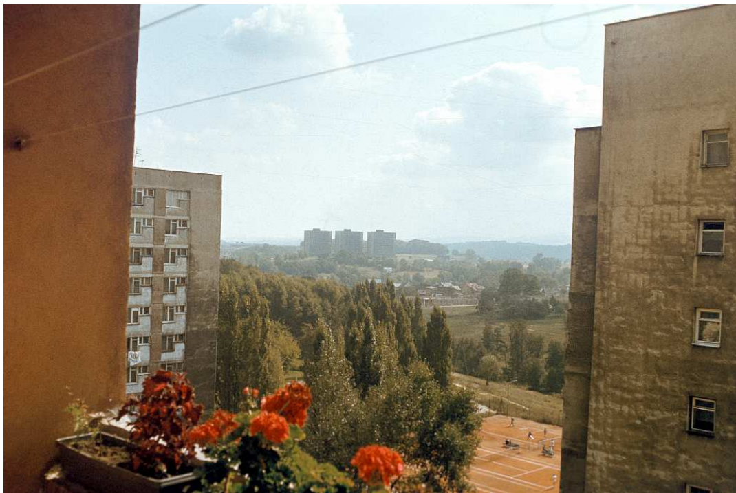
Fot. nr 87. Widok z wieżowca na końcu ulicy Spółdzielców w stronę trzech „akademików” AM na prokocimskim wzniesieniu Baranówka. Lato 1992.