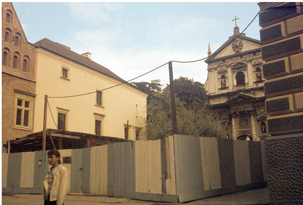
Fot. nr 13. Dawny Plac Wita Stwosza – dziś Marii Magdaleny. Lato 1992.