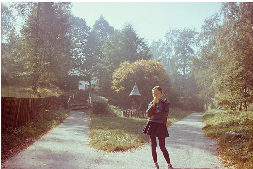
Fot. nr 47. Lato 1992.