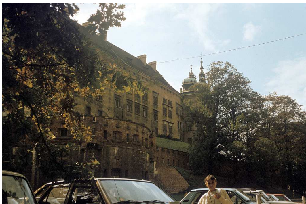
Fot. nr 17. Północna pierzeja zamku wawelskiego – widok z wylotu ulicy Kanoniczej. Lato 1992.