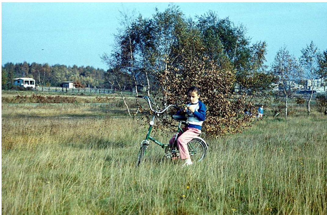
Fot. nr 102 (102-104). Sceneria rzęckich ugorów – widoki od strony stawu w kierunku ogródków działkowych i brzozowego lasu, który wzrastał wzdłuż ulicy Jakubowskiego. Koniec lata 1989.