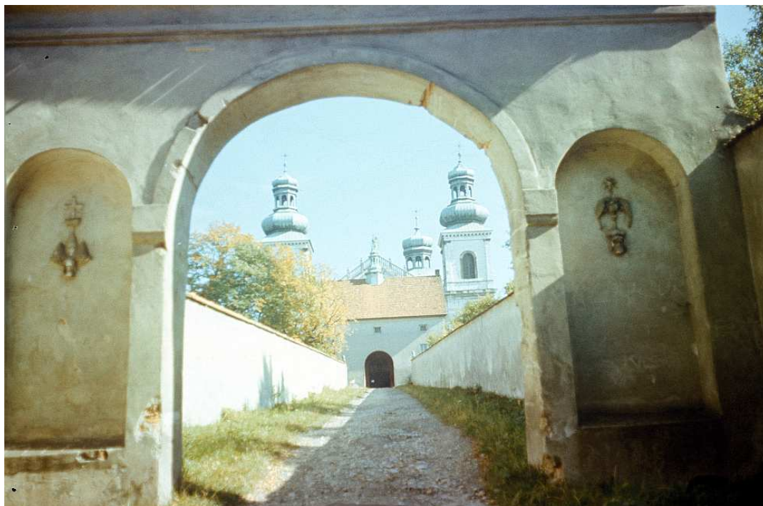
Fot. nr 70. Wiosna 1992.