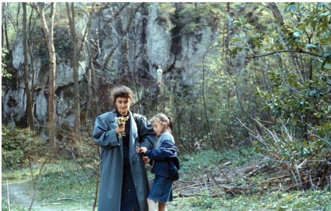
Fot. nr 55 (55-56). Panieńskie Skały i zdobiąca je przez dekady figura Matki Boskiej. Wiosna 1990.