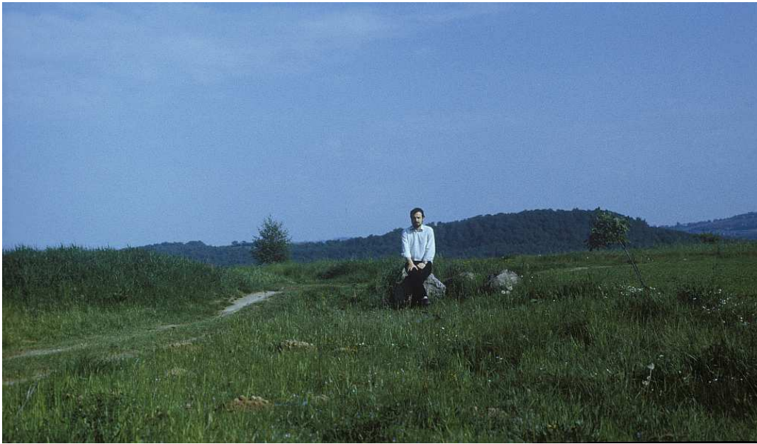
Fot. nr 98. Przy początkowym fragmencie „ulicy” Słona Woda – widok od strony ulicy Obronnej. Lato 1990