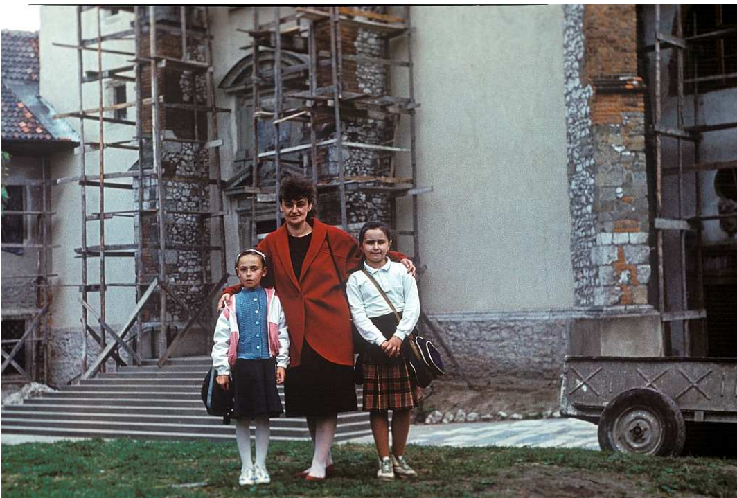
Fot. nr 77. Przed tyńieckim kościołem. Wiosna 1989.