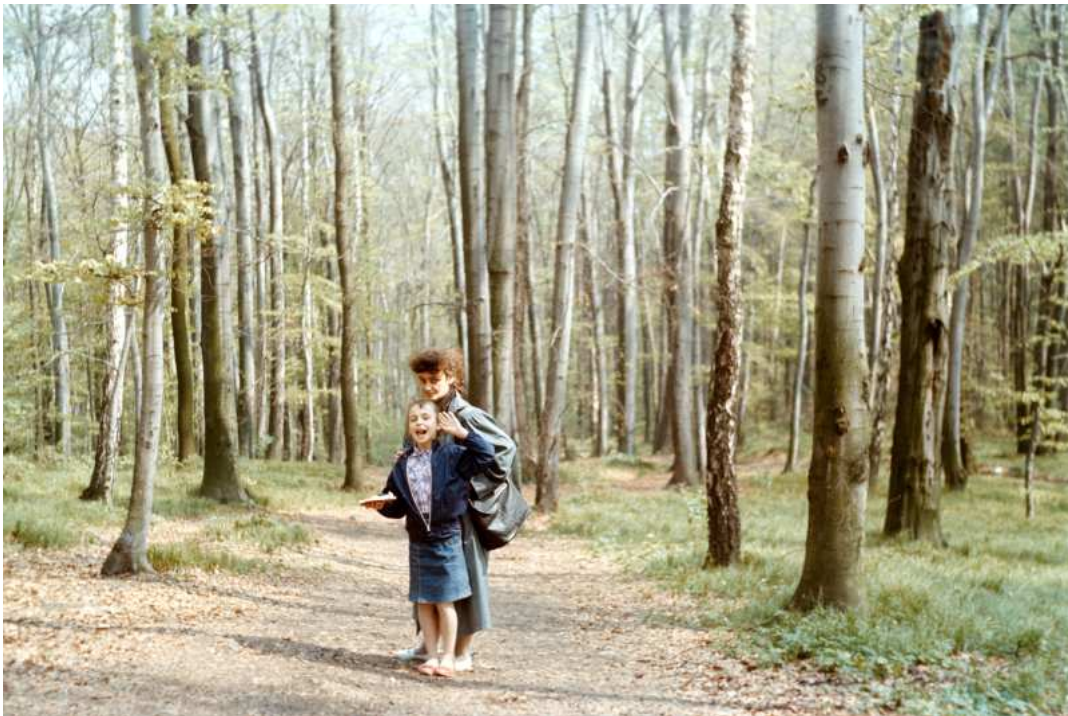
Fot. nr 58. Przy drodze do Kopca Piłsudskiego. Wiosna 1990.