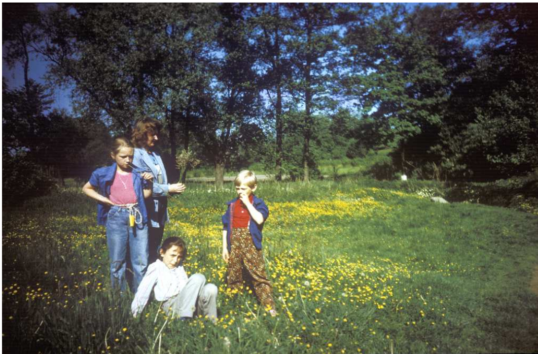
Fot. nr 88. W dolinie Drwinki na wysokości ulic: Sadka i Facimiech. Wiosna 1990.