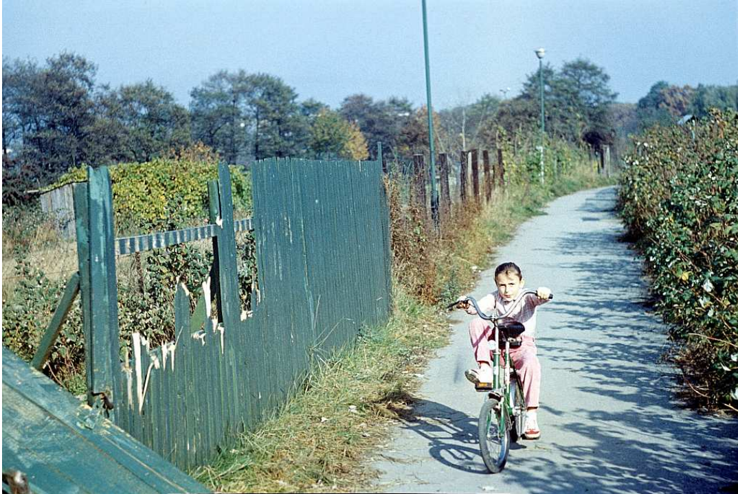
Fot. nr 92 (92-92). Na alejce, która łączyła „akademiki” AM z ulicą Wielicką i pętlą tramwajową w starym Prokocimiu. Lato 1989