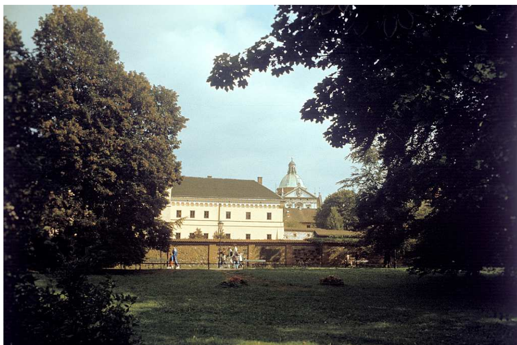
Fot. nr 8. Muzeum Archeologiczne i zachodnia strona dawnego Okołu – widok od strony Plant. Lato 1992.