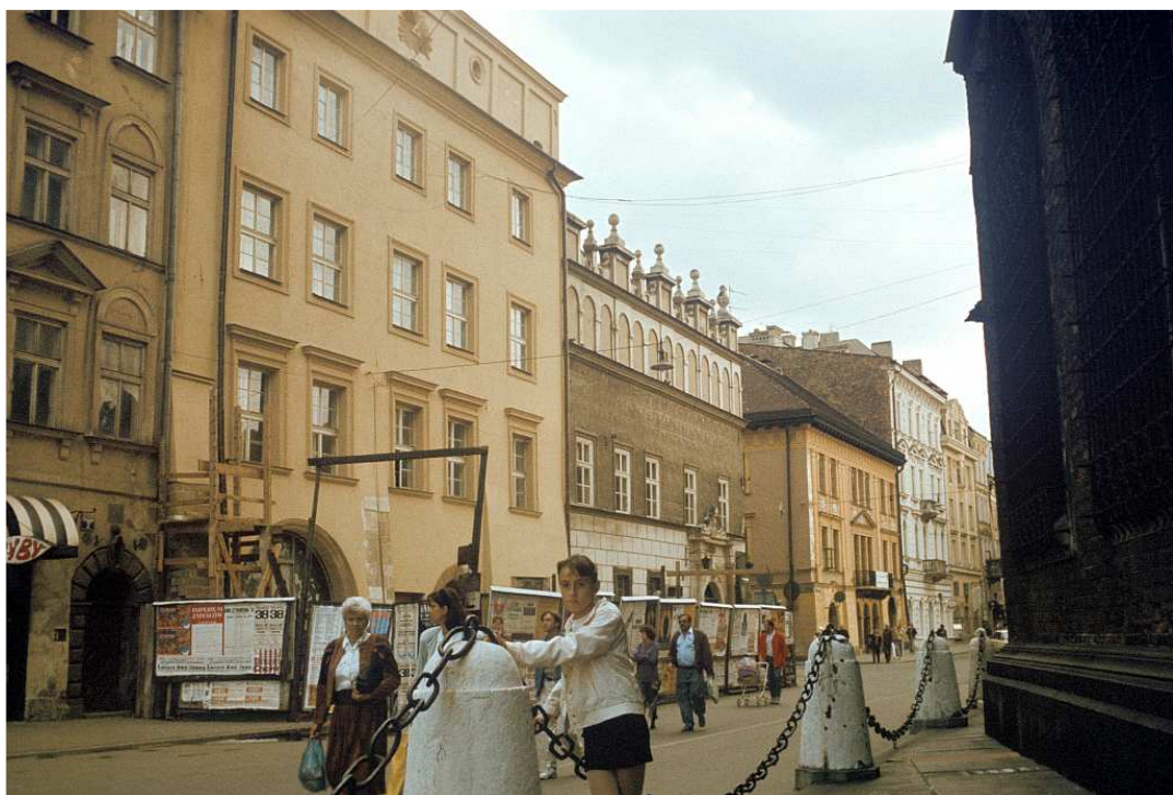
Fot. nr 29. Fragment zabudowy Placu Mariackiego. W tle ulica Mikołajska. Lato 1992.