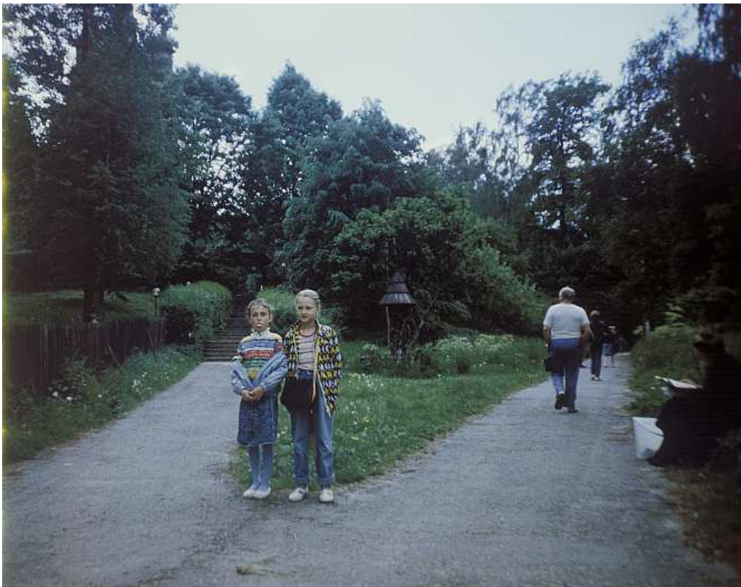
Fot. nr 46 (46-47). W sąsiedztwie drewnianego kościółka. Widoki z ulicy Panieńskie Skały. Lato 1990.