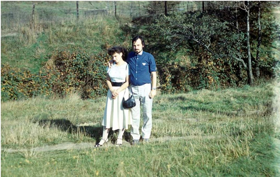
Fot. nr 114. Dolina Drwinki u wylotu ulicy Szpakowej. Lato 1989.