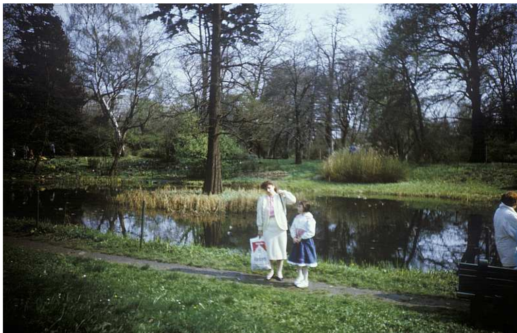
Fot. nr 42. Wiosna 1991.