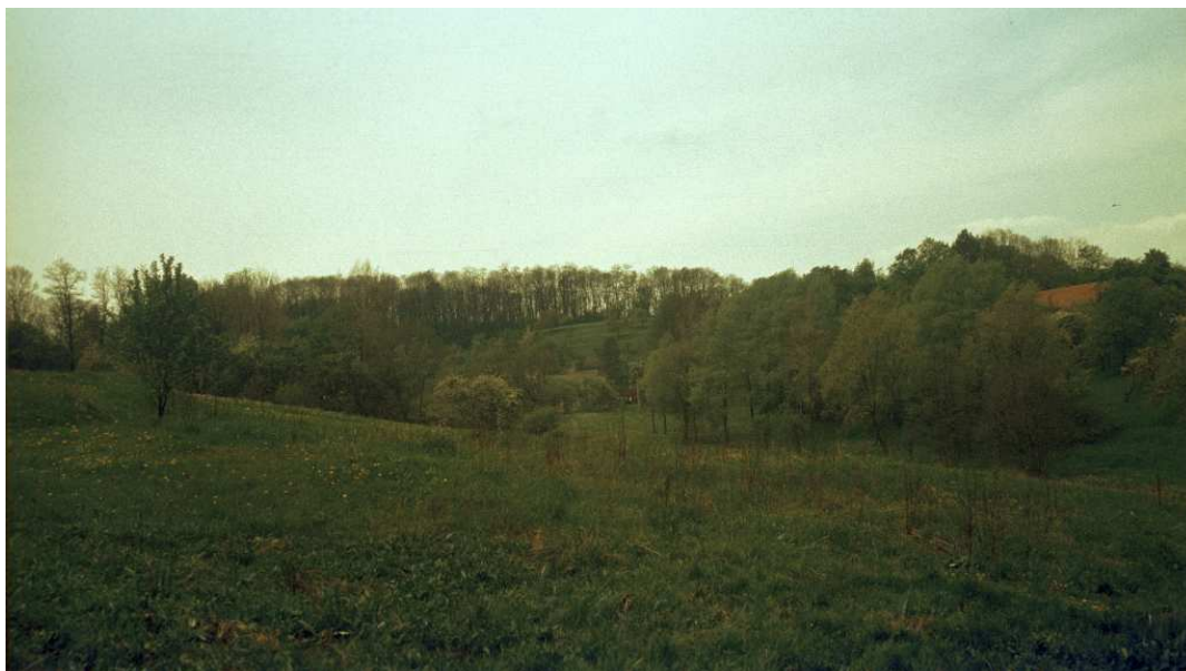
Fot. nr 134 (134-135). Widoki z doliny Malinówki w kierunku fortu w Rajsku (w tle). Wiosna 1992.