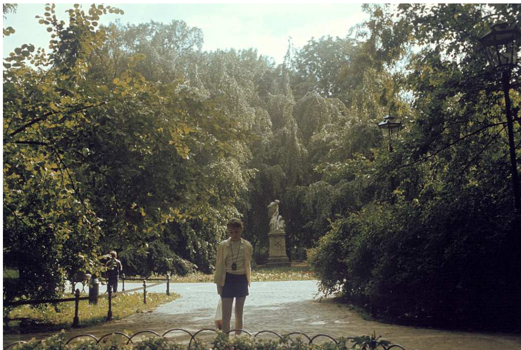
Fot. nr 7. Na Plantach, przy pomniku Grażyny i Litawora. Lato 1992.