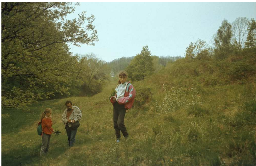
Fot. nr 135. Wiosna 1992.