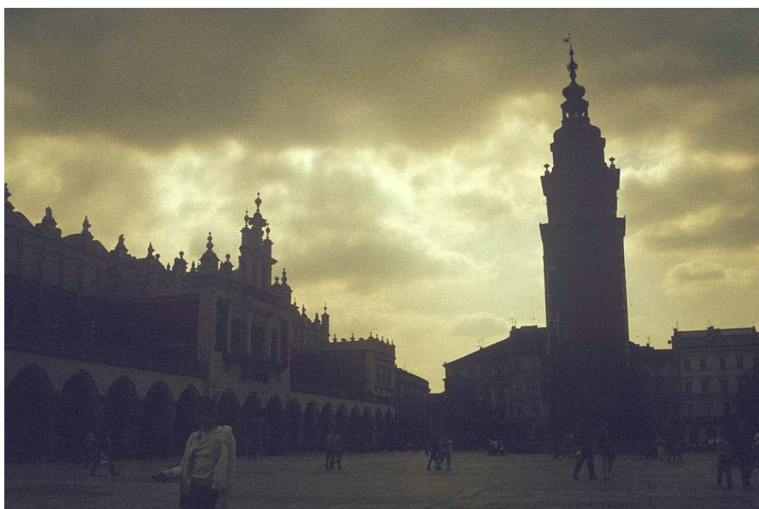
Fot. nr 27. Sukiennice i wieża ratuszowa. Widok od strony linii A-B Rynku Głównego. Lato 1992.