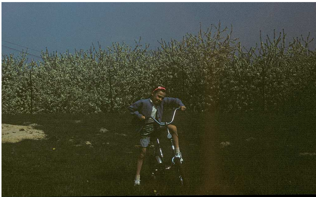
Fot. nr 94. Przy ogrodzeniu sadu przy ulicy Kostaneckiego – widok od strony biblioteki AM. Wiosna 1989.