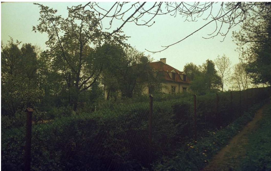
Fot. nr 130. Dworek w sąsiedztwie ulicy Nad Fosą. Wiosna 1992