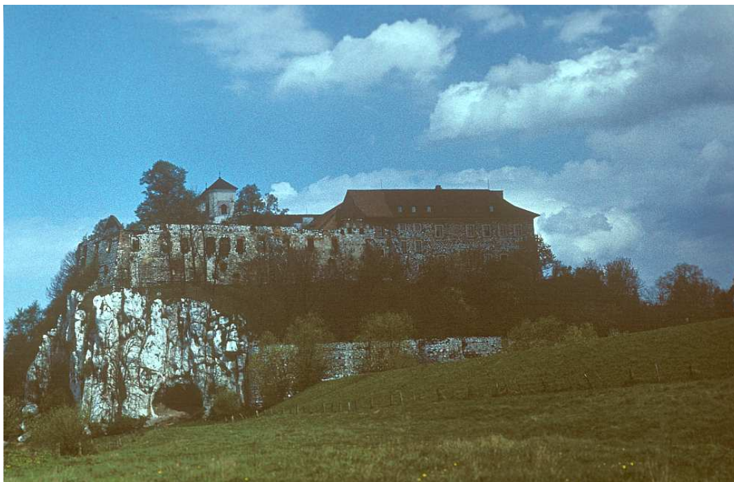
Fot. nr 74 (74-75). Opactwo Benedyktynów – widoki od strony wzgórza Grodzisko. Wiosna 1989.