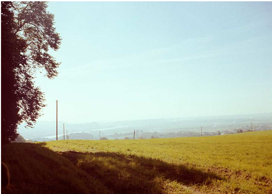
Fot. nr 69. Niczym niezarośnięte zbocze Srebrnej Góry od strony ulicy Orlej, gdzie dziś rosną winogrona. Wiosna 1992.