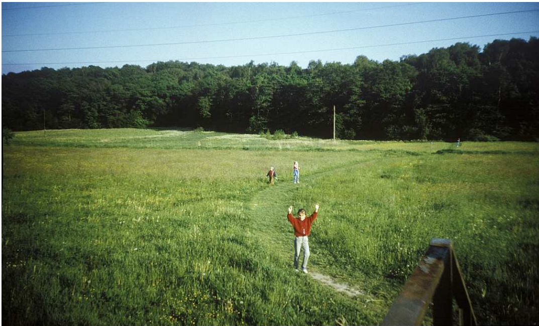
Fot. nr 111 (111-113). Na kwietnej łące w dolinie Malinówki pomiędzy Rząką (ulicą Kosocicką), a Krzyszkowicami, gdzie dekadę później ruszyła budowa autostrady A-4. Lato 1990.