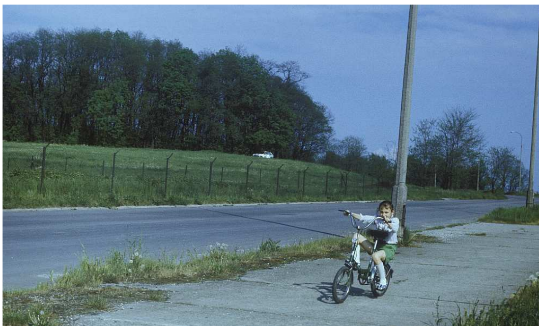
Fot. nr 97. Wiosna 1990.