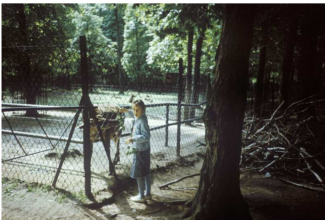
Fot. nr 68. Lato 1990.