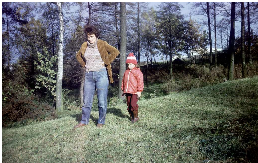
Fot. nr 135. Jesień 1986,