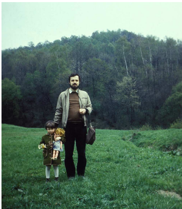
Fot. nr 219. Krzyszkowicki las. Widok od strony Kosocic, ponad potokiem Malinówka. Wiosna 1984.