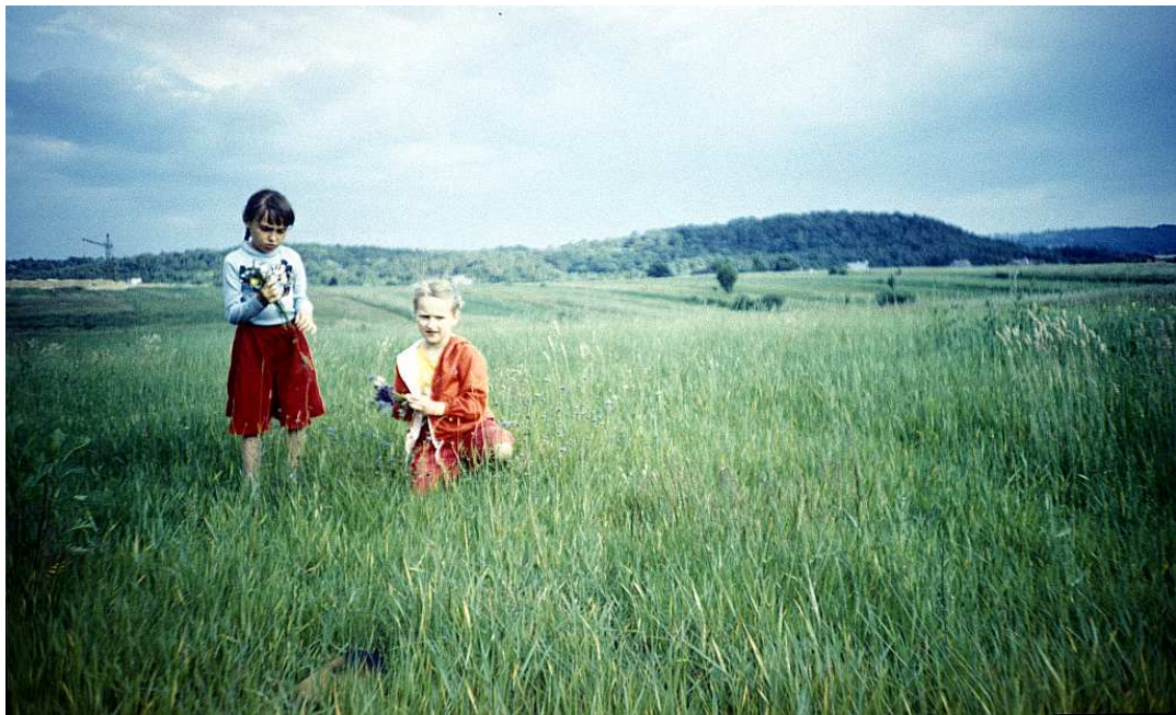
Fot. nr 174. Krzyszkowickie wzniesienia i lasek. Widok od strony większego ze stawów. Z lewej trwa budowa osiedla Rząka. Lato 1988