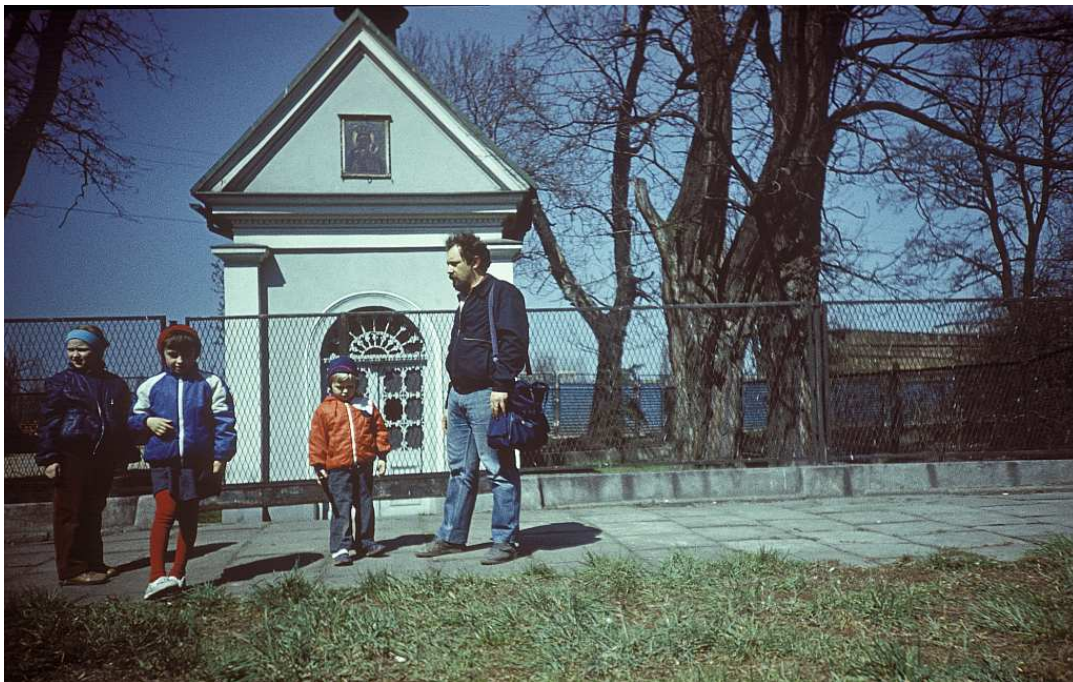
Fot. nr 84. Przy kapliczce przy ulicy Twardowskiego. Wiosna 1988.