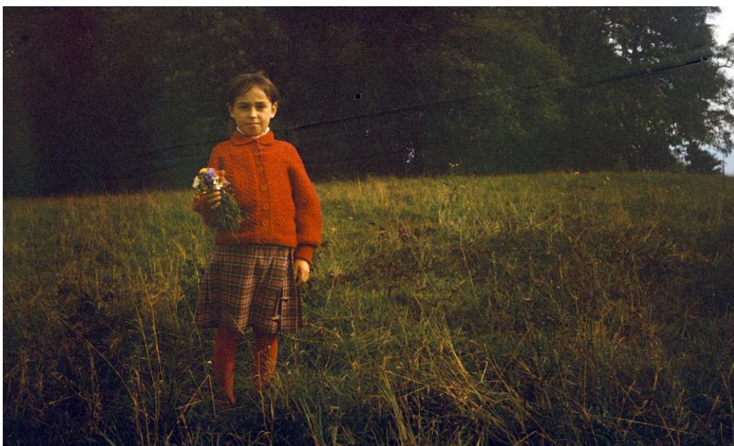
Fot. nr 153. Wrzesień 1988.