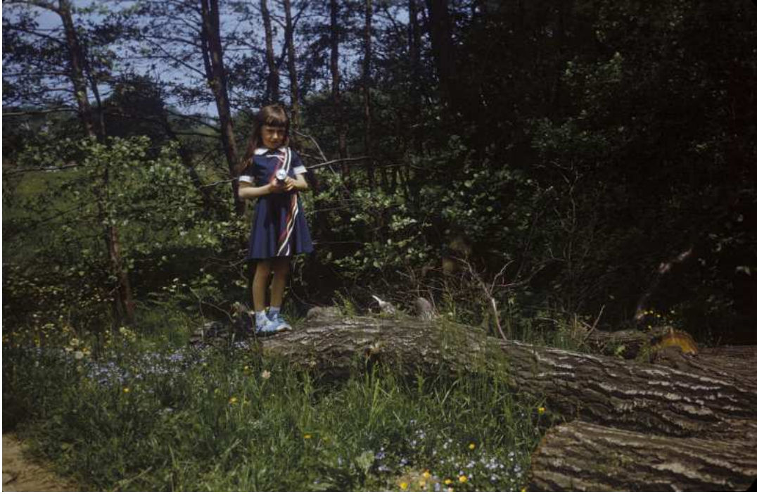
Fot. nr 193. Lato 1988.