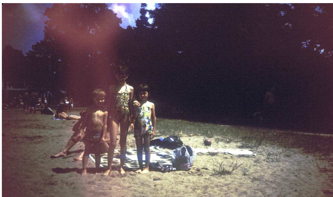
Fot. nr 201 (201-204). Na niczym nieskrępowanym kąpielisku w Kryspinowie. Lato 1986.