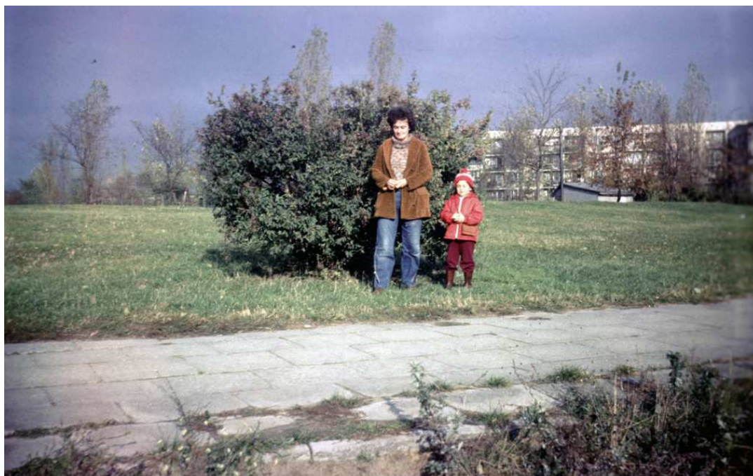
Fot. nr 123. Jesień 1986.