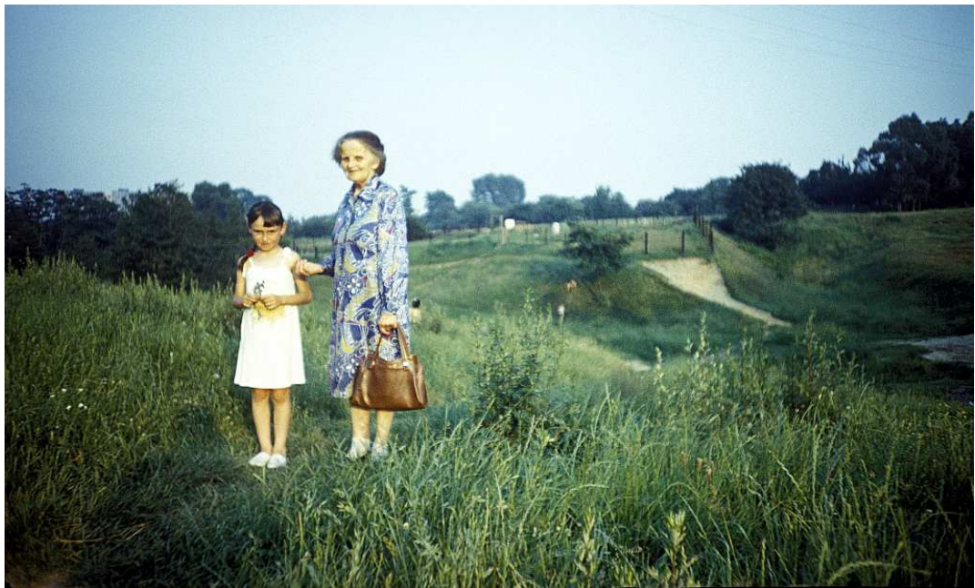
Fot. nr 154. Brzeg Piasków Wielkich za Drwinką. Ujęcie od strony osiedla Na Kozłowce. Lato 1988.