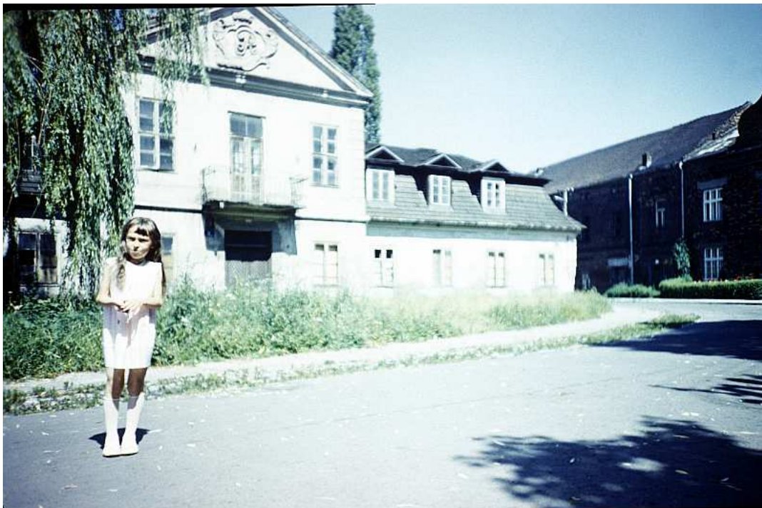
Fot. nr 206. Styk ulic: Białoprądnickiej i Papierniczej. Lato 1988.