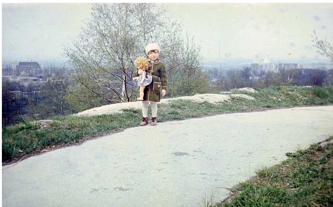
Fot. nr 138 (138-144). Ujęcia z góry pod krzyżem w sąsiedztwie „akademików” AM. Tu Wiosna 1984