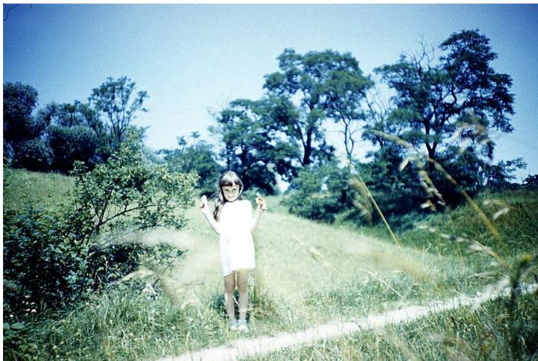
Fot. nr 209 (209-210). Na zboczu fortu nr 41a Mydlniki. Lato 1988.