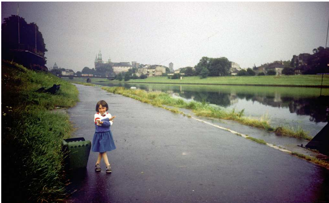
Fot. nr 45. Lato 1986.