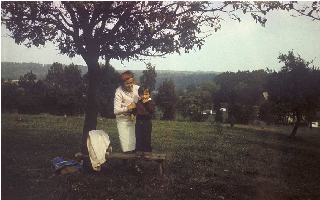
Fot. nr 223 (223-224). Na działce mojej Babci – z widokiem na las. Wrzesień 1983.