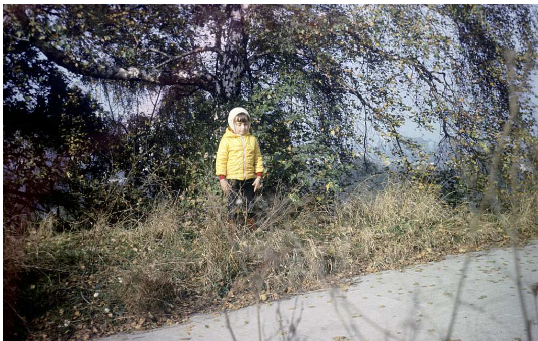
Fot. nr 141. Jesień 1987.