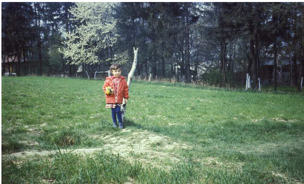
Fot. nr 54. Skraj Wesołej Polany. Wiosna 1984.