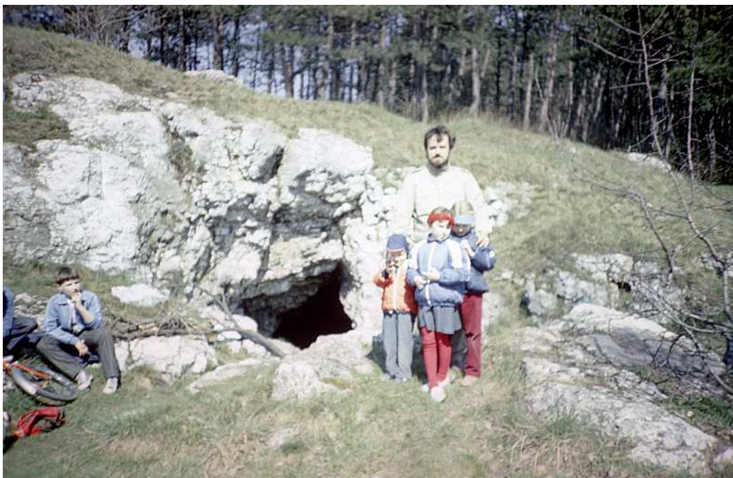
Fot. nr 94. Pod grotą Twardowskiego. Wiosna 1988.