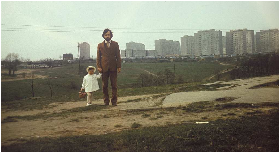
Fot. nr 154. Osiedle Piaski Nowe ponad Drwinką. Widoki od strony osiedla Na Kozłowce. Tu kwiecień 1983