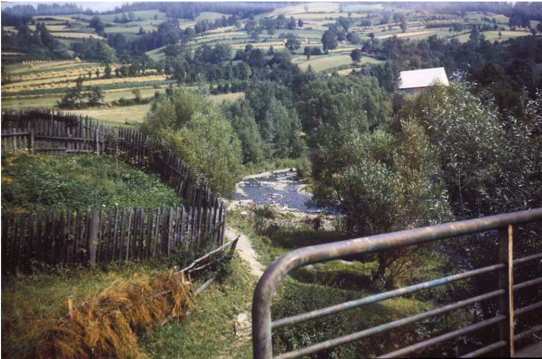
Fot. nr 227. Pola uprawne Mszany – widok z mostku w sąsiedztwie cmentarza. Wrzesień 1984