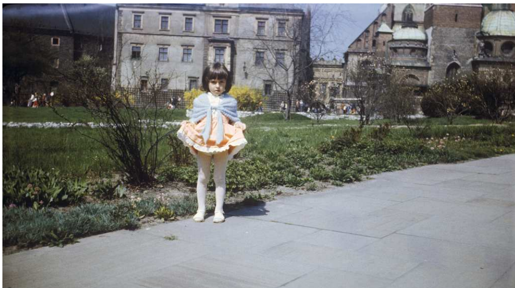
Fot. nr 6 (6-9). Na wawelskim dziedzińcu zewnętrznym, z katedrą w tle. Wiosna 1984