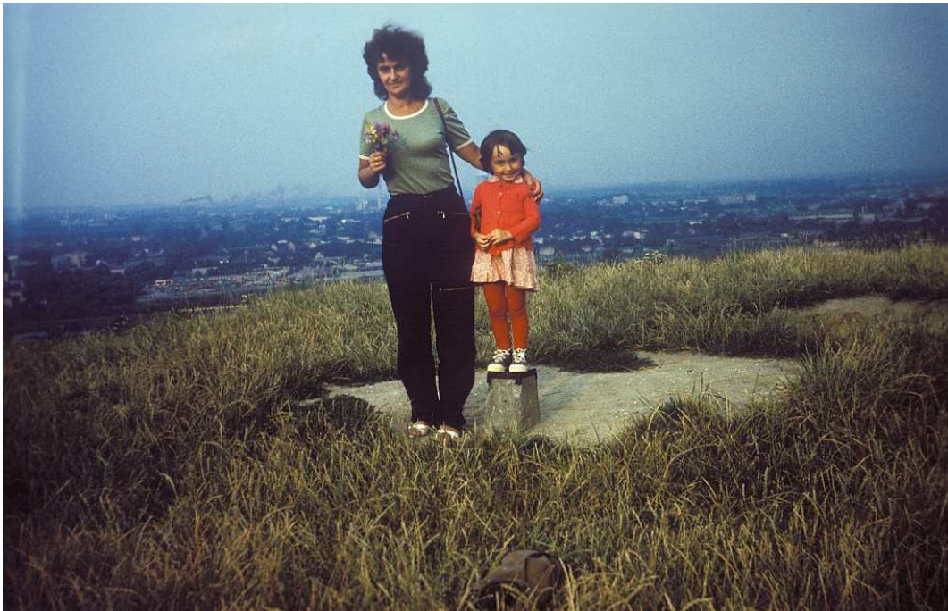
Fot. nr 105. Jesień 1983.