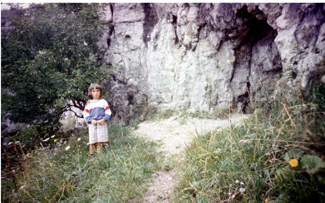
Fot. nr 95. Przy jaskini Jasnej. Lato 1896.