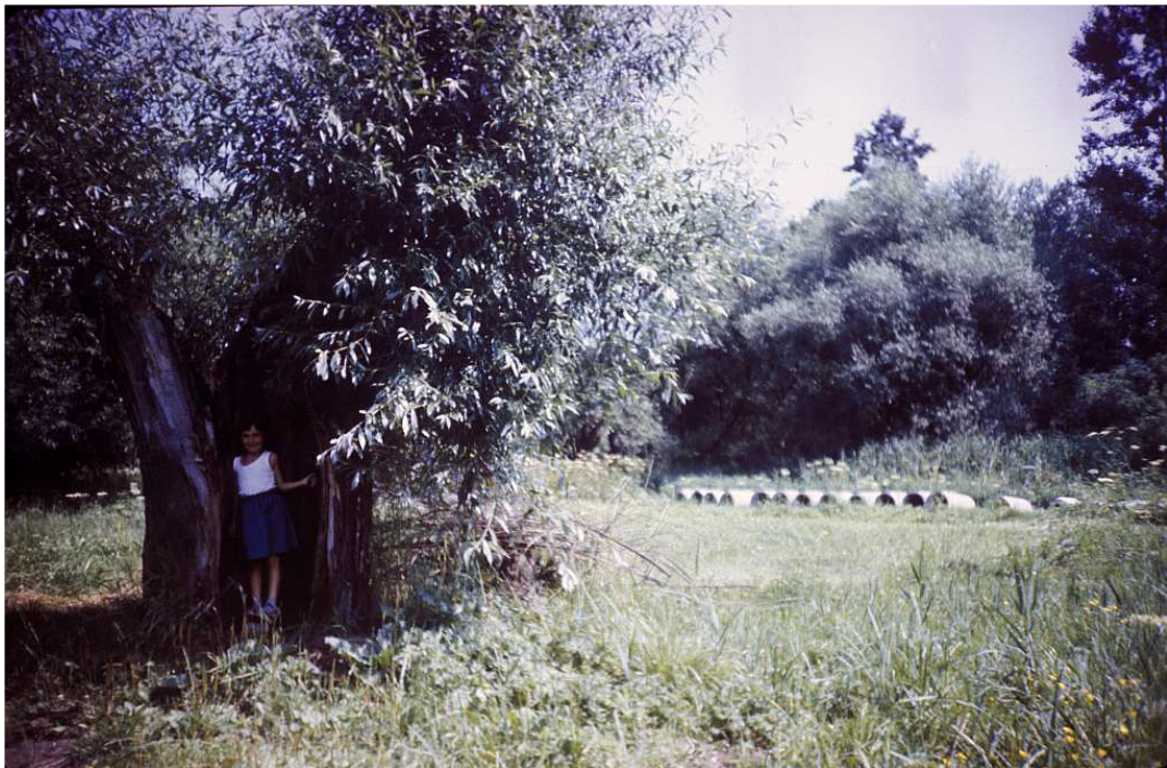
Fot. nr 198. Wierzba przy polnej ścieżce na przestrzeni pomiędzy ulicami: Myslenicka i Lusińską. Sierpień 1986.