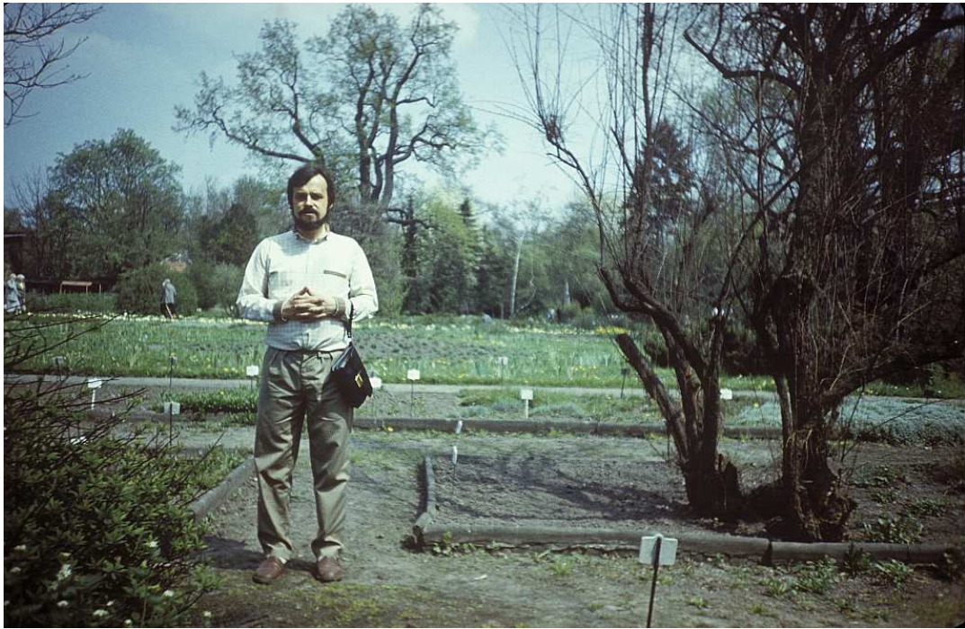
Fot. nr 23. Wczesna wiosna 1988.