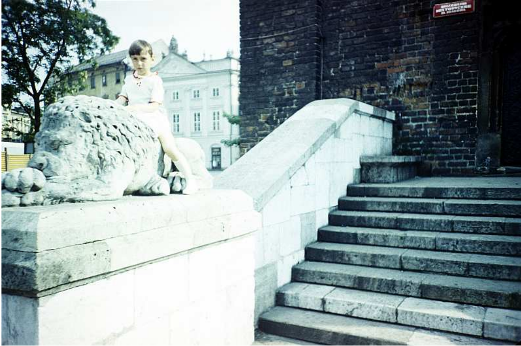
Fot. nr 14. Przed ratuszem. Lato 1988.