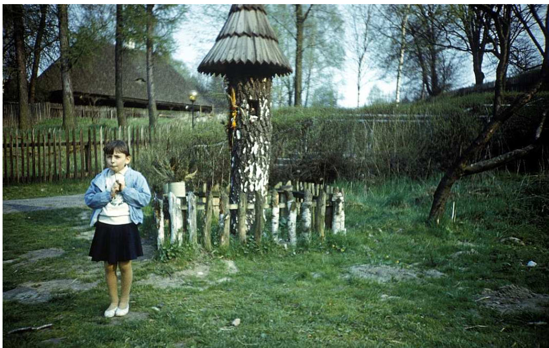
Fot. nr 49.. Wiosna 1988.