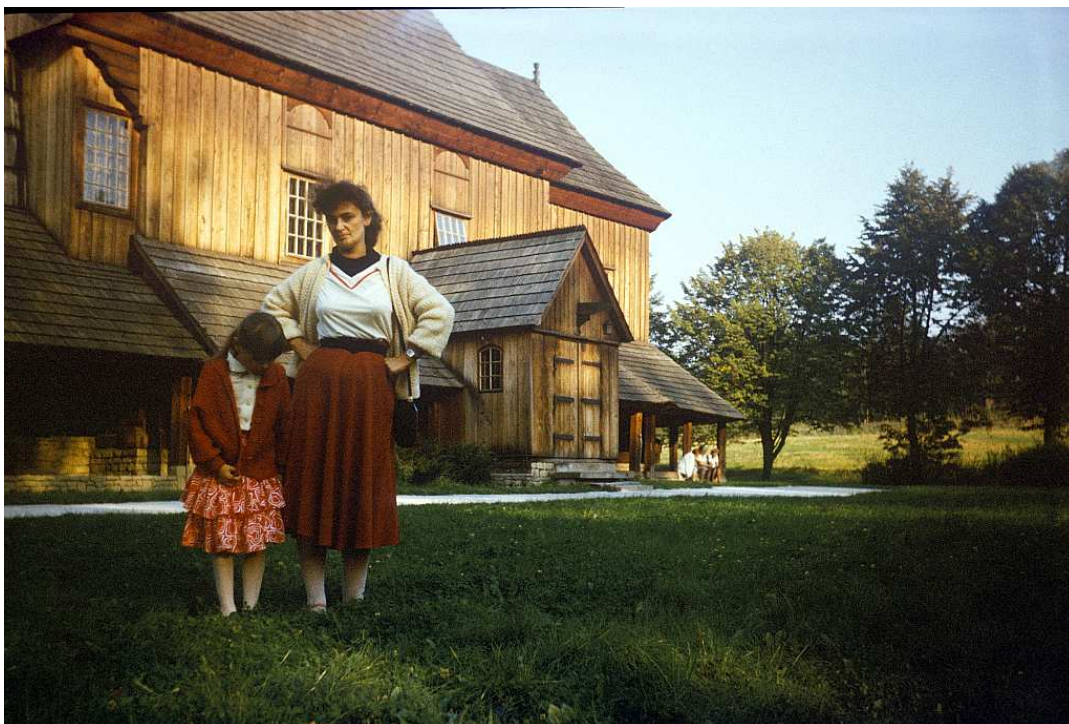
Fot. nr 52. Jesień 1988