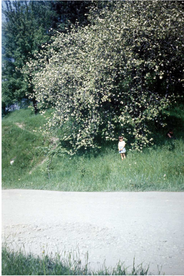
Fot. nr 112 (112-112a). Niezakrzaczone jeszcze zbocze Lasu Bonarka od strony torów kolejowych i ulicy Kamieńskiego.