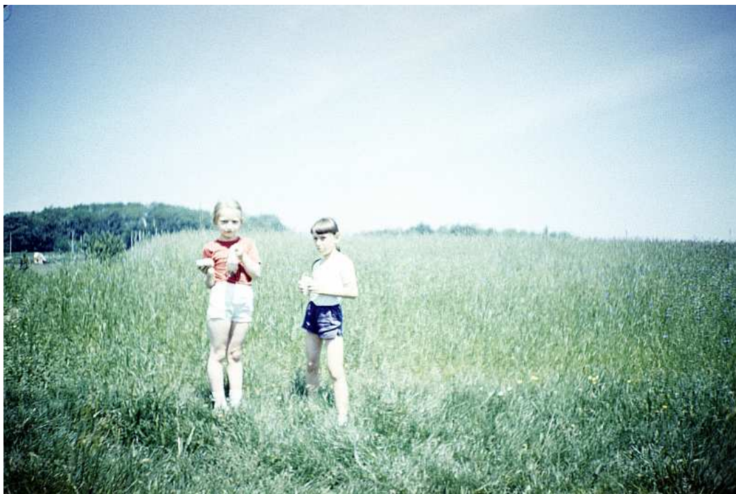
Fot. nr 161. Ponad łąkami w stronę fortu Prokocim. Lato 1988.