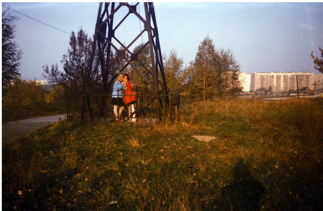
Fot. nr 145. Na górcie pod krzyżem. W tle bloki osiedla Nowy Prokocim za ulicą Wielicką. Jesień 1988.