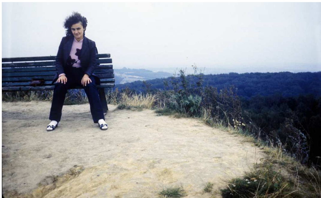
Fot. nr 76 (76-78). Na szczycie Kopca. Wrzesień 1984.