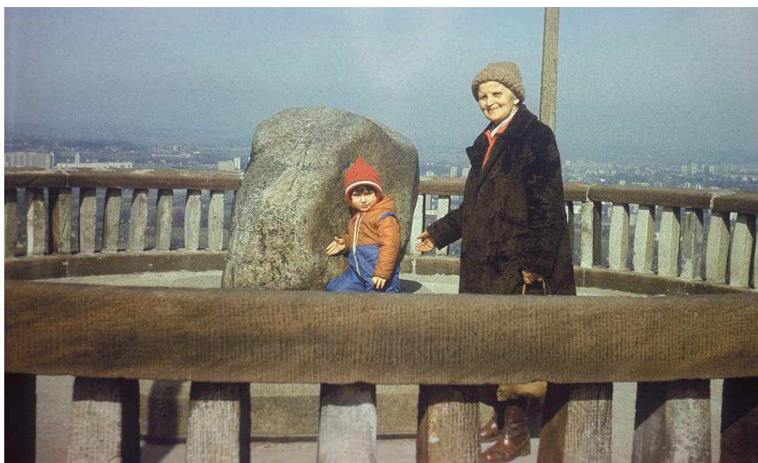
Fot. nr 34 (34-37). Na szczycie Kopca. Tu zima z początku 1983 roku.