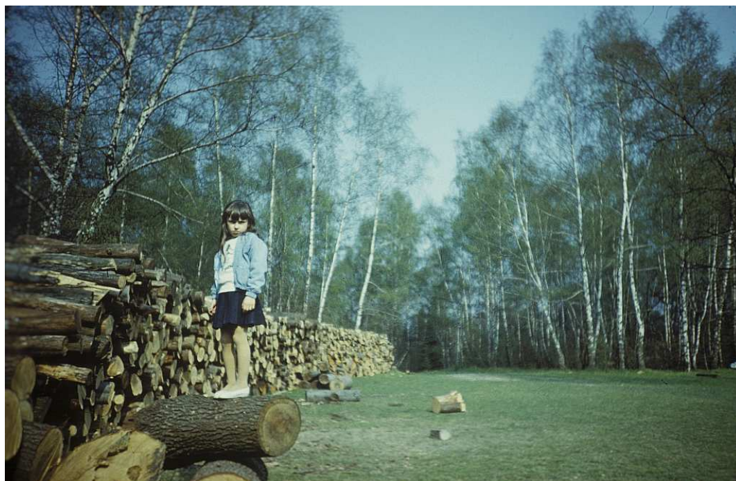
Fot. nr 73. Wiosna 1988.