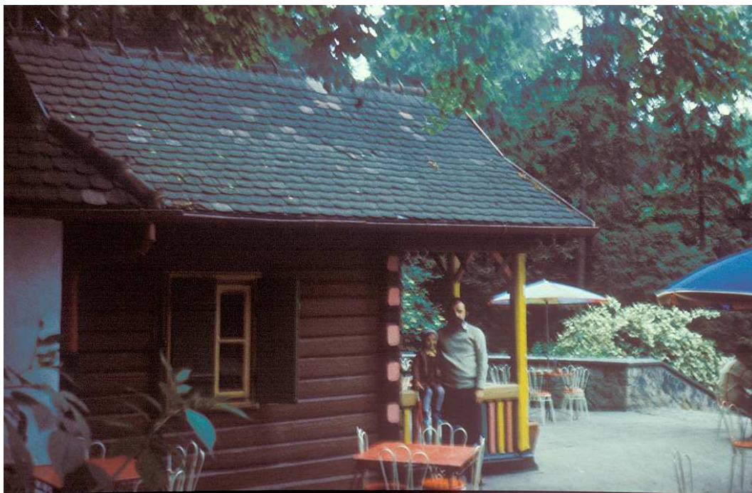
Fot. nr 58 (58-60). Trzy ujęcia Baby Jagi, kawiarenki na skraju lasu przy ulicy Leśnej. Tu jesień 1983.