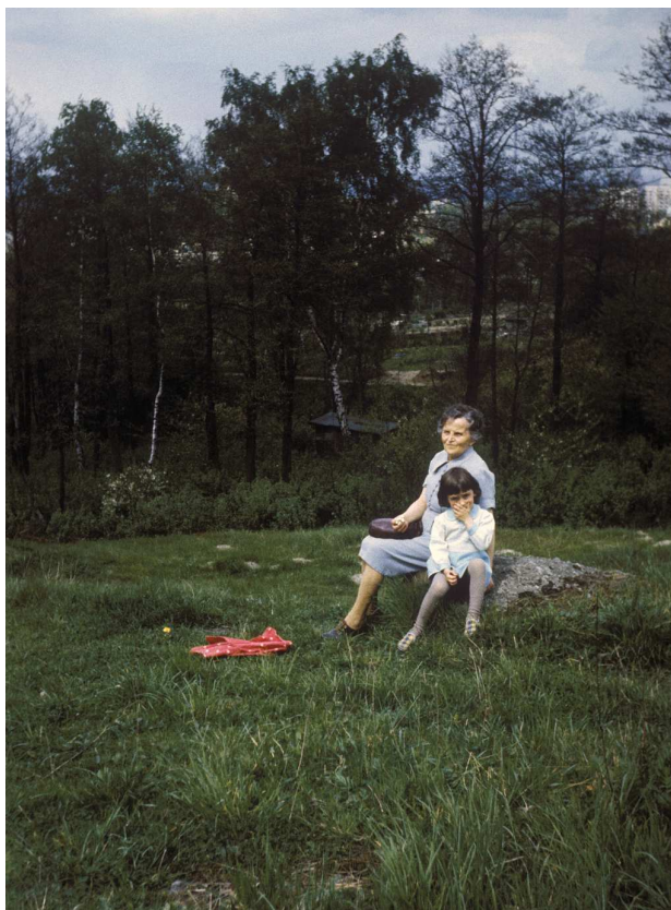
Fot. nr 139. Lato 1984