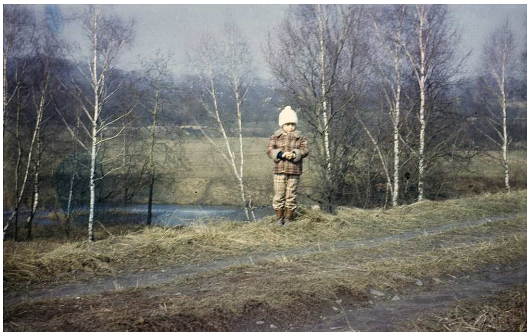
Fot. nr 89. Przy stawie przy ogródkach działkowych przy ulicy Salezjańskiej. Późna jesień 1986