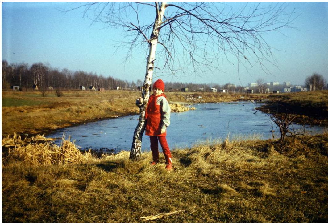
Fot. nr 169. Zima 1988/89.