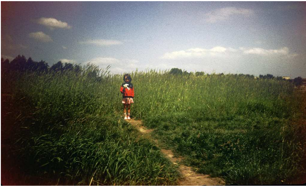
Fot. nr 186. Polna ścieżka przez łąny spod Domu Spokojnej Jesieni do ulicy Kosocickiej. Lato 1986.