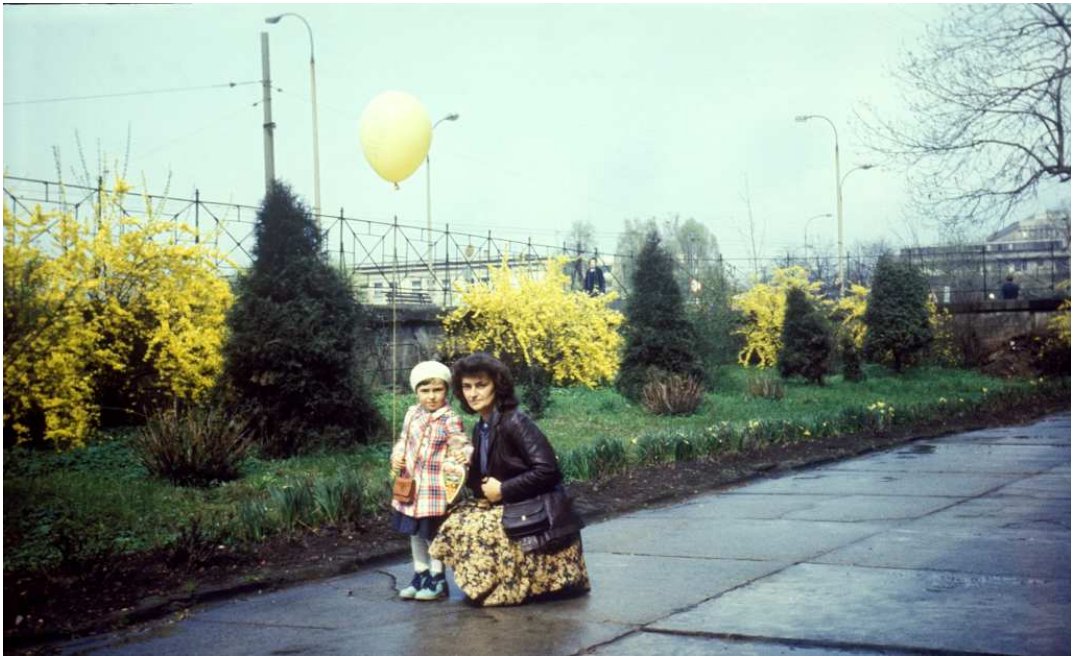
Fot. nr 44. Przy kościele Norbertanek. Wielkanoc 1984.