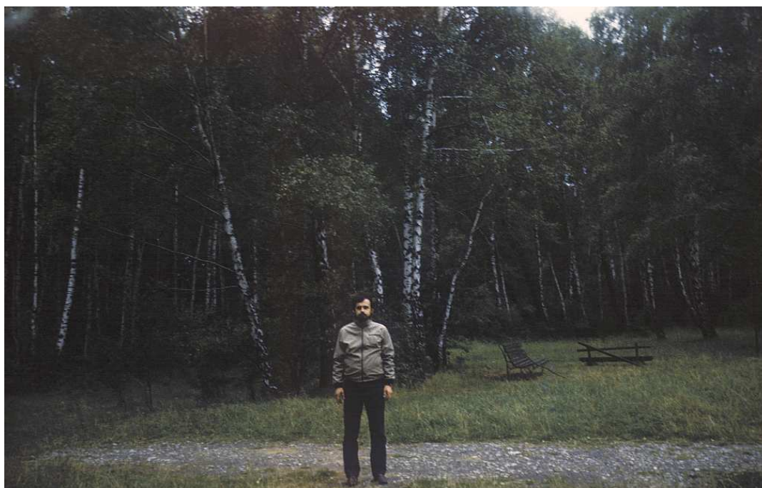
Fot. nr 71 (71-74). U podnóża Kopca Piłsudzkiego na Sowińcu. Lato 1984.