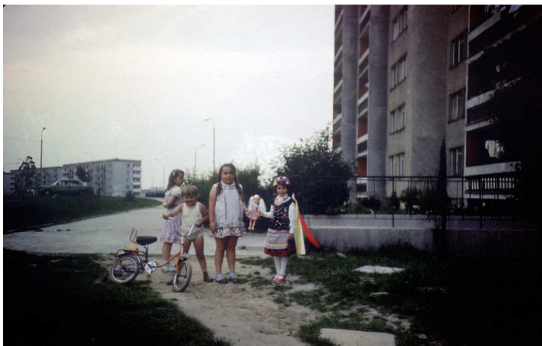
Fot. nr 115. Boże Ciało 1986.