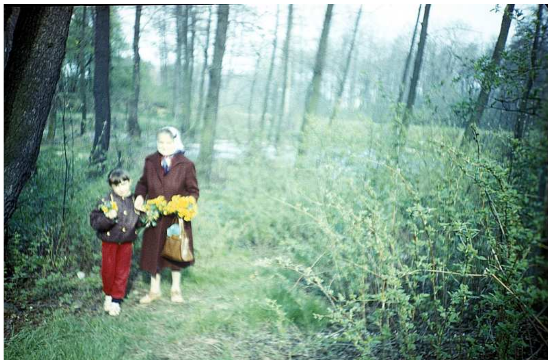
Fot. nr 129. Wiosna 1988.