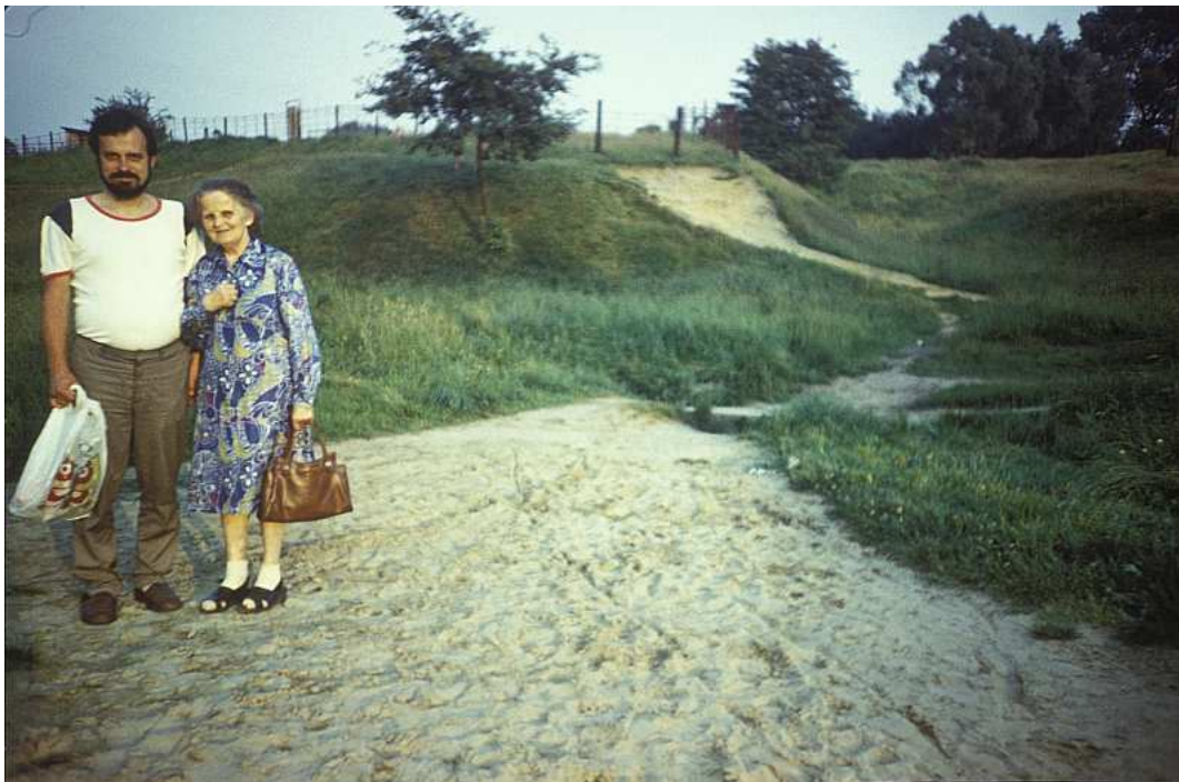
Fot. nr 155. Przy potoku Drwinka poniżej bloku z ulicy Spółdzielców 5. Lato 1988.