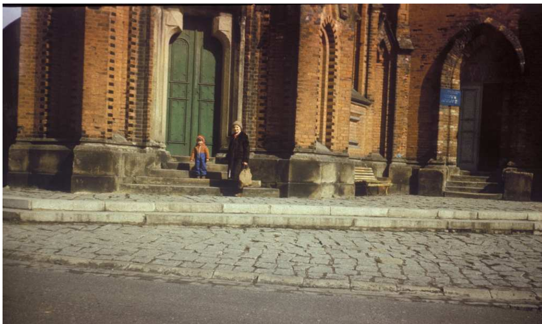
Fot. nr 38 (38-39). Pod kaplicą św. Bronisławy. Tu zima z początku 1983 roku.