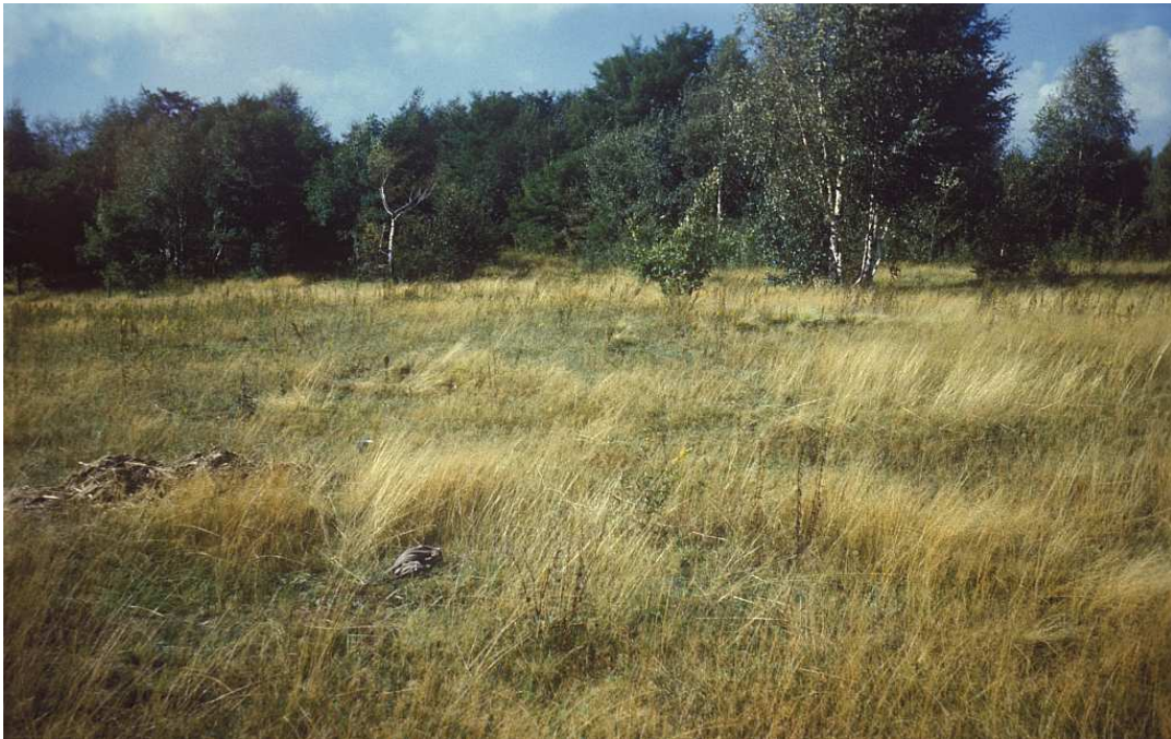
Fot. nr 178 (178-179). Rozległy jeszcze ugór na skraju lasu przy ulicy Jakubowskiego. Wrzesień 1983.