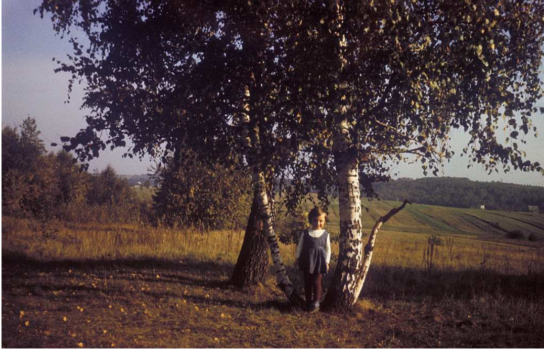
Fot. nr 175 (175-177). Pola uprawne Rżąki w bliskości wyciętego w styczniu 2013 roku lasu. Tu w tle las krzyszkowicki. Lato 1983.