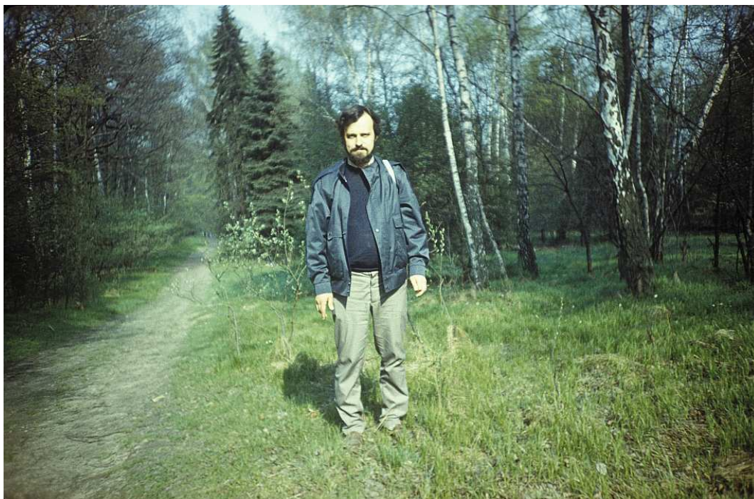
Fot. nr 72. Wiosna 1988.