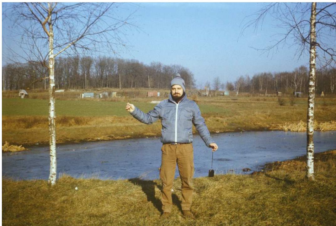
Fot. nr 171. Zima 1988/89.