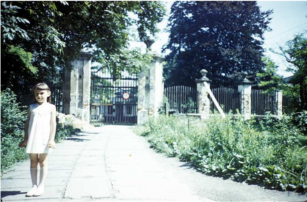
Fot. nr 205. Przed dworkiem białoprądnickim. Lato 1988.