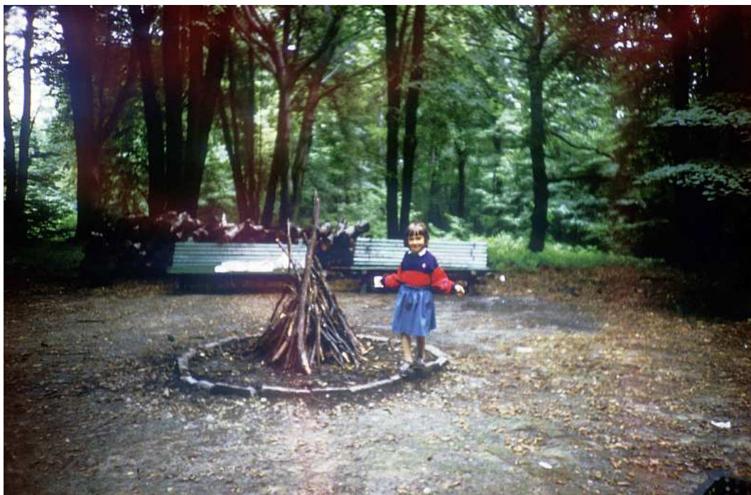
Fot. nr 64. Palenisko przy altanie na Polanie Wobra. Lato 1986.