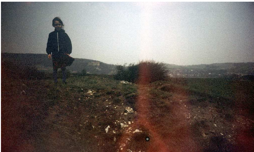
Fot. nr 96. Z widokiem w stronę Sikornika i Lasu Wolskiego. Wiosna 1987.