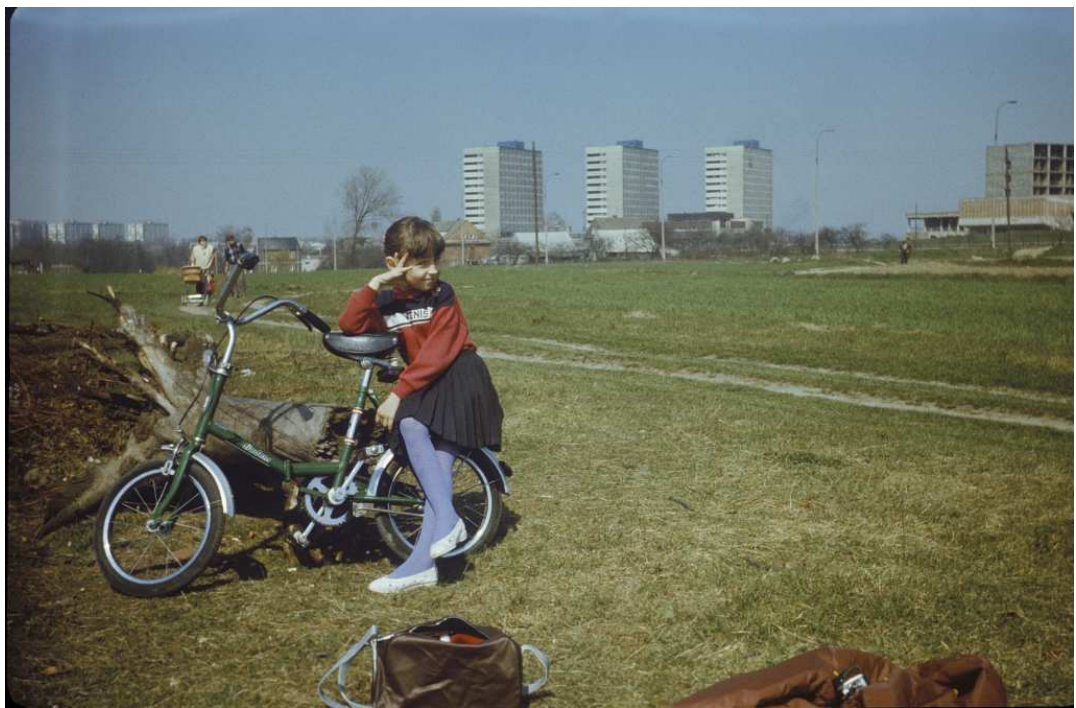
Fot. nr 164. Wiosna 1988.