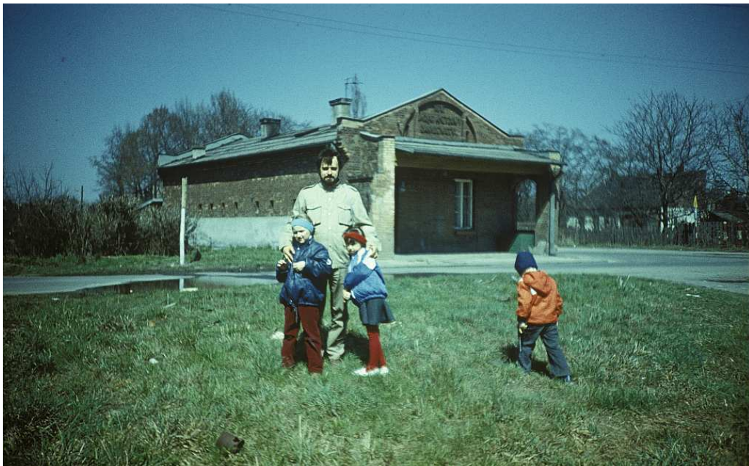
Fot. nr 82 (82-83). Przy rogatce przy ulicy Szwedzkiej. Wiosna 1988.