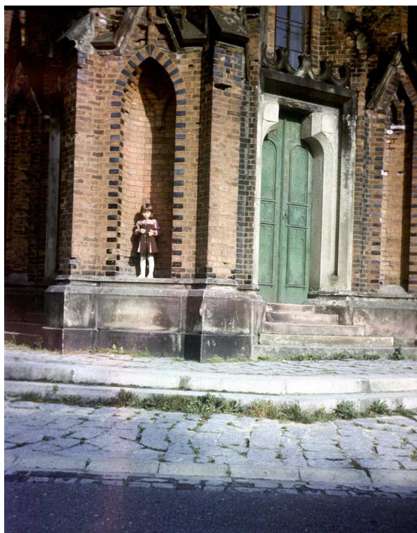
Fot. nr 39. Jesień 1986.