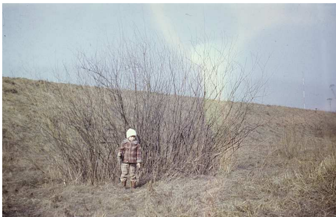
Fot. nr 91. W niecce kamieniołomu. Jesień 1986