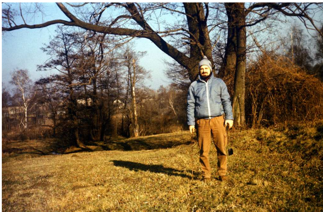
Fot. nr 133. Przy dróżce polnej za potokiem Kliniec, która wiodła na wzgórze do „akademików”. Zima 1988/89.