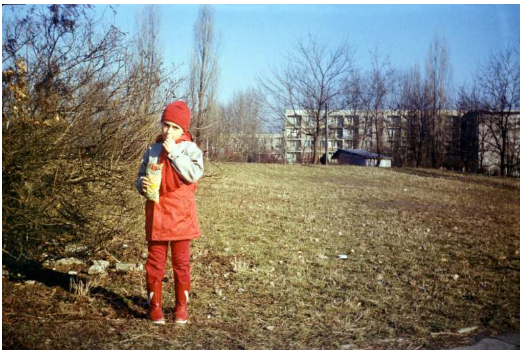
Fot. nr 125. Późna Jesień 1988.