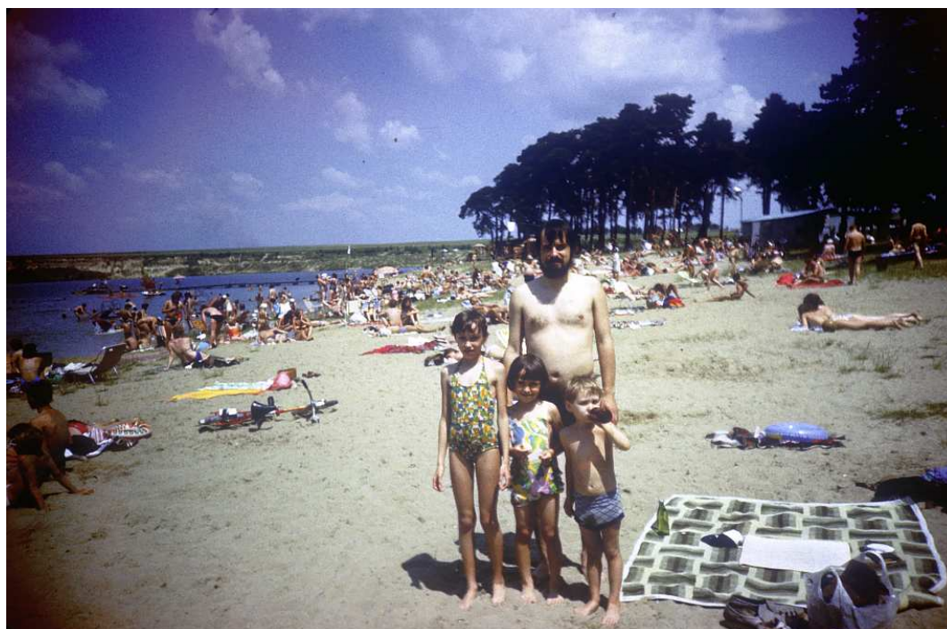
Fot. nr 202. Lato 1986.