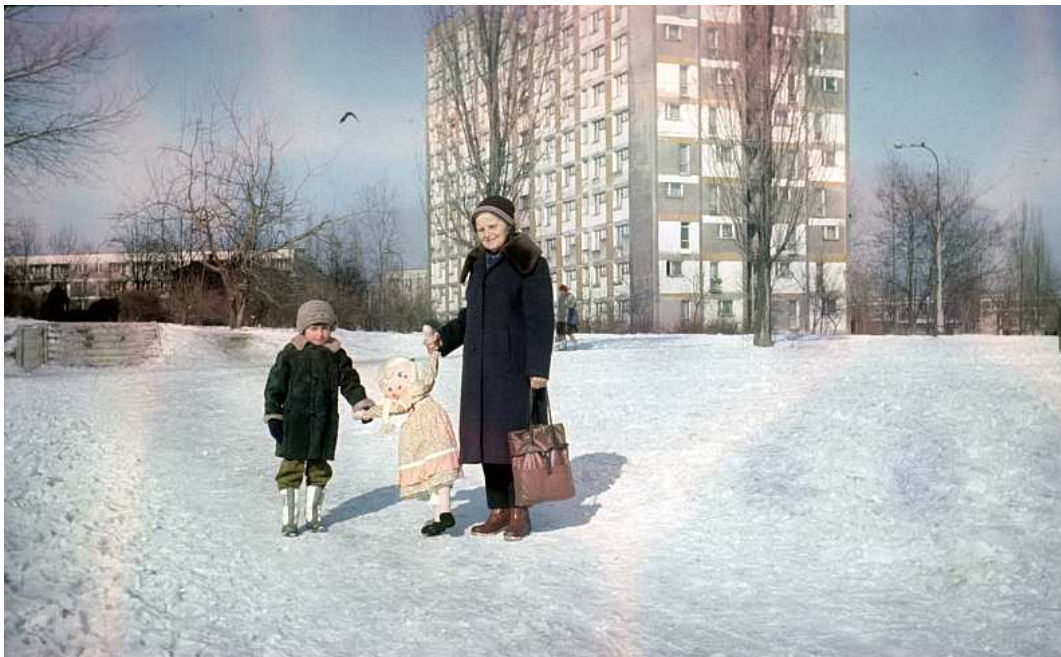
Fot. nr 118. Przy placu zabaw przed blokiem z ulicy Spółdzielców 11. Zima 1986/87.