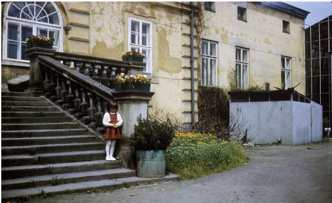
Fot. nr 19. Przed gmachem dawnego Obserwatorium Astronomicznego. Wiosna 1984.