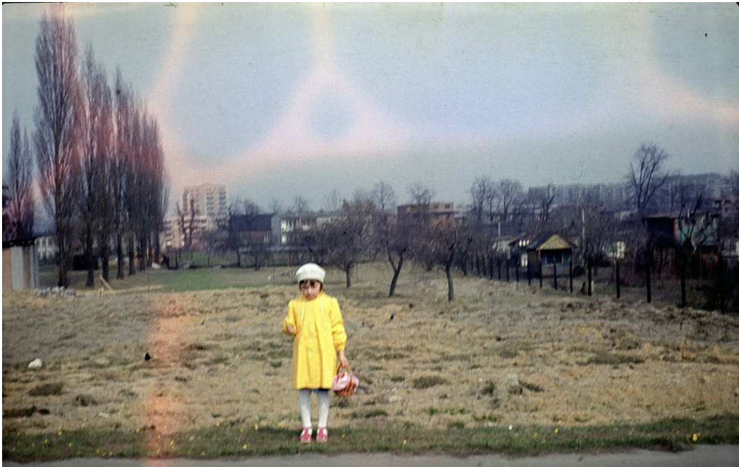
Fot. nr 146. Przy kościele parafialnym przy ulicy Prostej. W tle Aleja Dygasińskiego. Wiosna 1886