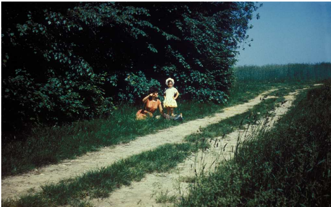
Fot. nr 218. Błoga cisza na krzyszkowickim wzniesieniu. Czerwiec 1983.