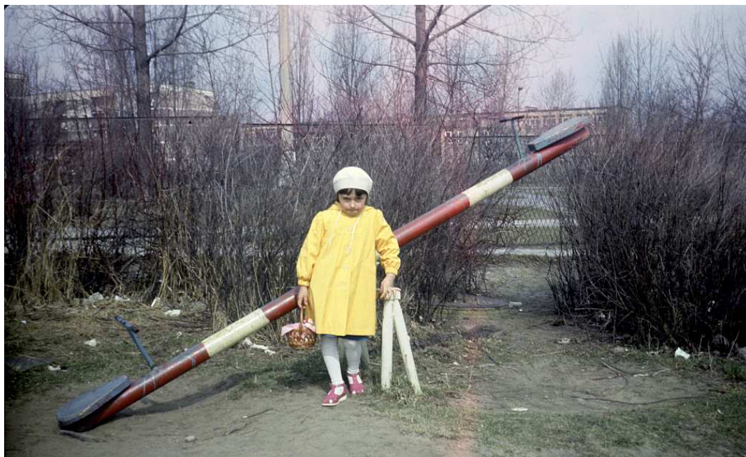
Fot. nr 120 (120-121). Na placu zabaw przy bloku z ulicy Spółdzielców 11. Tu Wiosna 1986