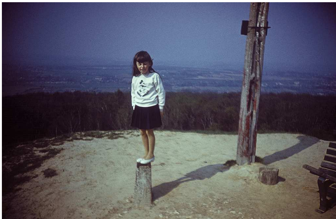
Fot. nr 78. Wiosna 1988.