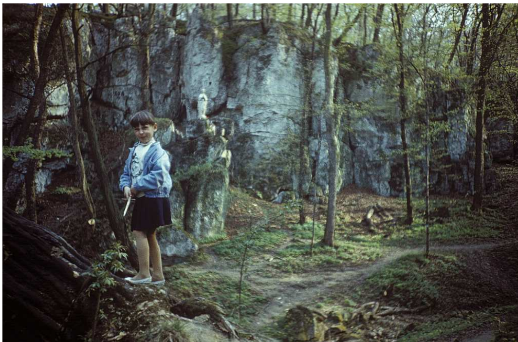
Fot. nr 56. Panieńskie Skały. Wiosna 1988.