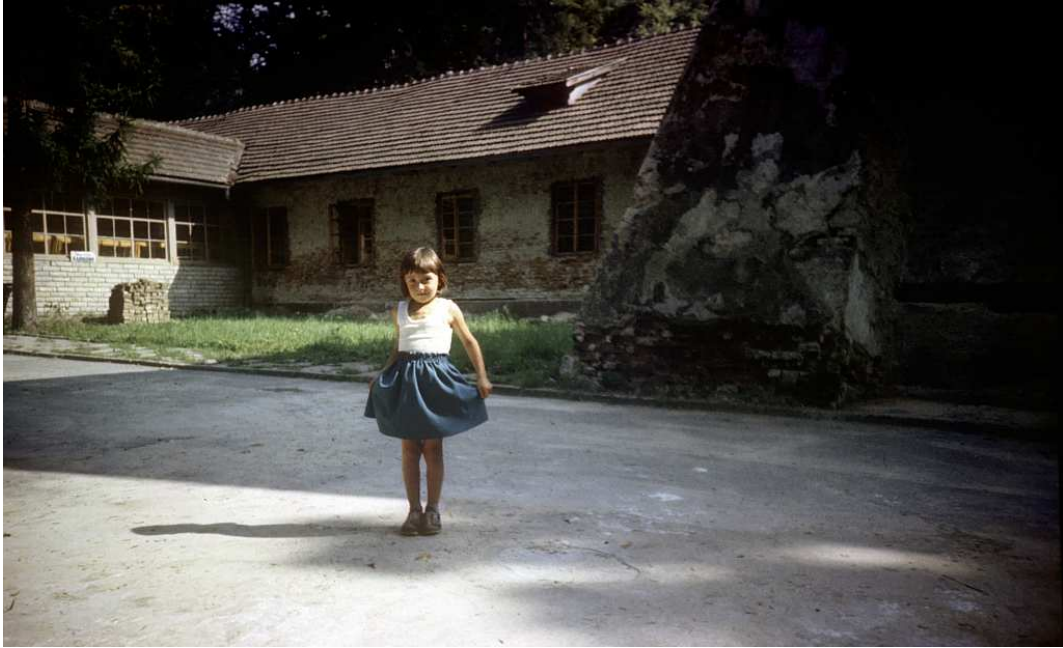
Fot. nr 197. Sierpień 1986.