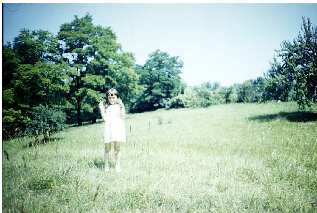
Fot. nr 201. Lato 1988.