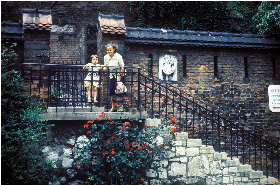
Fot. nr 5. Przed Muzeum Katedralnym. Lato 1983.