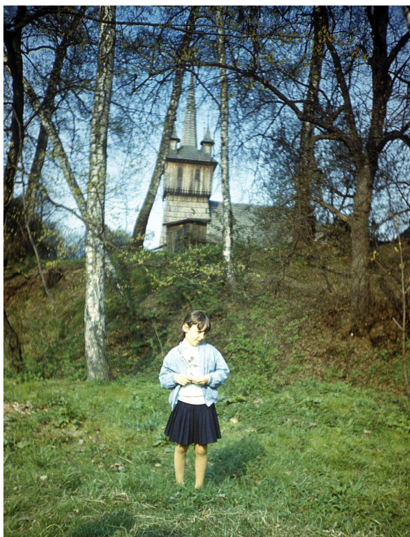
Fot. nr 51 (51-53). Fragmenty odbudowanego po pożarze kościółka w skansenie. Tu wiosna 1988.