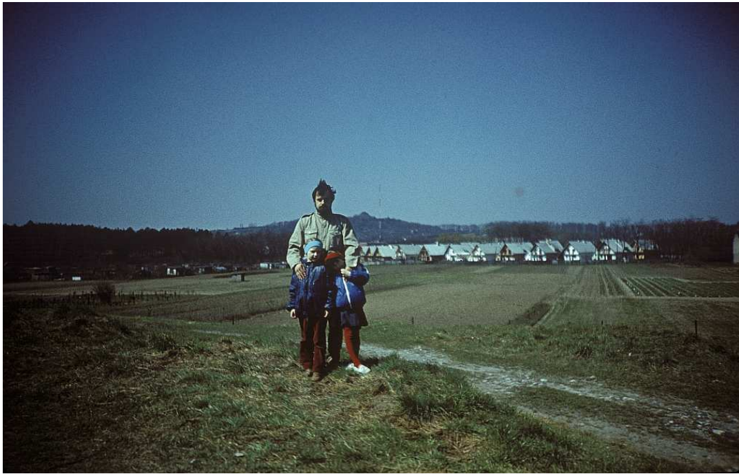
Fot. nr 92. Widok z ulicy Salezjańskiej w stronę Kopca Kościuszki. Wiosna 1988.