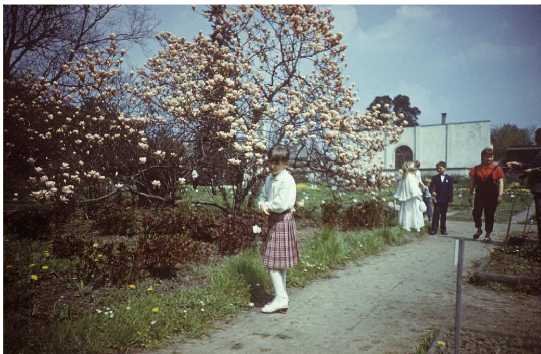
Fot. nr 22. Wiosna 1988.