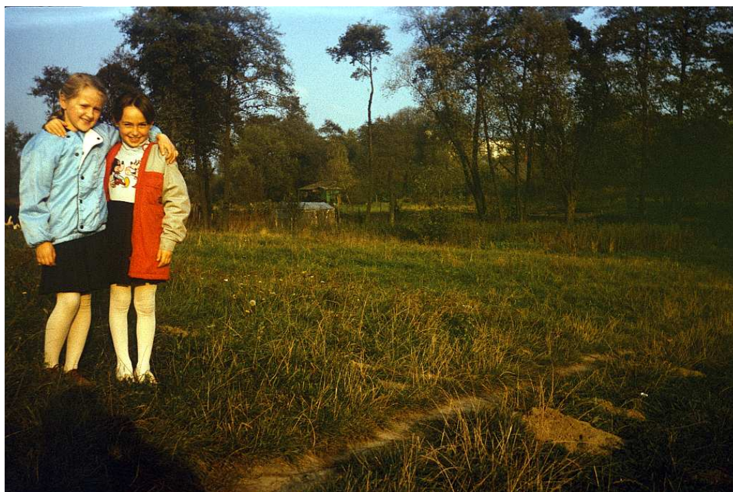
Fot. nr 131. Z ogródkiem działkowym w tle. Jesień 1988.