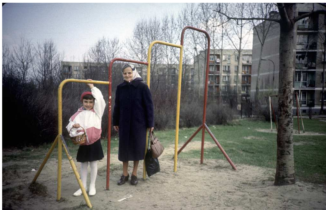
Fot. nr 121. Wiosna 1987