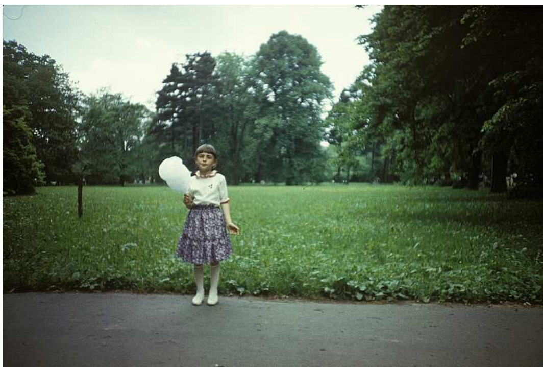
Fot. nr 149. Pełnia lata roku 1988 w Parku Jerzmanowskich.