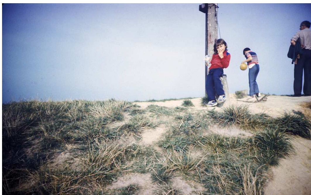
Fot. nr 77. Lato 1986.