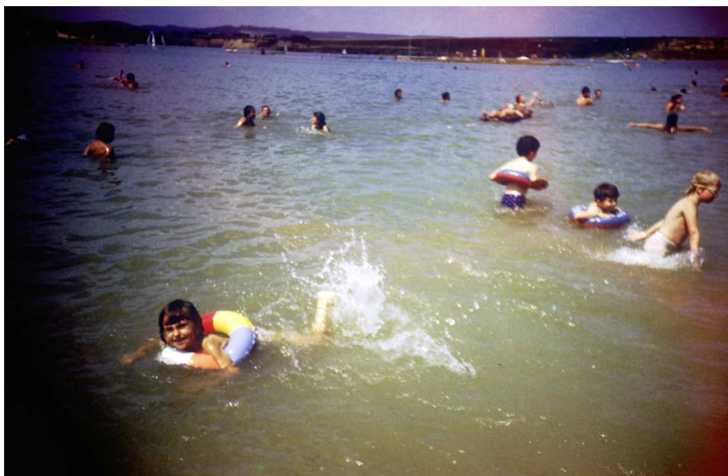
Fot. nr 204. Lato 1986.