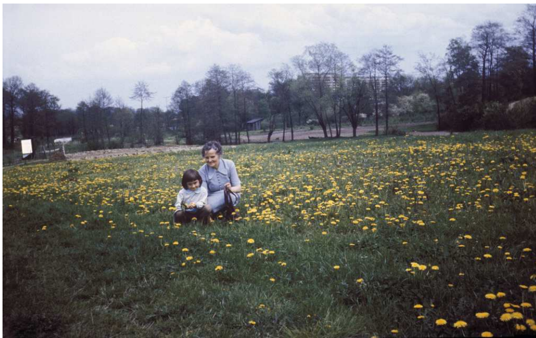
Fot. nr 130 (130-131). Rozległa łąka pomiędzy ulicą Podlesie, a „akademikami”. Tu wiosna 1984