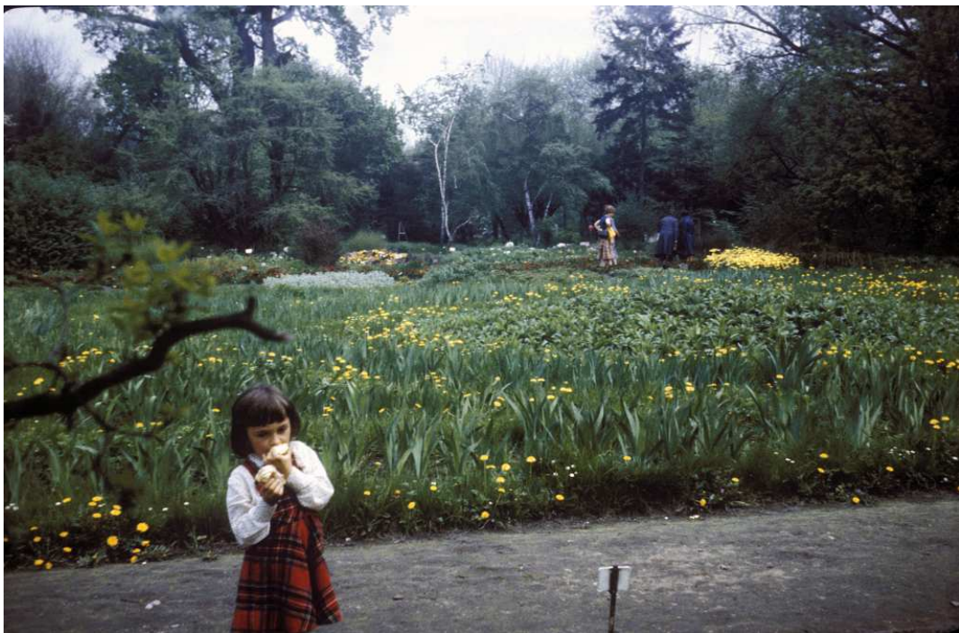
Fot. nr 20 (20-32). Migawki z terenu Ogródu. Tu wiosna 1984.