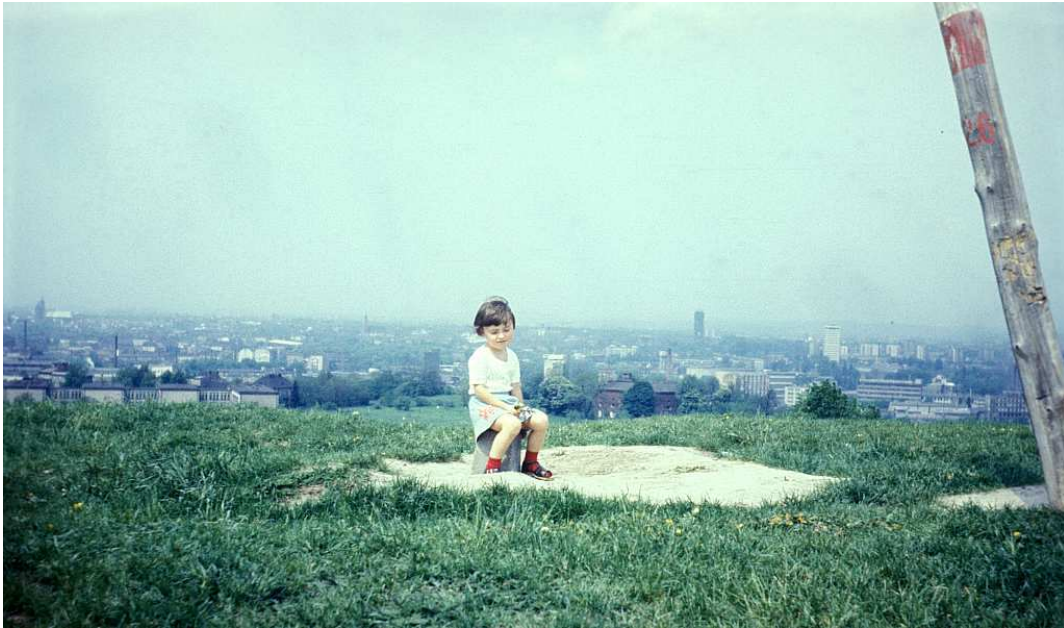
Fot. nr 99 (99-105). Panoramy ze szczytu Kopca. Fot. nr: 99-102 – w stronę Podgórza, Kazimierza i Zabytkowego Śródmieścia. Tu Lato 1983.