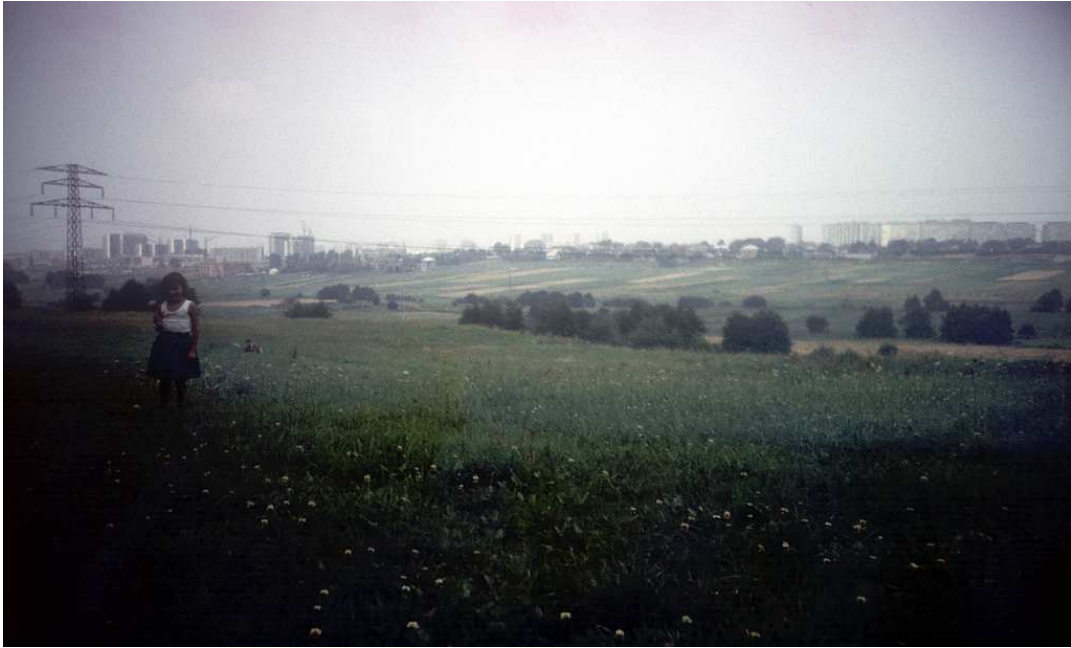
Fot. nr 190. Rozległe łąki Rajska i Piasków Wielkich, a w tle bloki osiedla Kurdwanów. Widok od strony wyboistej wówczas uliczki Do Luboni. Lato. 1986