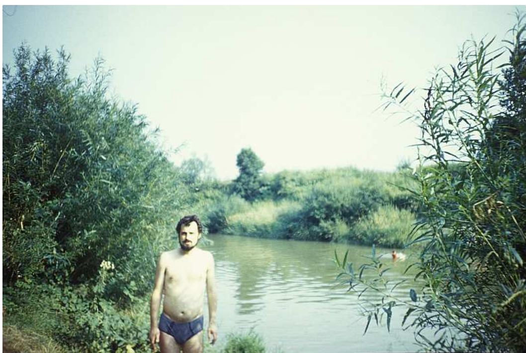
Fot. nr 222. Nad Rabaą. Lato 1988.