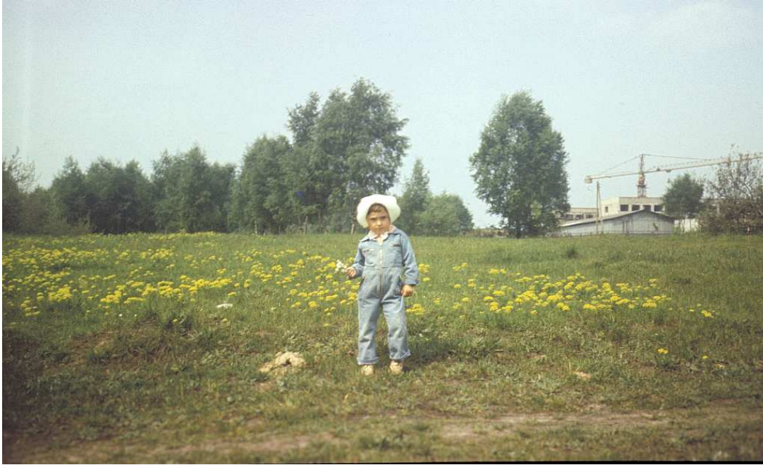
Fot. nr 185. Widok na rozbudowujący się szpital AM w Prokocimiu z wysokości Domu Pogodnej Jesieni. Wiosna 1983