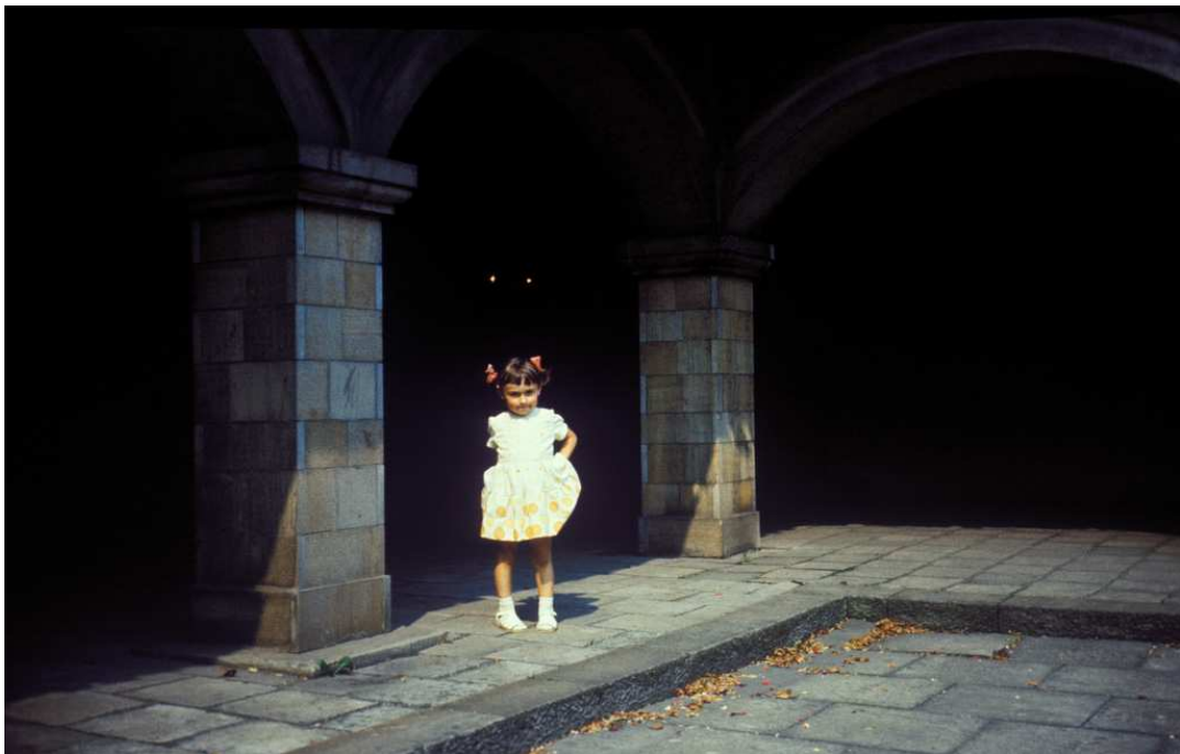
Fot. nr 216. Na krużgankach dziedzińca przed kościołem Cystersów w Mogile. Lato 1983.