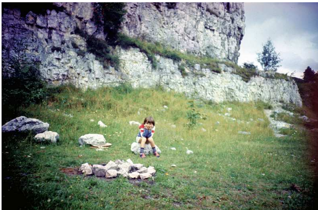
Fot. nr 85 (85-88). Niecka dawnego kamieniołomu. Tu Lato 1986.