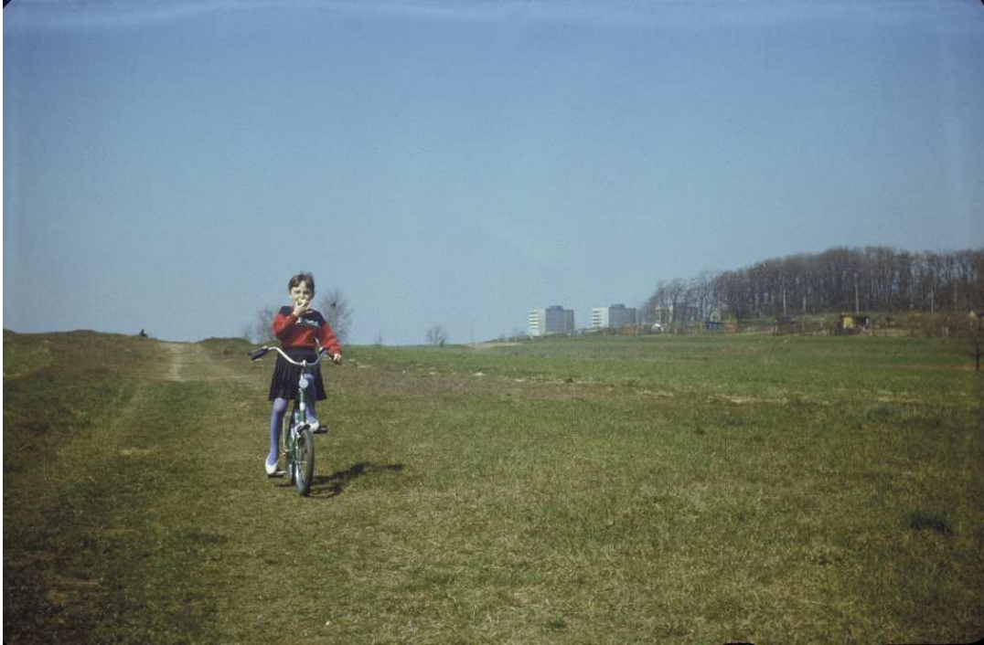
Fot. nr 63. Wiosna 1988.