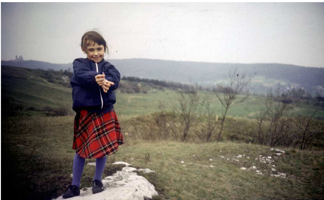
Fot. nr 97. Niczym niezarośnięta niecka poniżej fortu w Bodzowie. Wiosna 1987.