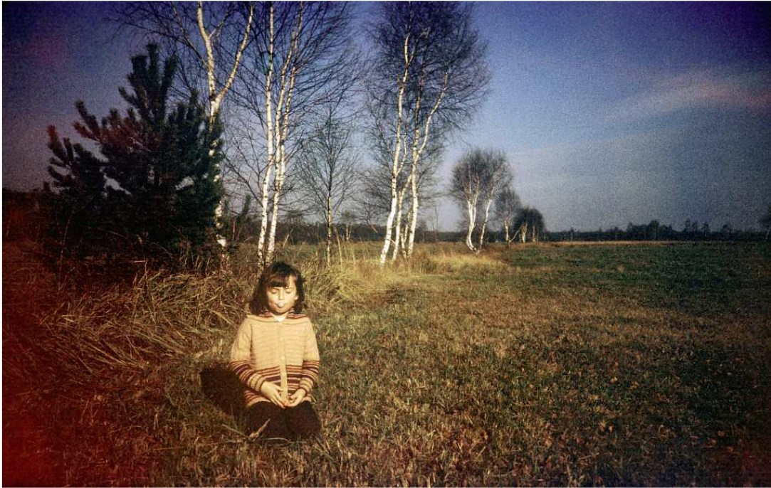
Fot. nr 220 (220-221). Rozległa łąka Szarowa. Widok od strony kolei. Jesień 1986