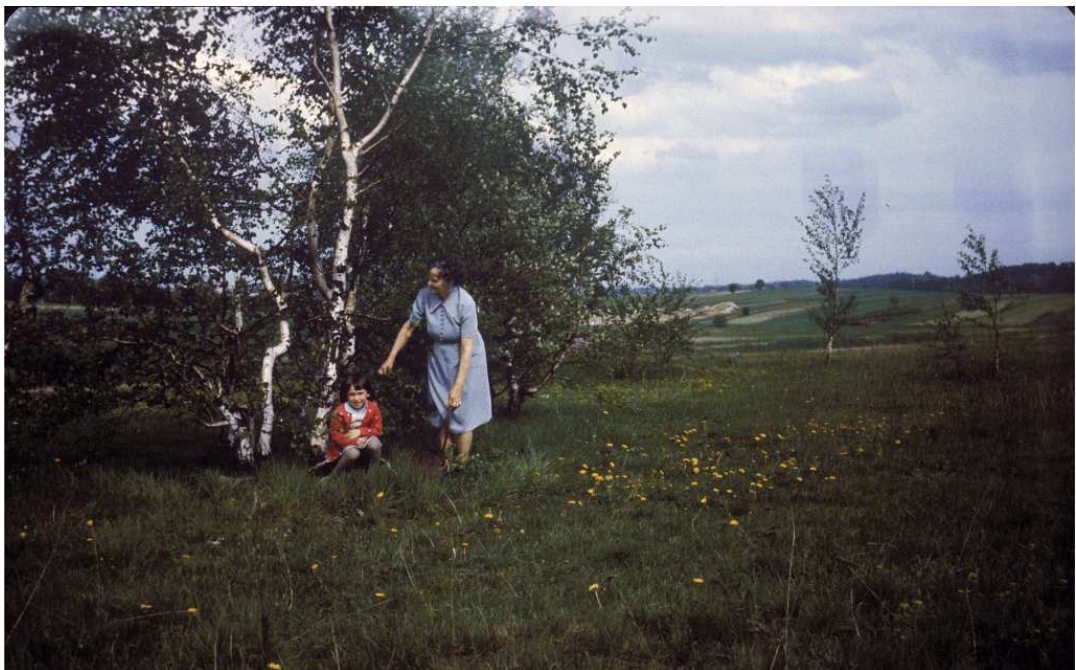
Fot. nr 176. Z laskiem kosocickim (z prawej) w tle. Lato 1984.