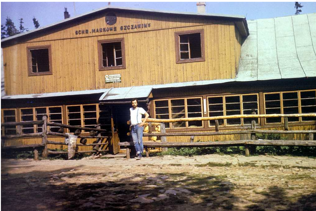
Fot. nr 1. Przy schronisku na Markowych Szczawinach. Wiosna 2003.

Powróćmy jednak do albumu. Rozdział I (fot. nr: 2-216) to liczne migawki z terenu Krakowa, zarówno jego centrum, jak i obrzeży, które na przestrzeni ostatnich trzech dekad zmieniły się szczególnie drastycznie. Rozdział ten zawiera kolejno zdjęcia z: Wawelu i jego sąsiedztwa (I.A), zabytkowego Śródmieścia (I.B), Kazimierza (I.C), Ogrodu Botanicznego Wesołej – I.D, Parku Jordana (I.E), Kopca Kościuszki (I.F), Salwatora, powszechnie dziś tak nazywanej, skrajnej części dawnego Zwierzyńca (I.G), Woli Justowskiej i Lasu Wolskiego (I.H), Dębnik (I.I), Zakrzówka (I.J), Bodzowa (I.K), Podgórze (Kopca Krakusa, spod fortu św. Benedykta i Lasu Bonarka) – I.L, Prokocimia (osiedla Na Kozłowie, doliny Drwinki, Parku Jerzmanowskich i okolic „akademików AM” na wzgórzu Baranówka)– I.Ł, Piasków Wielkich (I-M), Rżąki, szczególnie bogato udokumentowanej z racji moich częstych tu wypadów spacerowych (I.N), Kosocic (I.O), Rajska (I.P), Swoszowic (I.R), Tyńca (I.S), Kryspinowa (I.T), Białego Prądnika (I.U), Bronowic Małych i Mydlnik (I.W) oraz Mogiły (Kopca Wandy i klasztoru Cystersów) – I.Z.