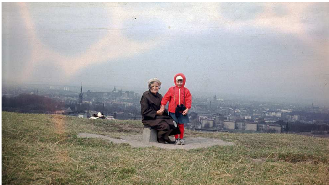
Fot. nr 101. Wczesna wiosna 1987.