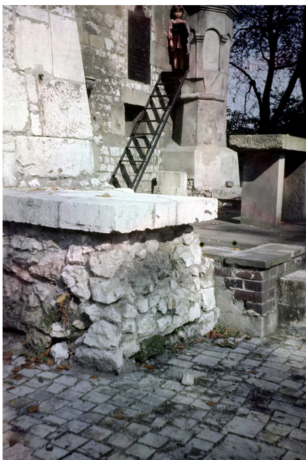
Fot. nr 47. Jesień 1986.