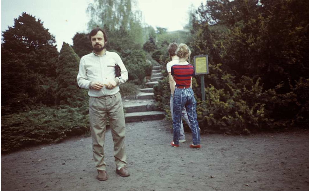
Fot. nr 31. Wczesna wiosna 1988.