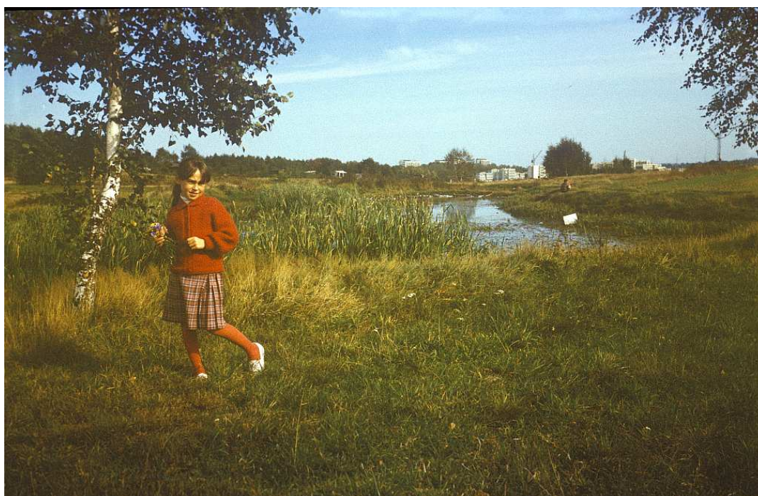
Fot. nr 168. Jesień 1988.