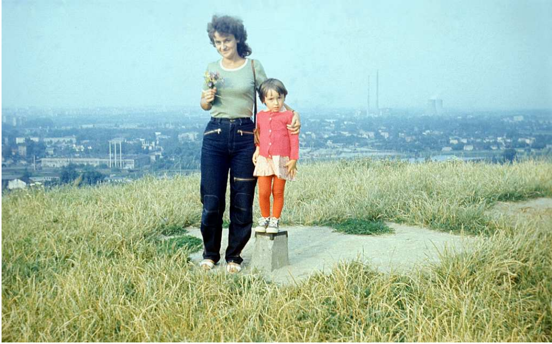
Fot. nr 103 (103-105). Widoki w stronę Łęgu i Huty im. Lenina. Tu Jesień 1983.