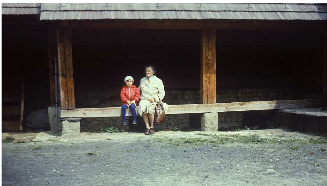
Fot. nr 53. Pod arkadami. Wiosna 1984.