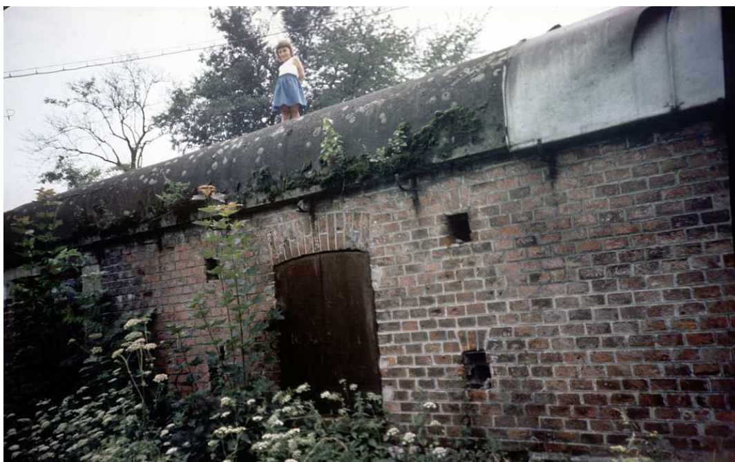
Fot. nr 158. Schron amunicyjny przy ulicy Niebieskiej. Lato 1986.