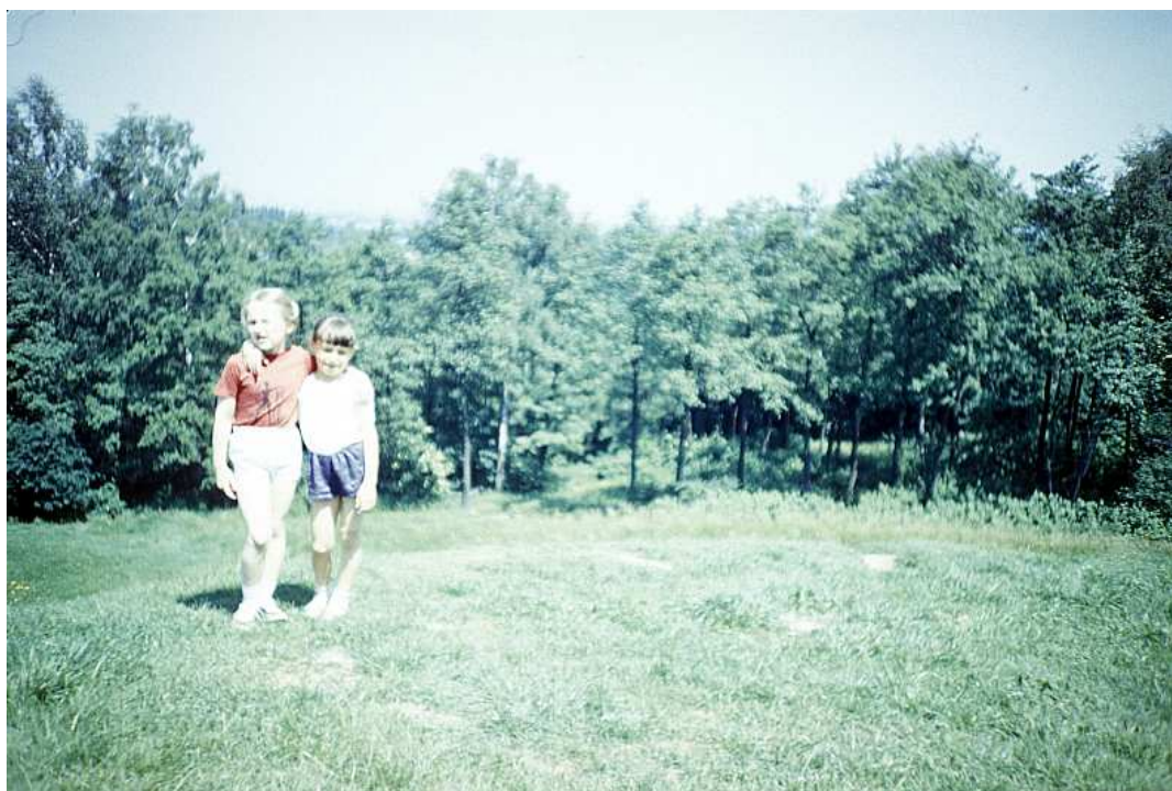
Fot. nr 142. Lato 1988.