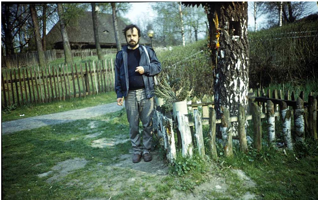
Fot. nr 50. Wiosna 1988