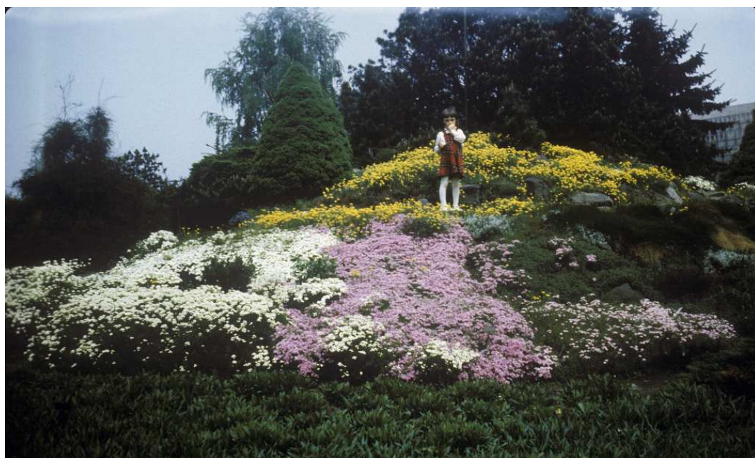
Fot. nr 30. .Wiosna 1984