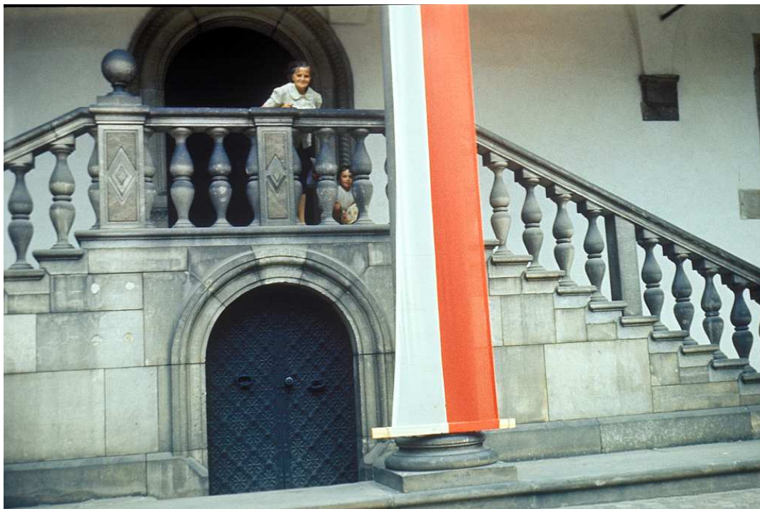
Fot. nr 2 (2-4). Na dziedzińcu zamku królewskiego na Wawelu. Lato 1983.