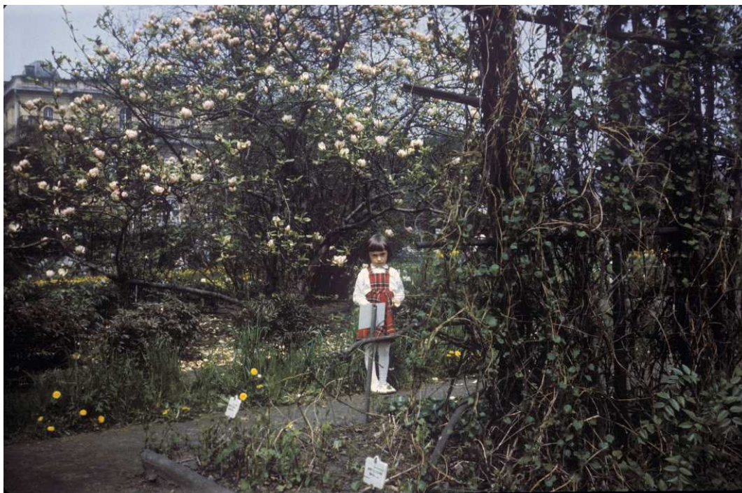
Fot. nr 21. Wiosna 1984.