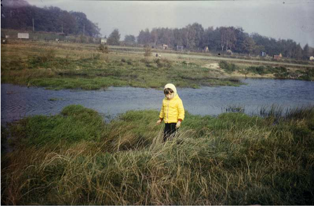
Fot. nr 165 (165-171). Ujęcia spod większego rżących stawów w stronę ulicy Kostaneckiego, Jakubowskiego i osiedla Rżaka (w budowie), gdzie rozlokowane były ogródki działkowe. Tu Zima 1986/87.