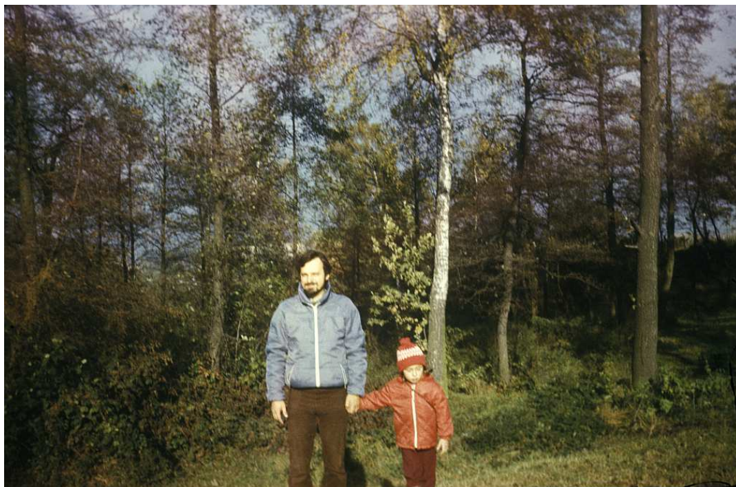
Fot. nr 134 (134-136). Na łące pod „akademikami”, gdzie na krowim nawozie ochoczo rosty białe pieczarki. Tu jesień 1986.