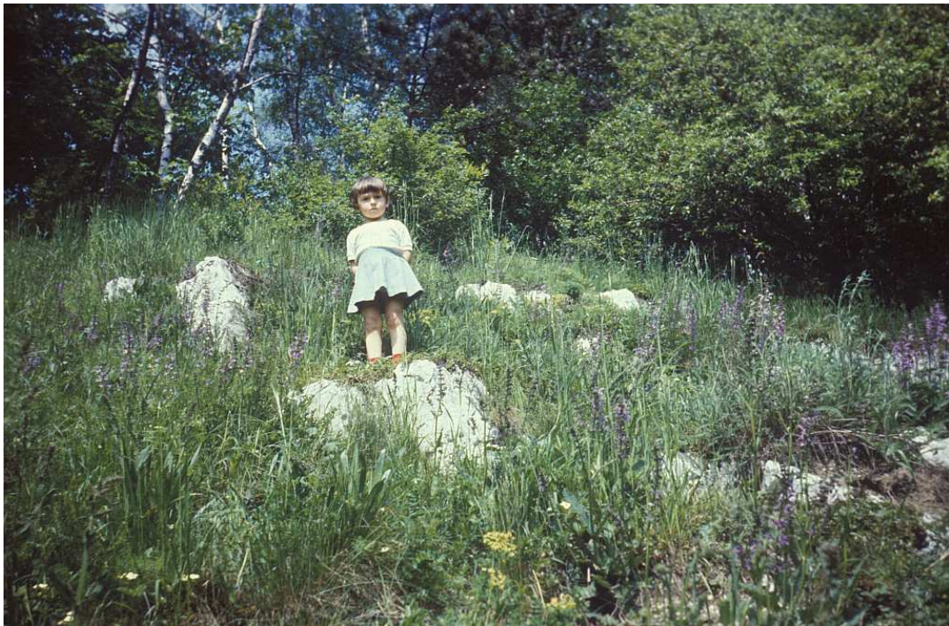
Fot. nr 112. Na zboczu Lasu Bonarka od strony ulicy Kamieńskiego. Tu lato 1983.