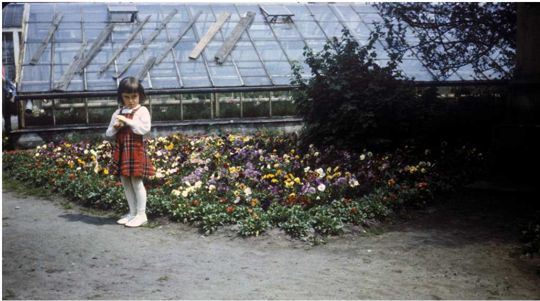
Fot. nr 32. Wiosna 1984.