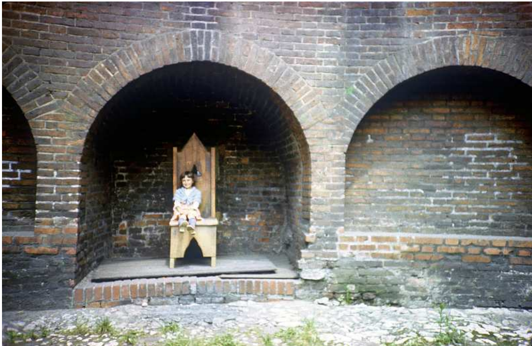
Fot. nr 13. Lato 1986.