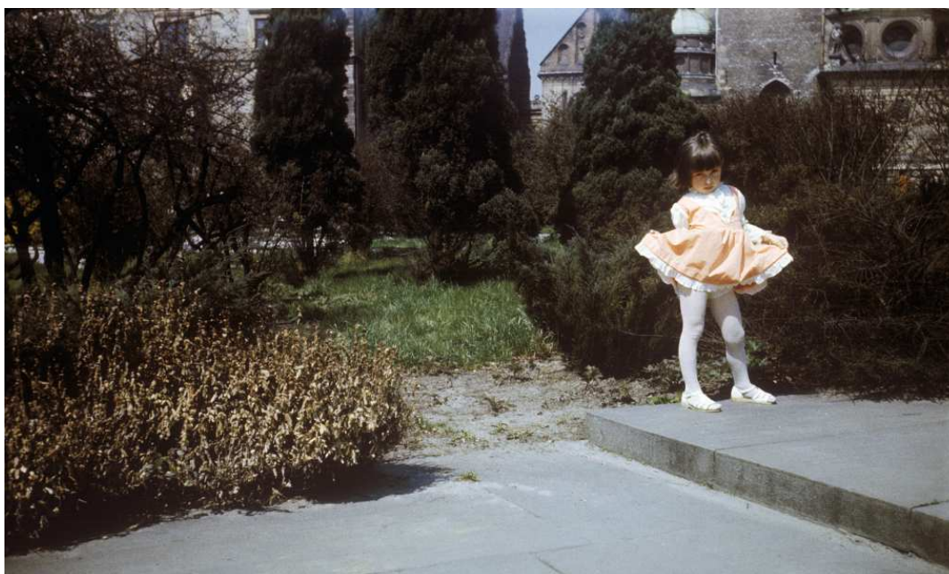
Fot. nr 7. Wiosna 1984.