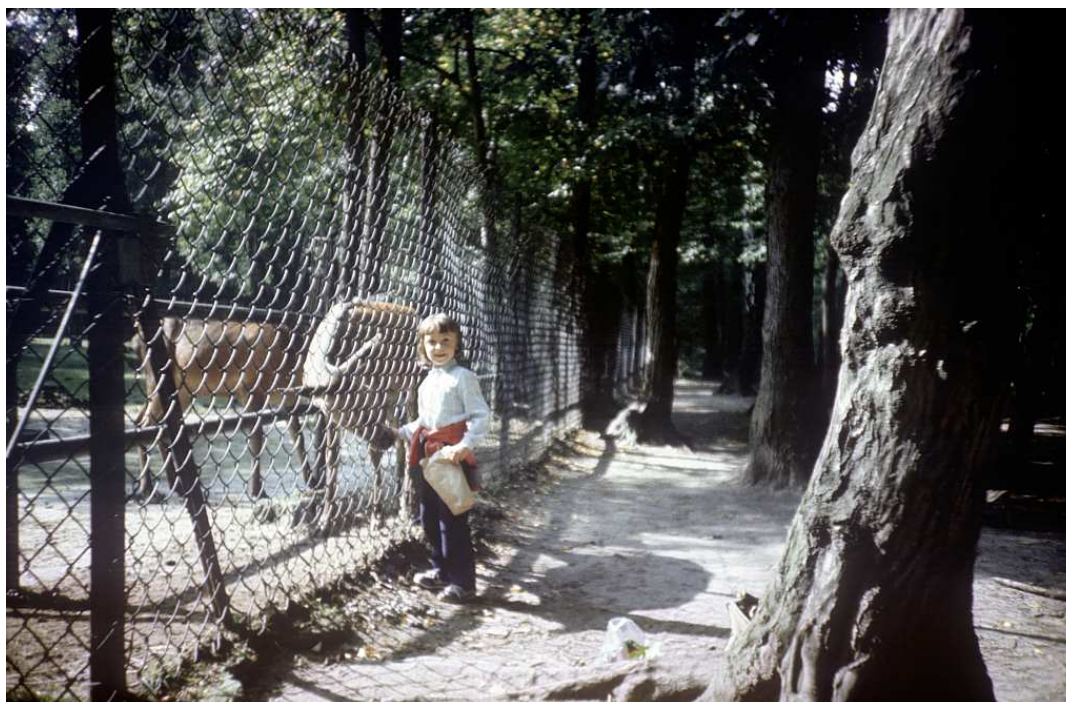
Fot. nr 67. Wrzesień 1986.