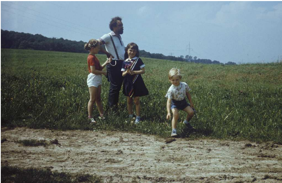
Fot. nr 191. Pola uprawne na przedpolu Rajska – widok z „ulicy” Do Luboni. W tle lasek na zboczu Rajska. Lato 1988