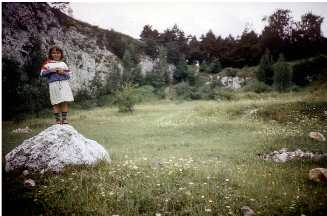
Fot. nr 88. 1986