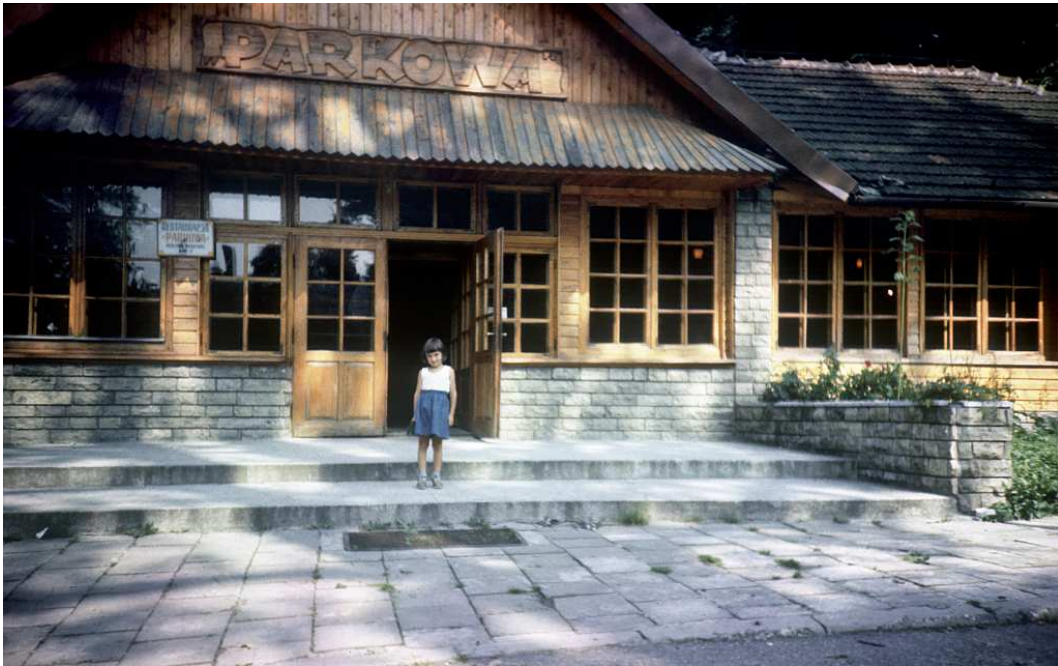
Fot. nr 195 (195-197). Przed swoszowickimi łazienkami. Sierpień 1986