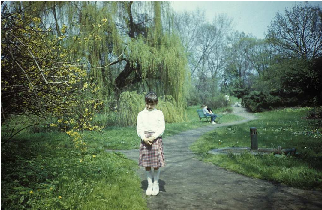
Fot. nr 24. Wczesna wiosna 1988.