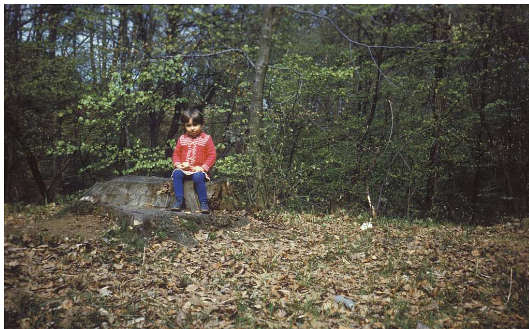
Fot. nr 61. Na polanie w sąsiedztwie Panieńskich Skał.. Wiosna 1984.