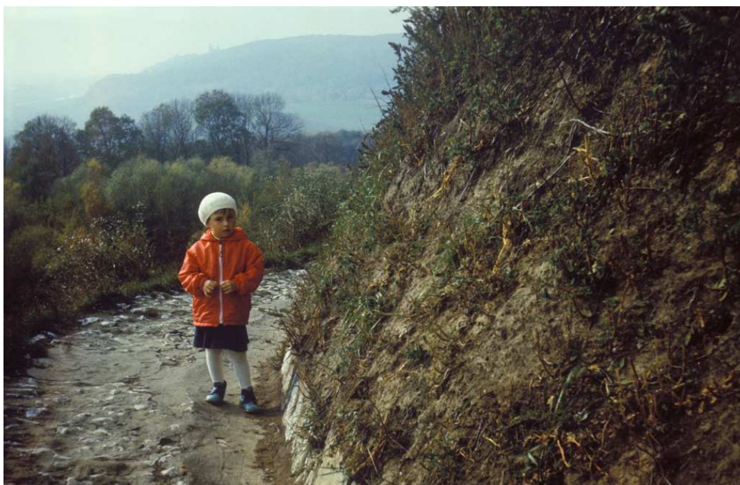
Fot. nr 41. Jesień 1983.