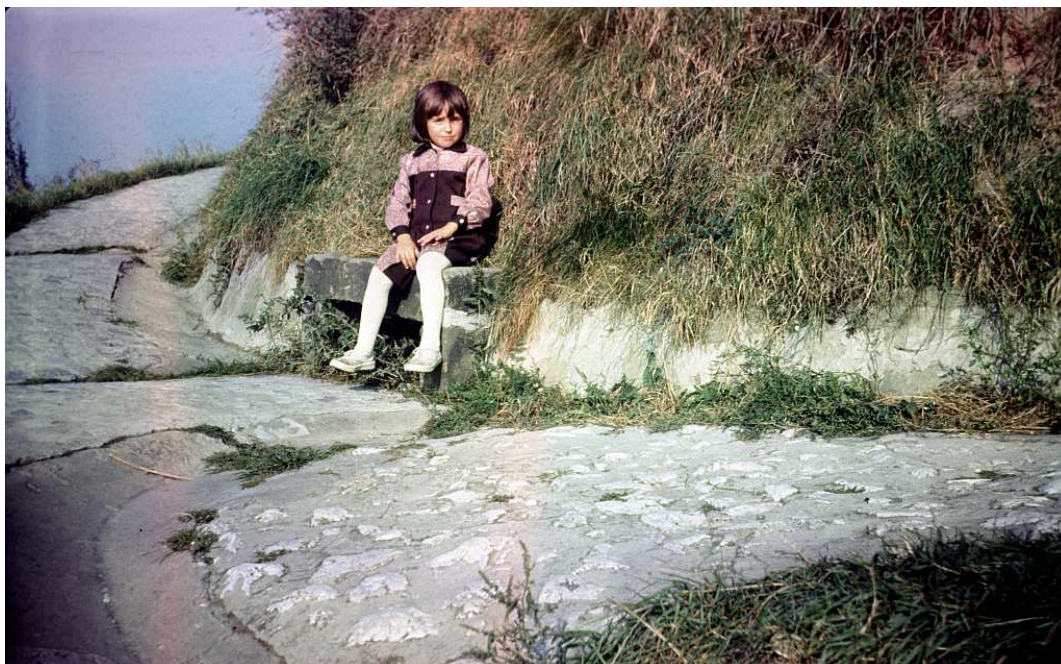
Fot. nr 42. Jesień 1986.