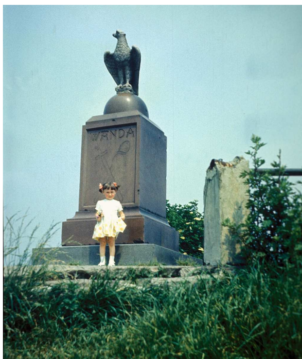
Fot. nr 211 (211-214). Na szczycie Kopca Wandy. Lato 1983.