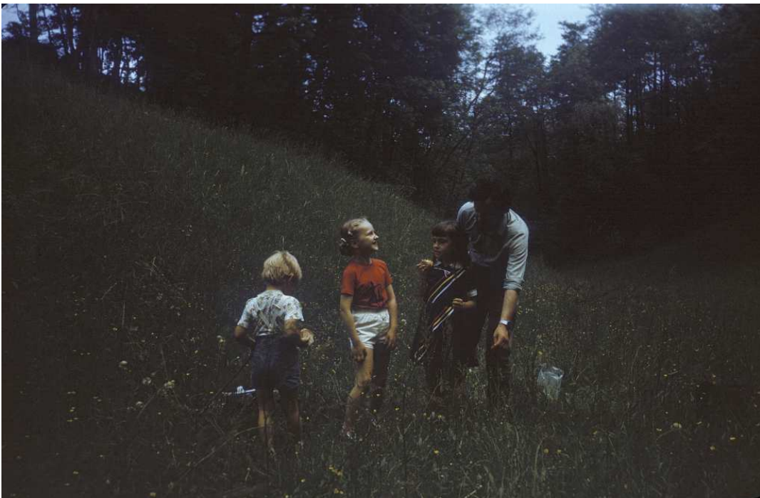
Fot. nr 188. Lato 1988