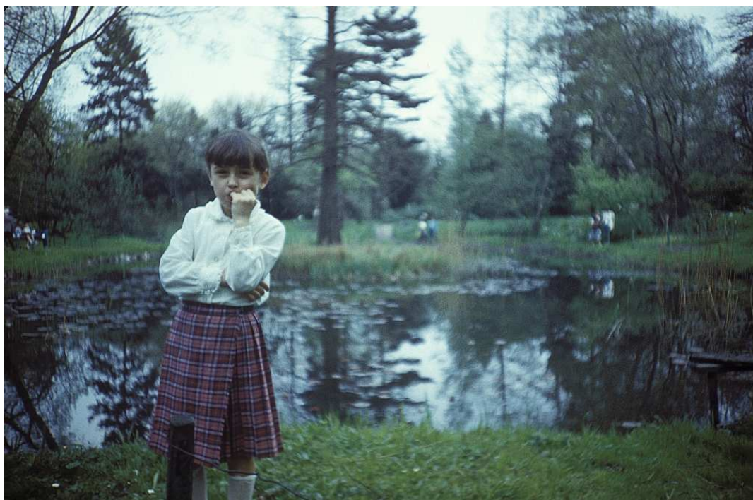
Fot. nr 26. wczesna Wiosna 1988.