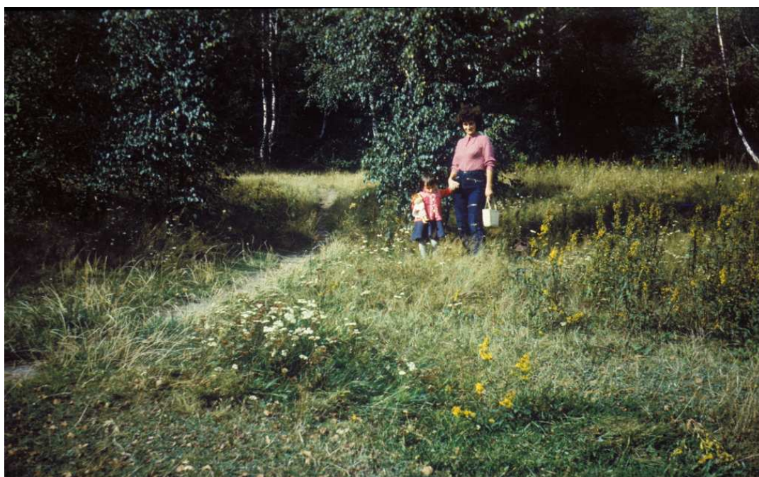
Fot. nr 180. Przy lasku w sąsiedztwie ulic: Kostaneckiego i Jakubowskiego i dróżce polnej, która następnie wiodła przez pola w stronę ulicy Kosocickiej. Wrzesień 1983.