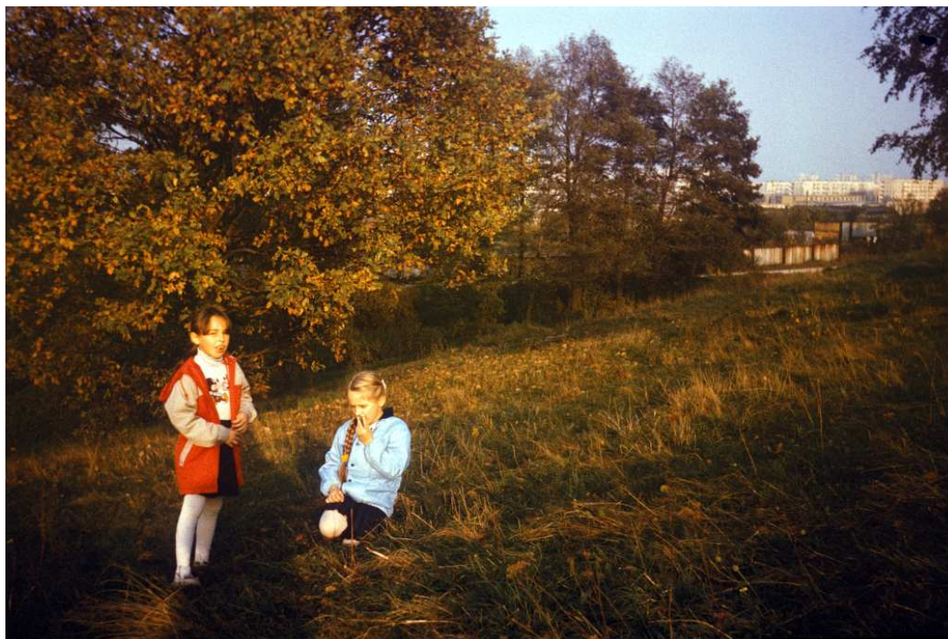
Fot. nr 137. Jesień 1988.