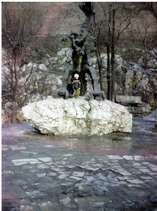
Fot. nr 11. Zima 1986/87