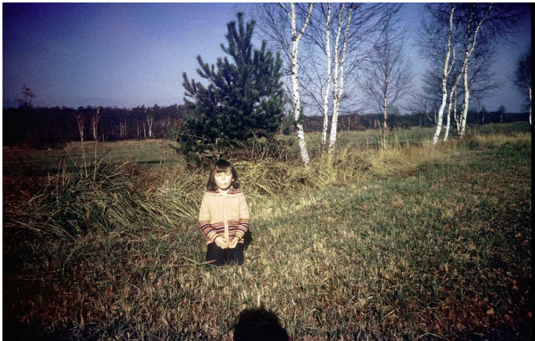
Fot. nr 221. Jesień 1986