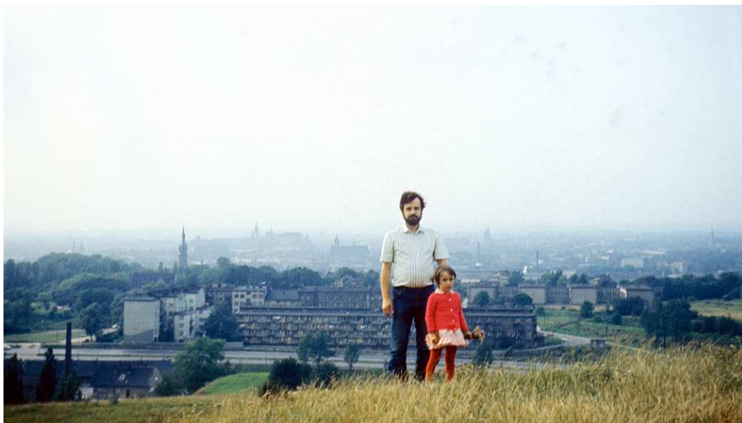
Fot. nr 100. Jesień 1983.