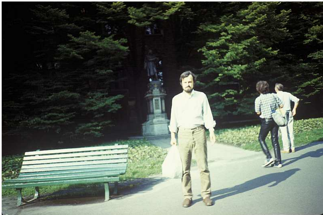
Fot. nr 15. Przed Collegium Novum i pomnikiem Kopernika. Lato 1988.