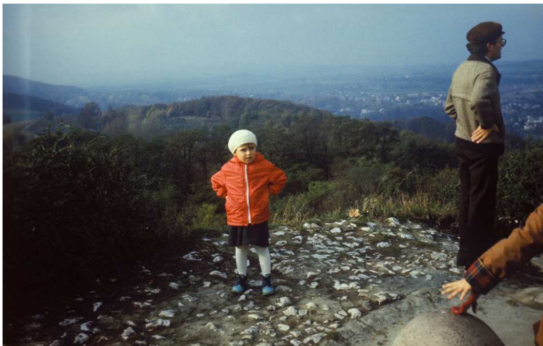
Fot. nr 40 (40-42). Na zboczu Kopca. Tu z widokiem w kierunku Lasu Wolskiego. Jesień 1983.