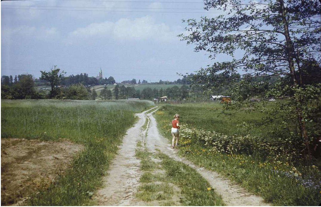
Fot. nr 192. „Ulica” Do Luboni. Widok w stronę Piasków Wielkich. Lato 1988.