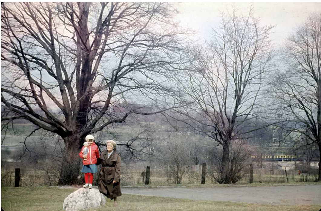
Fot. nr 106. Na parkingu u podnóża Kopca. Jesień 1986.