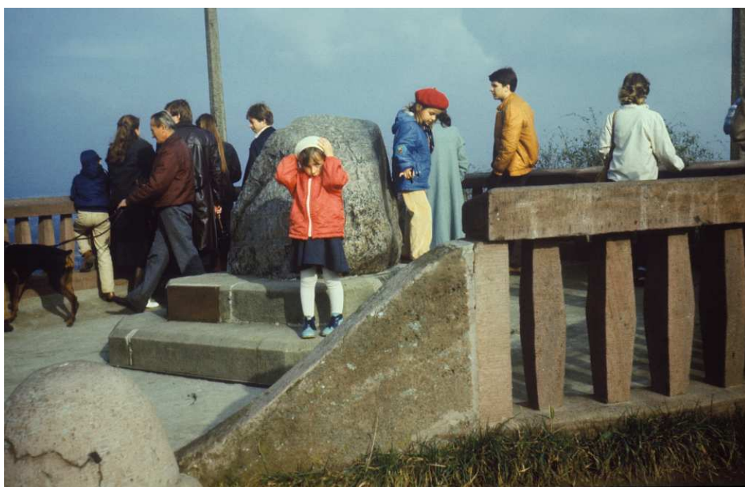
Fot. nr 35. Jesień 1983.