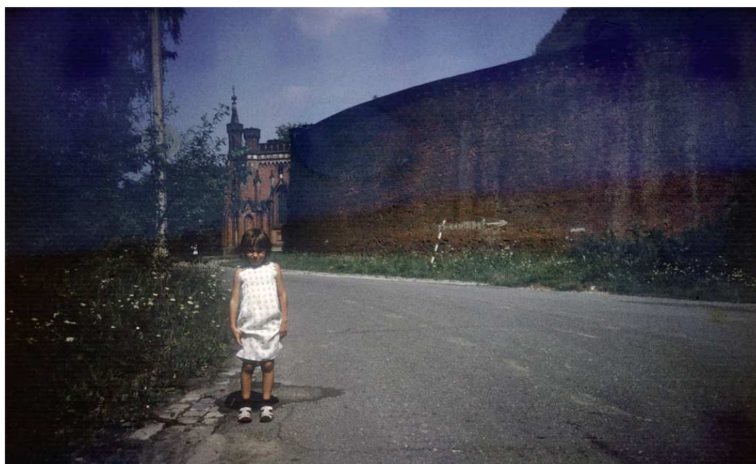
Fot. nr 43. Z kaplicą św. Bronisławy w tle. Lato 1986.