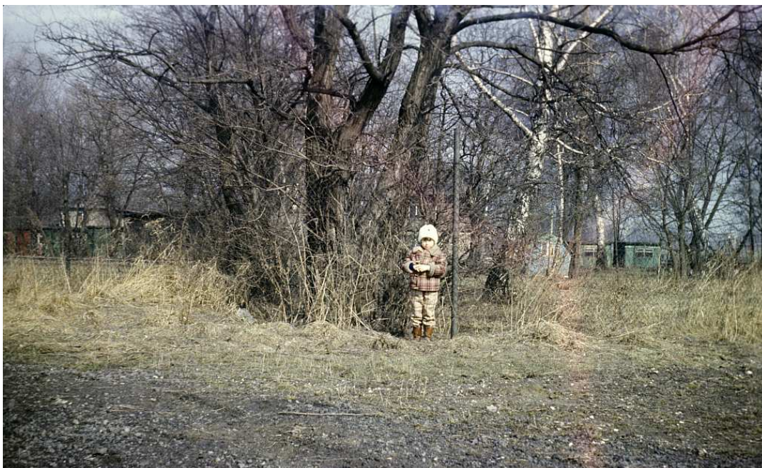
Fot. nr 90. Przy ogródkach działkowych z ulicy Salezjańskiej. Jesień 1986.