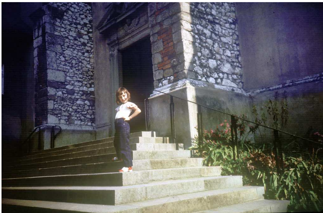
Fot. nr 200. Na schodach tynieckiego kościoła. Lato 1986.