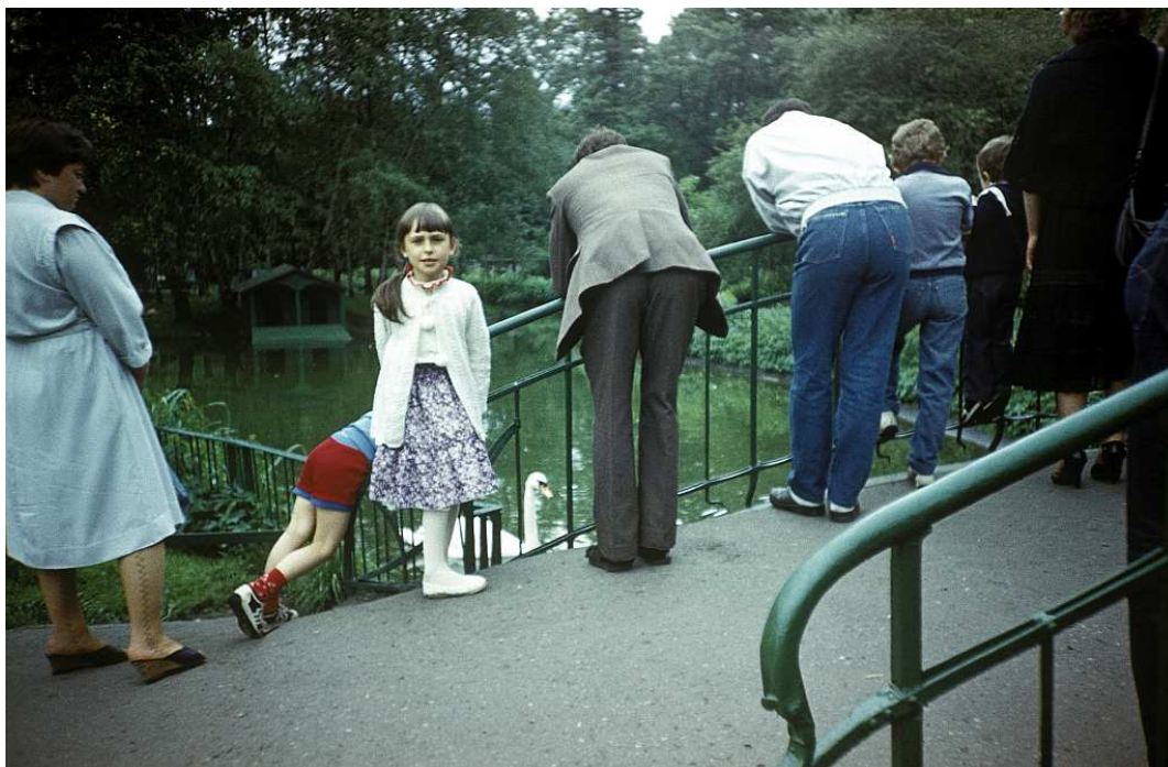
Fot. nr 16. Na mostku na sadzawce pod siedzibą LOT na Plantach. Lato 1988.