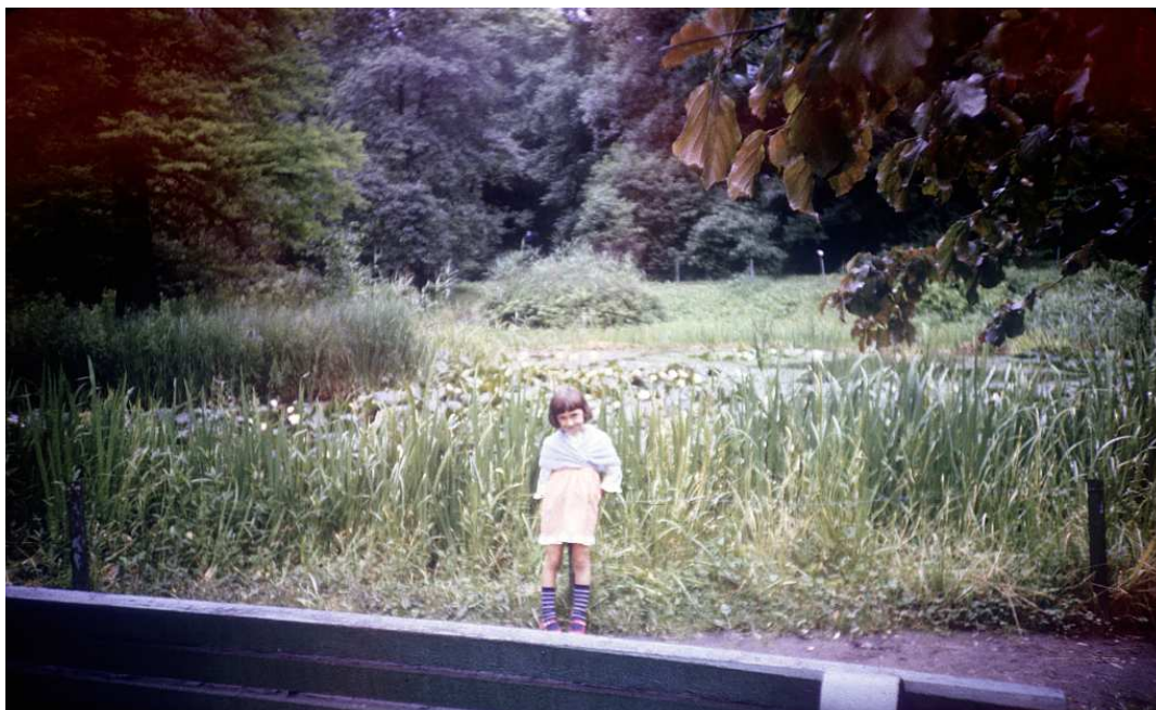
Fot. nr 25. Lato 1986.