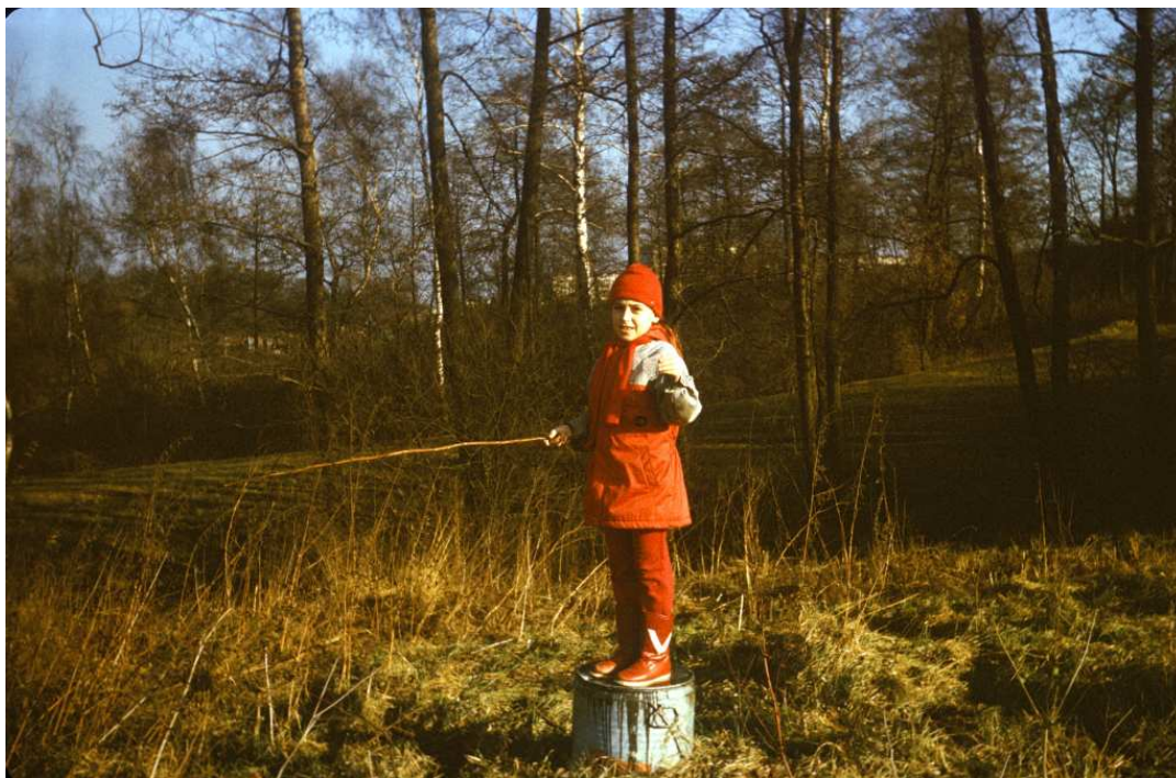
Fot. nr 132. Zarośla przy zagrodzie pod „akademikami”. Tu Zima 1988/89.