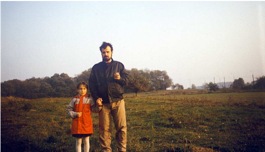
Fot. nr 151. Widok z ulicy Obronnej w stronę fortu nr 50 – Prokocim. Jesień 1988.