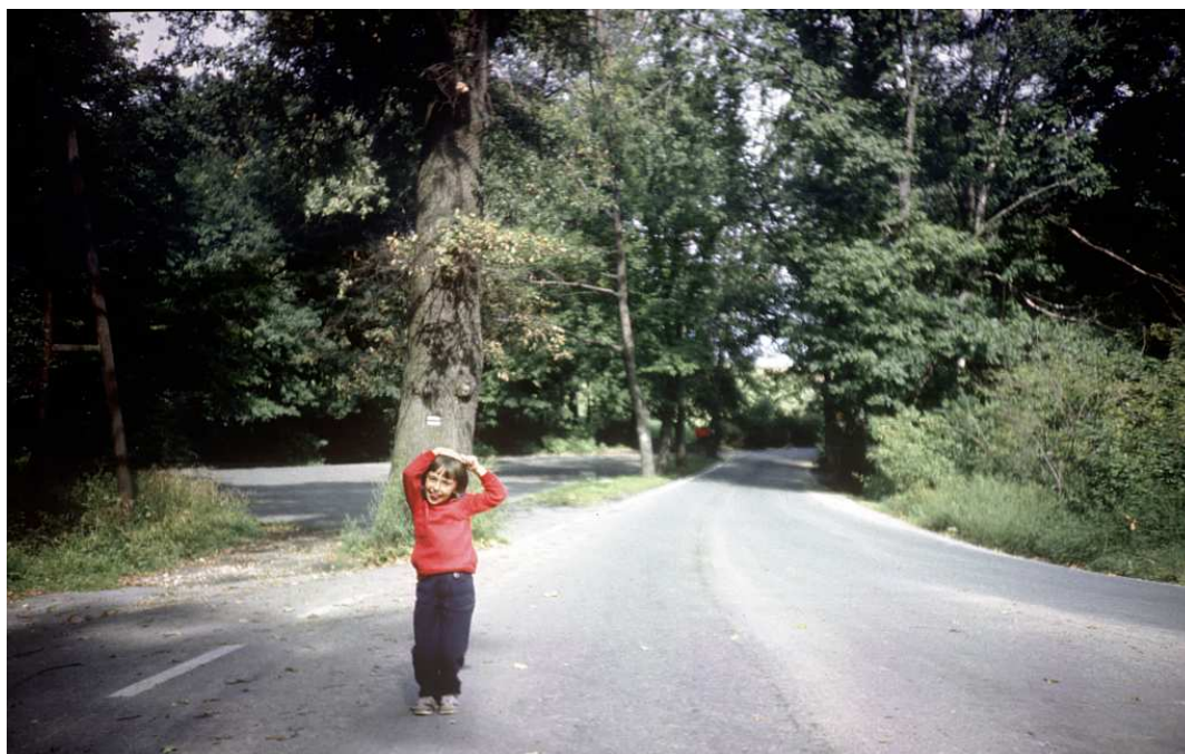
Fot. nr 57. Na drodze przy Babie Jadze. Lato 1986.