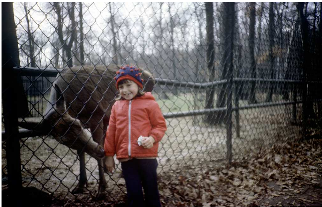
Fot. nr 68. Jesień 1986