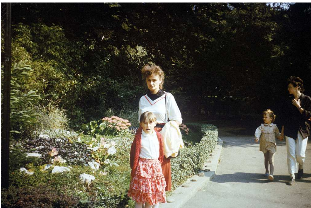
Fot. nr 69. Jesień 1988.