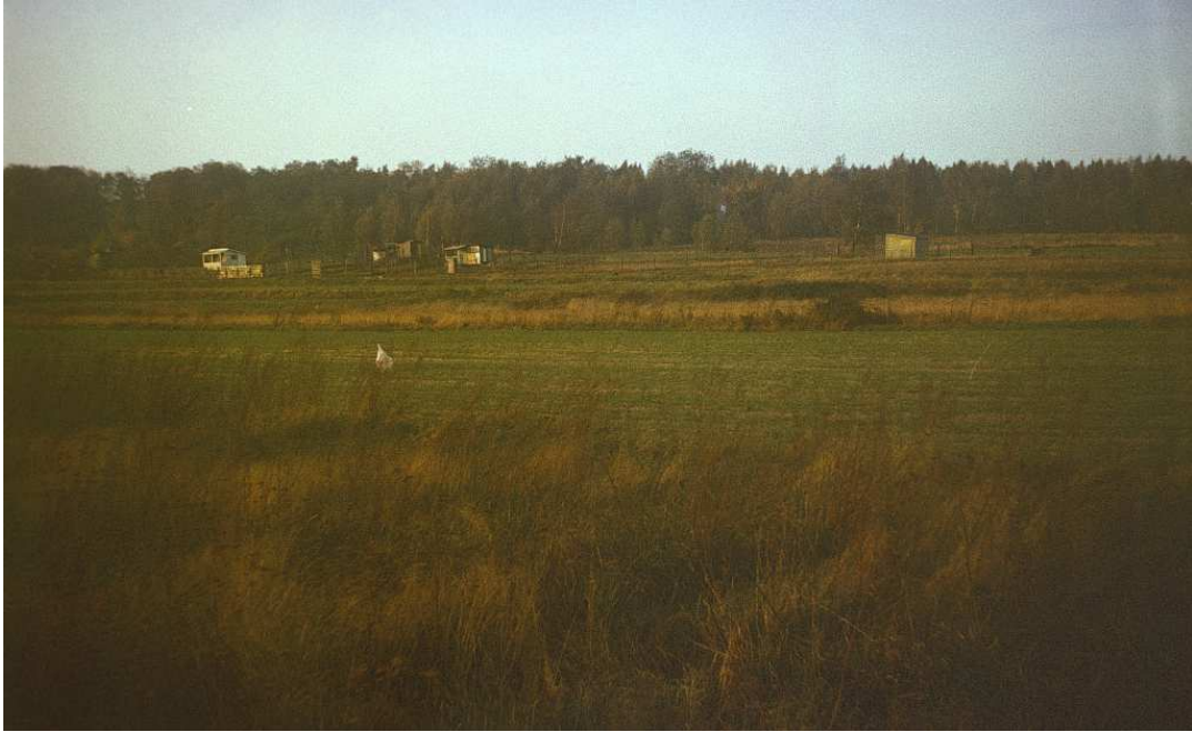
Fot. nr 173. Wycięty w styczniu 2013 las z sąsiedztwa ulicy Jakubowskiego. Widok od strony dzisiejszej ulicy Snozy. Jesień 89