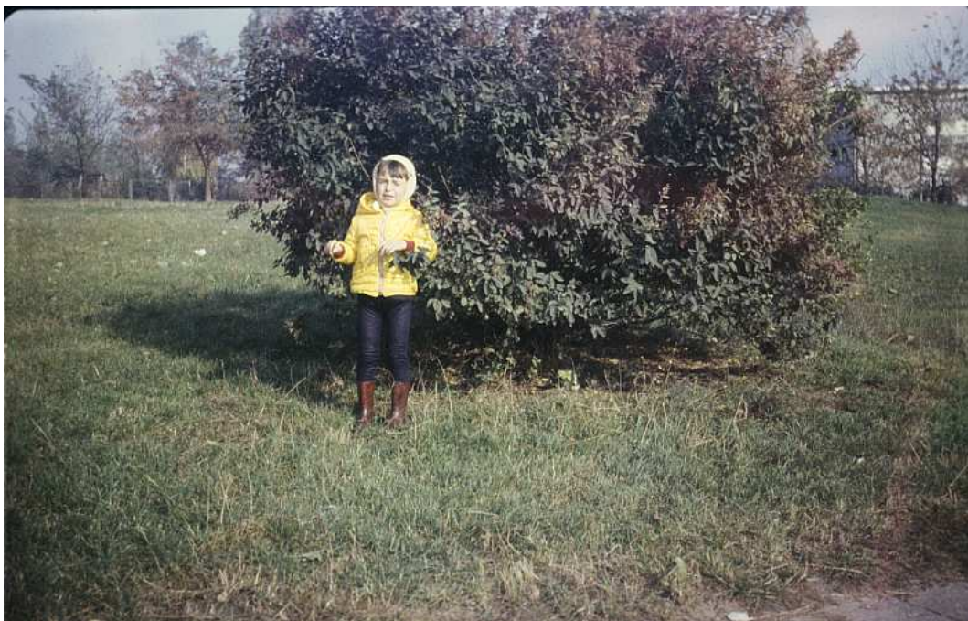
Fot. nr 122 (122-125). Krzew wiciokrzewu na zieleńcu w sąsiedztwie kortów tenisowych. W tle plac zabaw. Tu jesień 1986