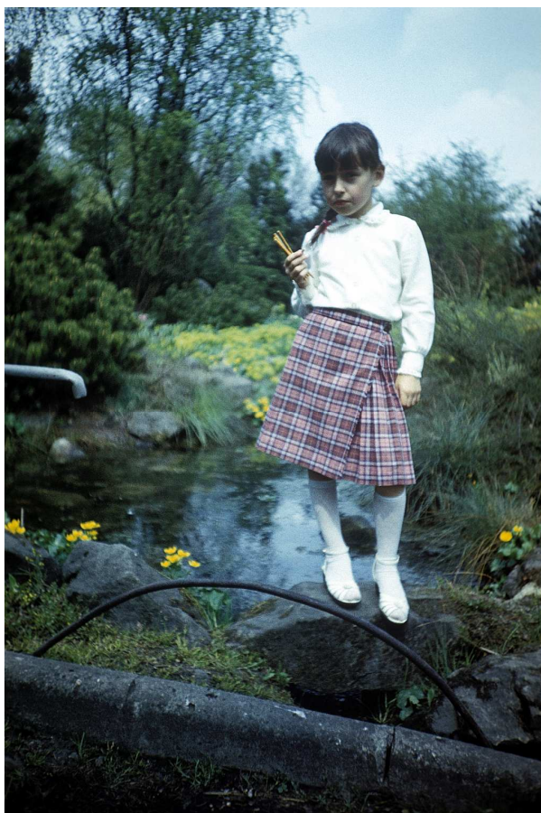
Fot. nr 28. Wczesna wiosna 1988.