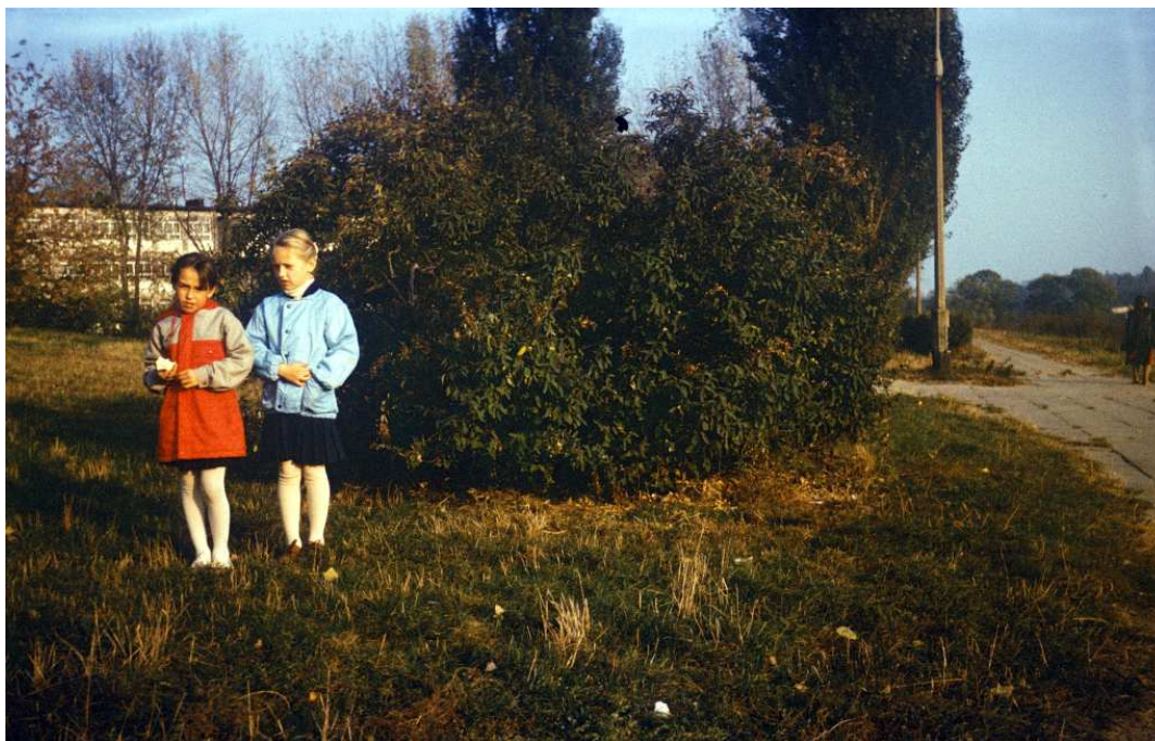
Fot. nr 124. Jesień 1988