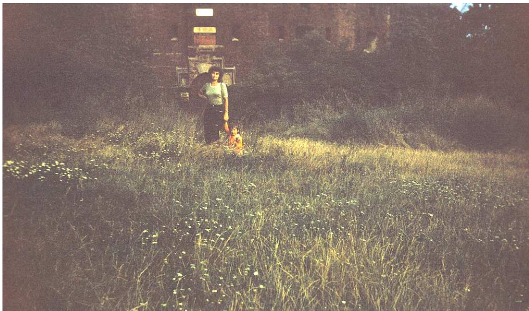
Fot. nr 110 (110-111) Z fortem „św. Benedykt” w tle. Tu wrzesień 1983