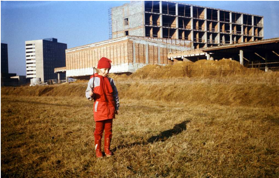
Fot. nr 150. Trwa budowa budynków Wydziału Farmacji AM. Jesień 1988.