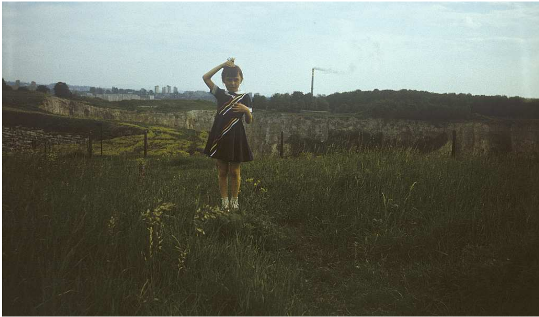
Fot. nr 107 (107-108). Ponad kamieniołomem Libana w stronę Bonarki. Tu lato 1988.