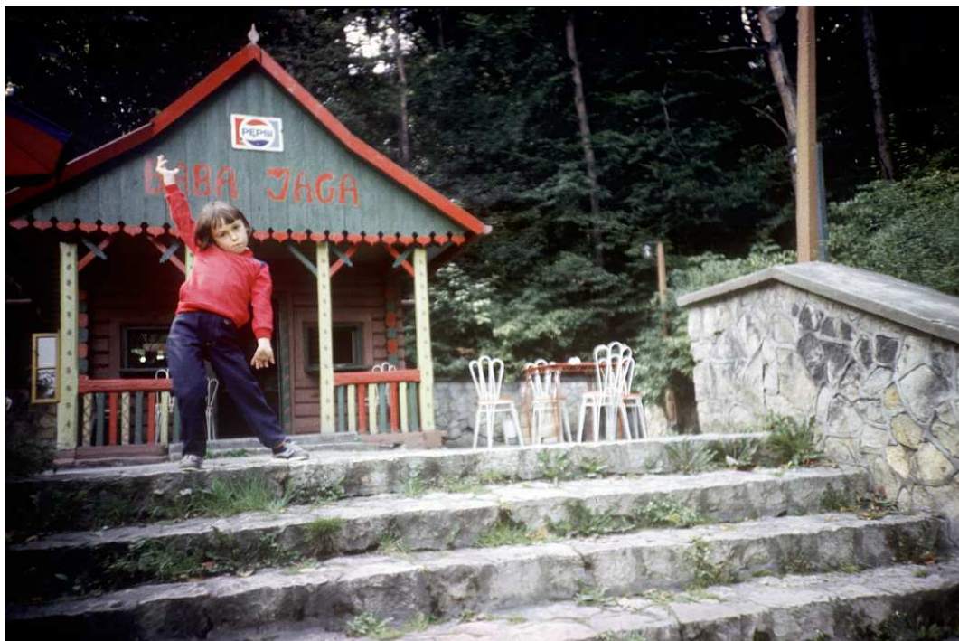
Fot. nr 60. Lato 1986.