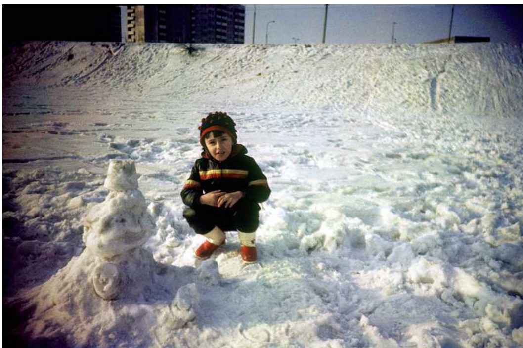
Fot. nr 117. Zima 1986/87.