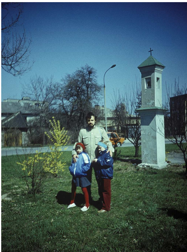
Fot. nr 80. Przy kapliczce przy ulicy Szwedzkiej. Wiosna 1988.