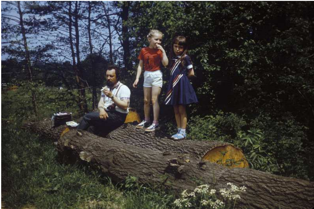
Fot. nr 192 (192-193). Pień drzewa przy skrzyżowaniu ulicy Do Luboni, który przez kilka lat zapewniał odpoczynek. Lato 1988