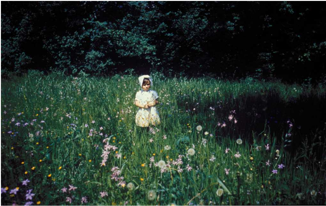
Fot. nr 217 (217-218). Rozległe łąki krzyszkowickiego wzniesienia. Czerwiec 1983.