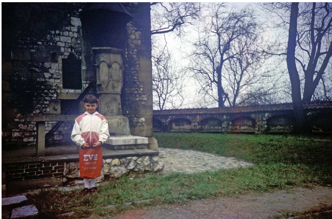
Fot. nr 46 (46-47). Przy kościele św. Salwatora. Tu Jesień 1986.