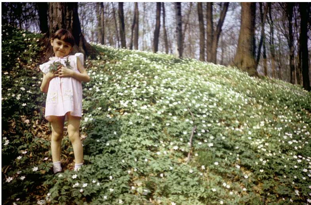
Fot. nr 62. Dywan z zawilców w sąsiedztwie Polany Wobra. Wiosna 1987.