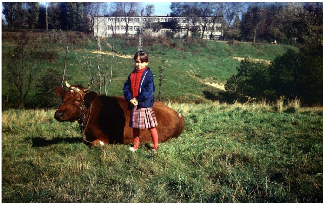
Fot. nr 156. Na łące przy potoku Drwinka w sąsiedztwie ulicy Szpakowej. Jesień 1988.