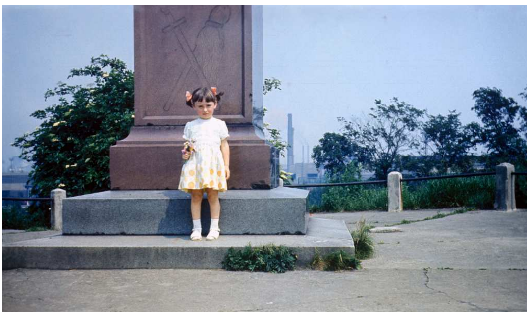
Fot. nr 212. Lato 1983.