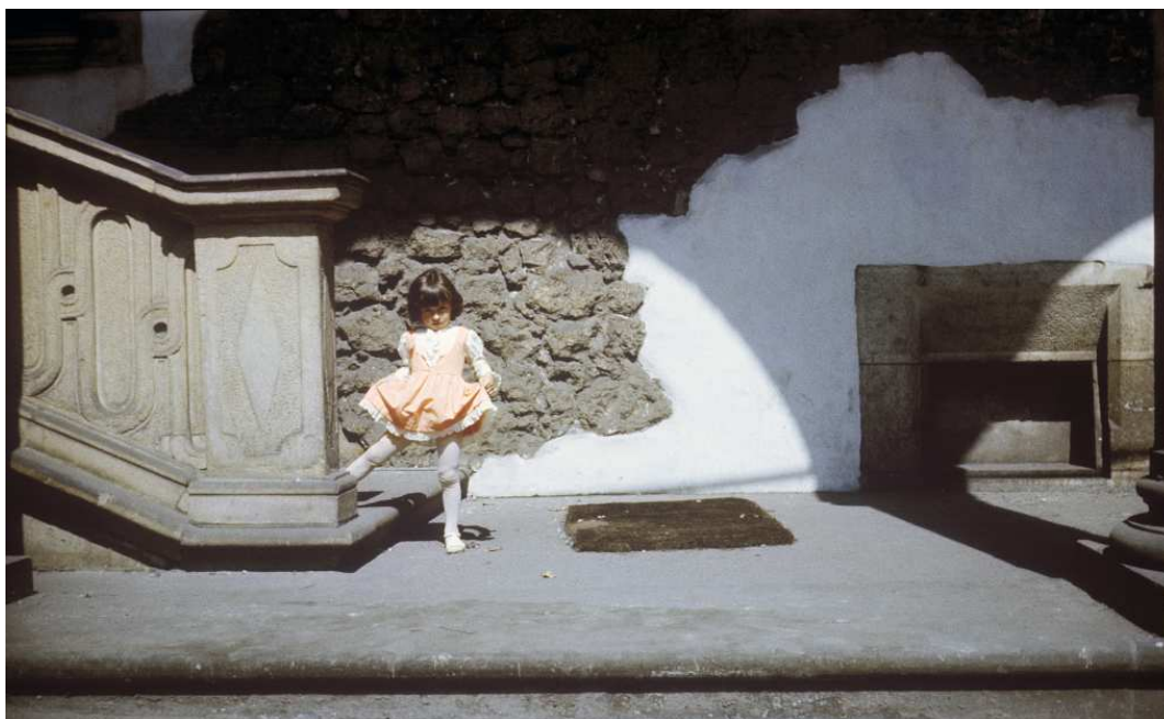
Fot. nr 3. Wiosna 1984