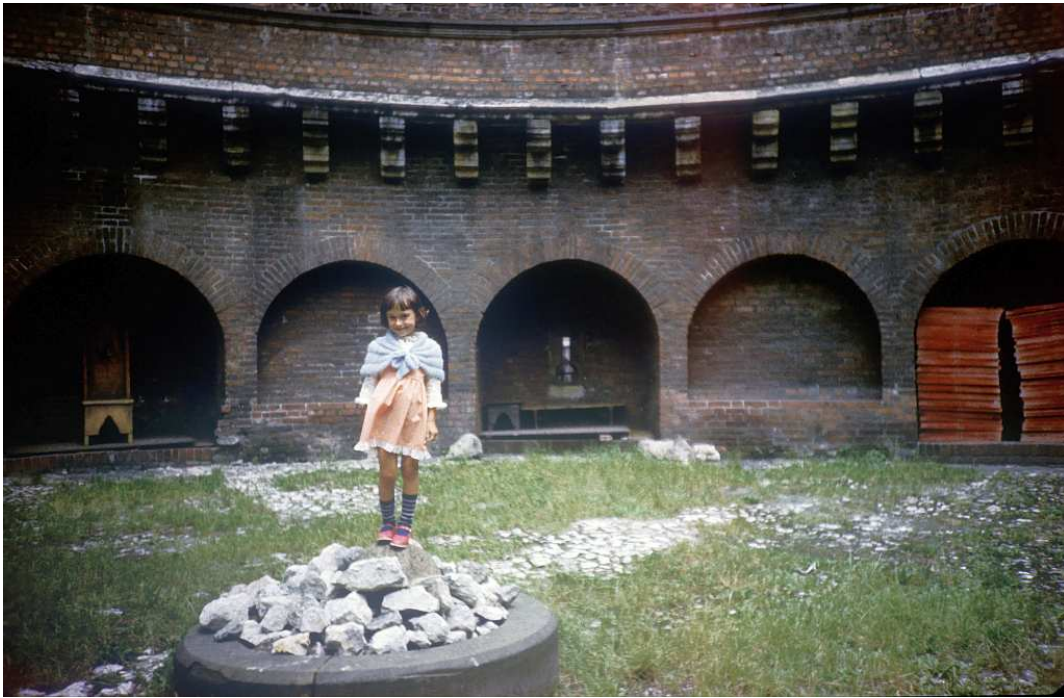
Fot. nr 12 (12-13). Na dziedzińcu Barbakanu. Lato 1986.