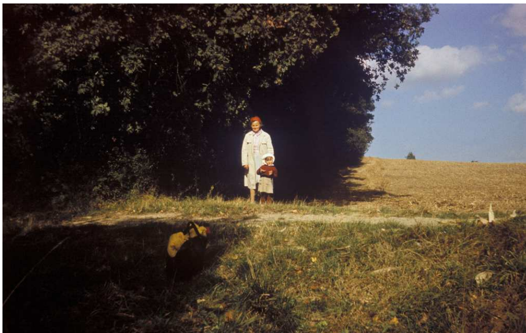
Fot. nr 225 (225-226). Bilczycki las w sąsiedztwie dworu. Wrzesień 1983.