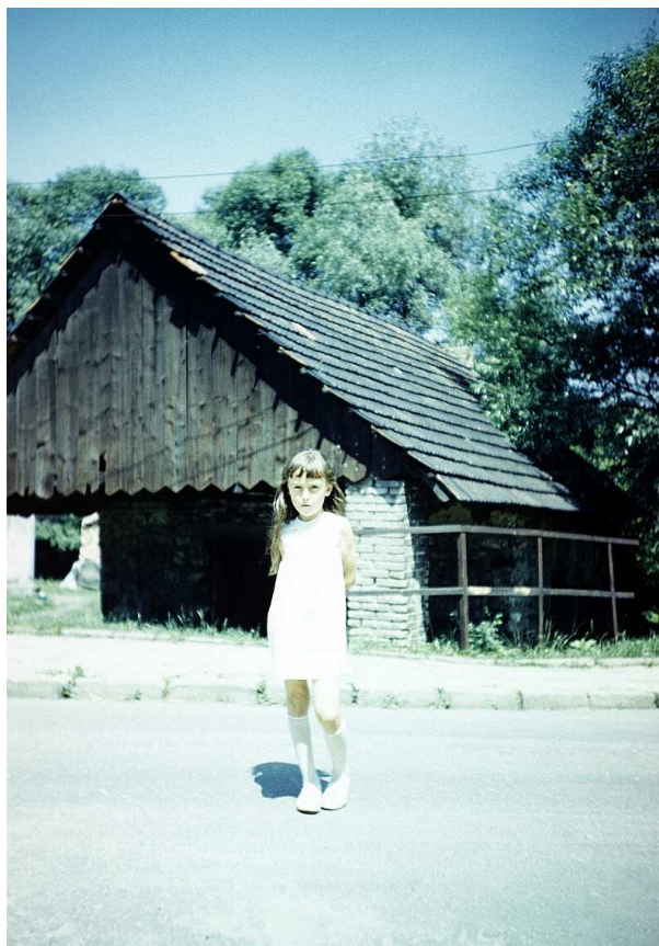
Fot. nr 207. Stara kuźnia przy ulicy Pod Strzechą. Lato 1988.