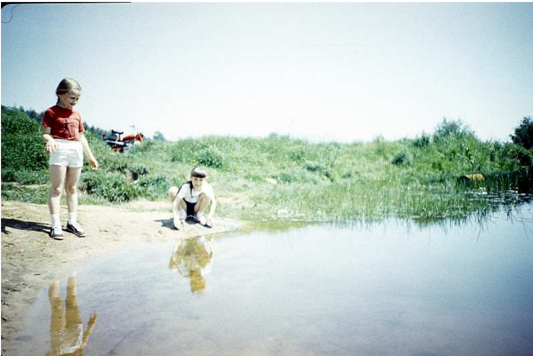
Fot. nr 166. Piasek na brzegu stawu. Pod koniec lat 70-tych było to kąpielisko dla chłopaków z pobliskiego „Kozłówka”. Lato 1988.