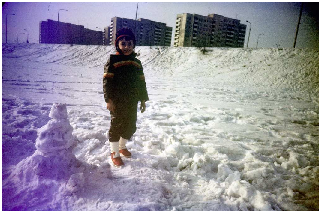
Fot. nr 116 (116-117). Pusty jeszcze plac przy ulicy Nowosądeckiej, gdzie niedługo wybudowane zostały garaże. W tle bloki przy ulicy Białoruskiej. Zima 1986/87. Dziś stoją tu garaże i blok z ulicy Nowosądeckiej 17.