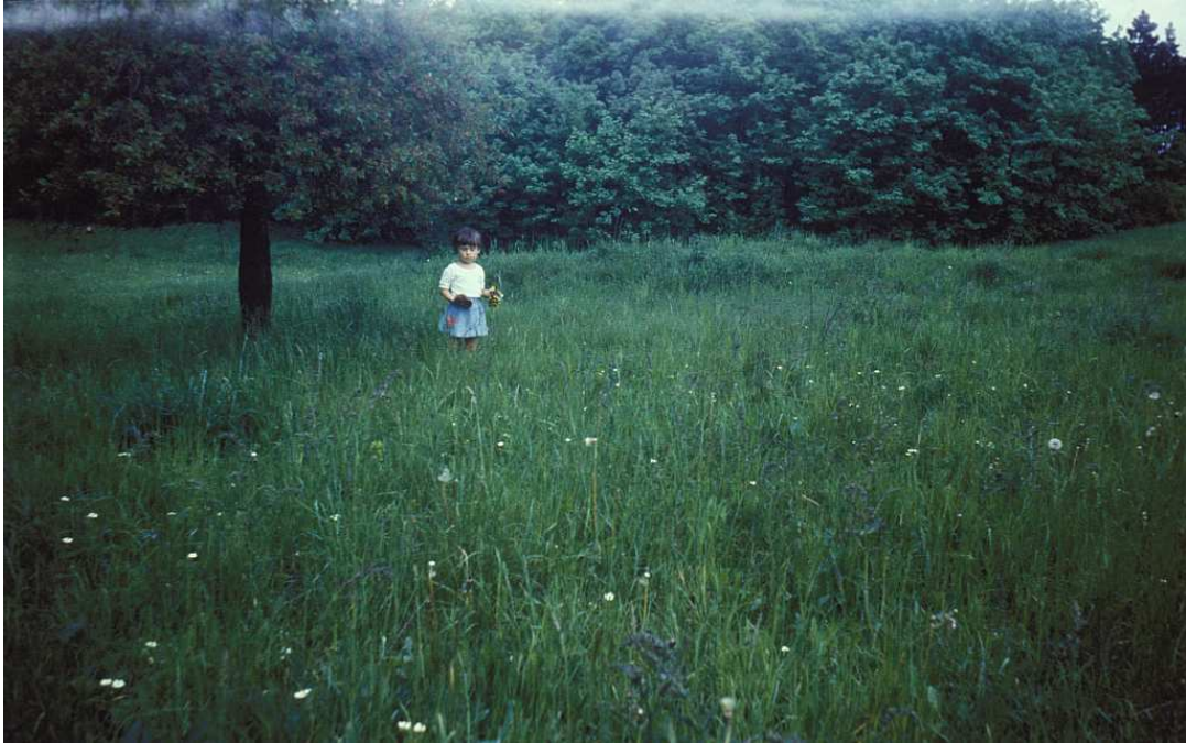
Fot. nr 113. Na polanie w Lesie Bonarka. Lato 1983.