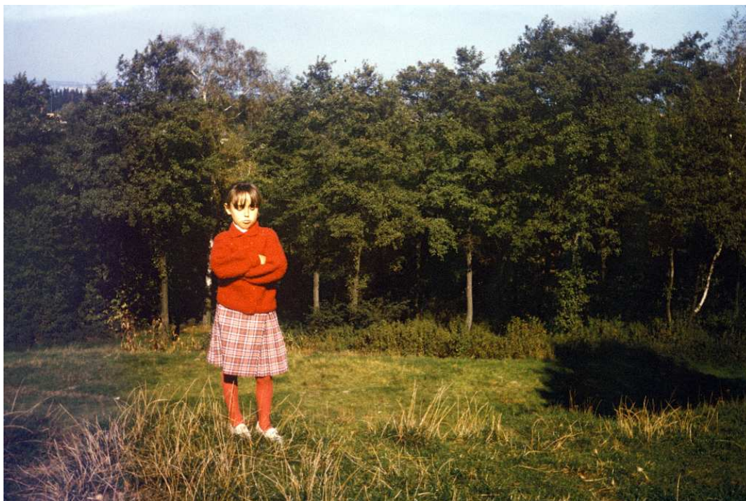
Fot. nr 143. Jesień 1988.