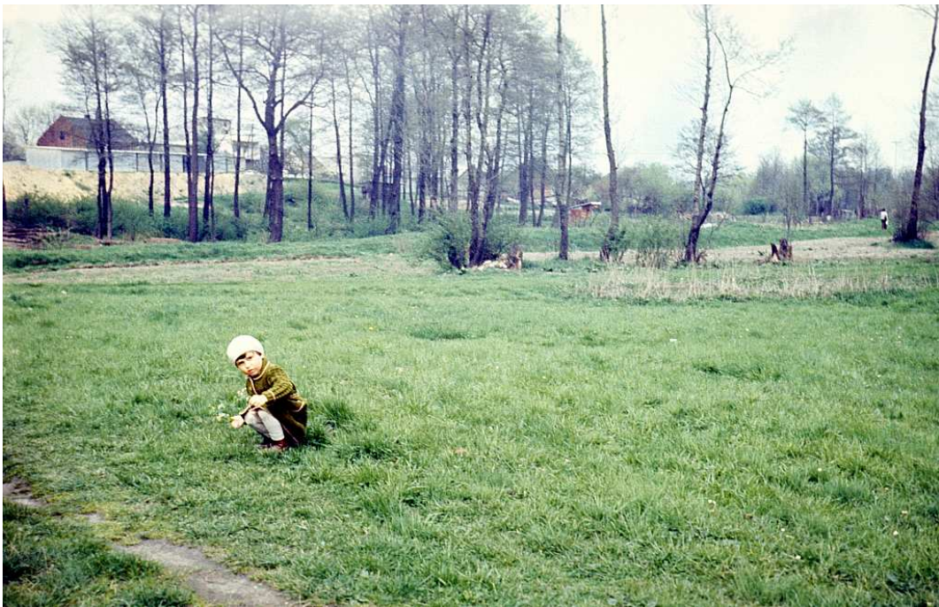
Fot. nr 127. Łąka pokryta ogródkami działkowymi wzdłuż ulicy Facimiech. Wiosna 1984.