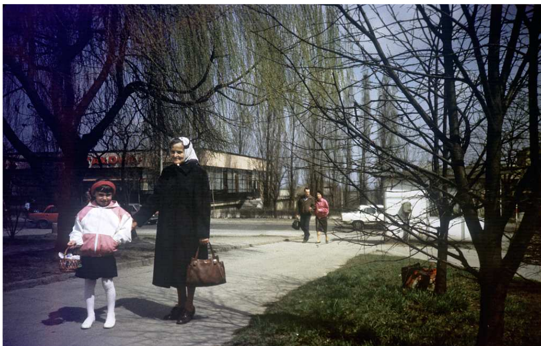
Fot. nr 119. Osiedle na Kozłówe. W tle dawna restauracja Kryształowa (dziś siedziba Siemachy). Wiosna 1987