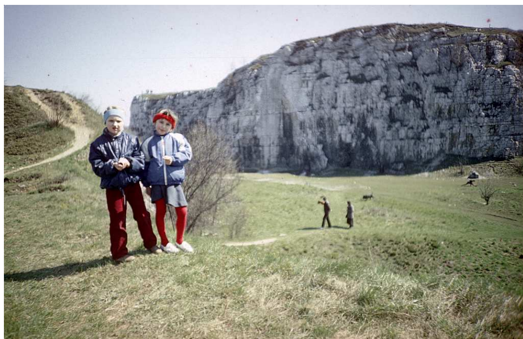
Fot. nr 87. Wiosna 1988