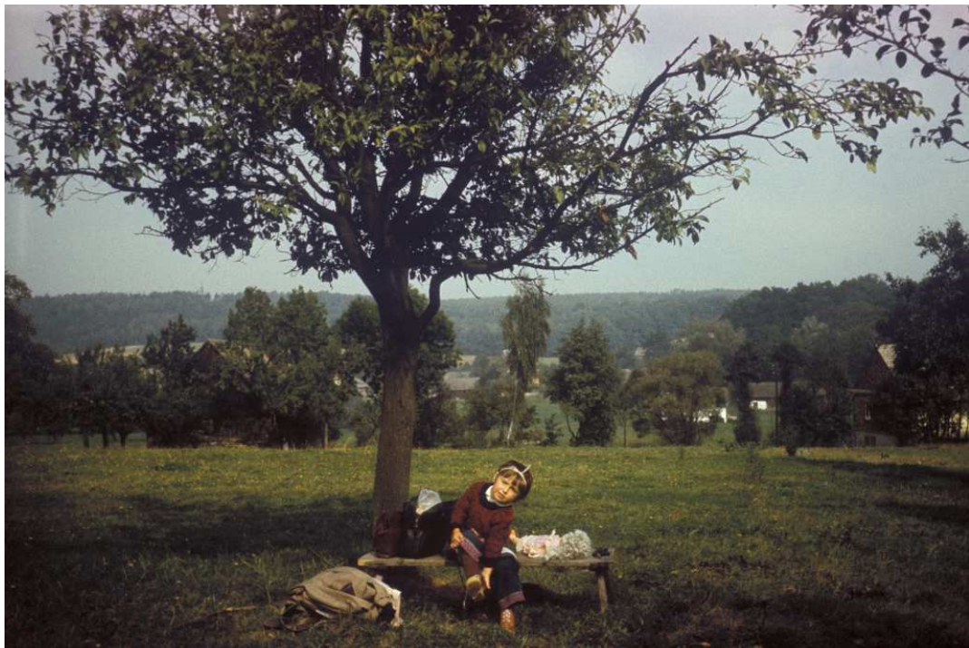
Fot. nr 224. Wrzesień 1983.