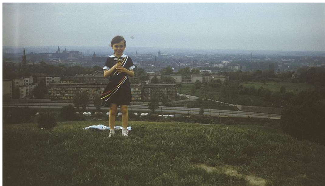
Fot. nr 102. Lato 1988.