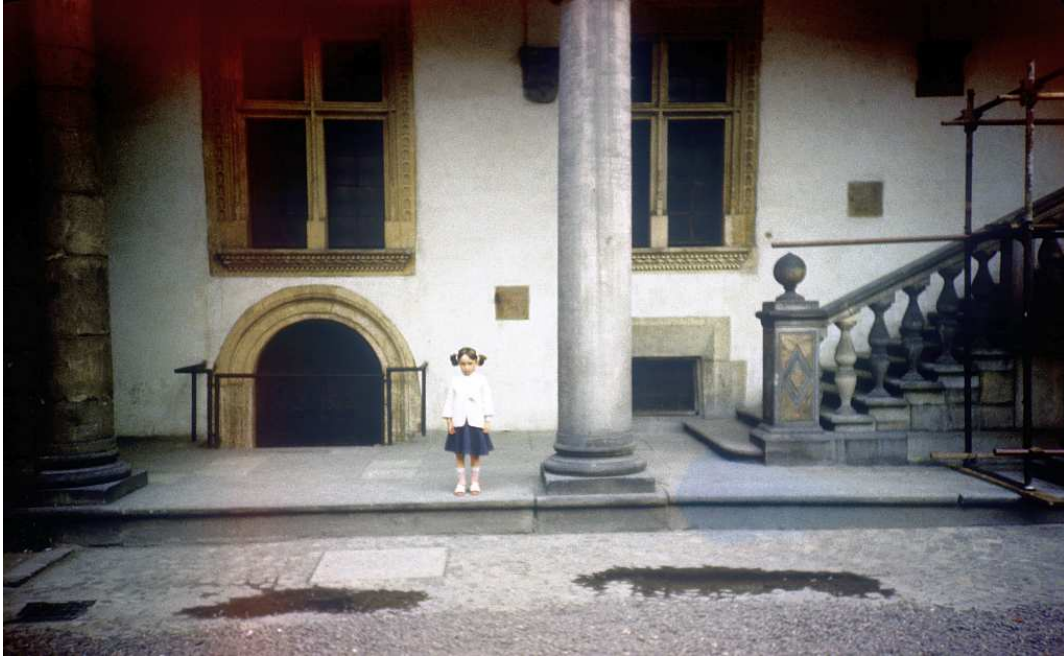
Fot. nr 4. Lato 1986.