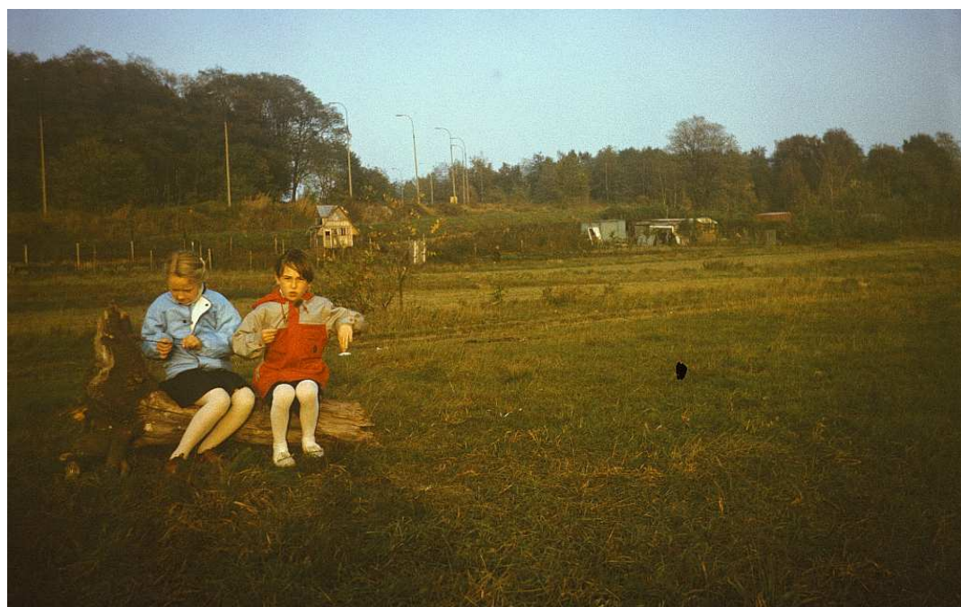
Fot. nr 172. Ogródki działkowe przy zakręcie ulicy Kostaneckiego przy forcie Prokocim. Jesień 1988.