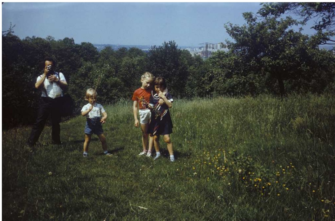
Fot. nr 189. Widok w stronę osiedla Nowy Kurdwanów ze wzniesienia w sąsiedztwie polnej wówczas uliczki Na Pokusie. Lato 1988.