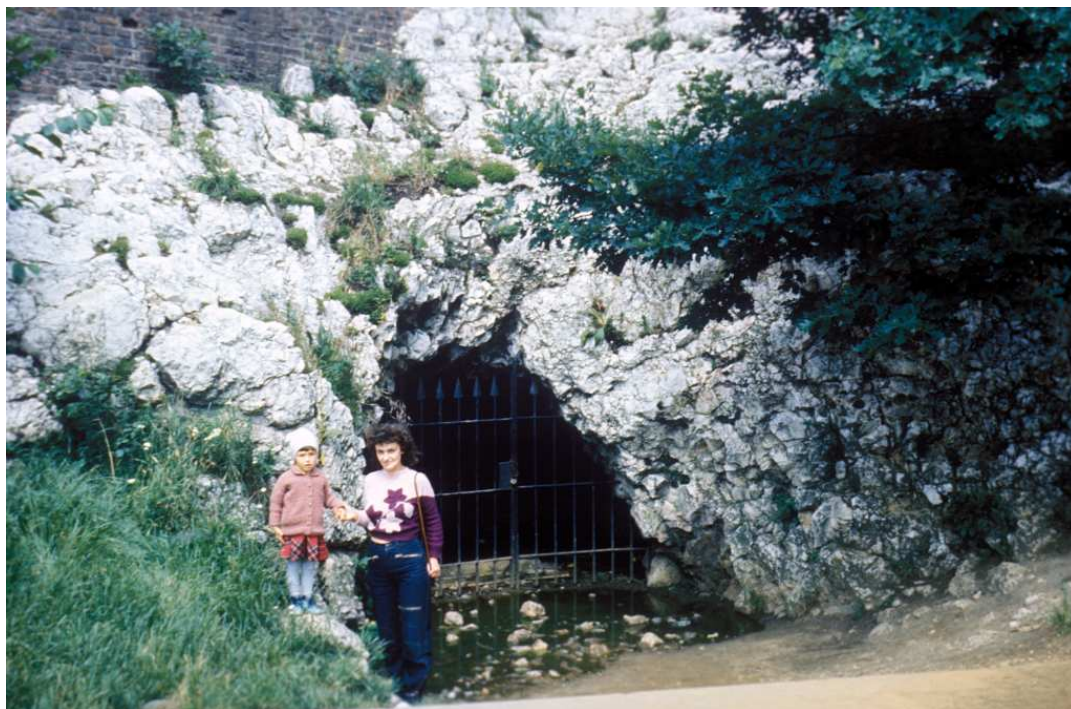
Fot. nr 10 (10-11). Przed Smoczą Jamą. Lato 1983.