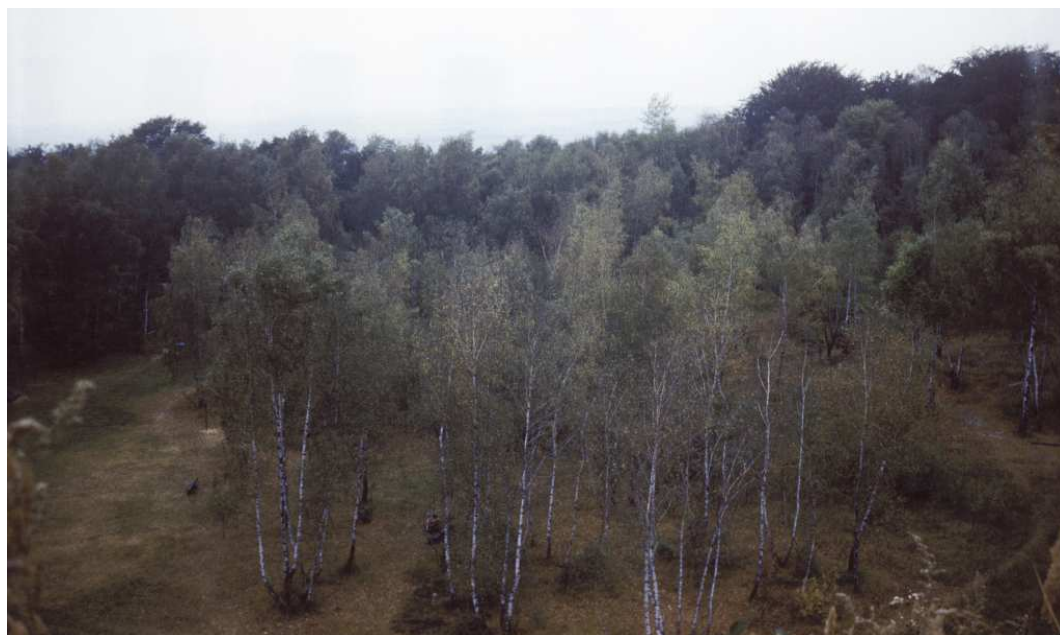
Fot. nr 79. Widok ze szczytu w stronę parkingu. Jesień 1984.