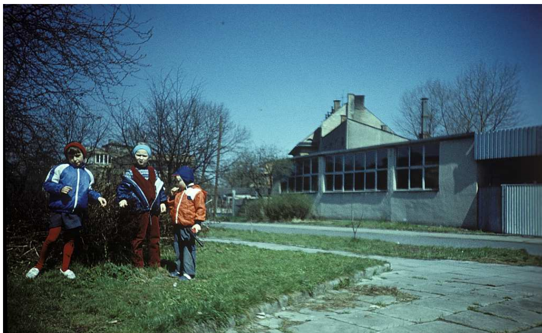
Fot. nr 81. Okolice ulicy Szwedzkiej. Wiosna 1988.