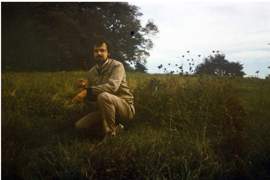
Fot. nr 152 (152-153). Kwietna łąka w sąsiedztwie fortu Prokocim. Tu wrzesień 1988.