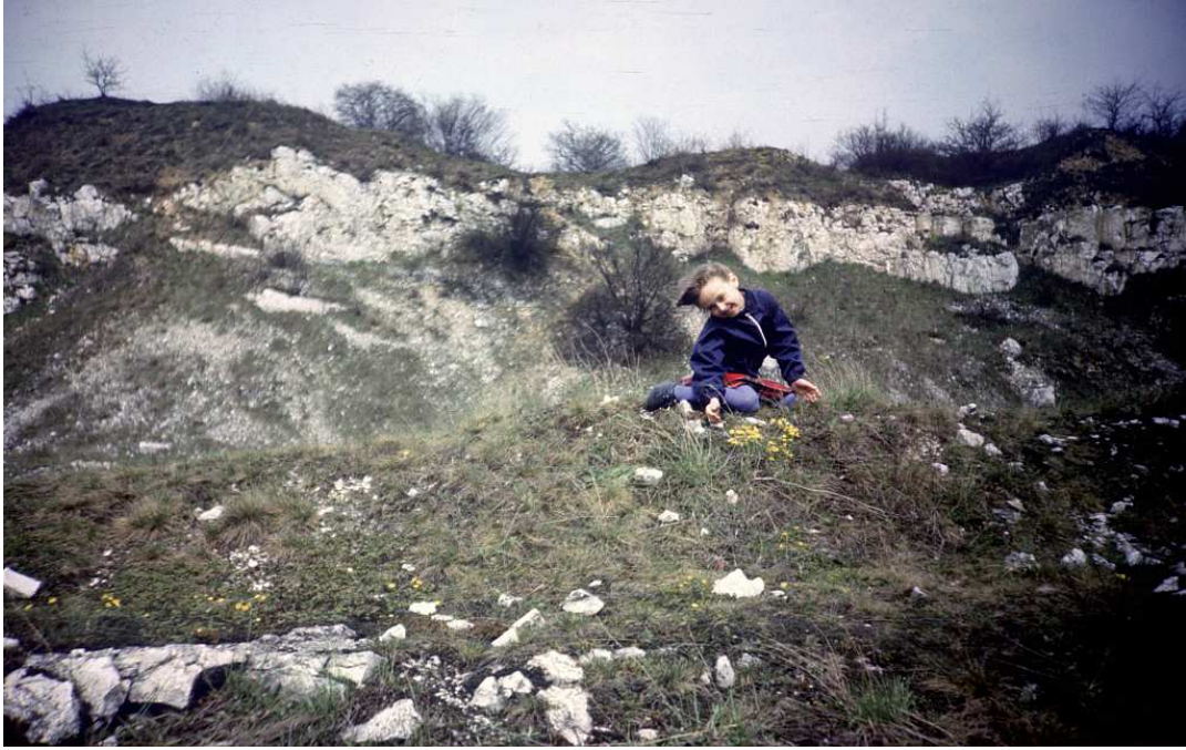
Fot. nr 98. Niecka kamieniołomu w sąsiedztwie ulicy Tynieckiej. Wiosna 1987.