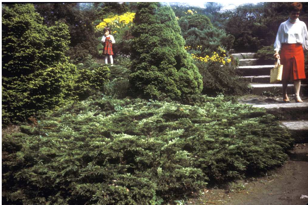
Fot. nr 29. Wiosna 1984.