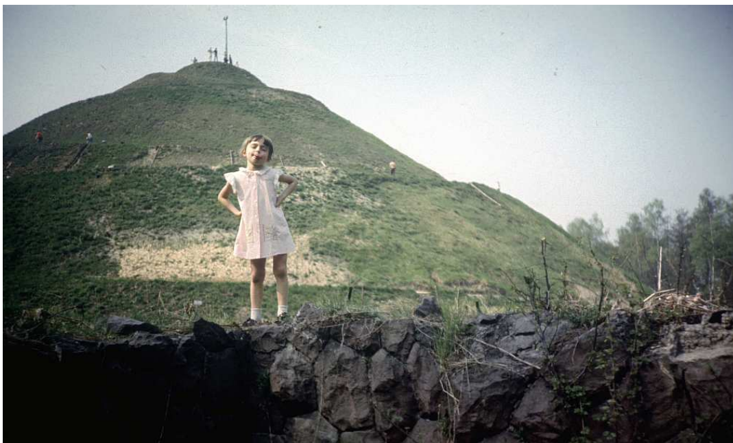
Fot. nr 74. Wiosna 1987. Kopiec uszkodzony przez jedną z nawałnic.