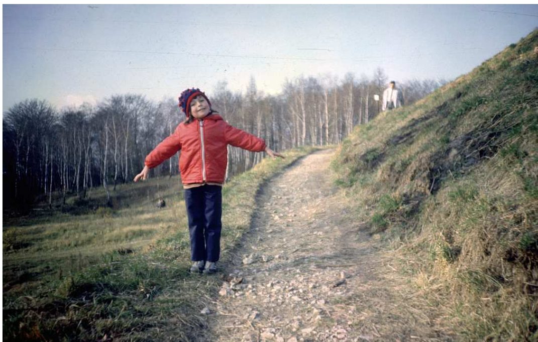
Fot. nr 75. Na zboczu Kopca. Jesień 1986.