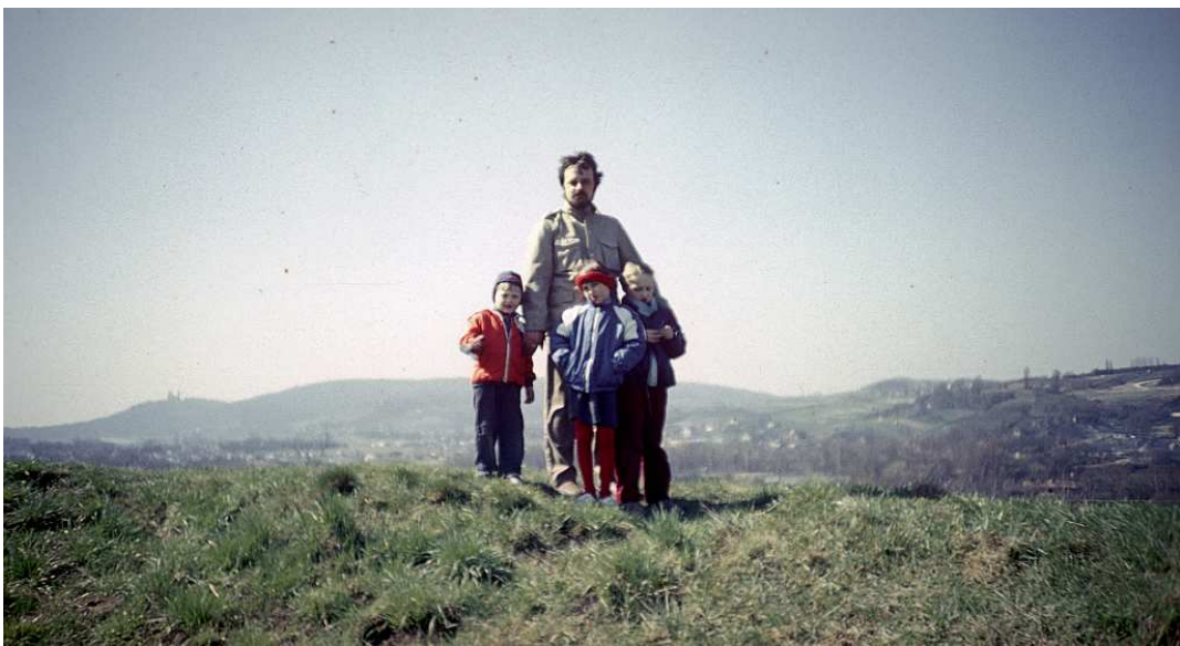
Fot. nr 93. Widok z okolicy szańca FS-29 w stronę Sikornika i Lasu Wolskiego. Wiosna 1988.