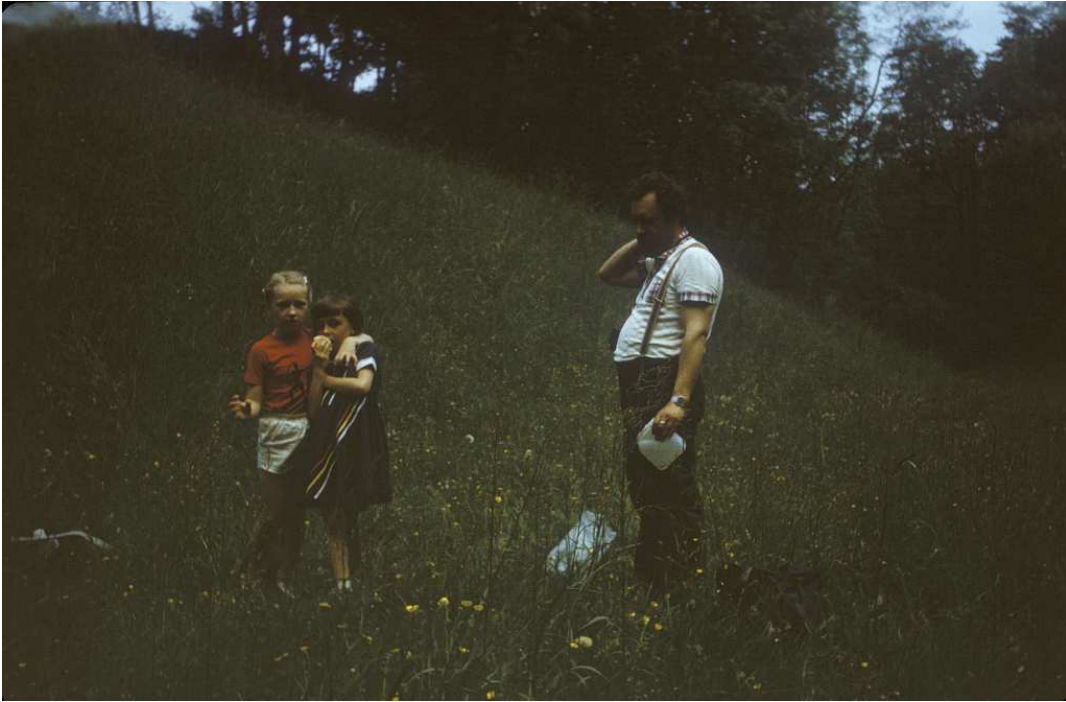
Fot. nr 187 (187-188). Zarośnięty trawą wąwóz, usytuowany wzdłuż ulicy Niebieskiej, który wiódł do kawern zlokalizowanych w stoku przylegającym do ulicy Osterwy i fortu Kosocice Zachód. Tu lato 1988.