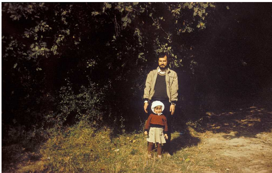
Fot. nr 226. Wrzesień 1983.