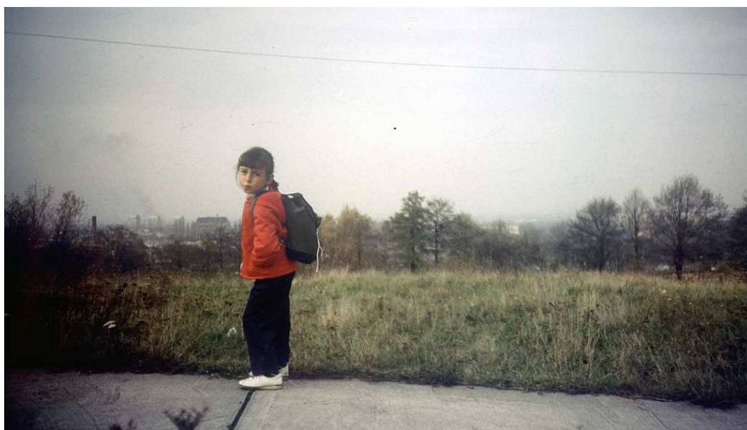
Fot. nr 140. Jesień 1986.