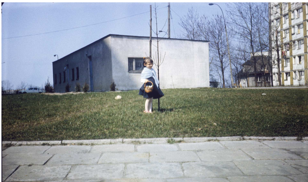
Fot. nr 114 (114-115). Otoczenie końcowego odcinka ulicy Spółdzielców na osiedlu Na Kozłowce. Tu Wielkanoc 1984.