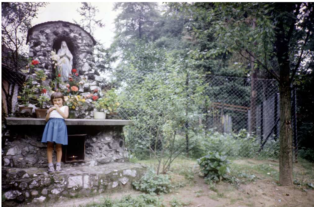
Fot. nr 157. Figura Matki Boskiej przy ulicy Podedworze. Lato 1986.