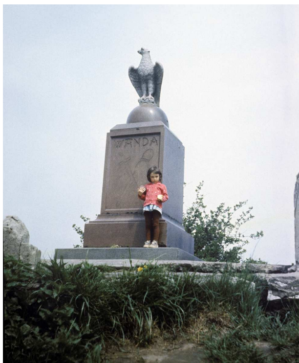
Fot. nr 213. Lato 1984.