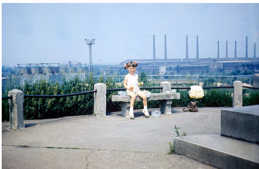
Fot. nr 214. Z kominami kombinatu HiL w tle. Lato 1983.