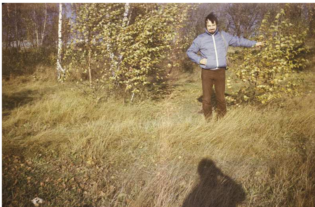
Fot. nr 182. Jesień 1986.