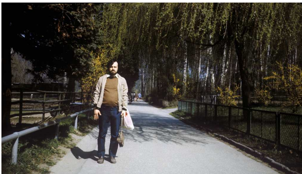
Fot. nr 65 (65-70). W ZOO. Tu wiosna 1984.