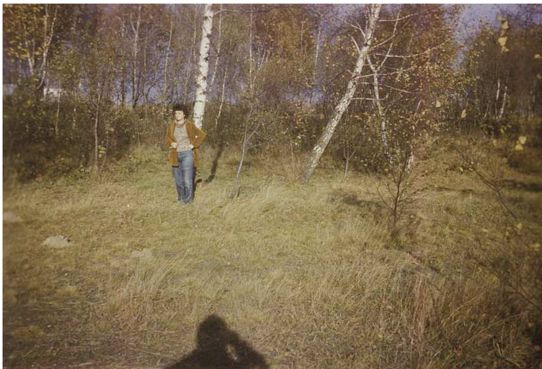
Fot. nr 181 (181-184). Skromny jeszcze laszek na skraju ugoru w sąsiedztwie ulicy Jakubowskiego. Tu Jesień 1986.