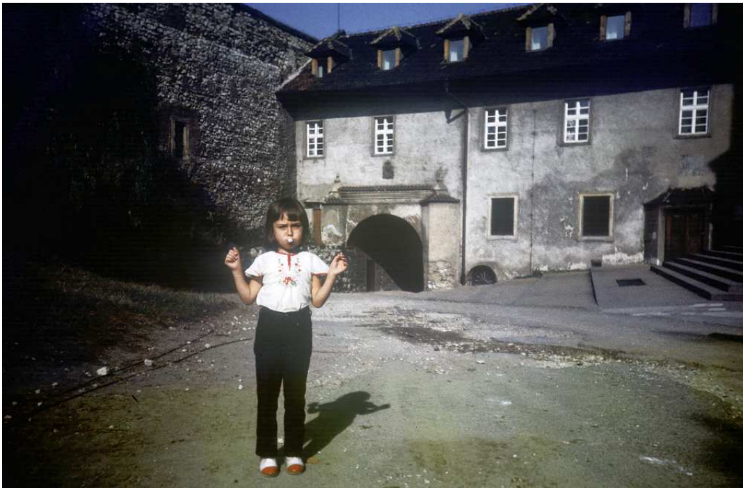
Fot. nr 199. Na dziedzińcu Opactwa Benedyktynów. Lato 1986.