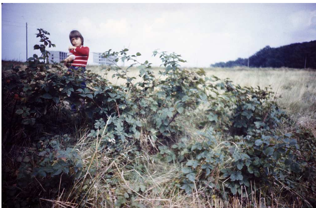
Fot. nr 160. Z fortem Prokocim i budującym się Wydziałem Farmacji UJ w tle. Lato 1986.