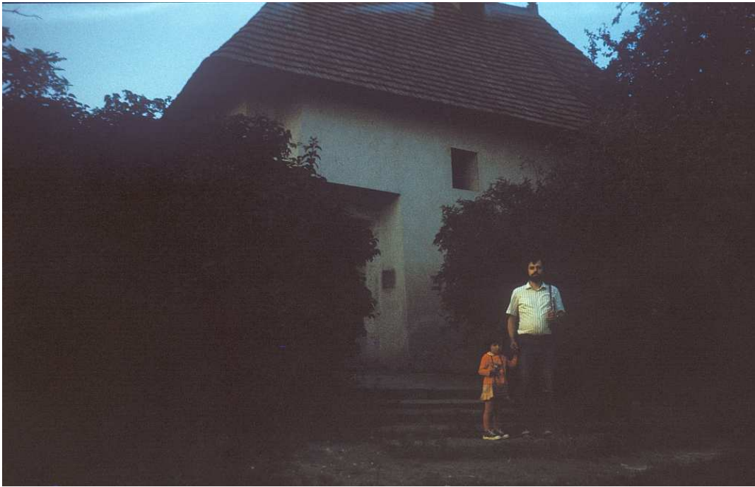
Fot. nr 109. Pod kościołkiem św. Benedykta. Wrzesień 1983.