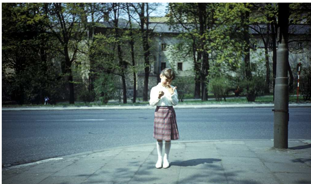
Fot. nr 17. Z klasztorem na Gródku w tle.. Wiosna 1988