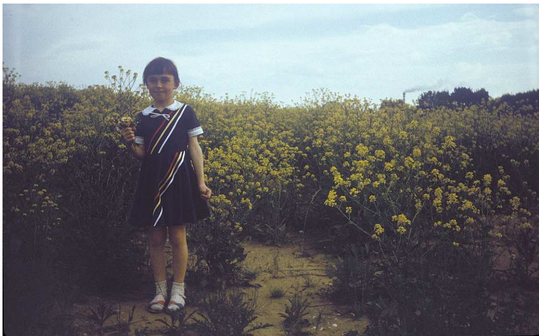
Fot. nr 108. Lato 1988.