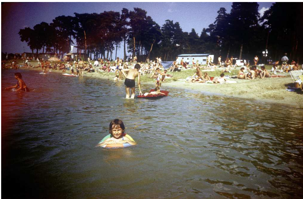
Fot. nr 203. Lato 1986.