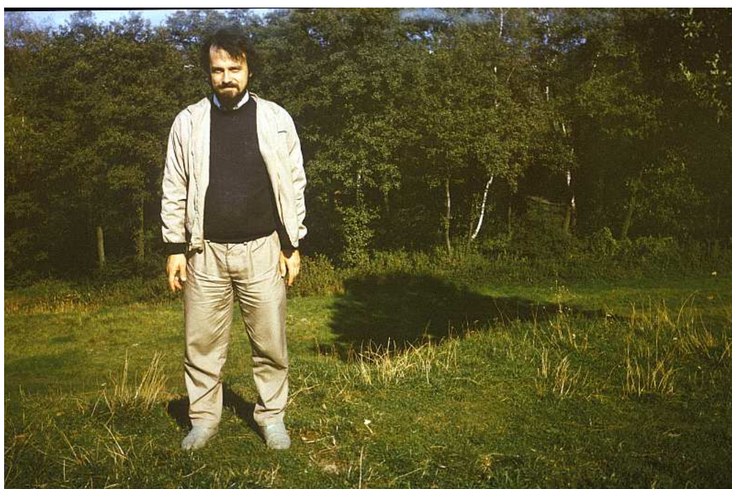
Fot. nr 144. Jesień 1988.