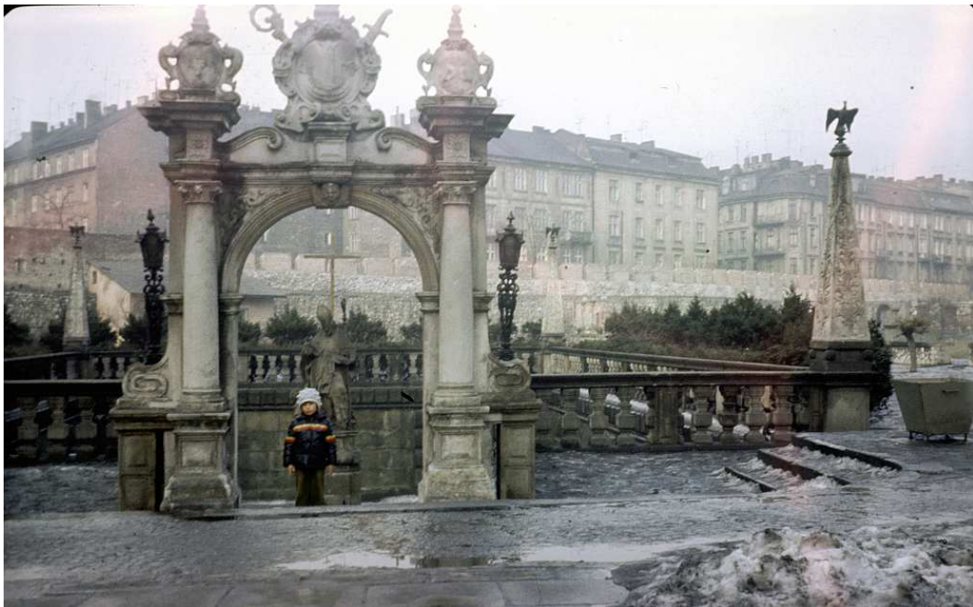
Fot. nr 18. Przed sadzawką na Skałce. Zima 1986/87.