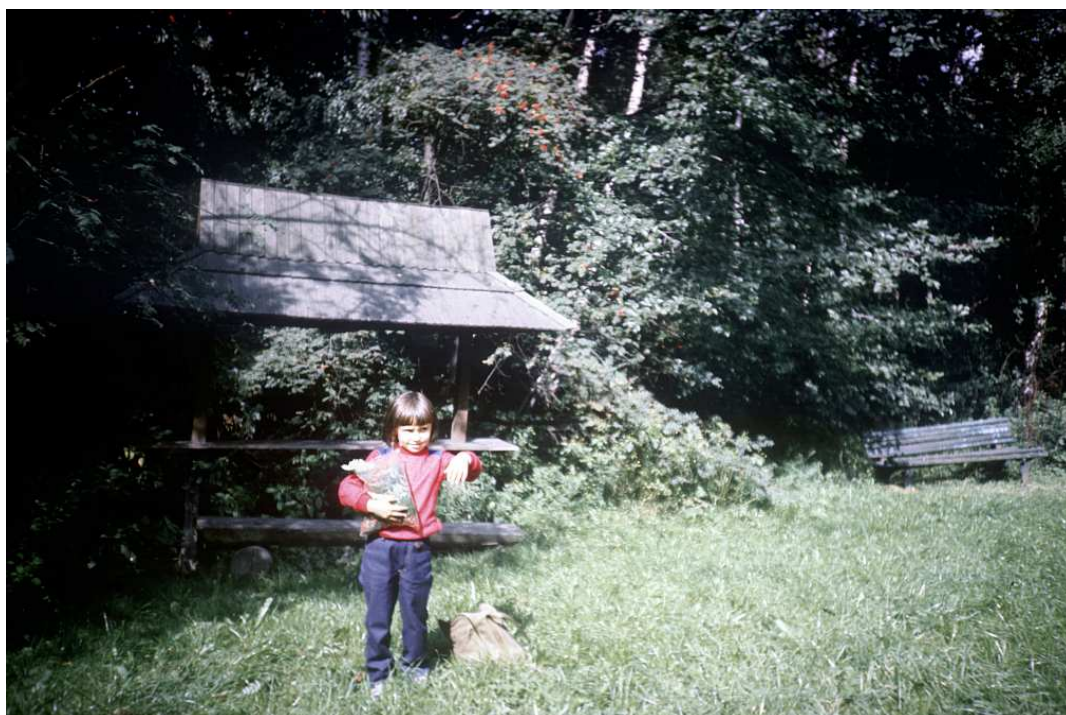
Fot. nr 63. Przy drodze do ZOO. Wrzesień 1986.