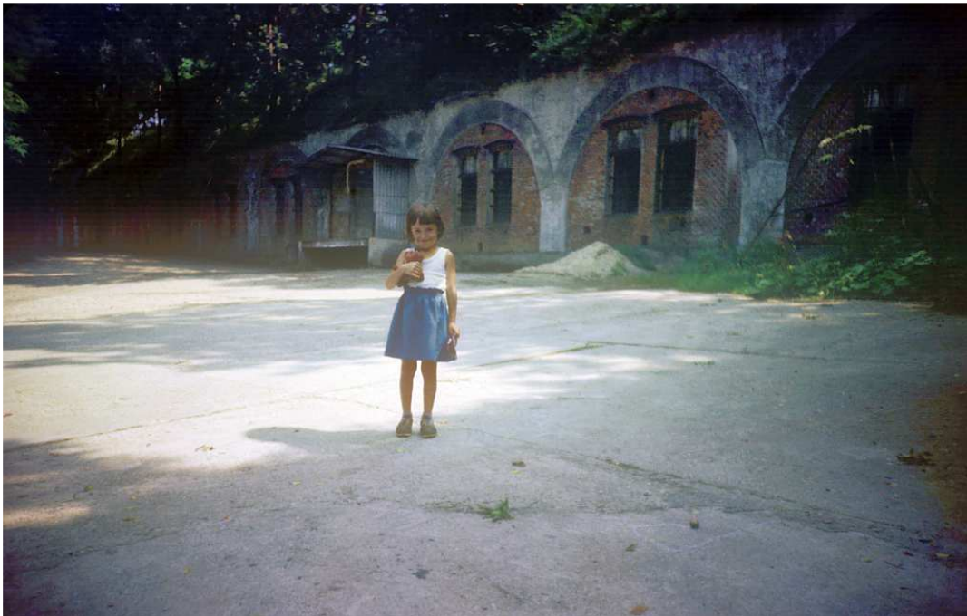
Fot. nr 194. Przed koszarami fortu nr 51 Rajsko. Lato 1986.