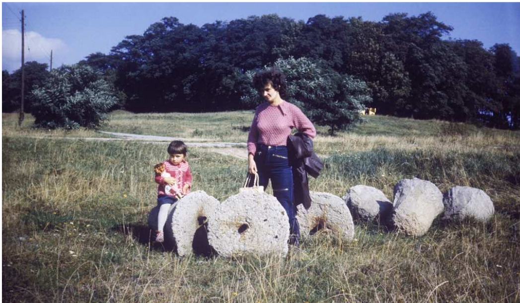
Fot. nr 159. Z fortem Prokocim w tle za ulicą Kostaneckiego. Lato 1984.