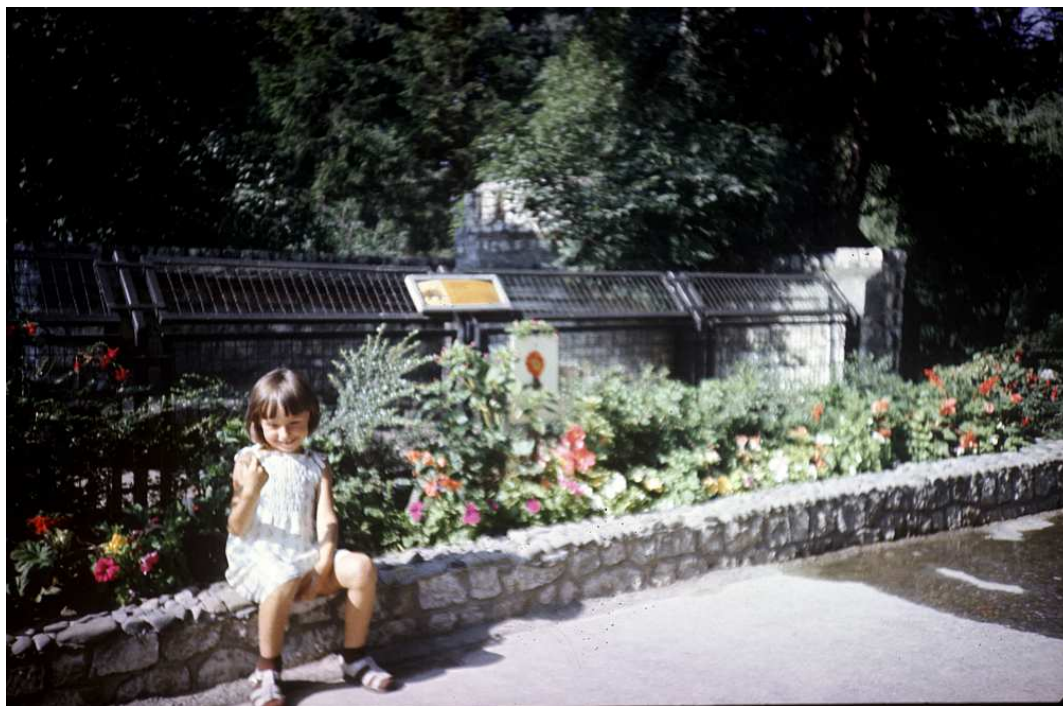
Fot. nr 66. Lato 1986.