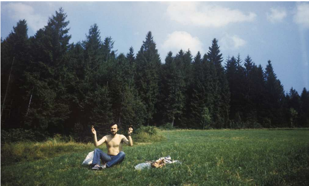
Fot. nr 228. Rozległe łąki na skraju lasu. Wrzesień 1984.