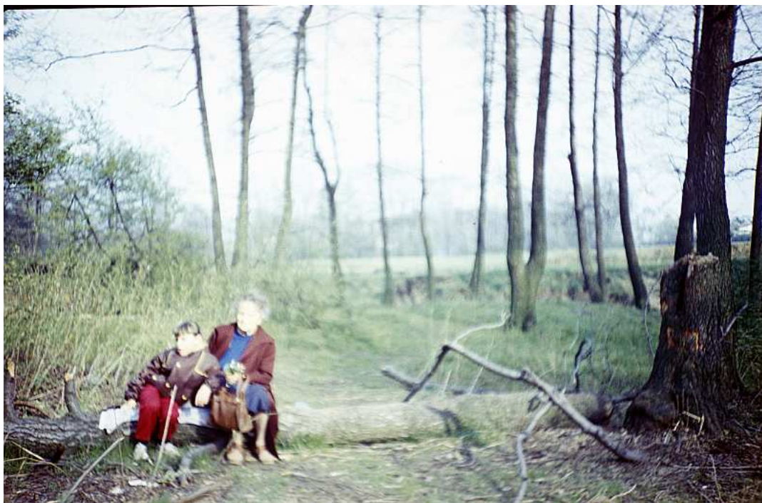
Fot. nr 128 (128-129). W dolince w sąsiedztwie mostku i ulicy Podlesie. Tu Wiosna 1988.