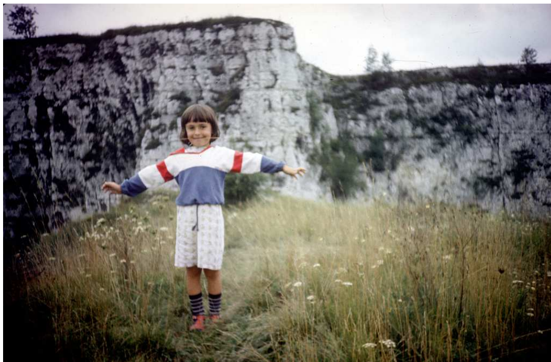
Fot. nr 86. Lato 1986.