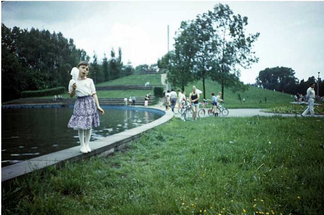
Fot. nr 33. Przy sadzawce. Lato 1988.