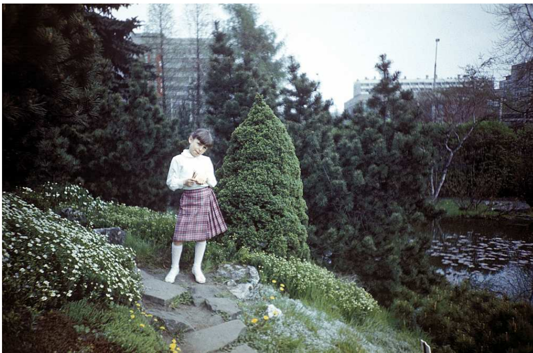
Fot. nr 27. wczesna wiosna 1988