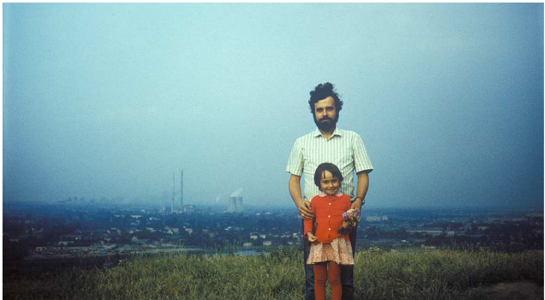
Fot. nr 104. Jesień 1983.