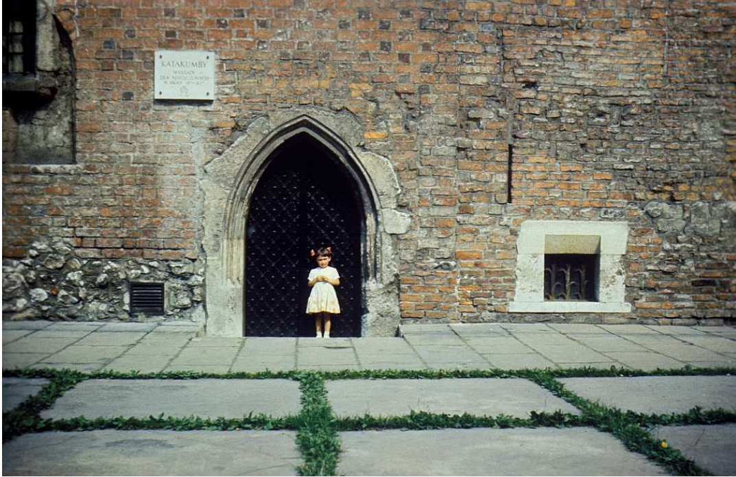
Fot. nr 215. Przed klasztorem Cystersów w Mogile. Lato 1983.