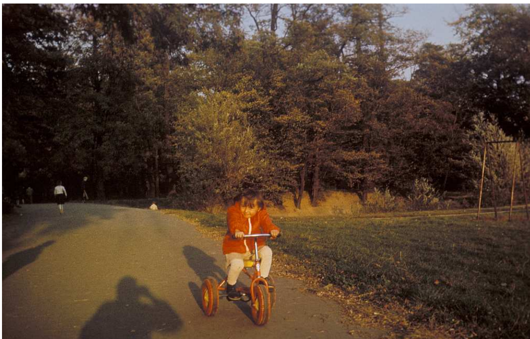
Fot. nr 148. W Parku Jerzmanowskich. Jesień 1983.