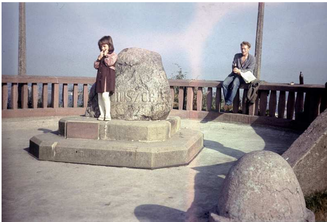
Fot. nr 36. Jesień 1986