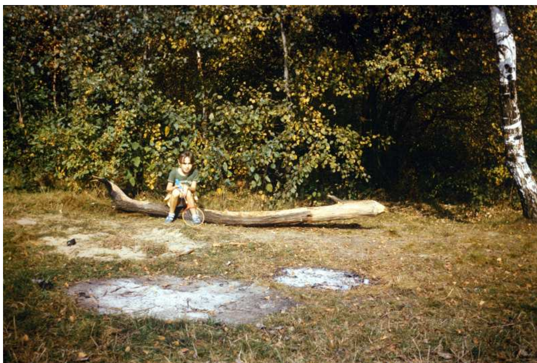
Fot. nr 184. Jesień 1988.