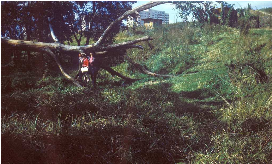
Fot. nr 126. Przy akademiach AM. W tle bloki osiedla Nowy Prokocim za ulicą Wielicką. Jesień 1983.