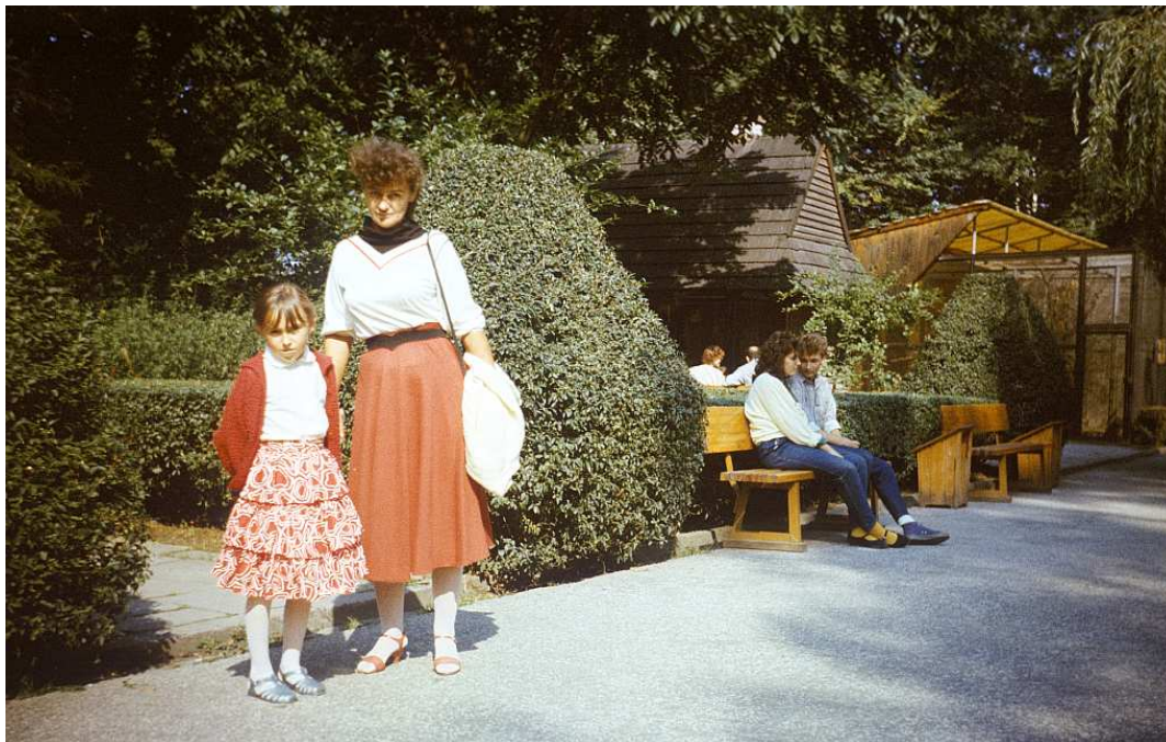
Fot. nr 70. Jesień 1988.