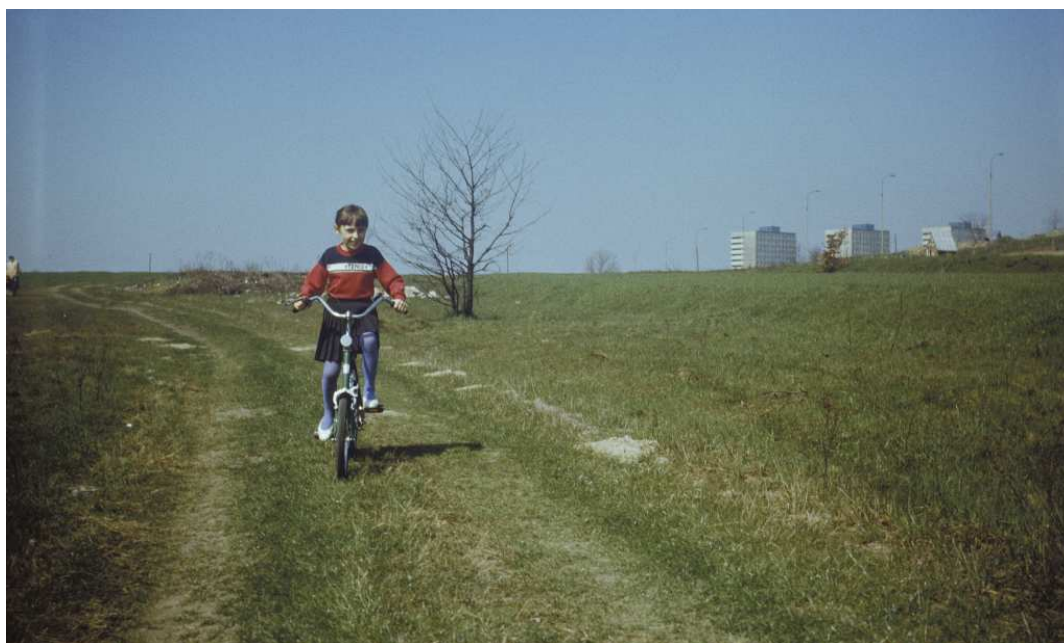
Fot. nr 162 (162-164). Pola Rżąki w początkowym fragmencie dzisiejszej „ulicy” Słona Woda. W tle „akademiki” AM, budynki Wydziału Farmacji AM (w budowie) i fort Prokocim (z prawej). Wiosna 1988.