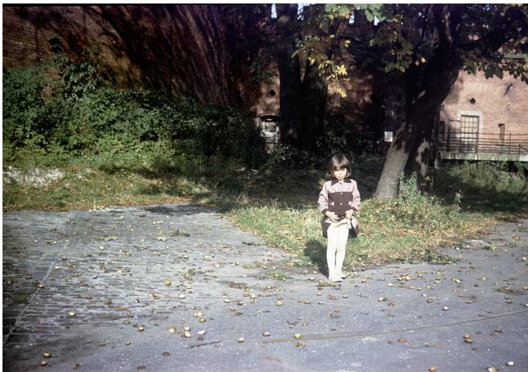
Fot. nr 111. Jesień 1986.