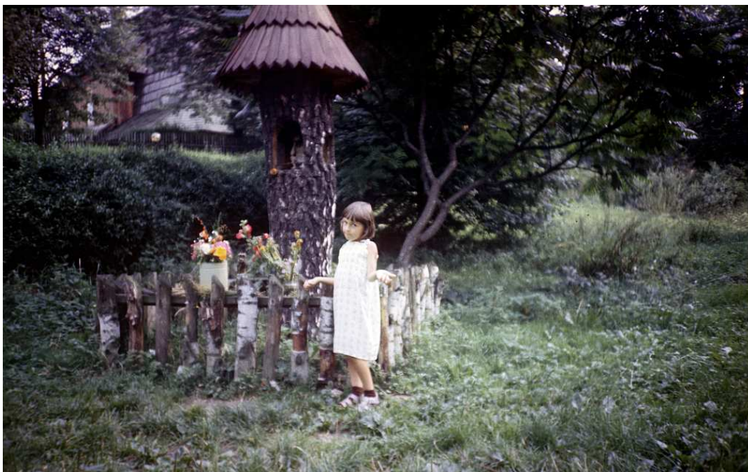
Fot. nr 48-50. Przed kapliczką przy drodze do kościołka na Woli. Lato 1986.