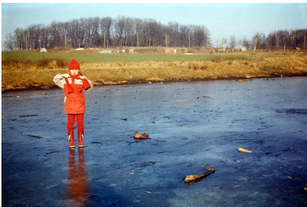
Fot. nr 170. Zima 1988/89.