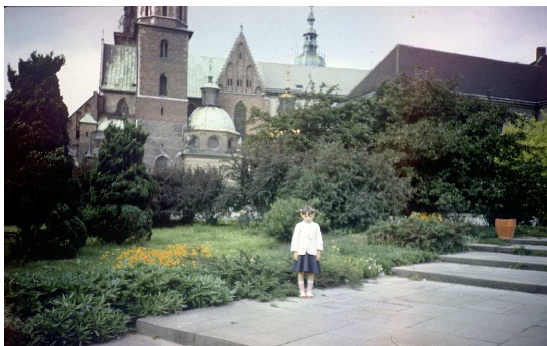
Fot. nr 9. Lato 1986.