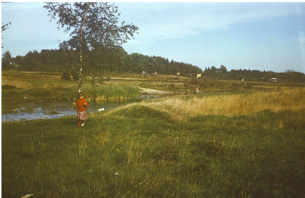
Fot. nr 167. Jesień 1988.