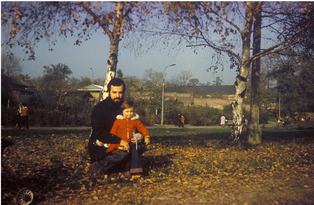
Fot. nr 147. Wspomnienie ogródków działkowych z sąsiedztwa Parku Jerzmanowskich i pętli tramwajowej z Prokocimiu. Jesień 1983.