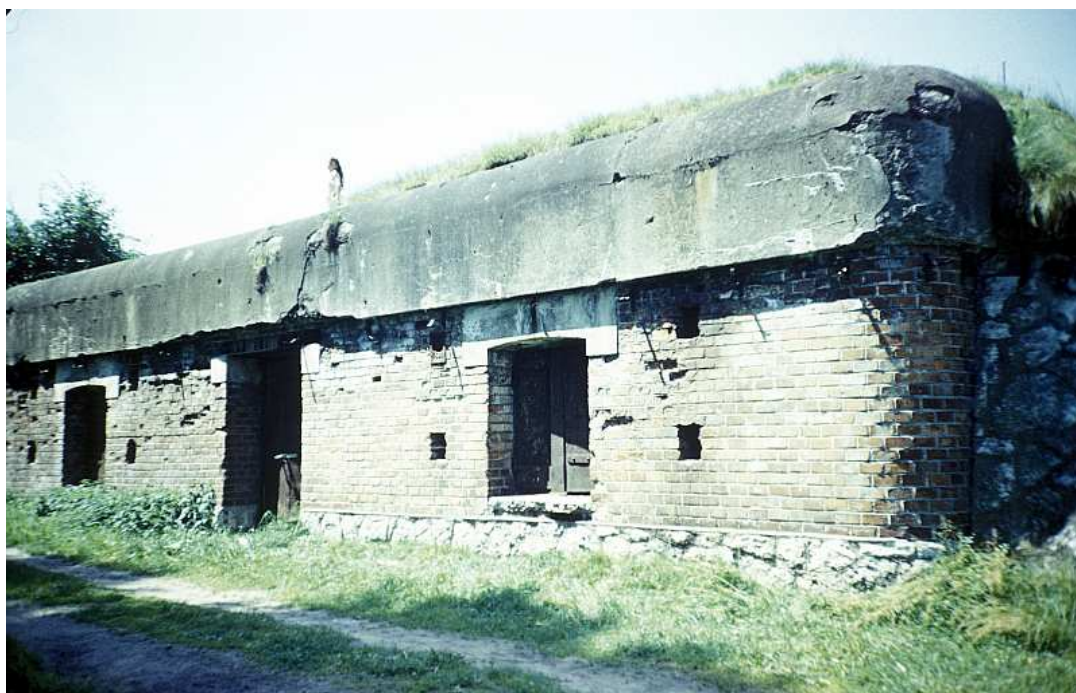
Fot. nr 208. Bronowicki schron szafca piechoty nr 41. Lato 1988.