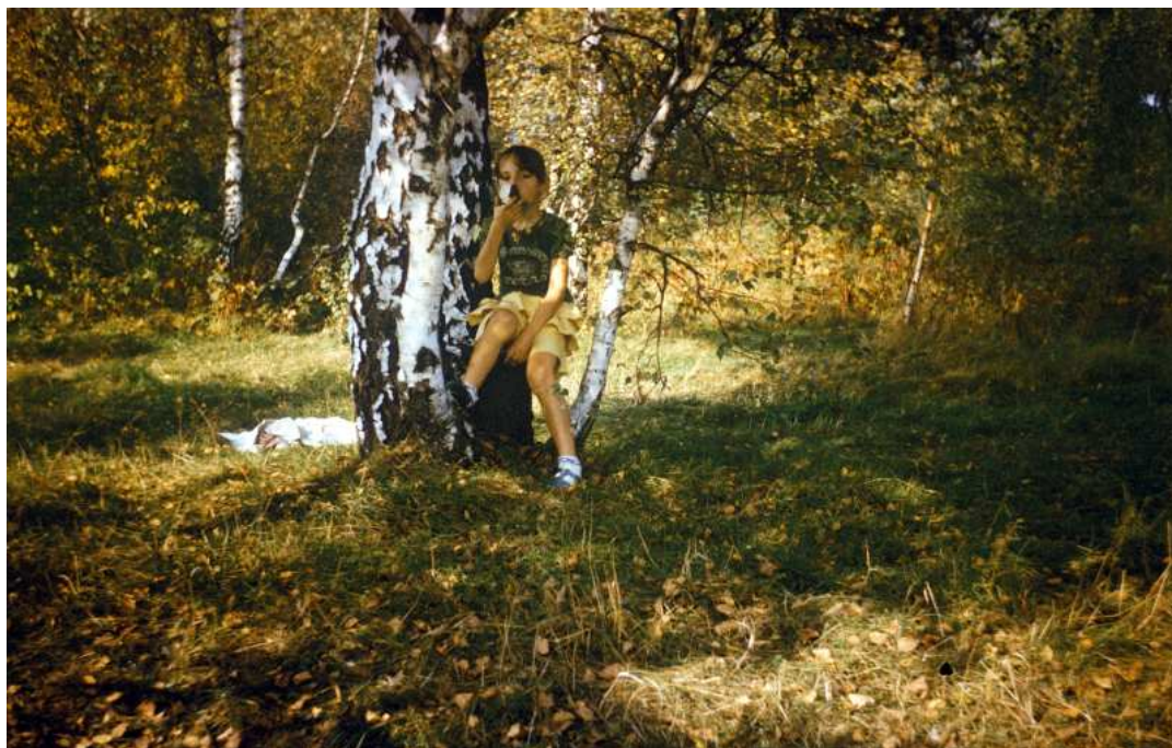
Fot. nr 183. Jesień 1988.