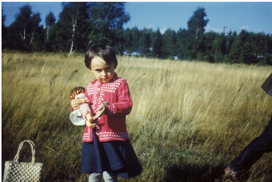
Fot. nr 179. Wrzesień 1983.