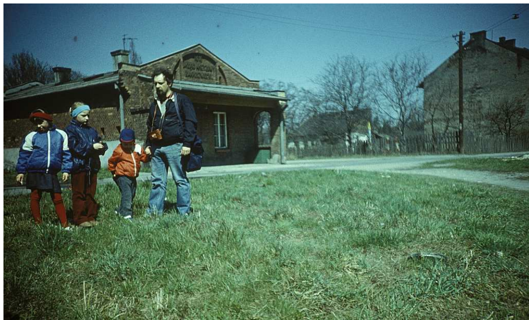
Fot. nr 83. Wiosna 1988.