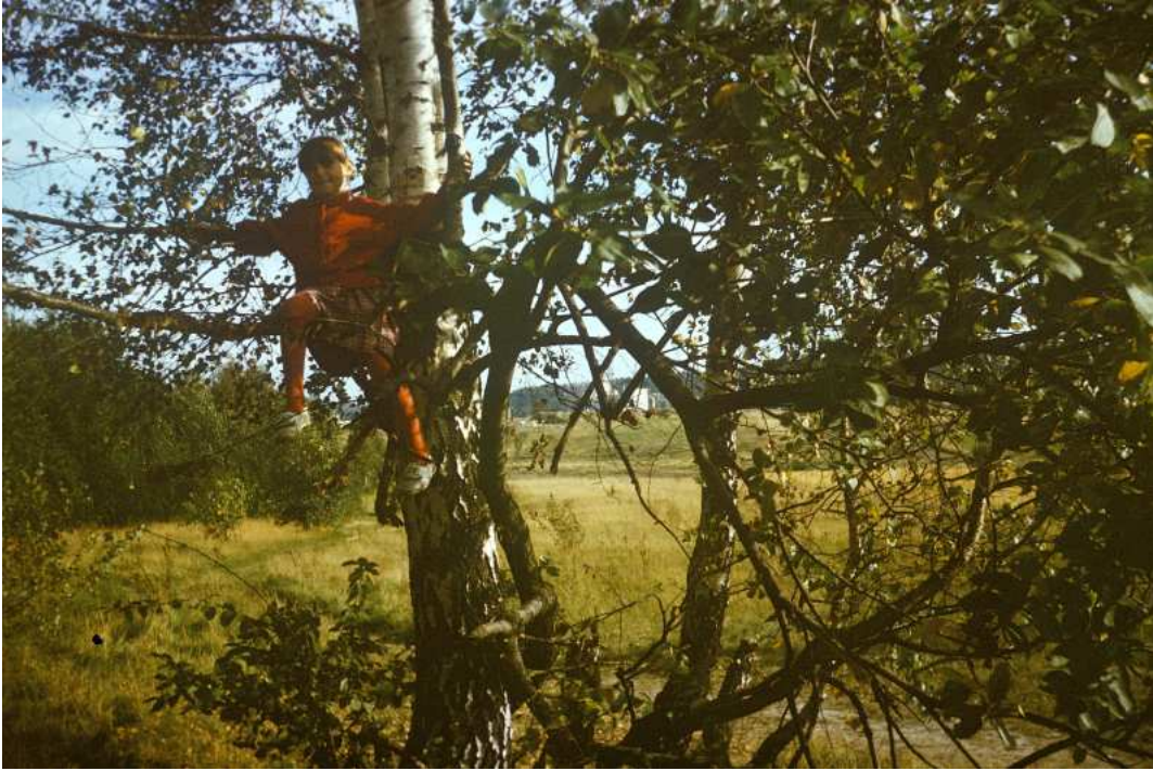
Fot. nr 177. Wątła jeszcze brzoza na skraju wyciętego lasu i ogródków działkowych. Jesień 1988