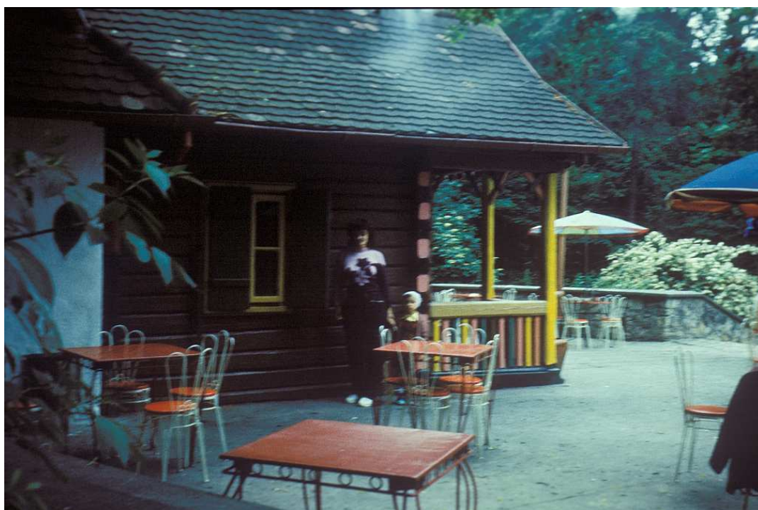
Fot. nr 59. Jesień 1983.