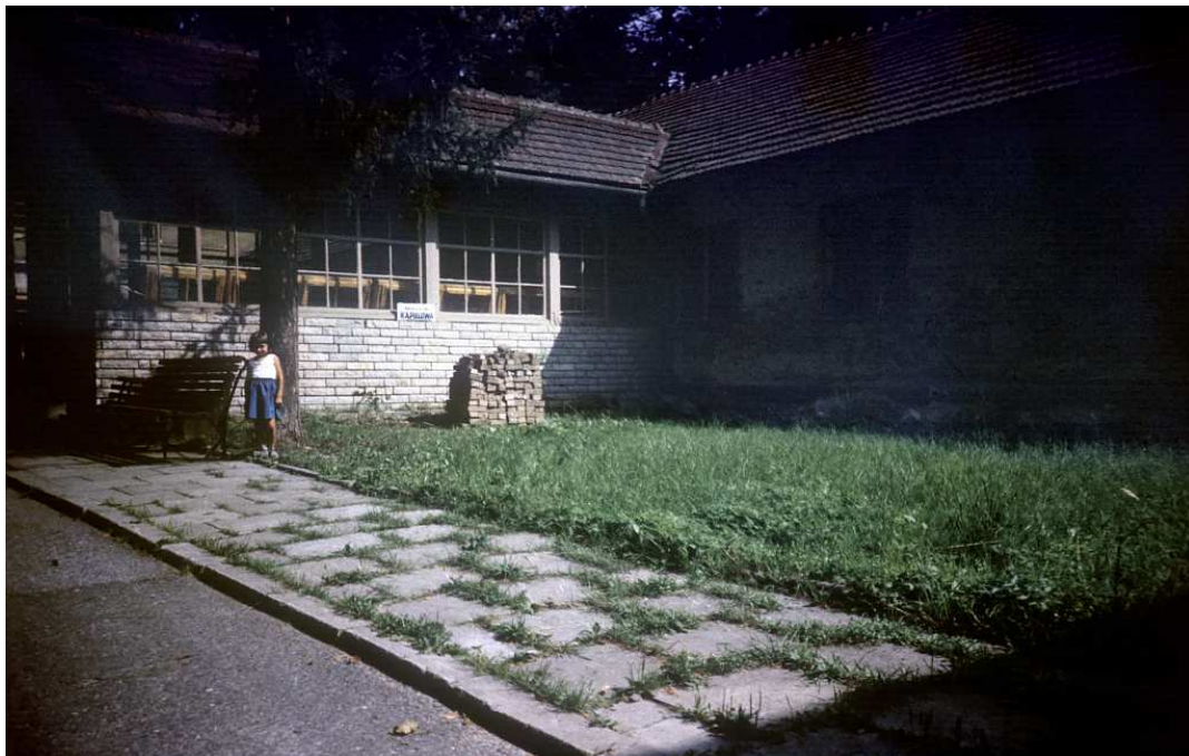
Fot. nr 196. Sierpień 1986.