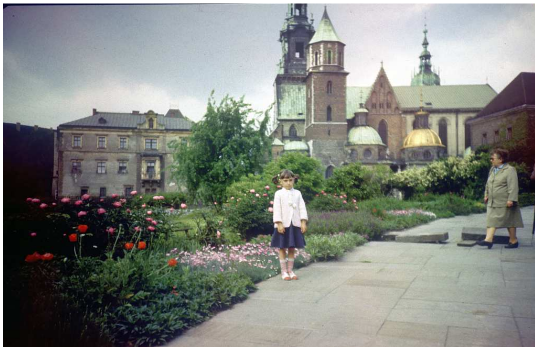
Fot. nr 8. Lato 1986.