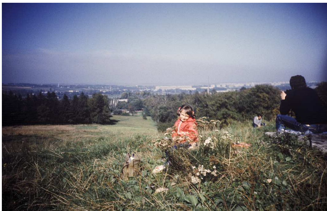
Fot. nr 55. Ujęcie ze szczytu Wesołej Polany. Lato 1986.