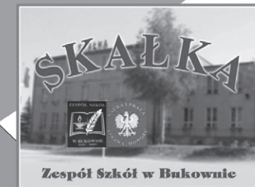
Zespół Szkół w Bukownie

Jedyna szkoła gastronomiczna w powiecie olkuskim