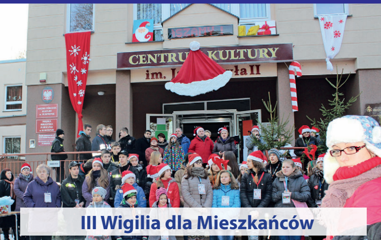
III Wigilia dla Mieszkańców