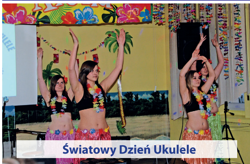
Światowy Dzień Ukulele