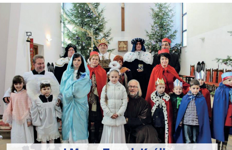
I Marsz Trzech Króli