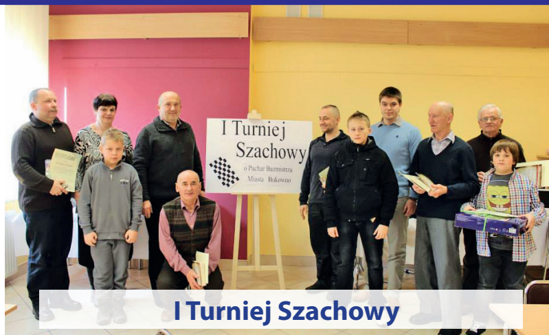
I Turniej Szachowy