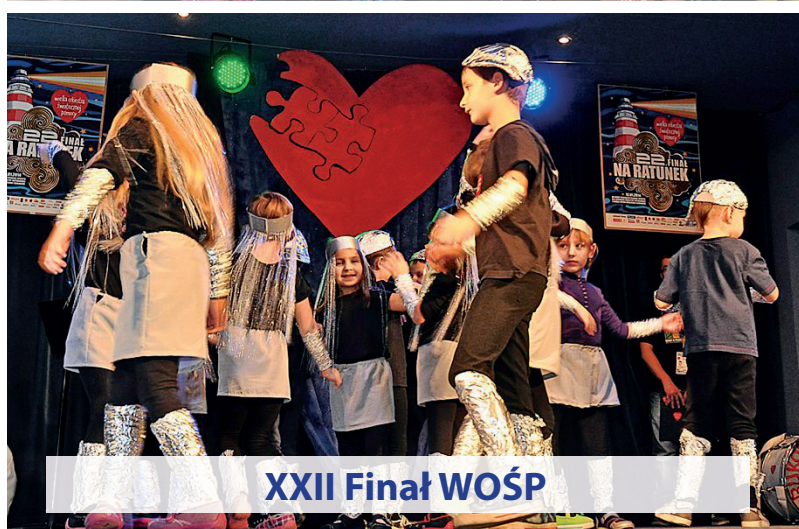
XXII Finał WOŚP