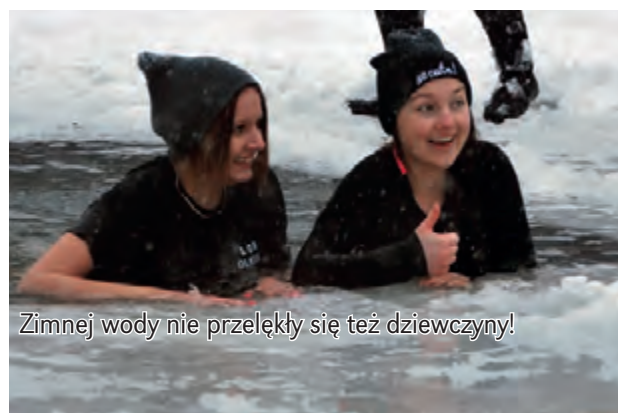
Zimnej wody nie przelewały się też dziewczyny!