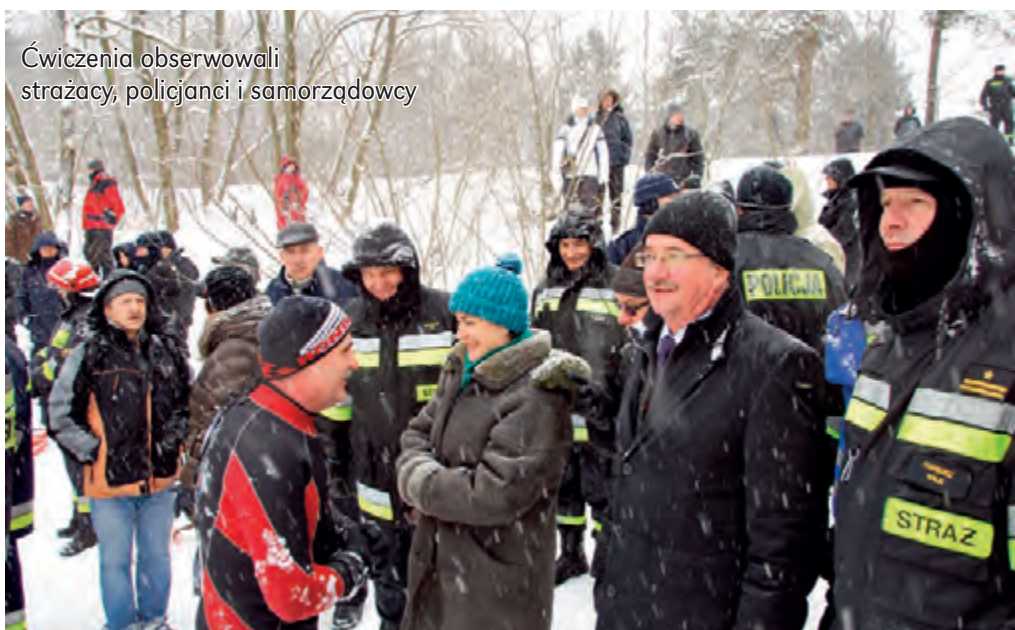
Ćwiczenia obserwowali strażacy, policjanci i samorządowcy