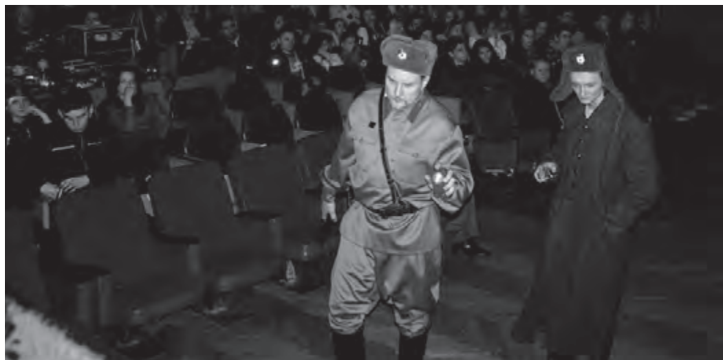
„Nocny” obchód sowieckich strażników. Przechodzą między rzędami krzesel, świecąc widzom latarkami prosto w twarze

W realia rosyjskiego obozu jenieckiego, w 1940 rok przenosi się współczesna polska dziewczyna, licealistka o imieniu Natasza. Prowadzi tam rozmowy z młodym mężczyzną Staszkiem, jeńcem, żołnierzem Wojska Polskiego. Od niego dowiaduje się, w jaki sposób on i tysiące jego kolegów, znaleźli się w obozie radzieckim i jakby nie dowierzając, sprawdza i uzupełnia te wiadomości z internetu, w laptopie, który ma ze sobą. Natasza rozmawia również z oprawcą obozowym, Iwanem, sowieckim żołnierzem. Później jest także przez niego przesłuchiwana. Przez tę wyprawę w przeszłość uprzytomnia sobie, jak bezwzględny los spotkał polskich jeńców wojennych, za-