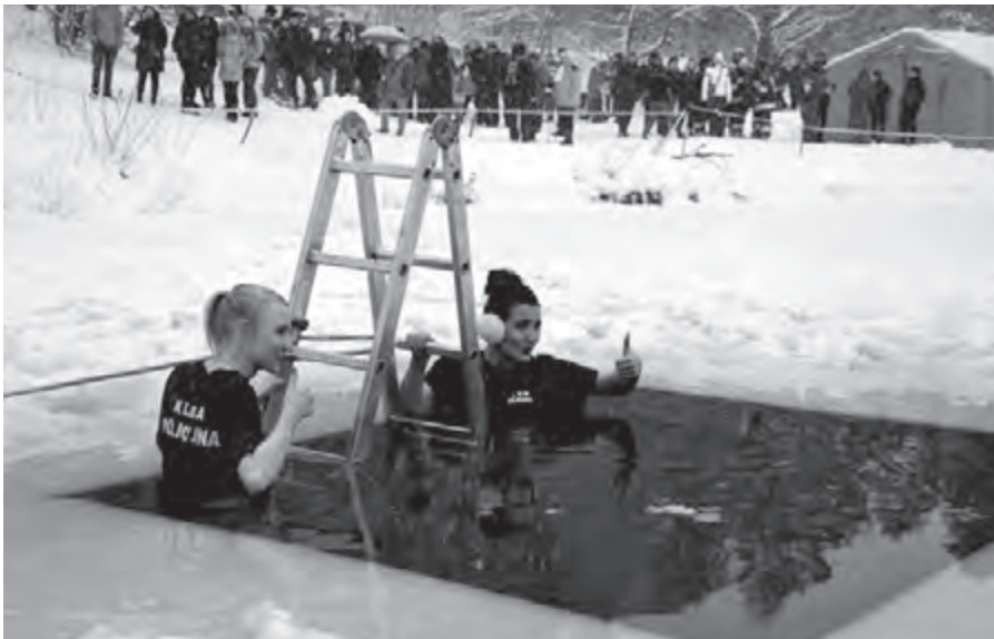
W KLUCZACH ODBYŁY SIĘ POKAZY RATOWNICTWA LODOWEGO. NIE ZABRAKŁO TEŻ CHĘTNYCH DO MORSOWANIA!