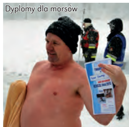
Dyplomy dla morsów