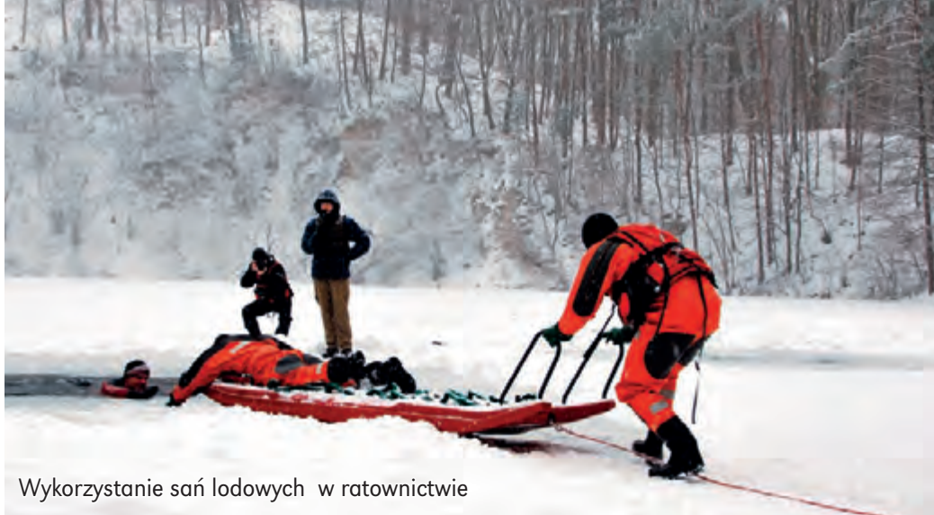
Wykorzystanie sań lodowych w ratownictwie