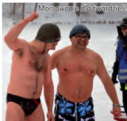
Morsowanie dla twardzieli!