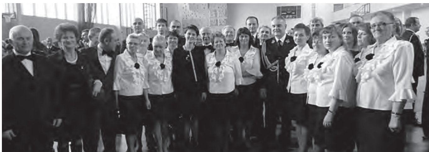
„Rodaczanie” na opłatku strażaków z Małopolski. W środku Waldemar Pawlak, były premier, prezes zarządu głównego OSP.