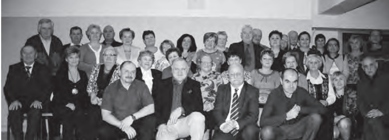
Uczestnicy spotkania jubileuszowego Koła PTTK