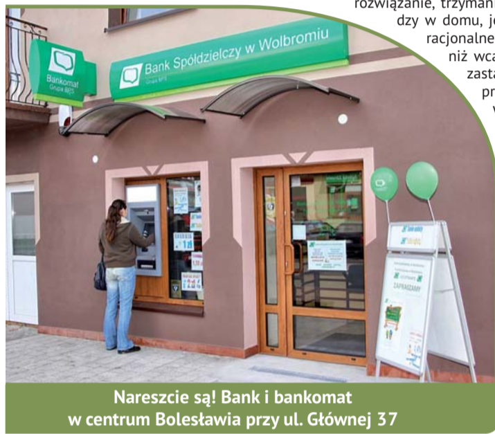
Nareszcie są! Bank i bankomat w centrum Bolesławia przy ul. Główniej 37