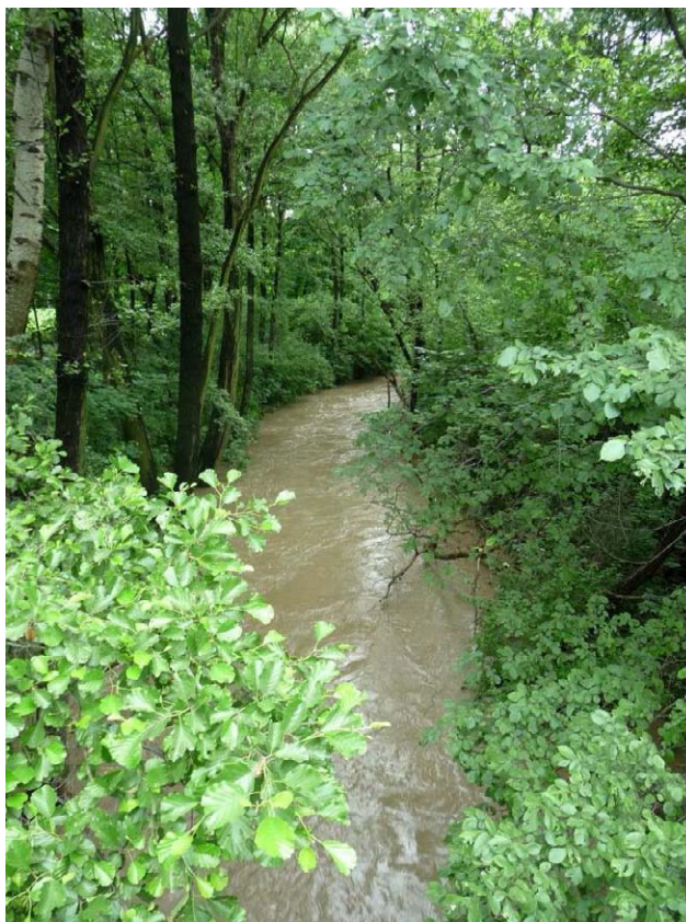
Fot. nr 48. Mętny nurt Dłubni. (25.06.13)