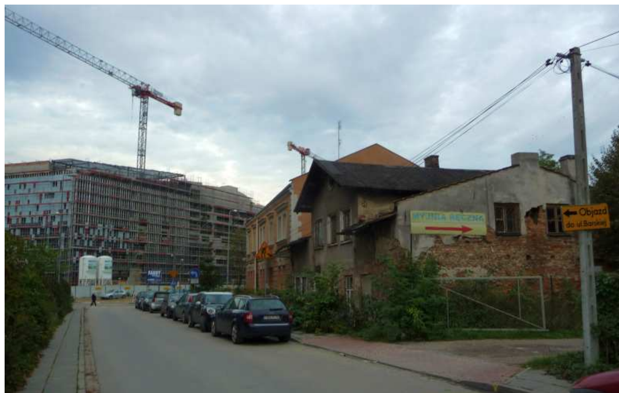
Fot. nr 120 (120-121). Z gigantem nowo powstającego Centrum Kongresowego w tle. (25.09.13)