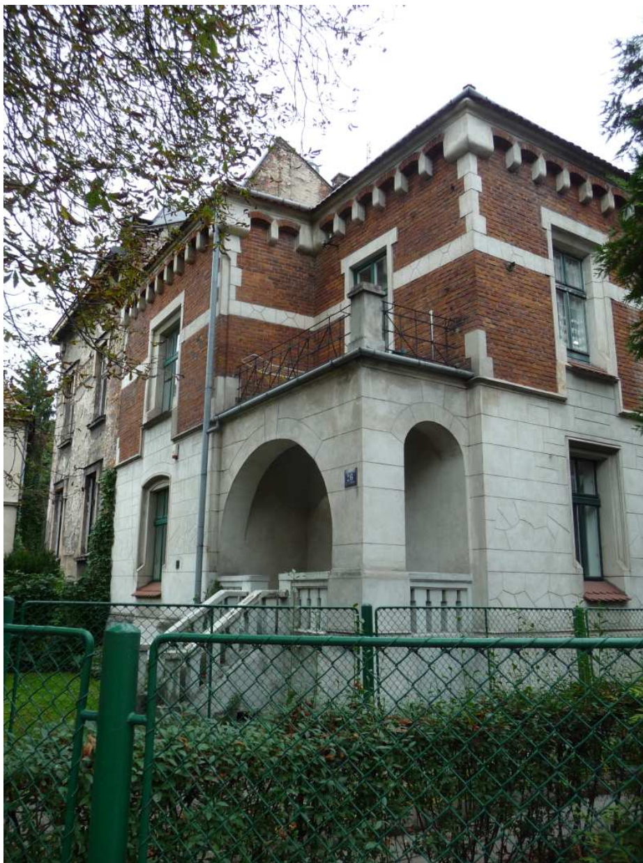
Fot. nr 66. Eklektyczna willa aptekarza Mieczysława Maślowskiego z ulicy Barskiej 26, wybudowana wg projektu Romana Bandurskiego. (25.09.13)