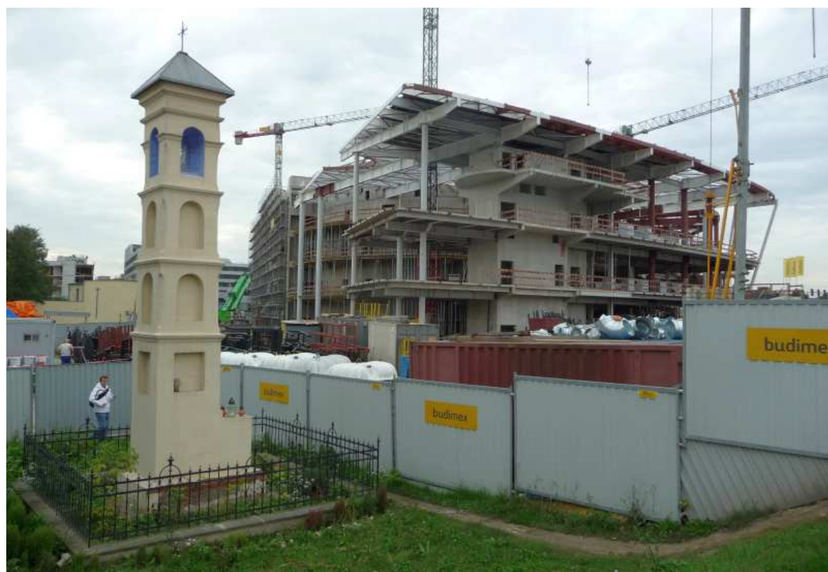
Fot. nr 112 (112-115). Zanikanie klimatu dawnego Zakrzówka. W tle nowo powstający gigant Centrum Kongresowego. (25.09.13)