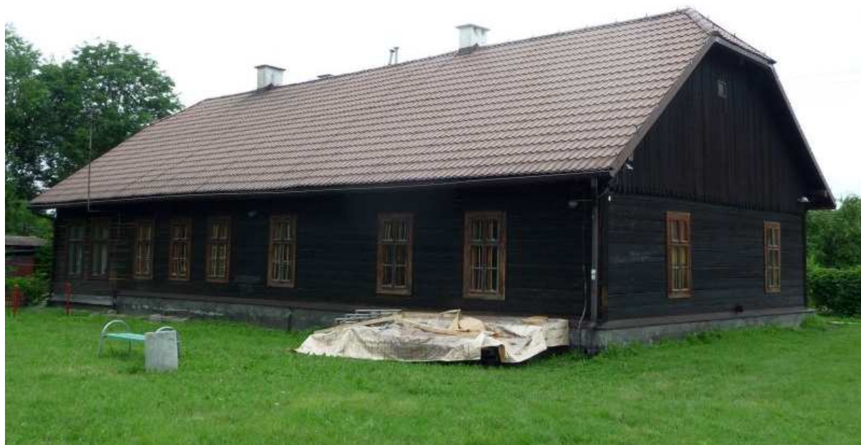
Fot. nr 41. Widok od strony podwórka. (25.06.13)