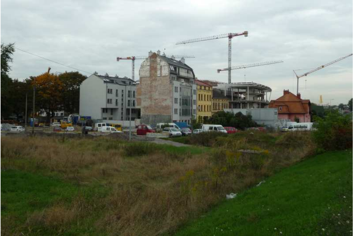
Fot. nr 97 (97-100). Fragment przebudowywanego odcinka ulicy Barskiej o numerach: 57-61. Kamienica pod nr 63 została właśnie wyburzona. (25.09.13)