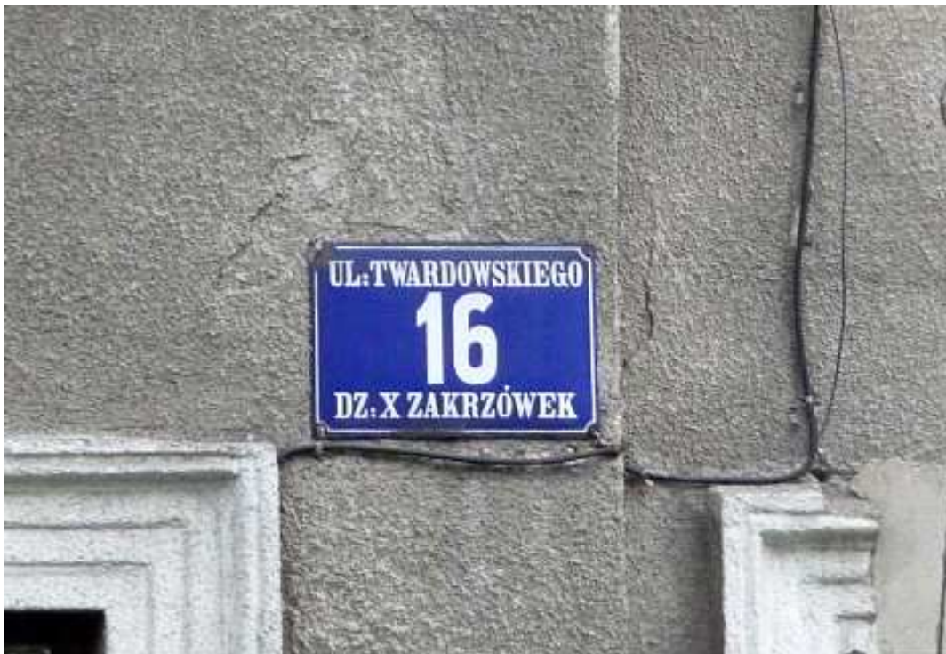
Fot. nr 125. Tabliczka z czasów Wielkiego Krakowa. (25.09.13)