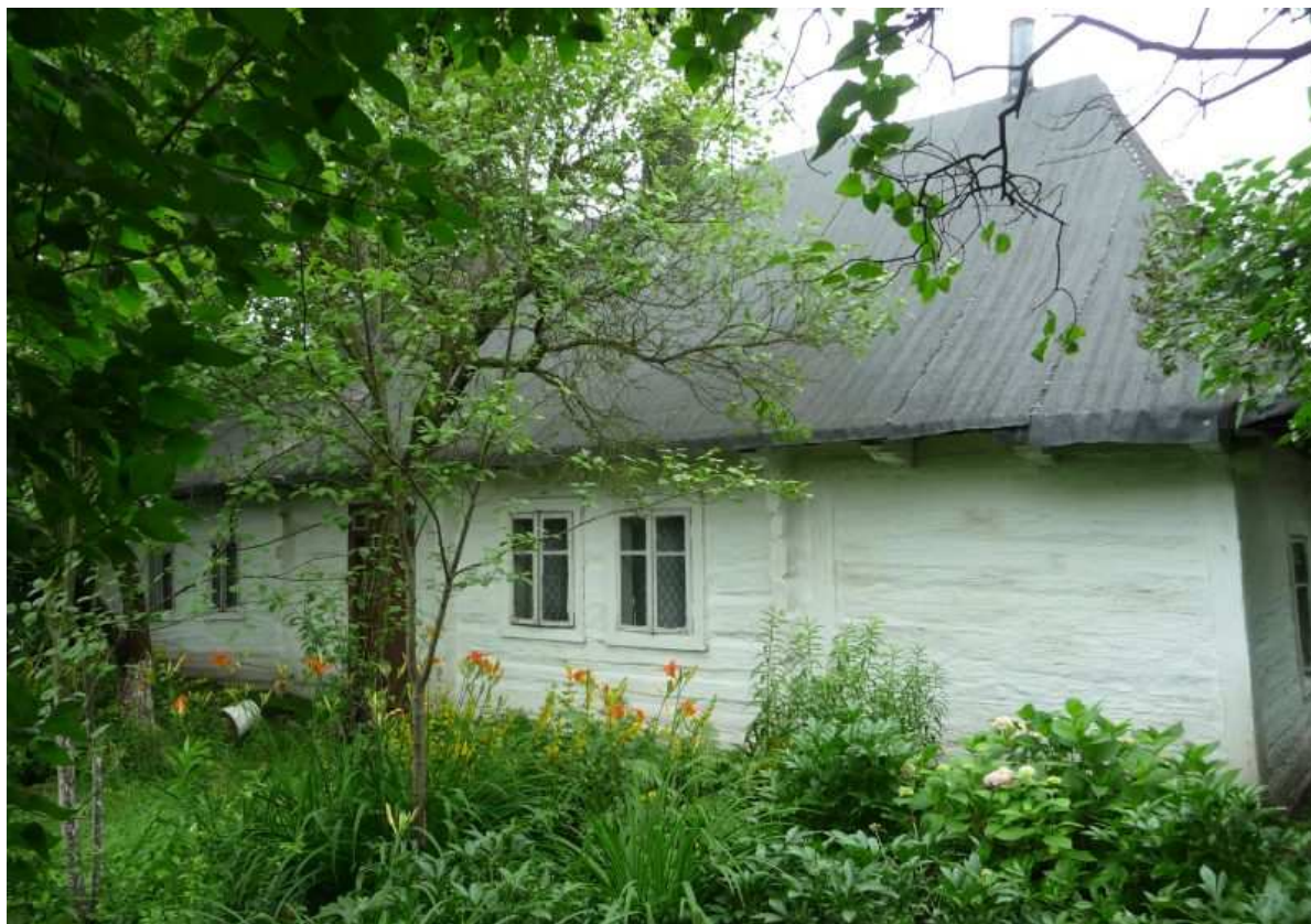
Fot. nr 17 (17-19). Fasada chałupy od strony ulicy PCK. (25.06.13)