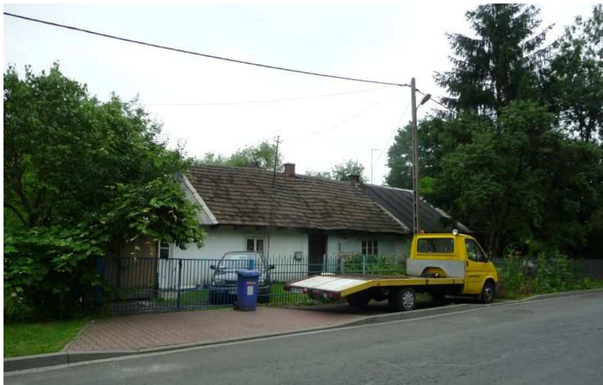
Fot. nr 27 (27-29). Bliska oryginałowi chałupa spod nr 68 (?). (25.06.13)