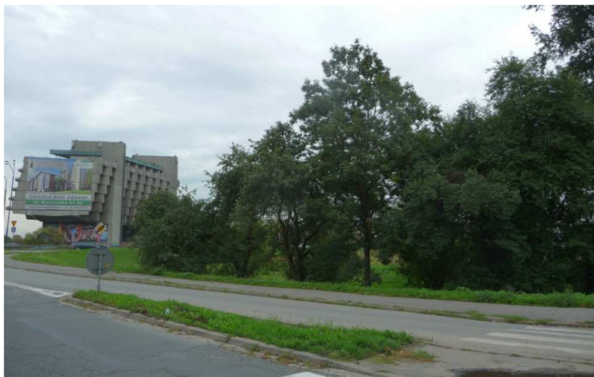
Fot. nr 132 (132-133). Widok od strony Osiedla Podwawelskiego. (25.09.13)