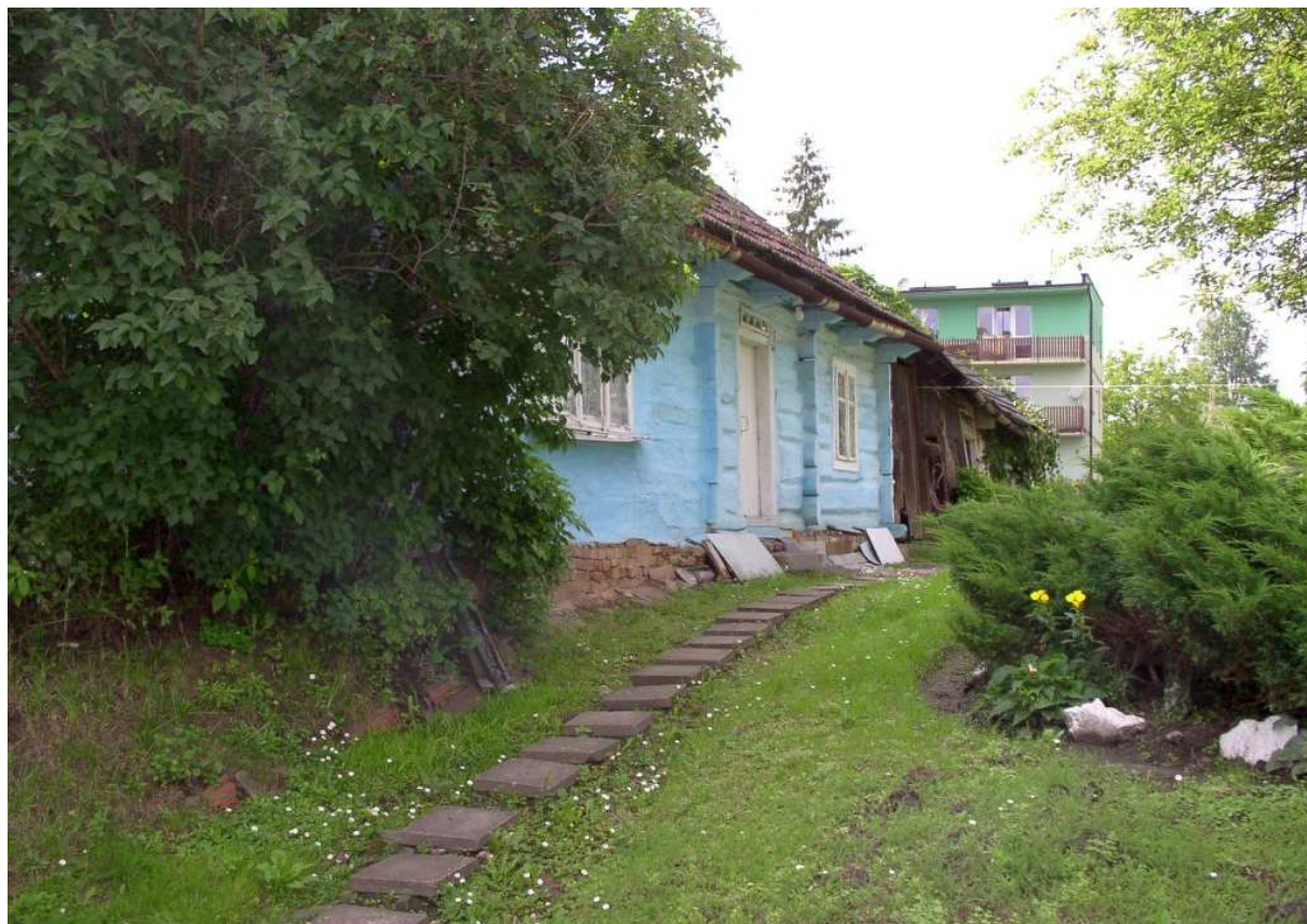
Fot. nr 21. Nieistniejący już antyk spod nr 160. (26.06.2009)