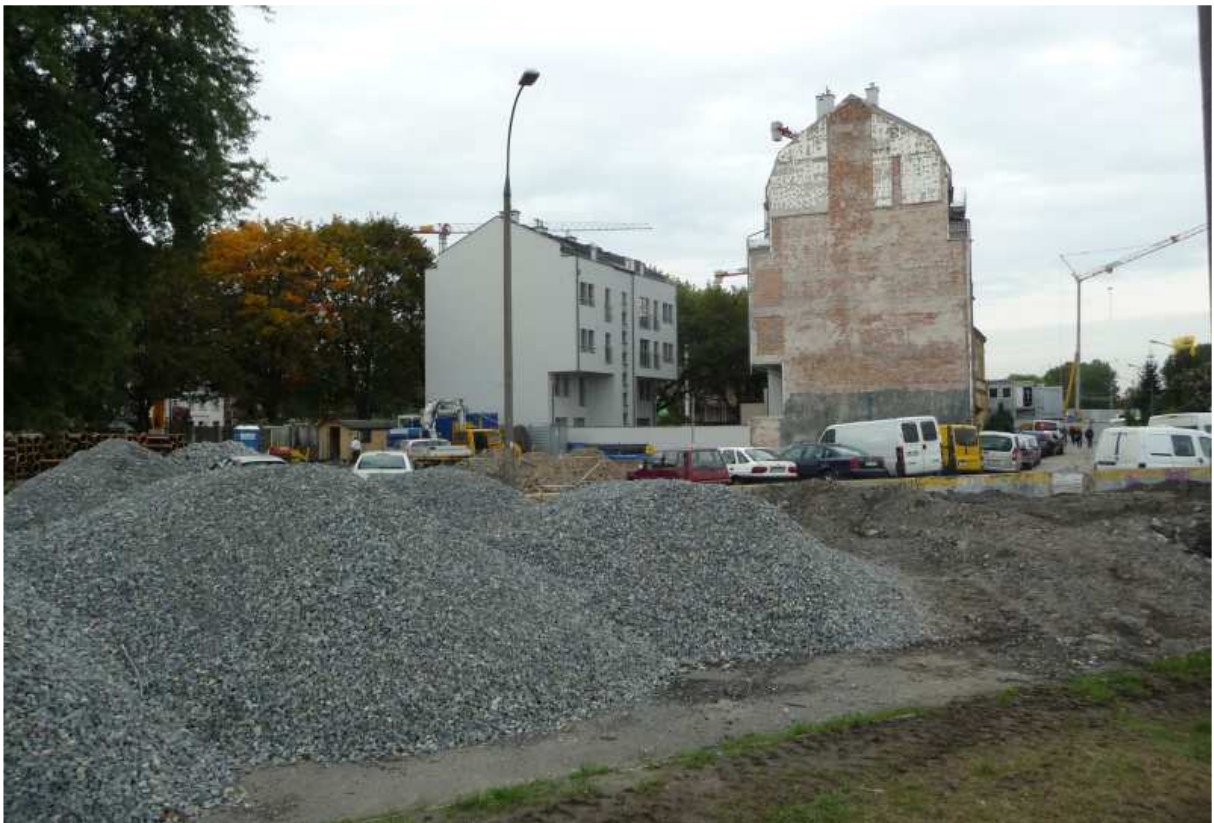
Fot. nr 98. Nowy budynek (z lewej) na tyłach kamienicy pod nr 61. (25.09.13)