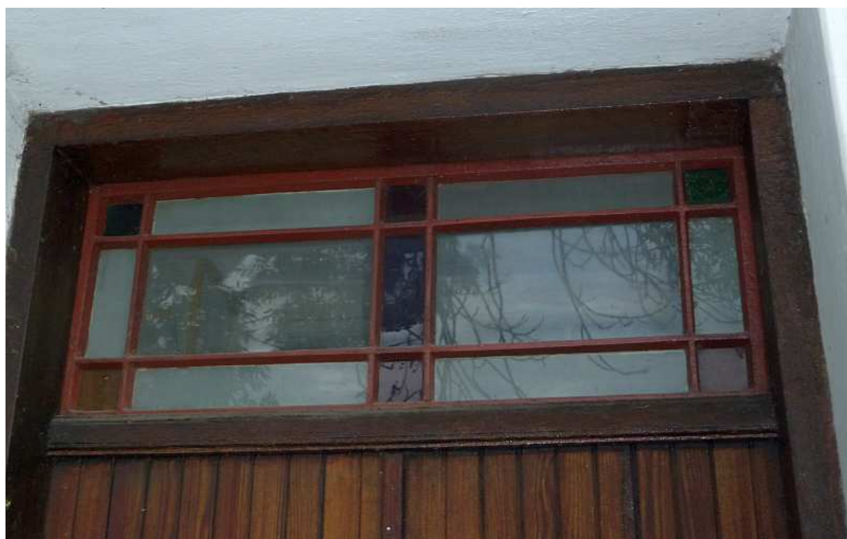
Fot. nr 56. Oryginalna mozaika nad drzwiami. (25.09.13)