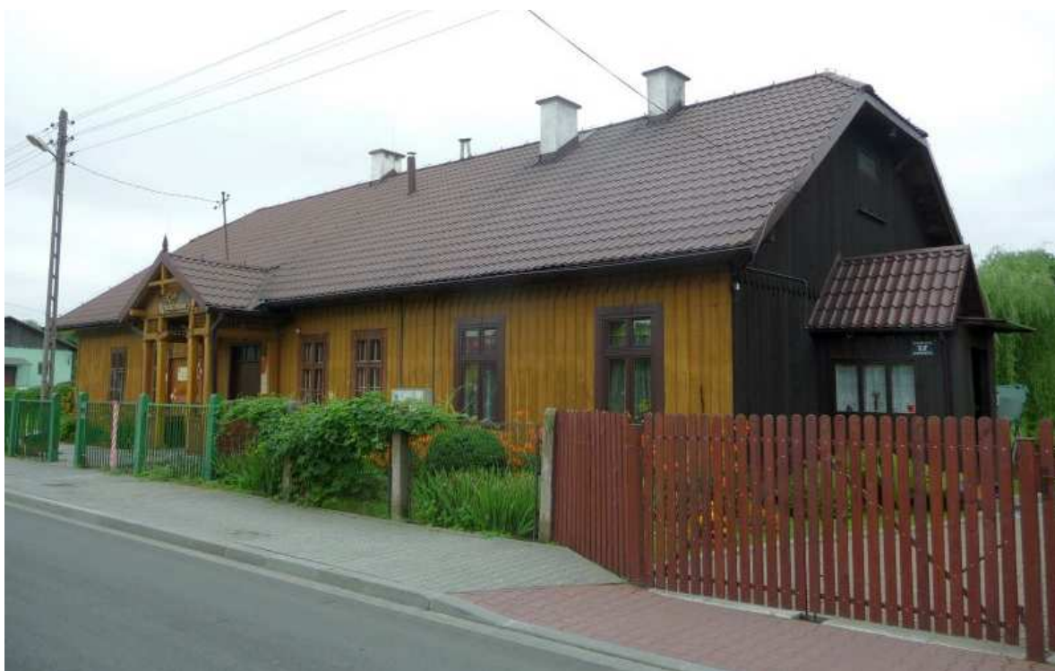
Fot. nr 38 (38-42). Dawny budynek szkoły z ulicy Wańkowicza 17, wybudowany przez Jana Matejkę pod koniec XIX-go wieku, gdzie dziś mieści się środowiskowy Klub Krzesławice. (25.06.13)