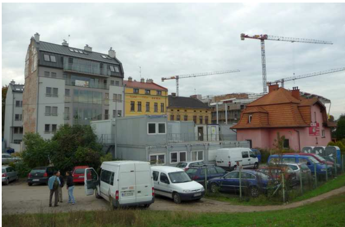
Fot. nr 100. Fragment o numerach: 57-61 i willa pod nr 60. W tle plac budowy Centrum Kongresowego. (25.09.13)