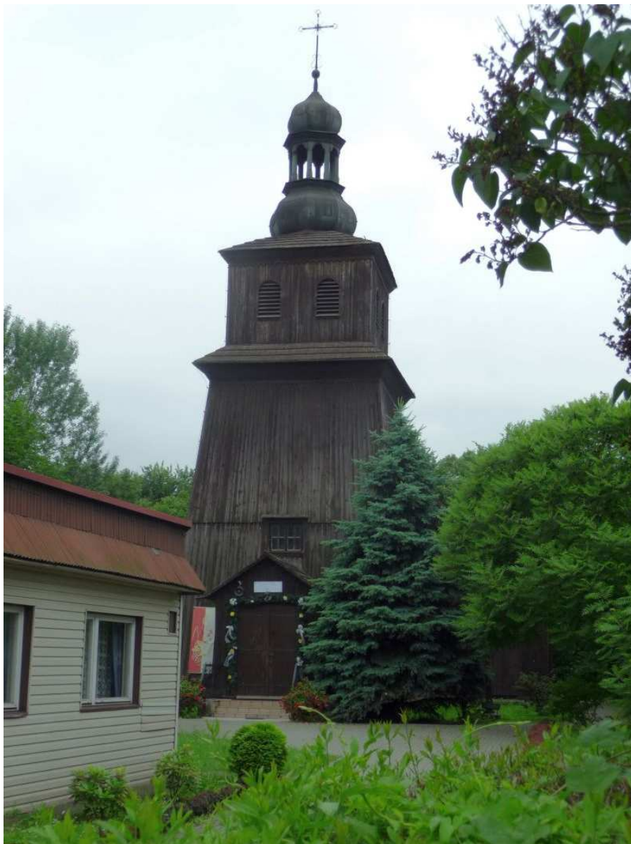
Fot. nr 36 (36-37). XVII-to wieczny kościółek p.w. Jana Chrzciciela, przeniesiony tu w latach 80-tych zeszłego wieku z Jawornika koło Myślenic. (25.06.13)