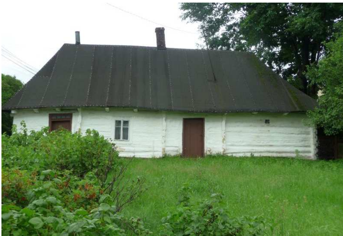
Fot. nr 13 (13-15). Widoki od strony ulicy Krasnowolskiego. (25.06.13)