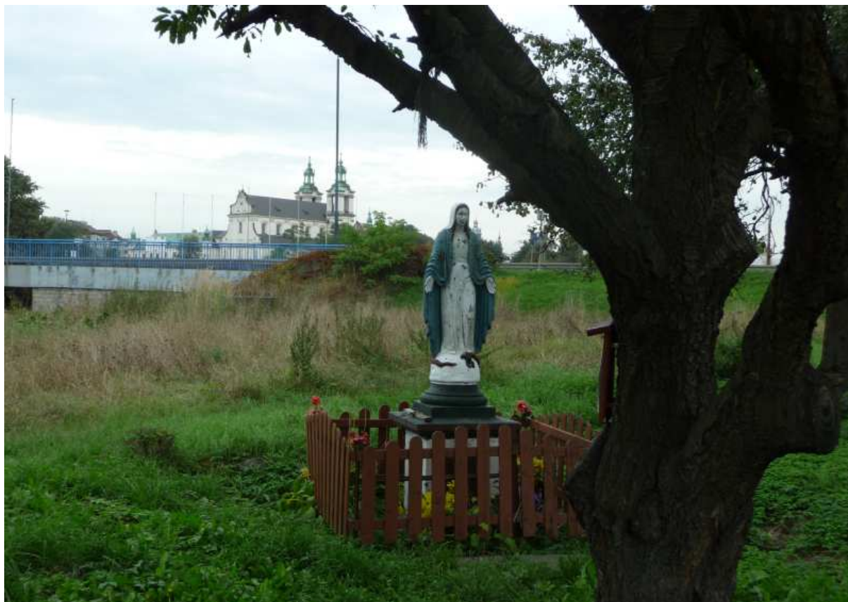
Fot. nr 95 (95-96). Widok w kierunku zespołu klasztorного Paulinów na Skalce. (25.09.13)