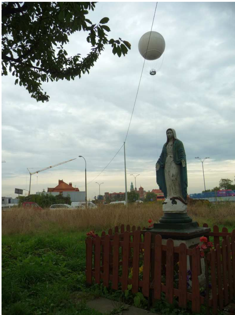
Fot. nr 90 (90-94). Widok z Wawelem w tle, który niebawem prawdopodobnie zostanie przesłonięty przez nową zabudowę, mającą powstać w miejscu i w sąsiedztwie Hotelu Forum. (25.09.13)