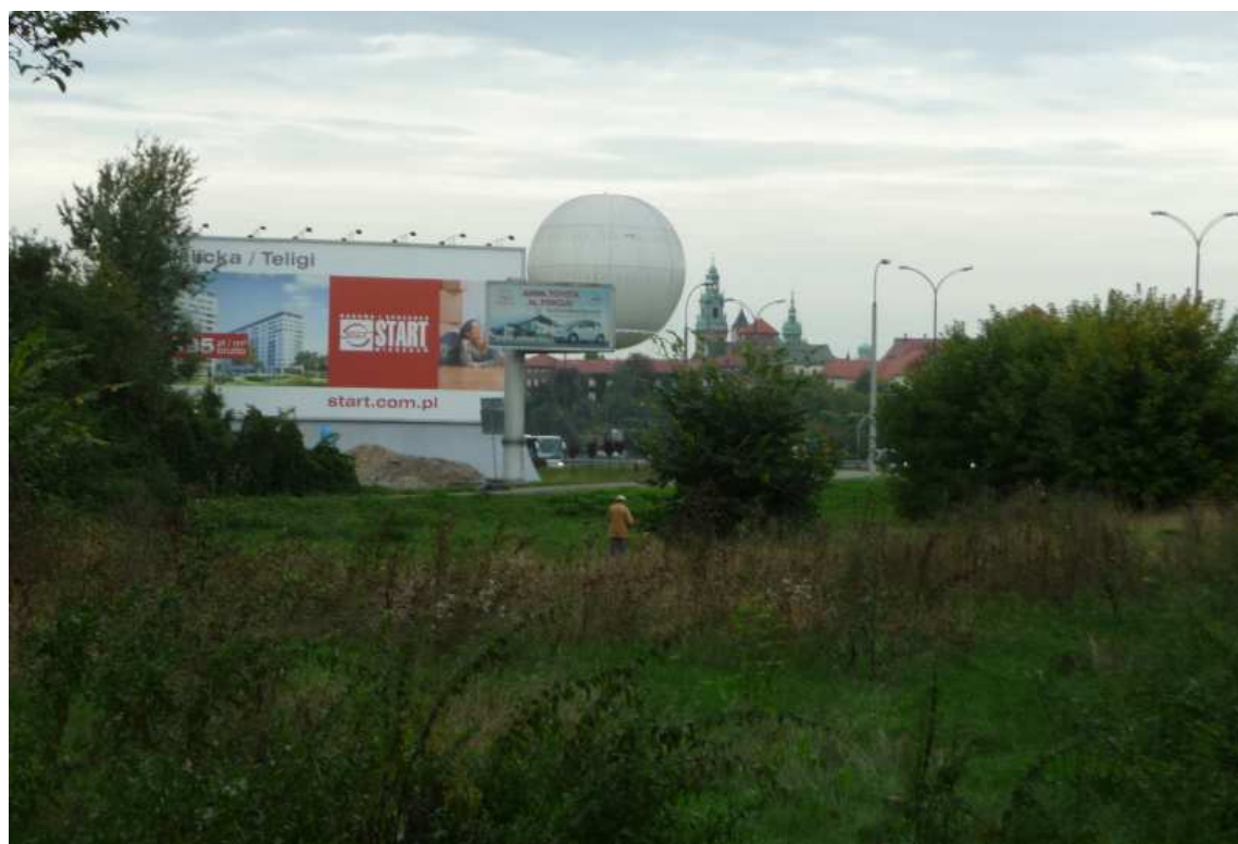
Fot. nr 77. Panorama Wawelu spod Hotelu Hilton Garden Inn. (25.09.13)