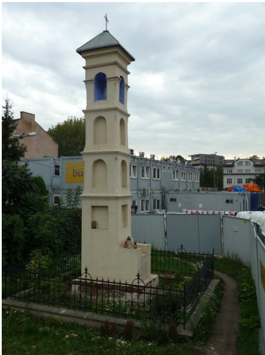
Fot. nr 113. Zabytkowa kapliczka z przełomu XVII-go i XVIII-go wieku, dawna latarnia strzegąca rozstaju lokalnych dróg bądź latarnia umarłych z pobliskiego cmentarza cholerycznego, przeniesiona tu niedawno z sąsiedztwa ulicy Bułhaka. (25.09.13)