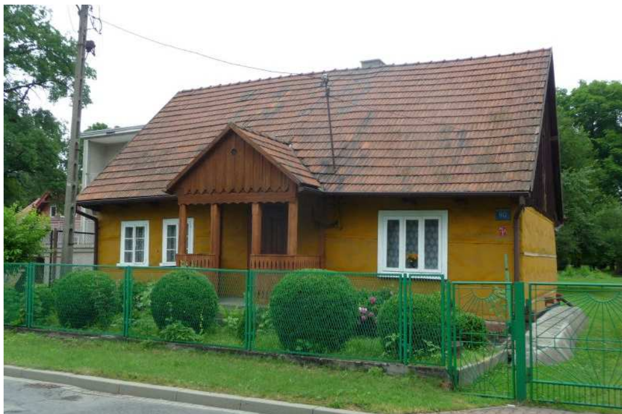
Fot. nr 25 (25-26). Skromny, podmiejski dworek z ulicy Wańkowicza 80. (25.06.13)