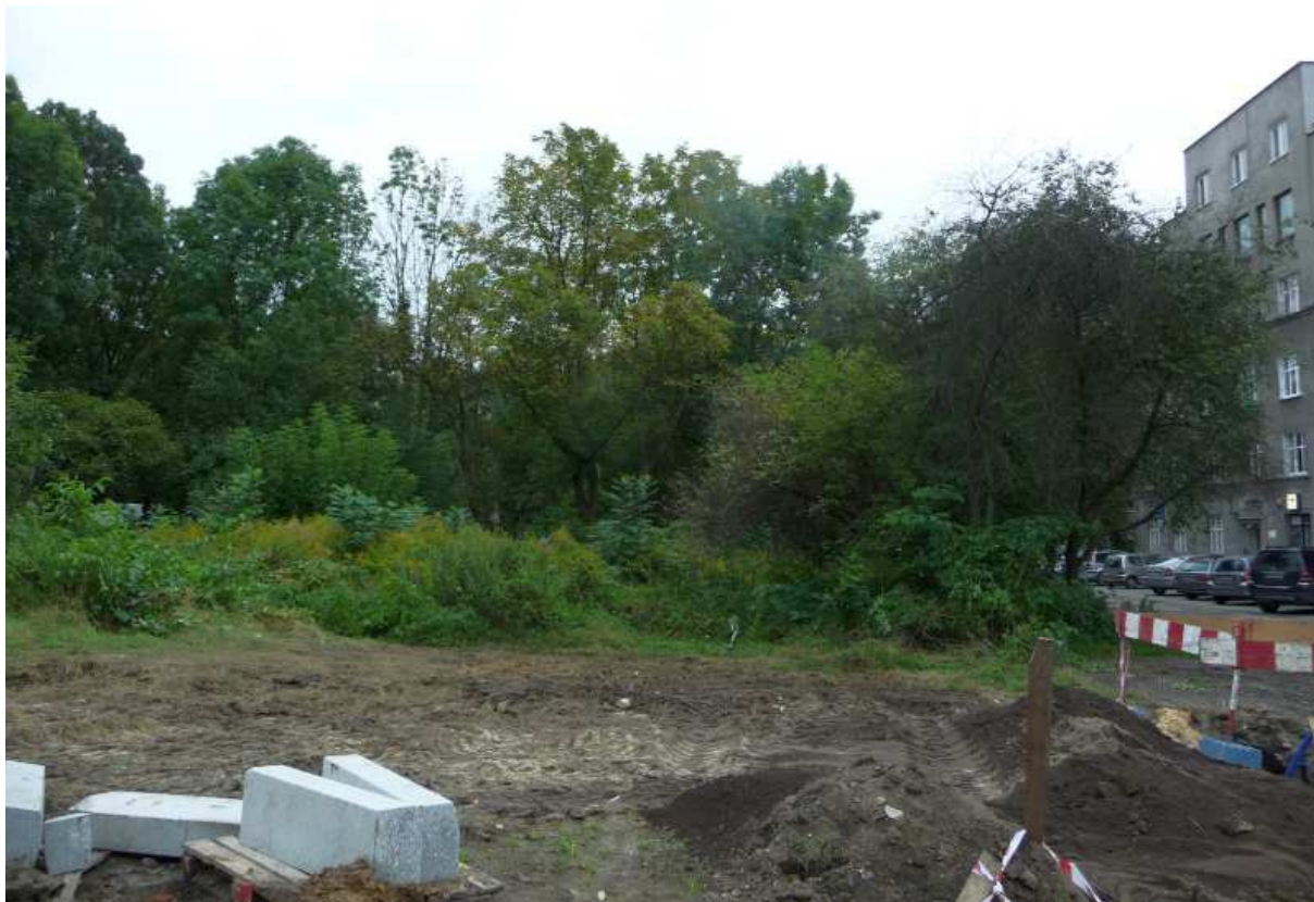
Fot. nr 101 (101-102). Resztki pacyfikowanych terenów zielonych w sąsiedztwie ulicy Na Ustroniu. (25.09.13)