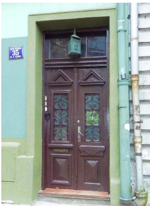
Fot. nr 73. Eklektyczne drzwi kamieniczki z ulicy Barskiej 35. (25.09.13)