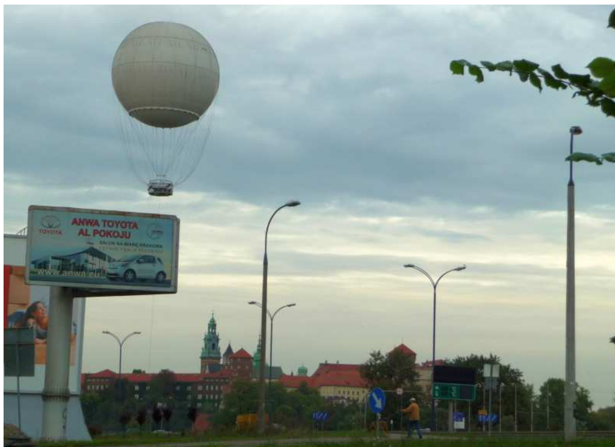
Fot. nr 78 (78-79). Panorama Wawelu – widok dogorywającej z łąki, zlokalizowanej na styku ulic: Barskiej i Konopnickiej. (25.09.13)