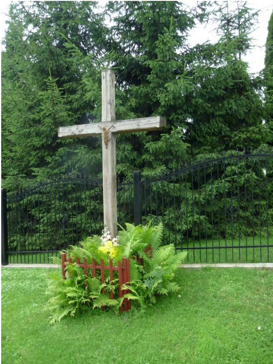
Fot. nr 1. Raczej współczesny krzyż z ulicy Wąwozowej, w narożu z ulicą PCK. (25.06.13)