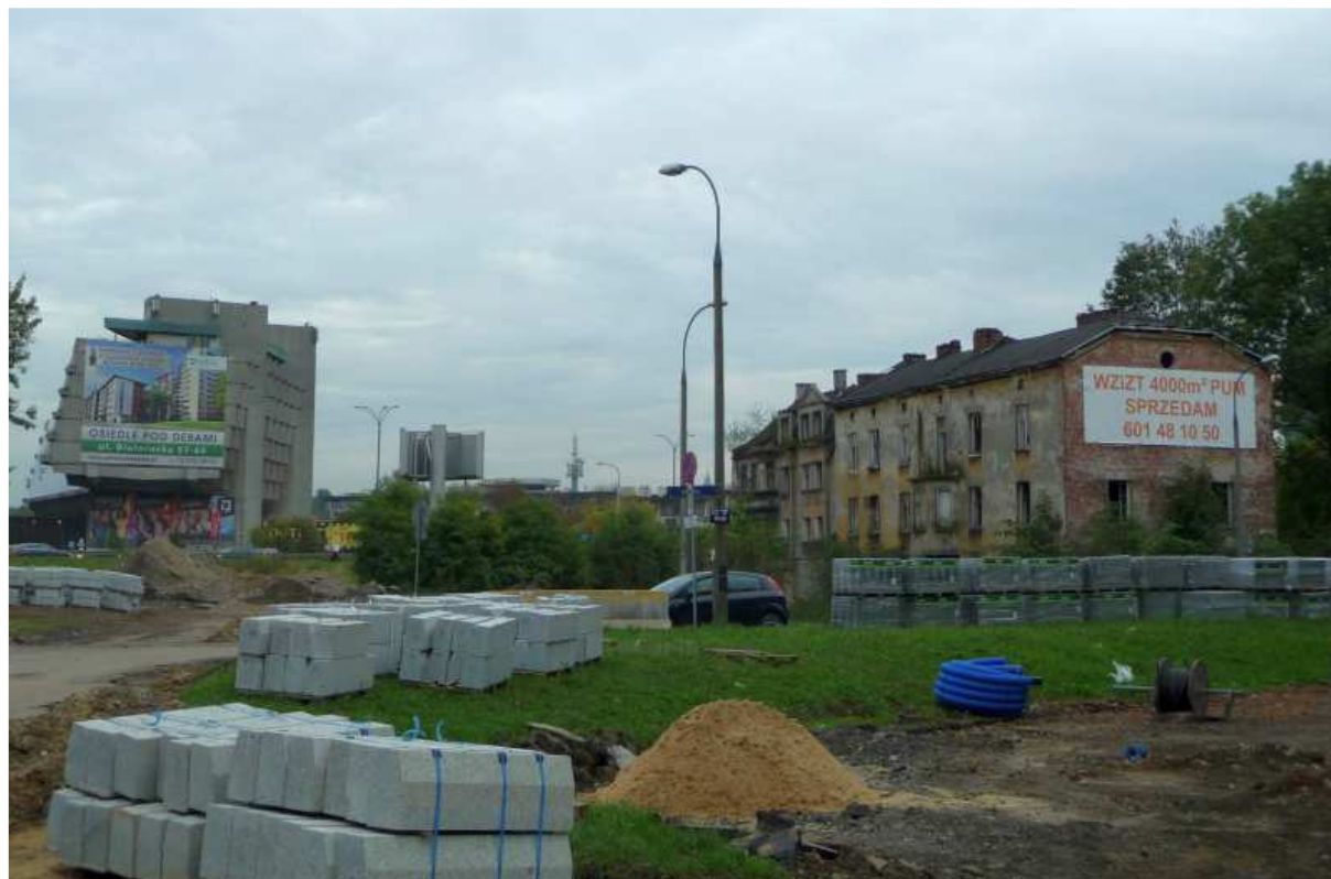
Fot. nr 86 (86-87). Ujęcia od strony ulicy Na Ustroniu. (25.09.13)