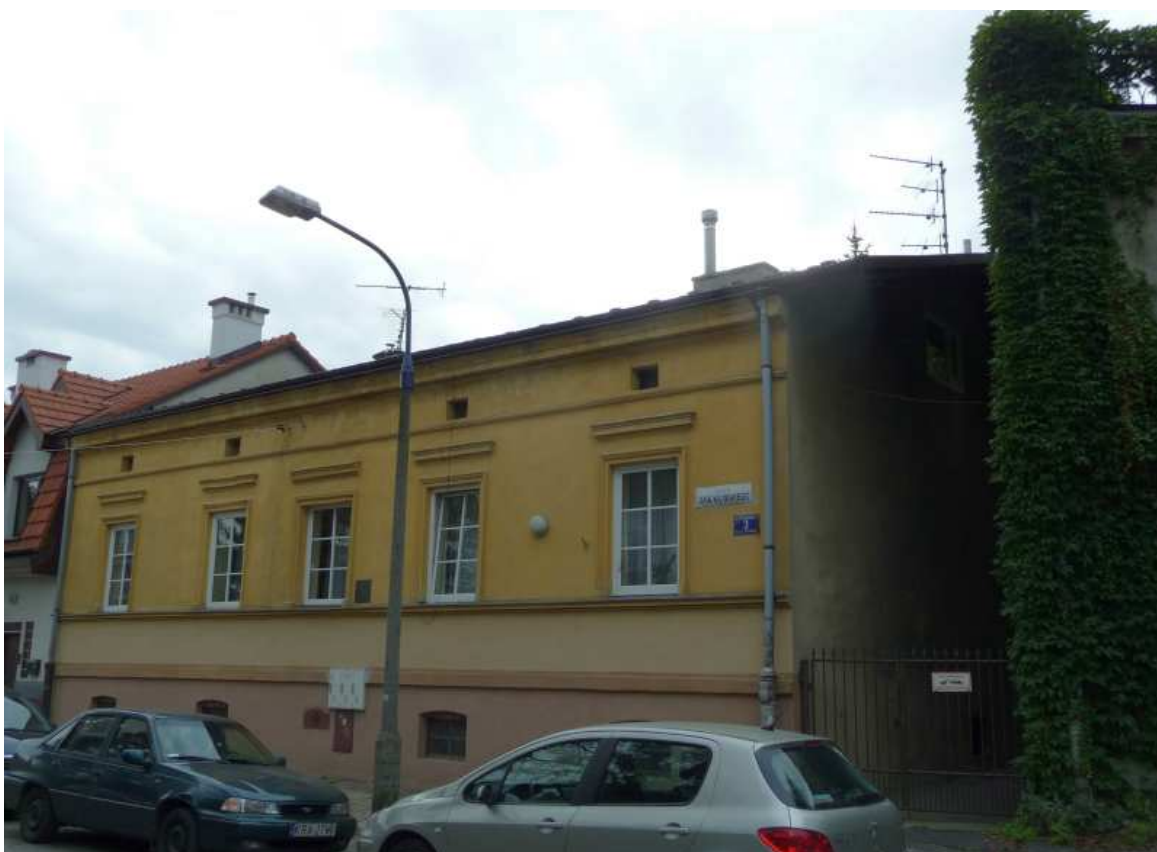
Fot. nr 61. Bliski oryginałowi podmiejski domek spod nr 3. (25.09.13)