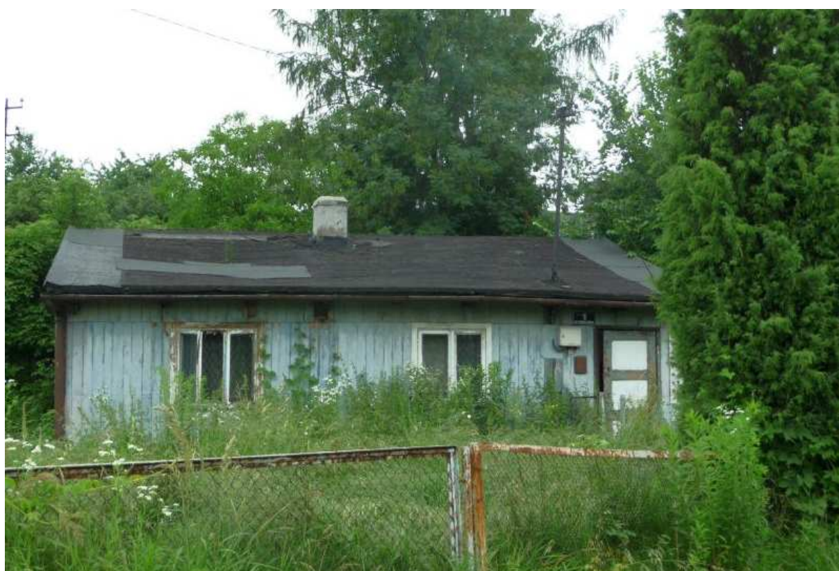
Fot. nr 33. Drewniana chałupa z ulicy Łempickiego 1. (25.06.13)