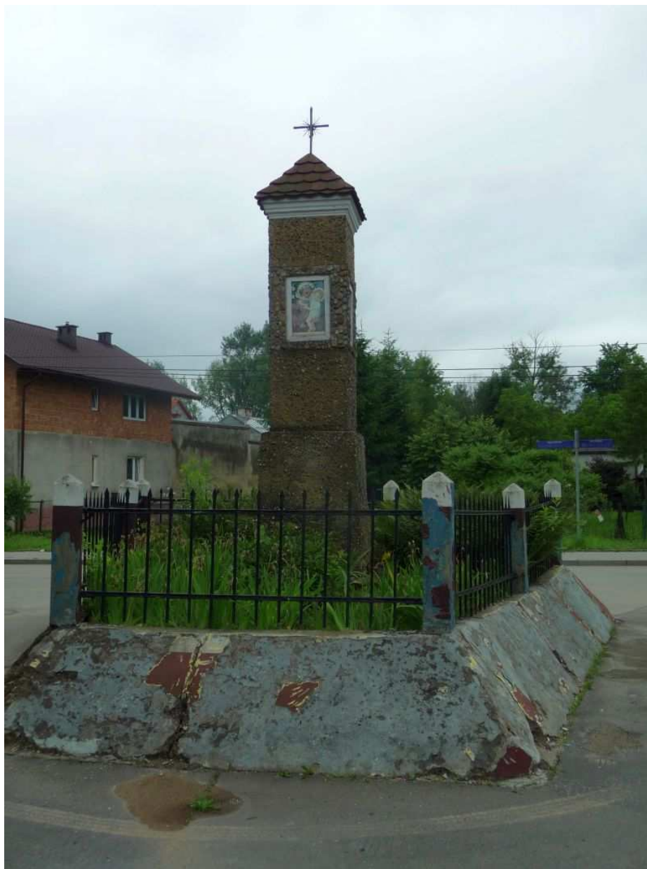
Fot. nr 5 (5-8). Raczej współczesna kapliczka na styku ulic: Wańkowicza i PCK. (25.06.13)