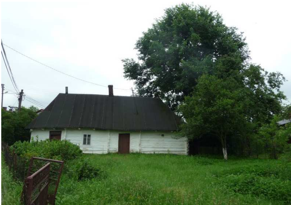
Fot. nr 12 (12-19). Chyba najlepiej zachowana chałupa z terenu dawnych Krzesławic; obiekt zapewne XIX-to wieczny, raczej spod nr 81 przy ulicy Wańkowicza, choć na tabliczce widnieje nr 51. (25.06.13)