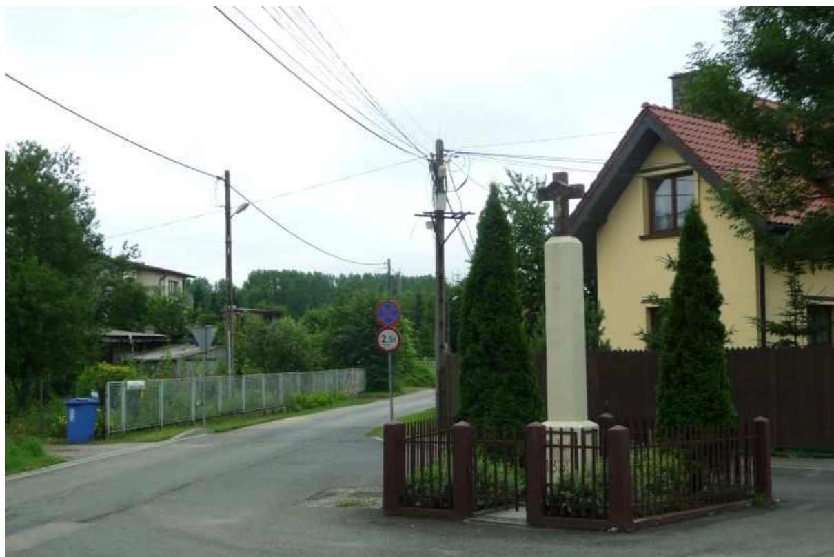
Fot. nr 30 (30-32). Skrzyżowanie ulic: Wańkowicza i Łempickiego. Na cyplu stoi współcześnie odnowiony krzyż, pierwotnie z 4-go maja 1839-go roku. (25.06.13)