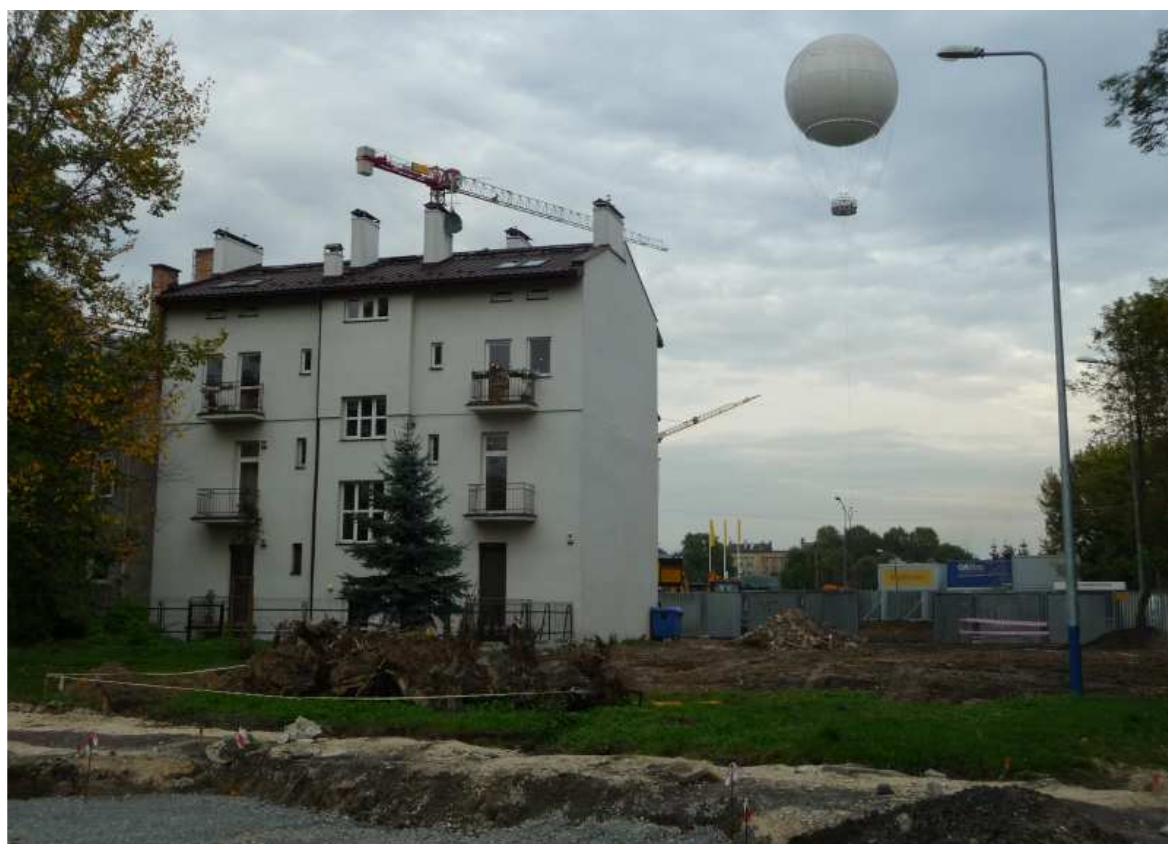
Fot. nr 106 (106-110). Obrzeże ulicy Bułhaka i Centrum Kongresowego po masowej wycince drzew. (25.09.13)