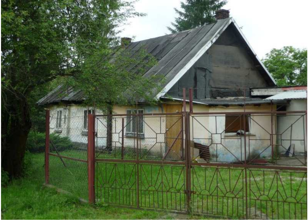
Fot. nr 3 (3-4). Relikt dawnej zabudowy z ulicy PCK (nr 1?). (25.06.13)