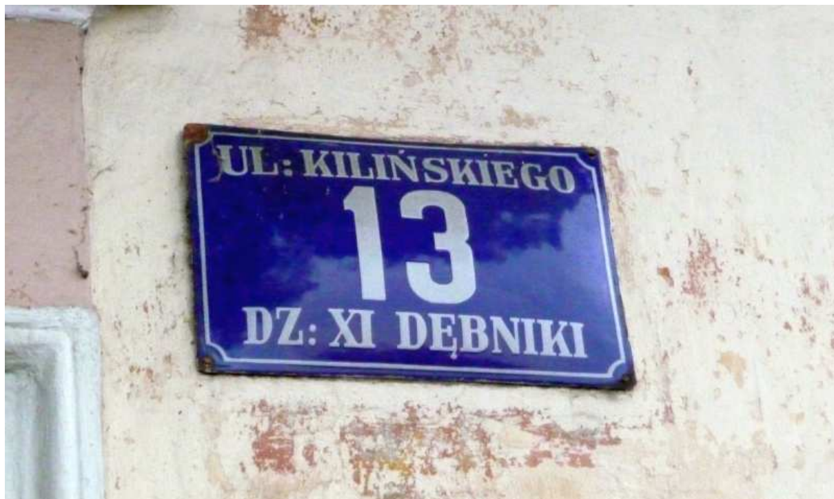
Fot. nr 55. Tabliczka z czasów Wielkiego Krakowa. (25.09.13)