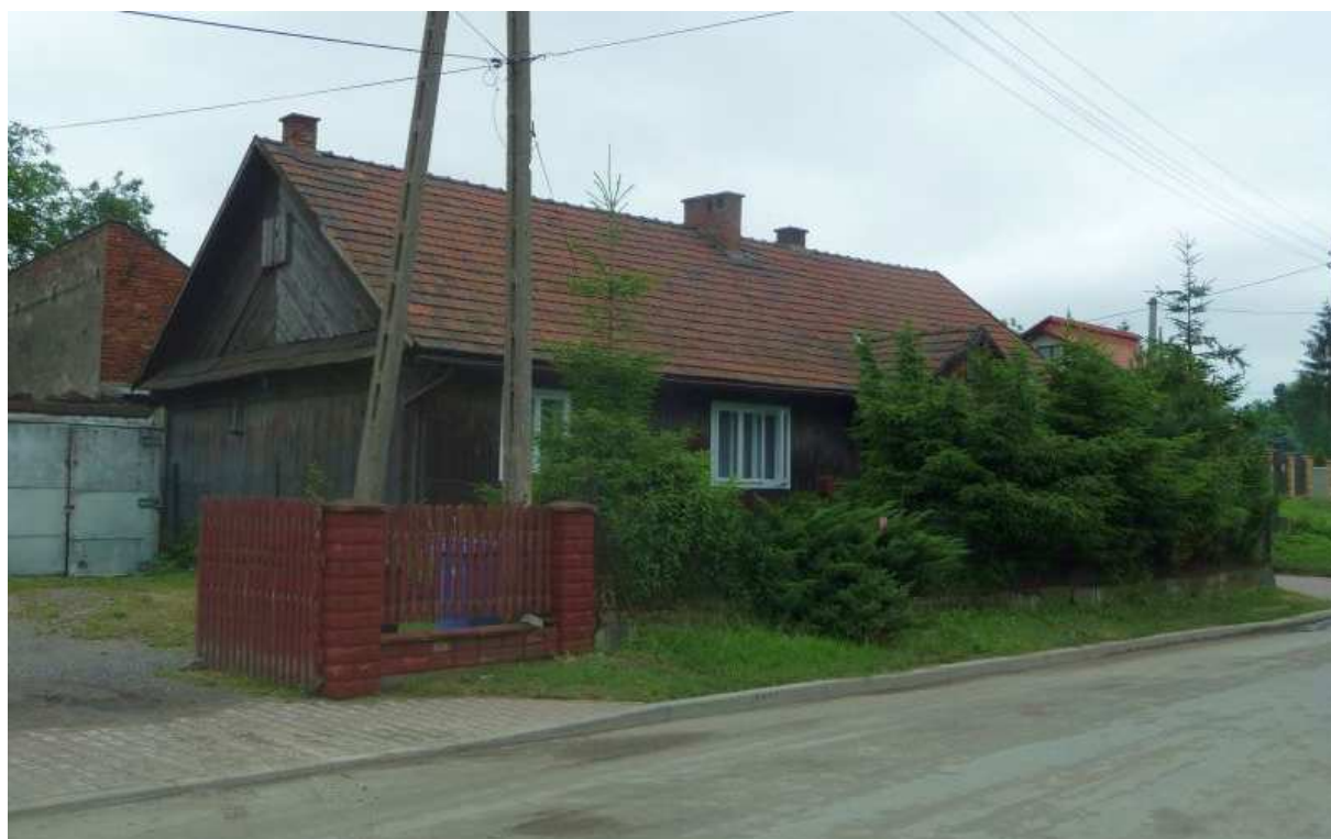
Fot. nr 22 (22-24). Oryginalna chałupa z ulicy Wańkowicza 122. (25.06.13)