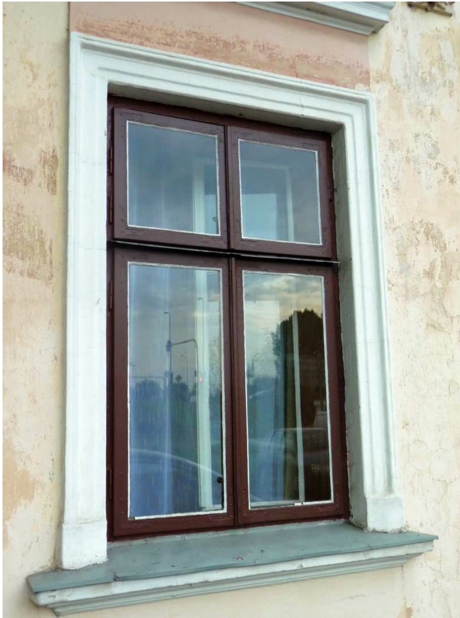
Fot. nr 59. Oryginalne okno. (25.09.13)