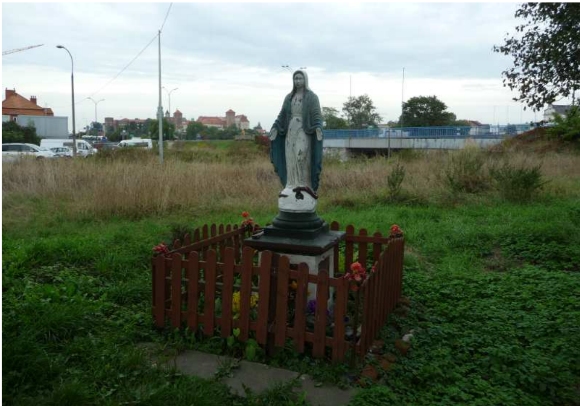
Fot. nr 89 (89-95). Podmiejska figura Matki Boskiej drzemiąca pośród resztek sadu, obejmującego przestrzeń między ulicami: Barską i Konopnickiej. (25.09.13)