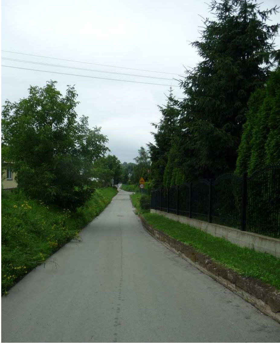
Fot. nr 2. Ulicą PCK w stronę ulicy Wańkowicza. (25.06.13)