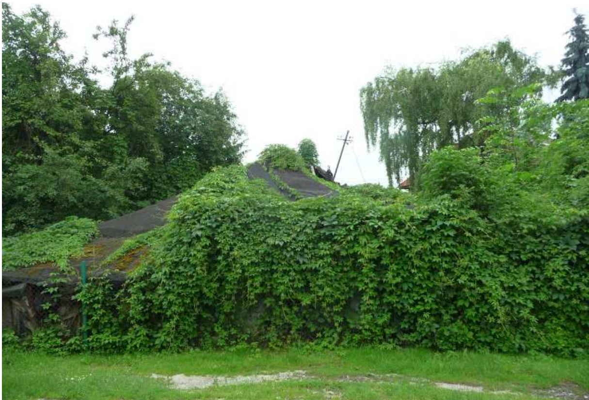
Fot. nr 9 (9-11). Zarośnięta winem ruina starej chałupy z ulicy Krasnowolskiego 1 (?). (25.06.13)