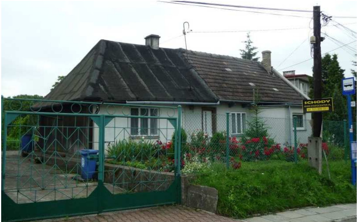
Fot. nr 43. Chałupa z ulicy Wańkowicza 52 (?). (25.06.13)