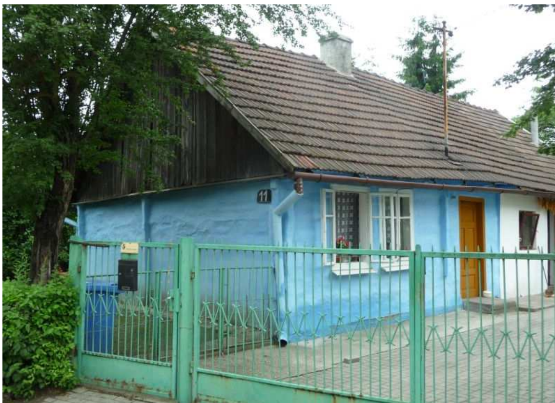
Fot. nr 35. To zapewne kolejny relikw z końca XIX-go wieku. (25.06.13)