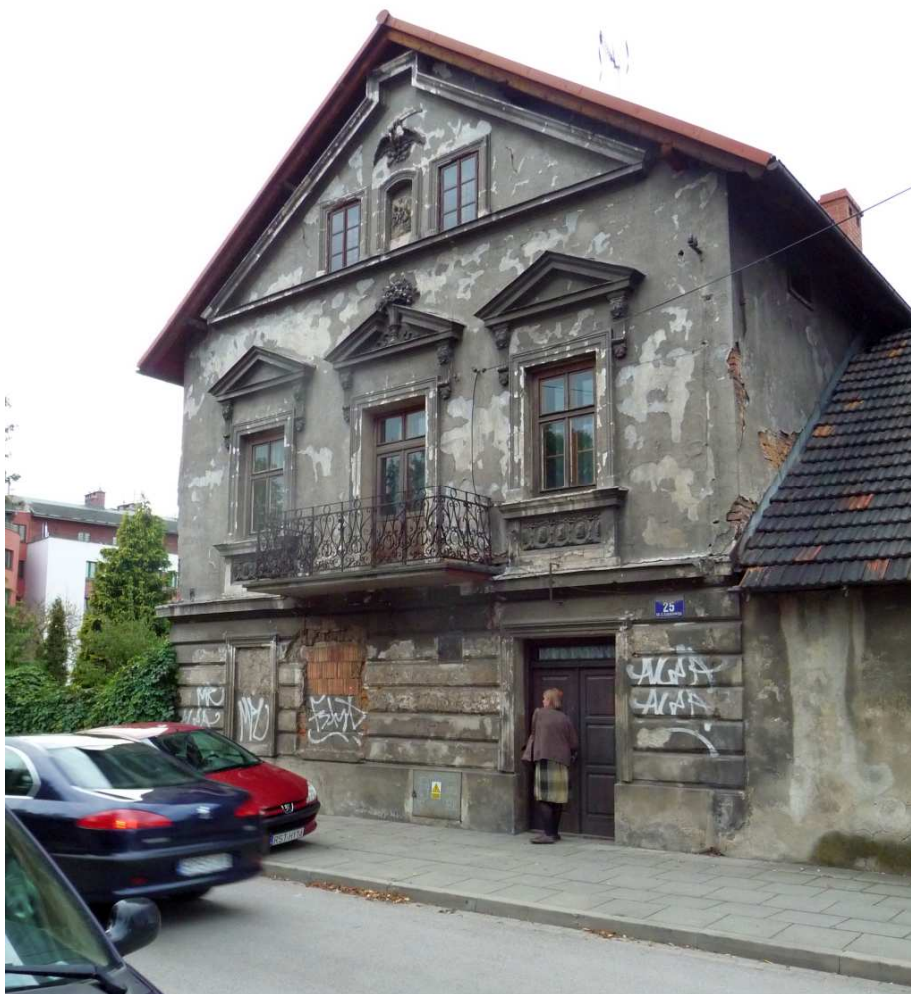
Fot. nr 127 (127-129). Fasada dworu, pochodzącego z końca XIX-go wieku. (25.09.13)