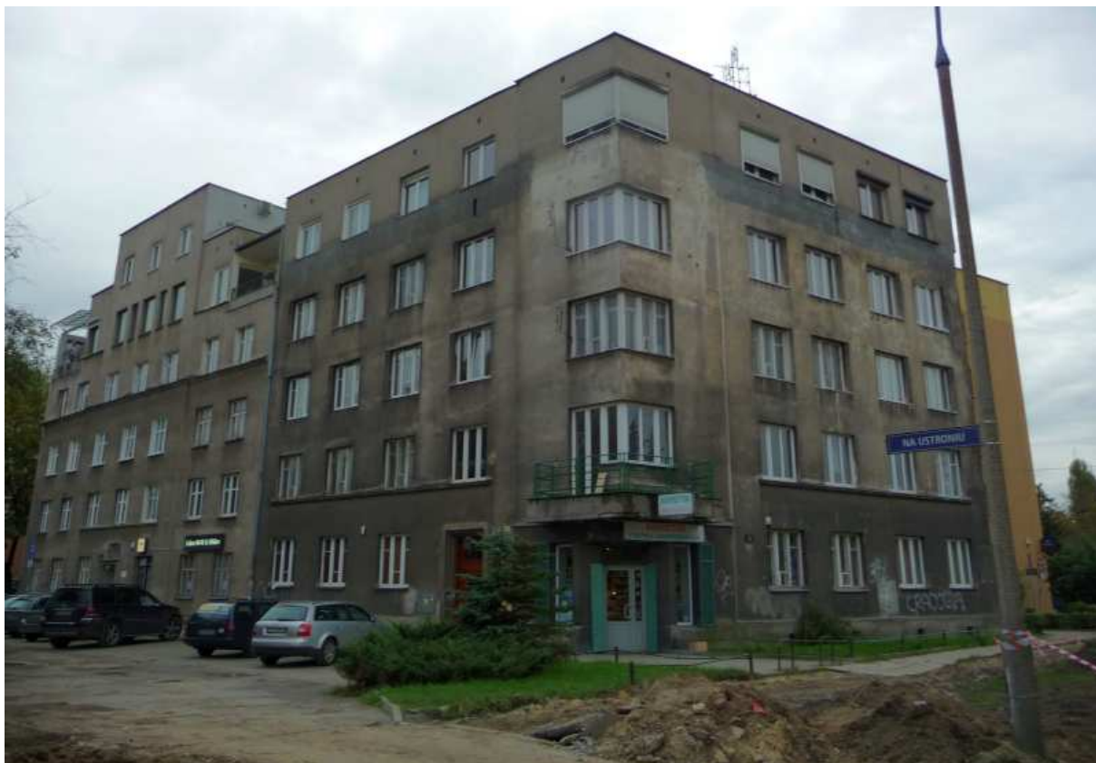
Fot. nr 102. Niewielka ulica Na Ustroniu. (25.09.13)