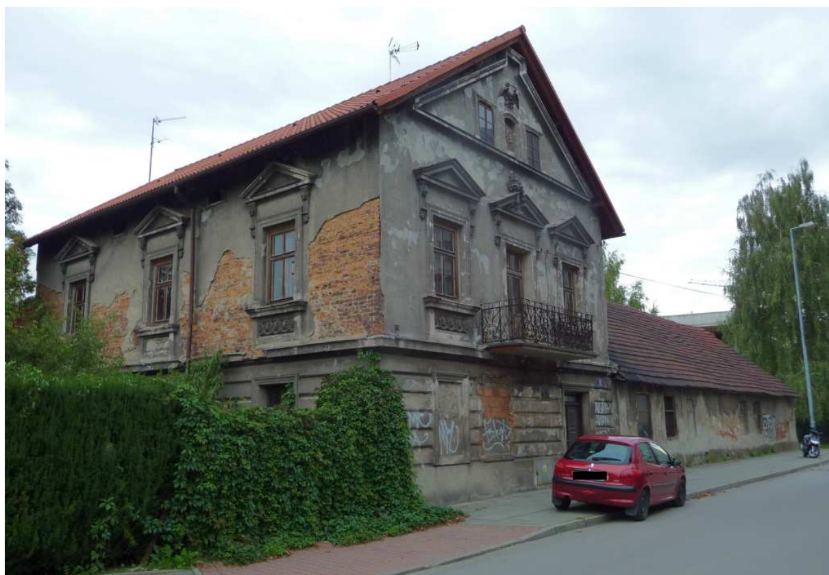
Fot. nr 130. Widok od strony ulicy Mieszczkańskiej. (25.09.13)