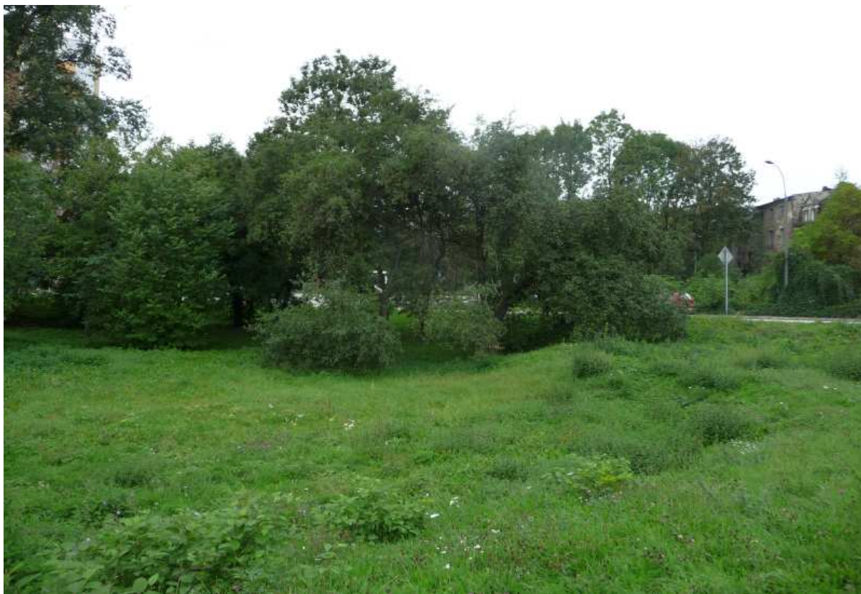
Fot. nr 80 (80-81). Łąka pomiędzy fragmentem ulicy Barskiej i Hotelem Hilton Garden Inn. (25.09.13)