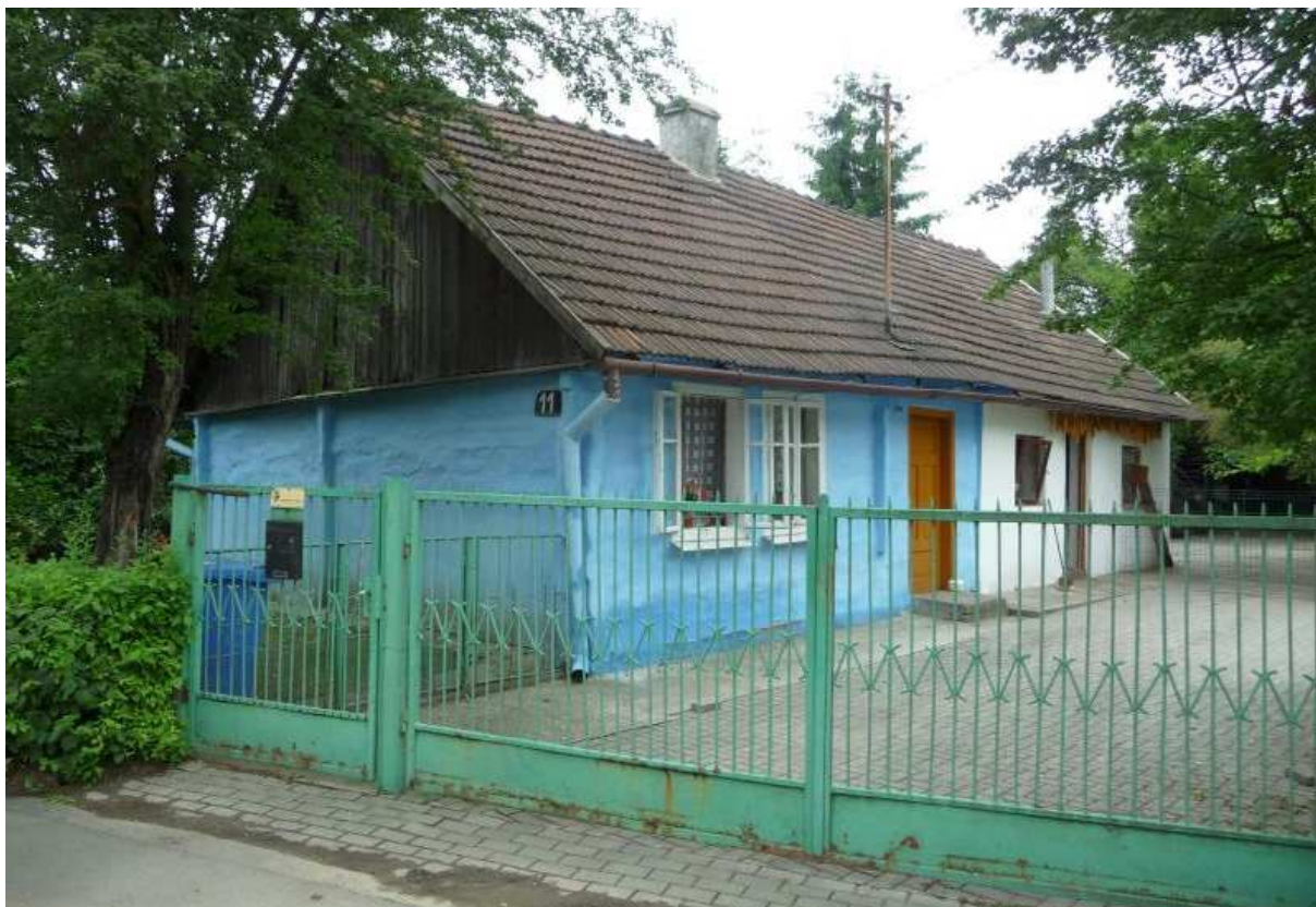
Fot. nr 34 (34-35). Oryginalna półówka tradycyjnie bielonej chałupy z ulicy Łempickiego 11. (25.06.13)