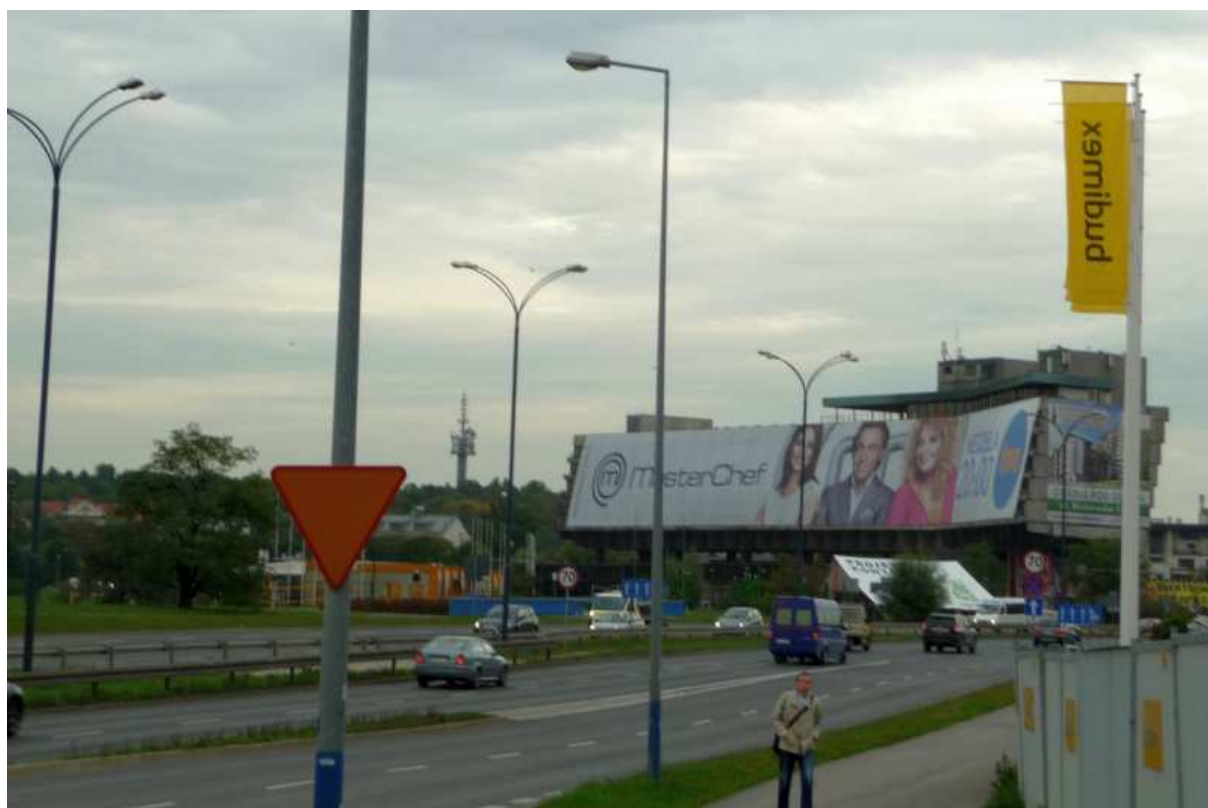
Fot. nr 131 (131-133). Zamknięty 10 lat temu Hotel Forum, wybudowany pod koniec lat 80-tych w miejscu stadionu RKS Garbarnia – widok z Ronda Grunwaldzkiego. (25.09.13)