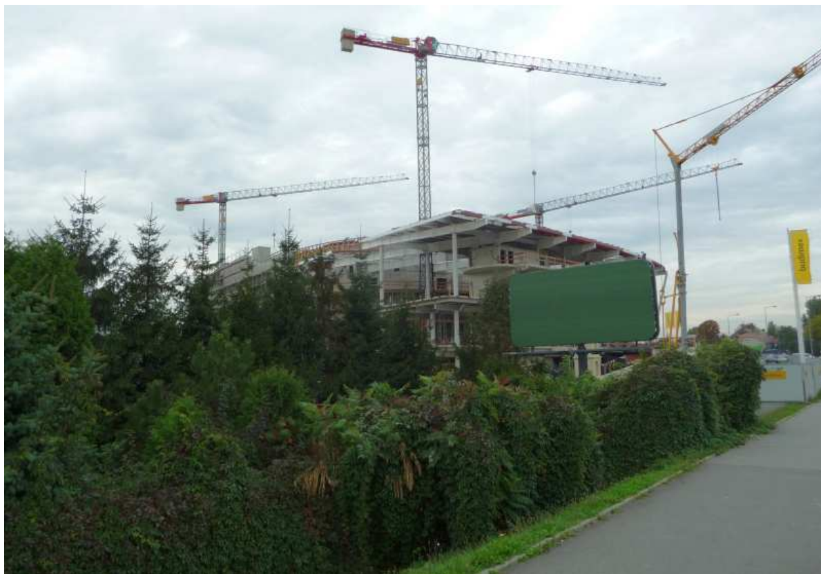
Fot. nr 111. Plac budowy Centrum Kongresowego– widok z ulicy Konopnickiej. (25.09.13)