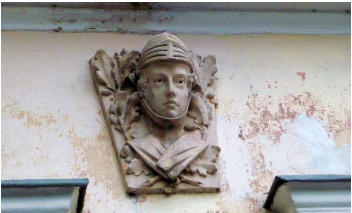
Fot. nr 58. Ten sam motyw z części środkowej. (25.09.13)