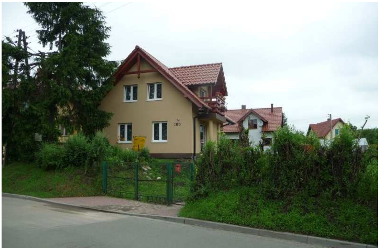
Fot. nr 20. Nowo wybudowany dom z ulicy Wańkowicza 160, który stoi w miejscu wiekowej chałupy (fot. nr 21). (25.06.13)