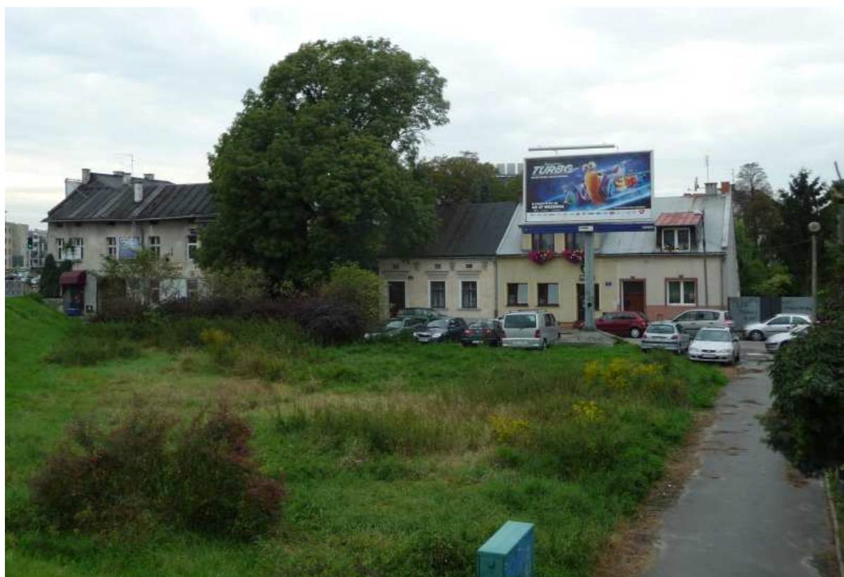
Fot. nr 51 (51-52). Końcowy fragment ulicy Kilińskiego o numerach: 11-17). Placyk na pierwszym planie wkrótce ma zostać zbudowany 30-to metrowym gigantem. (25.09.13)