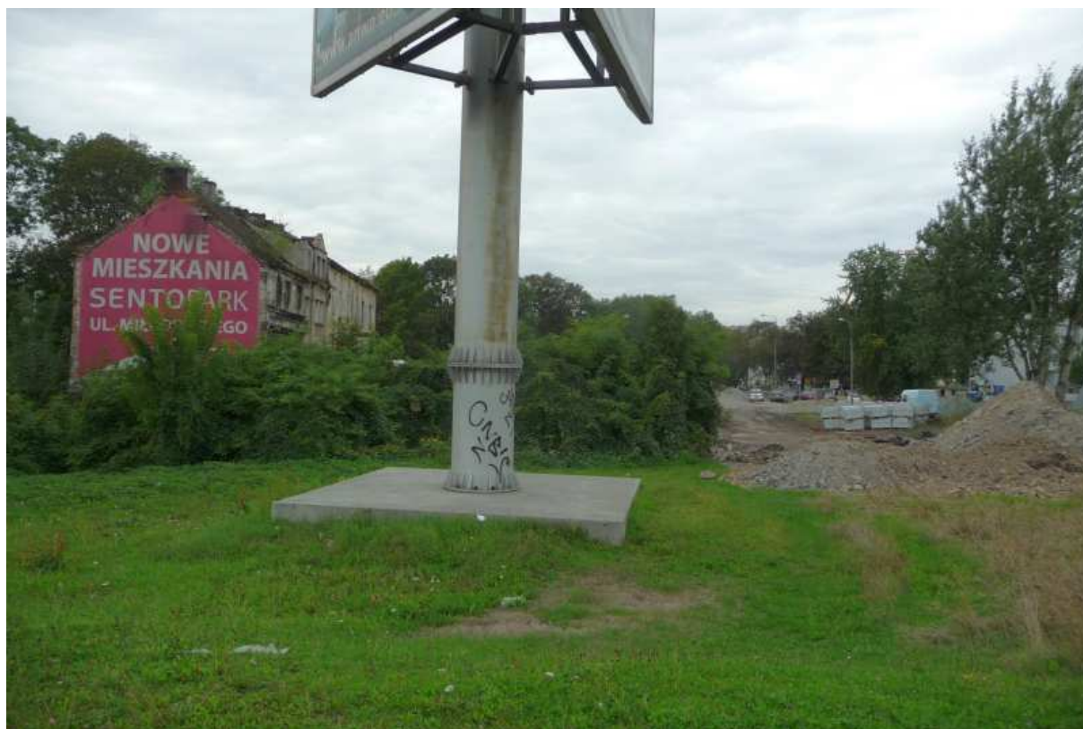
Fot. nr 83 (83-85). Ujęcia od strony ulicy Konopnickiej. (25.09.13)