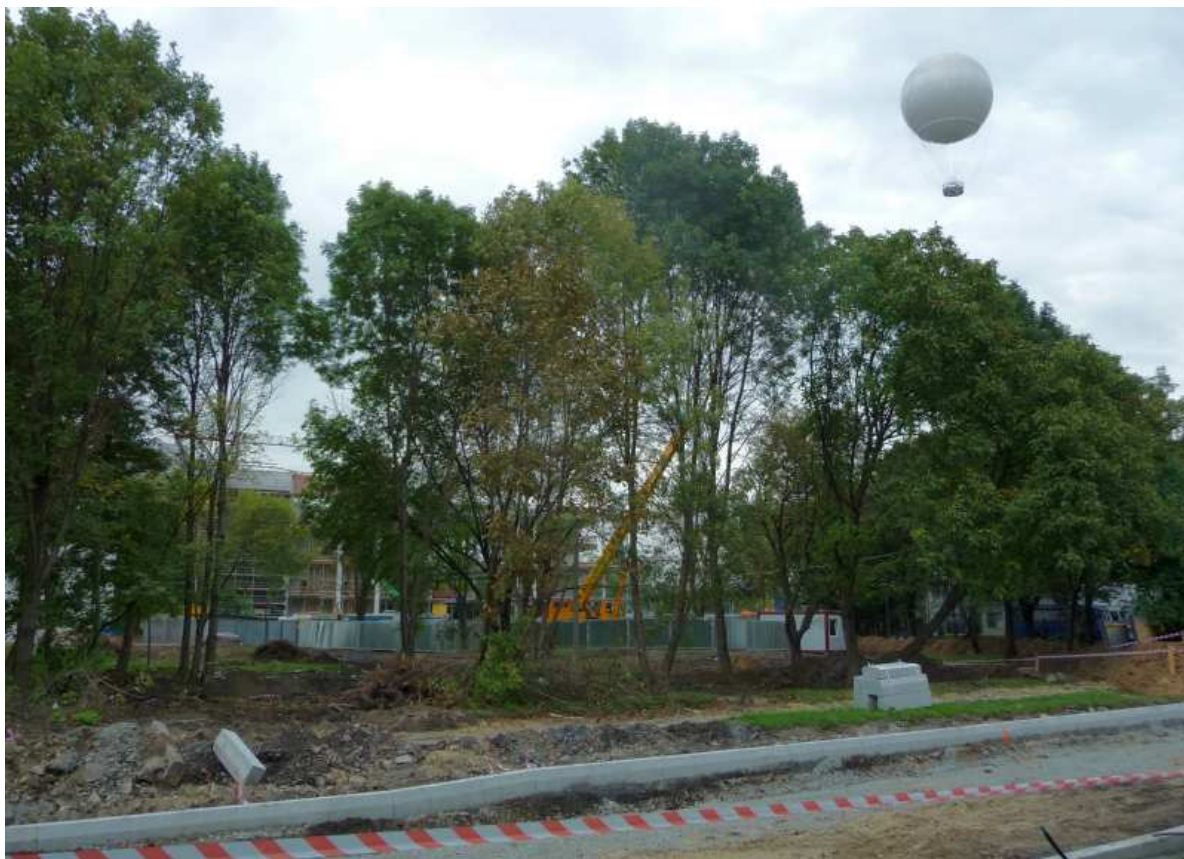
Fot. nr 103. Okolica ulicy Wierzbowej po masowej wycince drzew. (25.09.13)