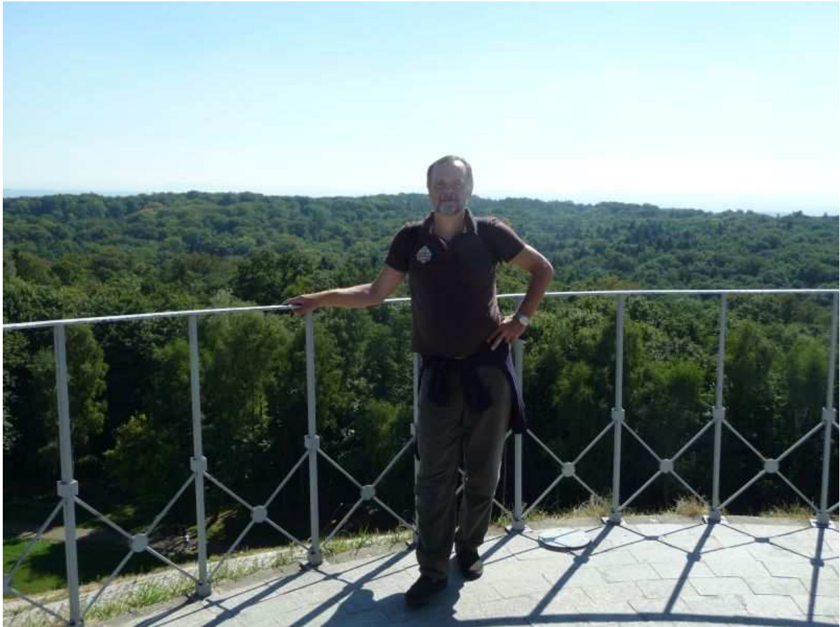
Fot. nr A. Na Kopcu Piłsudskiego. (07.09.13)