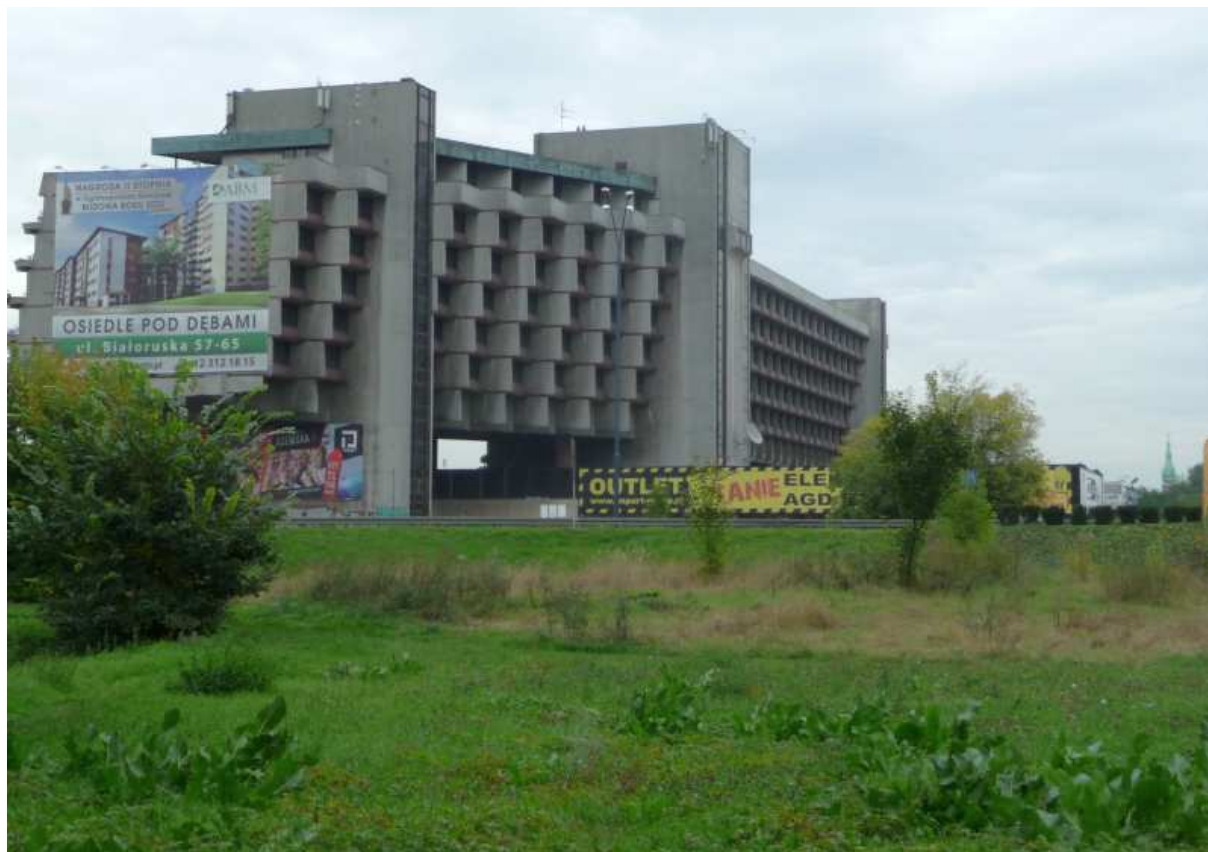
Fot. nr 133. Hotel Forum od strony Ludwinowa. (25.09.13)