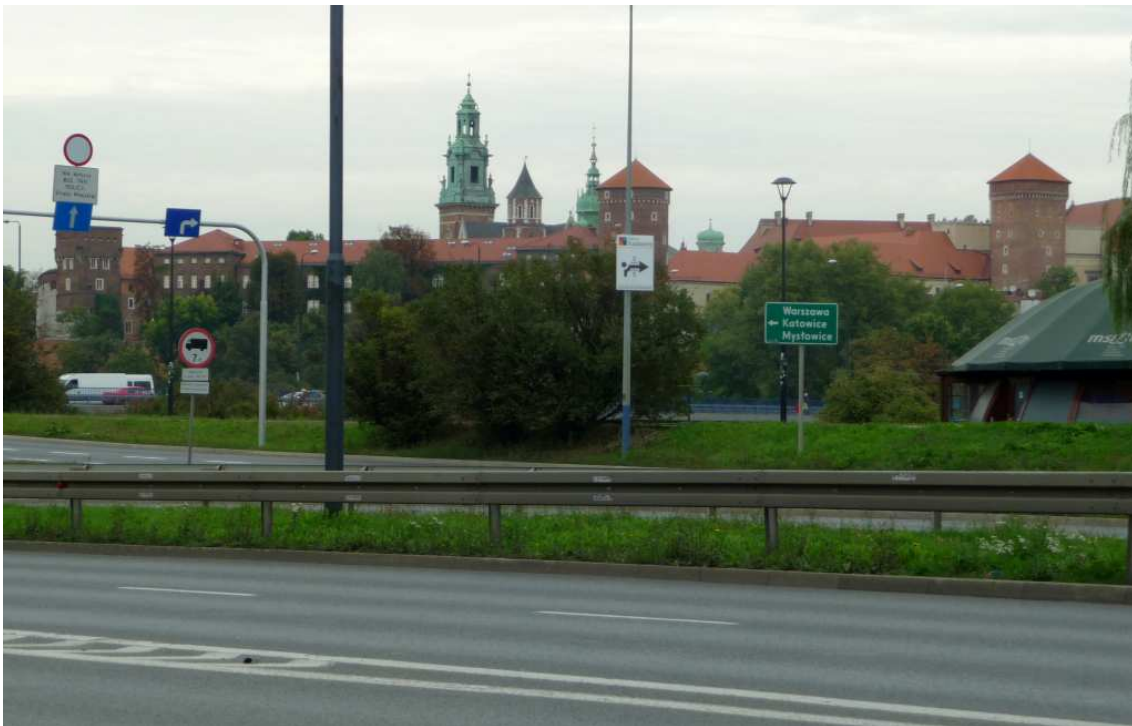
Fot. nr B. Być może już niedługo ten widok stanie się nieaktualny. (25.09.13)

Zarejestrowane w albumie obrazy wkrótce, bądź w niedługiej przyszłości, staną się już archiwalnymi, a ja będę miał jedynie gorzką satysfakcję, że udało mi się je utrwalić i zachować dla przyszłych pokoleń. Może za kilka, czy kilkanaście lat znów zmieni się nastawienie władz i mieszkańców Krakowa do nikomu niepotrzebnych dziś staroci, ale wtedy nie będzie już co odnawiać.