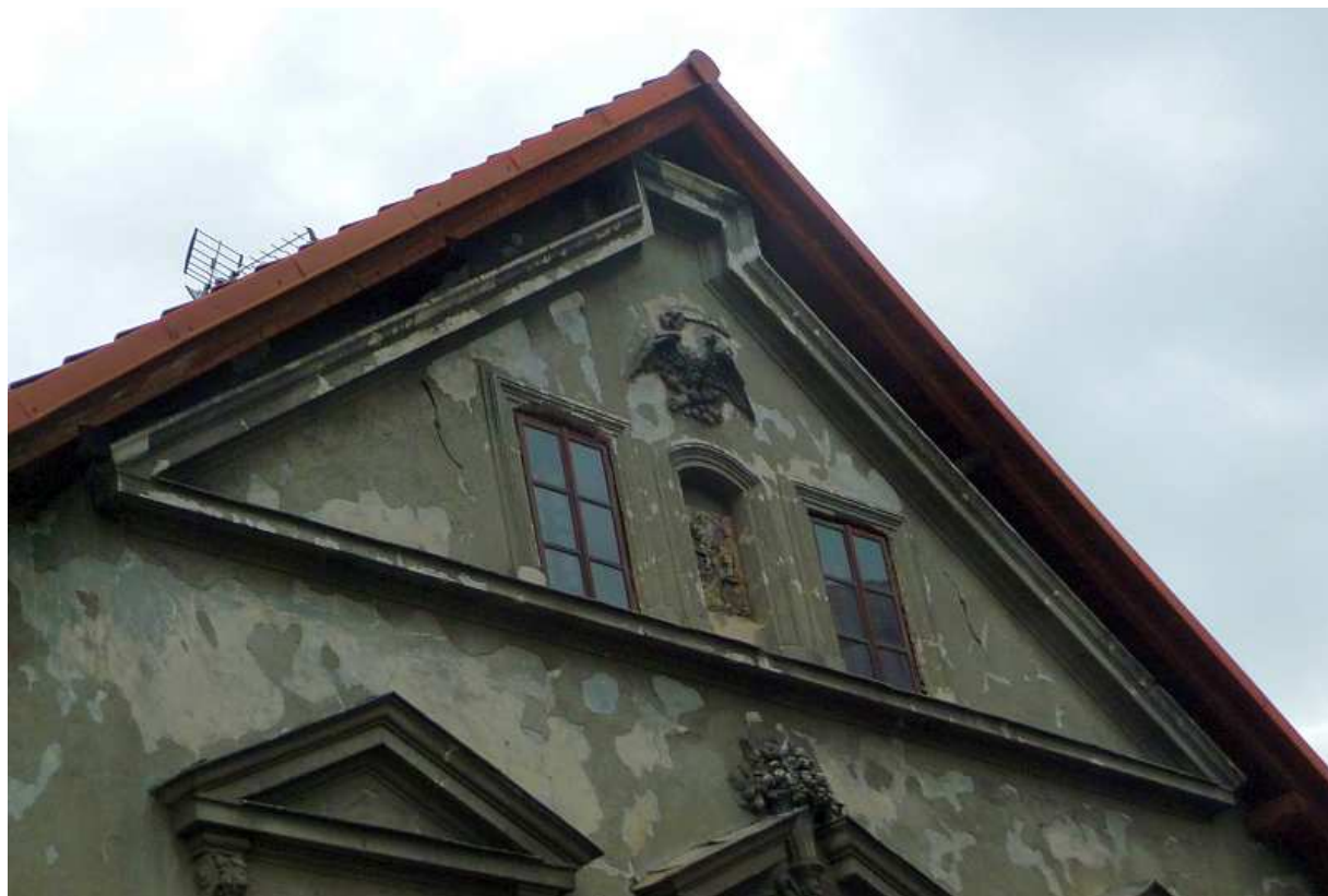
Fot. nr 129. Zwieńczenie fasady. (25.09.13)