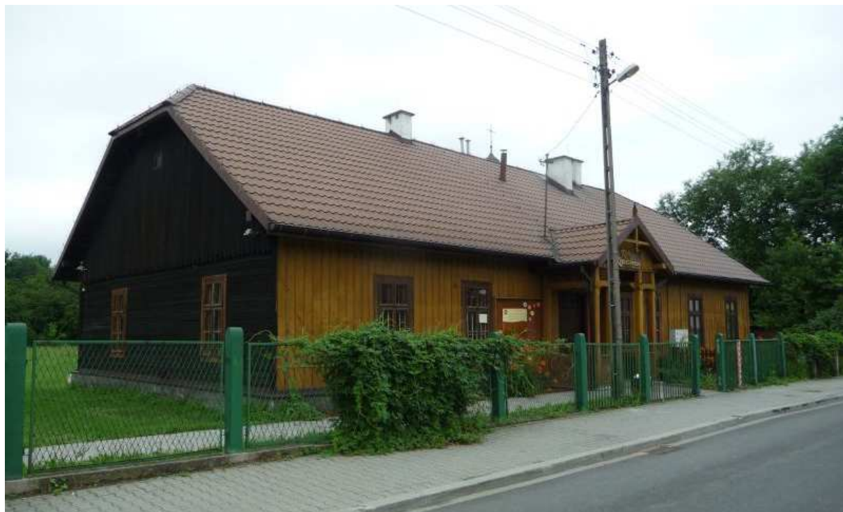
Fot. nr 39 (39-40). Fasada od strony ulicy Wańkowicza. (25.06.13)