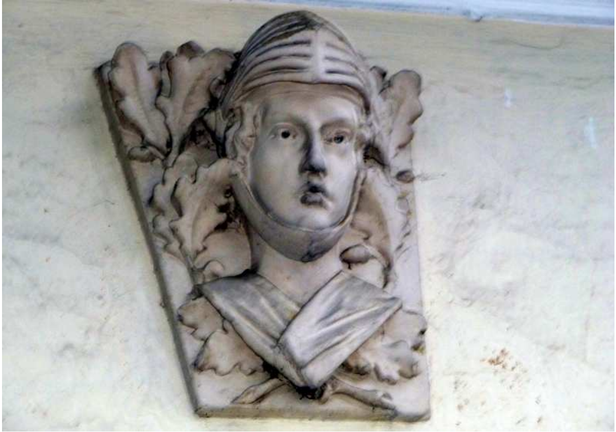
Fot. nr 57. Płaskorzeźba z lewej części domu. (25.09.13)