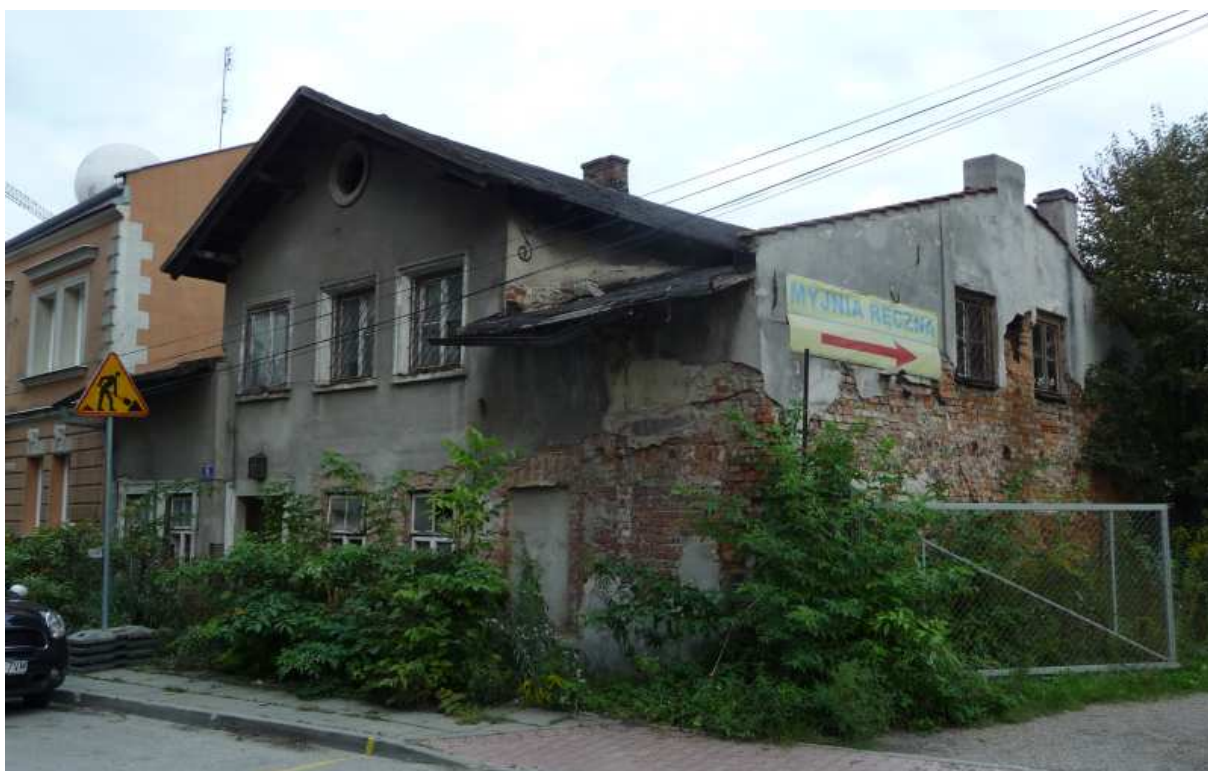
Fot. nr 122 (122-125). W klimacie galicyjskiego Zakrzówka. Ruina podmiejskiego domku spod nr 16. (25.09.13)