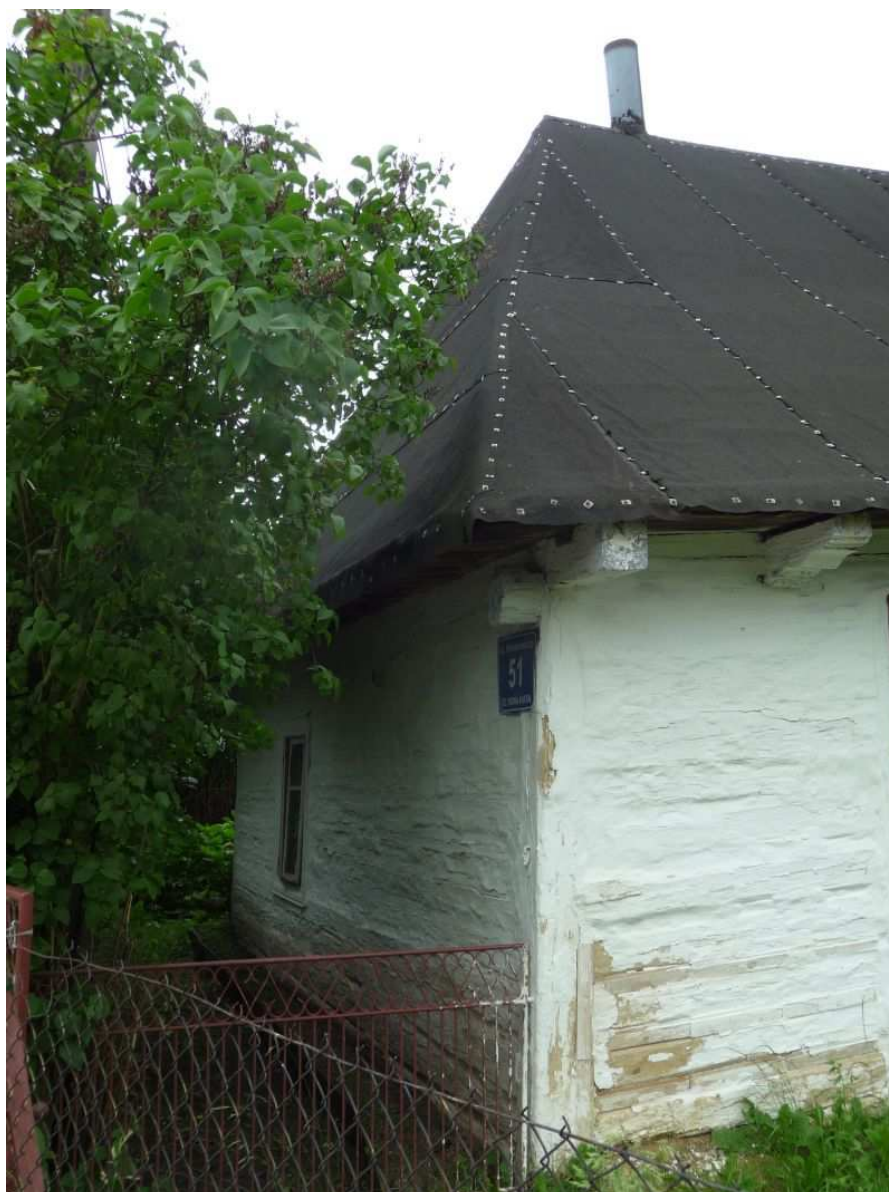
Fot. nr 16. Nr 81, czy 51?. (25.06.13)