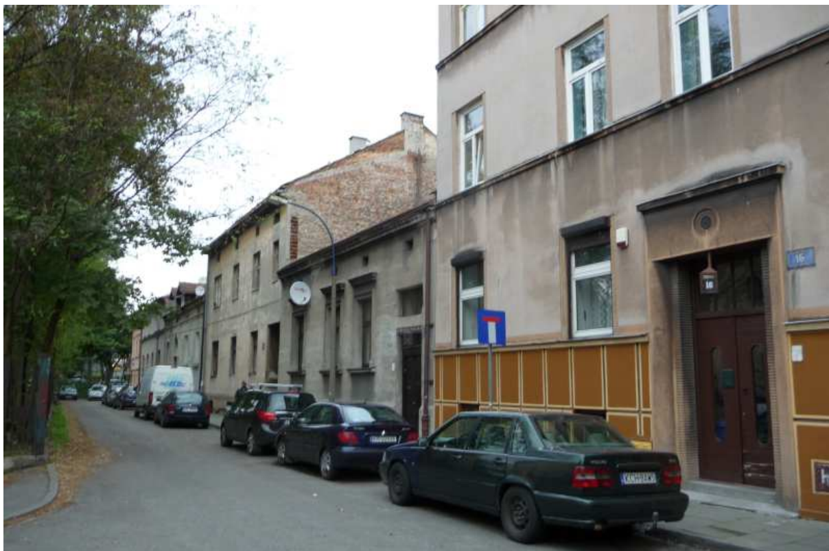
Fot. nr 75. Ulica Zduńska od 16 do 6 (w kierunku ulicy Konopnickiej). Druga jej połowa, dochodząca do ulicy Zamkowej, została przecięta przez ulicę Konopnickiej. (25.09.13)