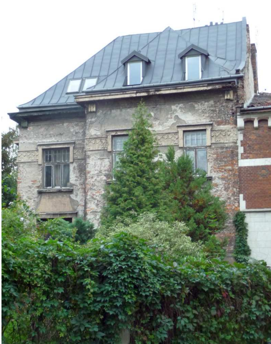
Fot. nr 67. Secesyjna willa Władysława Zapałowicza, inspektora c.k. kolei z ulicy Barskiej 24, wybudowana w 1909 roku wg projektu Romana Bandurskiego. (25.09.13)