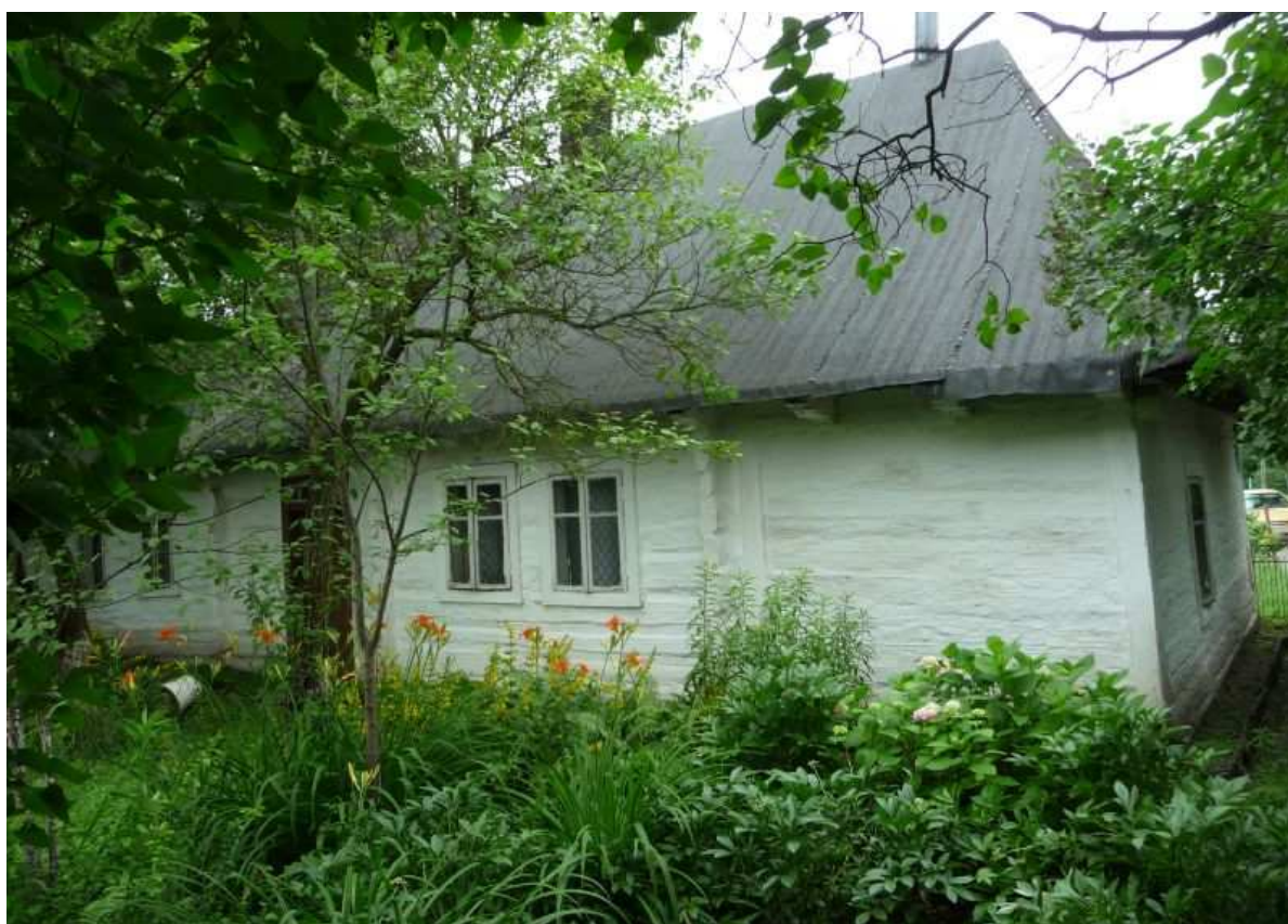
Fot. nr 18. Wańkowicza d. Kruczkowskiego 151(25.06.13)