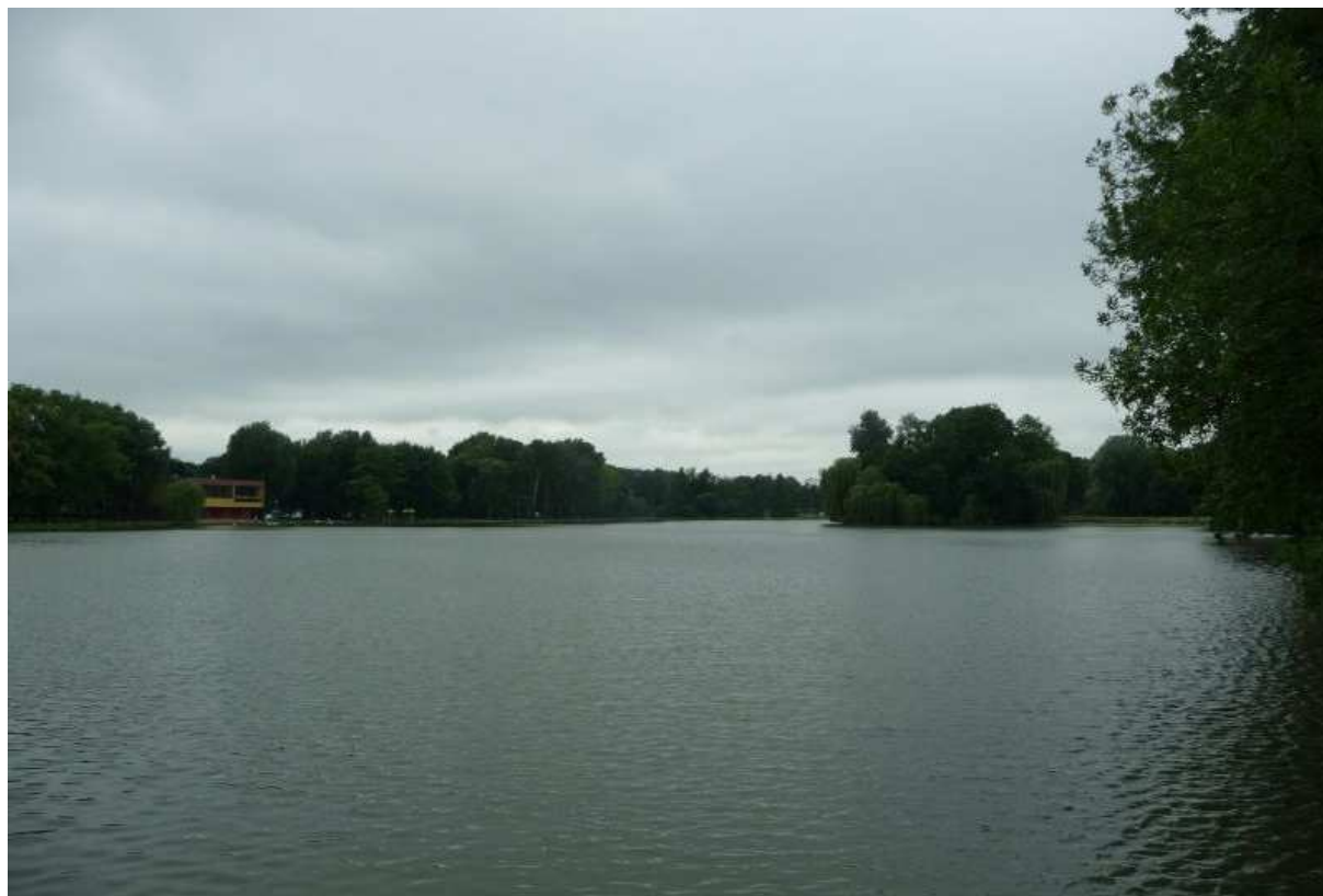
Fot. nr 49 (49-50). Nowohucki zalew zasilany wodami Dłubni – widoki z Alei Solidarności. (25.06.13)