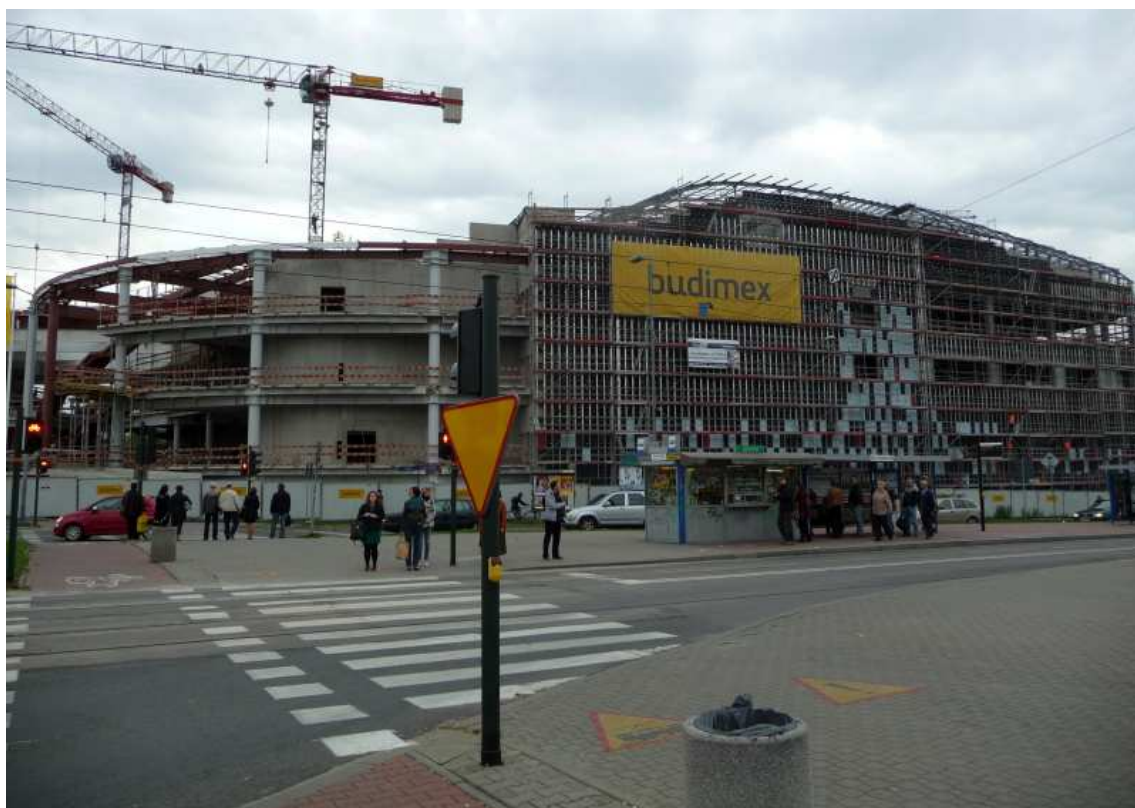
Fot. nr 116. Gigant Centrum Kongresowego – widok od strony Dębnik. (25.09.13)