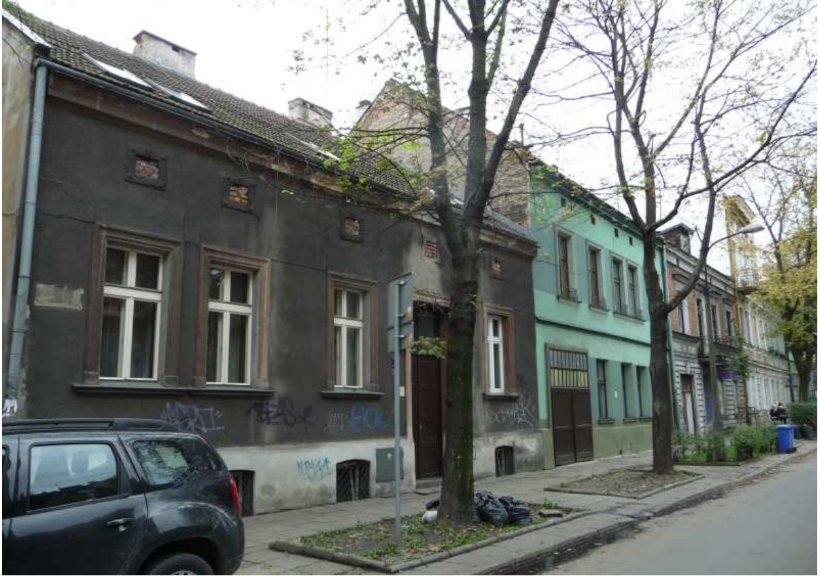
Fot. nr 68 (68-71). Fragment niskiej zabudowy ulicy Barskiej; nr: 37-31. (25.09.13)