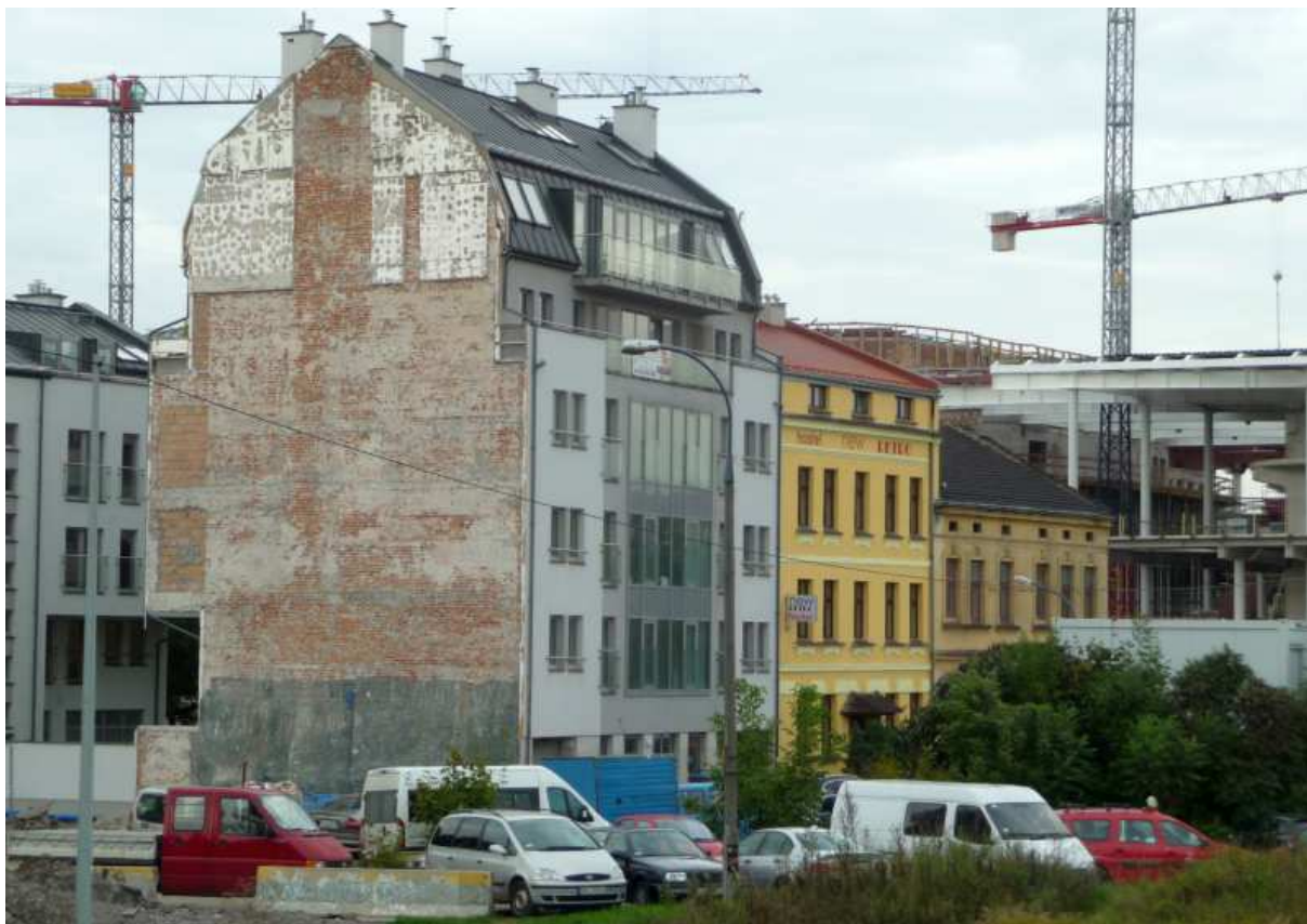
Fot. nr 99. Dwa „antyki” pod nr 57 i 59 i nowy budynek pod nr 61. (25.09.13)