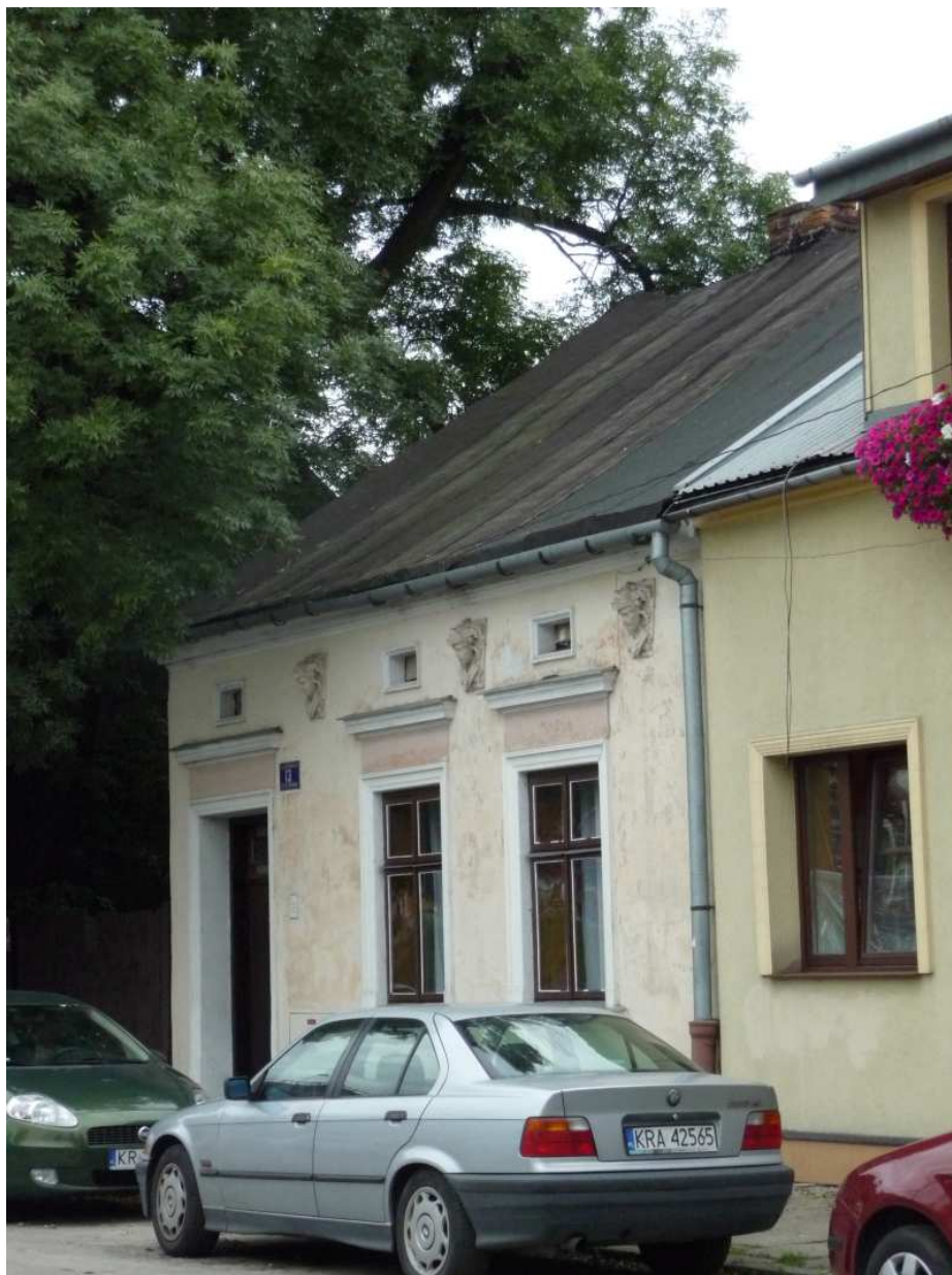
Fot. nr 54. Chroniony prawem podmiejski oryginał. (25.09.13)