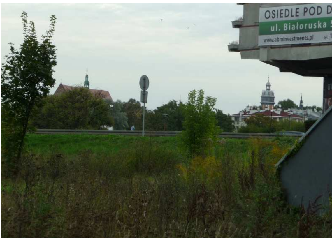
Fot. nr 76. Fragment Kazimierza ponad ulicą Konopnickiej – widok z obrzeża Osiedla Podwawelskiego, spod Hotelu Hilton Garden Inn. (25.09.13)