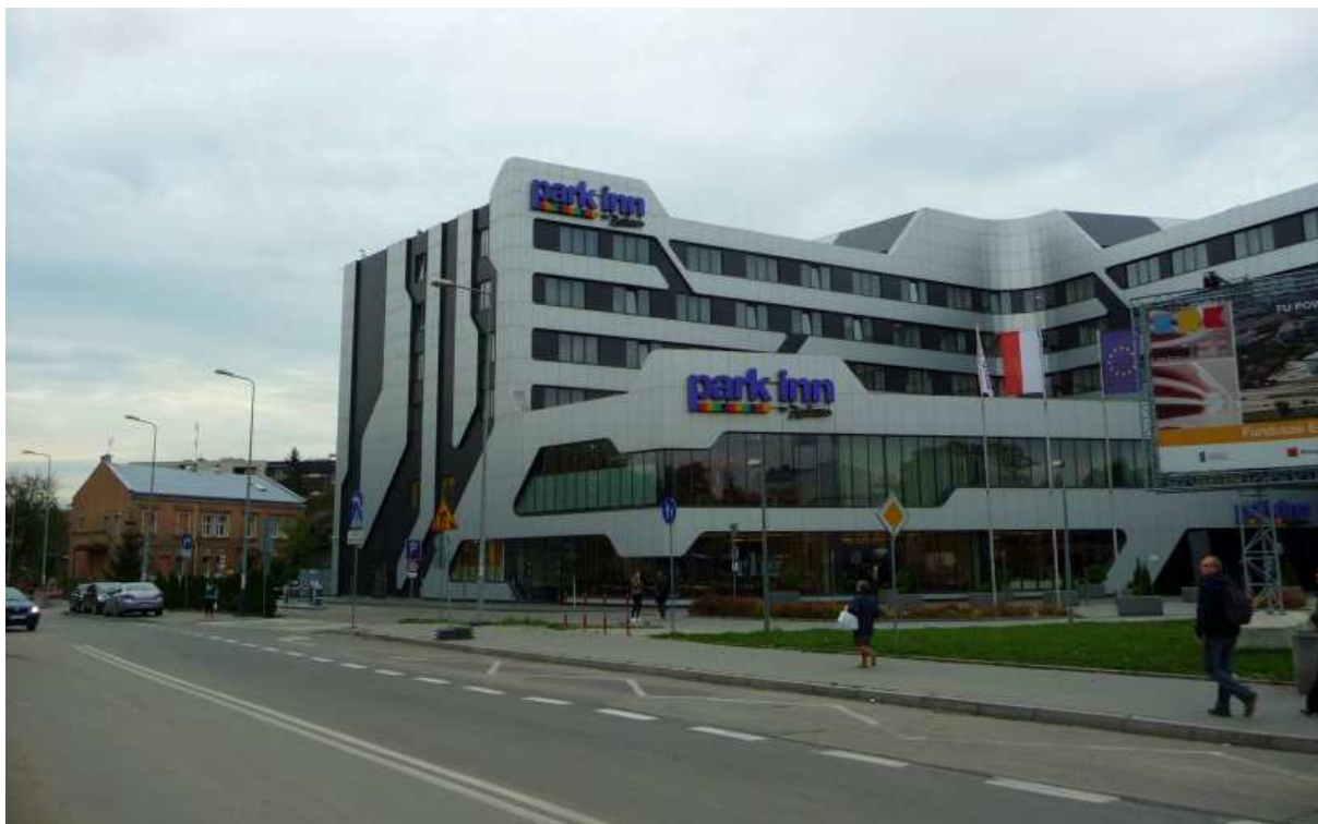
Fot. nr 117. Stary i nowy świat Zakrzówka wzdłuż ulicy Bułhaka. (25.09.13)