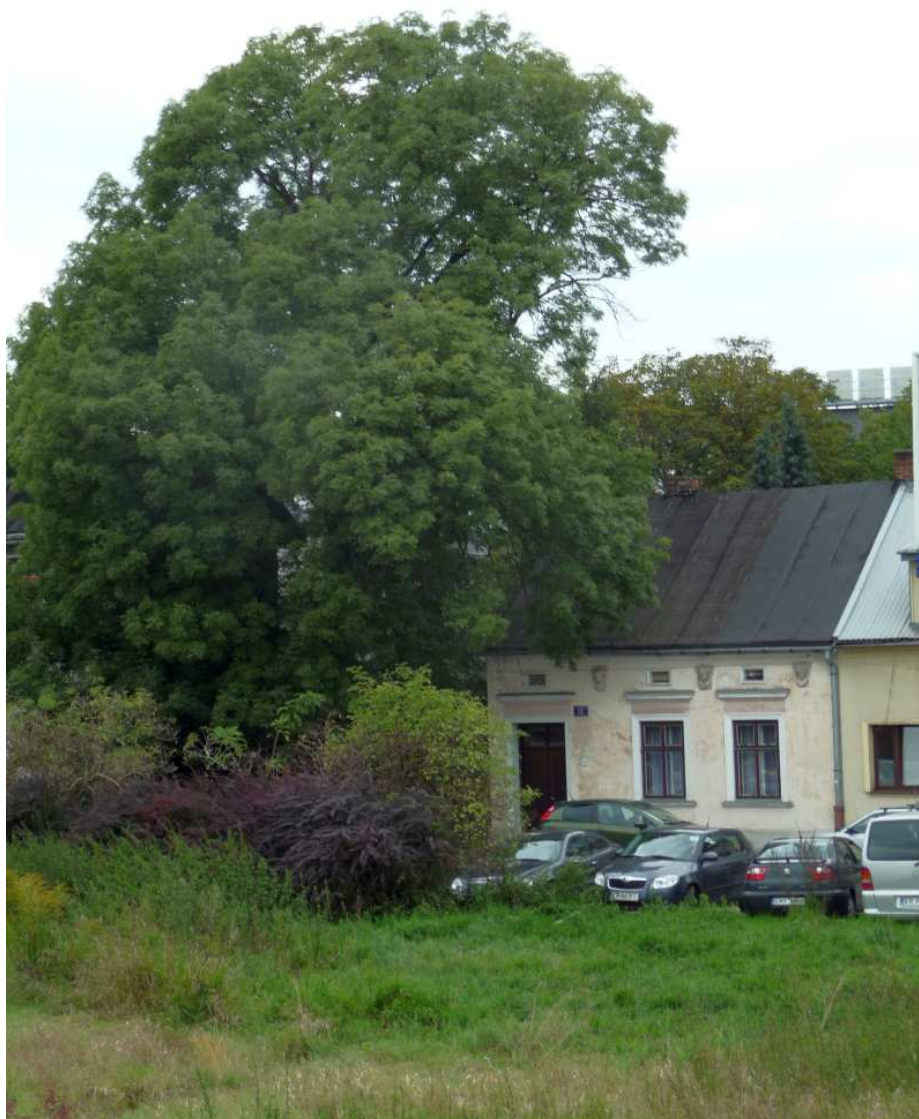
Fot. nr 53 (53-59). Oryginalny domek podmiejski pod nr 13. Wg właściciela to obiekt około 120-to letni, a stojąca obok kilkudziesięcioletnia lipa została zasadzona po narodzinach męskiego członka rodu. (25.09.13)