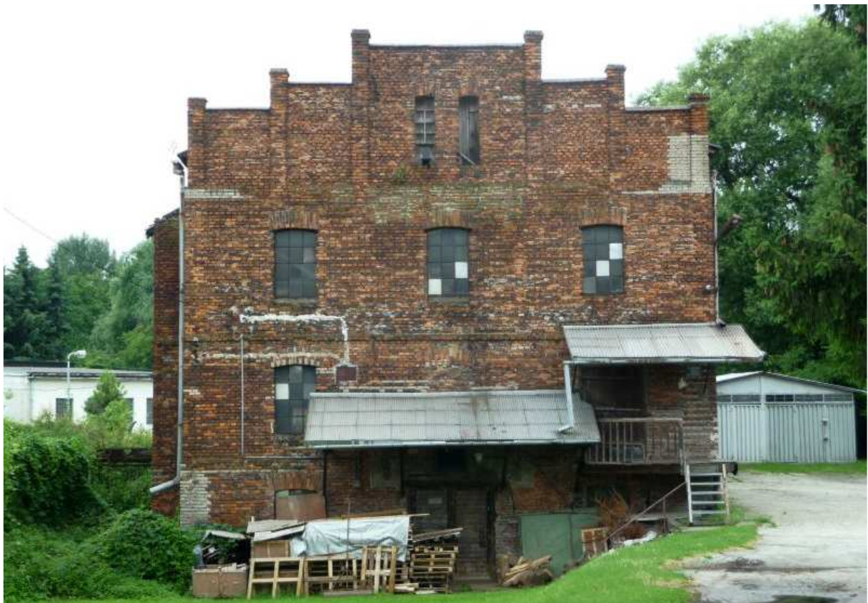
Fot. nr 44 (44-47). Budynek dawnego młyna, który stoi w bliskości Dłubni (pod nr 1 przy ulicy Wańkowicza). (25.06.13)