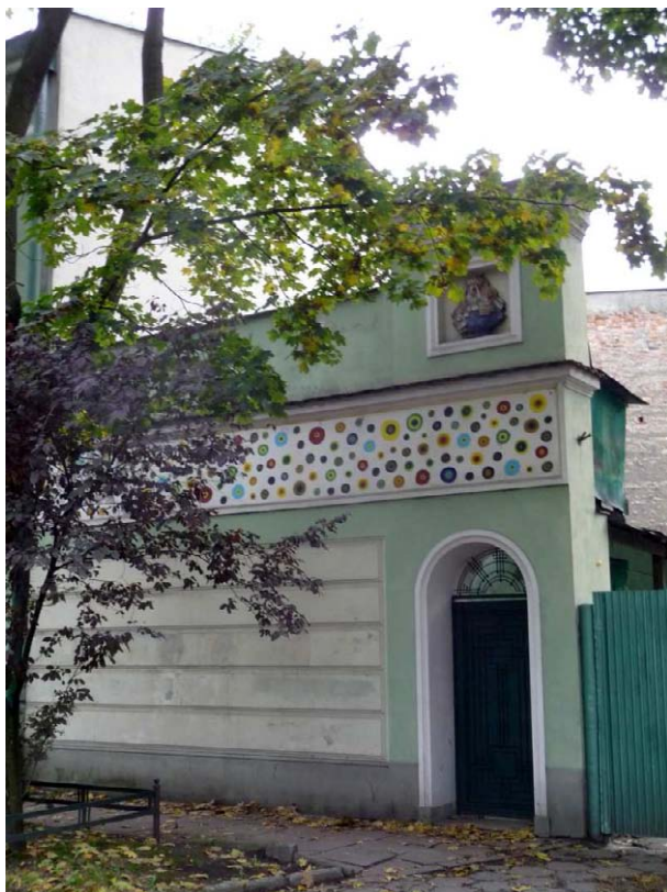
Fot. nr 72. Fragment zabytkowej kamieniczki pod nr 29. (25.09.13)