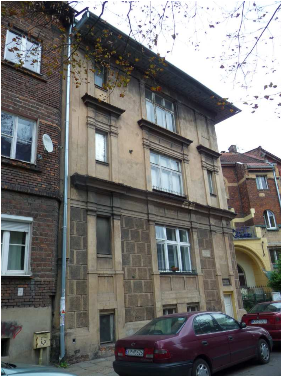
Fot. nr 65. Lewe skrzydło willi Romana Bandurskiego. (25.09.13)