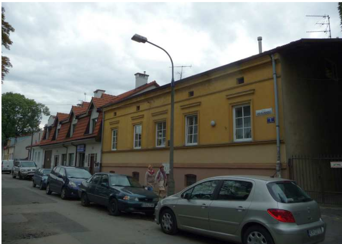
Fot. nr 60. Początkowy fragment zabudowy ulicy Kilińskiego o numerach: 3-13. (25.09.13)