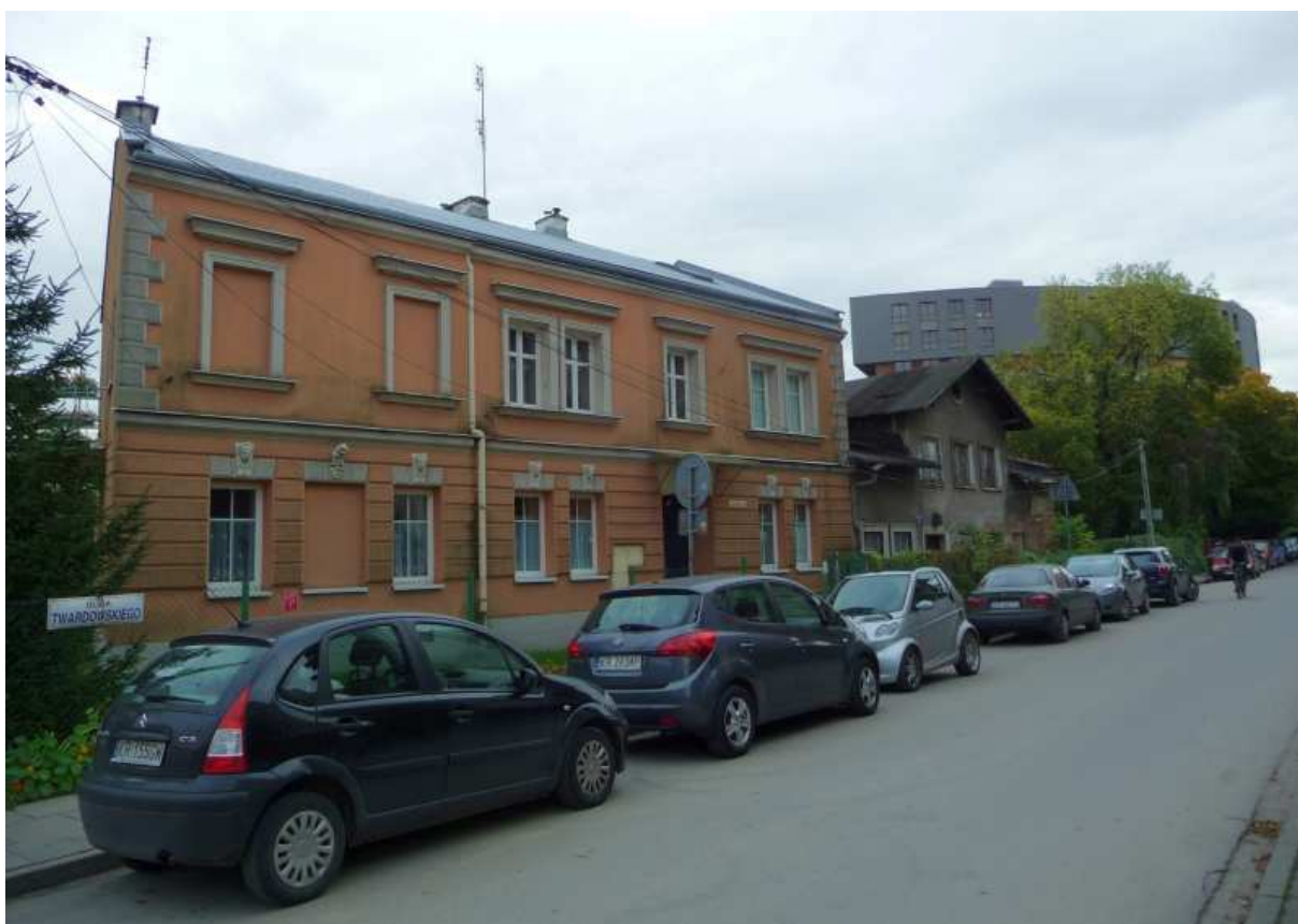
Fot. nr 118 (118-121). Ostały jeszcze fragment podmiejskiej zabudowy początkowego dziś odcinka ulicy Twardowskiego o numerach: 14-16. (25.09.13)