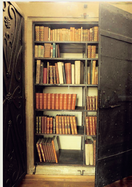
Fragment muzealnego archiwum

Zapraszamy zatem do obejrzenia XVII-wiecznego dokumentu miejskiego wraz z panoramą miasta z tego okresu oraz aktów królewskich z wizerunkami władców i XVI-wiecznym starodrukiem „Kronika