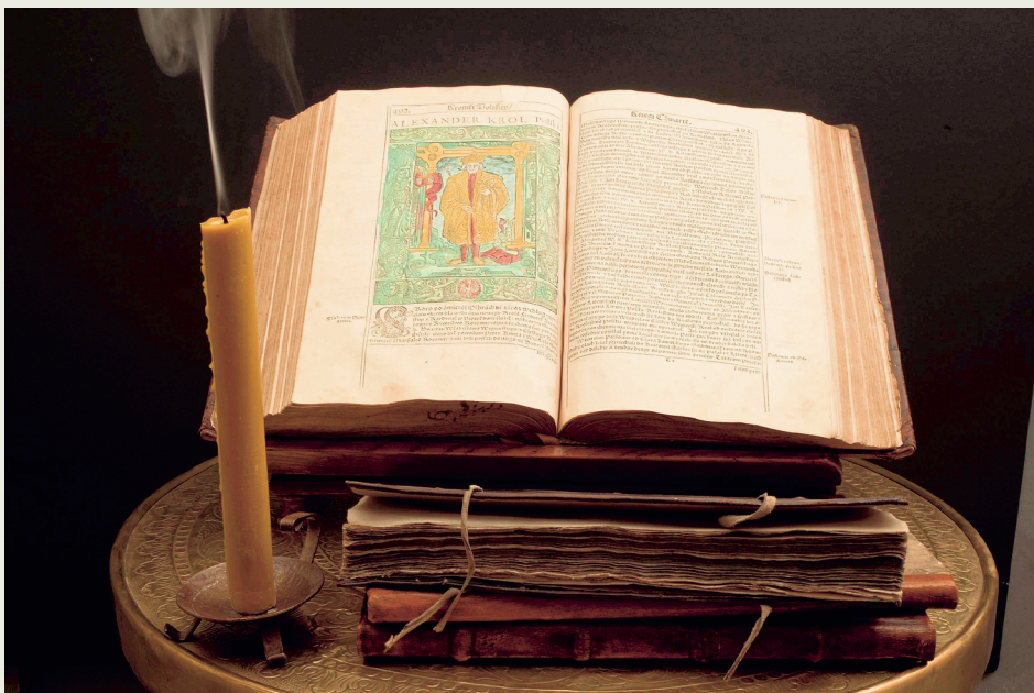
Bielski „Kronika polska”, Kraków 1597

poliska” Marcina Bielskiego. Interesujące dokumenty dotyczące personelu kopalni są przedstawione wraz z przedmiotami związanymi z ich pracą. Z kolei ozdobne faktury i oferty oglądający zobaczy w zaaranżowanym gabinecie urzędnika salinarnego. Niewątpliwie sporą atrakcją stanowią również wspomniane wpisy znanych zwiedzających wraz z ich wizerunkami lub pamiątkowymi fotografiami wykonanymi w Wieliczce (m. in. Karola Wojtyły z wycieczką szkolną czy prezydenta Stanisława Wojciechowskiego).