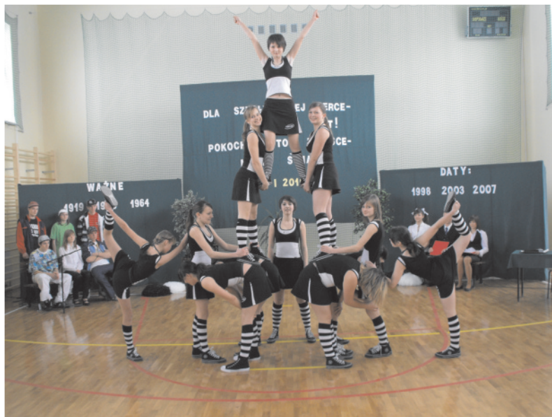
Tak świętowano otwarcie sali w styczniu ubiegłego roku