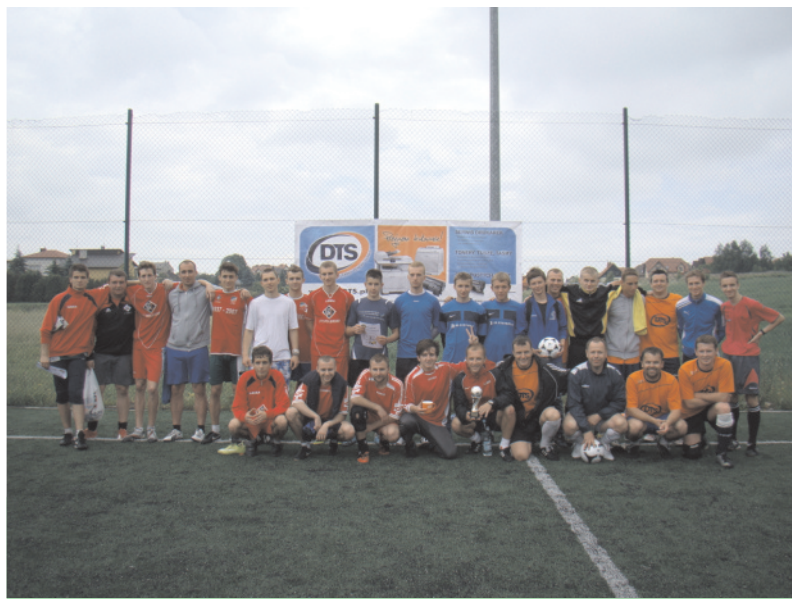
Zwycięskie drużyny po turnieju