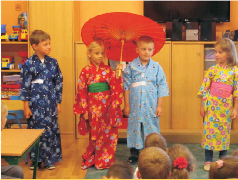
Przedzskolaki mogły przymierzyć japońskie kimona