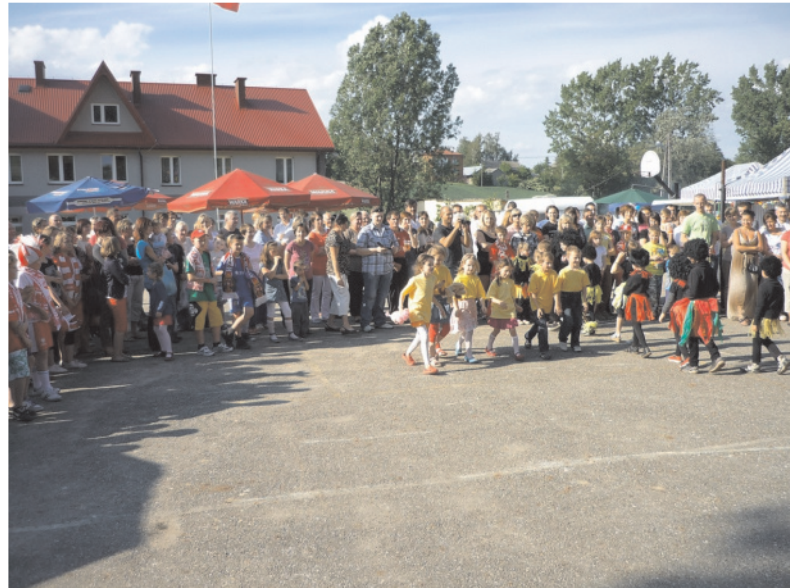
Dużo radości i wspólnej zabawy scala społeczność lokalną w zgrany zespół