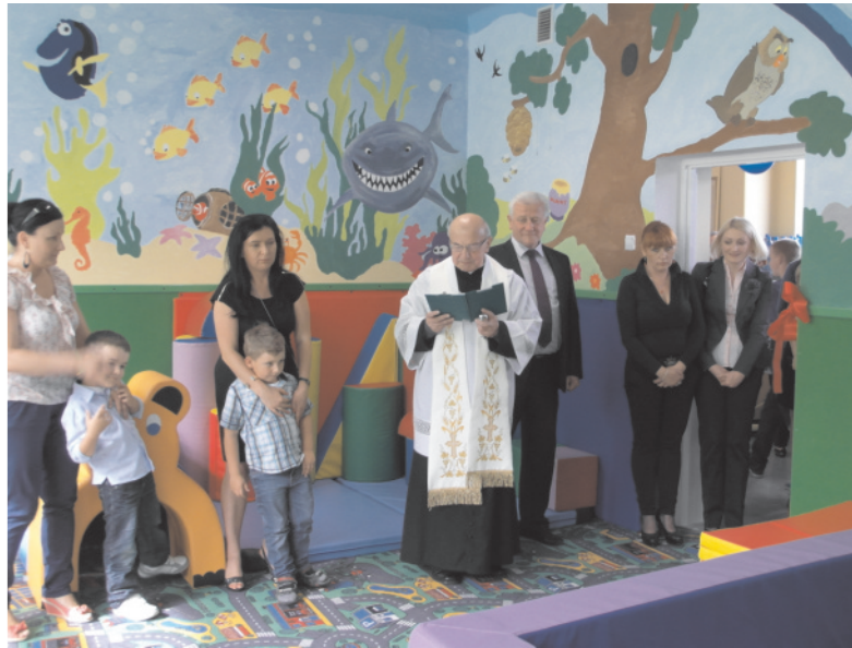
Sala wyremontowana, wyposażona i poświęcona – czas na zabawę!