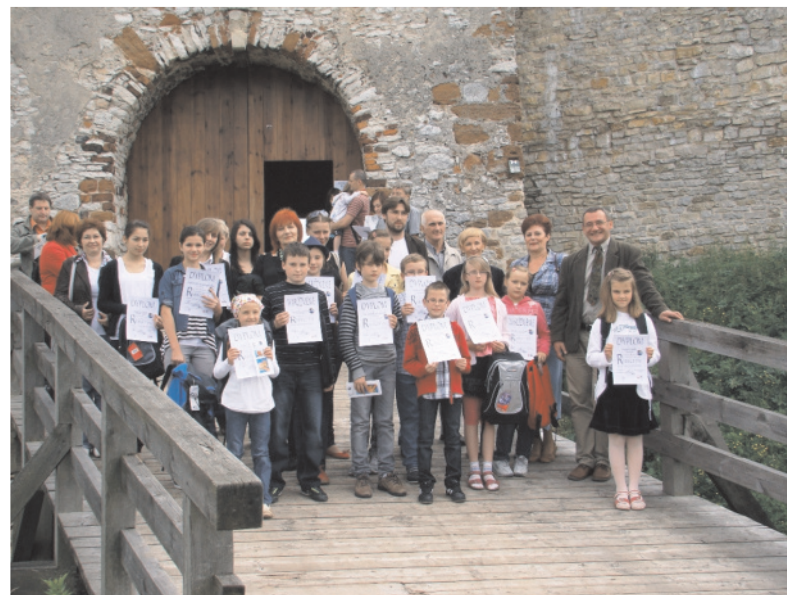
Laureaci konkursu przed odrestaurowaną bramą zamku w Rabsztynie