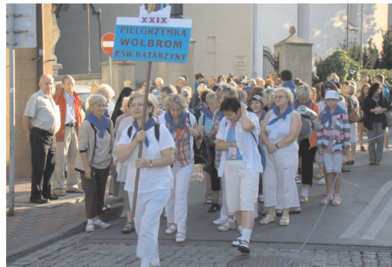
Pielgrzymkowy trud to dla nich źródło radości

Miejsko-Gminne Centrum Medyczne WOL-MED Wolbrom tel. 32 644 10 29 Stra Pożarna – 998 Jednostka Ratowniczo-Gaśnicza Państwowej Straży Pożarnej w Wolbromiu tel. 32 647 25 70 Zespół Ratownictwa Medycznego w Olkuszu tel. 32 645 20 02 Komisariat Policji w Wolbromiu tel. 32 649 33 50 Stra Miejska w Wolbromiu tel. 32 644 15 15, 662 298 296 Urząd Miasta i Gminy Wolbrom tel. centrala – 32 644 23 04, 32 644 23 36, 32 644 23 20, tel. sekretariat – 32 644 12 60 Miejski Zakład Gospodarki Komunalnej i Mieszkaniowej tel. 32 644 17 56, 32 644 17 72 Miejski Ośrodek Pomocy Społecznej tel. 32 644 10 75 Wolbromski Zakład Wodociągów i Kanalizacji Oczyszczalnia ścieków – tel. 32 644 12 54 Dział Eksploatacji Sieci – tel. 32 644 11 35 Centrum Kultury, Promocji i Informacji w Wolbromiu 32 644 1 341 Placówka energetyczna (Enion SA. Punkt handlowej obsługi klienta Wolbrom) tel. 32 644 10 39 Gminny Zespół Zarządzania Kryzysowego - tel. 66 22 98 300