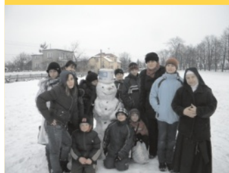
Super zimowisko - str. 3.