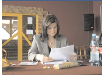
List do redakcji - str. 2.