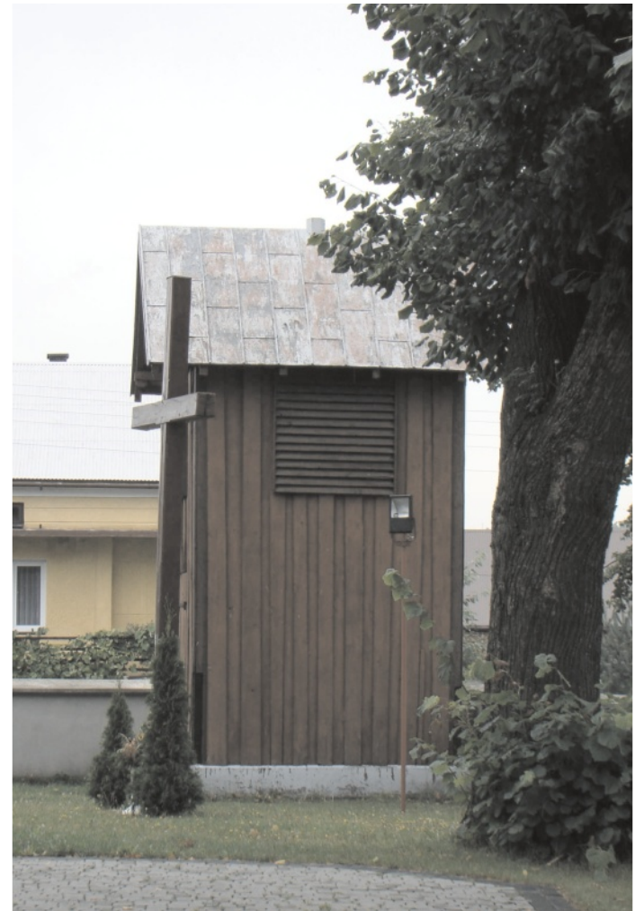
Wkrótce stara dzwonnica w Dłużcu załśni nowym blaskiem, podobnie jak kościół

wnioskującym, m.in. dofinansowania nie dostaną: