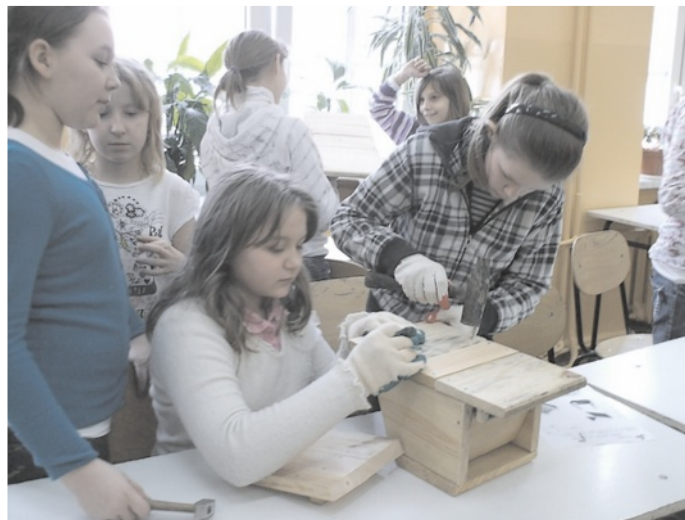
W ruch poszły młotki i gwoździe, i już gotowe były budki dla nietoperzy

Zainteresowanych tematem odsyłamy do strony: http://www.pke-zg.org.pl/nietoperz/