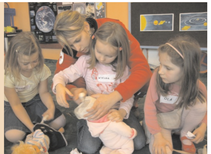
Trening czyni mistrza - lalki i misie służyły do ćwiczeń w bandażowaniu i opatrywaniu ran

Mamy nadzieję, że nauka przez zabawę nie zostanie przez dzieci zapomniana. Zdajemy sobie jednak sprawę, że zdobyte wiadomości i umiejętności dotyczące udzielania pierwszej pomocy na-