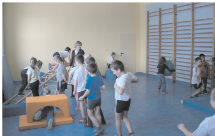
Dzieci z SP 1 w Wolbromiu mają wiele radości z sali zabaw współfinansowanej z programu "Radosna szkoła"

ubiegłorocznych było 10 szkół podstawowych z terenu naszej gminy. Miejsca zabaw tworzone w ramach programu mają rozwijać umiejętności motoryczne, orientację przestrzenną, koncentrację i koordynację wzroku i słuchu. Przygotowują także dzieci do prawidłowego organizowania i spędzania czasu wolnego oraz działania w grupie rówieśników.