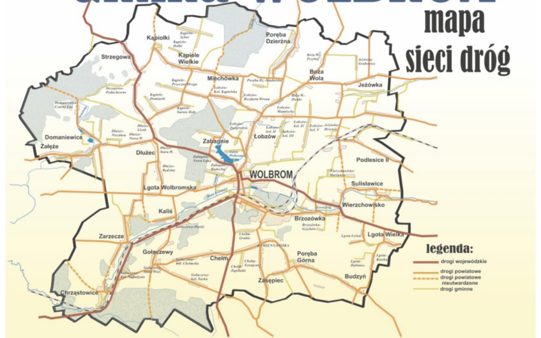
Zasada druga - zidentyfikuj zarządcę drogi