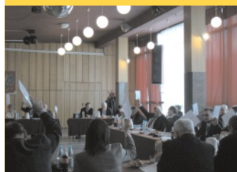
Przeciwko przemocy - str. 4.