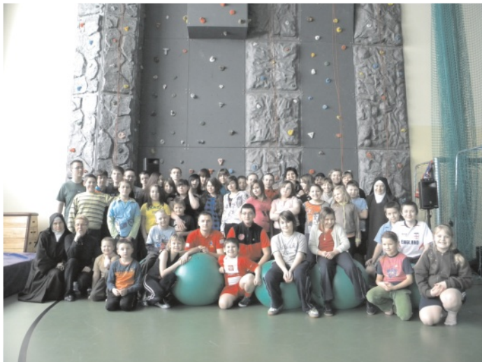
Uczestnicy zimowiska w Krocycach po zajęciach na ścianie wspinaczkowej