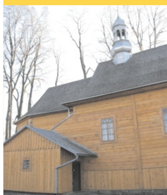
Rozdano dotaje - str. 6.