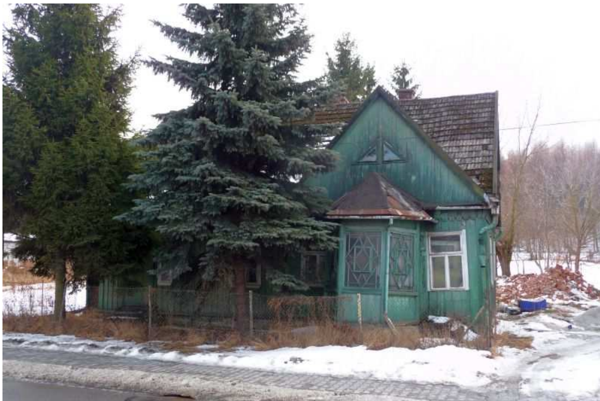
Fot. nr 27. Fasada willi częściowo ukrytej za drzewami iglastymi. (20.02.2012)