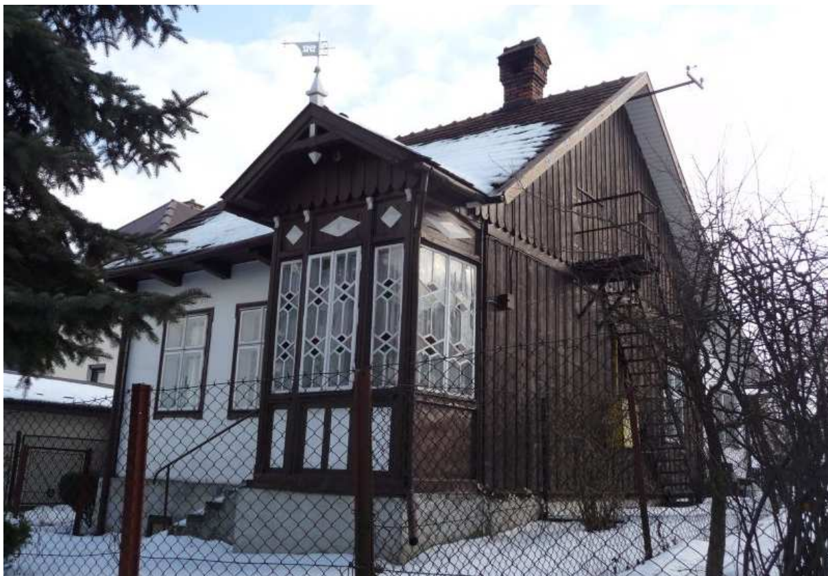
Fot. nr 12. Wyjątkowej urody domek z ulicy Brodzińskiego 8. (20.02.2012)