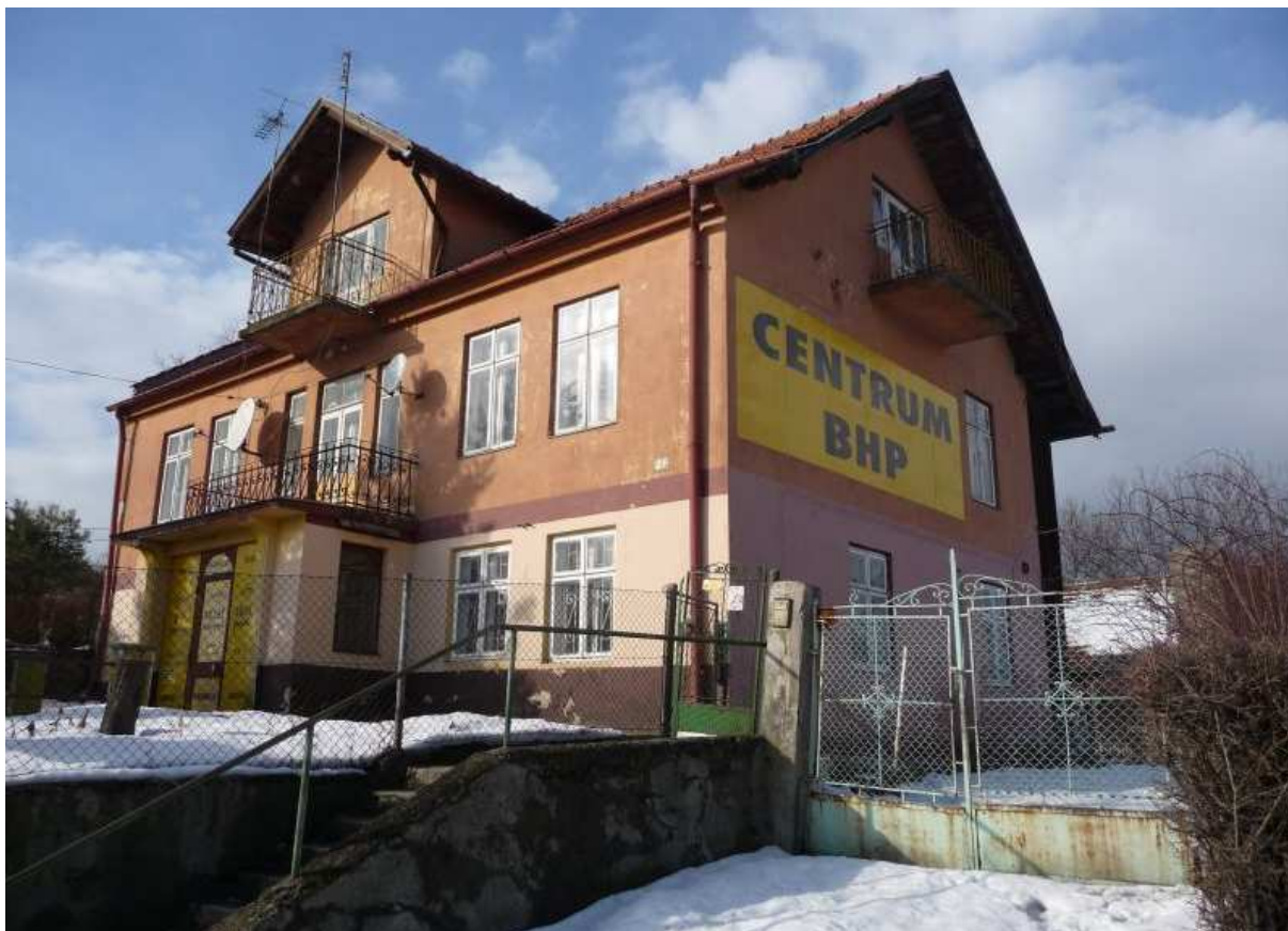
Fot. nr 68. Podmiejska willa z ulicy Brodzińskiego 31. (20.02.2012)