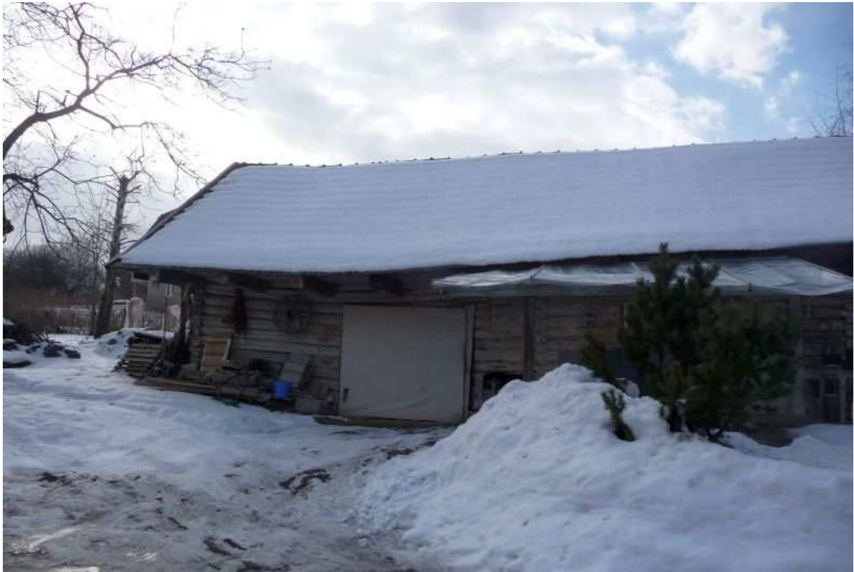
Fot. nr 9. Antyk z ulicy Brodzińskiego 2 - widok od strony podwórka. (20.02.2012)