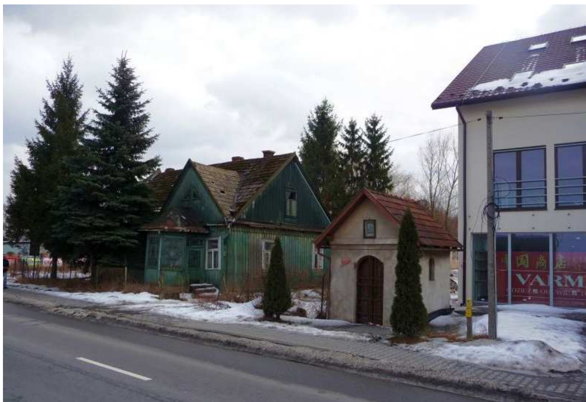
Fot. nr 25 (25-28). Fragment podmiejskiej zabudowy Bochni wokół posesji przy ulicy Brzeskiej 71. (20.02.2012)