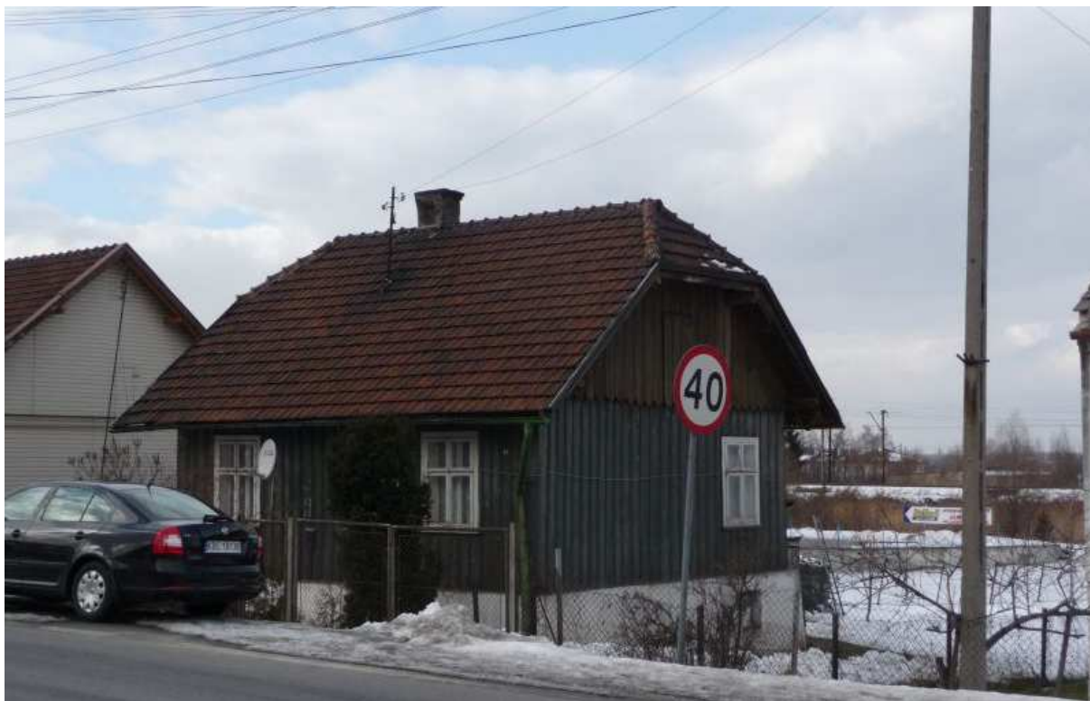
Fot. nr 31 (31-32). Oryginalny dom podmiejski z ulicy Brzeskiej 48 – budynek typowy dla przedwojennej zabudowy przedmieść. (20.02.2012)