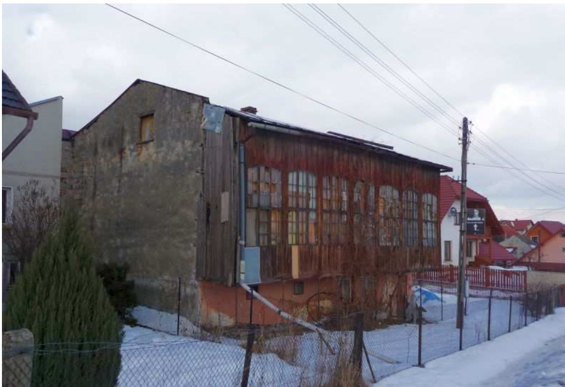
Fot. nr 16. Tajemniczy obiekt, o nieznanym mi przeznaczeniu, z ulicy Brodzińskiego 55. (20.02.2012)