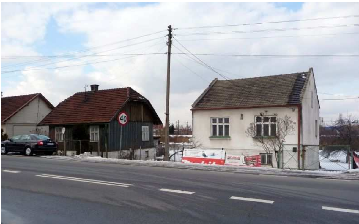
Fot. nr 29. Fragment przedwojennej zabudowy ulicy Brzeskiej, z domami o numerach: 48 i 50 (z lewej). (20.02.2012)