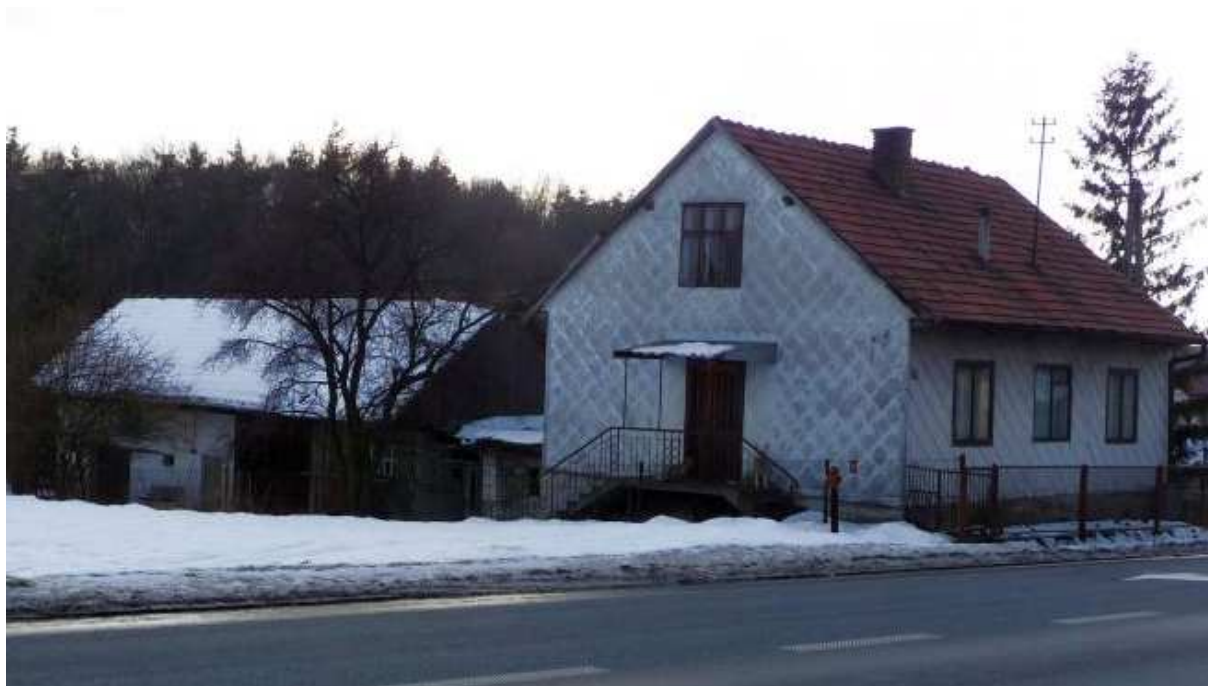
Fot. nr 20. Podmiejska zagroda z ulicy Brodzińskiego 92. (20.02.2012)