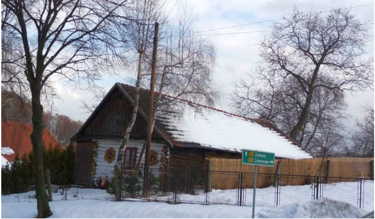
Fot. nr 8 (8-9). Wiejska chałupa, z pewnością z XIX-to wieczną metryką, z ulicy Brodzińskiego 2. (20.02.2012)