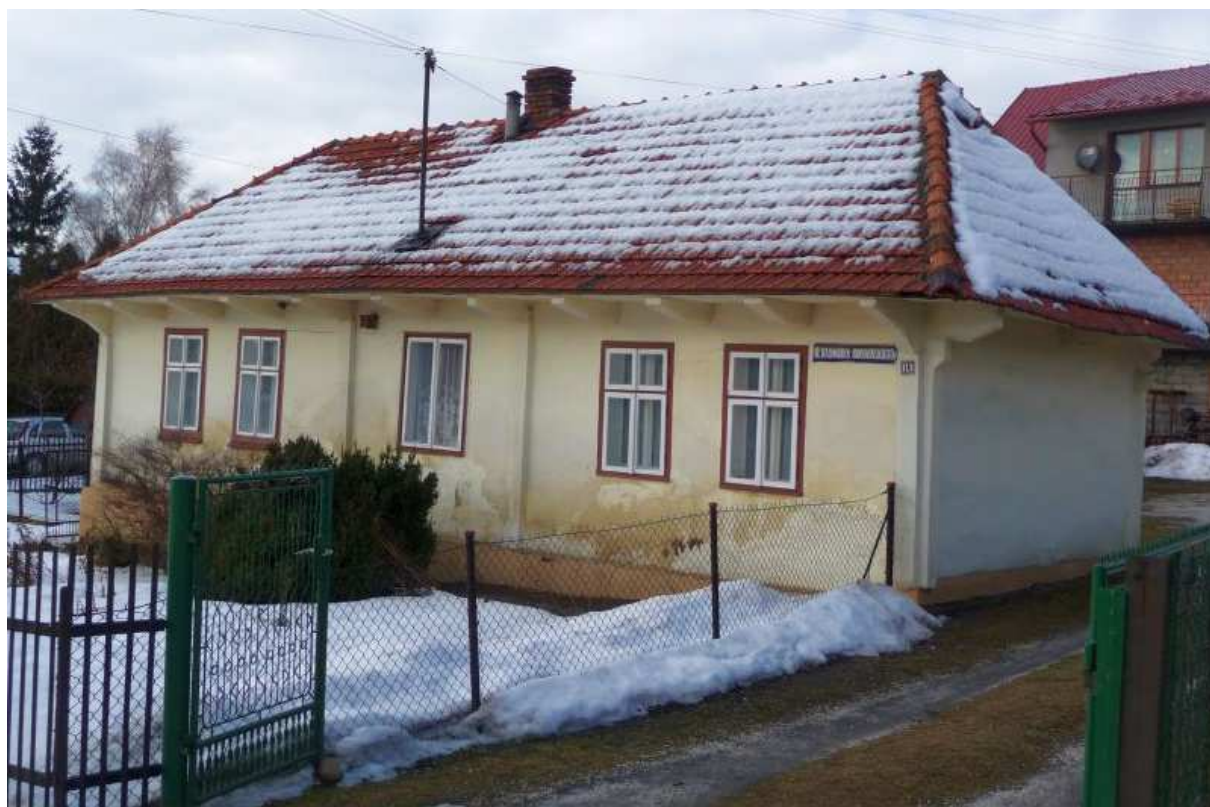
Fot. nr 79 (79-81). Zapewne blisko stuletni oryginał z ulicy Brodzińskiego 113, którego pierwotna faktura, raczej drewniana, została pokryta tynkiem. (20.02.2012)