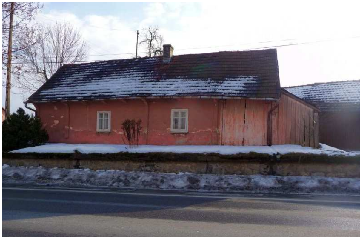
Fot. nr 64. Fasada chałupy, do której przylega część gospodarcza. (20.02.2012)