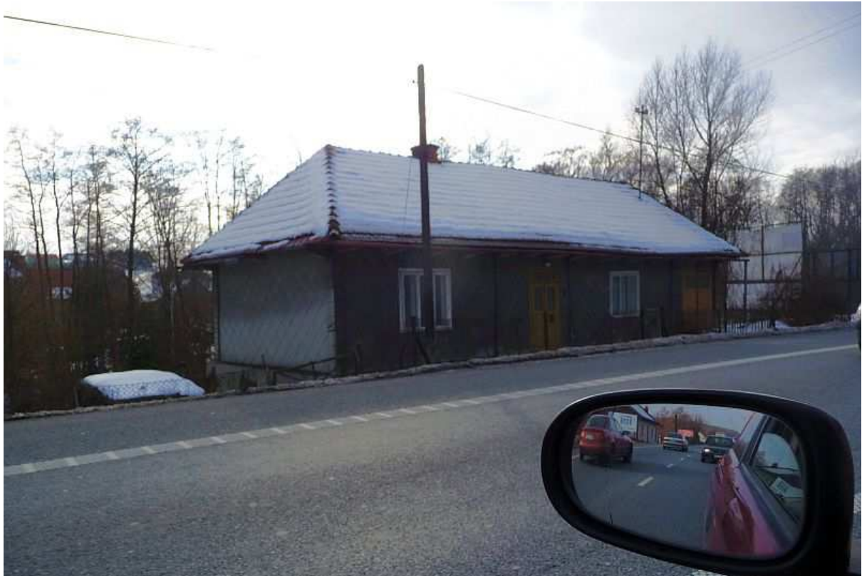
Fot. nr 88. Całość chałupy uchwycona z samochodu. (20.02.2012)