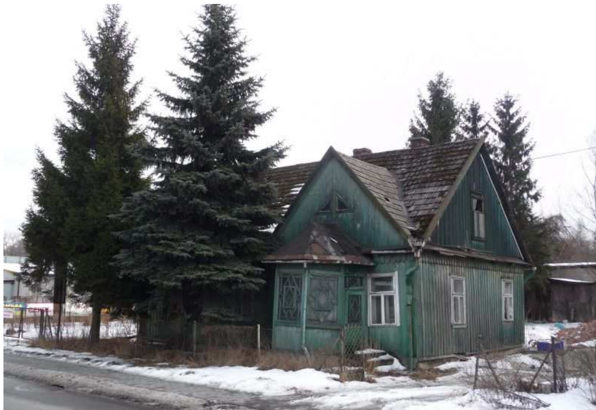
Fot. nr 2. Pełna uroku willa podmiejska z ulicy Brzeskiej 71. (20.02.2012)

W Bochni nadal zachowało się wiele reliktyw oryginalnej, podmiejskiej zabudowy, zarówno z czasów galicyjskich, jak i przedwojennych oraz domów z okresu tuż po II wojnie światowej, ale stan i perspektywy przetrwania tych najcenniejszych obiektów muszą budzić niepokój. Wzdłuż ulicy Brzeskiej udało mi się odnaleźć kilka interesujących chałup i budynków podmiejskich (fot. nr: 2-9 i 11-19 oraz 25-48 i 52-85), z których najcenniejsze to: mocno zniszczony już dom pod nr 71 (fot. nr: 2 i 25-28) oraz podmiejska chatka pod nr 47 (fot. nr: 4 i 33-37).