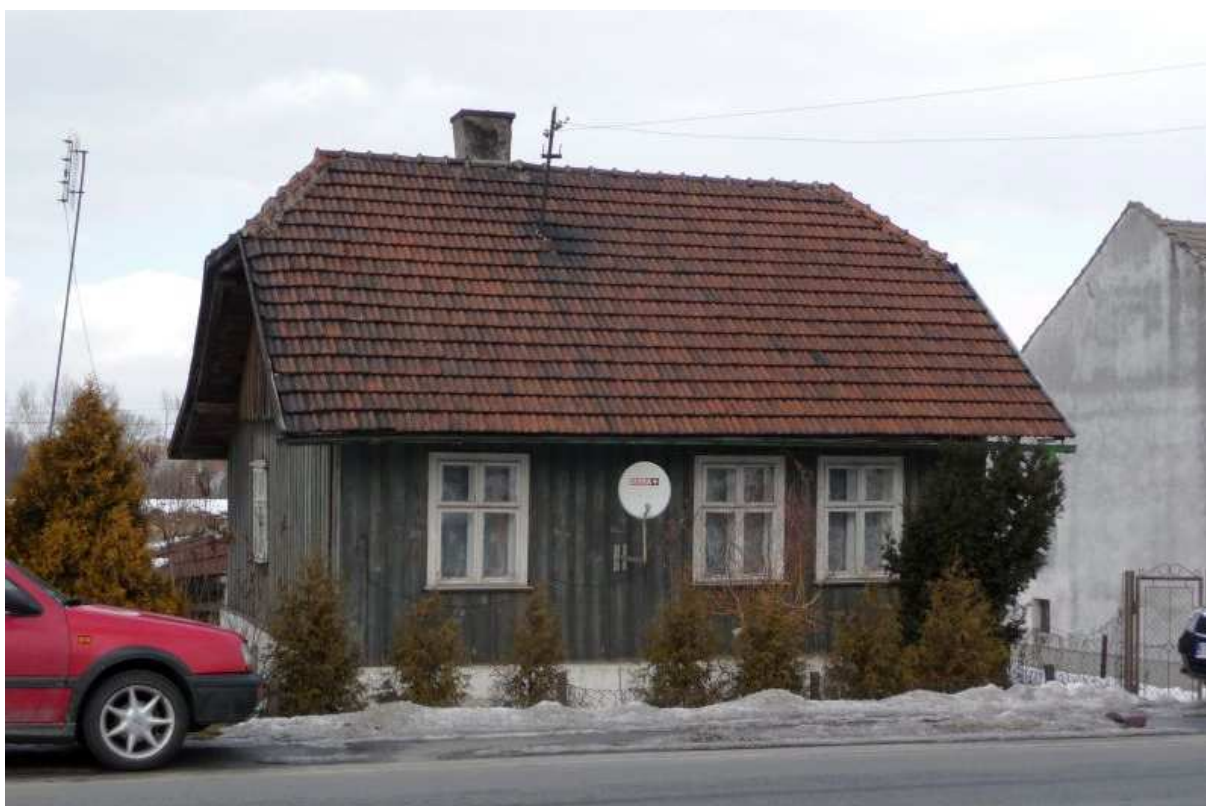
Fot. nr 32. Fasada domku z ulicy Brzeskiej 48. (20.02.2012)