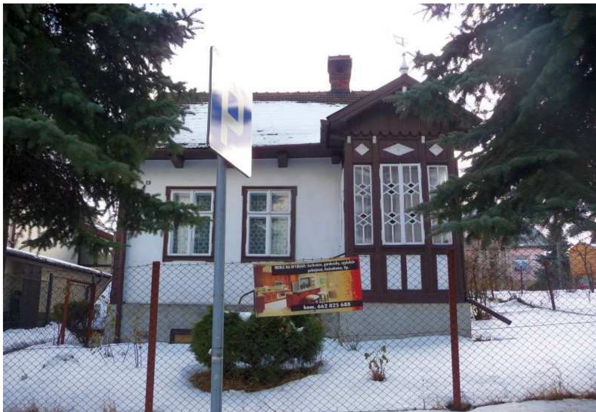
Fot. nr 55 (55-58). Podmiejski dom z ulicy Brodzińskiego 8, kolejny ciekawy przykład z dawnego świat przedmieść Bochni z okolic przełomu I i II ćwierci XX w. (20.02.2012)