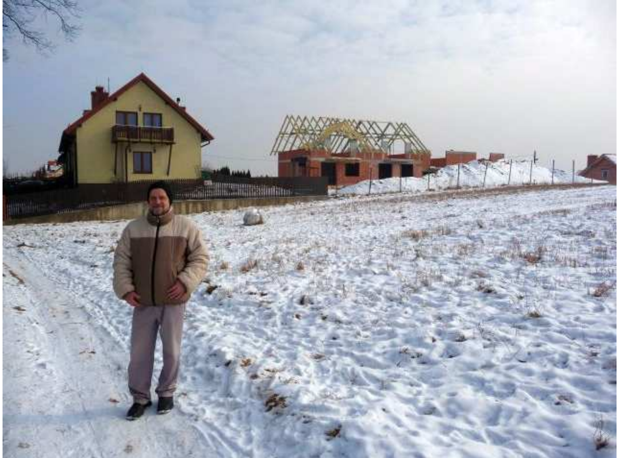
Fot. nr 1. Na Chabrowym Wzgórzu w podwielickich Krzyszkowicach. (2012)