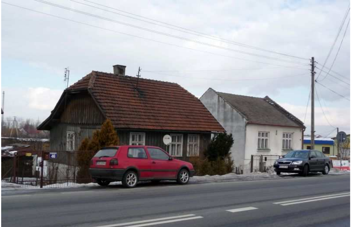
Fot. nr 3. Fragment podmiejskiej zabudowy Bochni w końcowym odcinku ulicy Brzeskiej – domy u numerach (od lewej): 48 i 50. (20.02.2012)