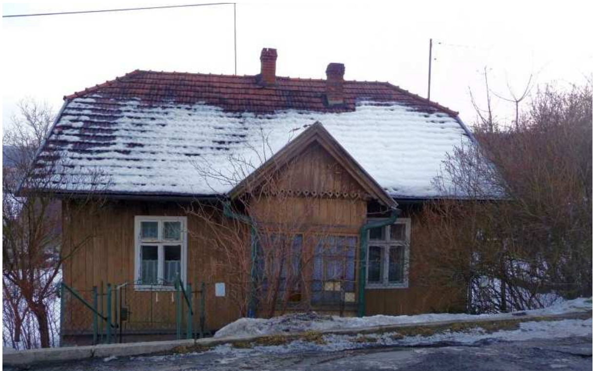
Fot. nr 73. Fasada domku, który dziś stoi sporo poniżej poziomu ulicy. (20.02.2012)