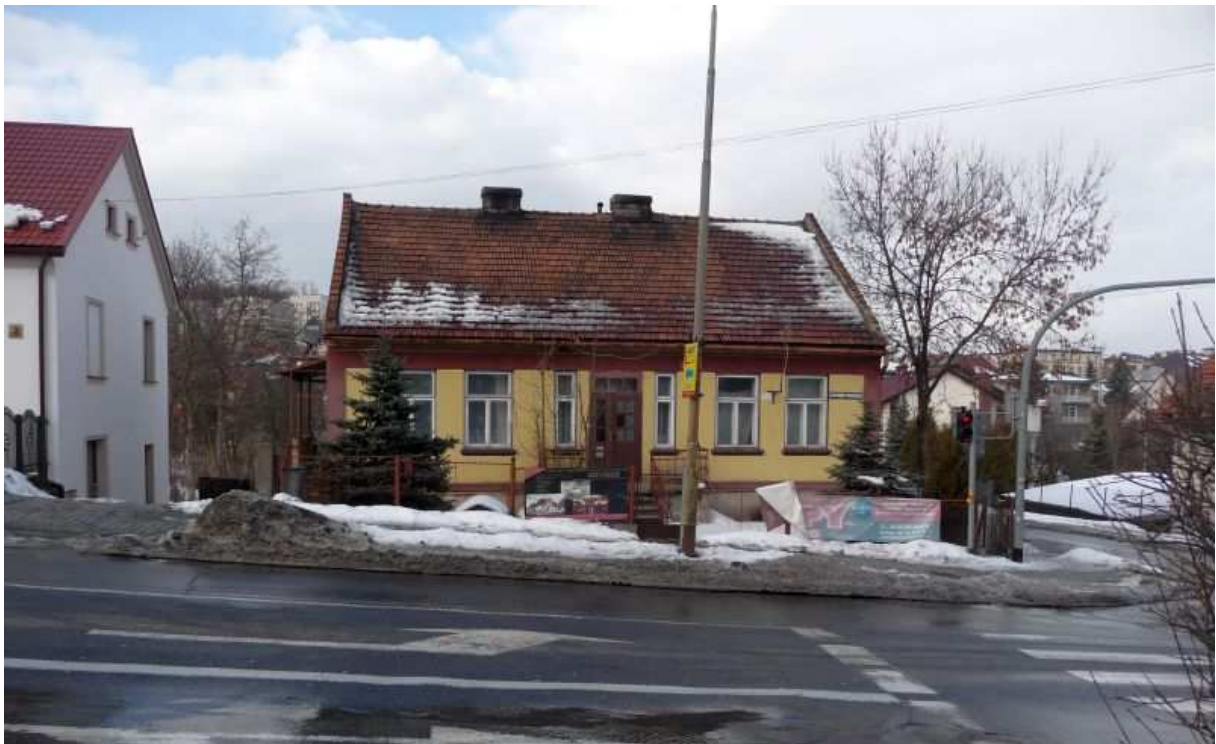
Fot. nr 42 (42-43). Drugi kraniec Bochni, przylegający wylowego fragmentu gościńca biegnącego z Tarnowa do Krakowa – murowany dom, zapewne z I ćwierci XX-go wieku, z ulicy Brodzińskiego 1. (20.02.2012)