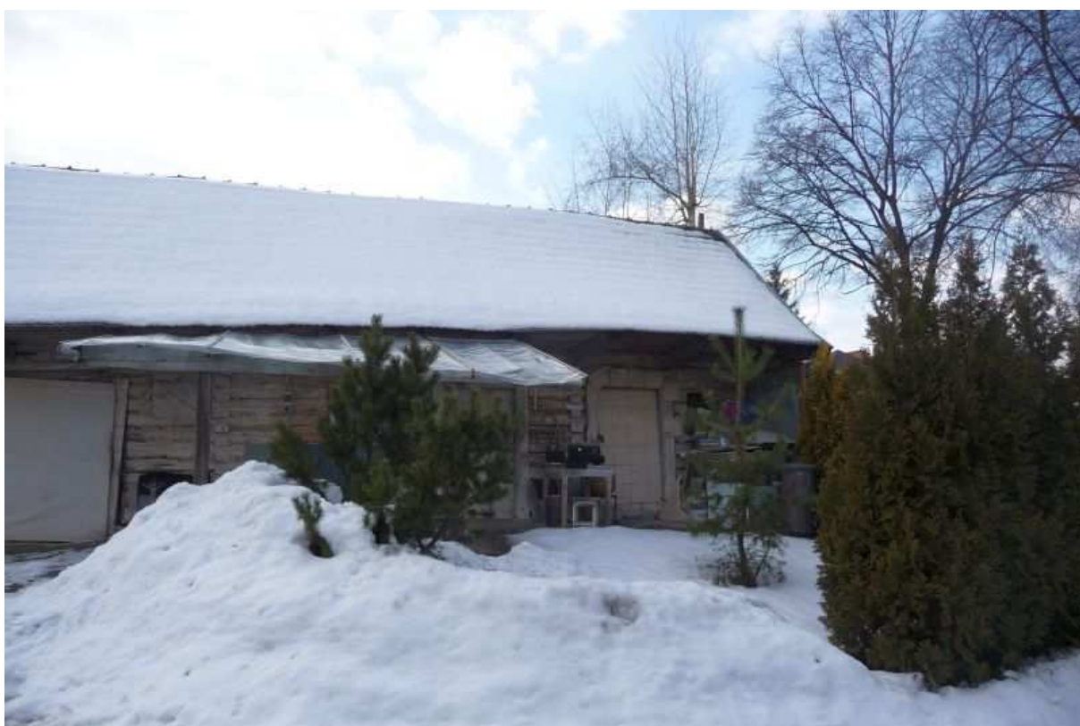
Fot. nr 48. Detale tylnej części antyku z ulicy Brodzińskiego 2. (20.02.2012)