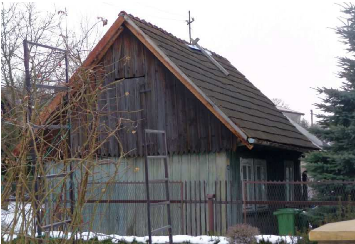
Fot. nr 35. Próba uchwycenia fasady przysłoniętej przez drzewa iglaste. (20.02.2012)