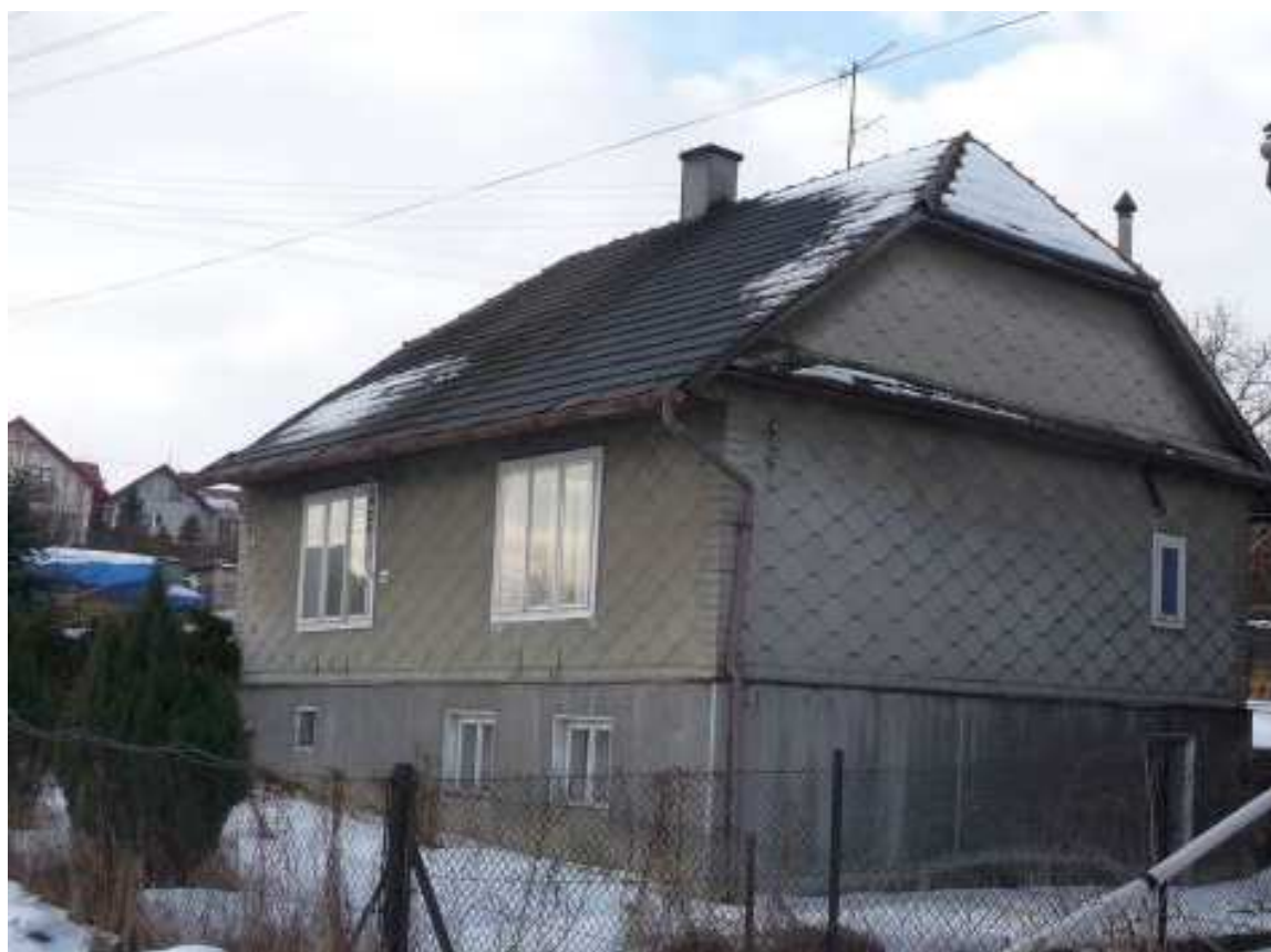
Fot. nr 17. Jeden z wielu tego typu domków w tej okolicy z ulicy Brodzińskiego 57. (20.02.2012)