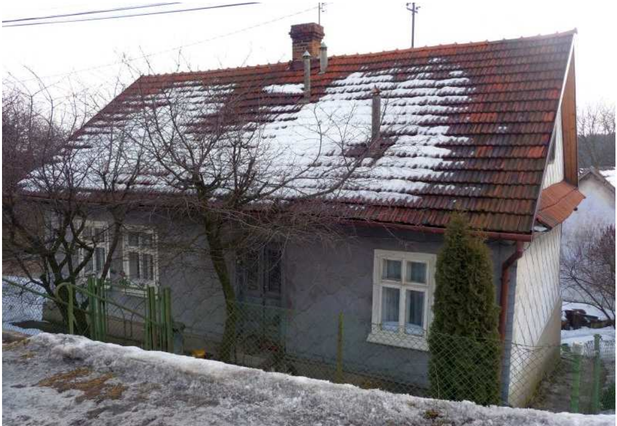
Fot. nr 76. Dawne pochodzenie tego blisko stuletniego domku podkreśla jego znaczne obniżenie w stosunku do aktualnego poziomu jezdní. (20.02.2012)