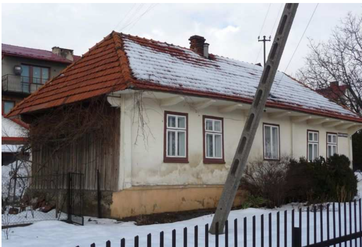
Fot. nr 21. Urokliwy oryginał z ulicy Brodzińskiego 113. (20.02.2012)