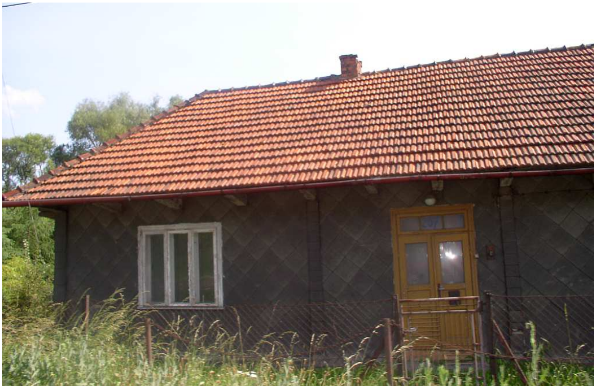
Fot. nr 87 (87-88). Kolejna łapczycka chałupa przylegająca do dawnego krakowskiego gościńca (pod nr 207), którą można datować na II ćwierć XX wieku. Tu uchwycony z samochodu jej lewy fragment z łuskową boazerią i nieoryginalnym oknem. (18.07.2009)