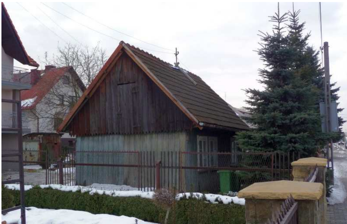
Fot. nr 33 (33-37). Oryginalna, podmiejska chałupa, zapewne jeszcze XIX-wiecznymi korzeniami, z ulicy Brzeskiej 47. (20.02.2012)