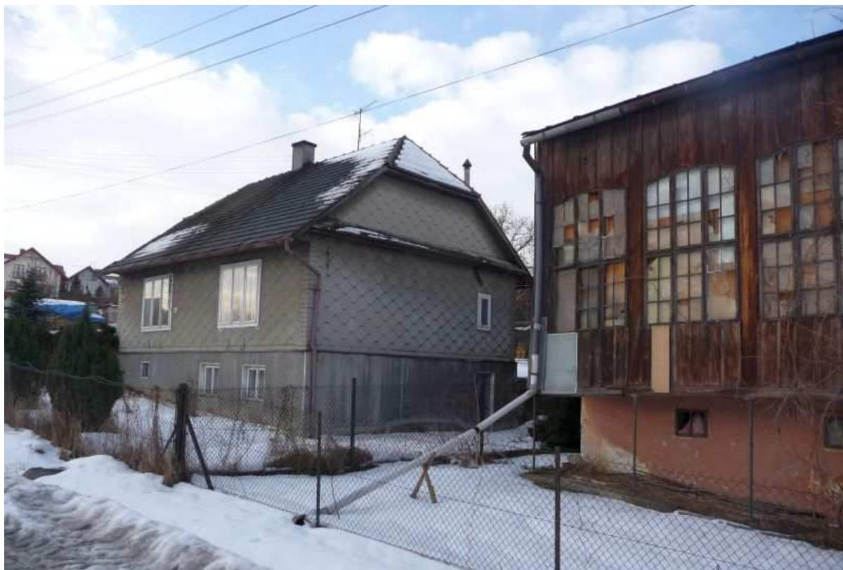
Fot. nr 70. Fragment dawnej zabudowy bocheńskiego przedmieścia w końcowym odcinku ulicy Brodzińskiego o numerach: 55 i 57. (20.02.2012)