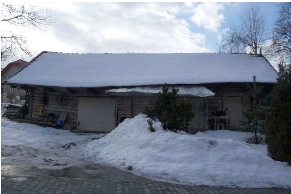
Fot. nr 47. Tylna część wiejskiej chałupy. (20.02.2012)