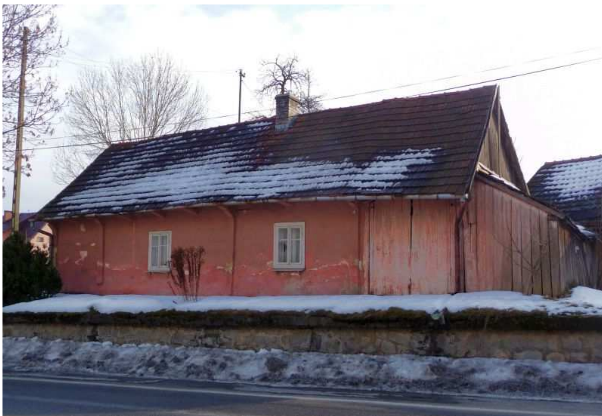
Fot. nr 65. Jeszcze jedno ujęcie bocheńskiego antyku od strony ulicy. (20.02.2012)