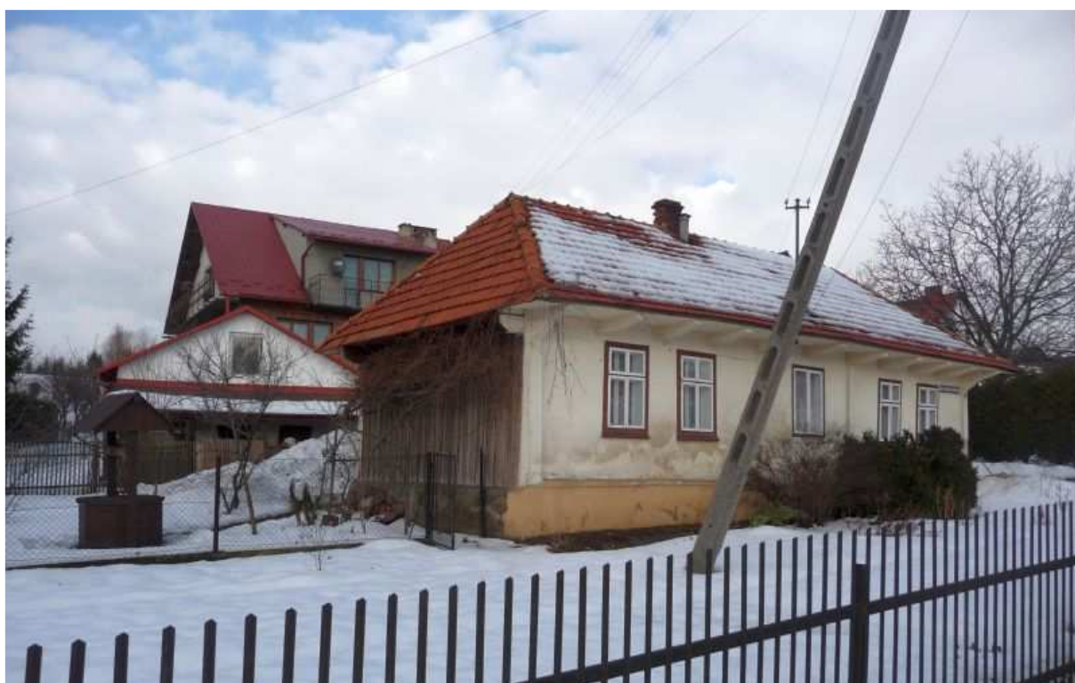
Fot. nr 81. W klimacie przedwojennej Łączycy. (20.02.2012)