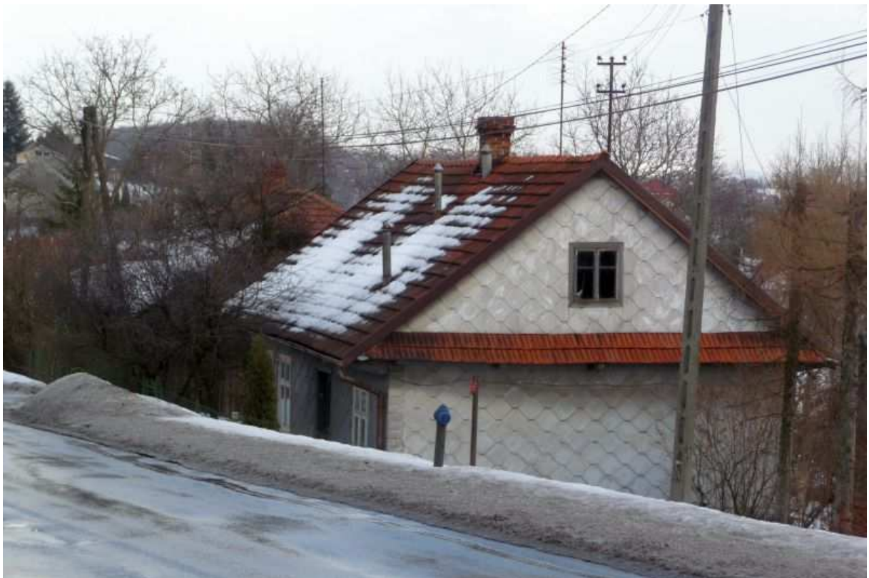
Fot. nr 77. Ujęcie z poziomu ulicy Brodzińskiego. (20.02.2012)