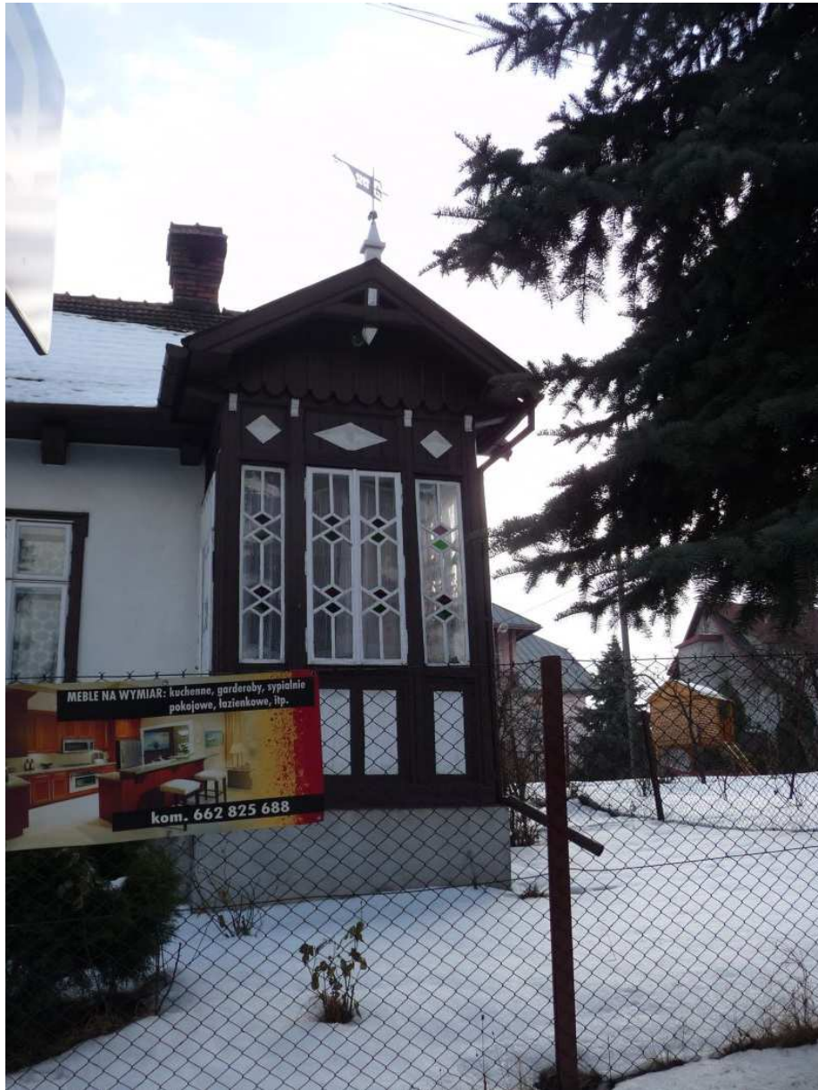
Fot. 57. Rzadki już przykład tak efektownego ganku z mozaiką szklaną, wykonanego w stylu kurortowym, którego wygląd przez lata nie uległ zmianie. (20.02.2012)