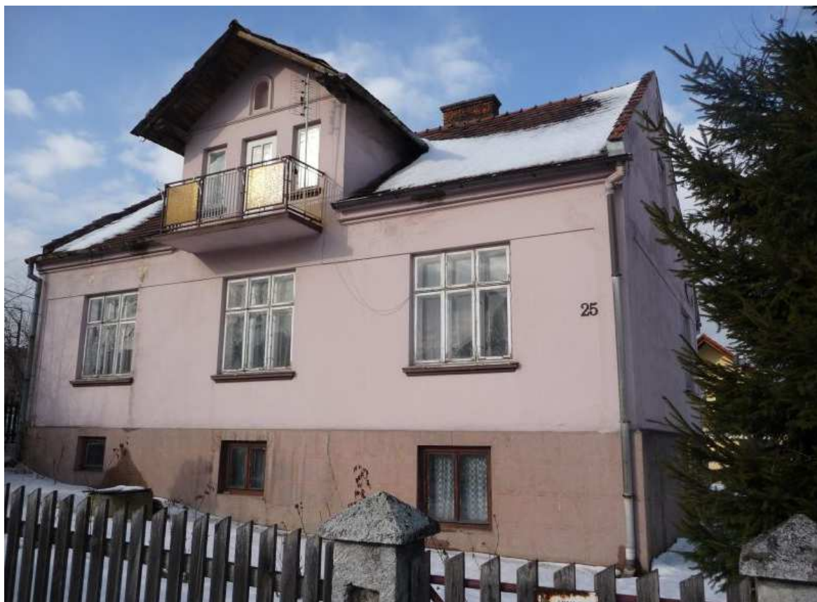
Fot. nr 61 (61-62). Oryginalna fasada willi z ulicy Brodzińskiego 25. (20.02.2012)