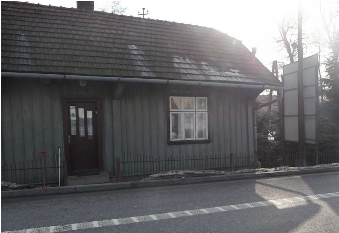
Fot. nr 86. Fragment obitego boazerią, może jeszcze przedwojennego łapczyckiego domu ze środkowej części wsi (pod nr 79). Okno jest w nim ciągle oryginalne. (20.02.2012)