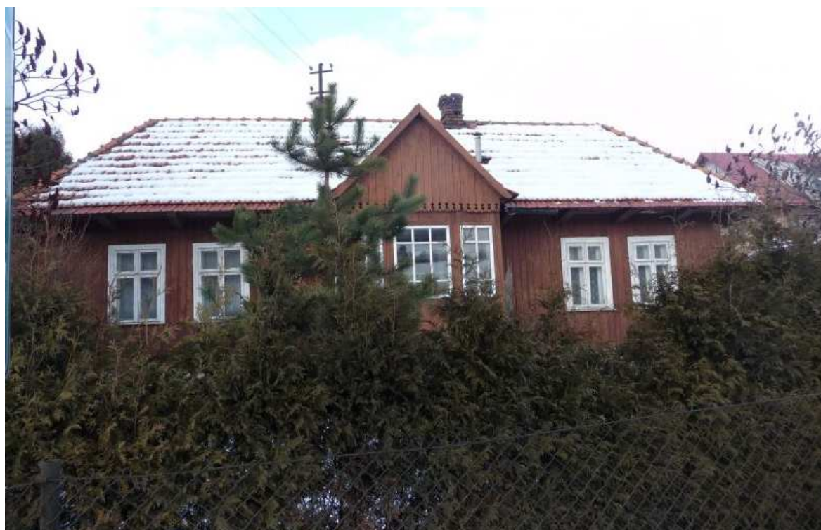
Fot. nr 83. Fasada domu, który zachował oryginalną stolarkę ganku i okien. (20.02.2012)