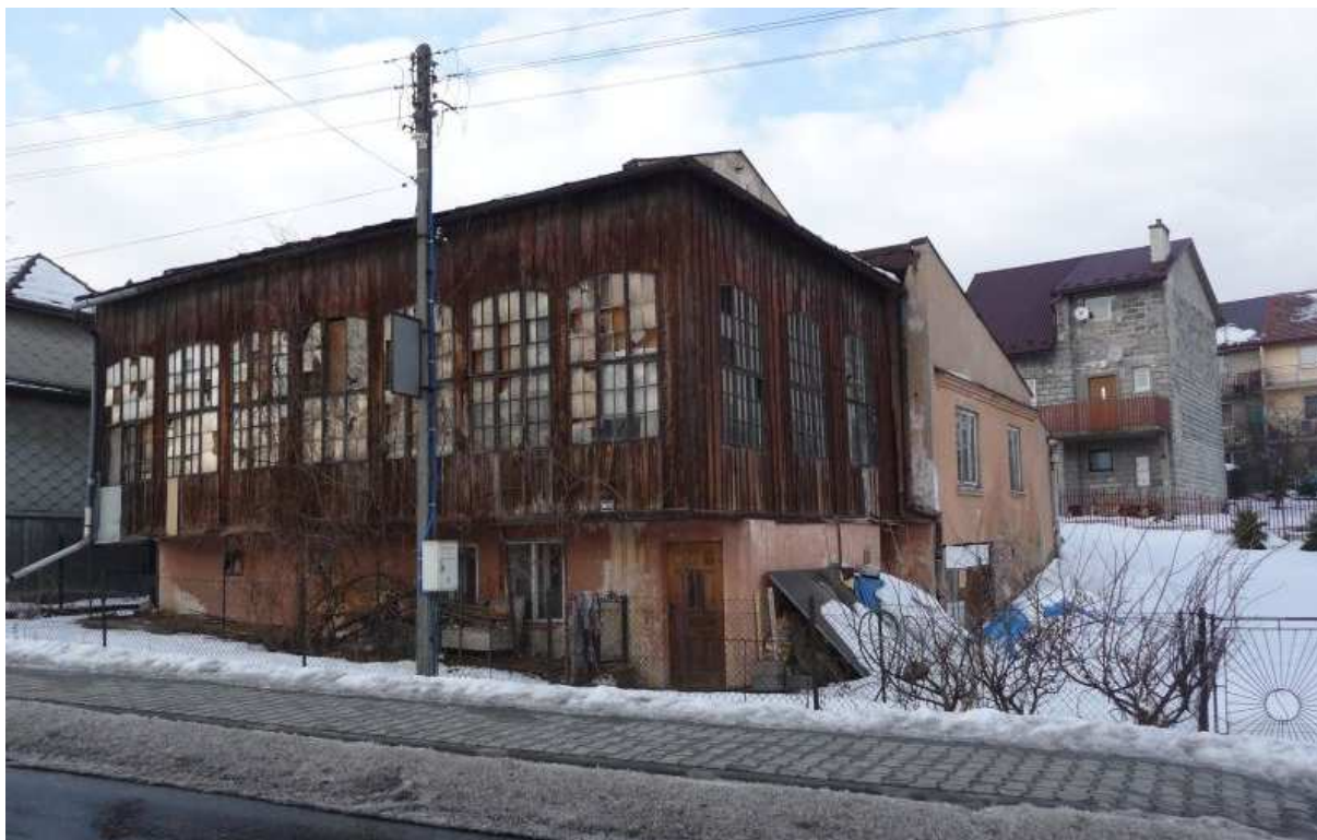
Fot. nr 69. Ruina nieznanego mi obiektu (restauracji?) z ulicy Brodzińskiego 55. (20.02.2012)