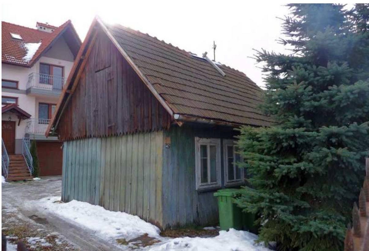
Fot. nr 34. Oryginalna stolarka okienna chaty. (20.02.2012)