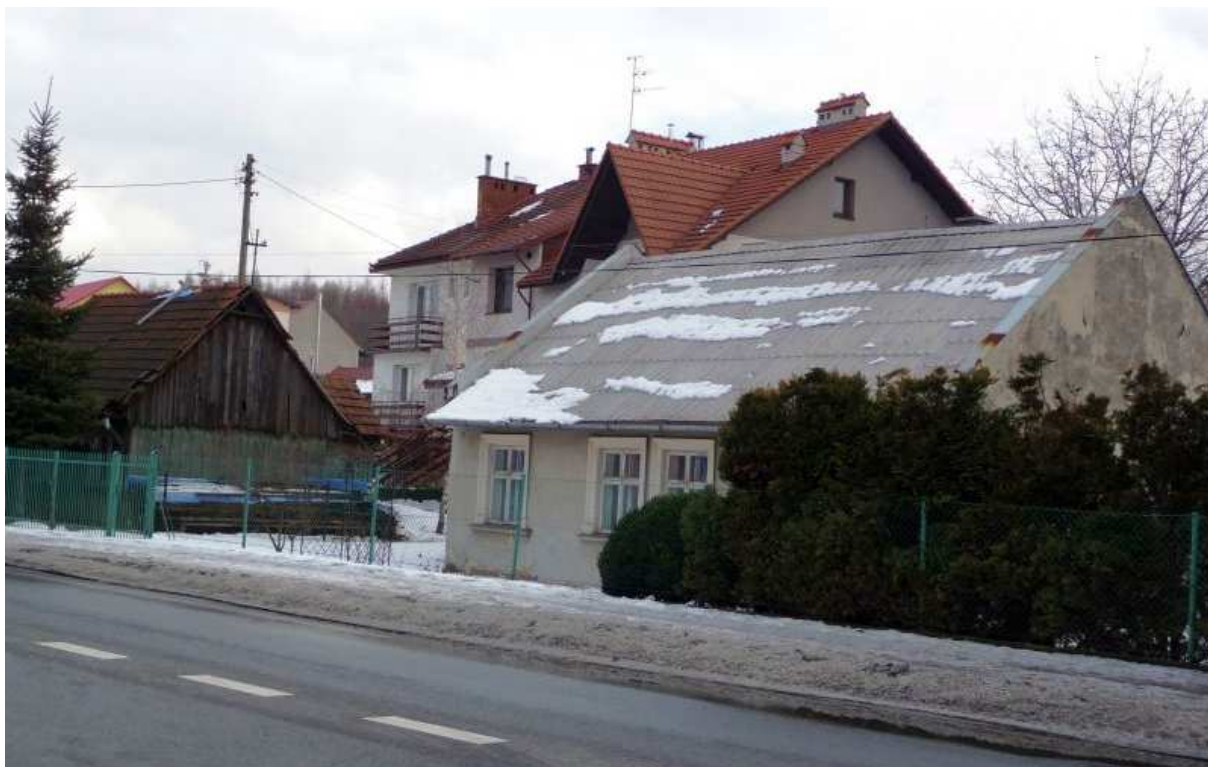
Fot. nr 39. Fragment zabudowy krańca Bochni, która dominowała jeszcze 30 lat temu. (20.02.2012)