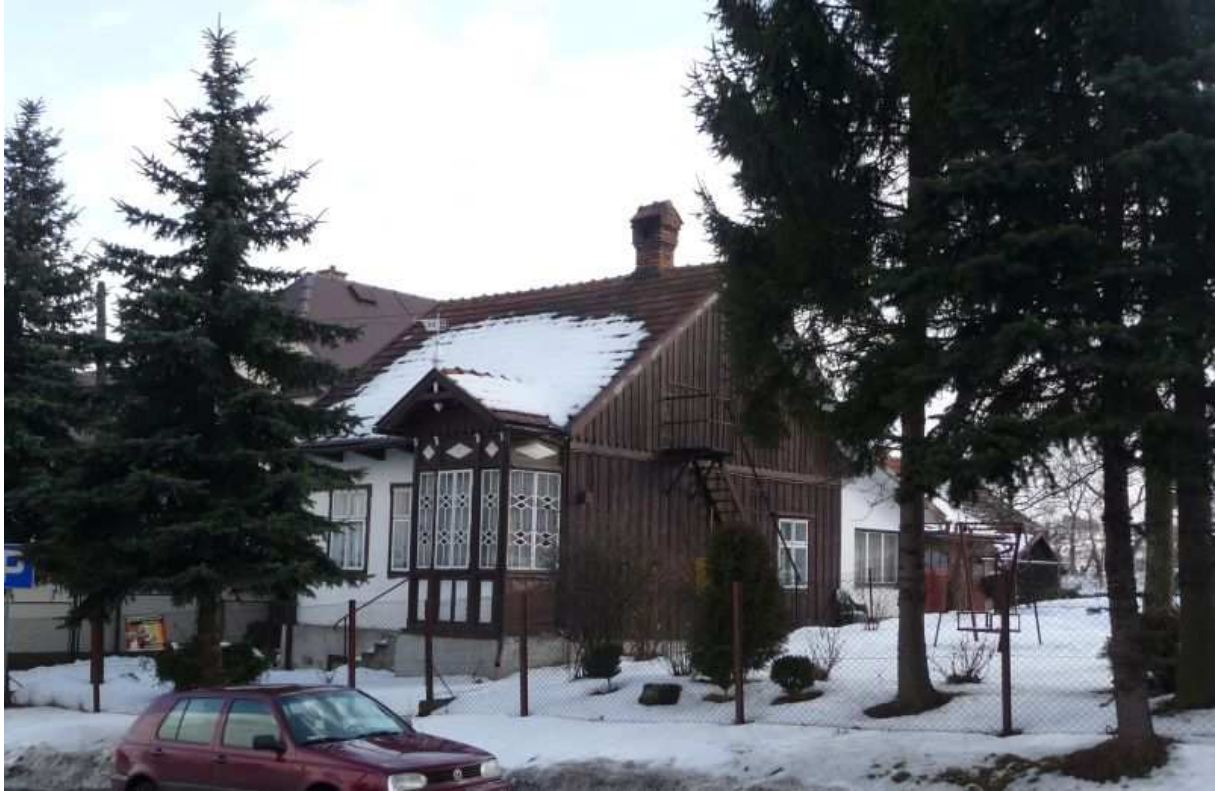
Fot. nr 58. Jeszcze na jedno spojrzenie na domek z ulicy Brodzińskiego 8. (20.02.2012)