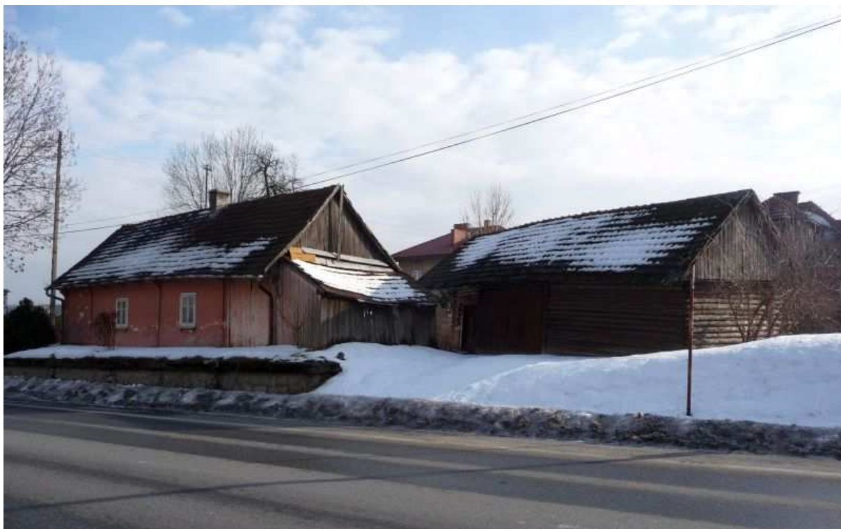
Fot. nr 66. Całość zagrody z ulicy Brodzińskiego 16. (20.02.2012)