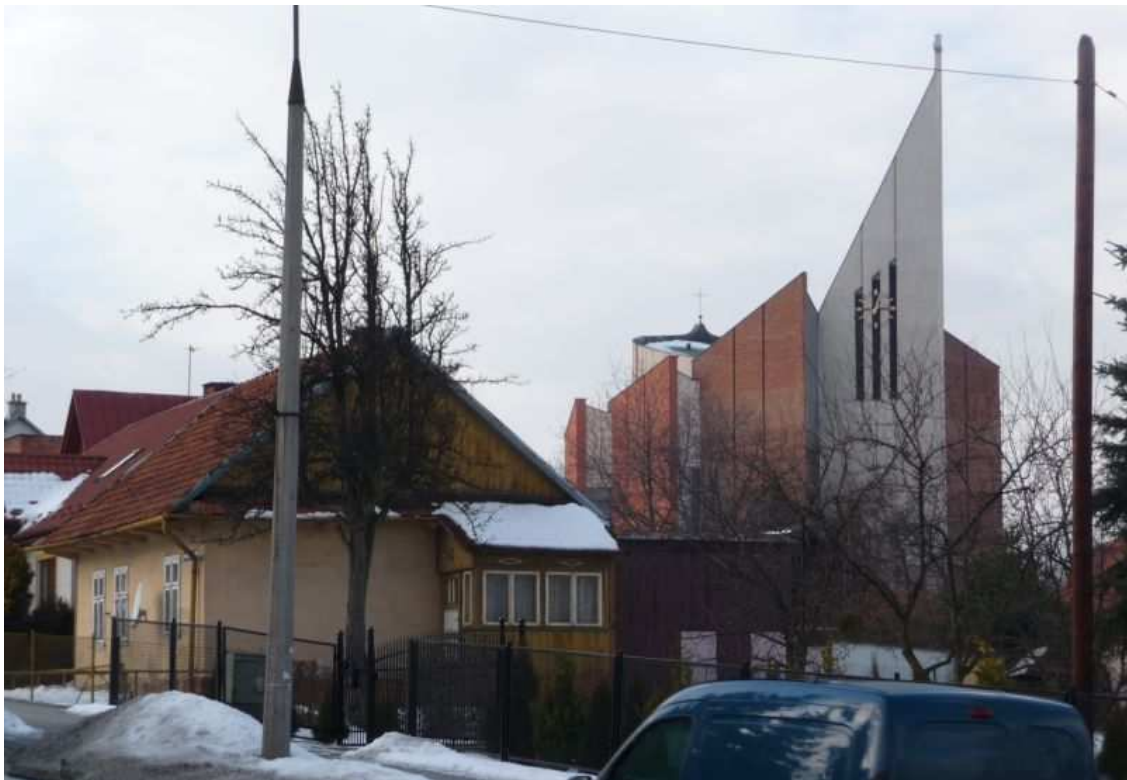
Fot. nr 11. Dwa świątły Bochni wokół ulicy Brodzińskiego. Z lewej domek pod nr 15. (20.02.2012)