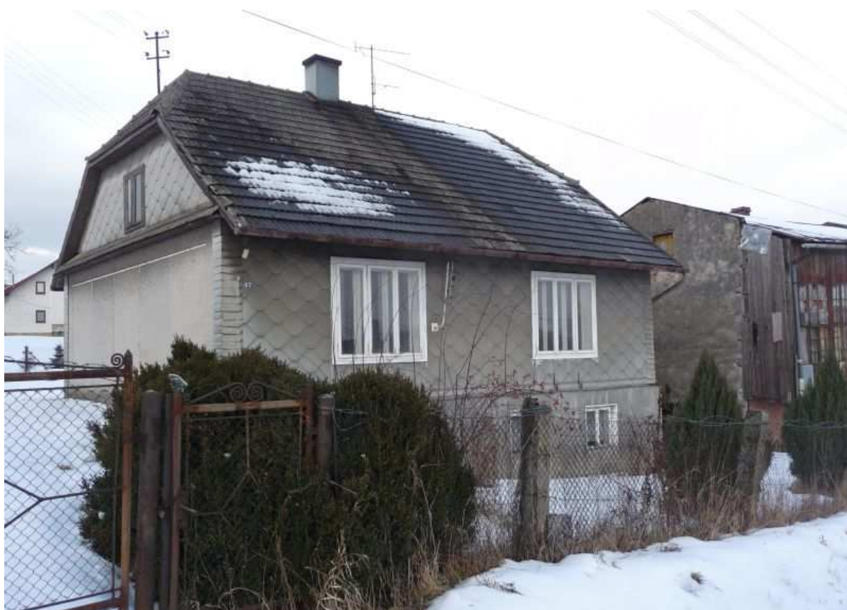
Fot. nr 71. Podmiejski domek z ulicy Brodzińskiego 57, który mógł powstać tuż po II wojnie światowej i jego łuskowata boazeria. (20.02.2012)