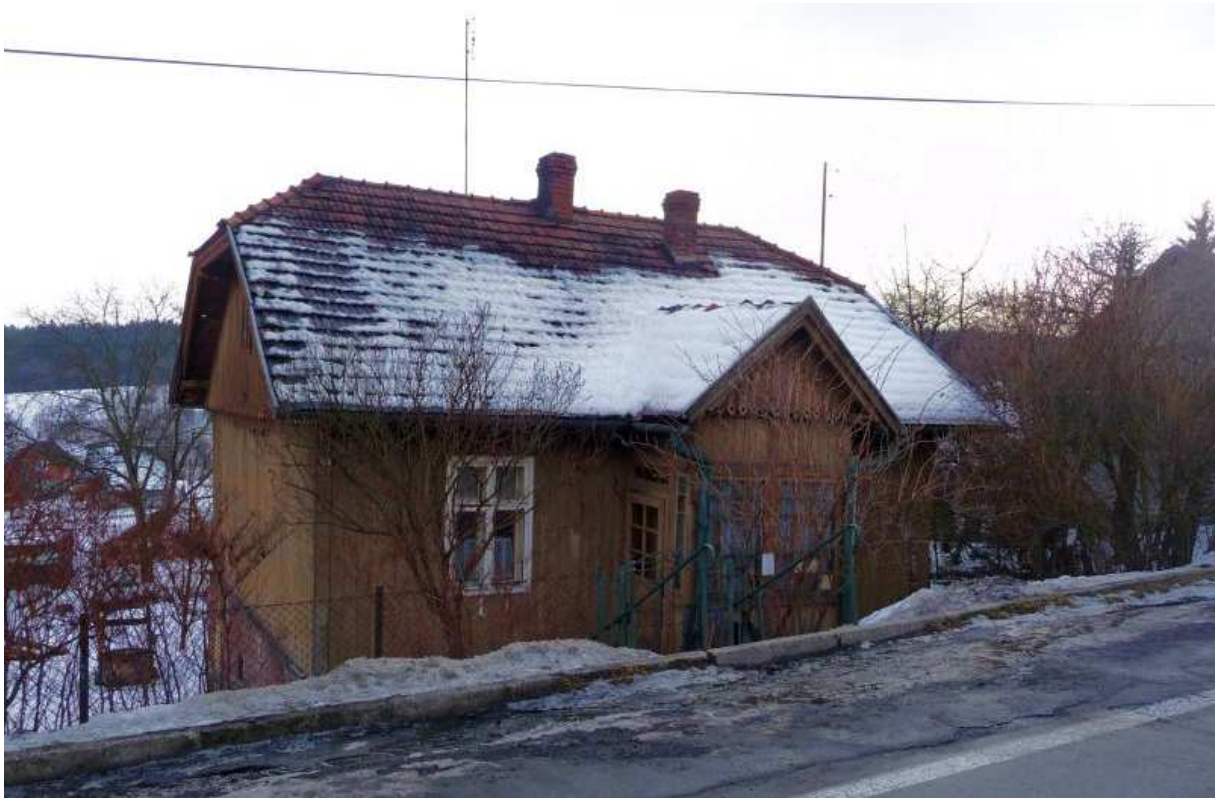
Fot. nr 72 (72-74). Kilka ujęć oryginalnego domu podmiejskiego, wybudowanego zapewne w latach międzywojennych, z ulicy Brodzińskiego 44. (20.02.2012)