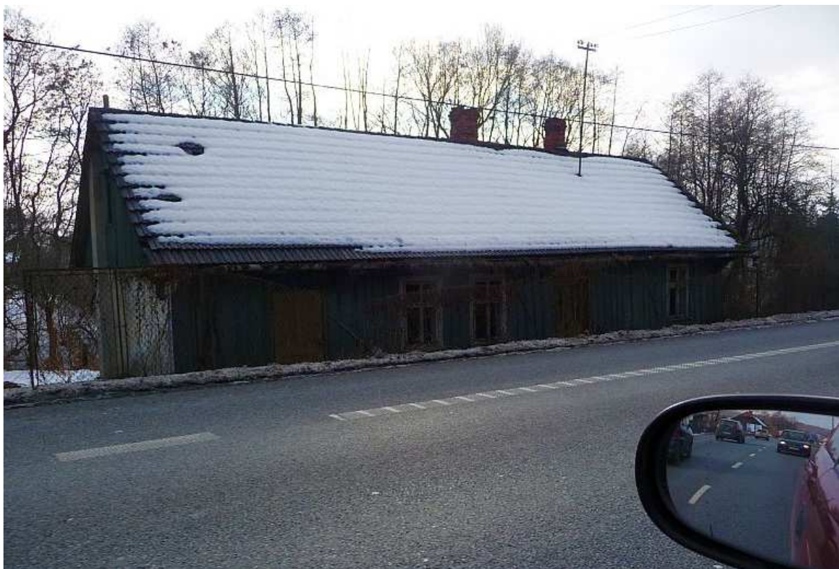
Fot. nr 89. Ruina oryginalnej chałupy spod nr 198 ze środkowej części Łapczycy, która mogła powstać w okolicy przełomu I i II ćwierci XX wieku. (20.02.2012)