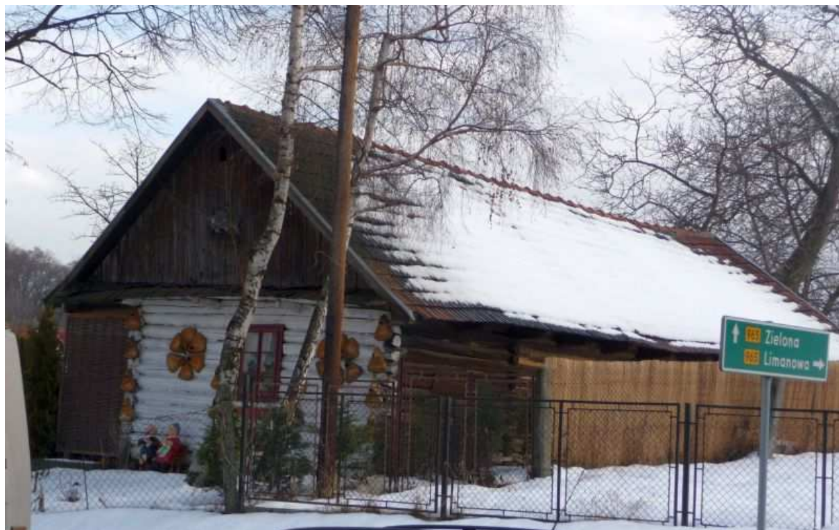
Fot. 45. Książkowy wręcz przykład dawnej zabudowy podbocheńskiej wsi. (20.02.2012)