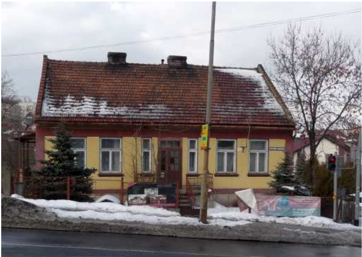
Fot. nr 7. Podmiejski dom, zapewne z początku XX-go wieku, z ulicy Brodzińskiego 2. (20.02.2012)

Warto też zwrócić uwagę na zabytkową figurę z początku ulicy Brodzińskiego, która została posadowiona pod koniec XIX-go wieku, w roku 1897 (fot. nr: 10 oraz 49-51); nadal jest ona dobrze wkomponowana w zachowaną tu podmiejską zabudowę, choć inskrypcja na jej cokole nie jest do końca czytelna.