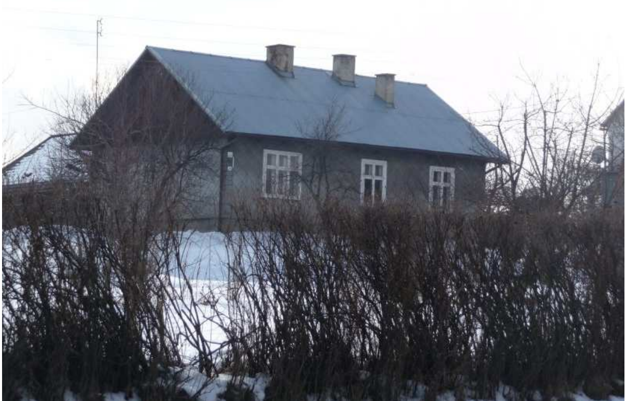
Fot. nr 59. Rozległy dom wielorodzinny z ulicy Kolanowskiej 6, ukryty w głębi ulicy Brodzińskiego. (20.02.2012)