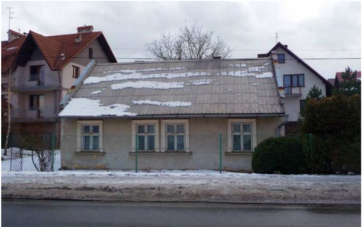
Fot. nr 38 (38-39). Podmiejski oryginał, zapewne z okolic połowy XX-go wieku, z ulicy Brzeskiej 45. (20.02.2012)