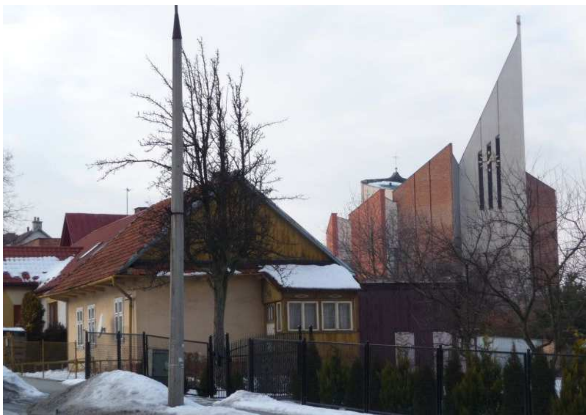
Fot. nr 52. Dwa świątynie współczesnej Bochni; pierwszy z lewej oryginalny domek podmiejski z ulicy Brodzińskiego 15a z prawej współczesny kościół p.w. św. Pawła Apostoła. (20.02.2012)