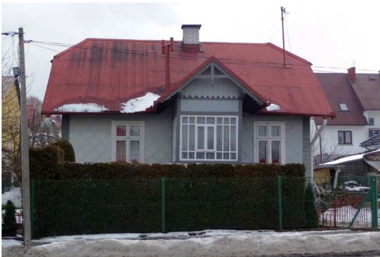
Fot. nr 40 (40-41). Oryginalny domek, może jeszcze przedwojenny, z ulicy Brzeskiej 35. (20.02.2012)