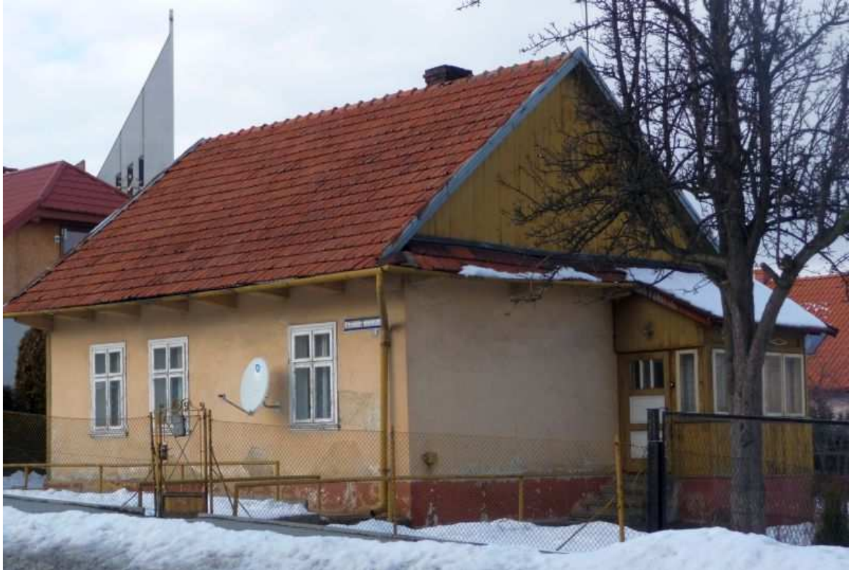
Fot. nr 53 (53-54). Oryginał zapewne z lat międzywojennych z ulicy Brodzińskiego 15. (20.02.2012)