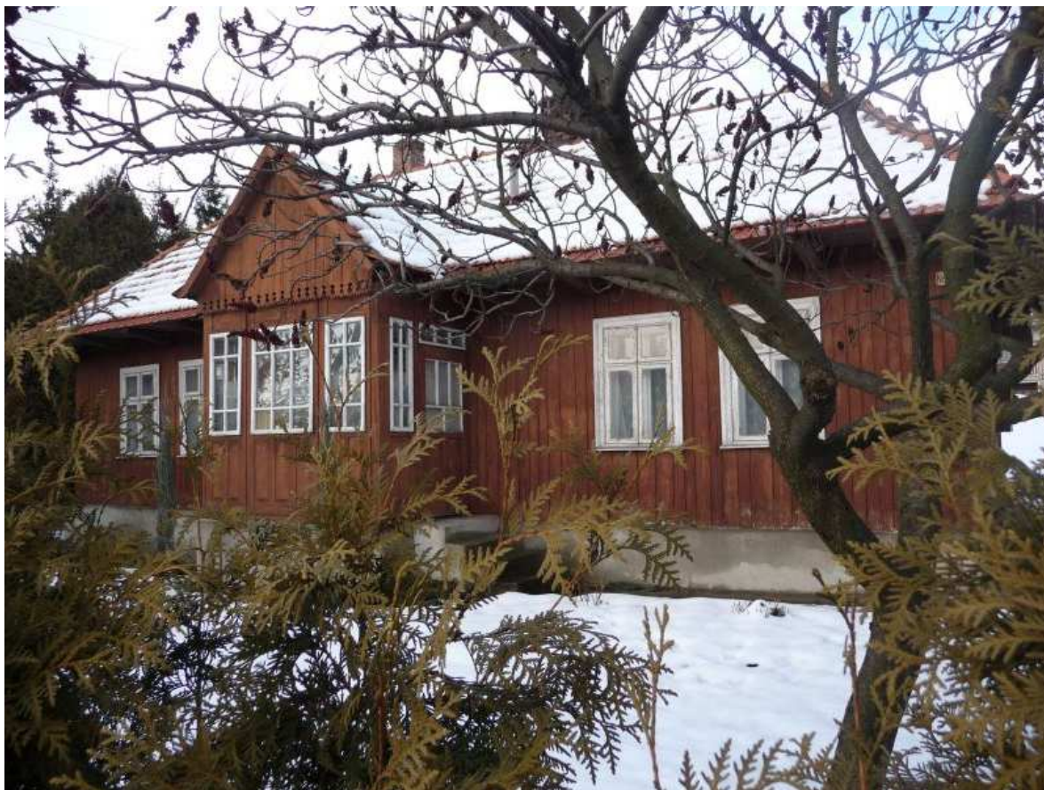
Fot. nr 82 (82-85). Efektowny dom mieszkalny z ozdobnym gankiem przy granicy z Łapczycą, zlokalizowany przy Obwodnicy pod nr 267. (20.02.2012)