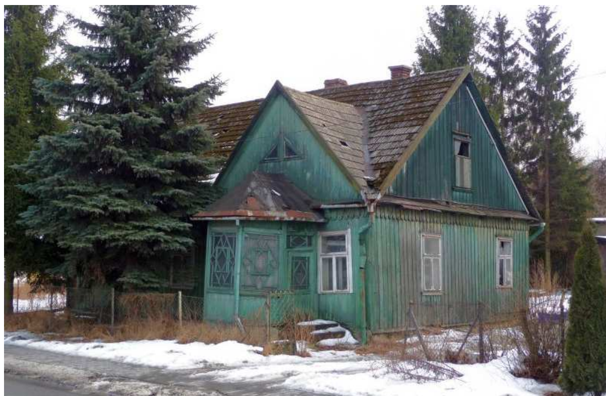
Fot. nr 26. Oryginalna i pełen uroku ganek willi z ulicy Brzeskiej 71. (20.02.2012)