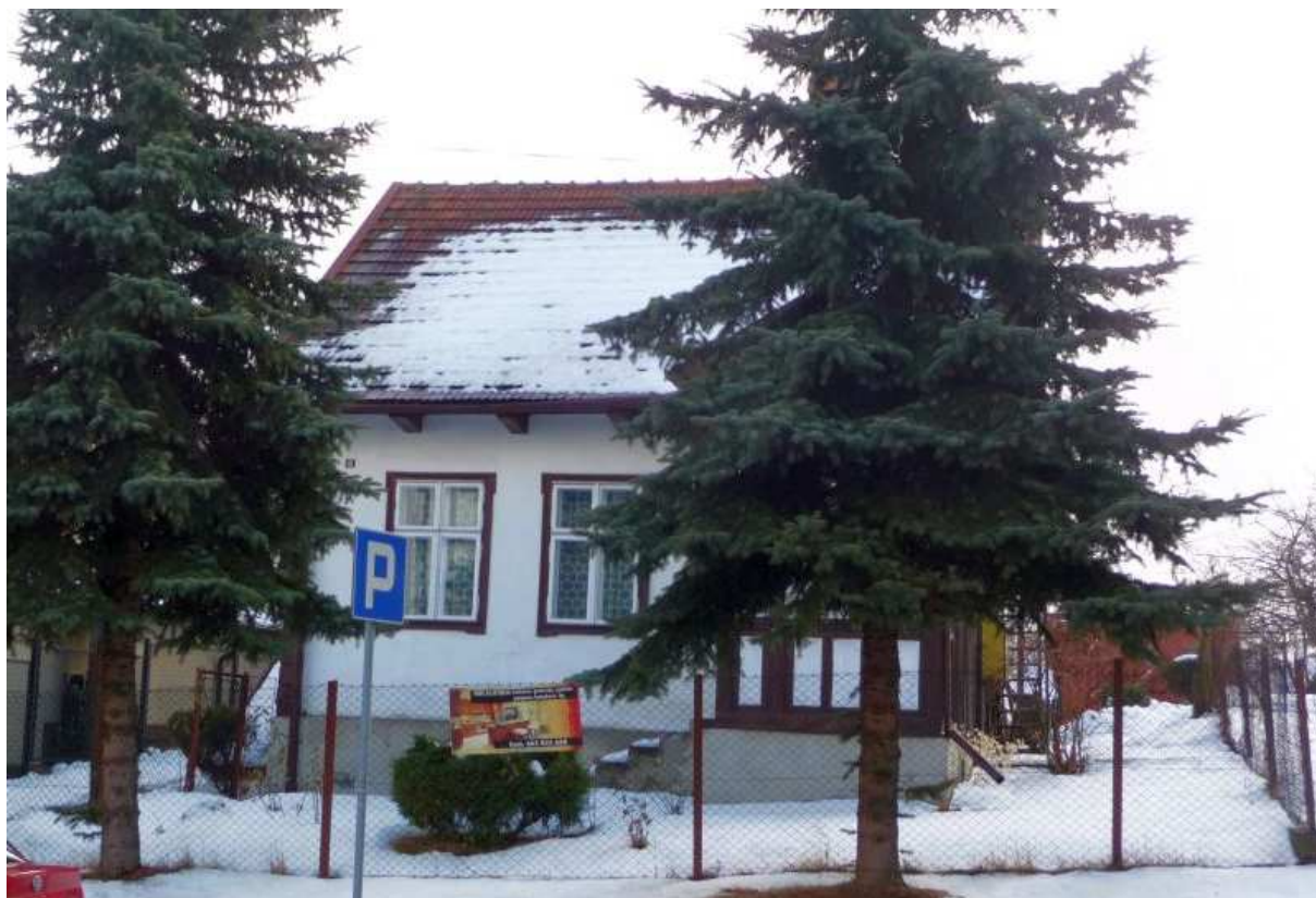
Fot. nr 56. Fasada domku, który zachował dawne, oryginalne okna z cienkimi szprosami. (20.02.2012)