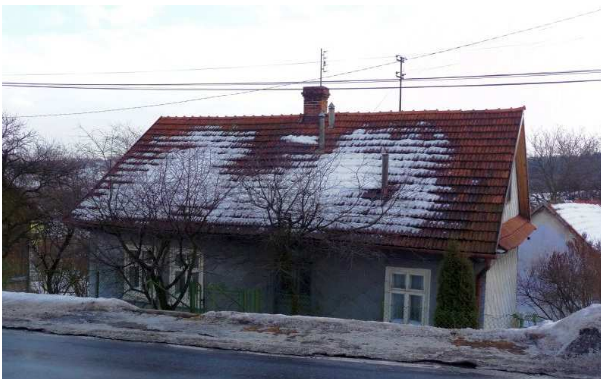
Fot. nr 19. Podobny do poprzedniego oryginał z ulicy Brodzińskiego 46. (20.02.2012)