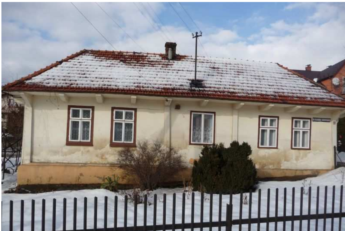
For. nr 80. Fasada domku, który nadal posiada oryginalną stolarkę okienną w obu skrzydłach. W miejscu dawnego ganku wmurowano środkowe okno. (20.02.2012)