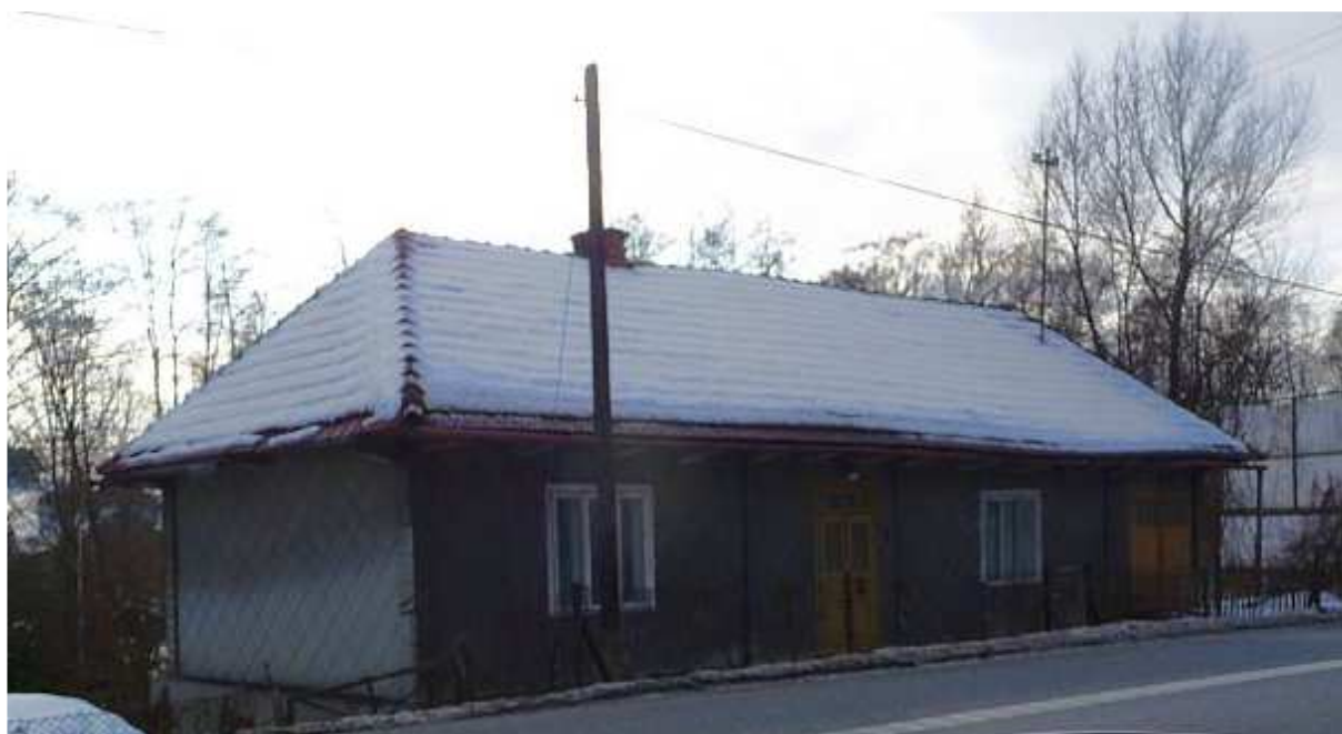
Fot. nr 23. Przydrożny dom ze środkowej części Łąpczycy (nr 207), dziś już mocno obniżony w stosunku do poziomu jezdni – zdjęcie wykonane z jadącego samochodu.