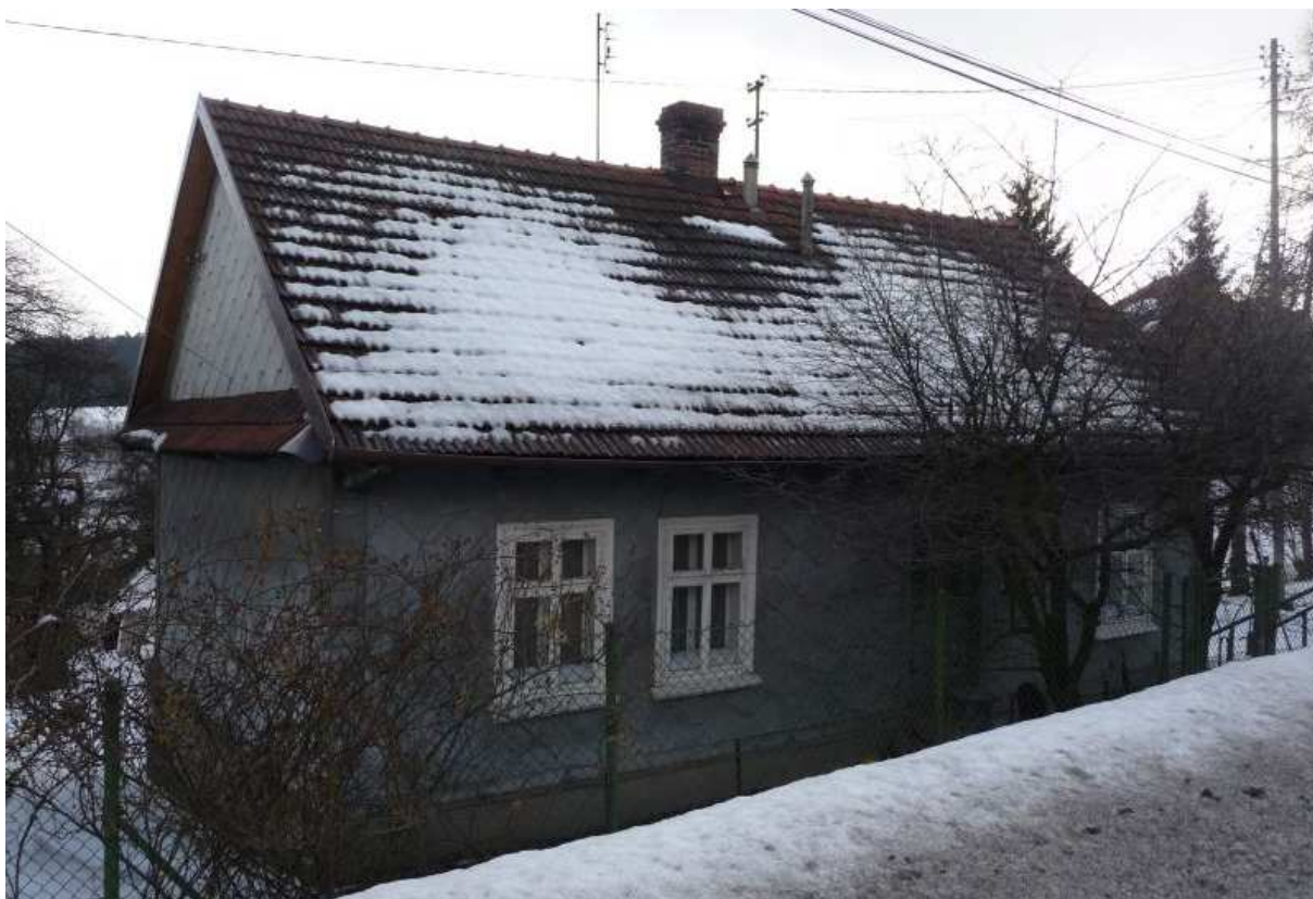
Fot. nr 75 (75-77). Kolejny, oryginalny podmiejski domek z ulicy Brodzińskiego 46, który również można datować na okolice przełomu I i I ćwierci XX wieku. (20.02.2012)