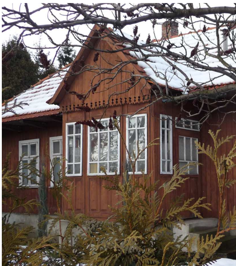
Fot. nr 85. Oryginalny ganek domu, który urzeka prostotą. (20.02.2012)