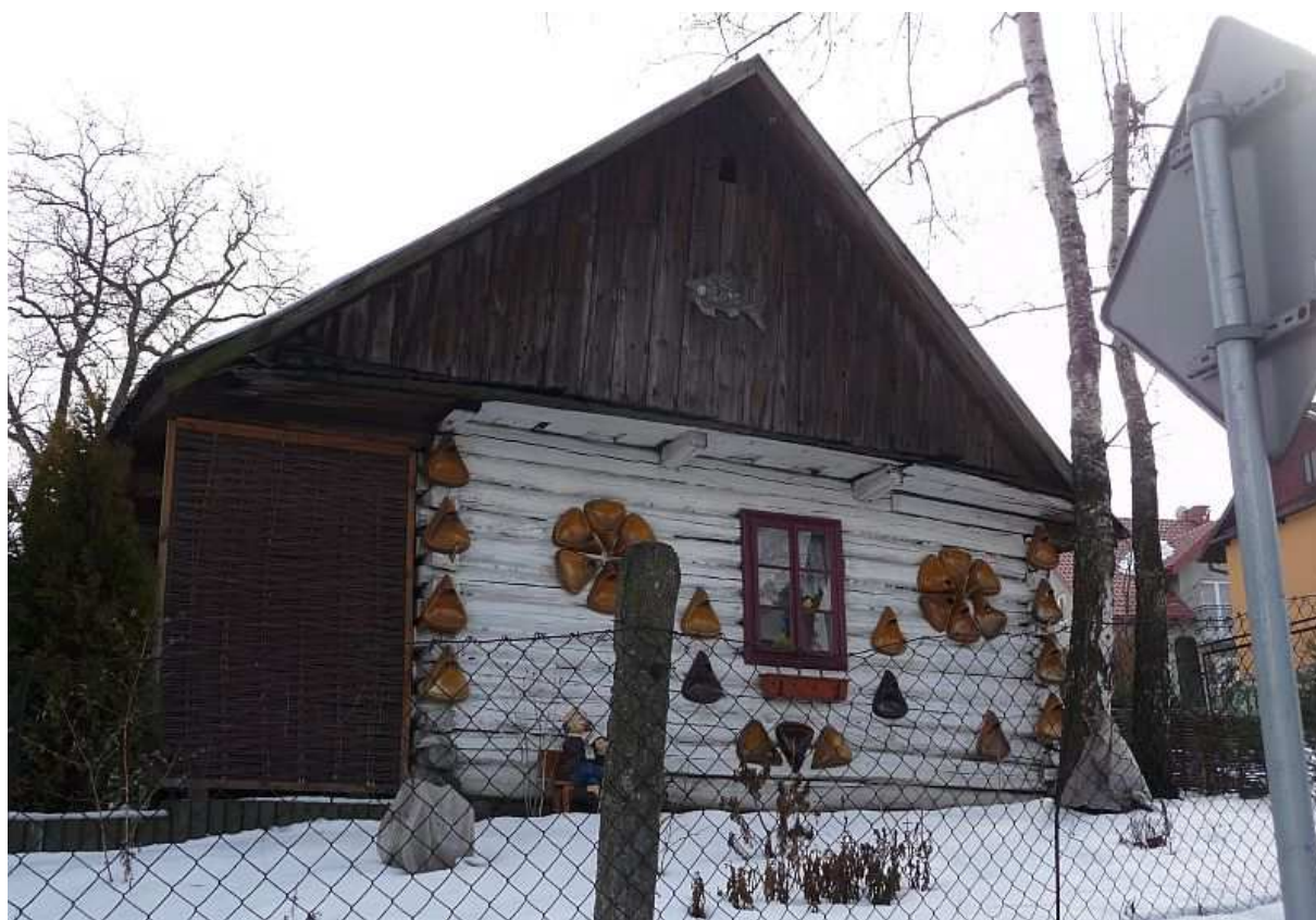
Fot. nr 46. Serce rośnie patrząc na tak zadbaną dawną chałupę. (20.02.2012)