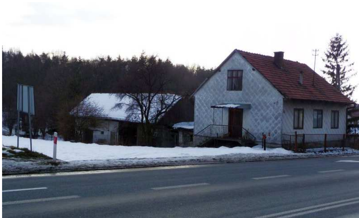
Fot. nr 78. Stara zagroda z ulicy Brodzińskiego 92. Dom z nieoryginalnymi oknami i bozerią łuskową mógł powstać w okresie międzywojennym. (20.02.2012)