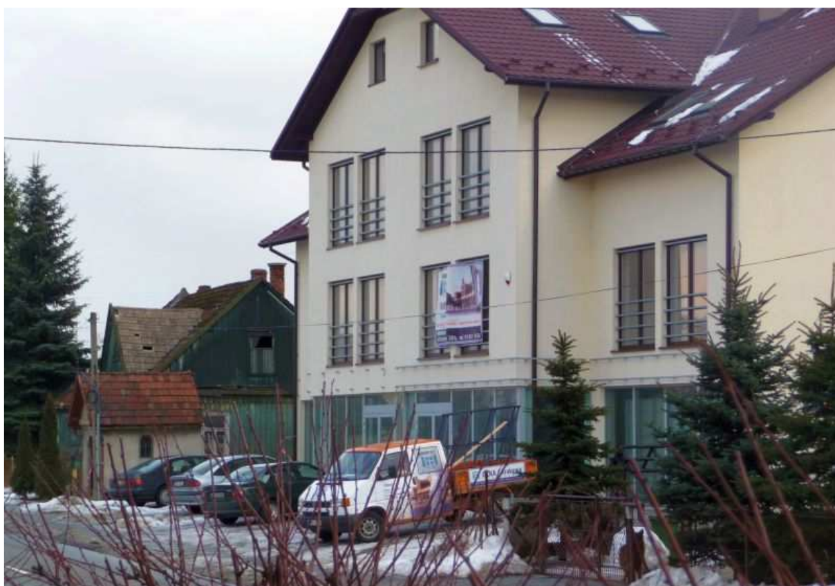
Fot. nr 28. Dawny świat podmiejski jest szybko wypierany przez współczesną zabudowę. (20.02.2012)