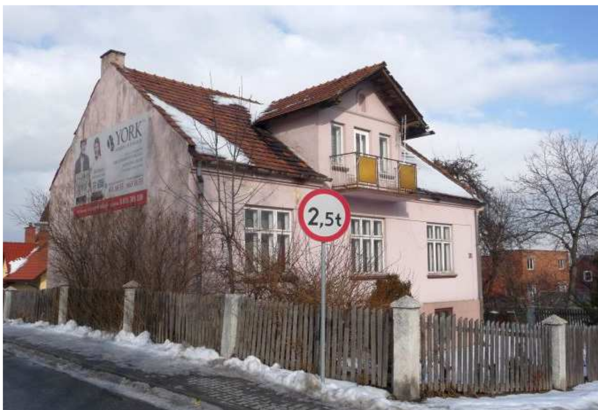
Fot. nr 13. Podmiejska willa z ulicy Brodzińskiego 25. (20.02.2012)