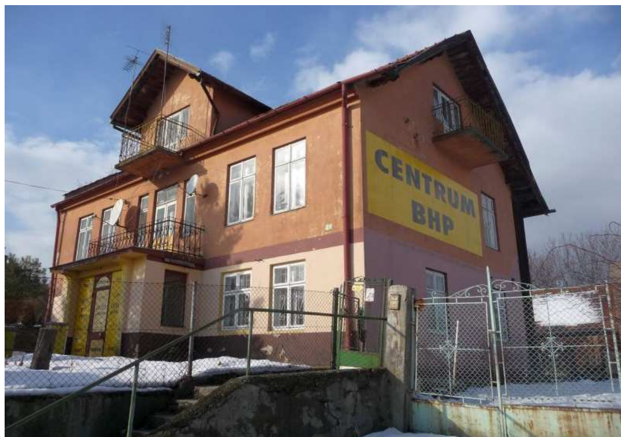
Fot. nr 15. Raczej przedwojenna willa z ulicy Brodzińskiego 31. (20.02.2012)