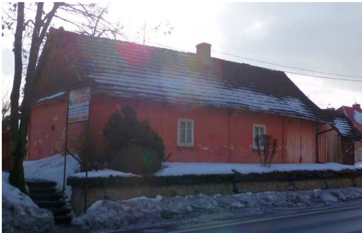
Fot. nr 14. Zapewne XIX-to wieczna chałupa z ulicy Brodzińskiego 16. (20.02.2012)