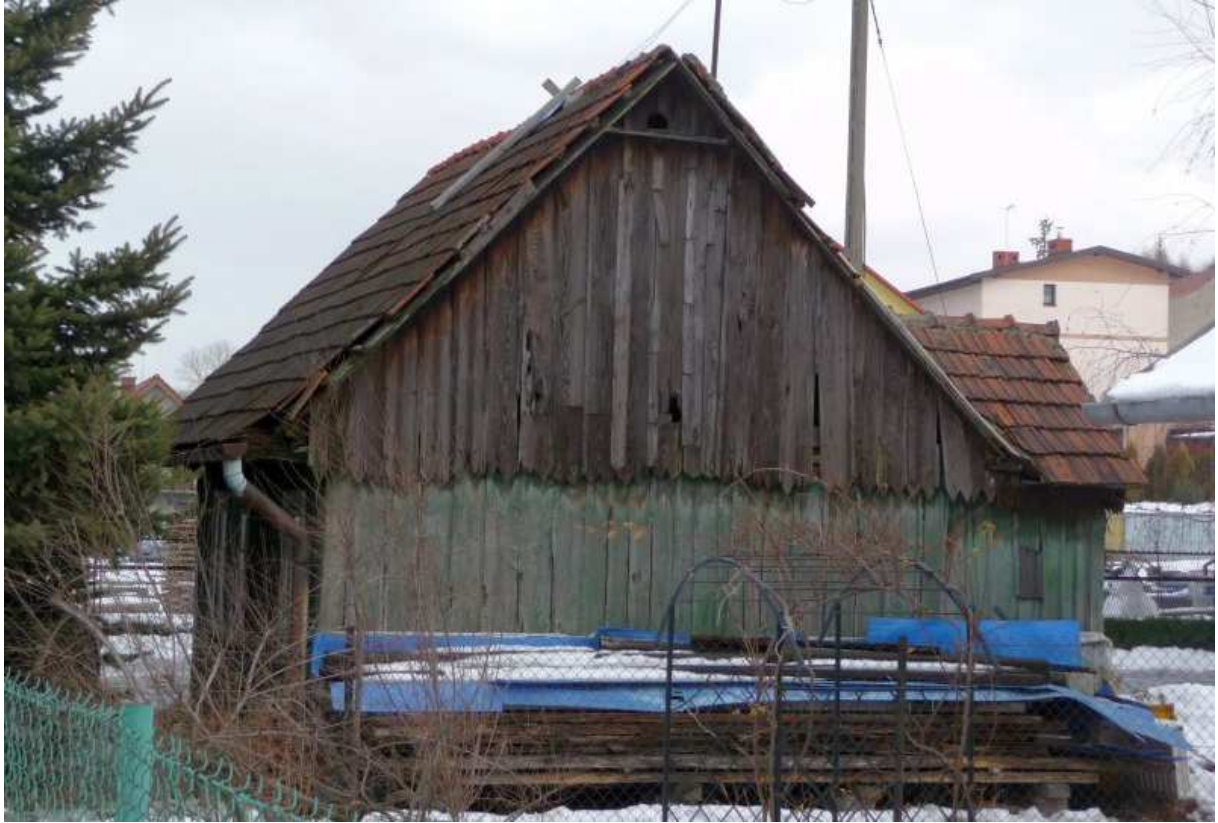
Fot. nr 37. Boczna część chałupy, której dni są już chyba policzone, bo istnieje w żadnej ewidencji zabytków. (20.02.2012)