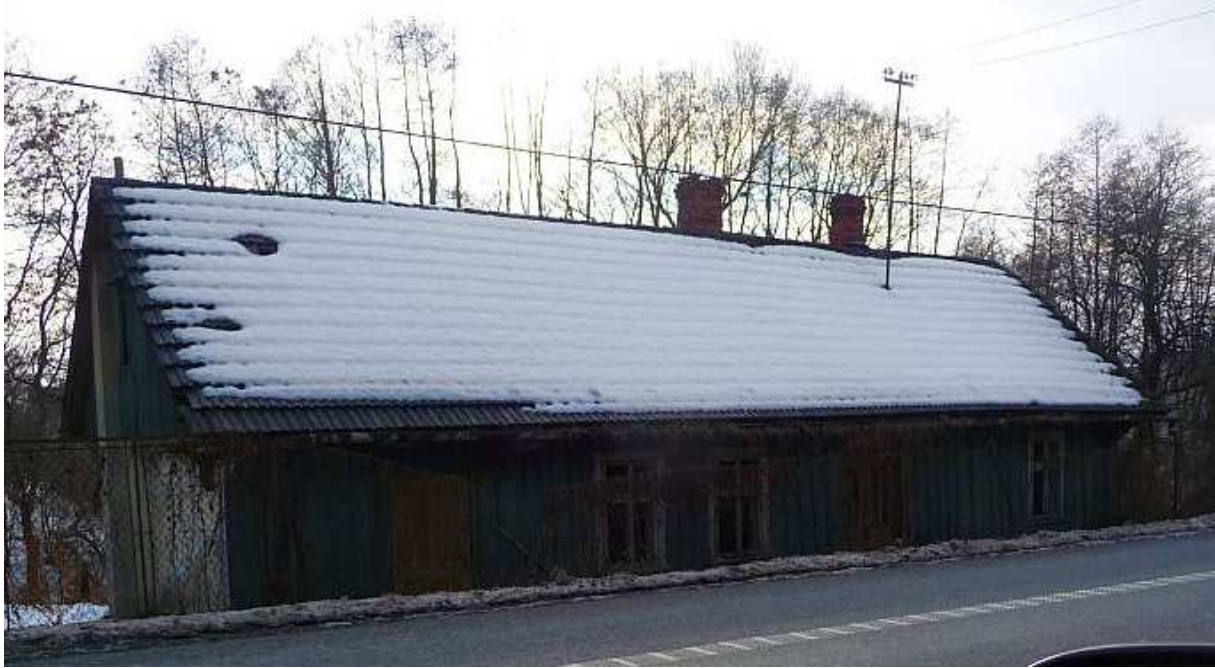
Fot. nr 24. Dogorywająca ruina oryginalnego domku przedwojennego ze środkowej części Łapczycy (nr 198) – zdjęcie wykonane z jadącego samochodu. (20.02.2012)

I na koniec krótki wypad do środkowej części Łapczycy, gdzie wzdłuż dawnego gościńca krakowskiego, czyli dzisiejszej krajowej drogi nr 75, biegnącej z Krakowa w kierunku Tarnowa, dogorywa kilka ciekawych kiedyś, dziś już opuszczonych bądź znajdujących się w stanie nieodwracalnej ruiny wiejskich domów o numerach: 79, 207 i 198 (fot. nr: 86-89). Interesująco przedstawia się ruina spod nr 198, o której już dawno zapomniano i dziś znajduje się już ona sporo poniżej powierzchni jezdni. Zdjęcia tych obiektów są kiepskiej jakości, bo zostały wykonane z jadącego samochodu, gdyż ten fragment drogi krajowej jest tak ruchliwy, że nie sposób się tutaj zatrzymać.