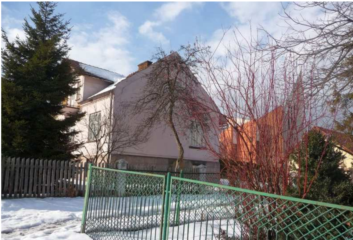
Fot. nr 60. Dwa świąty Bochni – zapewne przedwojenna willa z ulicy Brodzińskiego 25, a w tle nowoczesny kościół p.w. św. Pawła Apostoła. (20.02.2012)