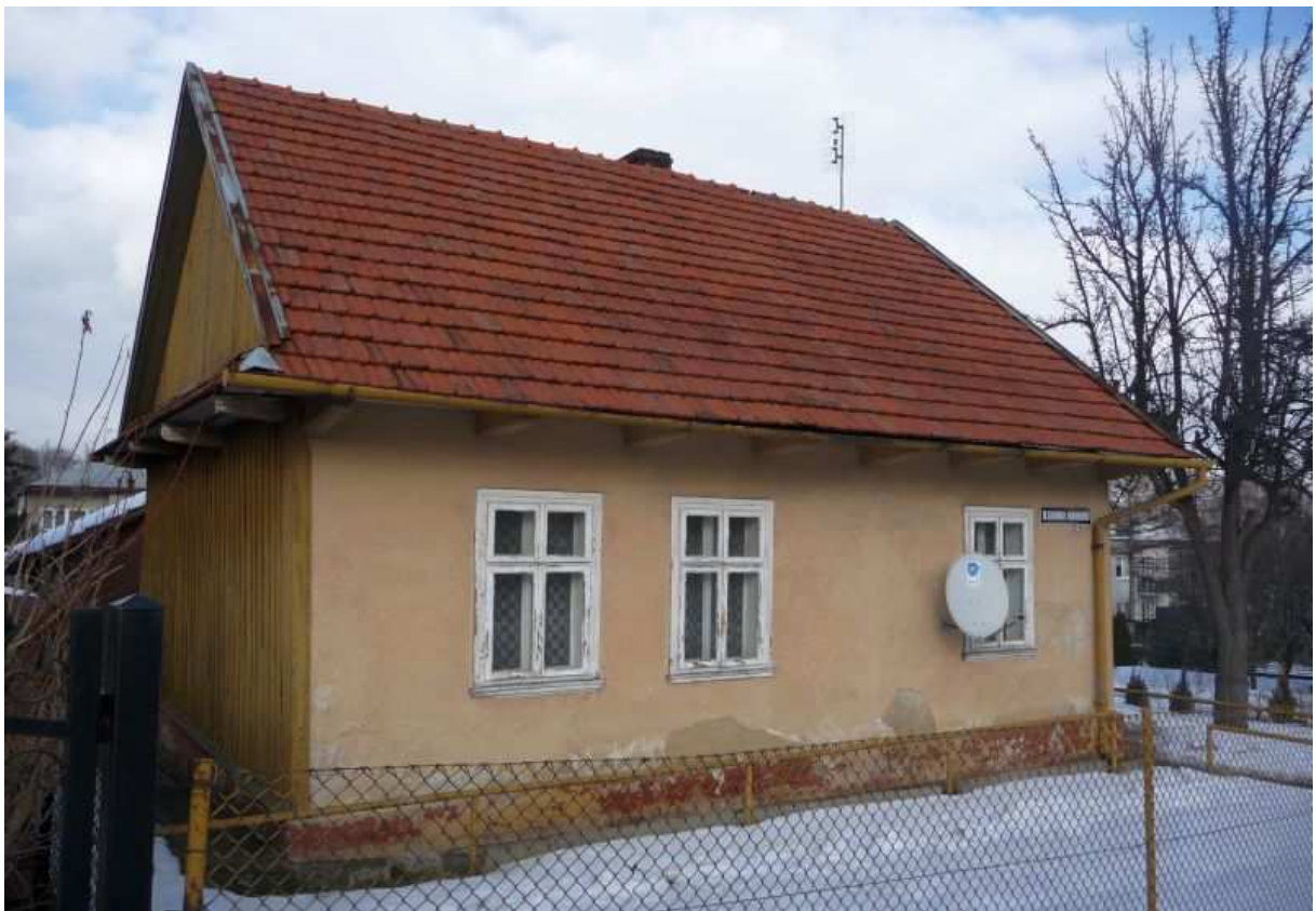
Fot. 54. Fasada domku, który zachował oryginalną stolarką okienną. (20.02.2012)