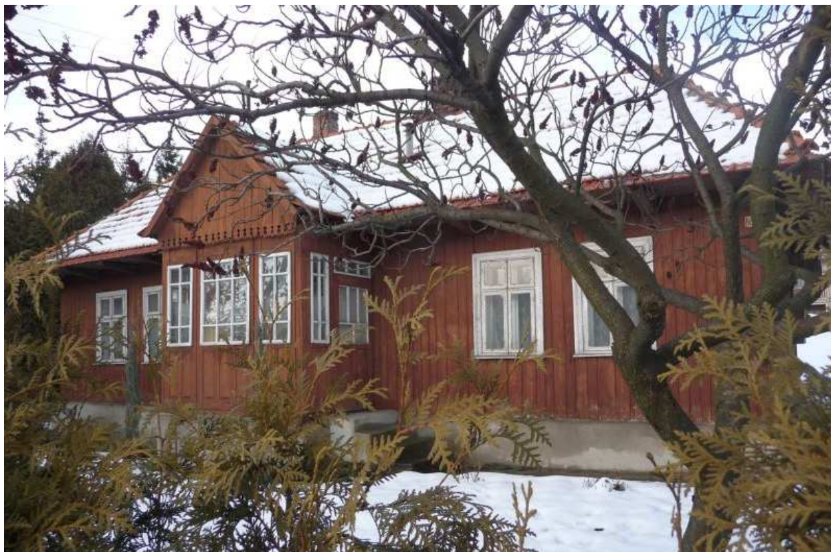
Fot. nr 22. Oryginalna willa, zapewne z I ćwierci XX-go wieku z pogranicza z Łąpczycę - Obwodnica nr 267. (20.02.2012)