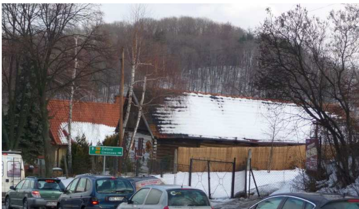
Fot. 44 (44-48). Podmiejska chałupa z ulicy Brodzińskiego 2 – rzadki już przykład oryginalnego obiektu z metryką sięgająca prawdopodobnie w koniec w XIX wieku. (20.02.2012)