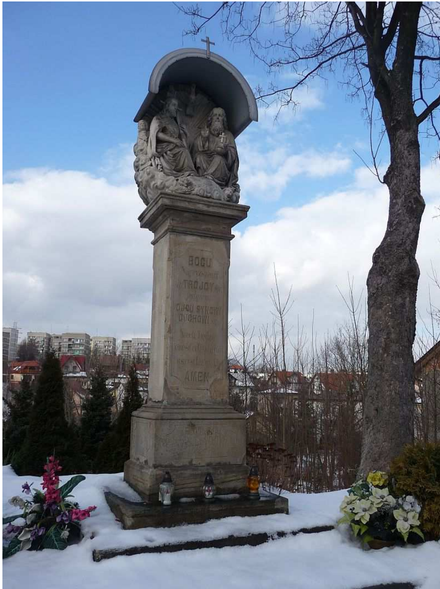
Fot. nr 50. Lico figury. (20.02.2012)