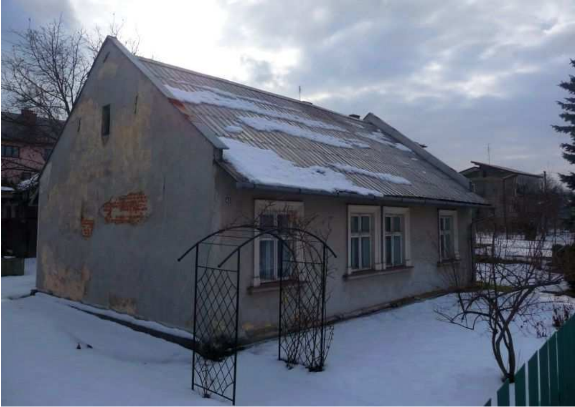
Fot. nr 5. Murowany dom z ulicy Brzeskiej 45. (20.02.2012)