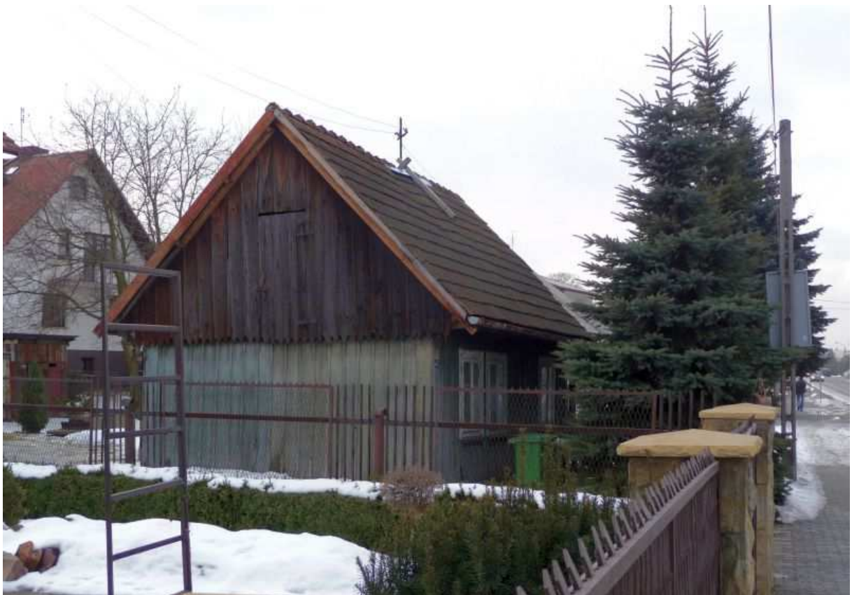
Fot. nr 4. Oryginalna, wiejska chatka z ulicy Brzeskiej 47. (20.02.2012)