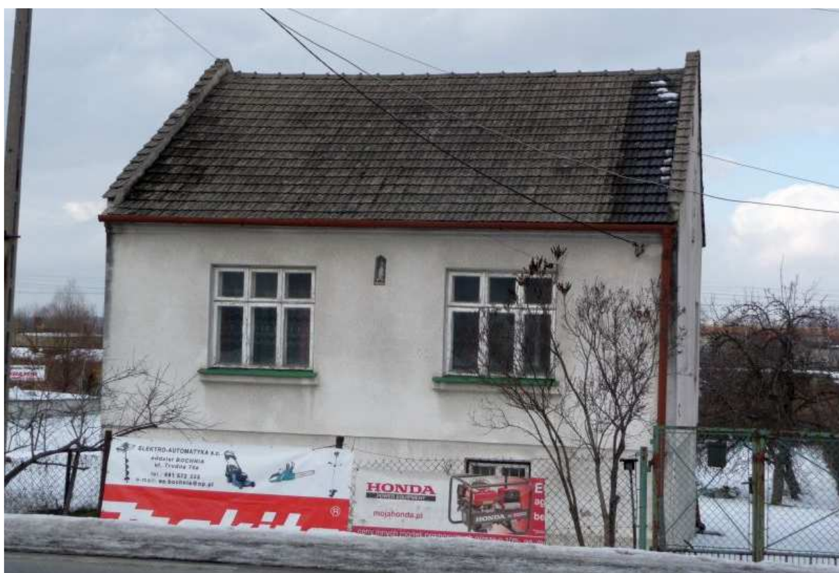
Fot. nr 30. Murowany domek z ulicy Brzeskiej 50, który nadal zachował tradycyjną stolarką okienną. (20.02.2012)