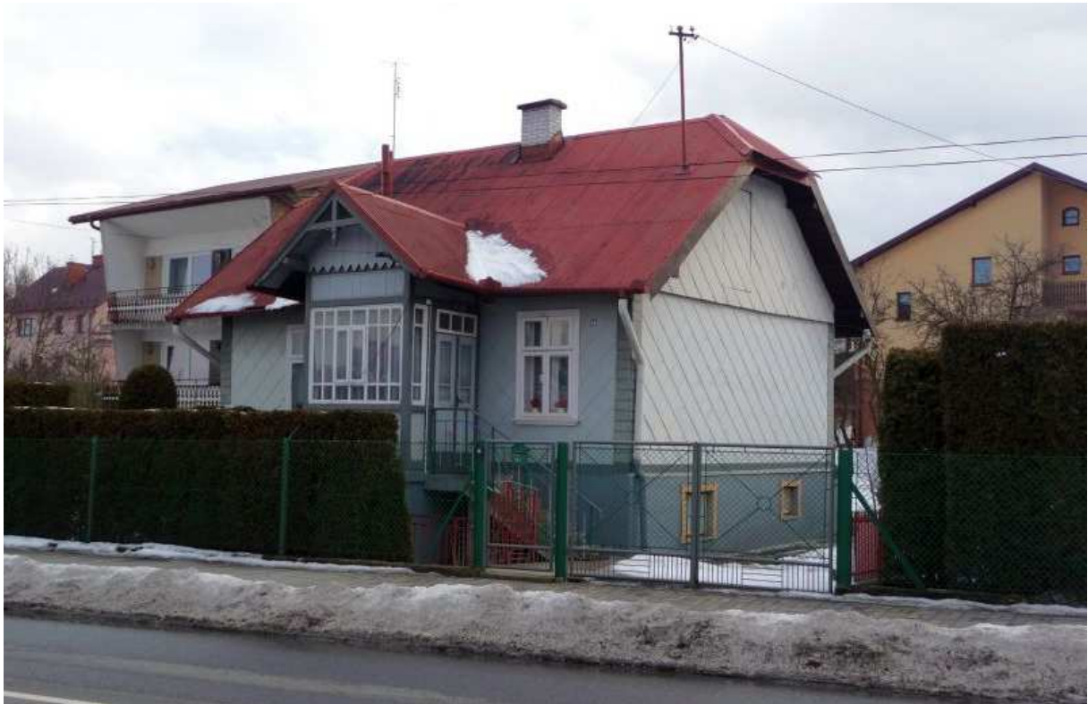
Fot. nr 41. Ciekawy ganek podmiejskiego domku z ulicy Brzeskiej 35. (20.02.2012)