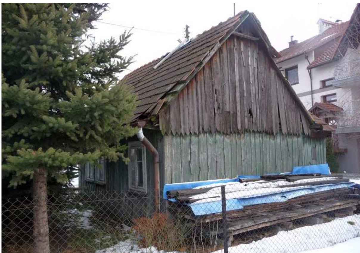
Fot. nr 36. Jeszcze jedno ujęcie w pełni oryginalnej fasady – tylko strzechy brak. (20.02.2012)