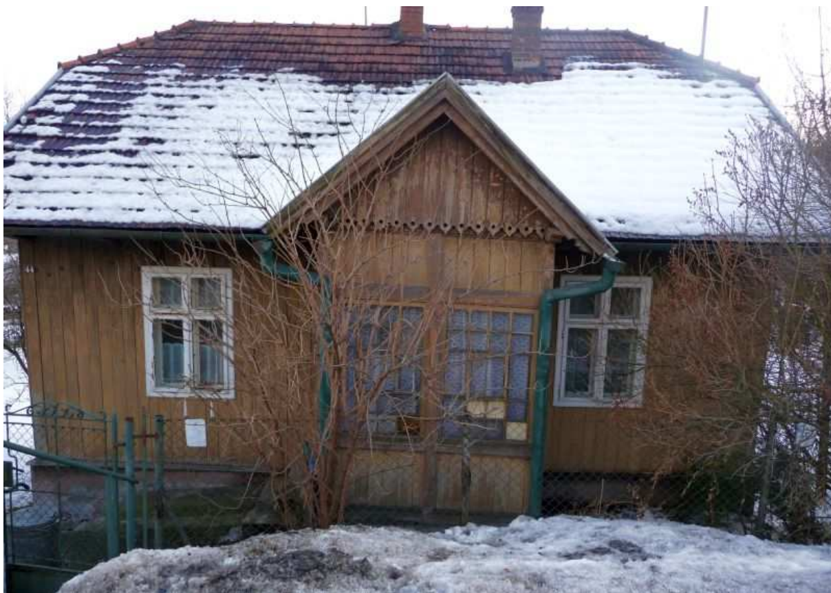
Fot. nr 74. Jeszcze jedno spojrzenie na oryginał z ulicy Brodzińskiego 44. (20.02.2012)