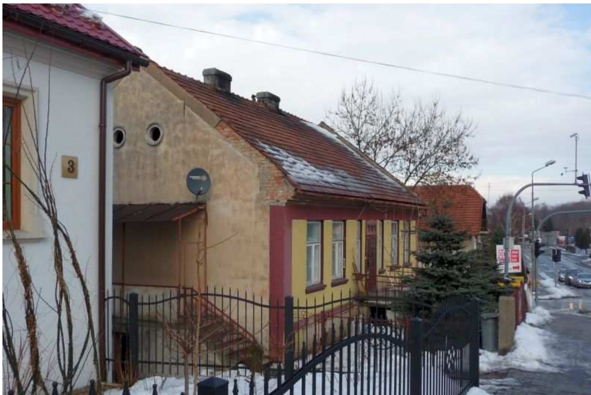
Fot. nr 43. W klimacie Bochni sprzed stu lat. (20.02.2012)