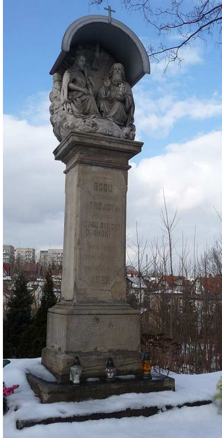
Fot. nr 10. Figura z ulicy Brodzińskiego – postument z 1897-go roku. (20.02.2012)