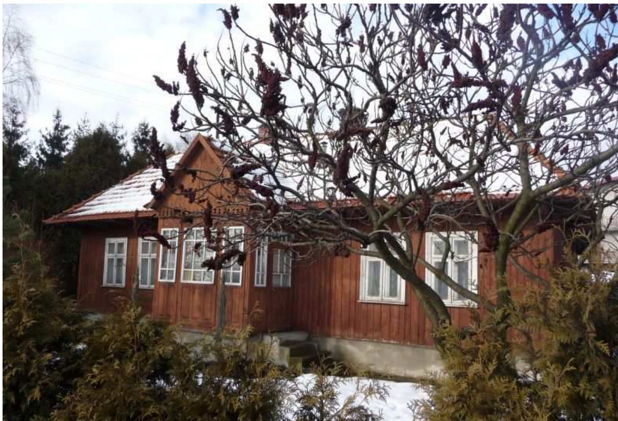
Fot. nr 84. W sielskim klimacie przedwojennej Łapczycy. (20.02.2012)