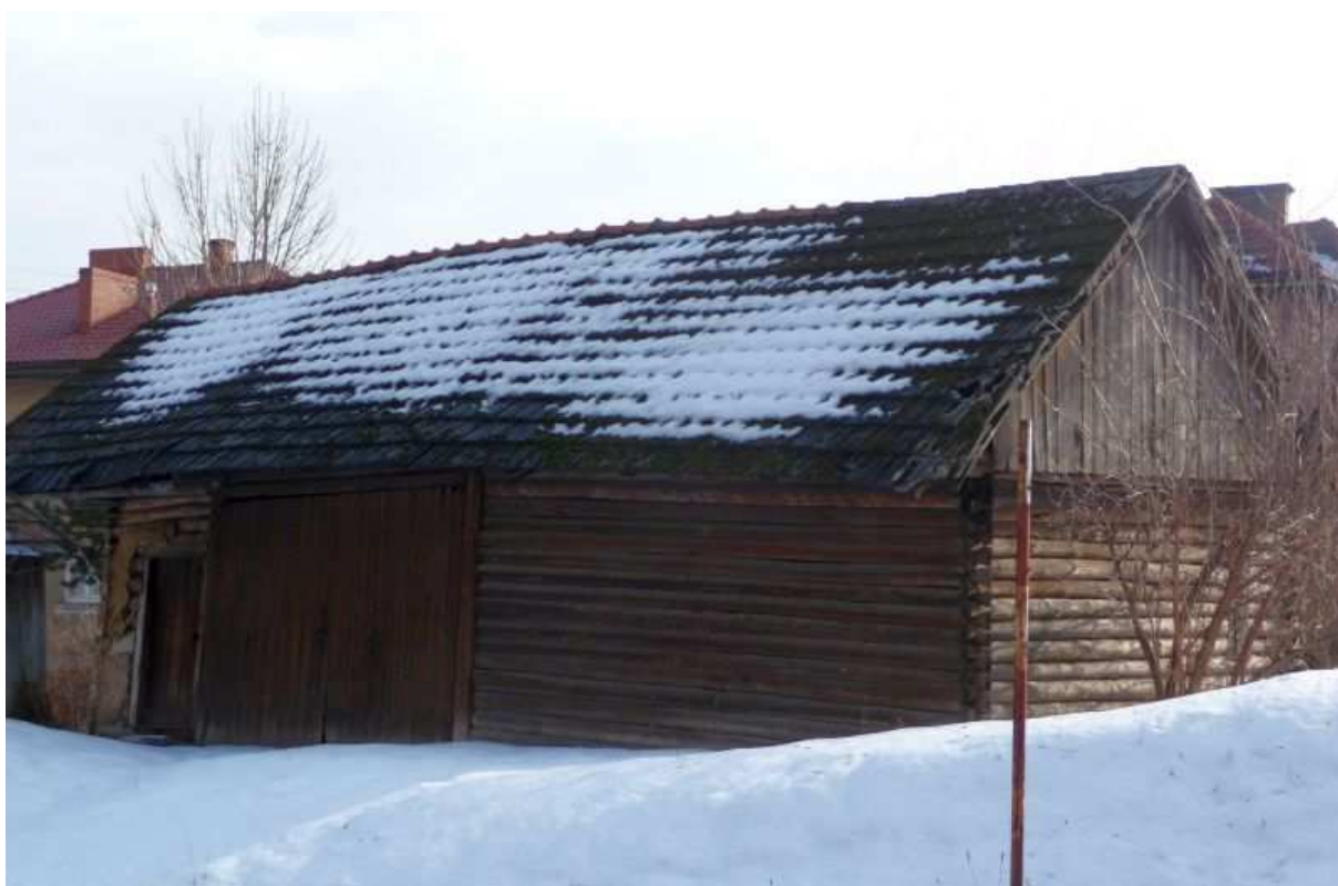
Fot. nr 67. Oryginalna stodoła na tyłach zagrody, zapewne z tych samych lat co dom. (20.02.2012)