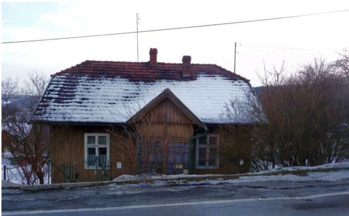
Fot. nr 18. Drewniany domek z ulicy Brodzińskiego 44, typowy dla zabudowy międzywojennej. (20.02.2012)