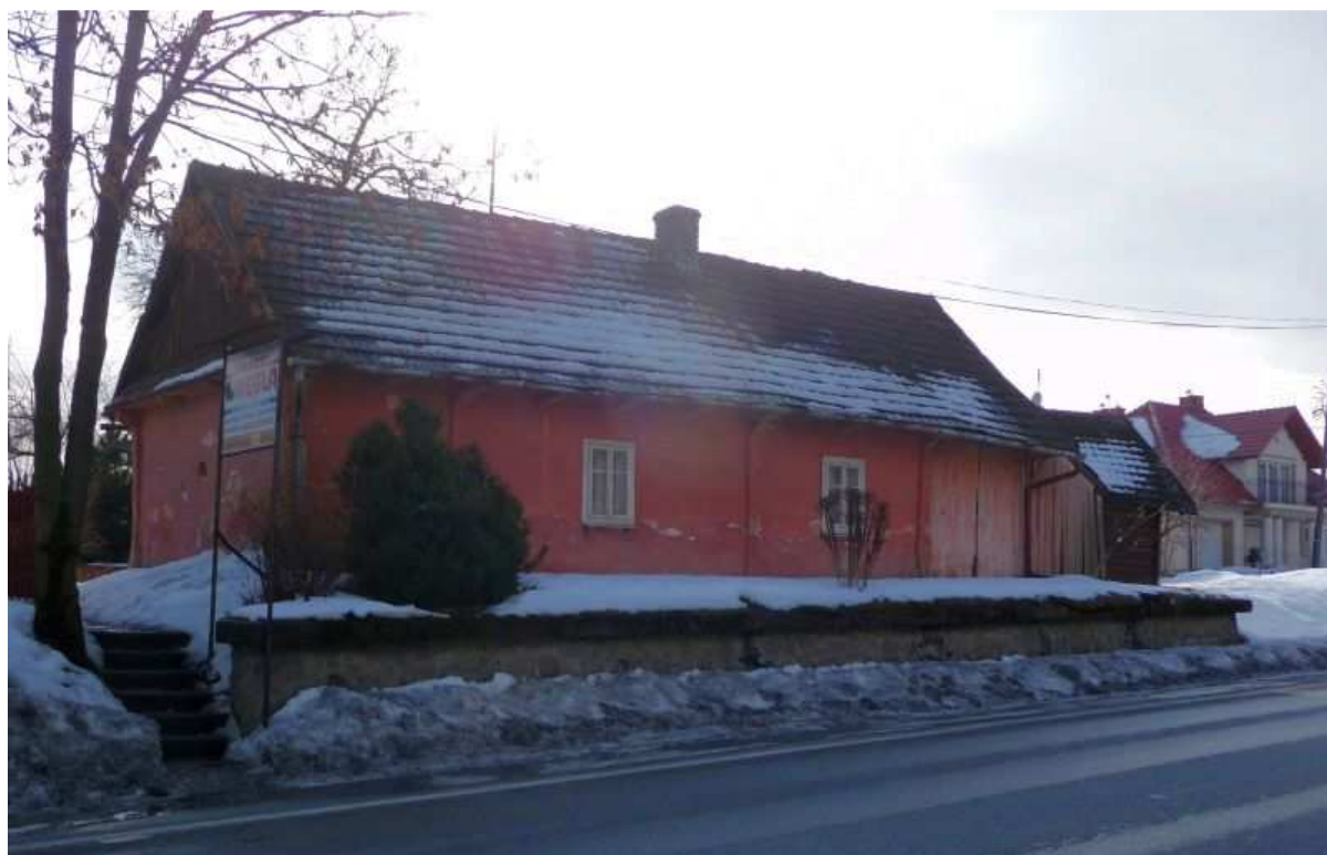
Fot. nr 63 (63-67). Wiejski antyk, zapewne o XIX-wiecznym rodowodzie, z ulicy Brodzińskiego 16. (20.02.2012)