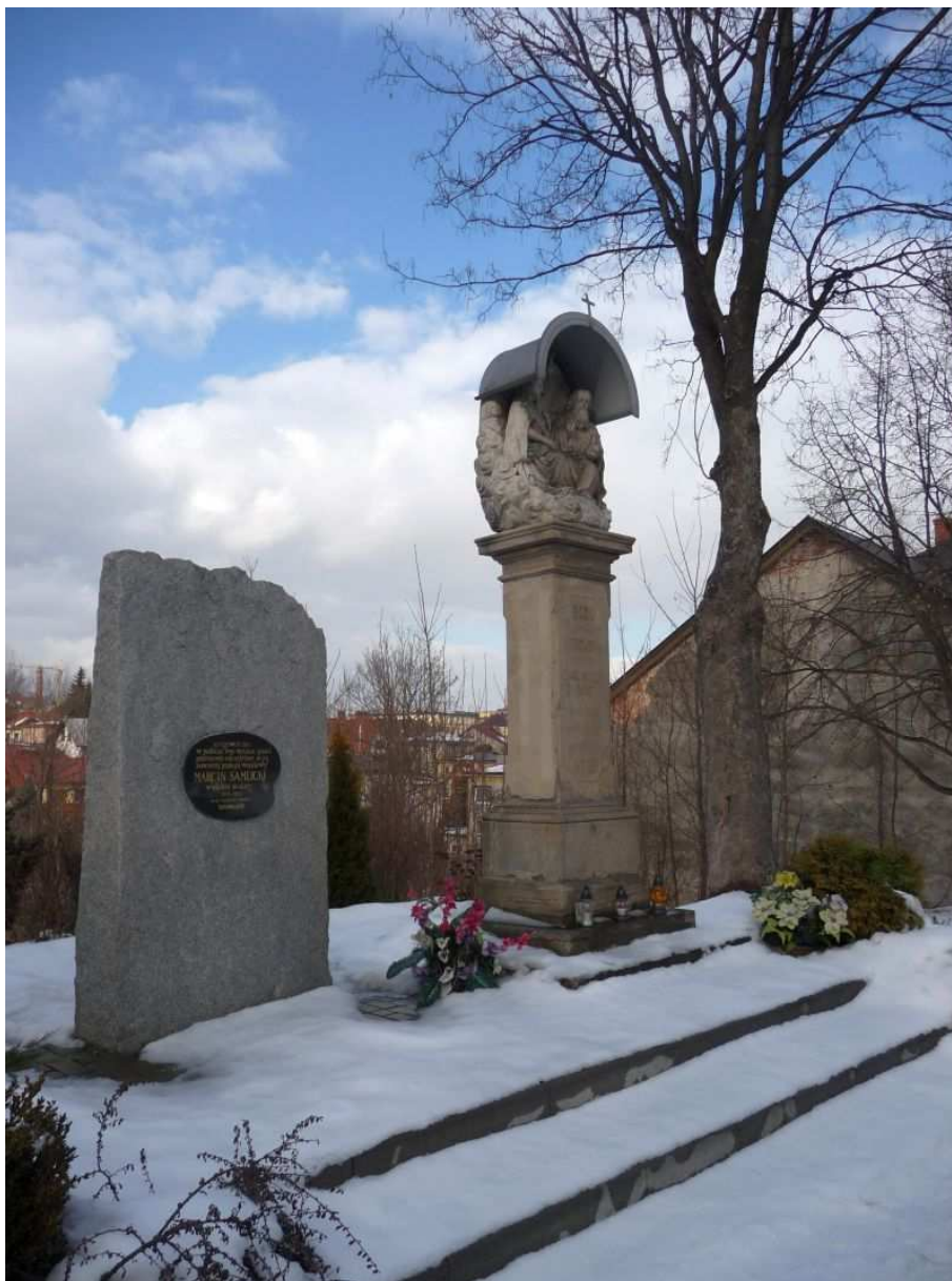
Fot. nr 49 (49-51). Zabytkowa figura (posadowiona w 1897-go roku) z początkowego odcinka ulicy Brodzińskiego. (20.02.2012)