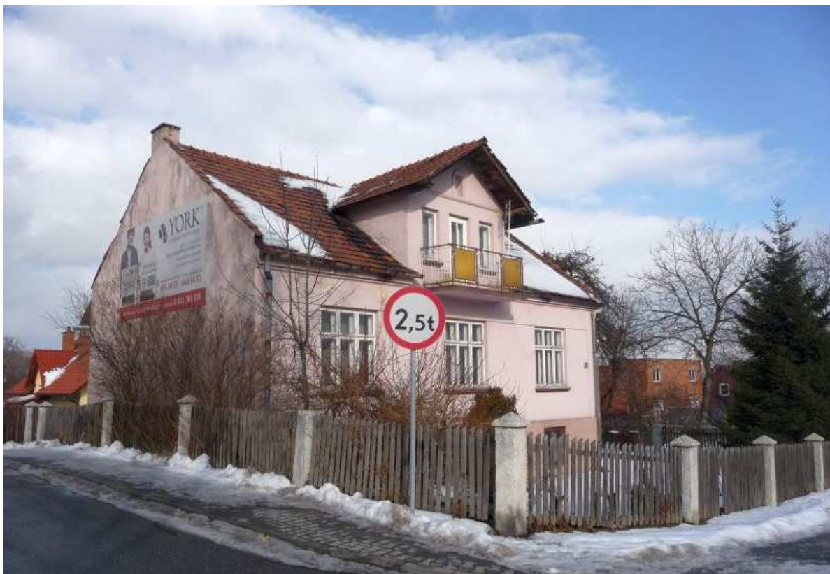
Fot. nr 62. W powojennym klimacie bocheńskiego przedmieścia. (20.02.2012)