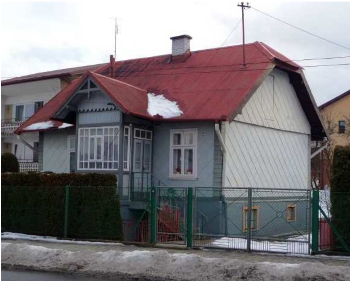
Fot. nr 6. Zapewne przedwojenny oryginał z ulicy Brzeskiej 35. (20.02.2012)