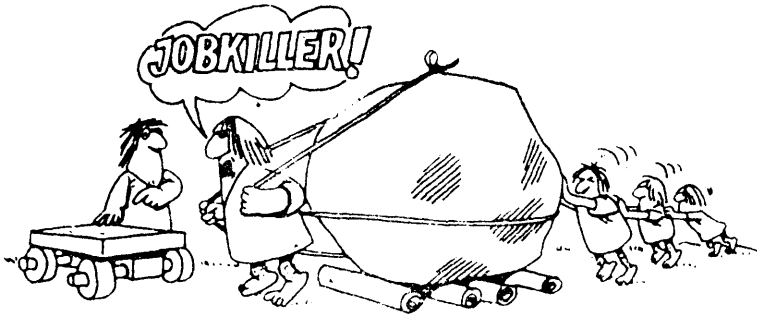
Różny sposób widzenia nowej techniki i miejsc pracy

Jakościowej zmianie ulegną warunki pracy. Rysują się zagrożenia zdrowia. Z pewnością zmieni się struktura stanowisk pracy. Jedną z najważniejszych zmian będzie to, że ta sama technika, przy pomocy której się pracuje, będzie wypełniała czas wolny. Przekreśli to tezę o relaksie poprzez oderwanie od warunków