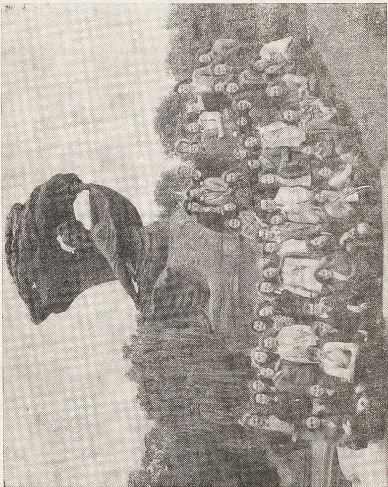
Młodzież w Warszawie