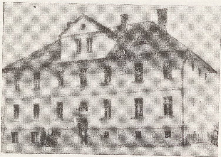
Internat — pierwsza siedziba Liceum ze słowackim językiem nauczania, budynek Urbaru