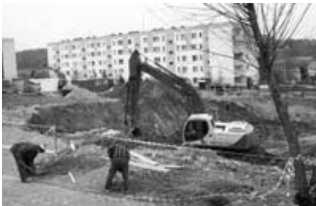
Pierwsze dni budowy basenu na Kurdwanowie.