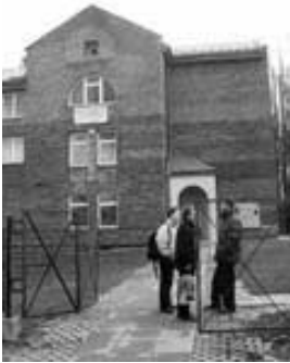
Budynek Archidiecezjalnej Szkoły Muzycznej w Prokocimiu im. ks. kard. Franciszka Macharskiego.

...Chcieliśmy, aby powstała szkoła opierająca się na programach szkół państwowych, ale jednocześnie uwzględniająca także przedmioty specyficzne dla zawodu organisty, uczące improwizacji w grze na organach, akompaniamentu liturgicznego, dające pojęcie o układzie mszy świętej – mówi dyrektor ASM.