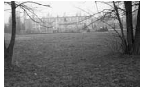
Teren pod basen przy ul. Kurczaba – między SM „Nowy Prokocim” a SP nr 117.

Jeszcze w tym roku Wydział Spraw Społecznych ma wystąpić o WZiZT (Warunki Zabudowy i Zagospodarowania Terenu), a następnie o pozwolenie na budowę. Tak więc na pewno 2007 r. będzie poświęcony wyłącznie na przygotowanie tej inwestycji. Dobrze byłoby, aby samo-