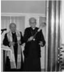
Były metropolita krakowski ks. kard. Franciszek Macharski poświęca organy Archidiecezjalnej Szkoły Muzycznej.

nowy metropolita krakowski, ks. kardynał Stanisław Dziwisz powołał w 2006 r. Archidiecezjalną Szkołę Muzyczną I i II stopnia. 28 listopada 2006 r. uroczście poświęcono budynek i instrumentarium szkoły, jednocześnie nadając jej imię ks. kard. Franciszka Macharskiego.