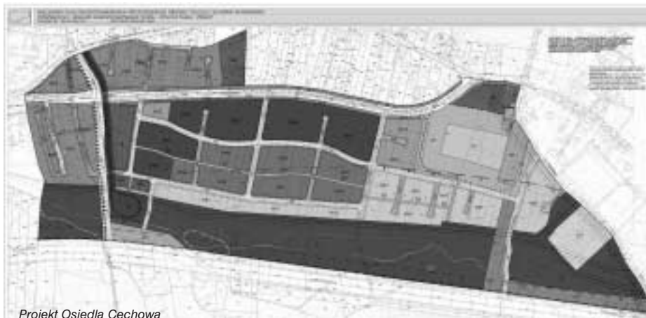
Projekt Osiedla Cechowa

Przebieg planowanej Trasy Łagiewnickiej wzbudza protesty nie tylko Zgromadzenia Sióstr Matki Bożego Miłosierdzia, ale także ekologów. Chodzi o... projekt przesunięcia koryta Wilgi. Rzeka ma zmienić swój dotychczasowy bieg na odcinku pół kilometra, od torów kolejowych w Łagiewnikach do ul. Ludwisarzy oraz po drugiej stronie ul. Zakopiańskiej, na terenie Borku Fałęckiego. Nowe koryto miałoby powstać w odległości od 70 do 100 m od starego.