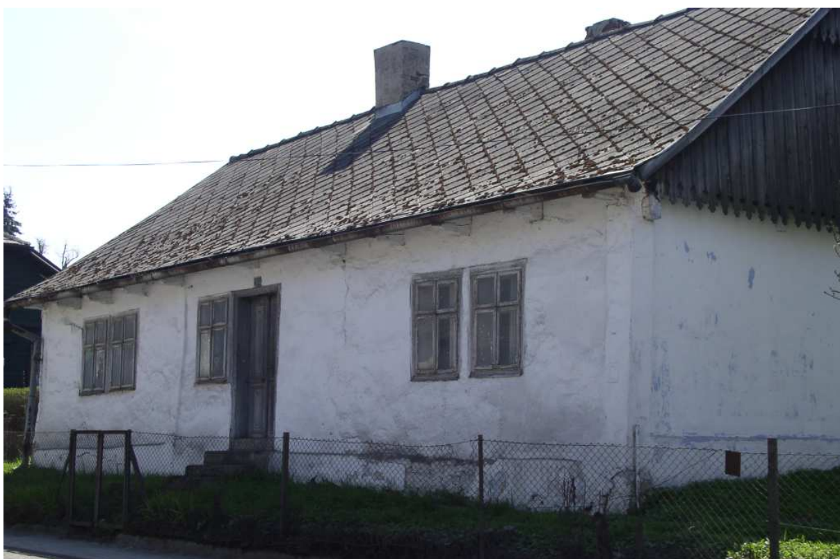
Fot. nr 34. Fasada chałupy.