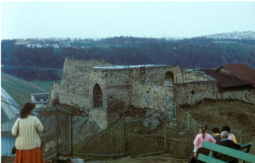
Fot. nr 68. Ujęcie w stronę Raby.