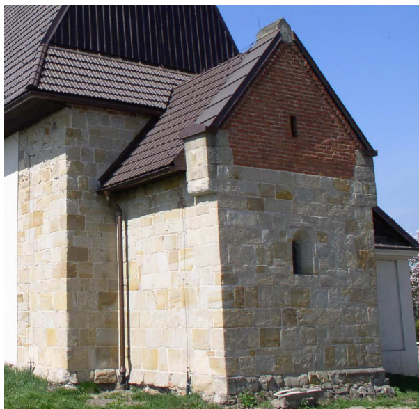
Fot. nr 99. Romański fragment kościoła.