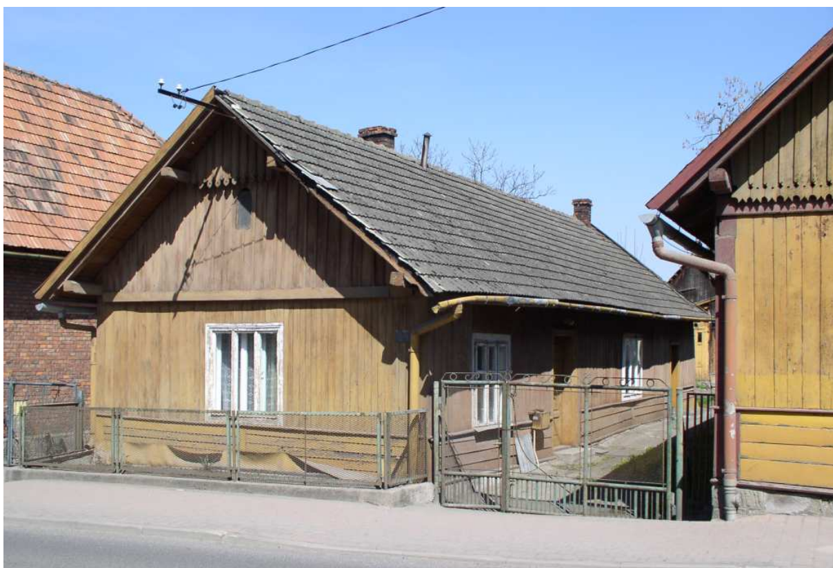
Fot. nr 29. Przykład zabudowy ulicówki o charakterze szczytowo-frontowym. Zapewne stuletni dom pod nr 22.