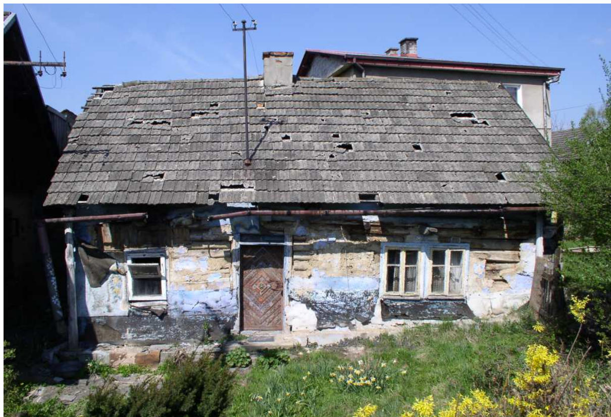
Fot. nr 60 (60-61). Zapewne jeszcze XIX-wieczny „antyk” – niestety w stanie agonii. Chata przylegała do domu nr 10 z poprzedniej fotografii. Niestety nie widać jej numeru. Dom ten już nie istnieje.