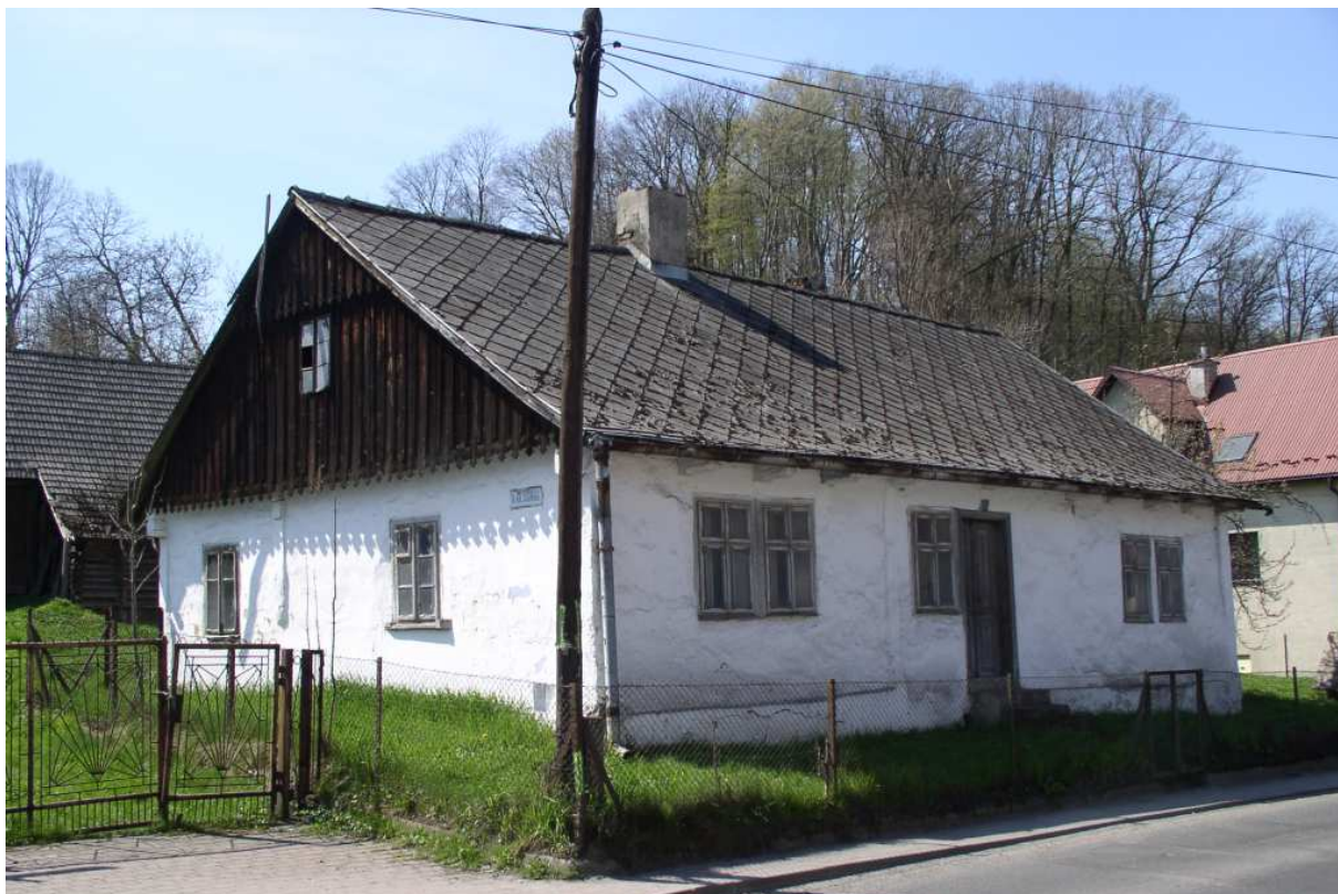
Fot. nr 35. Jeszcze jeden widok na dobczycki „antyk”.