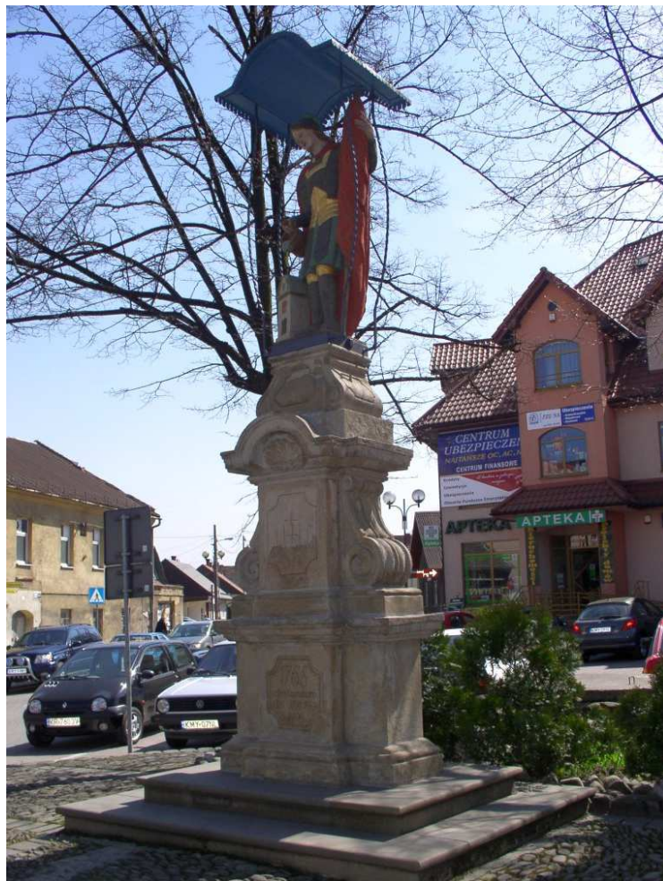
Fot. nr 7. Lico figury św. Floriana.