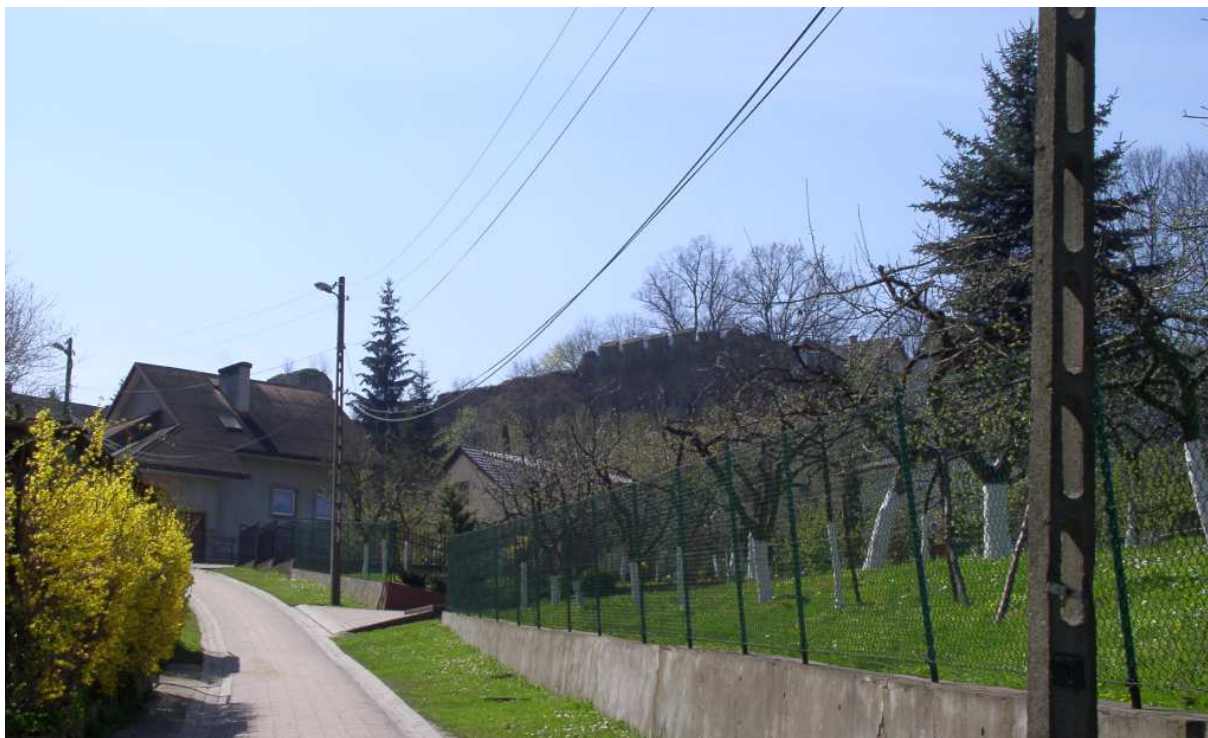
Fot. nr 22. Widok wzdłuż ulicy Kasztelana Dobka w kierunku wzgórza zamkowego.