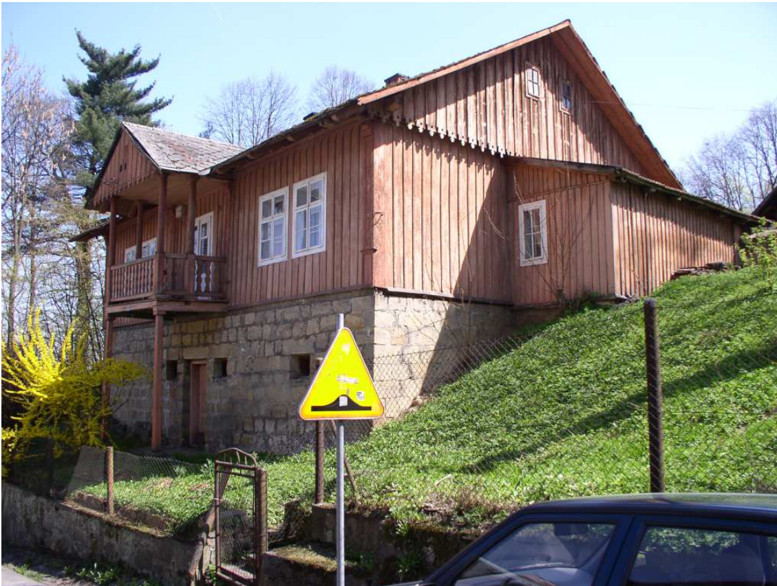
Fot. nr 18 (18-21). Oryginalna, drewniana willa z ulicy Kazimierza Wielkiego 6, która mogła powstać gdzieś wokolicy II dekady XX wieku.