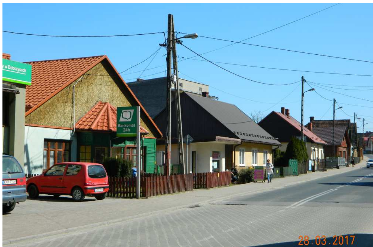
Fot. nr 76. Pierzeja o parzystych numerach.