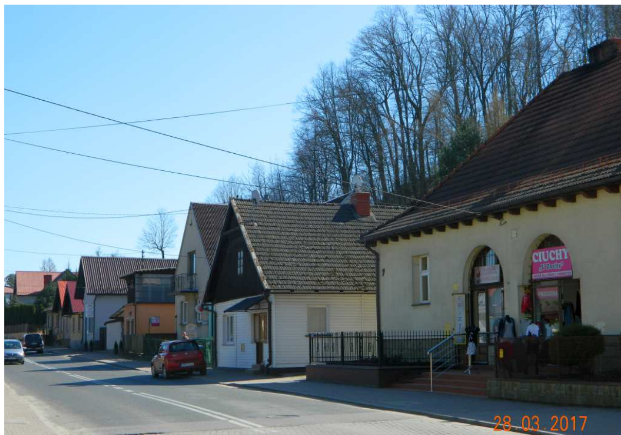
Fot. nr 77. Pierzeja o nieparzystych numerach.