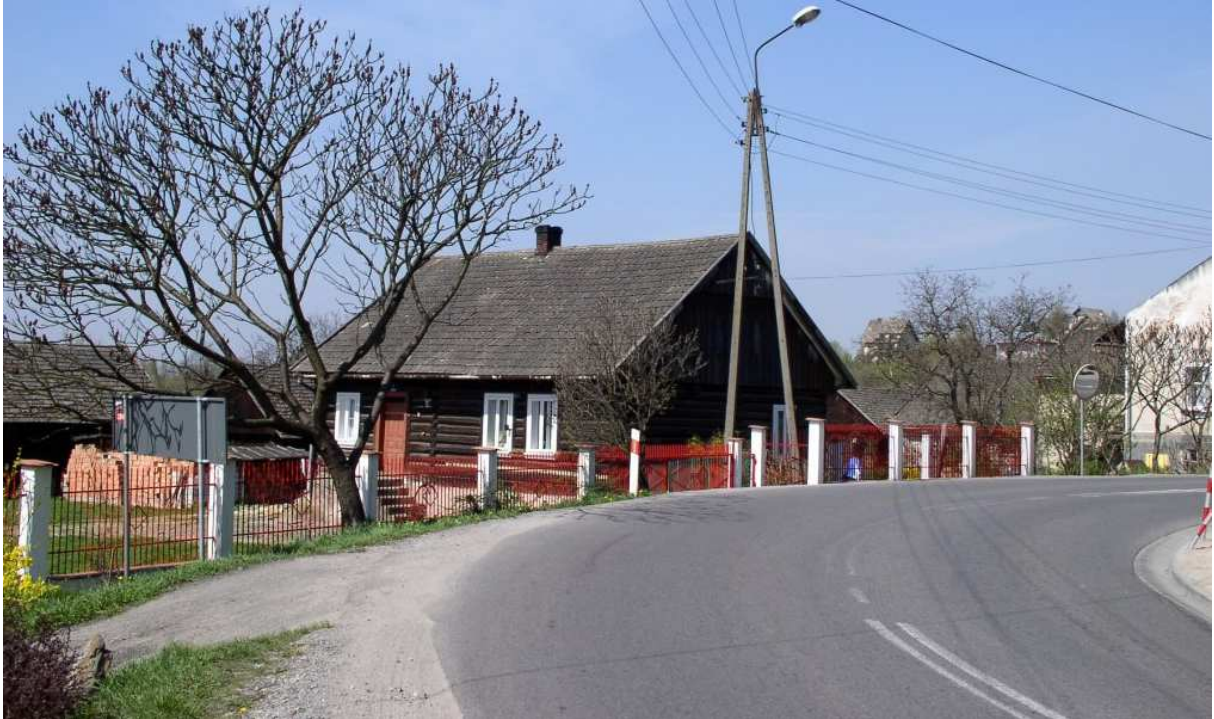
Fot. nr 102. Stara, poprzecznie belkowana chałupa spod nr 5, stojąca naprzeciw wejścia do kościoła.