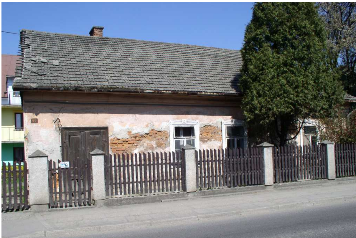
Fot. nr 47 (47-48). Murowana chałupa (nr 66) pochodząca zapewne z przełomu I i II ćwierci XX wieku.