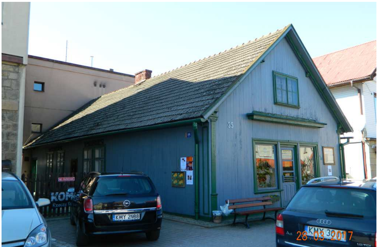
Fot. nr 83. Bliski przedwojennemu oryginałowi dom z Rynku 25.