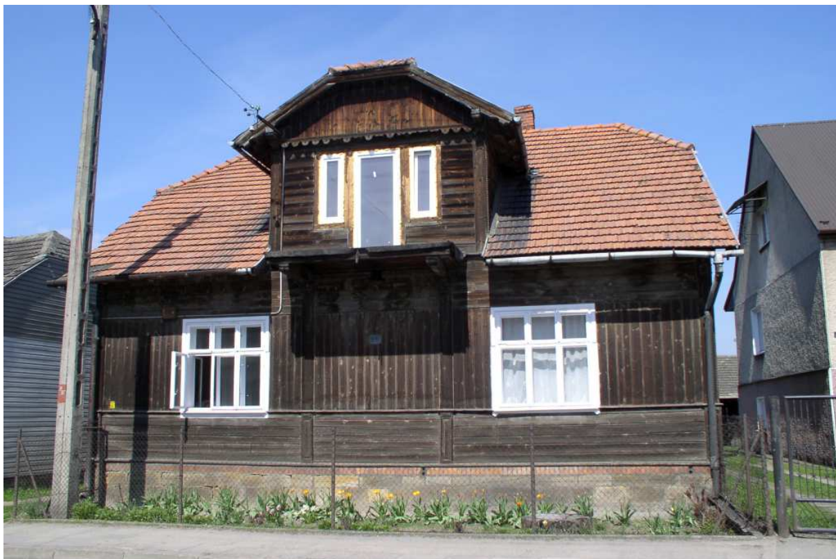
Fot. nr 46. Ciekawy przykład starej willi (nr 60) z charakterystyczną jaskółką, pochodzącej zapewne z II ćwierci XX wieku.