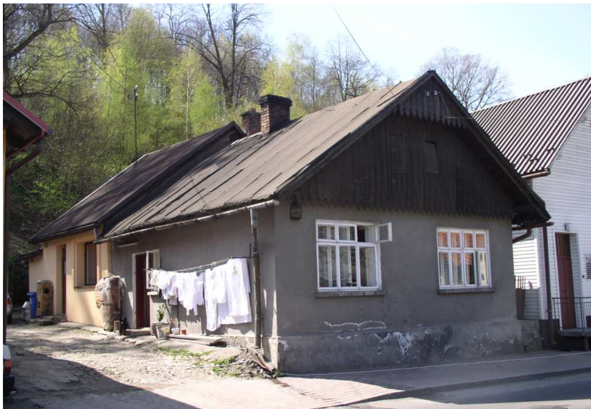
Fot. nr 31. Przykład typowej zabudowy z I połowy XX wieku (dom nr 19).