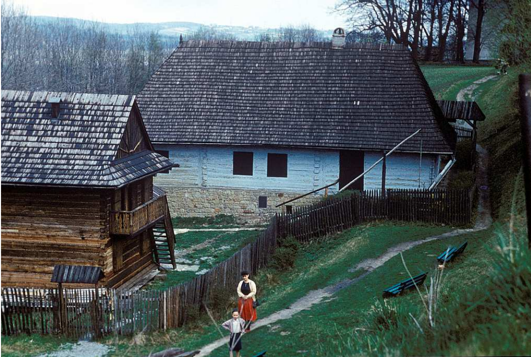
Fot. nr 66. Zabudowania skansenu (wiosna 1989).