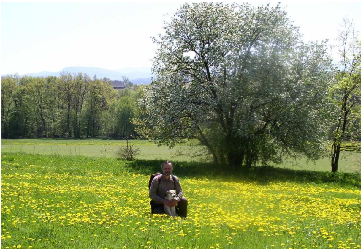
Fot. nr 1. Z Gucią w Zagórzanach na tle majestatycznej Kostrzy (2007).