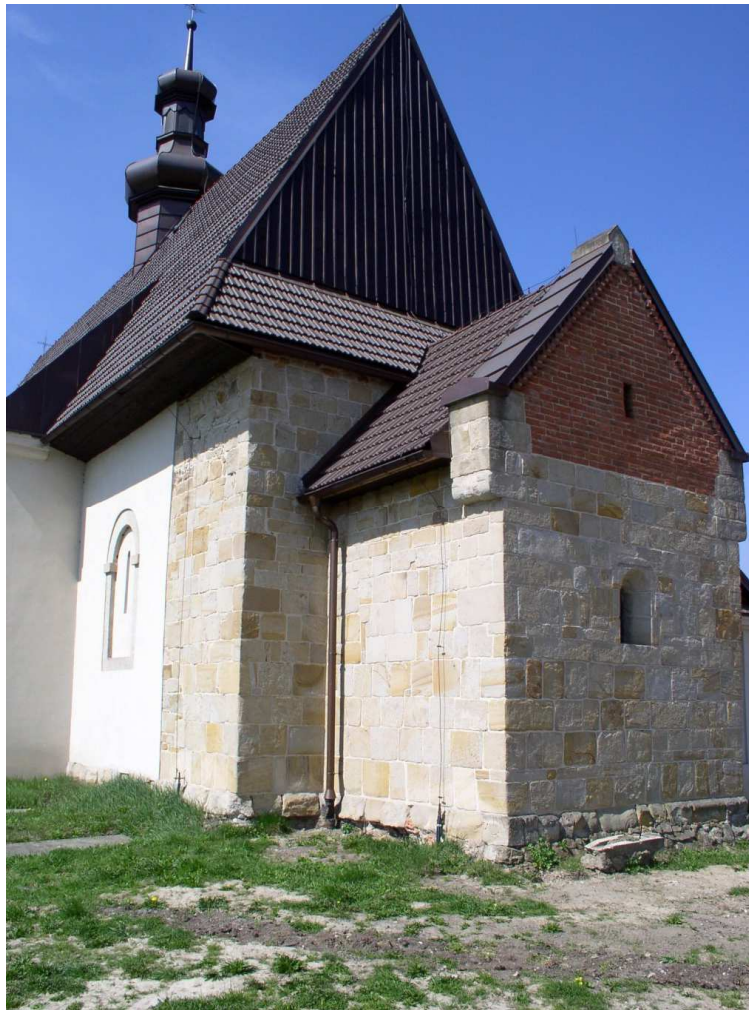
Fot. nr 98 (98-101). Kościół parafialny pw. śś. Mikołaja i Marii Magdaleny, pochodzący z końca XII bądź z początku XIII wieku. Nowy kościół powstał w latach 1960-66.