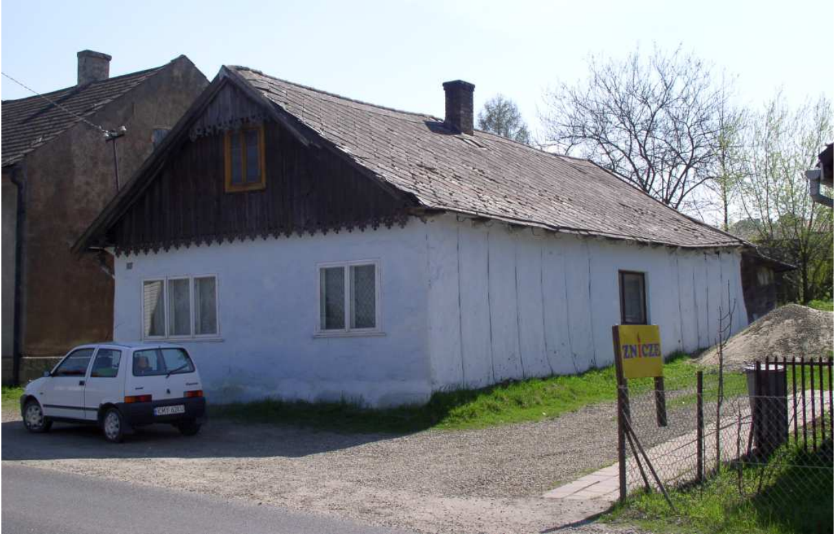
Fot. nr 42 (42-43). Zniekształcona już mocno stara chałupa (nr 49), być może jeszcze z XIX-to wiecznymi korzeniami.