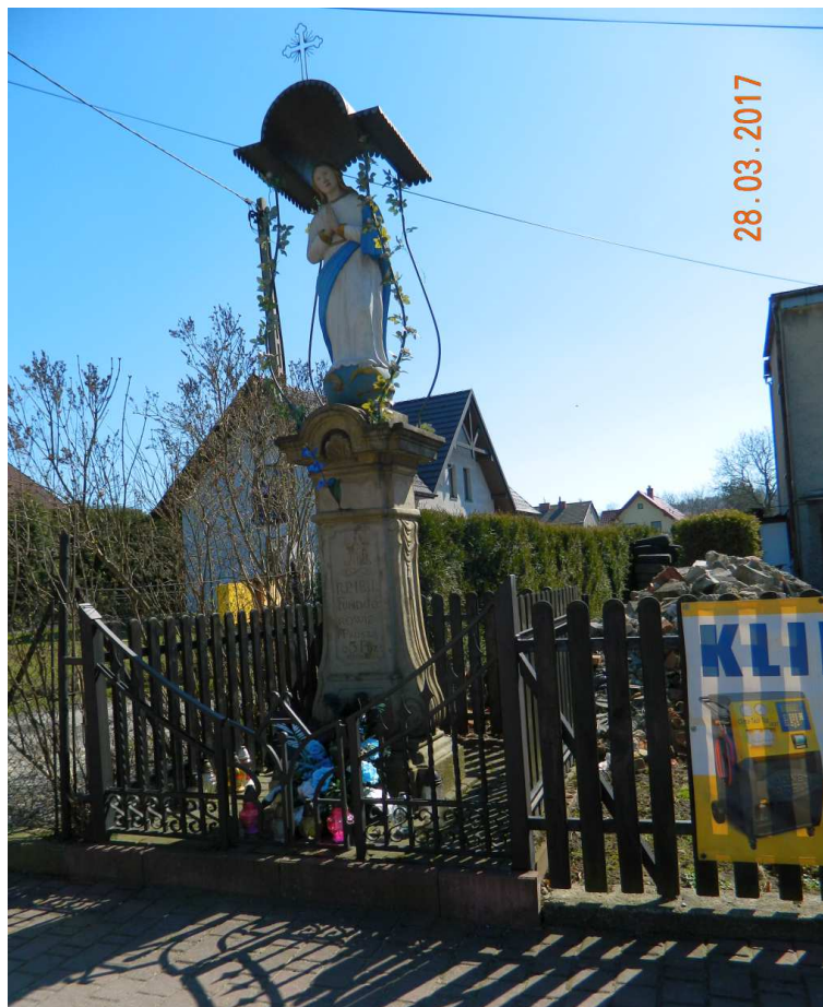
Fot. nr 95 (95-97). Zabytkowa, bo pochodząca z roku 1811, figura Matki Boskiej z początku ulicy Długosza.