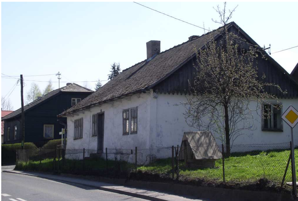
Fot. nr 33 (33-37). Oryginalna chałupa (nr 29) na styku z ulicą Królowej Jadwigi, zapewne pochodząca gdzieś z przełomu XIX i XX wieku, która już nie istnieje.