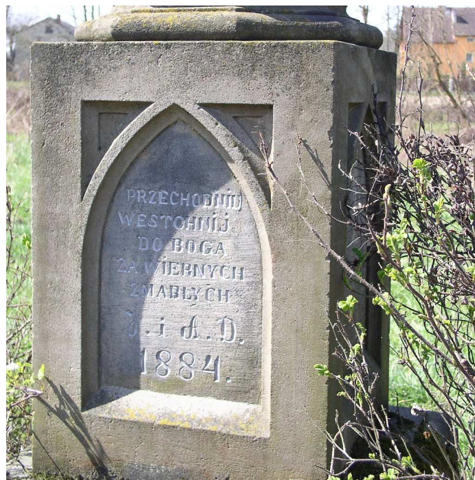
Fot. nr 111. Inskrypcja na cokole figury.