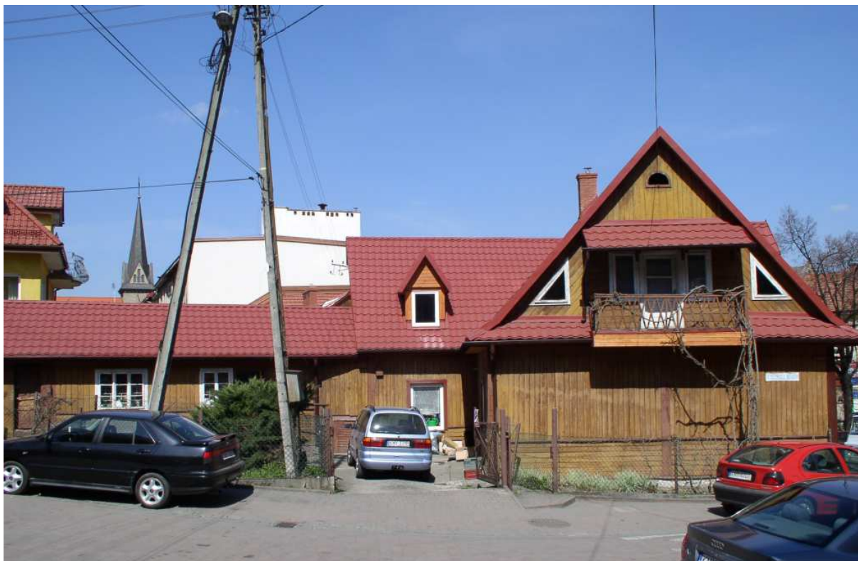
Fot. nr 16 (16-17). Stary kompleks mieszkalno-gospodarczy z naroża Rynku 33 i ulicy Kazimierza Wielkiego, pochodzący zapewne z początku XX wieku.