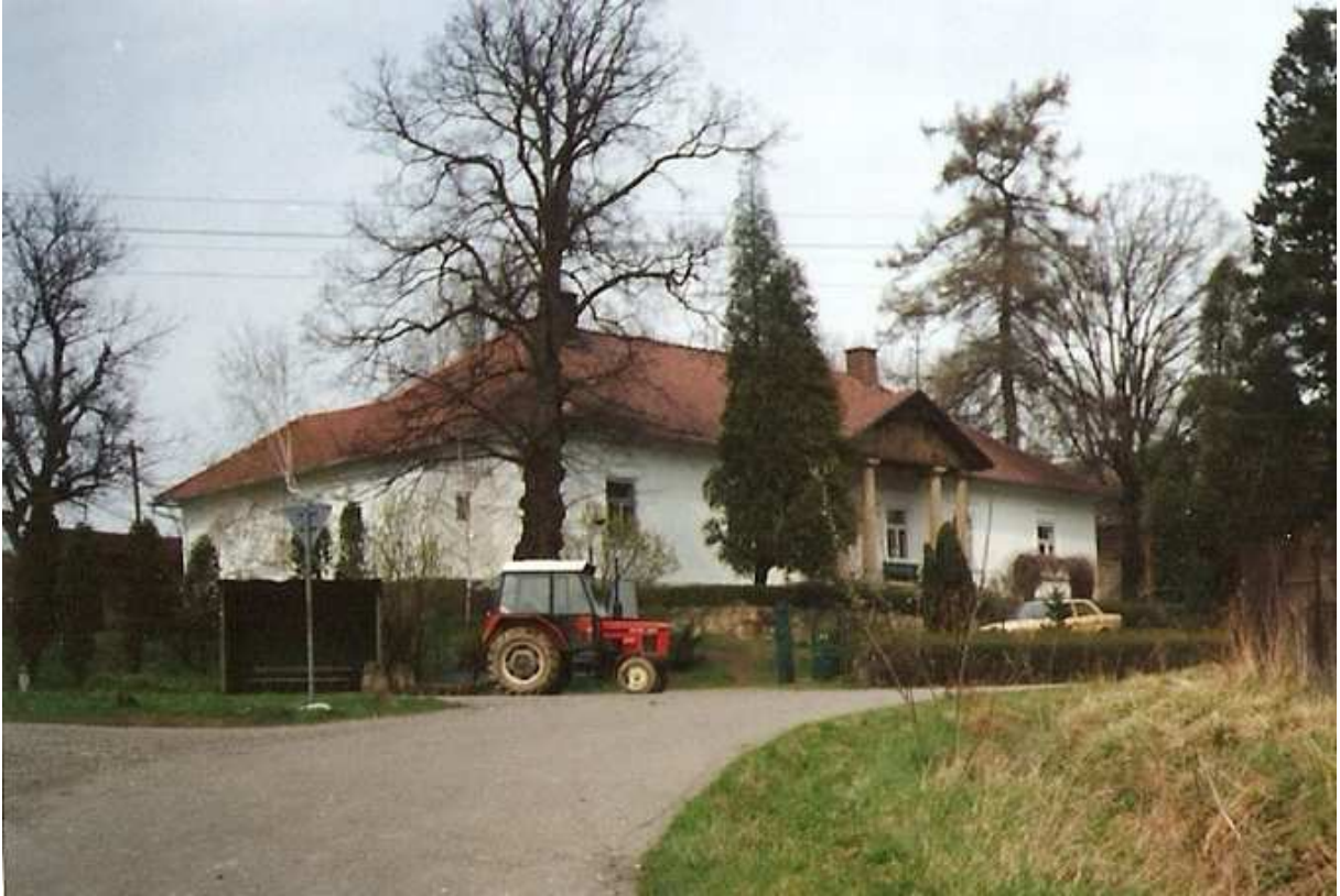
Fot. nr 3. Mierzeń - klasycystyczny dwór Banachów z przełomu XVIII i XIX wieku (1994).