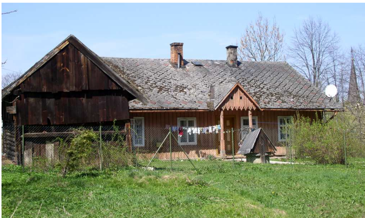
Fot. nr 21. Willa z ulicy Kazimierza Wielkiego 6 – widok od strony ulicy Kasztelana Dobka na jej podwórk