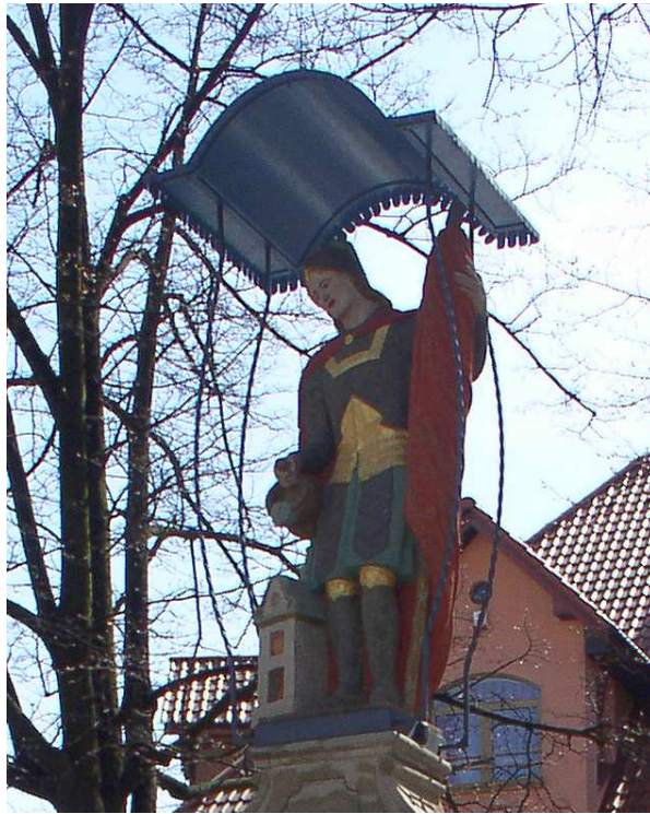
Fot. nr 6a. Postać świętego.