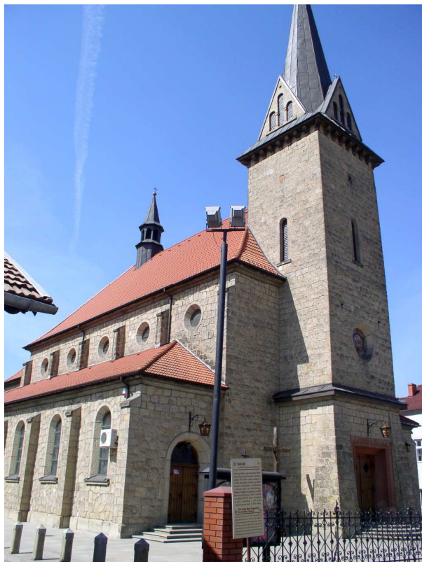
Fot. nr 5. Powojenny kościół parafialny p.w. Matki Boskiej Wspomożenia Wiernych z centrum dobczyckiego Rynku.