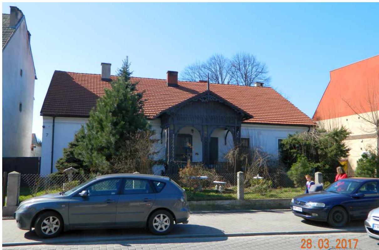
Fot. nr 86 (86-87). Zabytkowy dworek przy dobczyckim Rynku (nr 7).