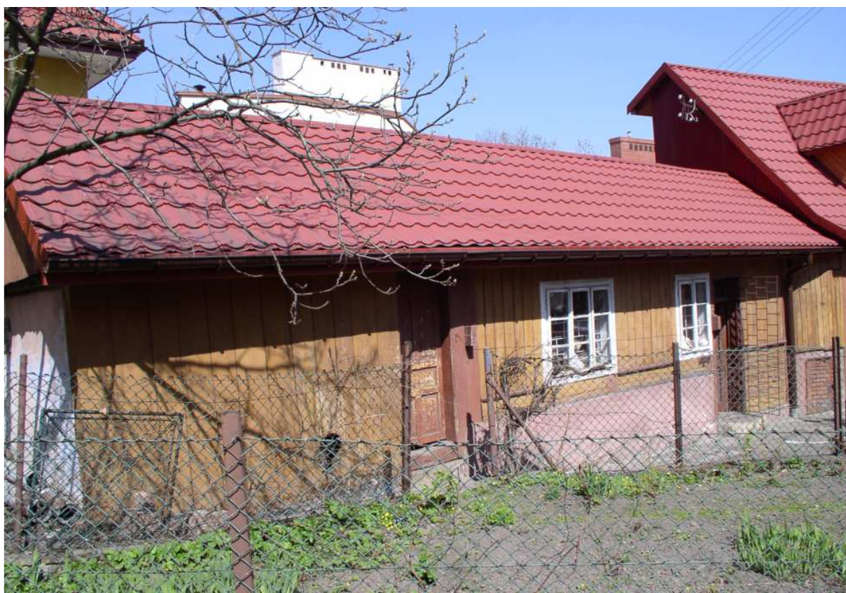
Fot. nr 17. Oficyna kompleksu – widok od strony ulicy Kazimierza Wielkiego.