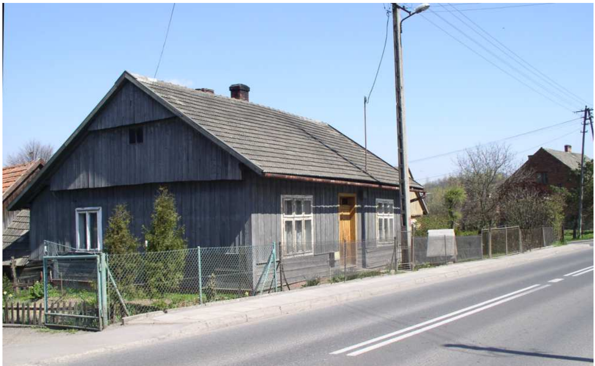
Fot. nr 57. Oryginalny, zapewne już powojenny dom spod nr 82.