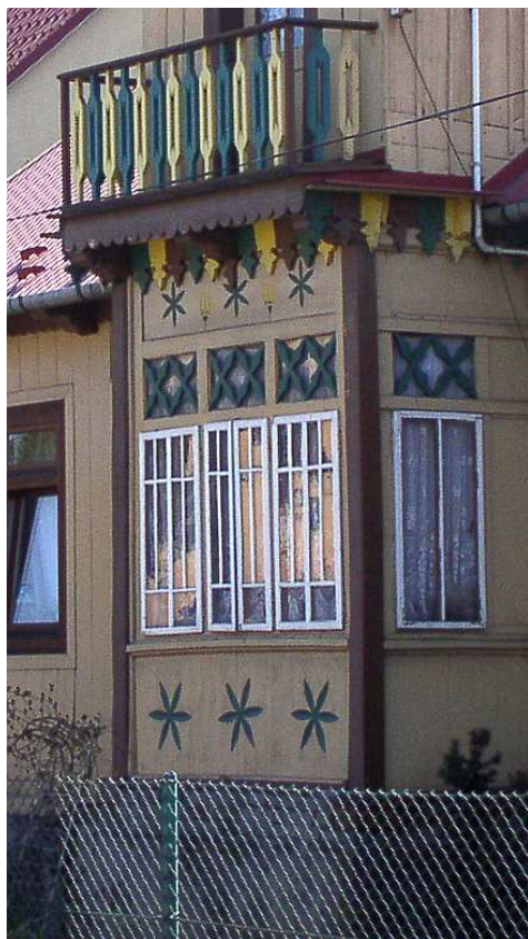
Fot. nr 38a. Ciekawie zdobiony ganek.