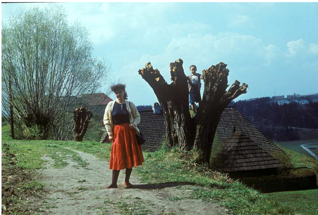
Fot. nr 64 (64-66). Przy skansenie w sąsiedztwie dobczyckiego zamku (wiosna 1989).