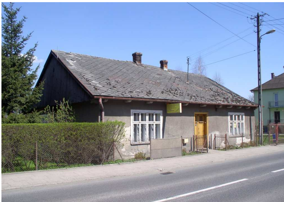
Fot. nr 39 (39-40). Oryginalny dom (nr 41?) zapewne z II ćwierci XX wieku.