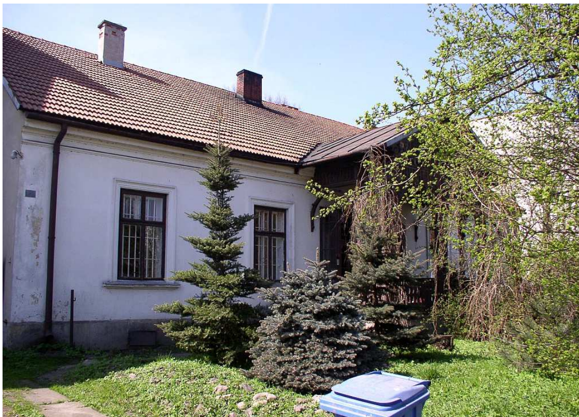
Fot. nr 10. Szczegóły fasady dworku.