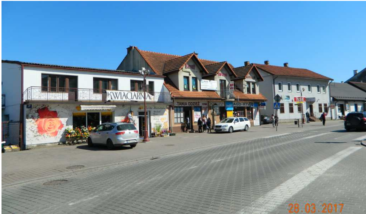
Fot. nr 88. Widok początkowego fragmentu wschodniej pierzei Rynku (od nr 2), począwszy od ulicy Piłsudskiego.