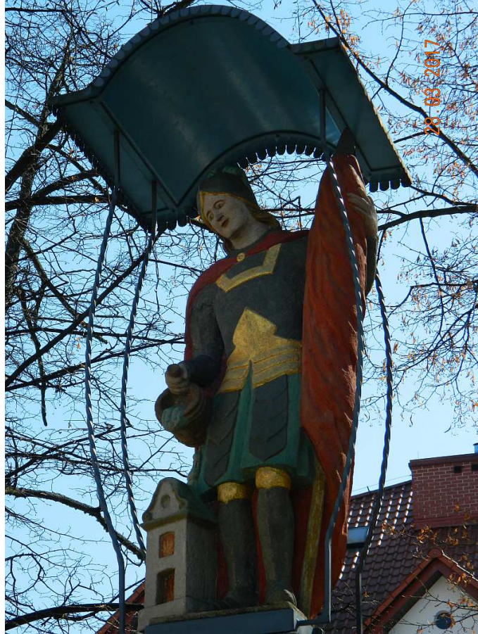
Fot. nr 80. Postać św. Floriana w kształcie typowym dla podkrakowskich wsi.