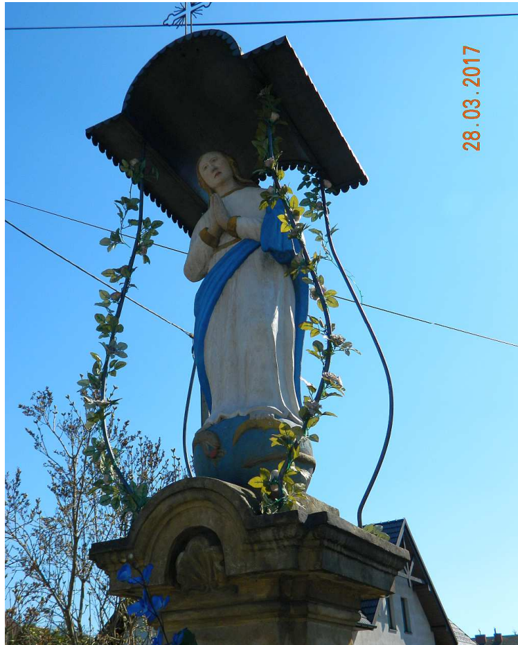
Fot. nr 96. Figura Matki Boskiej.