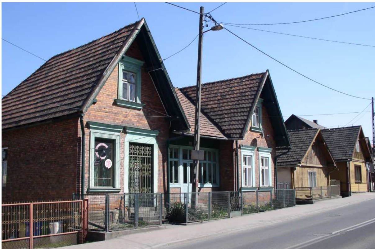
Fot. nr 28. Ciąg dalszy zabudowy wschodniej strony ulicy (nr: 20-24).