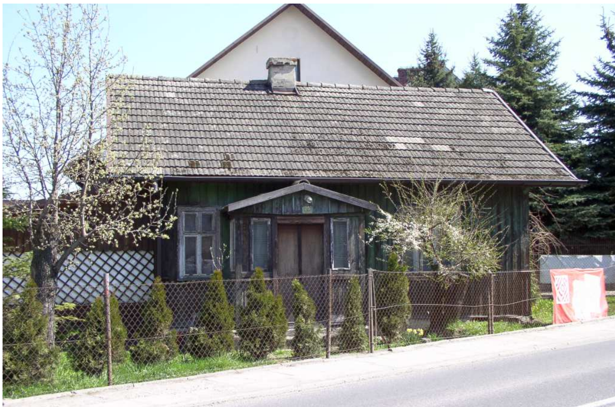
Fot. nr 54 (54-55). Domek z werandą (nr 70) wybudowany zapewne w II ćwierci XX wieku.