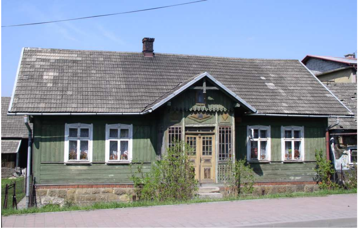
Fot. nr 58 (58-59). Piękny, drewniany dom z werandą z ulicy Marwin 10, zapewne pochodzący jeszcze z I-ej ćwierci XX wieku bądź z przełomu I i II ćwierci.