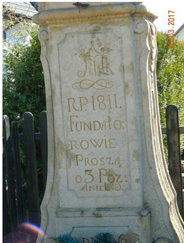
Fot. nr 97. Inskrypcja na cokole.