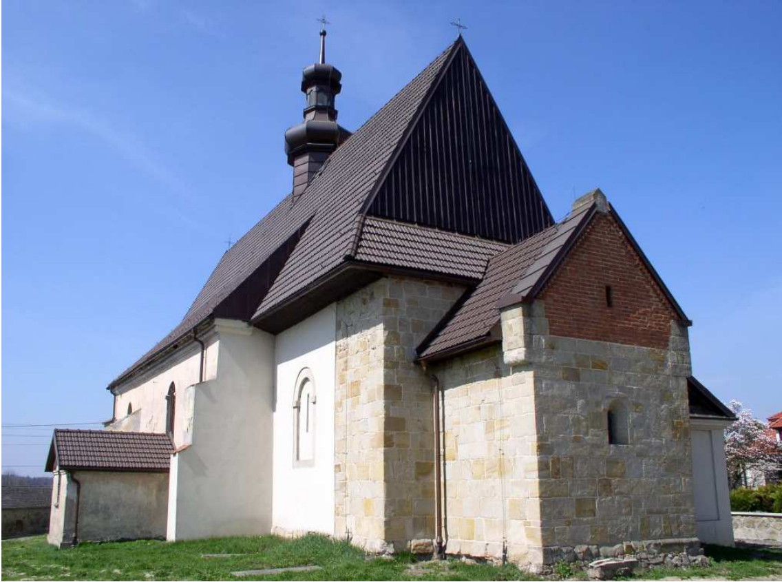
Fot. nr 100. Oryginalne romańskie prezbiterium z półkolistym okienkiem.