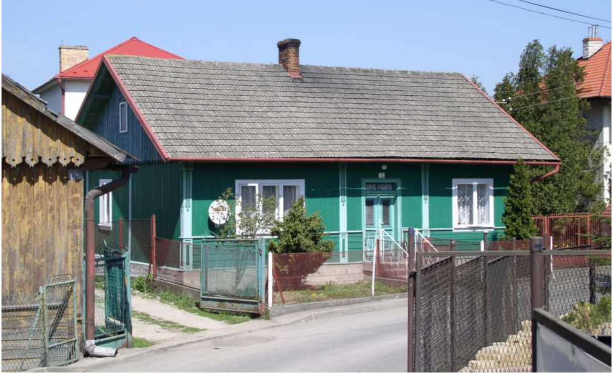
Fot. nr 50. Inny, zadbanej domek z okolic połowy XX wieku z ulicy św. Anny 4.