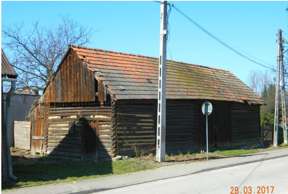
Fot. nr 94. Stodoła przy dawnej zagrodzie z ulicy Królowej Kingi 2. Można przypuszczać, że zabudowa tej zagrody powstała na początku XX wieku.