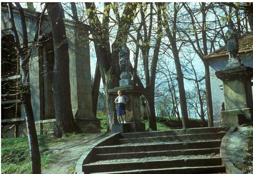
Fot. nr 63. Przed kościołem św. Jana Chrzciciela (wiosna 1989).