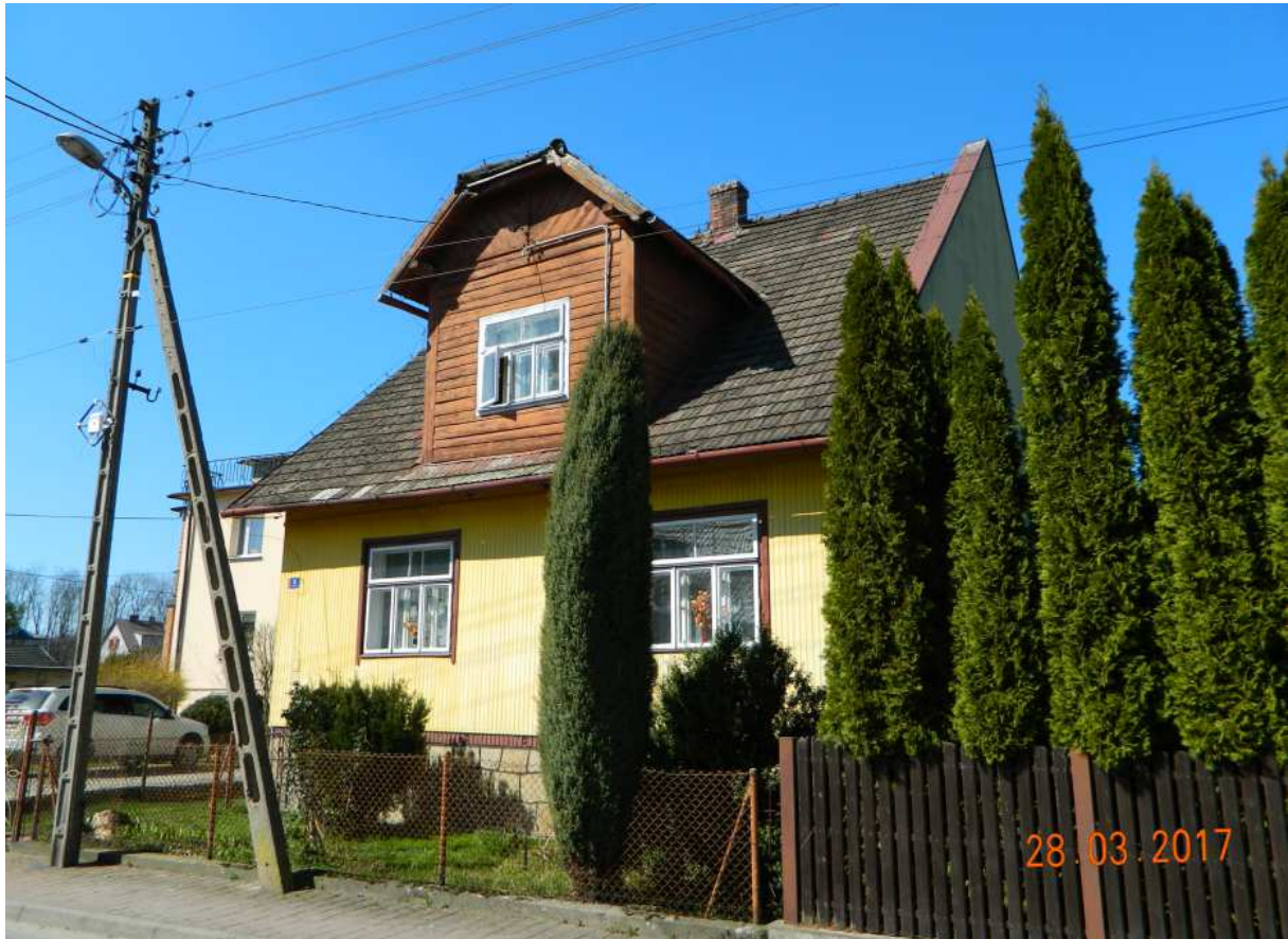
Fot. nr 90.