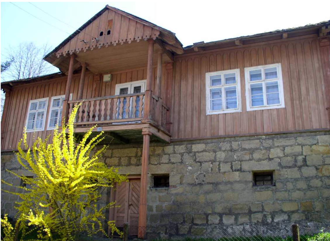
Fot. nr 19. Fasada willi i jej kamienne przyziemie.