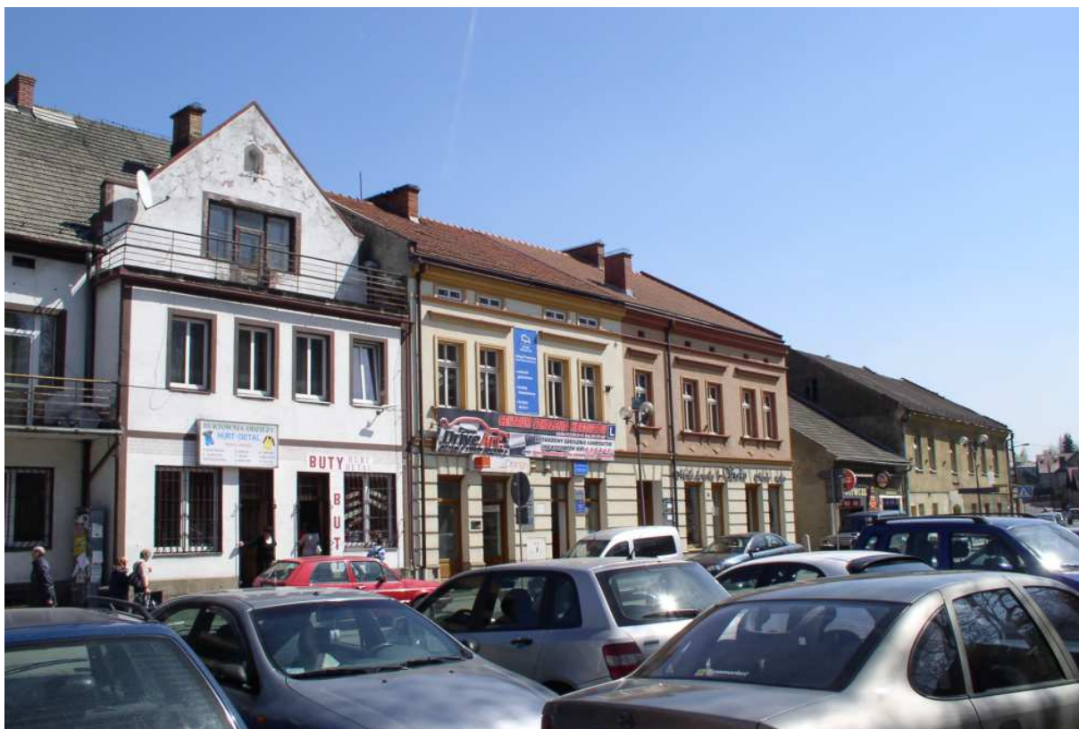
Fot. nr 13. Stuletnie kamieniczki we wschodniej pierzei Rynku (nr: 32-38).