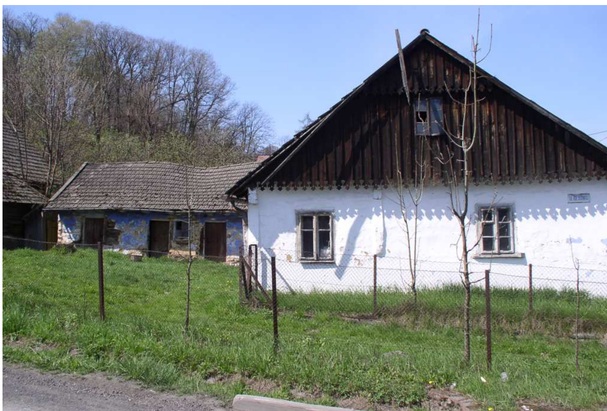
Fot. nr 36. Zabudowania gospodarcze od strony dziedzińca.