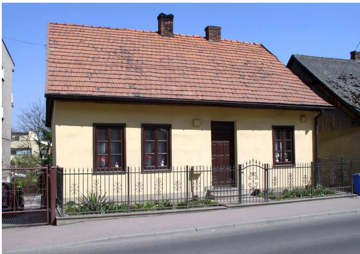
Fot. nr 27. Przebudowana, stara chałupa (nr 14?) z zachowaną stolarką okienną.