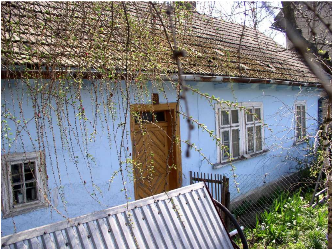
Fot. nr 105. Fasada ciągle zamieszkałego „antyku” z Dziekanowic.