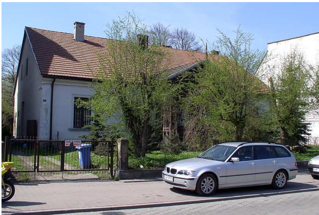
Fot. nr 9 (9-11). Zabytkowy dworek z centrum Dobczyc (Rynek 7), powstały zapewne na początku XX wieku.