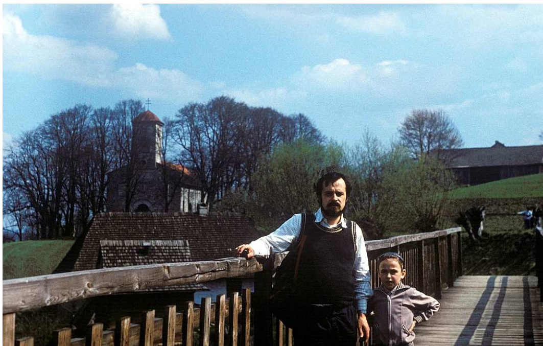
Fot. nr 62 (62-63). Nad fosą zamku w Dobczycach. W tle stare Dobczyce i kościół p.w. św. Jana Chrzciciela (wiosna 1989).