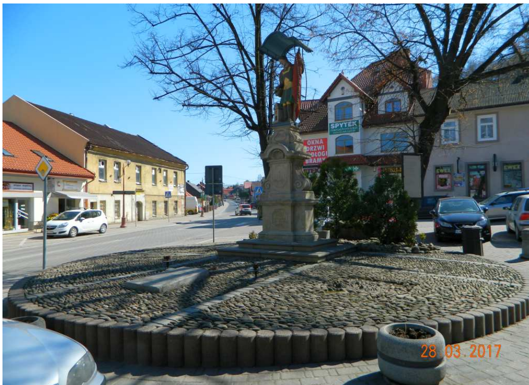
Fot. nr 78 (78-81). Zabytkowa figura św. Floriana na dobczyckim Rynku.