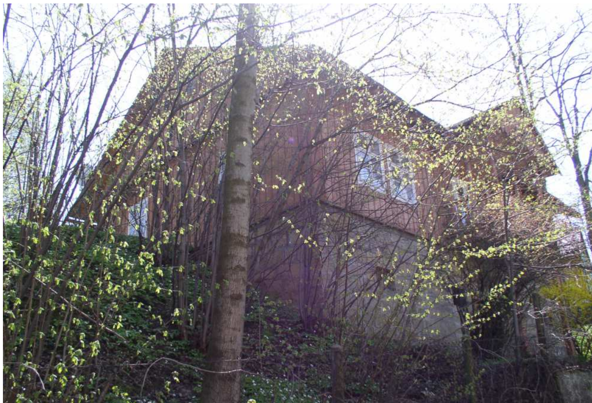
Fot. nr 20. Widok z boku na efektowny dom wbity w stromy brzeg.