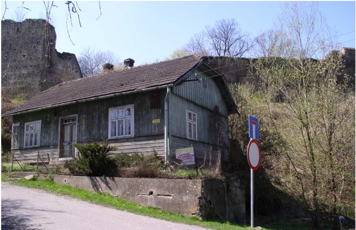
Fot. nr 24. Z murami obronnymi starego miasta w tle.

Fot. nr: 25-61 - ulica Jana Kilińskiego.