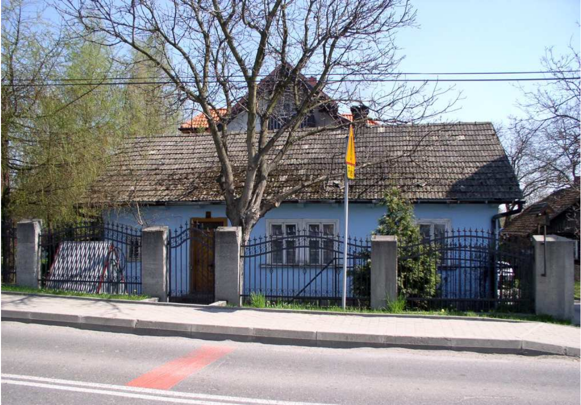
Fot. nr 104 (104-106). Oryginalnie „siwiona” chałupa spod nr 58, zapewne z rodowodem z przełomu XIX i XX wieku bądź z początku XX wieku.