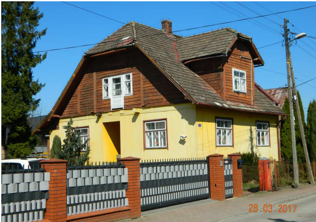
Fot. nr 89 (89-90). Willa z ulica Piłsudskiego 2, zapewne pochodząca z okolic przełomu I i II ćwierci XX wieku.