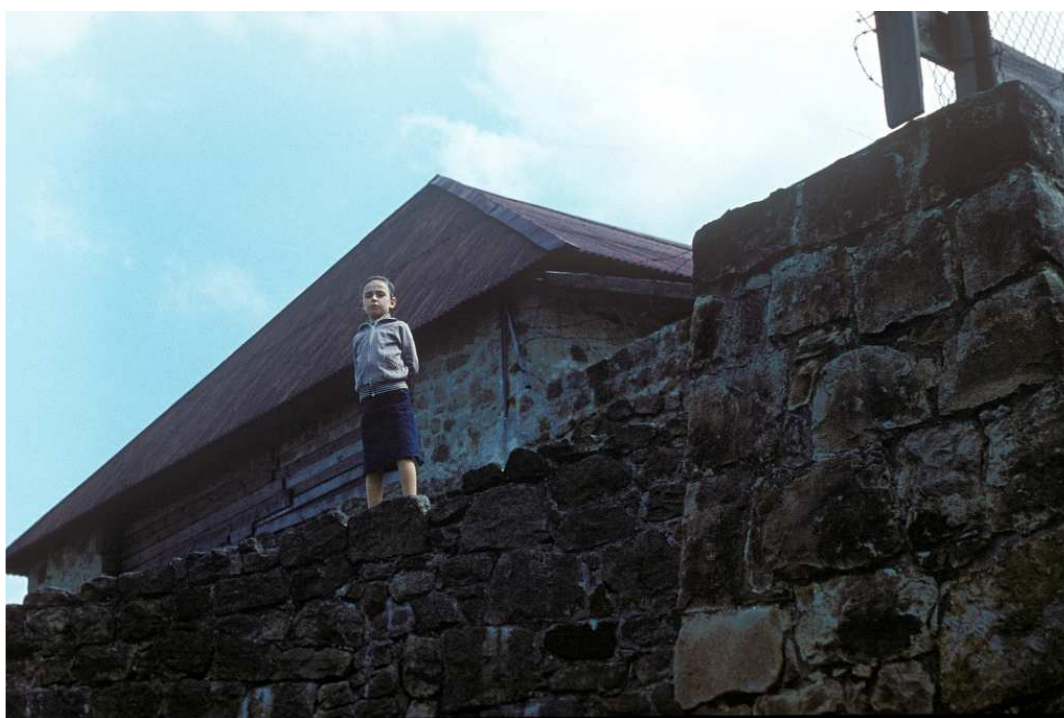
Fot. nr 69 (69-70). Częściowo zrekonstruowane mury dobczyckiego zamku.