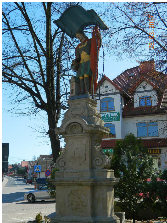
Fot. nr 79. Lico Figury.