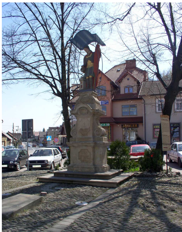
Fot. nr 6 (6-7). Figura św. Floriana z dobczyckiego Rynku z 1768 roku, upamiętniająca powstanie nowych Dobczyc.