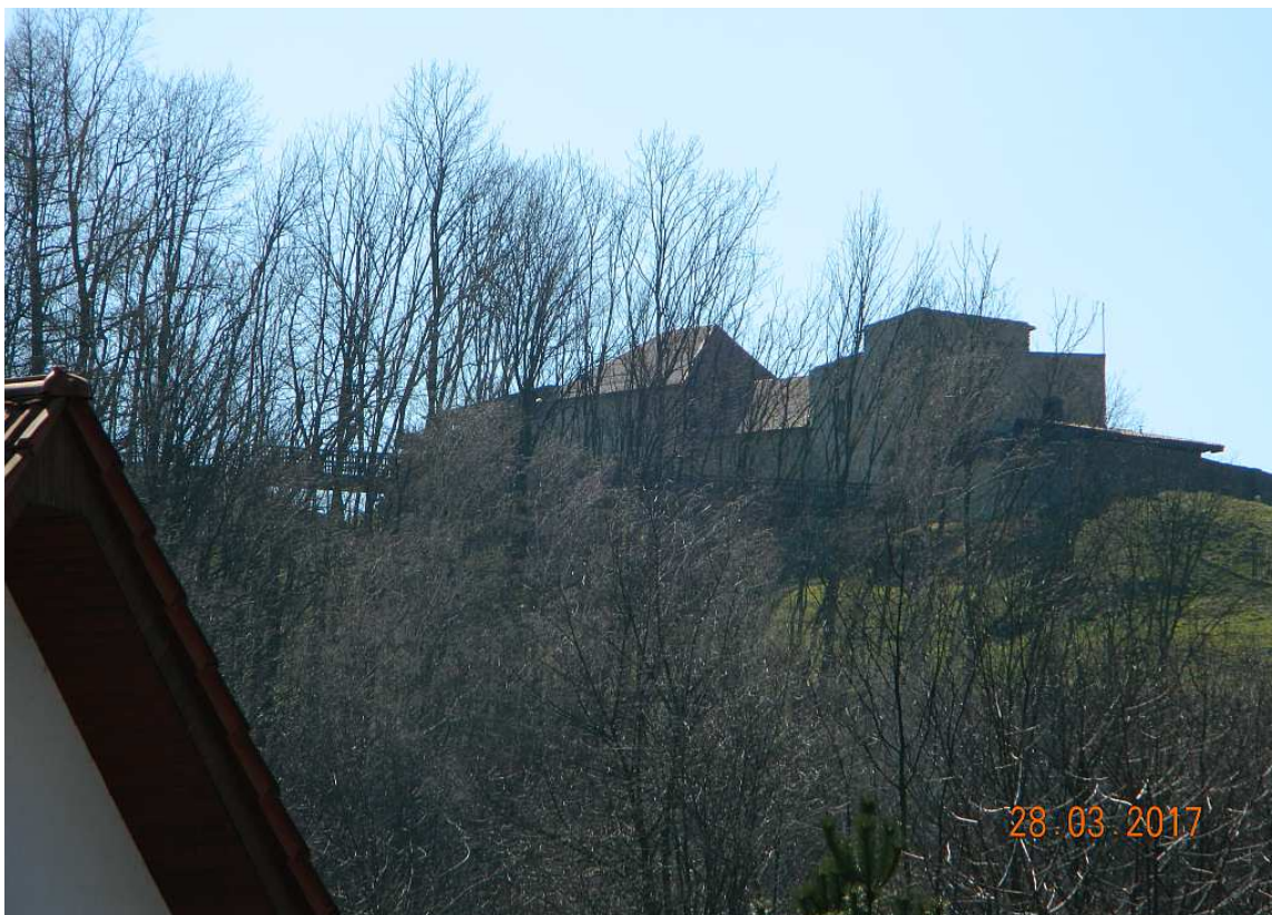
Fot. nr 72 (72-73). Widoki z ulicy Wąskiej, z sąsiedztwa stadionu. Tu w stronę zamku.