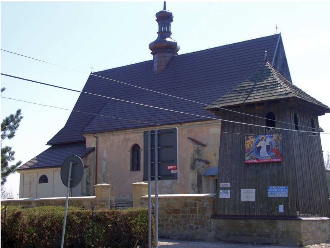
Fot. nr 101. Widok na przebudowaną nawę główną kościoła i drewnianą dzwonnice.