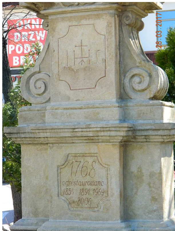
Fot. nr 81. Inskrypcja na cokole figury z wygrawerowaną jej historią.