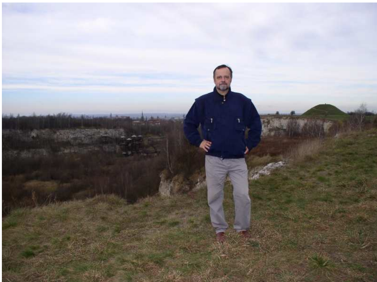
Na wzniesieniu nad dawnym kamieniołomem Libana. W tle Kopiec Krakusa i Mój Kraków.

Facebook: http://pl-pl.facebook.com/people/Leszek-Grabowski/100000321665908