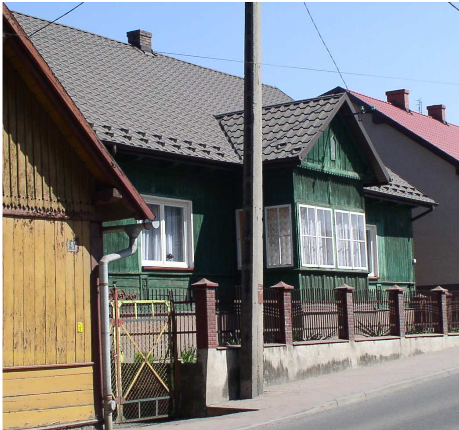
Fot. nr 30a. Zapewne blisko stuletni dom z werandą spod nr 26.