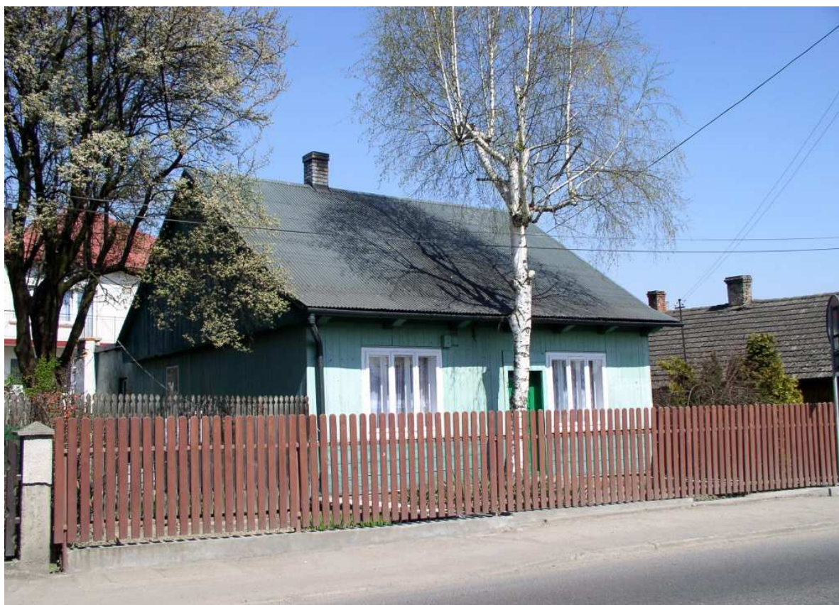
Fot. nr 49. Domek typowy dla czasów z połowy XX-go wieku (nr 68?).