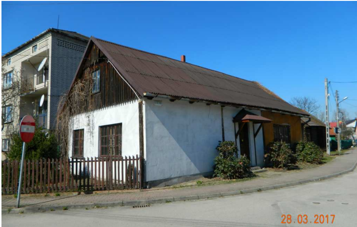
Fot. nr 92 (92-93). Zniekształcony już stary dom z Królowej Kingi 2 (w narożu z ulicą Piłsudskiego).