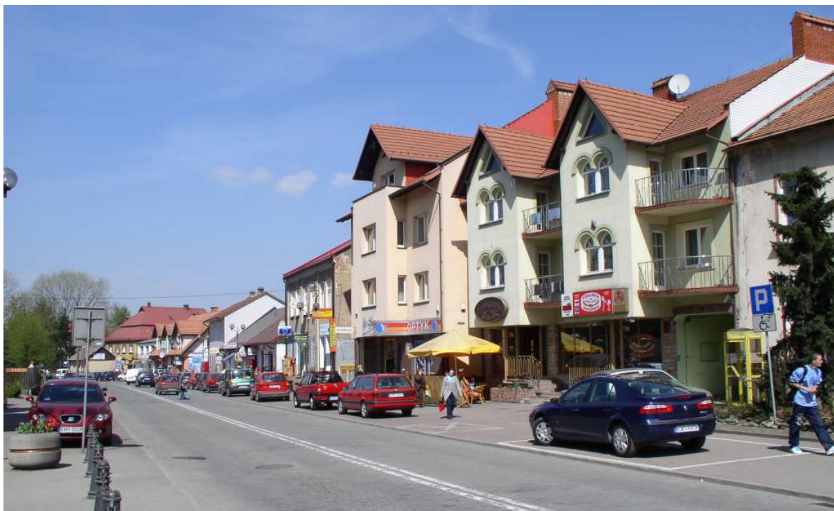
Fot. nr 12. Widok na początkowy fragment pierzei Rynku o numerach parzystych.