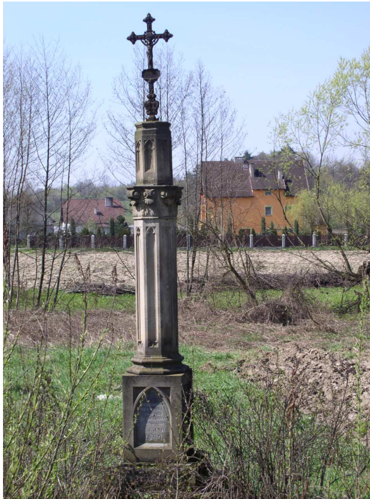
Fot. nr 110 (110-111). Piękna neogotycka figura z 1884 roku, która stoi na rozwidleniu dróg: Gdów – Dobczyce (ul. Zarabie) i Dobczyce – Wieliczka (ul. Dobczycka).