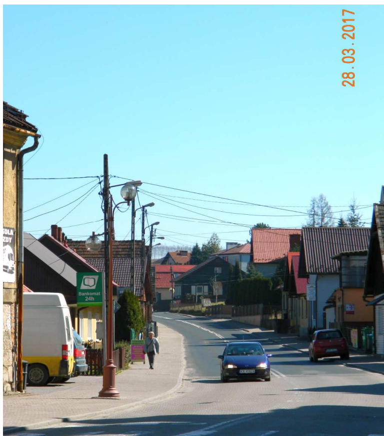
Fot. nr 75 (75-77). Wzdłuż początkowego odcinka ulicy Jana Kilińskiego.