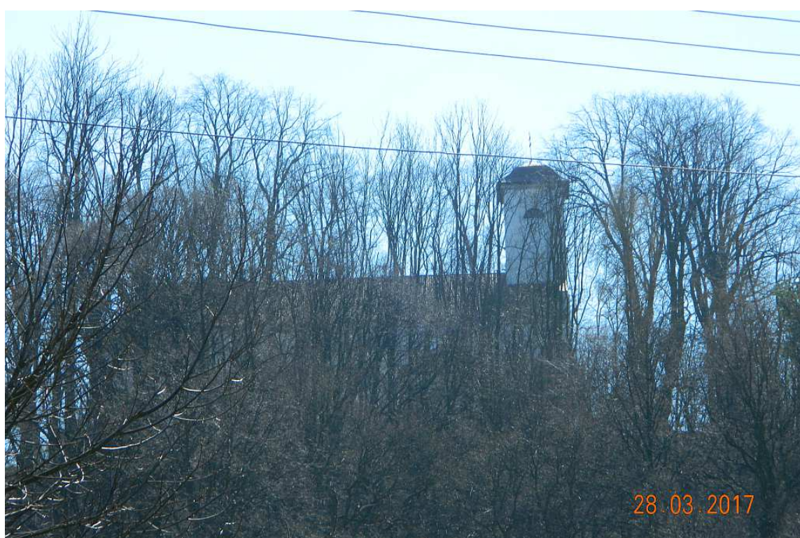
Fot. nr 73. W stronę kościoła p.w. św. Jana Chrzciciela na wzgórzu zamkowym.