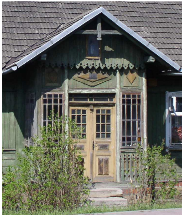
Fot. nr 59. Oryginalny, ozdobny ganek z mozaikowymi szybkami.