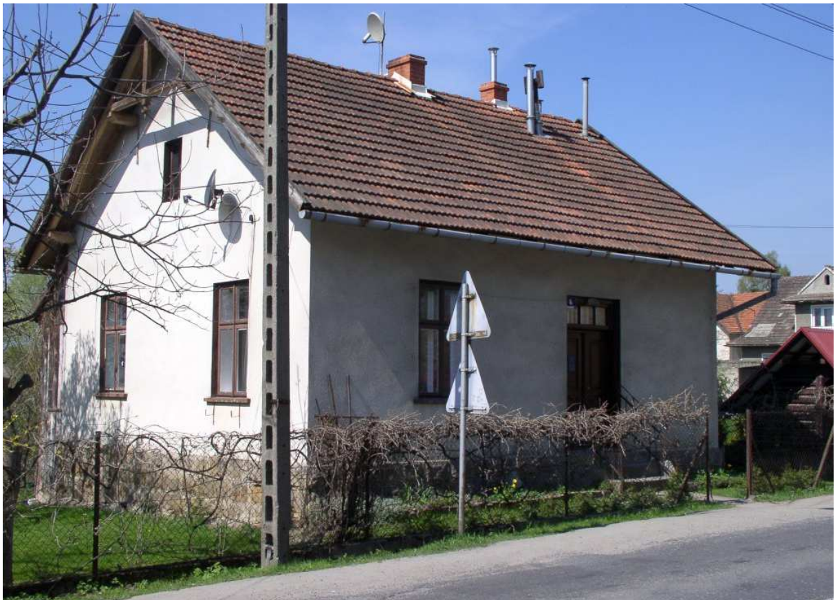
Fot. nr 103. Domek spod nr 6 z okolic II ćwierci XX wieku (dawna plebania?).