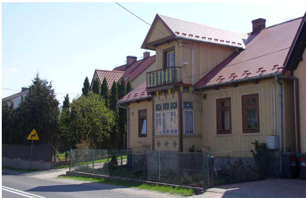
Fot. nr 38 (38-38a). Niemal oryginalna (z wyjątkiem okien) dawna willa pod nr 37, ze zdobionym gankiem i jaskółką.