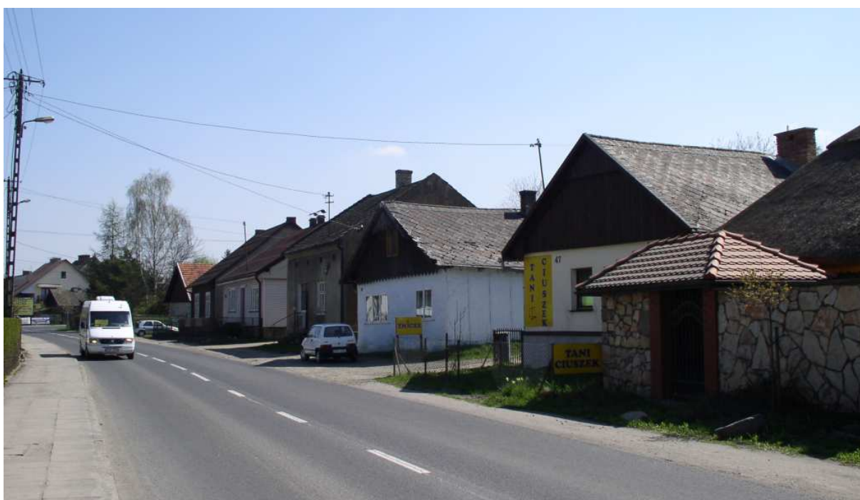
Fot. nr 41. Dalszy fragment zachodniej pierzei ulicy (nr 47-57).