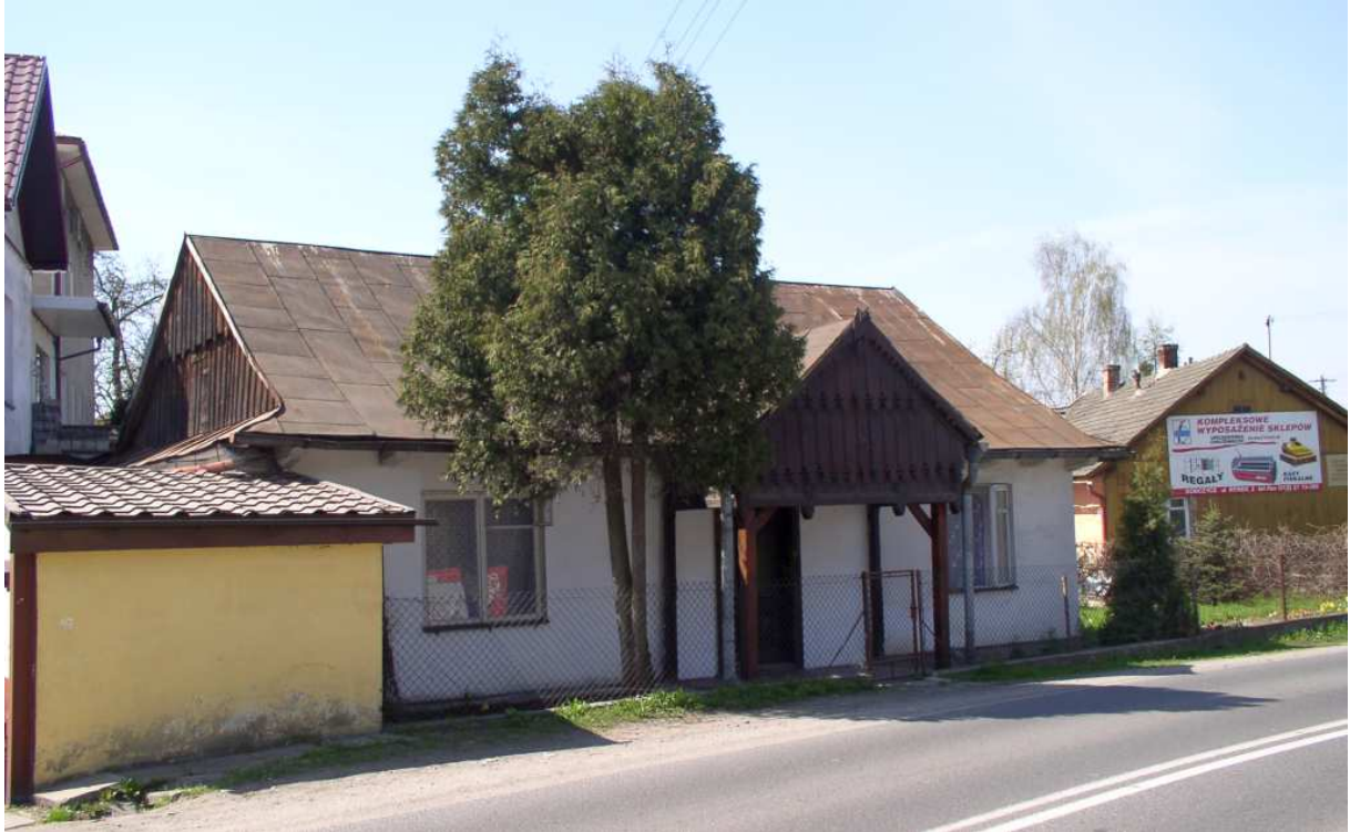
Fot. nr 56. Portyk starego domu (nr 61) z przebudowaną fasadą.