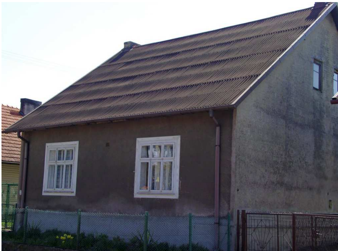
Fot. nr 44. Skromny, zapewne już powojenny domek (nr 55).