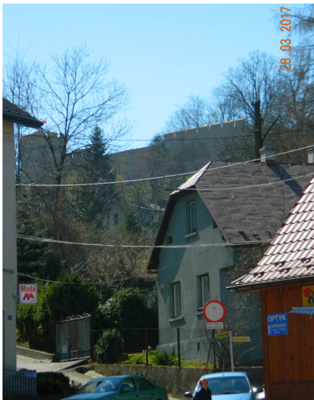
Fot. nr 73. Widok na mury obronne starych Dobczyc ponad ulicą kasztelana Dobka.