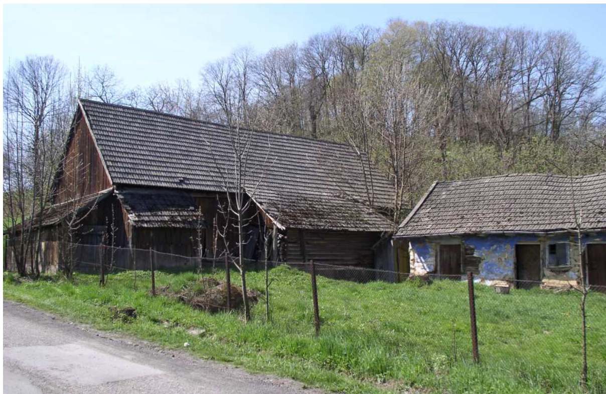
Fot. nr 37. Stodola ze wzgórzem zamkowym w tle.