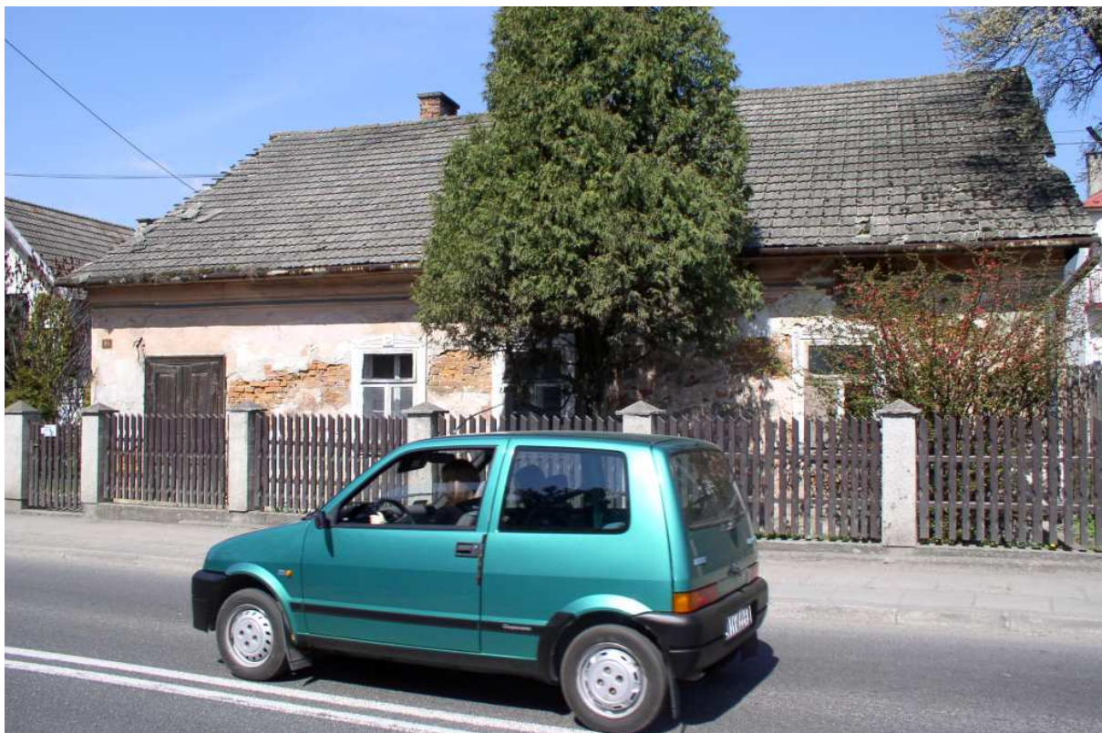
Fot. nr 48. 100-letnia chałupa na swym dziejowym zakręcie.