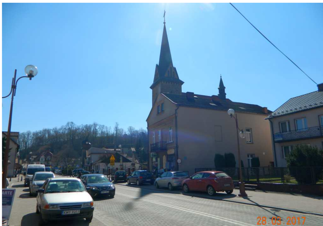
Fot. nr 85. Fragment Rynku u podnóża wzgórza zamkowego.