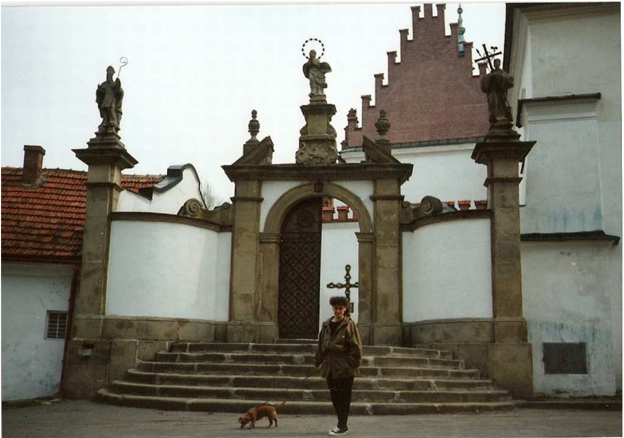
Fot. nr 3a. Przed Opactwem Cystersów w Szczyrzycu (1994).