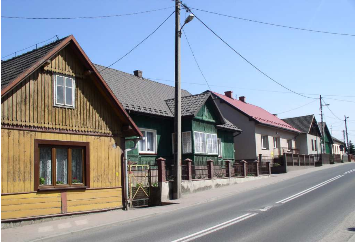
Fot. nr 30. Dalsza część zabudowy wschodniej pierzei ulicy (nr: 24-34).