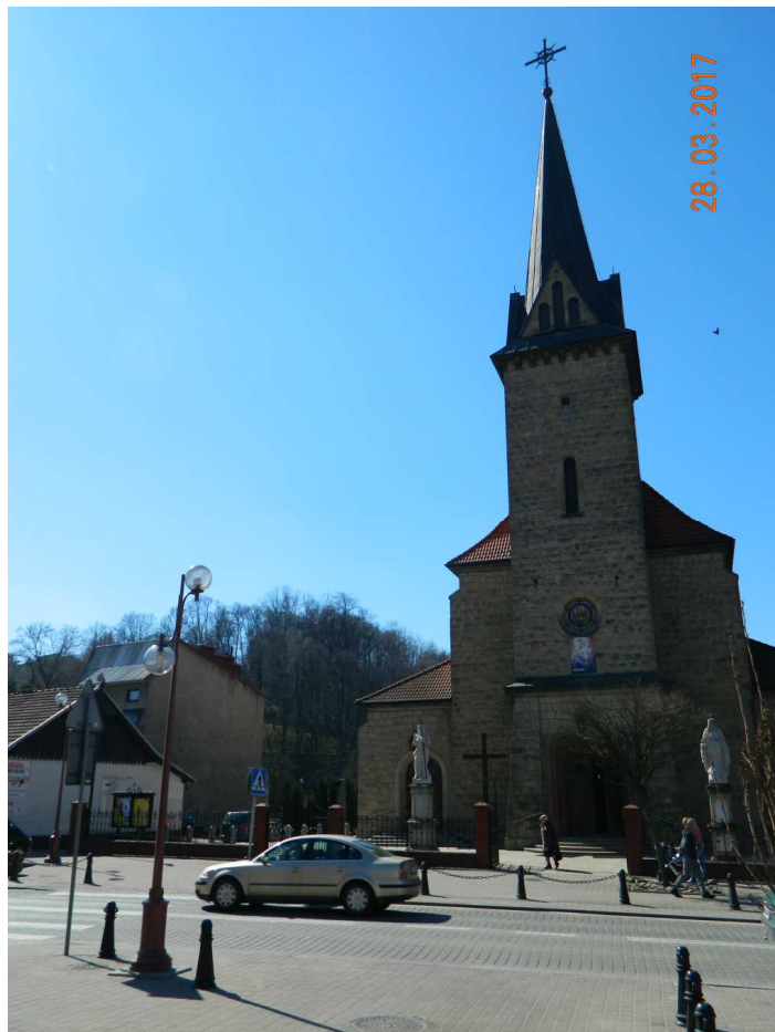
Fot. nr 84. Kościół parafialny p.w. Matki Bożej Wspomożenia Wiernych.