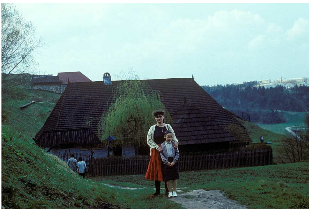
Fot. nr 65. Tradycyjna chata w dobczyckim skansenie (wiosna 1989).