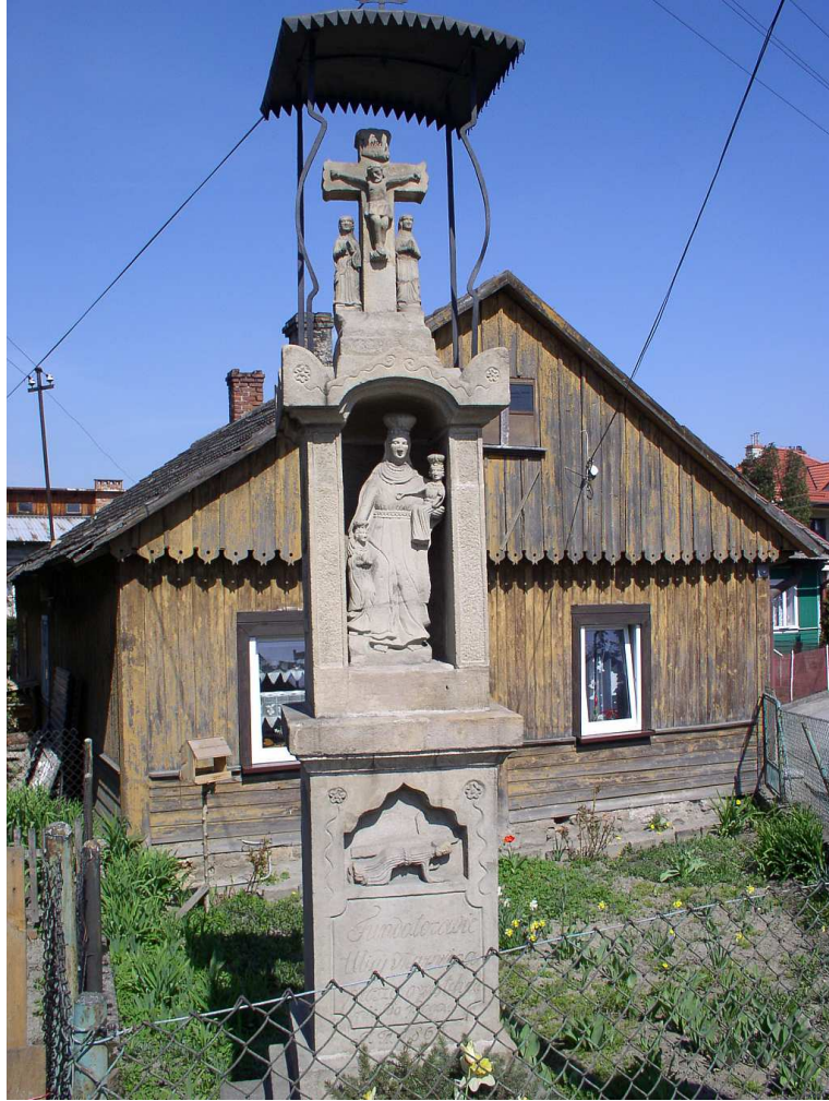
Fot. nr 52. Lico figury. W tle bok domku z początku ulicy św. Anny (nr 2).