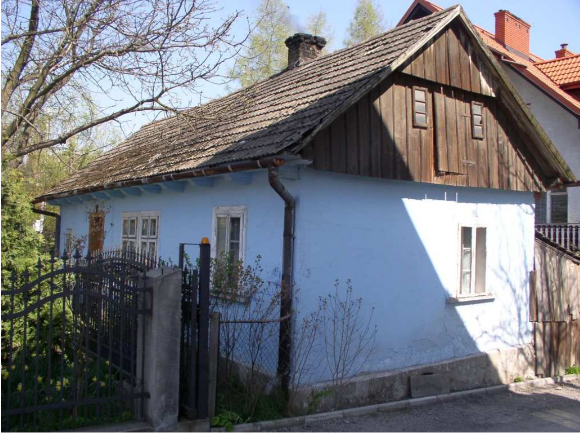
Fot. nr 106. Widok z boku.