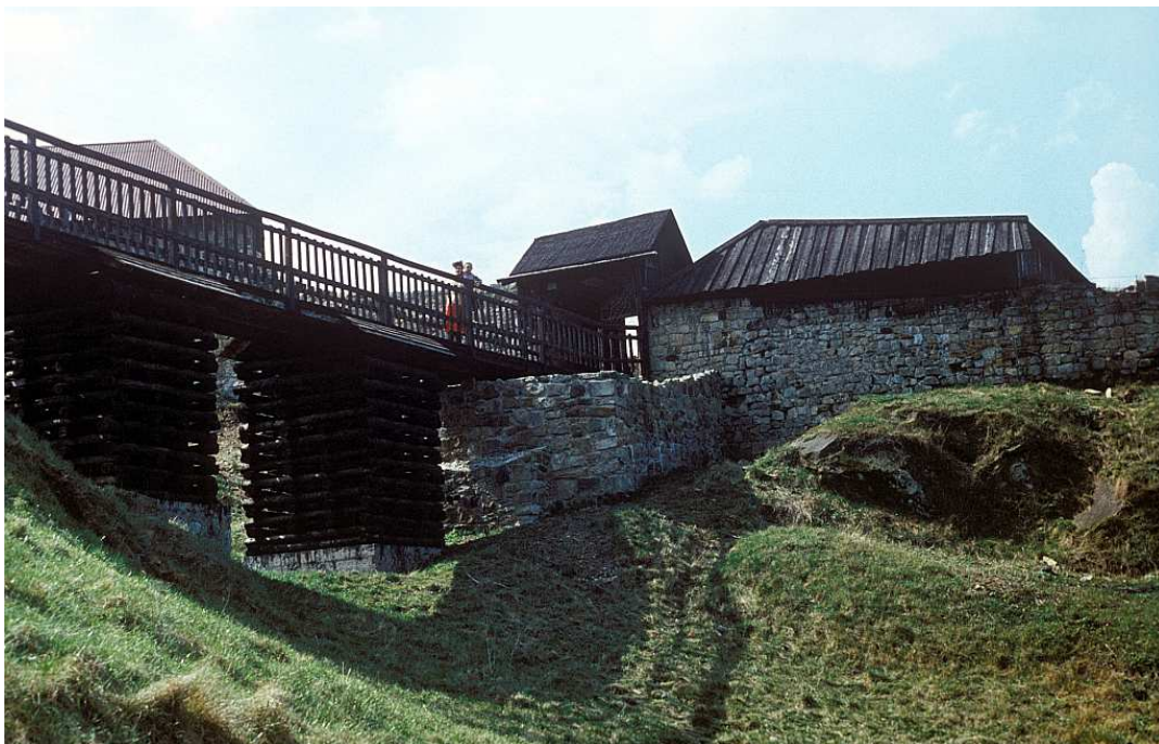
Fot. nr 67 (67-70). Różne ujęcia częściowo zrekonstruowanych ruin zamku w Dobczycach wg stanu z wiosny 1989 roku.