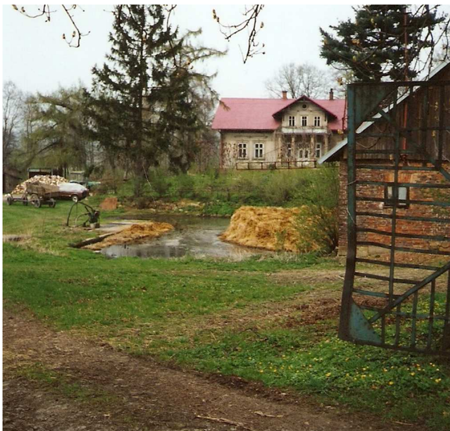
Fot. nr 2. Stadniki – dwór Bednarskich pochodzący z roku 1922 (1994).

Jestem włóczykijem i razem z żoną oraz z psem uwielbiamy zapuszczać się w najbliższe okolice Krakowa, szczególnie Gdowa, skąd pochodzili moi rodzice i tu nad Rabą, czy w okolicznych lasach: Woli Zręczyckiej, Zagórzan i Klęczany, pędzić wspólny sielski żywot, z dala od zgiełku i hałasu miejskiego. W okolicy Dobczyc zapuszczam się zwłaszcza jesienią, by w lasach Kornatki i Czasławia oddawać się grzybobraniu, a przy okazji odwiedzać pobliskie miejscowości.