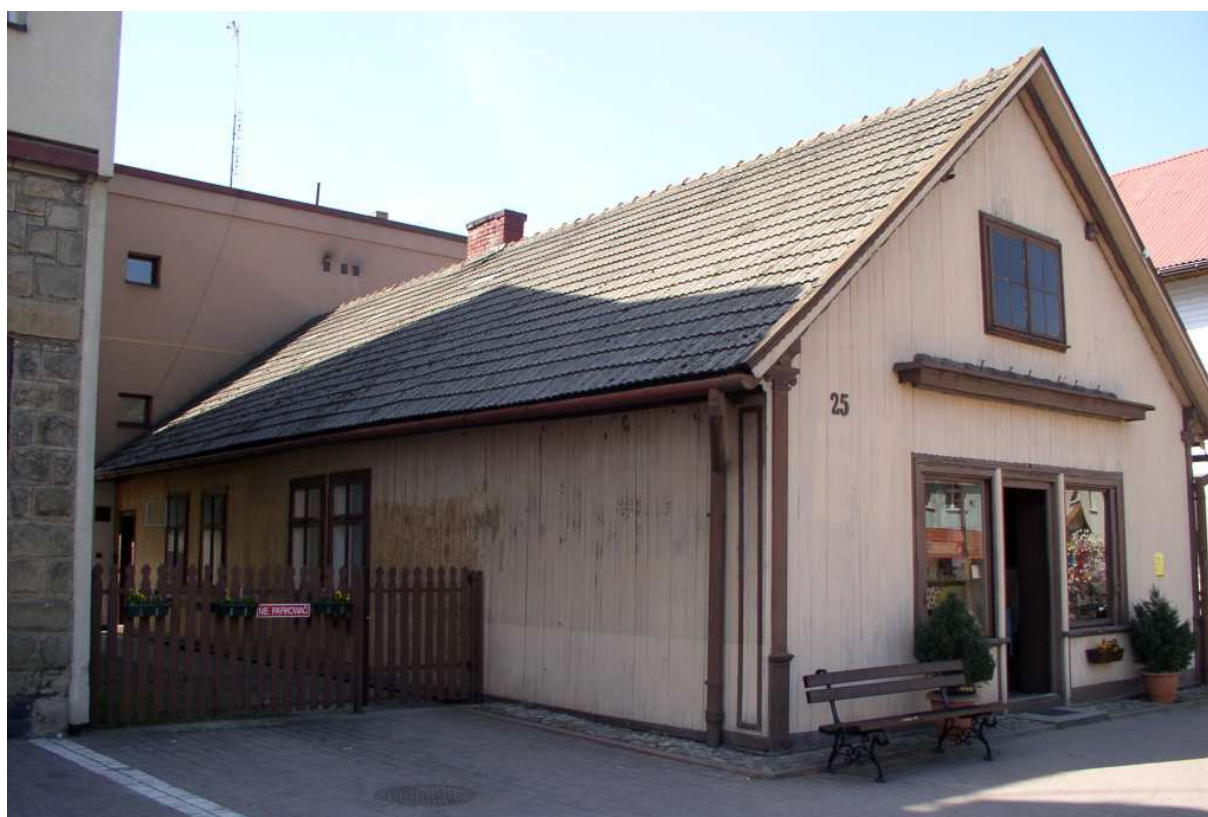
Fot. nr 15. Stary, drewniany dom, jeden z ostatnich antyków w zabudowie Rynku (nr 25).