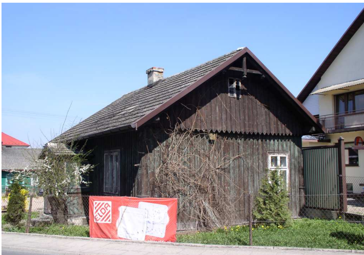
Fot. nr 55. Stary domek, którego wygląd nie uległ istotnej zmianie.