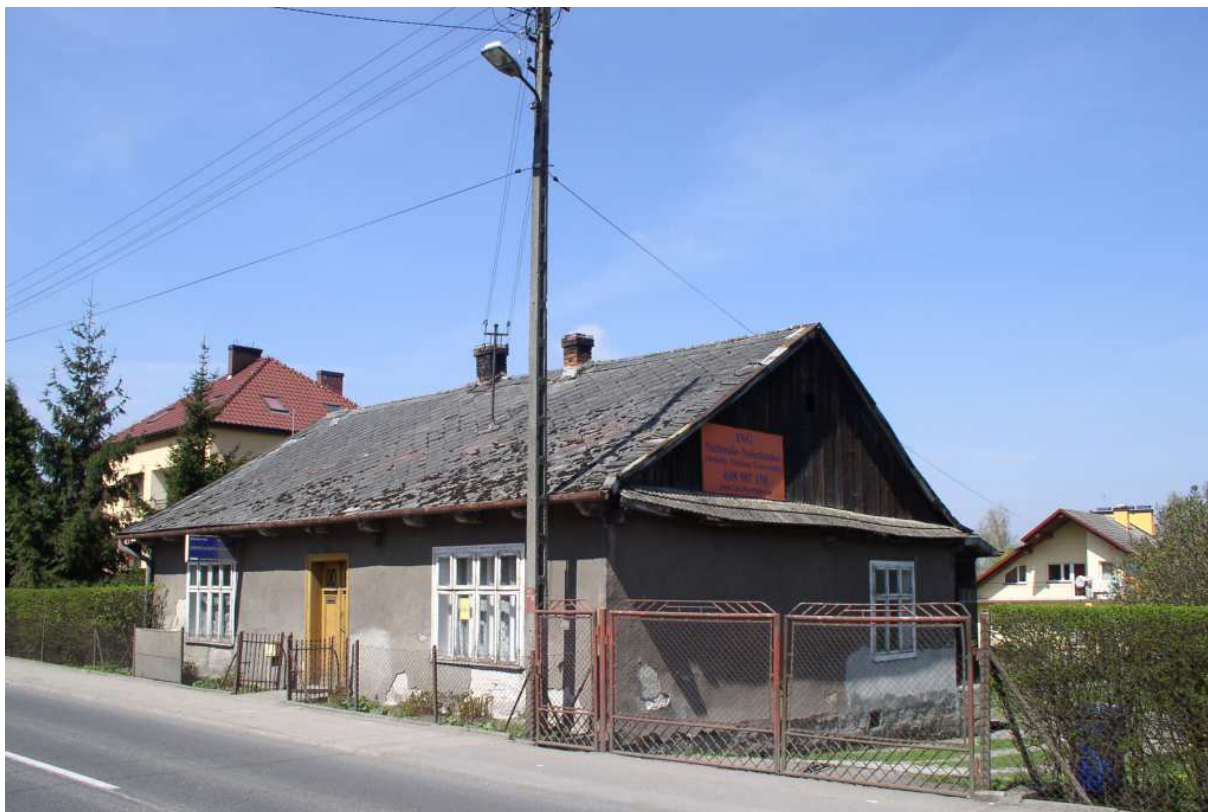
Fot. 40. Domek typowy dla Dobczyce z pierwszej połowy XX-go wieku.