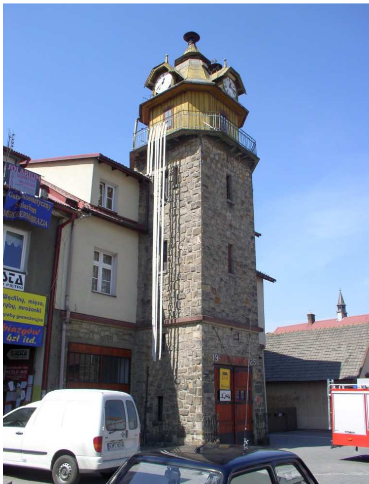
Fot. nr 8. Współczesna remiza strażacka w sąsiedztwie figury św. Floriana.