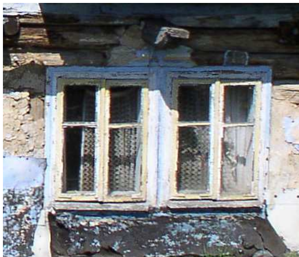
Fot. nr 61. Oryginalne okna, charakterystyczne dla wiejskich chałup powstałych do początku XX wieku.