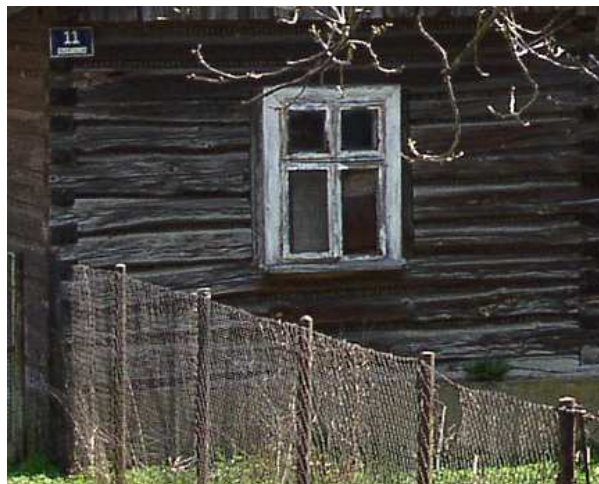
Fot. nr 109. Originalne detale: okno i poprzeczne belki drewniane.