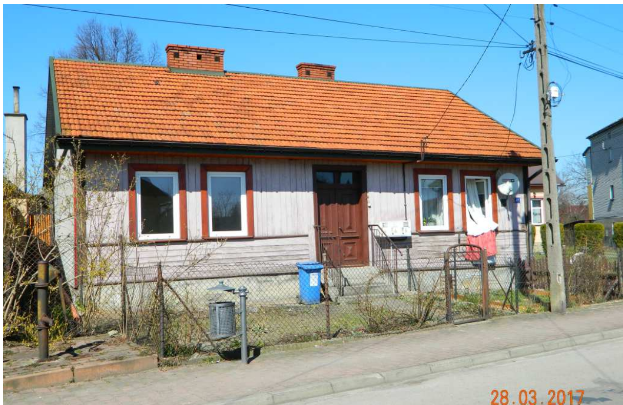
Fot. nr 91. Pozbawiony już oryginalnej stolarki okiennej stary dom z ulicy Piłsudskiego 18, który mógł powstać na początku XX wieku.