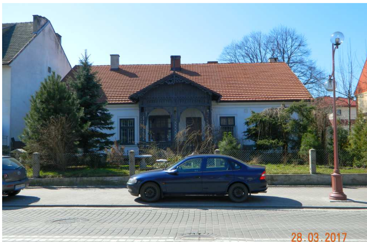
Fot. nr 87. Oryginalny, ażurowy ganek, który dodaje fasadzie wiele uroku.