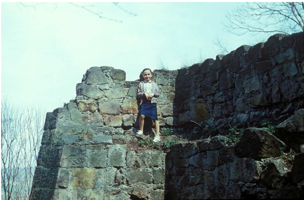
Fot. nr 70.