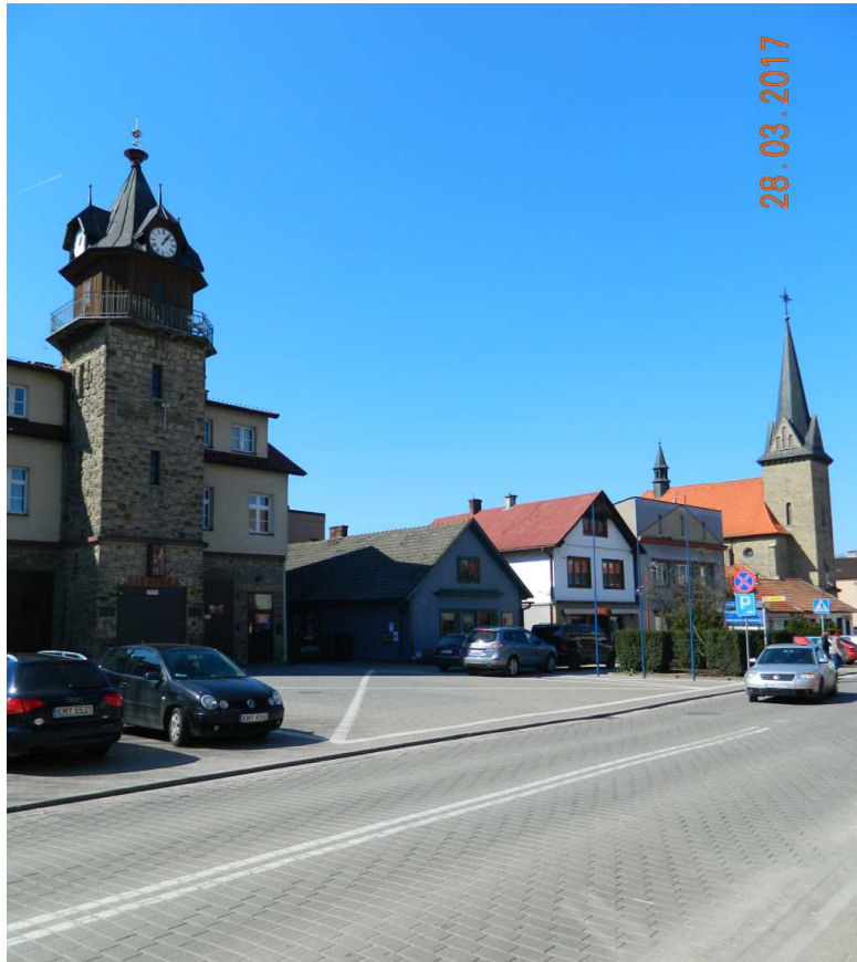
Fot. nr 82. Rynek ze strażnicą OSP i kościołem parafialnym p.w. Matki Bożej Wspomożenia Wiernych.