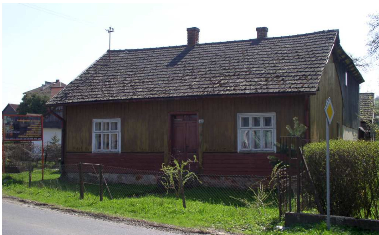
Fot. nr 45. Domek (nr 59) typowy dla II ćwierci XX wieku.