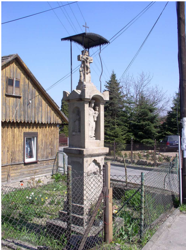
Fot. nr 51 (51-53). Zabytkowa figura z 1863 roku z naroża ulic: Kilińskiego i św. Anny.