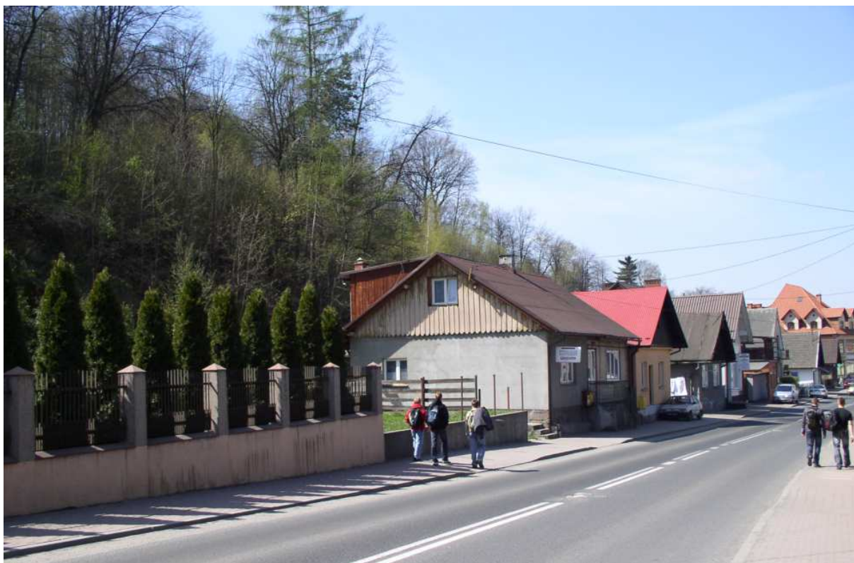
Fot. nr 32. Zachodnia pierzeja ulicy u stop wzgórza zamkowego (nr: 3-23).