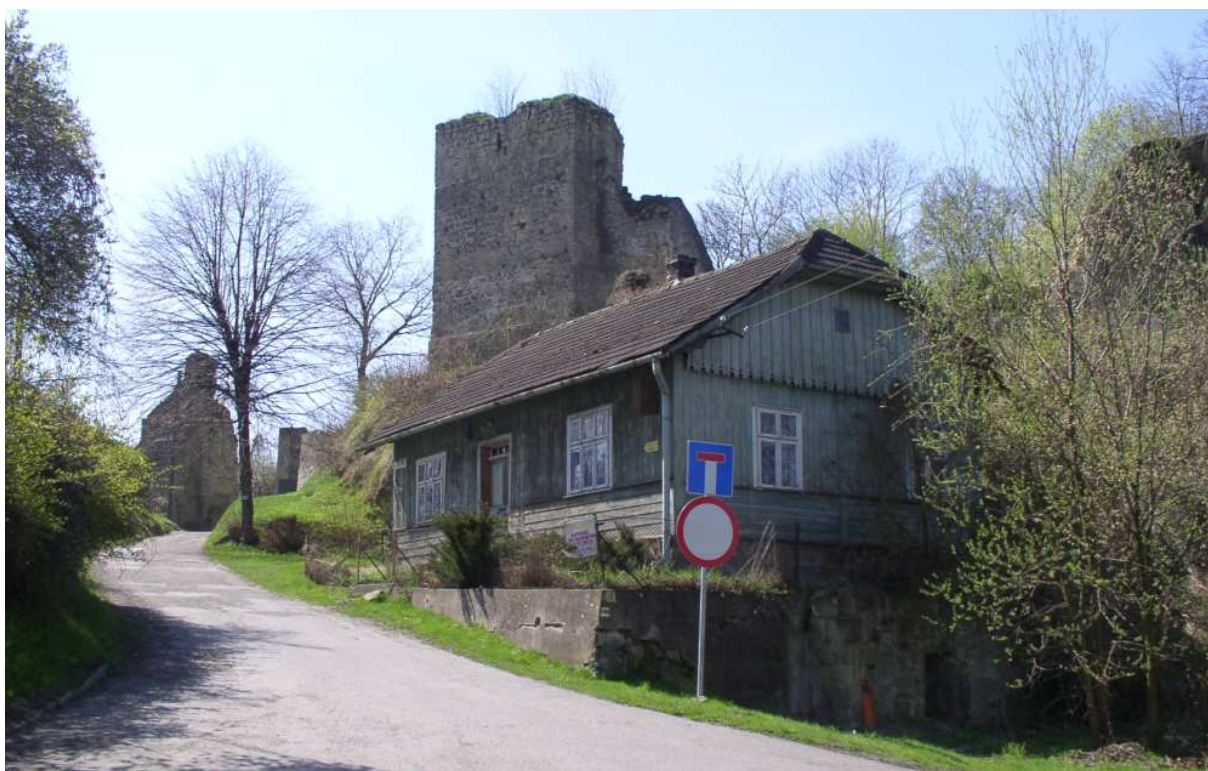
Fot. nr 23 (23-24). Drewniany dom z ulicy Kasztelana Dobka (nr 9?), zapewne pochodzący z okresu międzywojennego początku, na tle baszty wchodzącej w obręb dawnych murów obronnych starych Dobczyc.