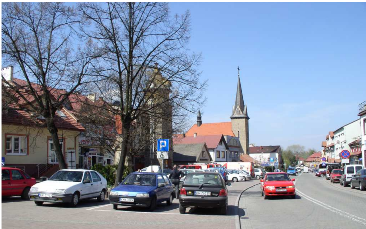
Fot. nr 14. Widok na zachodnią pierzeję Rynku, z kościołem w tle.