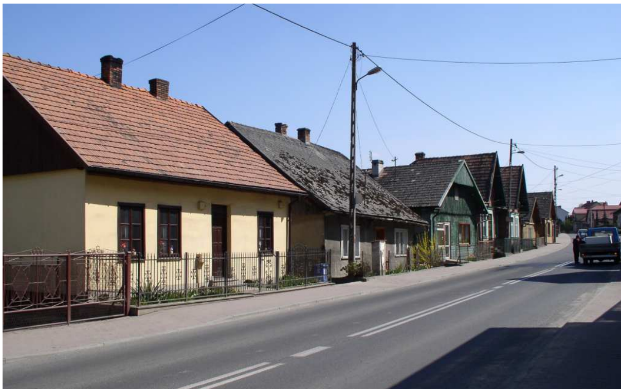
Fot. nr 26. Zabudowa wschodniej strony ulicy o numerach parzystych (nr: 14-28).