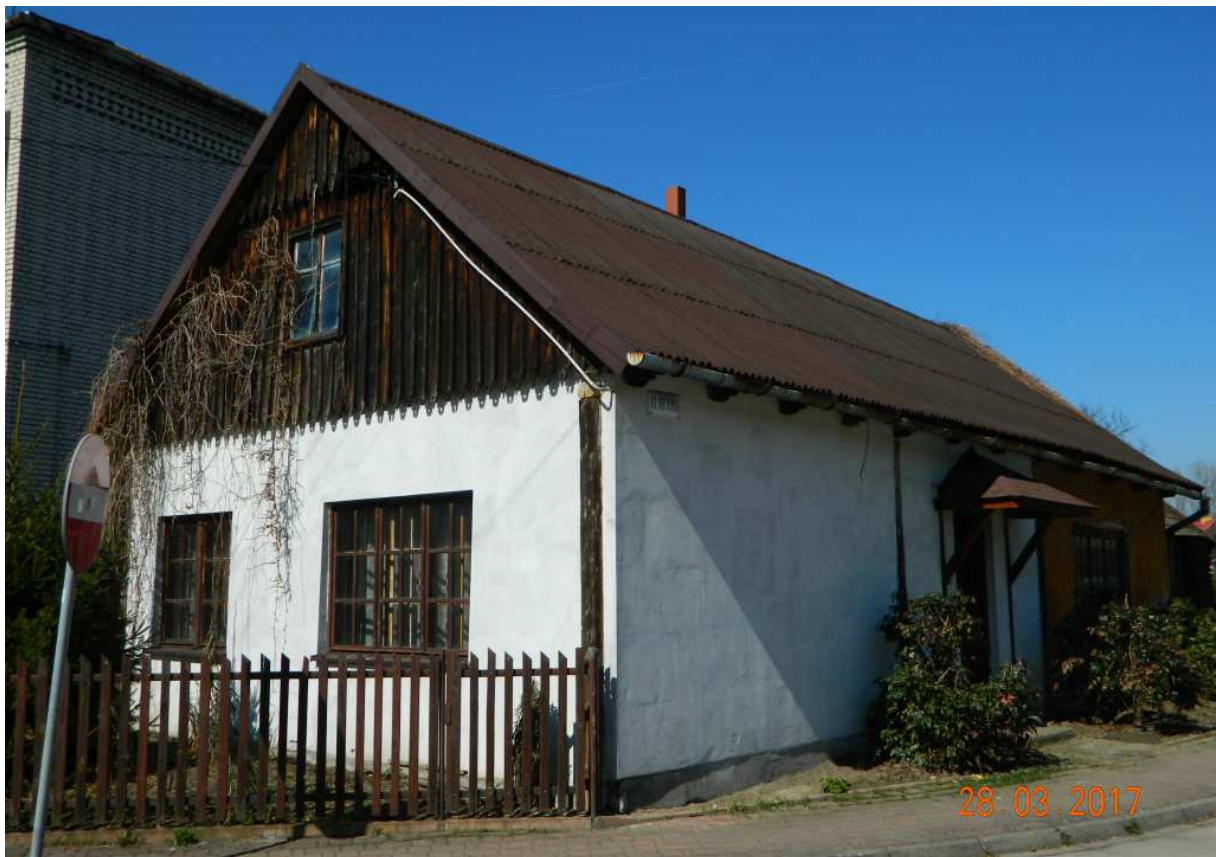
Fot. nr 93.