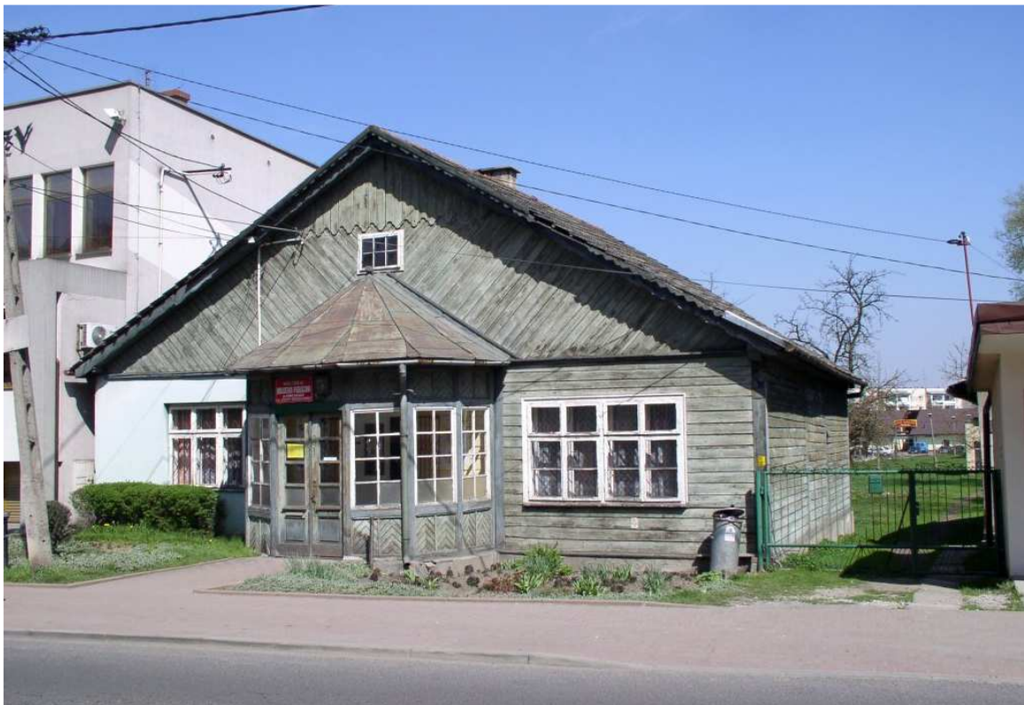
Fot. nr 25. Oryginalny stary dom spod nr 4, zapewne pochodzący z I ćwierci XX wieku, gdzie mieści się Miejska Biblioteka Publiczna.

Galeria chałup i domków od końca XIX wieku, po pierwszą połowę XX wieku.