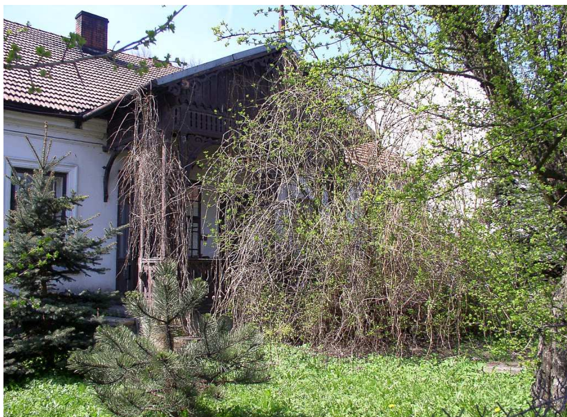
Fot. nr 11. Weranda dworku ukryta pośród winorośli.