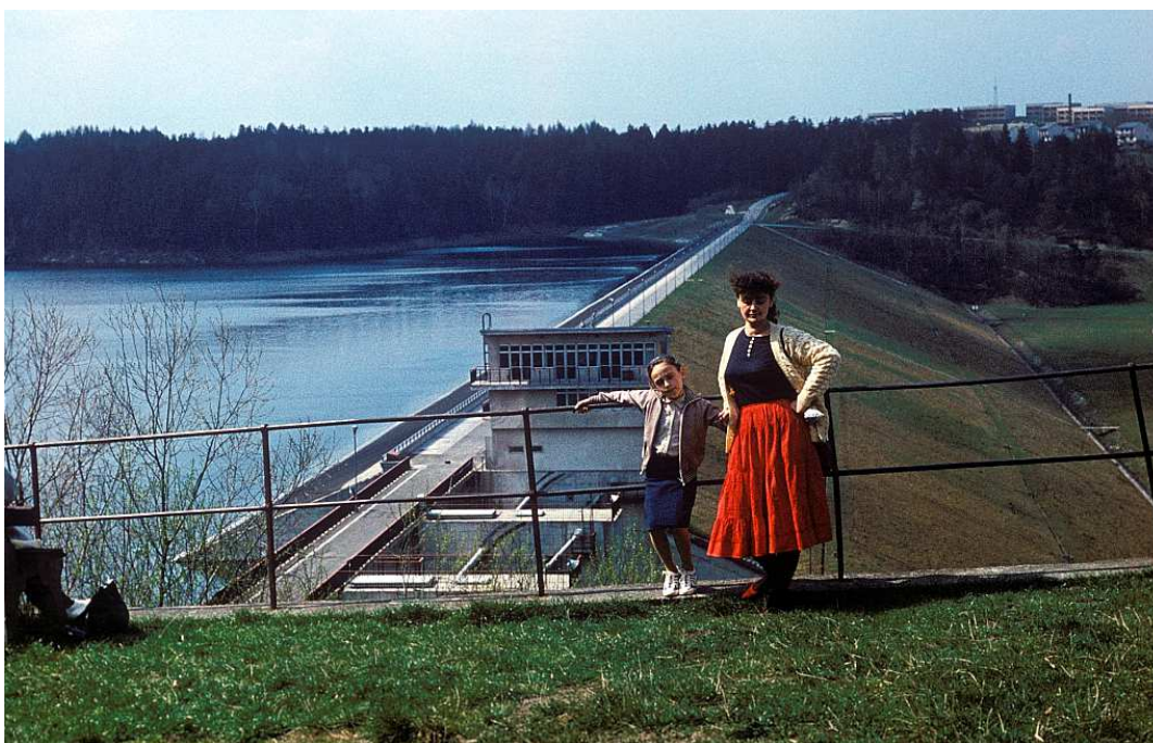
Fot. nr 71. Widok na zaporę w Dobczycach (Wiosna 1989).