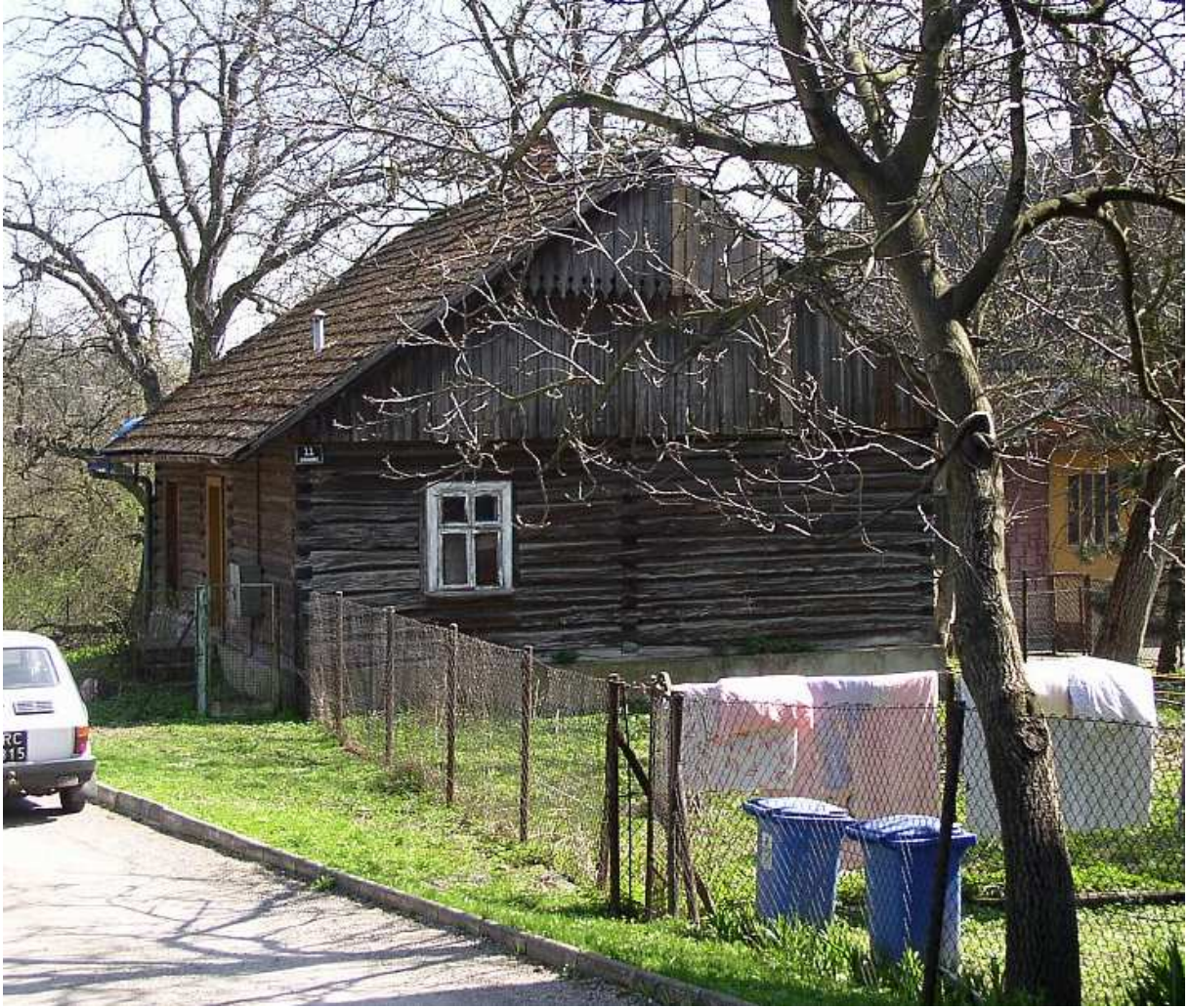
Fot. 108. Widok od strony ulicy.