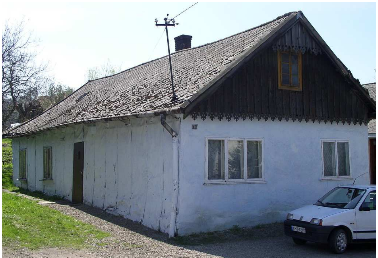
Fot. nr 43. Stara chałupa z nową stolarką okienną.