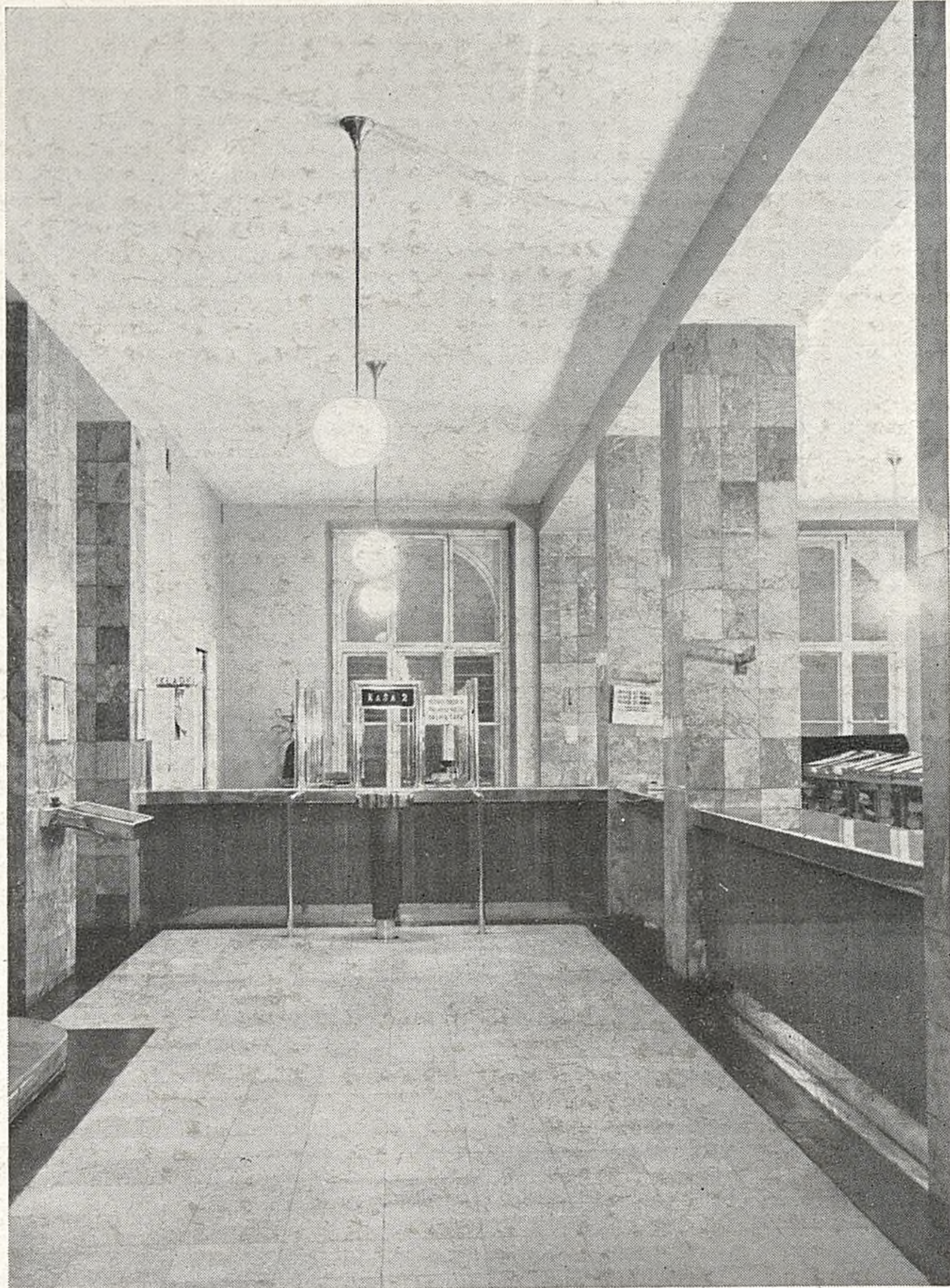
Fragment biur Kasy : Wydział Operacji Biernych