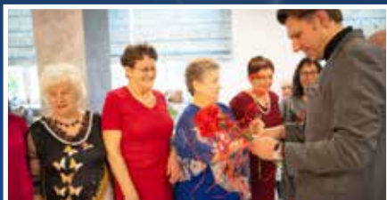
Dzień Kobiet w Gorlicach – s.2