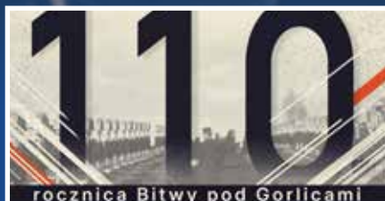
110. rocznica bitwy pod Gorlicami - s.10