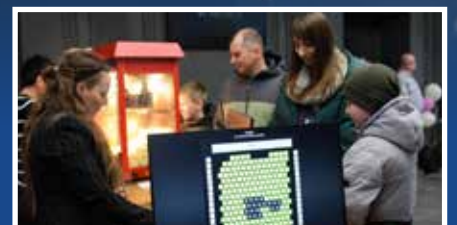
Rusza Kino Legenda - s.15