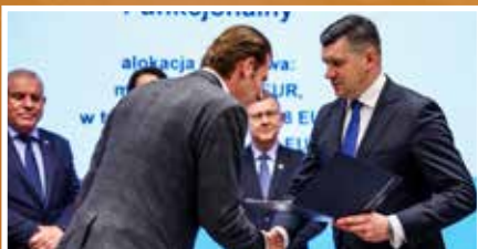
17 mln euro dla Gorlickiego Obszaru ZIT – s.4

Trwają przygotowania do obchodów 110. rocznicy Bitwy pod Gorlicami