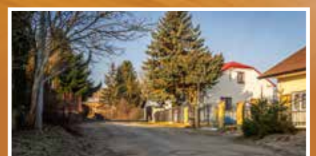
Ponad 600 tys. zł. na remont ul. Gajowej! – s.6