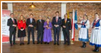
Małżeństwa na medal – s.8