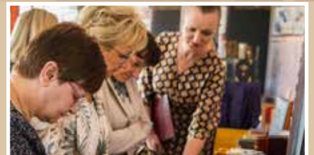
Tydzień bibliotek - s.13