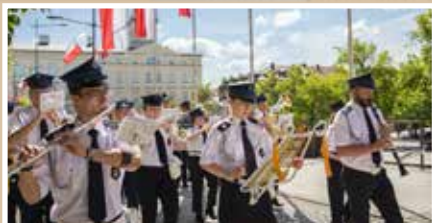
Święto 3 maja - s.2