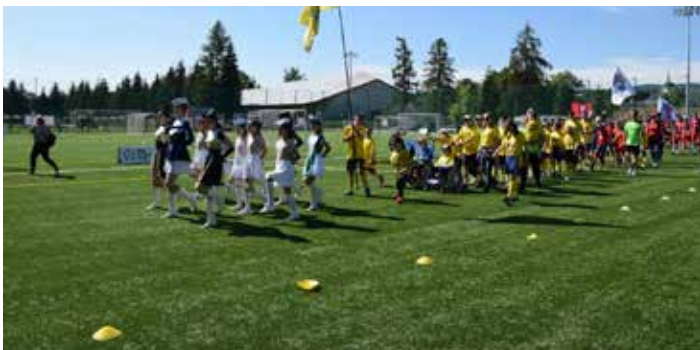
Akademia sportowa futbol+ przy Stowarzyszeniu Sprawne Smoki