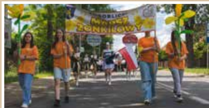
Dzień Dziecka w parku - s.8-9