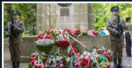
Rocznica wielkiej bitwy - s.3