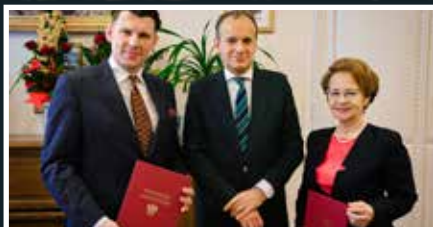
Nowy SAG coraz bliżej - s.12