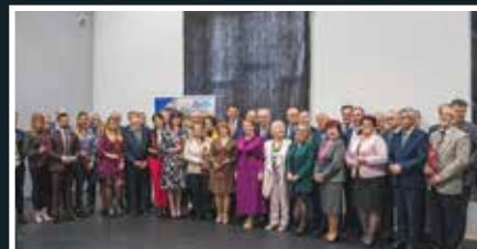
30 lat ZGZG - s.15