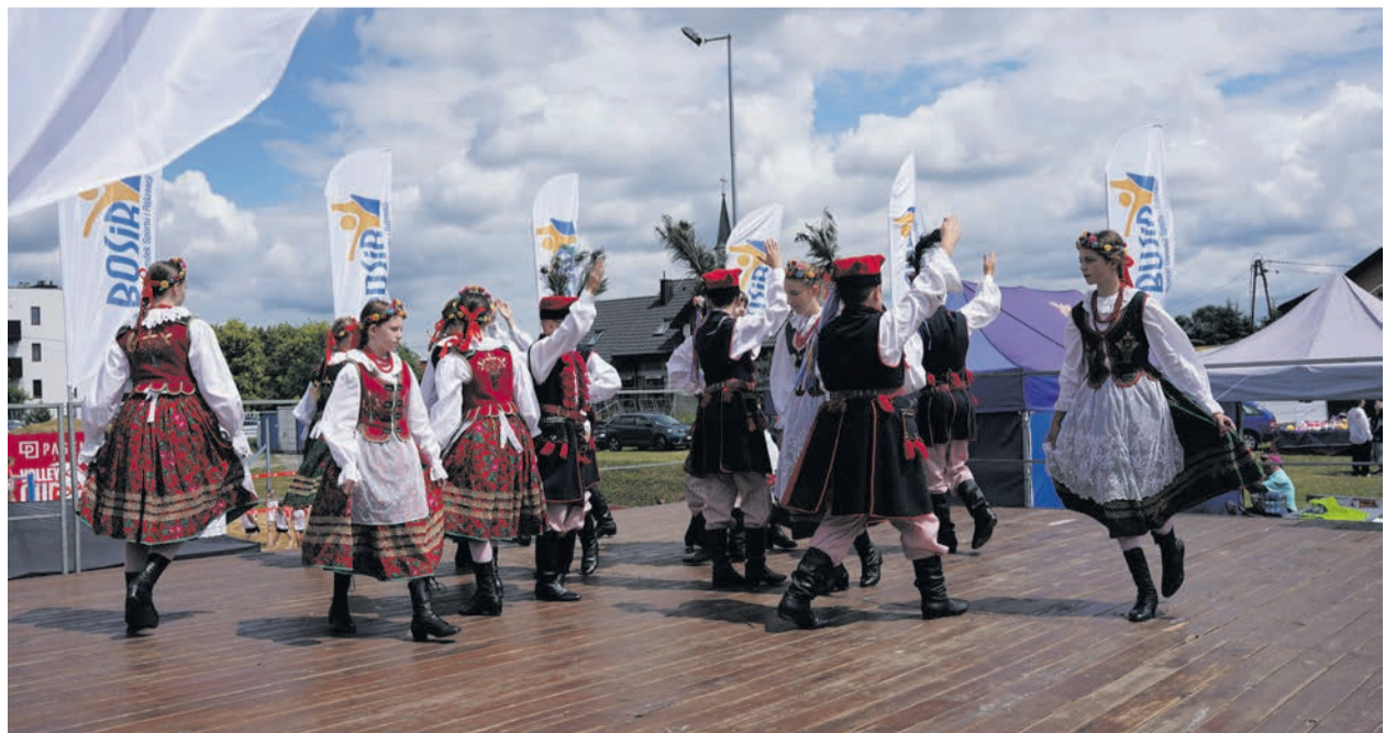
Uczniowie ze Szkoły Podstawowej w Porębie Spytkowskiej prosto z warszawskich wojaży.

Nie zabrakło akcentów edukacyjnych. Organizatorzy przygotowali bogaty wachlarz warsztatów, których nauka i dobra zabawa stanowiły wspólny