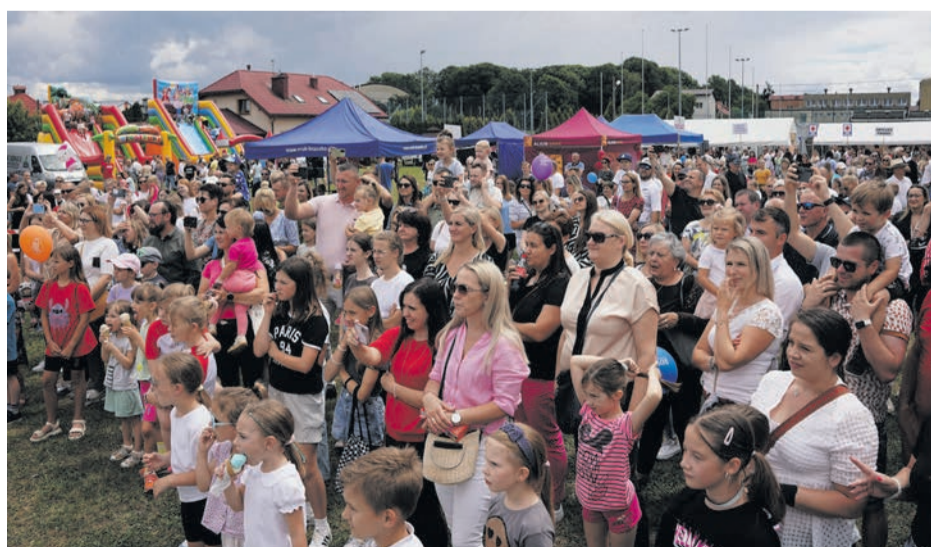
Występ przed tak liczną publicznością to chwila, którą każde dziecko zapamięta na zawsze.