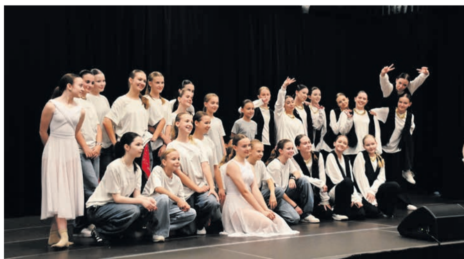
Na scenie Regionalnego Centrum Kulturalno-Bibliotecznego wystąpiły tancerki z Kremer Dance Studio.