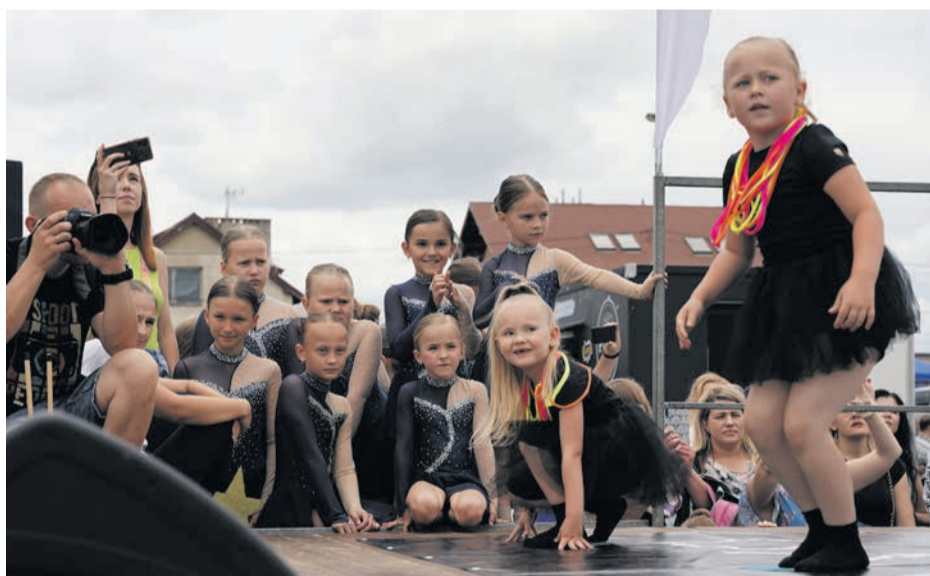
Jedni już występują, inni nie mogą się doczekać na swoją kolej.