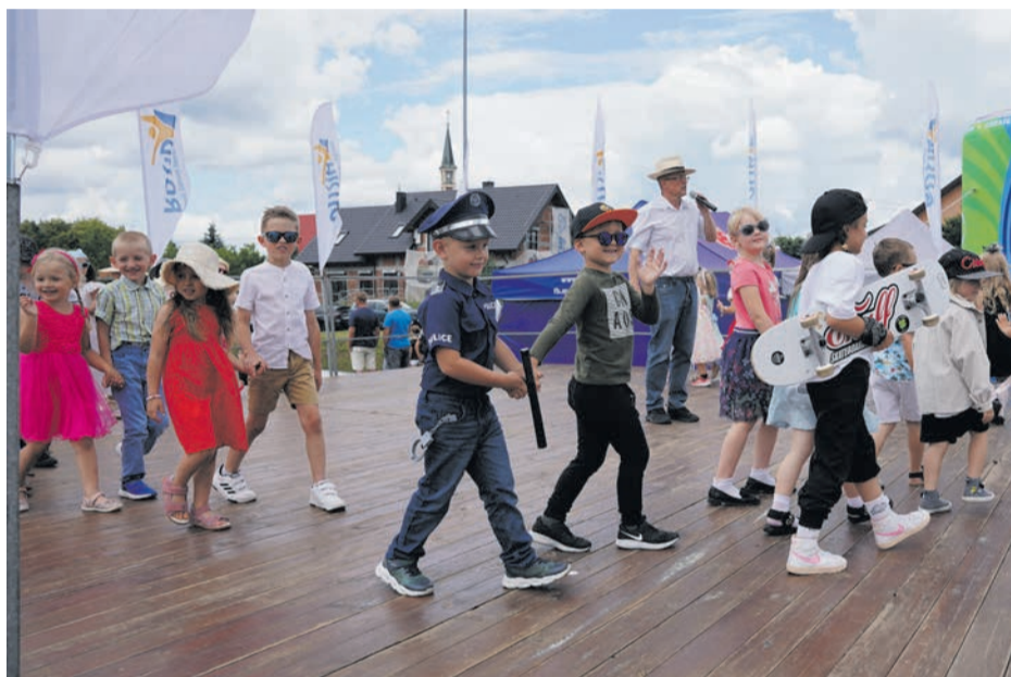
... i podczas pokazów mody.