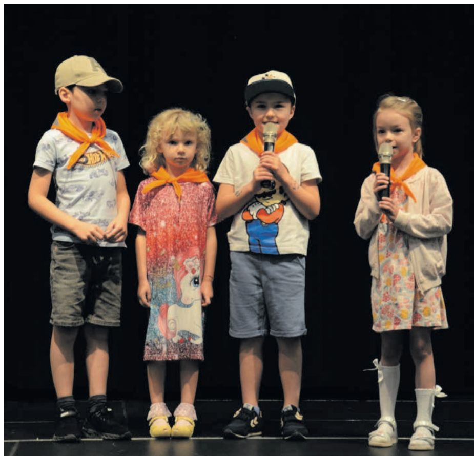
Dzieci z brzeskich przedszkoli nie tylko zasiadały na widowni. W wolnych chwilach same prezentowały swoje umiejętności.

co się świeci. Jacka i Placka zastąpiły Tola i Ola, które razem z całym zespołem urzekły publiczność i jurorów, którzy w uzasadnieniu do wyróżnienia napisali: „za różnorodność środków scenicznych, zaangażowanie zespołu i siłę głosu”. GRUPA STARSZA przyzwyczała stałych bywalców TEATRALNYCH LUSTER, że wraz ze