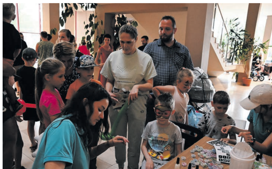
Tatuże, makijaże, wizaże – w tym salonie ruch panował przez cały dzień.