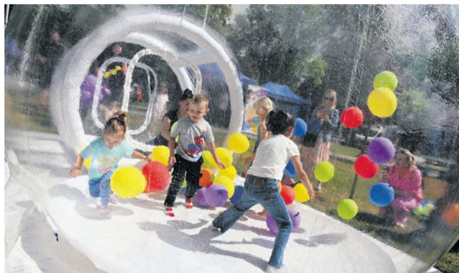
Bubble House to nowa propozycja, która natychmiast przypadła wszystkim dzieciom do gustu.