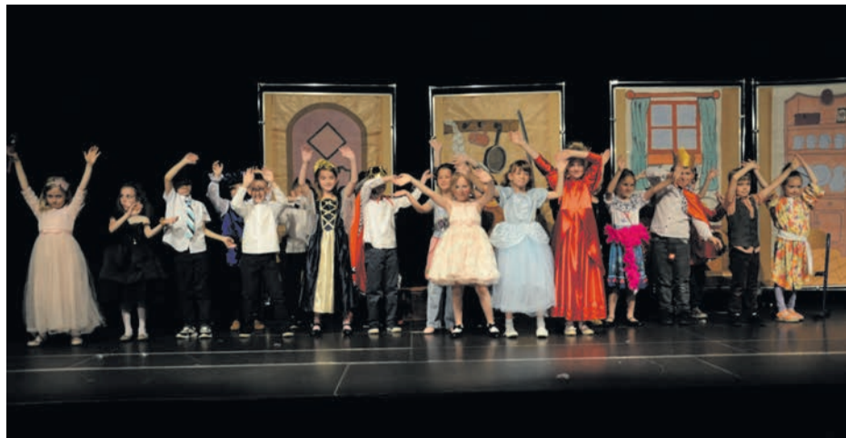
Mali aktorzy ze Szkoły Podstawowej nr 1, tworzący grupę o wdzięcznej nazwie KUFEREK, w Teatralnych Lustrach debiutowali i byli z tego debiutu – jak widać na zdjęciu – bardzo zadowoleni. Ich wersja „Kopciuszka” przypadła do gustu dziecięcej publiczności.