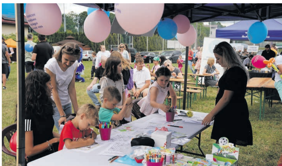
Takich stoisk jak to ustawiono na pikniku kilkanaście i każde cieszyło się olbrzymim zainteresowaniem.