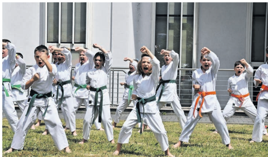
Młodzi członkowie Qi Karate Klubu po raz kolejny przygotowali pokaz zapierający dech w piersiach.