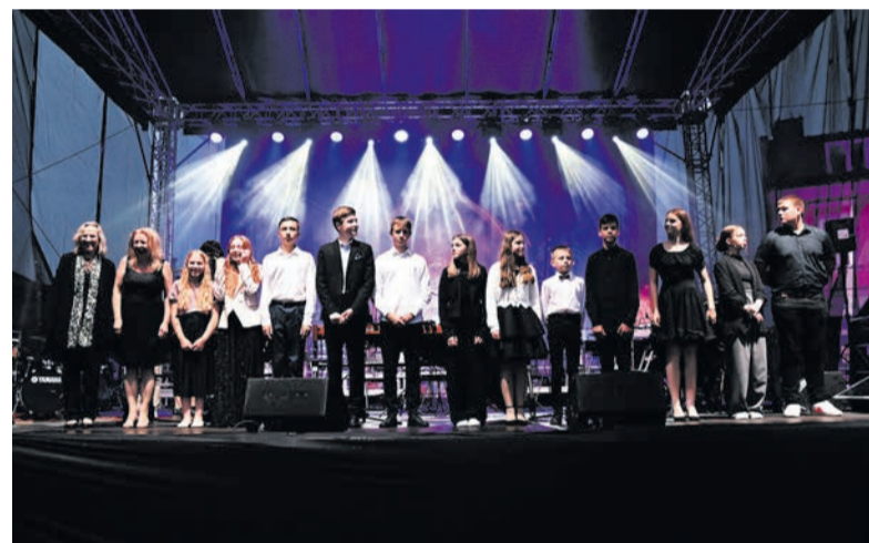
Uczniowie Szkoły Muzycznej I stopnia na scenie Brzesko Okocim Festiwalu – czerwiec 2023