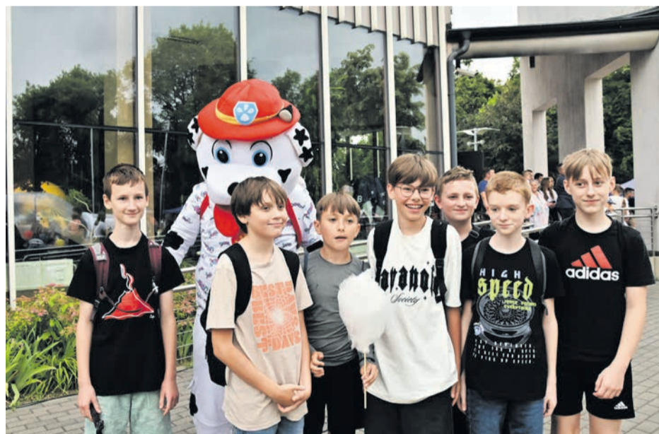
Takie zdjęcie to pamiątka na całe życie.