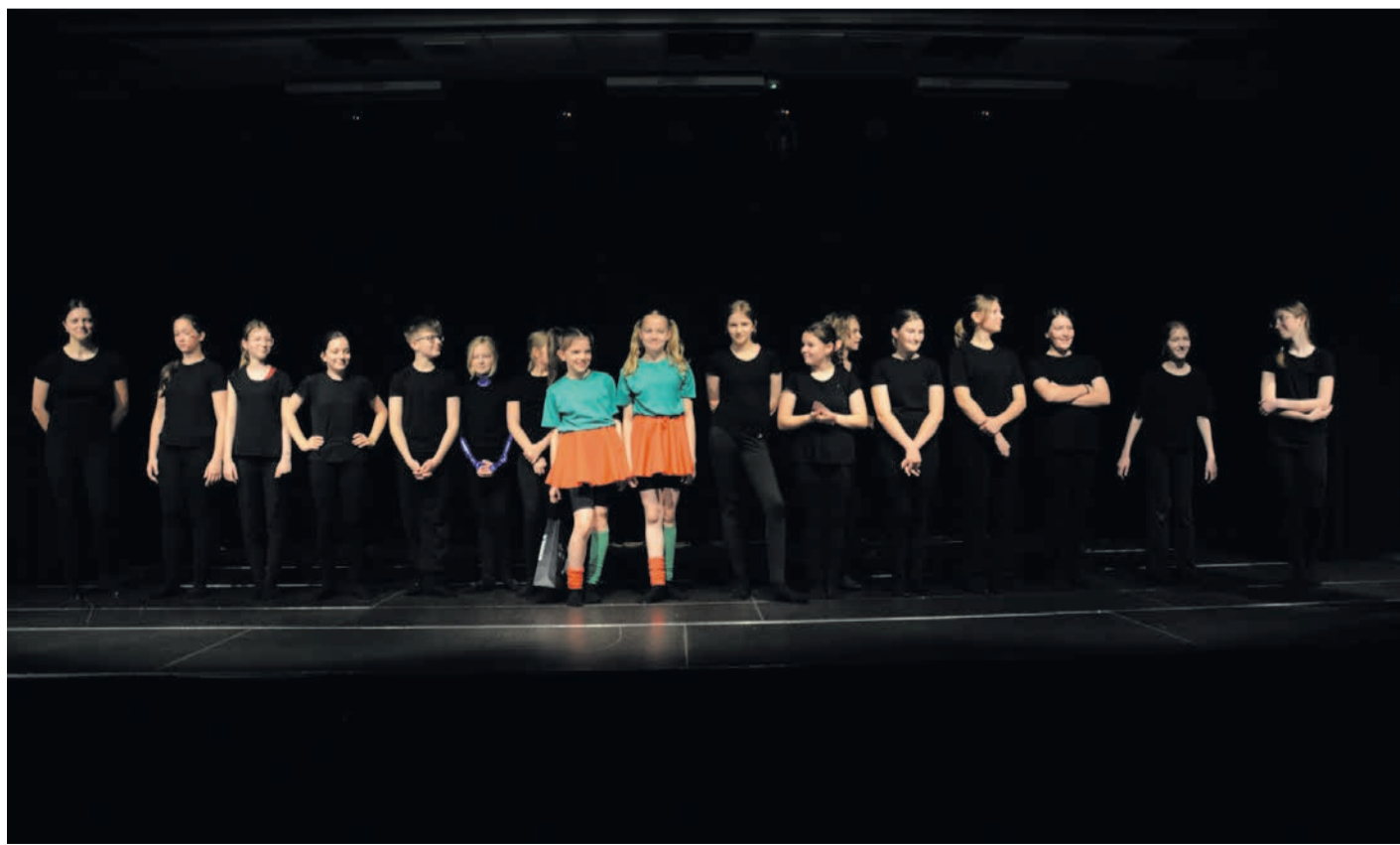
Grupa Młodsza kółka teatralnego MISZMASZ ze Szkoły Podstawowej nr 3 przedstawiła swoją wersję popularnej książki „O dwóch takich, co ukradli księżyc”