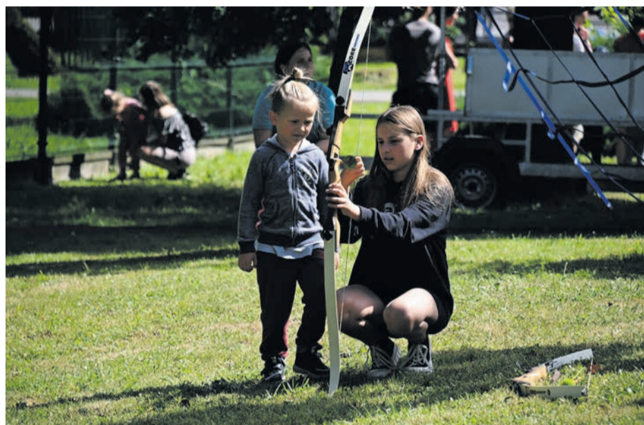
Być może w Brzesku na nowo powstanie sekcja łucznicza?