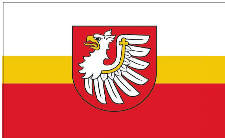
Flaga Powiatu Brzeskiego