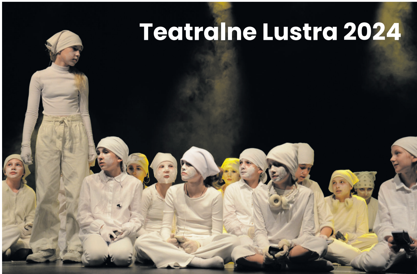
Aktorzy teatru STONOGA z Zespołu Szkolno-Przedszkolnego przestrzegali przed zgubnym skutkiem nadużywania telefonów komórkowych.

W Regionalnym Centrum Kulturalno-Bibliotecznym miały miejsce XII Konfrontacje Teatrów Dzieci i Młodzieży TEATRALNE LUSTRA organizowane przez Małopolskie Centrum Kultury SOKÓŁ (Biuro Organizacyjne w Tarnowie) i Miejski Ośrodek Kultury w Brzesku. Nagrodę główną, DIAMENTOWE LUSTRO, otrzymał zespół Bajdoludki ze Szkoły Podstawowej im. Elizy Orzeszkowej w Radgoszczy.