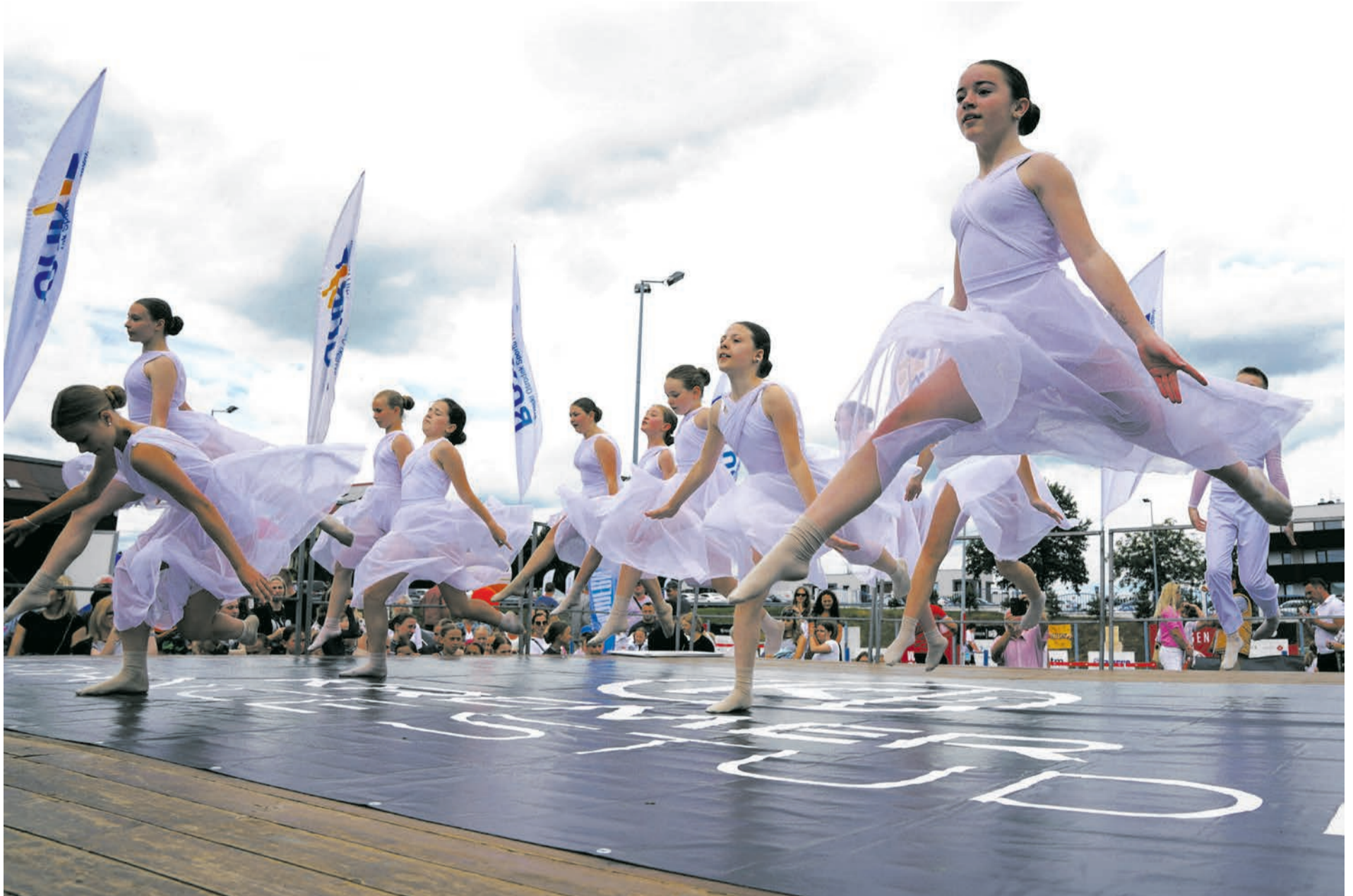
Pokazy tancerek z Kremer Dance Studio to stały punkt wielu wydarzeń organizowanych w gminie Brzesko.

Zgodnie z zapoczątkowaną kilka lat temu tradycją, także tegoroczny Dzień Dziecka świętowany był na obiektach przylegających do brzeskiej pływalni. Całodzienny piknik zorganizowały Brzeski Ośrodek Sportu i Rekreacji, Urząd Miejski w Brzesku, Komendę Powiatową Policji w Brzesku, Komendę Powiatową Państwowej Straży Pożarnej w Brzesku, Miejski Ośrodek Kultury w Brzesku, Okocimski Klub Sportowy, UKS Feniks Jasień, UKS Dragon Mokrzycka, UKS Volley Brzesko, wsparte przez wiele firm, instytucji i osób prywatnych.