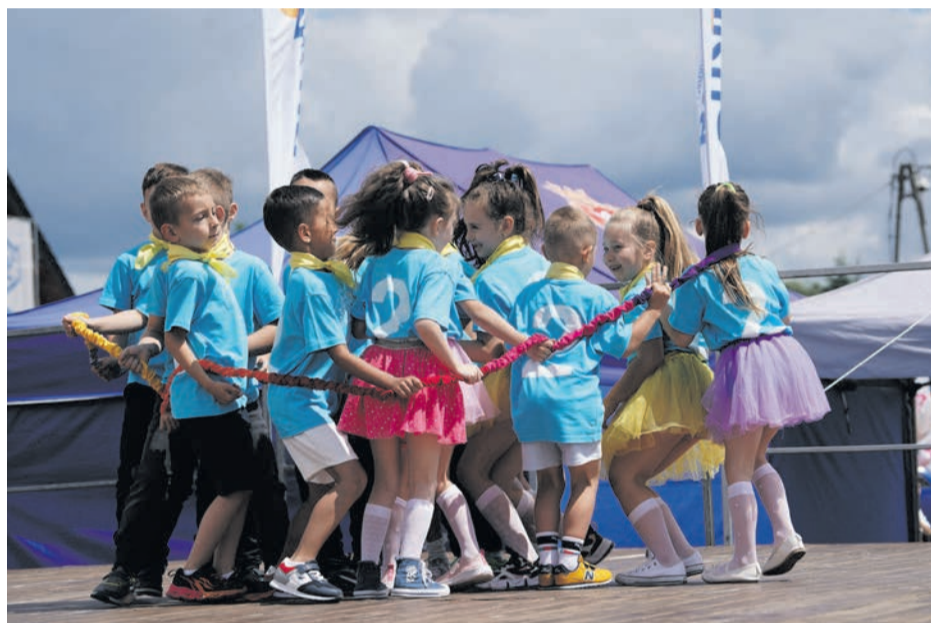
Brzeskie przedszkolaki znakomicie prezentują się w układach tanecznych ...

Mimo kapryśnej pogody frekwencja podczas całego pikniku była imponująca. Tylko przez scenę przewinęło się kilkaset dzieci ze swoimi opiekunami i instruktorami. Na placu było ich kilkakrotnie więcej. Program był tak zróżnicowany, że wszyscy wracali do domów w pełni usatysfakcjonowani. KB