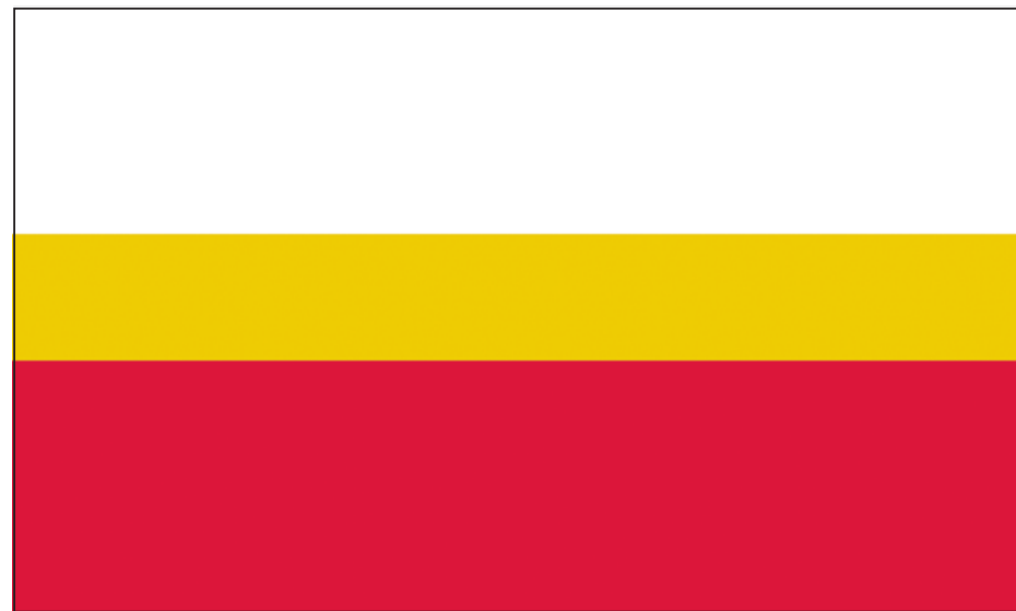
Flaga Województwa Małopolskiego