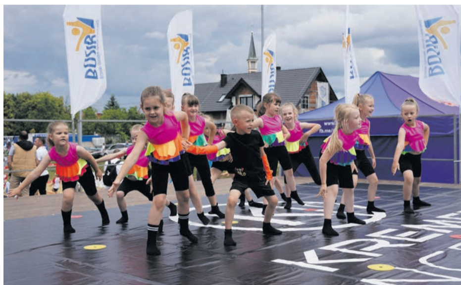
W akcji najmłodsze pokolenie Kremer Dance Studio.