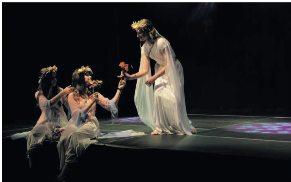
Grupa Starsza teatru MISZMASZ przyzwyczała swoich widzów do tematów klasycznych. Tym razem sięgnęła po mitologię grecką.