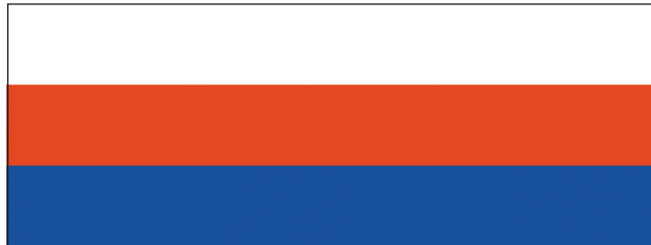
Flaga Gminy Brzesko

Od dwudziestu lat każdego roku 2 maja obchodzimy w naszym kraju Dzień Flagi Rzeczypospolitej – jednego z najważniejszych symboli narodowych. Od tego wydarzenia minęło już półtora miesiąca. Warto przypomnieć, że swoje flagi ma większość tzw. Małych Ojczyzn, czyli polskich gmin. W tym gronie znajduje się Brzesko, które takim symbolem szczyli się już od 28 lat.