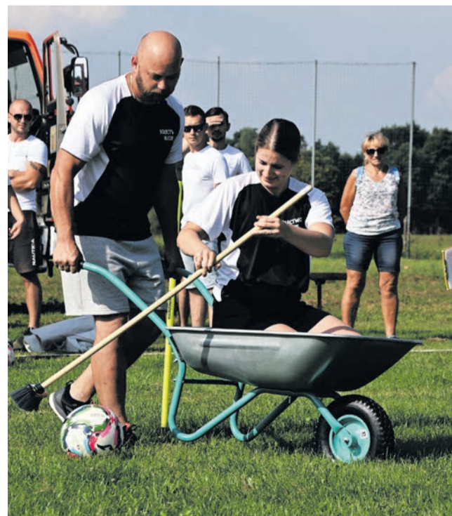
Wbrew pozorom nie są to wyścigi kanadyjek.