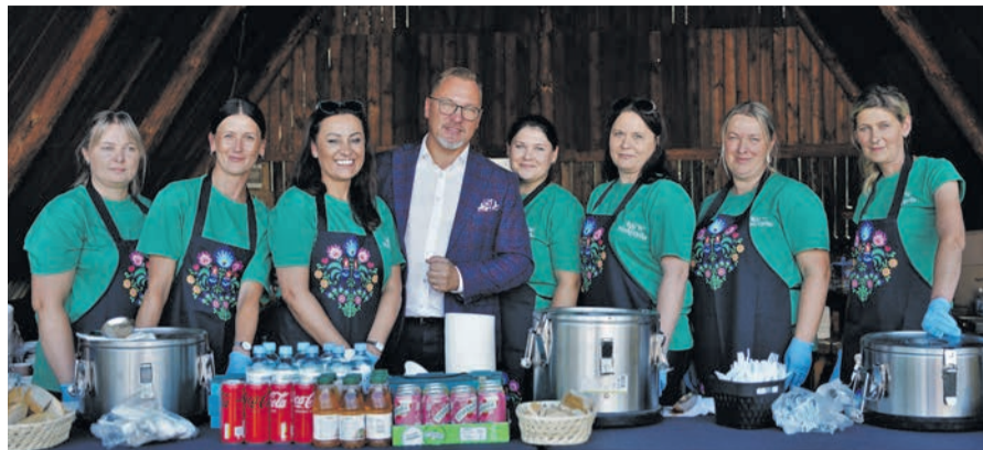
Panie z KGW Mokrzyńska zadbały o podniebienia uczestników pikniku.