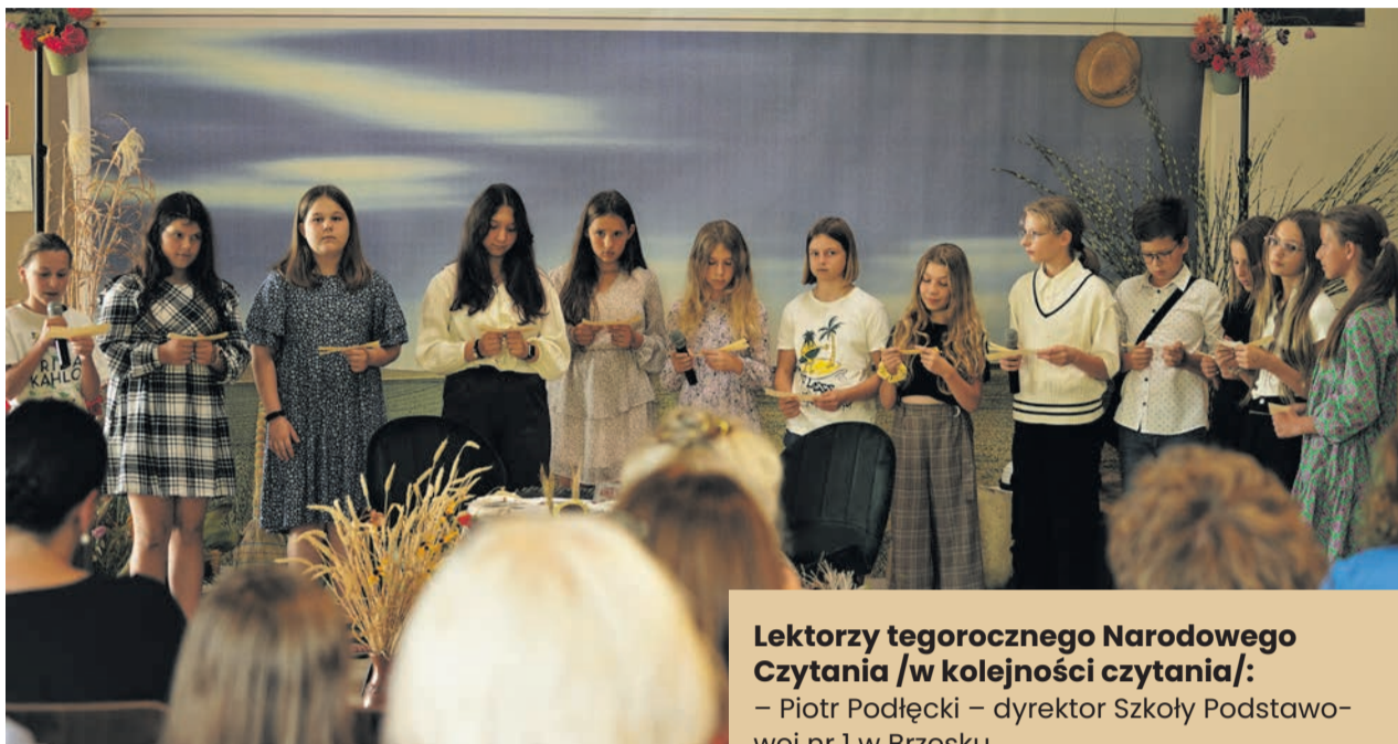
Najpiękniejsze cytaty z „Nad Niemnem” odczytała młodzież z Grupy Teatralnej GT