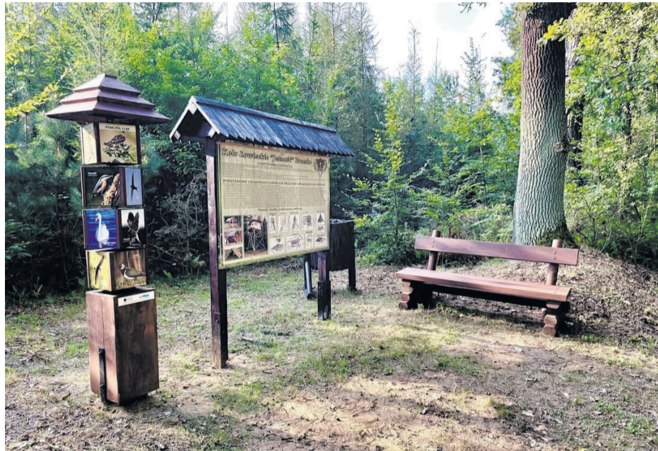
Ścieżka turystyczna w lesie szczepanowskim niedawno została wzbogacona o nowe elementy.

22 września każdy pasażer, który zechce skorzystać z transportu autobusami Miejskiego Przedsiębiorstwa Komunikacyjnego w Brzesku, będzie mógł to uczynić nie ponosząc żadnych opłat. Zachęcamy każdego zmotoryzowanego, aby w tym szczególnym dniu, jeśli zamierza poruszać się na niewielkim obszarze, pozostawił swój pojazd w garażu i skorzystał z tej atrakcyjnej oferty MPK.