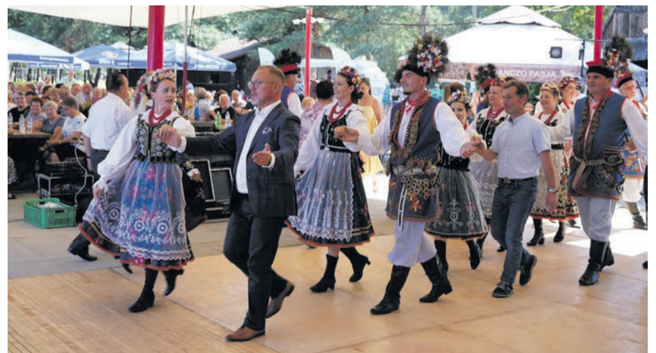
Krakowiaczy w finałowej sekwencji swojego koncertu porwali wszystkich do poloneza.