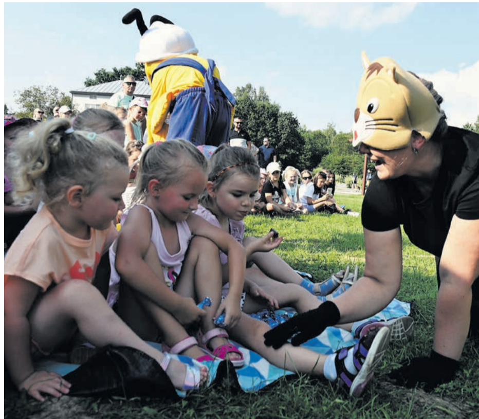
Takich bajkowych postaci było w Mokrzykach znacznie więcej.