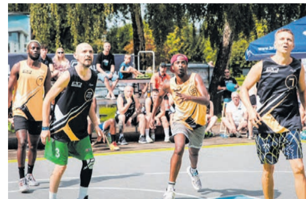
Na boisku koszykarze Street Sharks i Ekipy Remontowej Brzesko