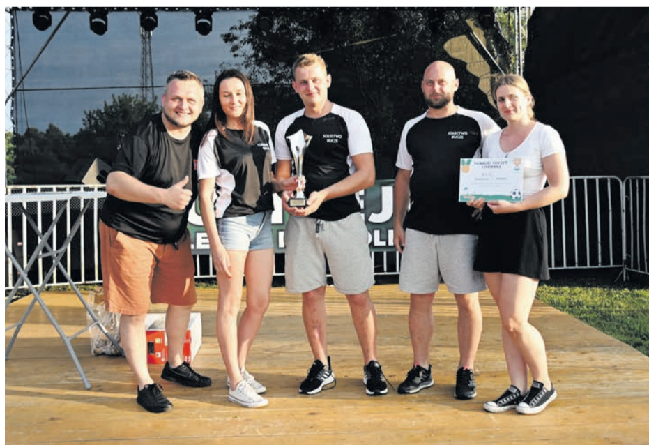
Reprezentacja Bucza ukończyła zmagania na drugim miejscu.