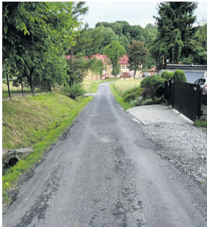
Ulica Cmentarna potrzebuje pilnie remontu ...