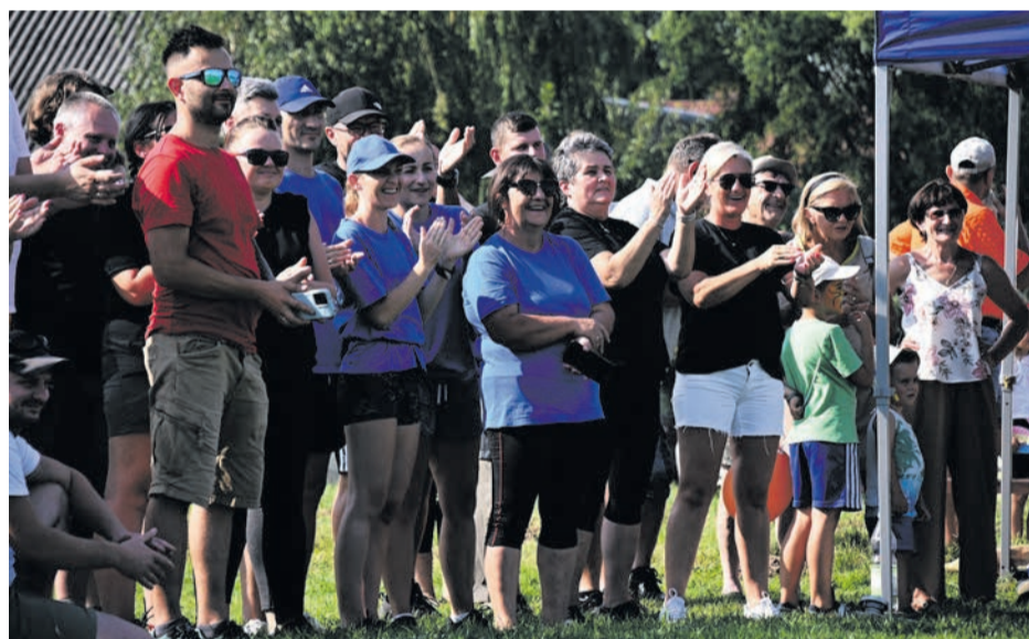
Licznie zgromadzeni widzowie na brak emocji narzekać nie mogli.