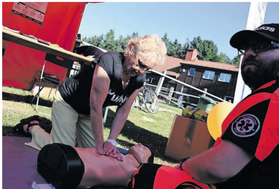
Senior Party to również inicjatywy związane z profilaktyką.