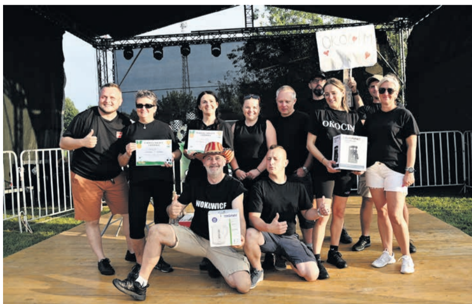
Czarne koszule czyli Okocim i Wokowice – drużyny, które zajęły równorzędne trzecie miejsca.