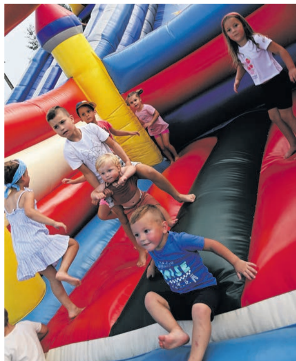
Swoje atrakcje mieli też najmłodsi uczestnicy pikniku.