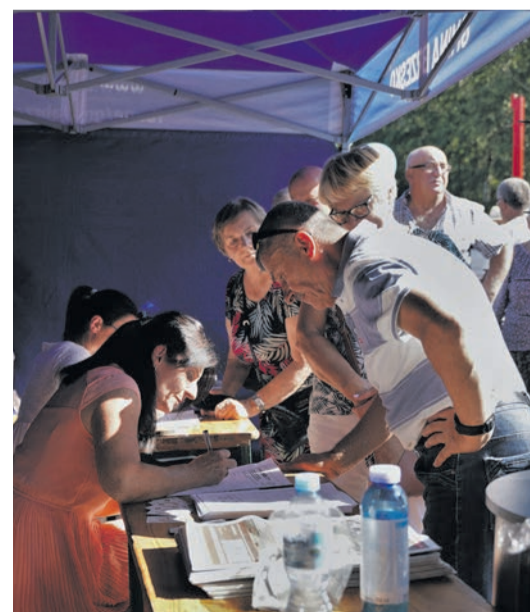
Dużym zainteresowaniem cieszyły się Ogólnopolskie Karty Seniora