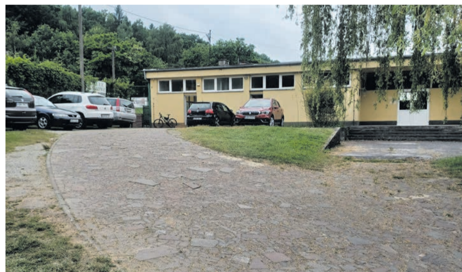
Burmistrz Brzeska planuje również remont parkingu przy kortach tenisowych.

Burmistrz Brzeska przygotowany jest na kilka wariantów. Dlatego zamierza zlecić wykonanie dokumentacji projektowej w taki sposób, aby planowana inwestycja mogła być realizowana etapami. Przy ewentualnym odrzuceniu wniosku o dofinansowanie, prace modernizacyjne będzie można wykonywać sukcesywnie, krok po kroku. – Trwałoby to dłużej, niż sobie życzymy, ale do tego remontu przystąpimy – zapewnia burmistrz. WP