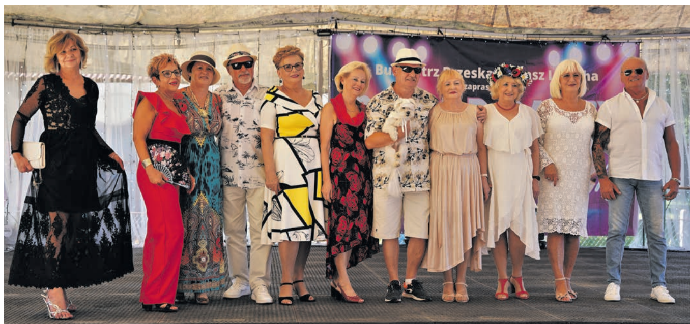
Imponujący był pokaz mody przygotowany przez Stowarzyszenie Aktywny Senior.