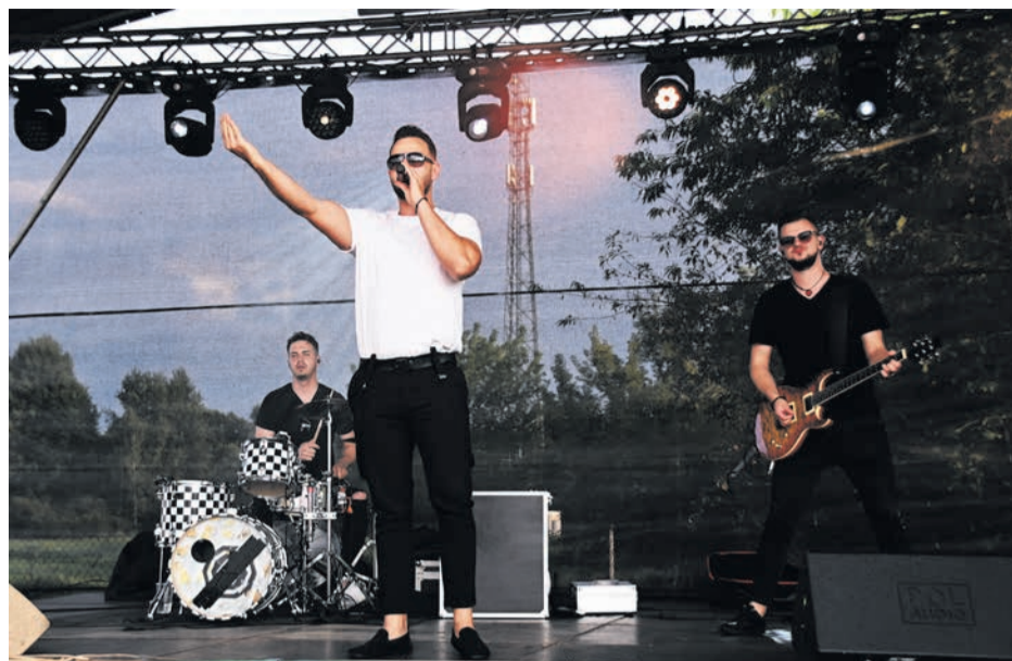
Zespół Shantel w Buczu świętował swoje 10. urodziny.