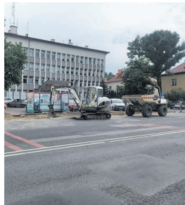
W wielu miejscach Brzeska spotkać można obecnie maszyny drogowe używane do remontów miejskich ulic

W Porębie Spytkowskiej na blisko 200-metrowym odcinku ulicy Granicznej położono nową nawierzchnię asfaltową. Koszt zadania wyniósł 122 828 zł przy dofinansowaniu w wysokości 22 444 złotych. Położenie nowego asfaltu na 100-metrowym odcinku ulicy Przyszkolnej kosztowało 91 130 zł przy dofinansowaniu w kwocie 12 tysięcy złotych. W Mokrzkach na ponad 300-metrowym odcinku ulicy Ludowej zastosowano kruszywo frezowane. Koszt tego zadania to 47 539 zł, a wysokość dotacji – 17 tysięcy