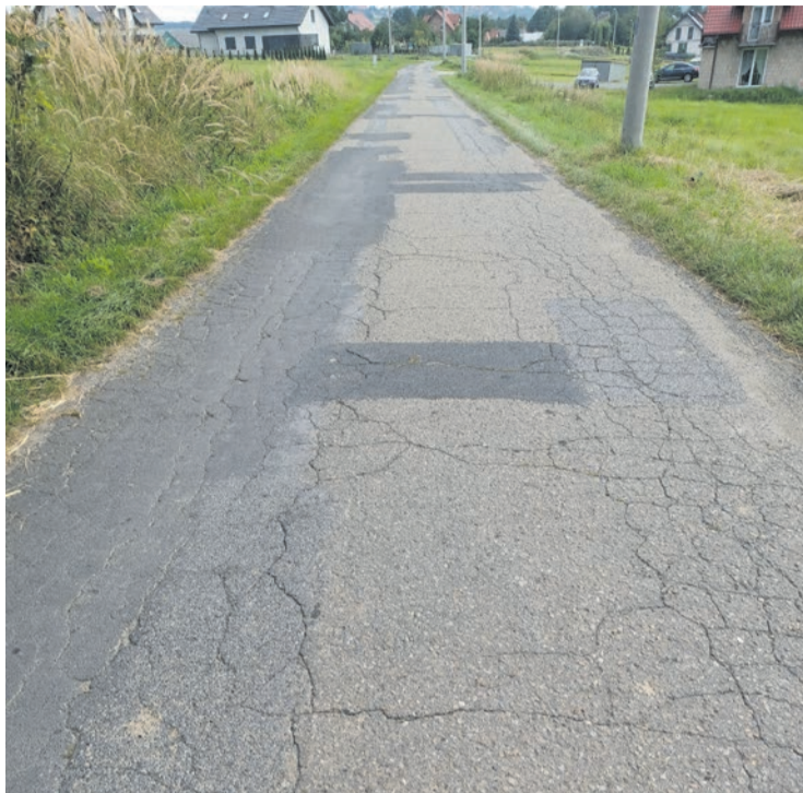
podobnie jak ulica Świętego Bartłomieja

Jeszcze w tym miesiącu rozpocznie się remont półkilometrowego odcinka ulicy Cmentarnej w Porębie Spytkowskiej. 8 września br. w siedzibie Urzędu Miejskiego została podpisana umowa dotycząca realizacji tego zadania, którego wykonawcą jest Konsorcjum złożone z dwóch bocheńskich firm – Largo Frez-Bud (lider) oraz Enigma Group Sp. z o.o. (partner).