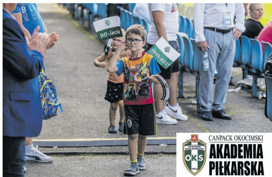
Mocną stroną Okocimskiego jest praca z dziećmi i młodzieżą