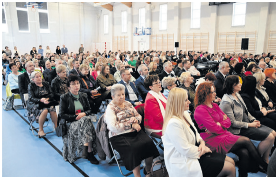
W uroczystym otwarciu hali uczestniczyły tłumy mieszkańców Mokrzk.