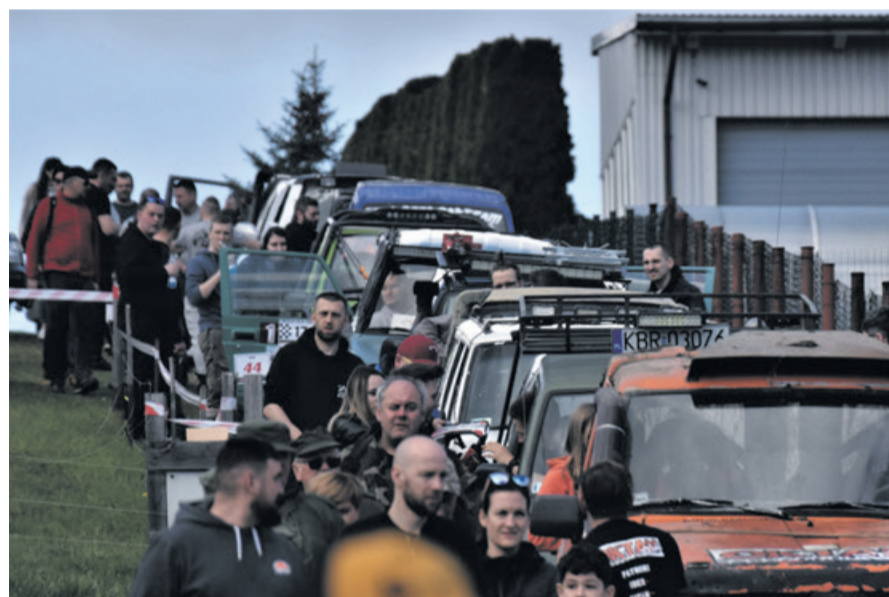
W okolicach Bocheńca jednego dnia pojawiło się ponad 300 pojazdów