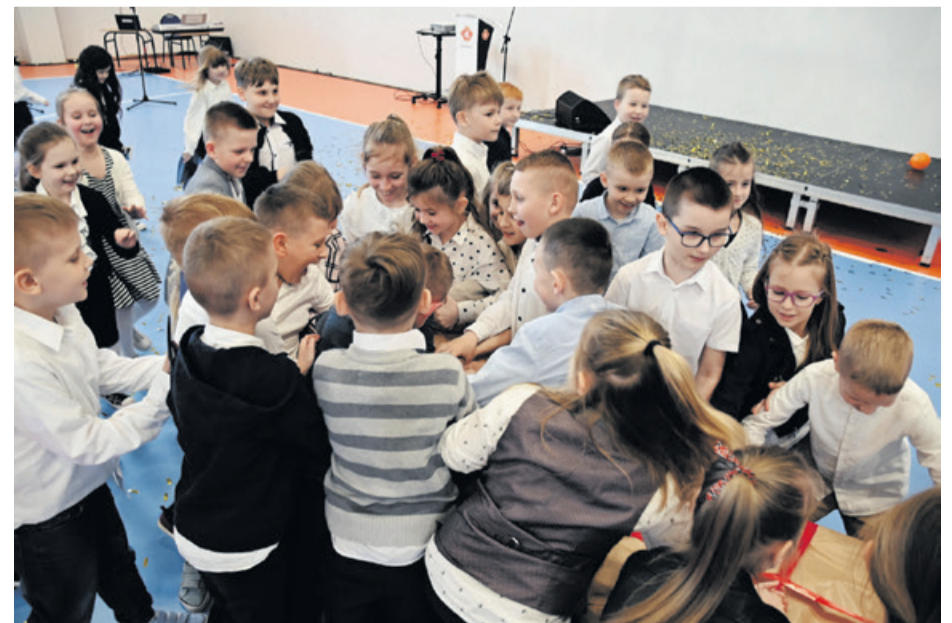
Dzieci same przystąpiły do rozpakowywania prezentu ufundowanego przez burmistrza Brzeska.

Budowa hali sportowej rozpoczęła się w sierpniu 2020 roku i podzielona została na trzy etapy. Pierwszy z nich