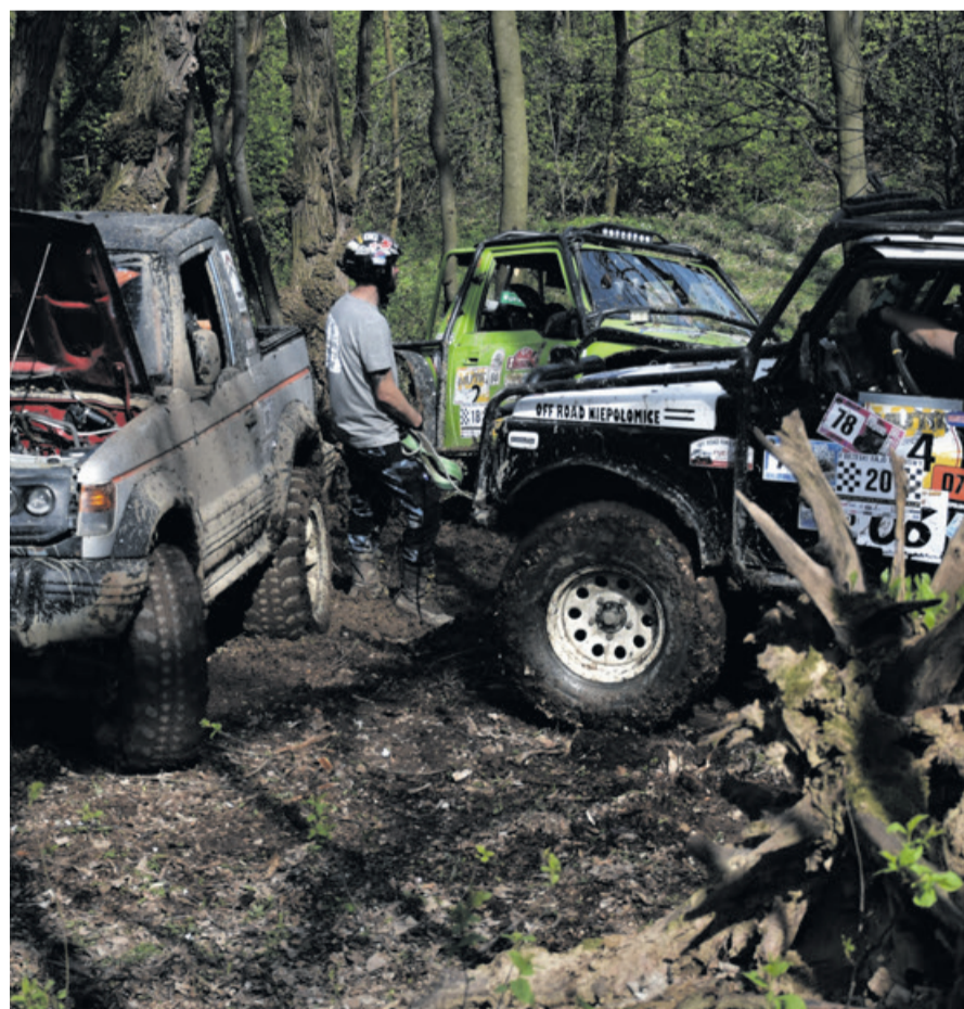
Organizatorzy przygotowali tym razem najeżoną pułapkami terenową jazdę na orientację