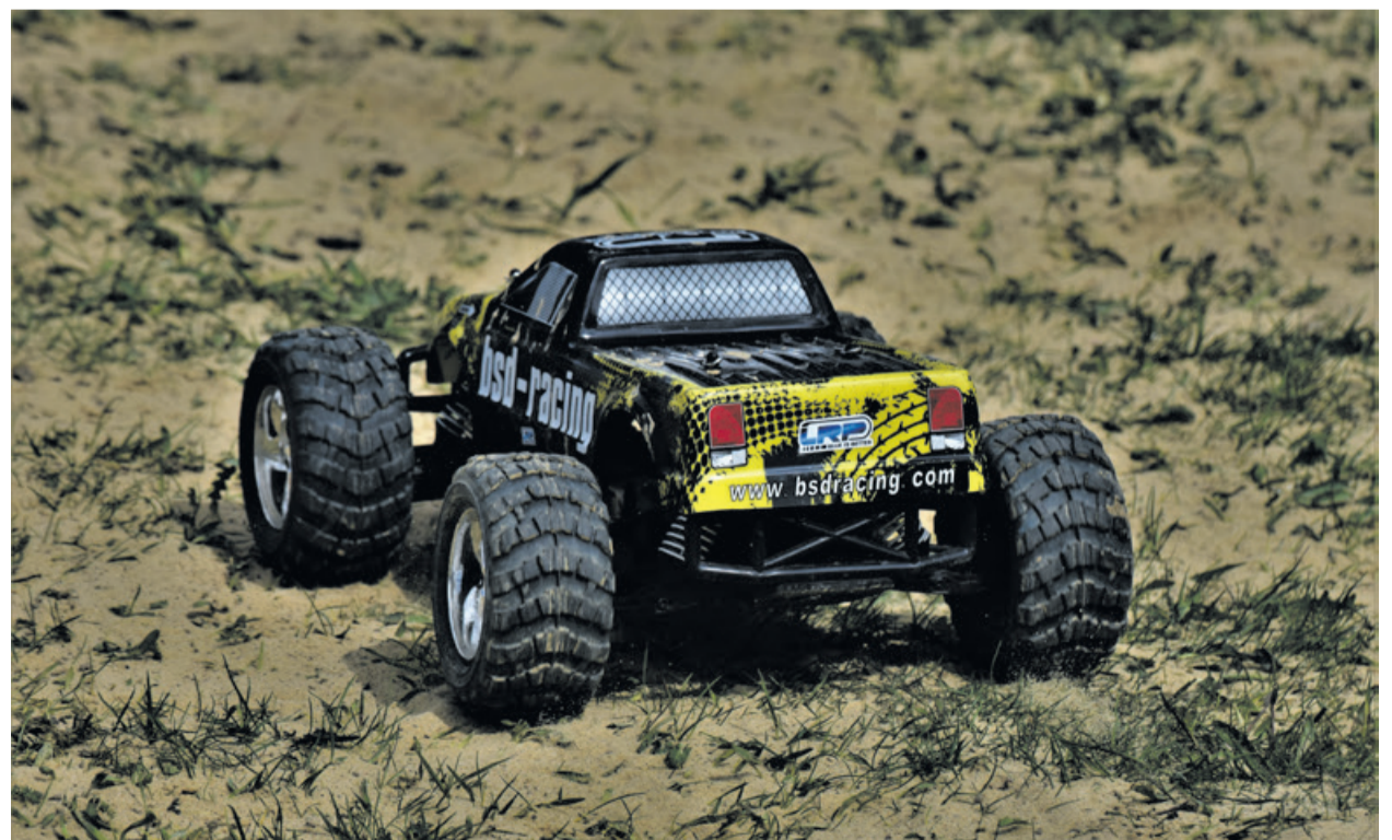
Dużym powodzeniem cieszyły się miniaturowe terenówki zdalnie sterowane przez dzieci, młodzież i dorosłych

Bogaty był program wydarzeń towarzyszących rajdowi. Wśród nich największym powodzeniem cieszył się specjalnie przygotowany tor przeszkód, po którym poruszały się miniaturowe terenówki zdalnie sterowane przez dzieci, młodzież i dorosłych. Chętnych było tak wielu, że w pewnym momencie wyczerpały się akumulatory zasilające repliki terenowych pojazdów.