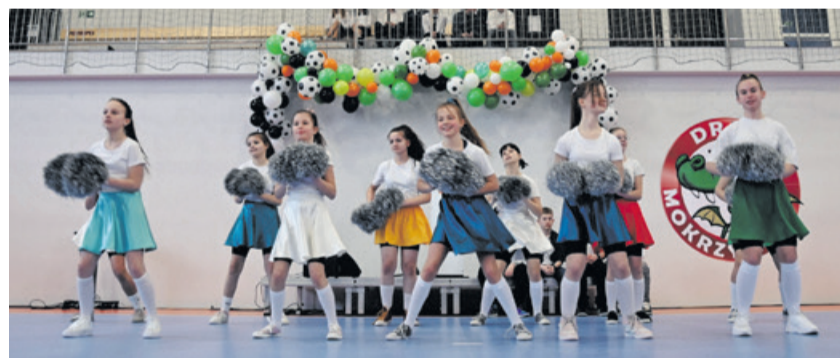
Wystąpiły cheerleaderki ...