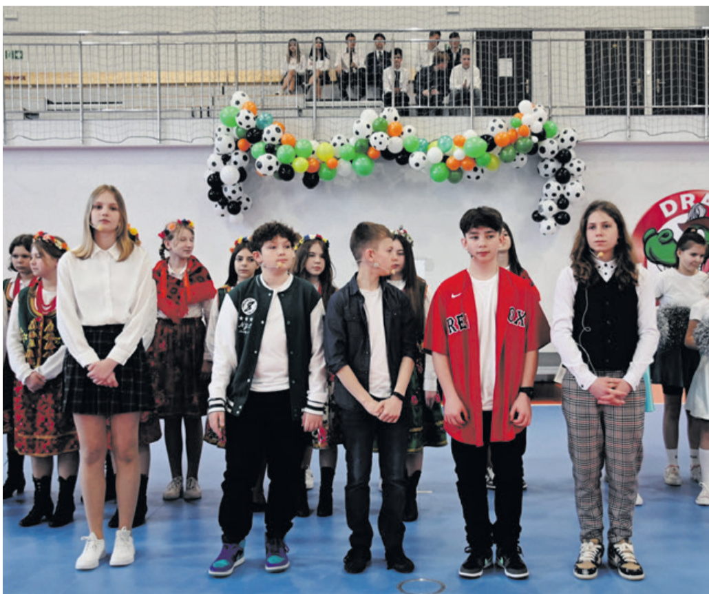
Uczniowie szkoły w Mokrzkach uświetnili uroczystość wspaniałym występem, który zakończyli spontanicznym podziękowaniem za wybudowanie długo oczekiwanej hali.