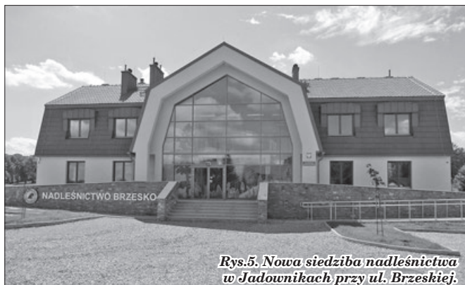
Rys.5. Nowa siedziba nadleśnictwa w Jadownikach przy ul. Brzeskiej.

Autor dziękuje Nadleśnictwu Brzesko za udostępnienie zamieszczonych w artykule zdjęć.