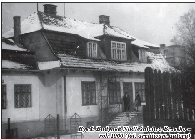
Rys.1. Budynek Nadleśnictwa Brzesko – rok 1960

transportowych. W magazynach tych okresowo były też przechowywane nasiona buka.