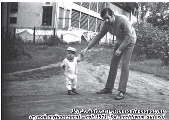
Rys.2. Autor z synem na tle magazynu szyszek wyluszczeni – rok 1971

Wyluszczeni nasion, będąca jednostką organizacyjną Nadleśnictwa, funkcjonowała w Brzesku w oparciu o istniejące linie technologiczne od roku 1960 (pierwsze uzyskane nasiona) do roku 1997, gdy zakończyła swoją działalność 7 . Jej funkcje przejęła nowo zbudowana linia technologiczna wraz z zapleczem technicznym do wyluszczenia nasion w Leśnictwie Jodłówka. Wyluszczeni nasion funkcjonuje do dnia dzisiejszego w ramach utworzonego Gospodarstwa Szkółkarsko – Nasien-