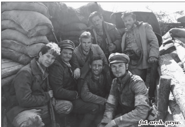
fol. arch. pryw.