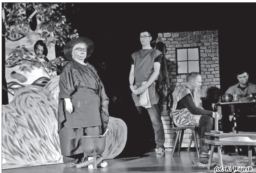
fol. K. Wójcik