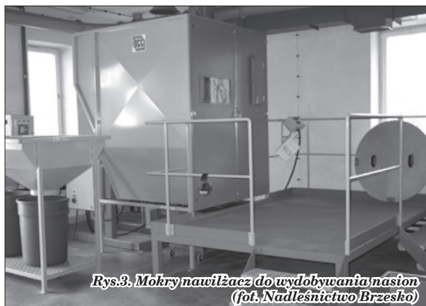
Rys.3. Mokry nawilżacz do wydobywania nasion

5. Bilans otwarcia Państwowych Zakładów Przemysłowo-Rol-