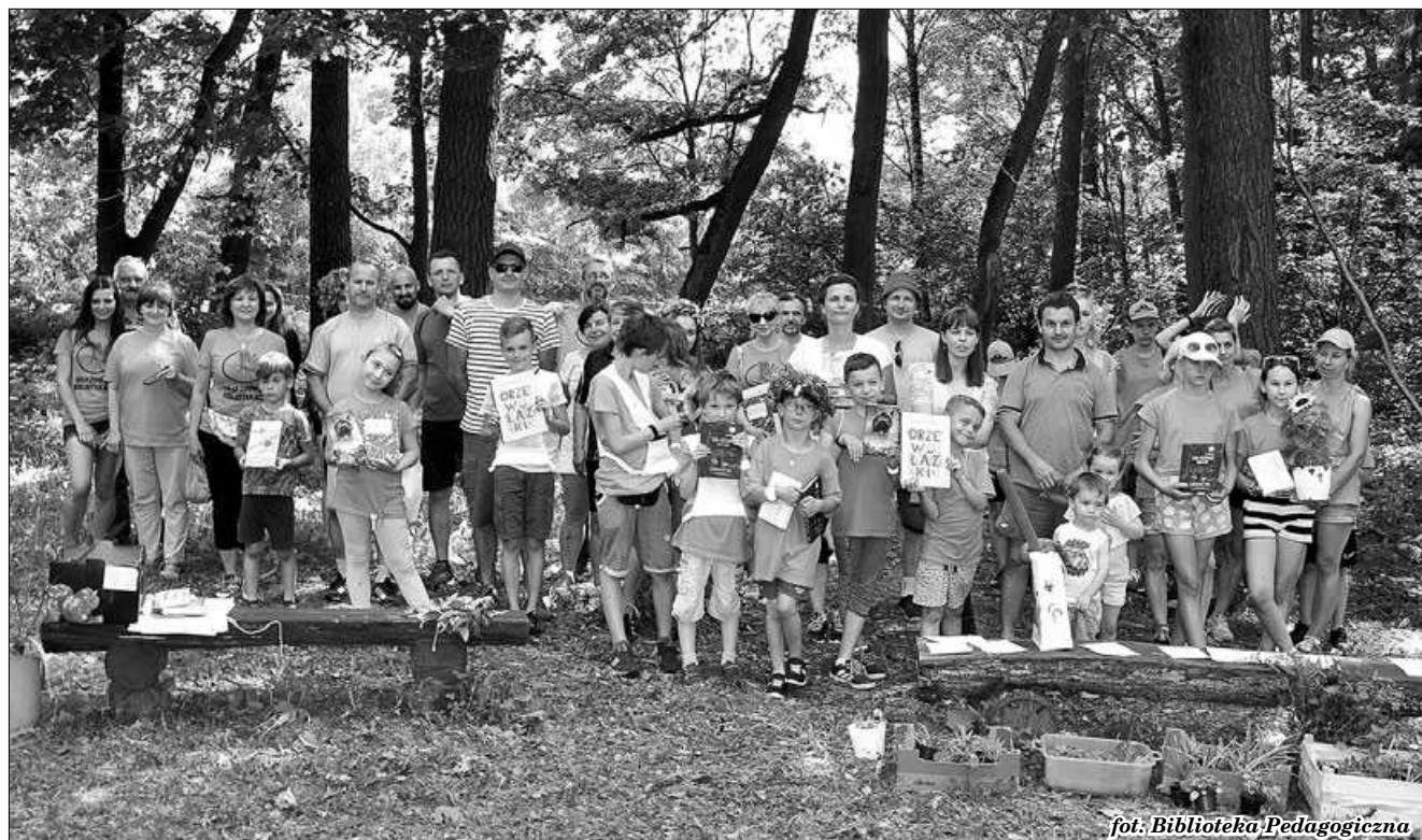
fol: Biblioteka Pedagogiczna