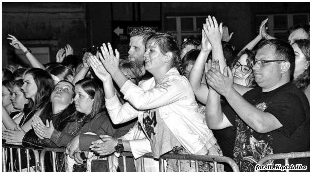
fol. B. Kądziołka