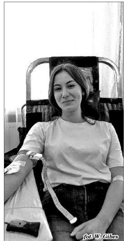
fol. W. Gibes