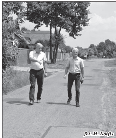
fol. M. Kofcis