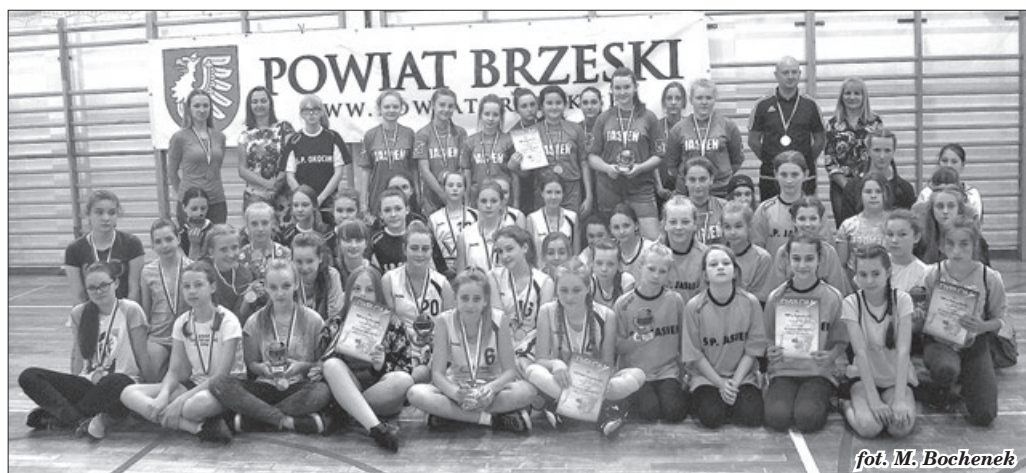
fol. M. Bochenek