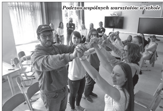
Podczas wspólnych warsztatów w szkole