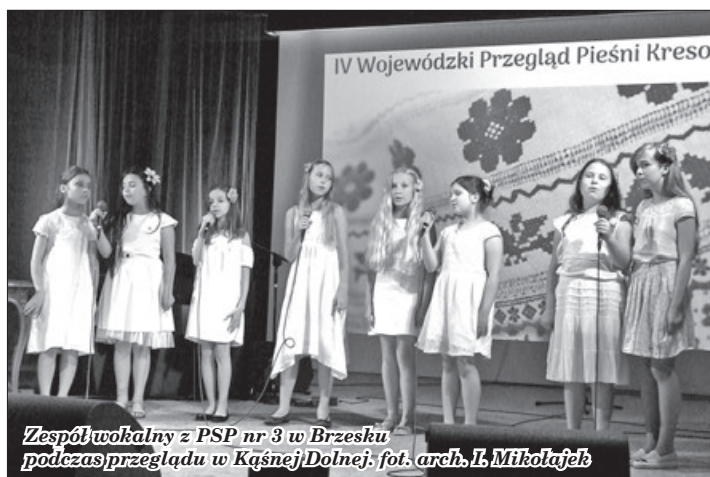
Zespół wokalny z PSP nr 3 w Brzesku podczas przeglądu w Kąsnej Dolnej