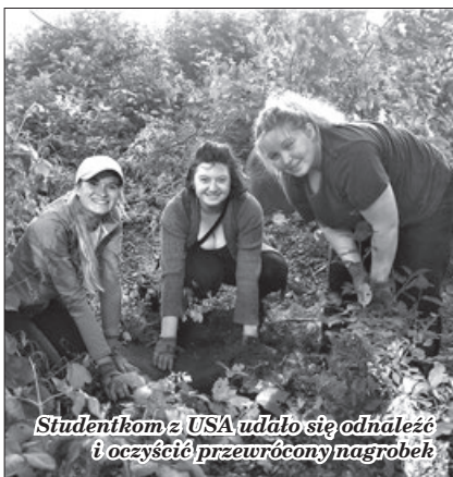
Studentkom z USA udało się odnaleźć i oczyścić przewrócony nagrobek