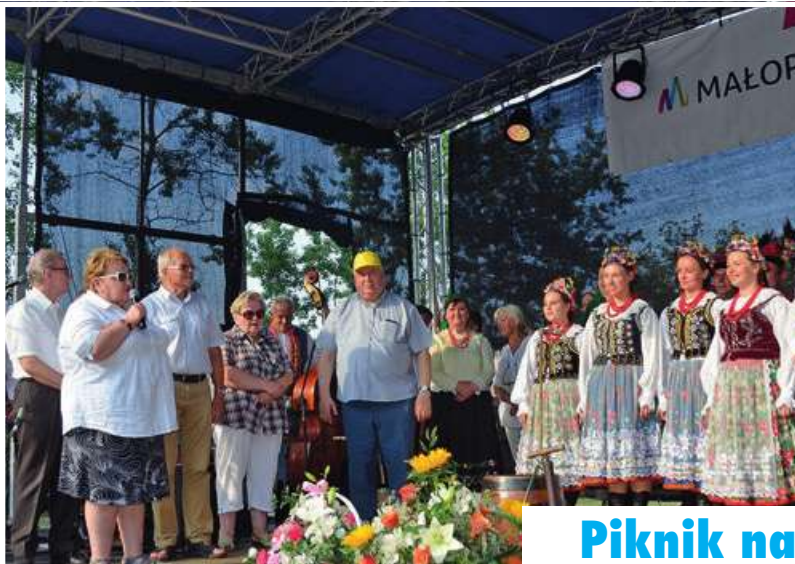
Piknik na Słotwinie