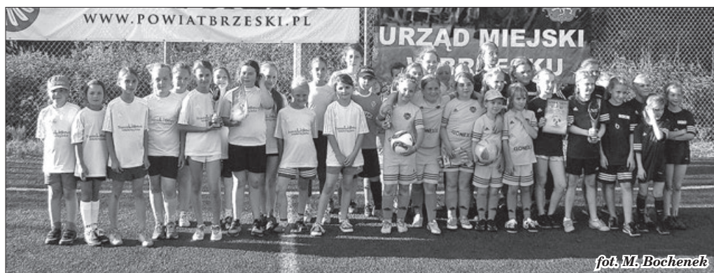
fol. M. Bochenek

Sponsorami pucharów, dyplomów i nagród był Urząd Miejski i Starostwo Powiatowe w Brzesku. MB