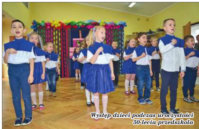
Występ dzieci podczas uroczystości 50-lecia przedszkola