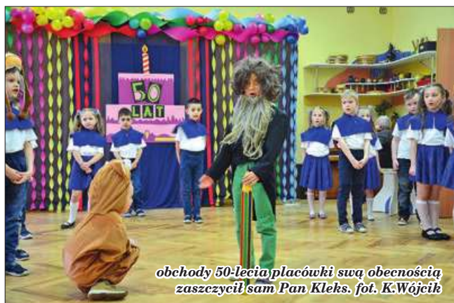
obchody 50-lecia placówki swą obecnością zaszczycił sam Pan Kleks.