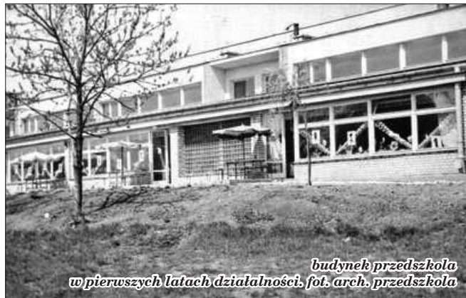
budynek przedszkola w pierwszych latach działalności