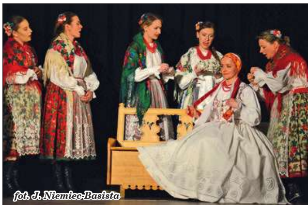
fol. J. Niemiec-Basista