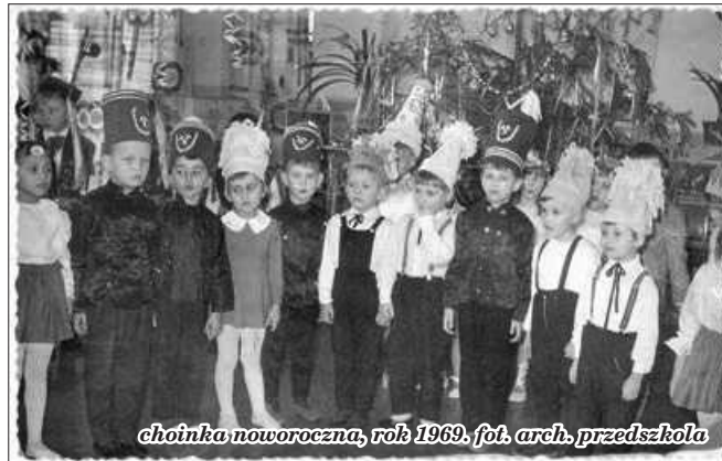
choinka noworoczna, rok 1969

bardzo aktywne miejsce, dużo się tam działo. Czasem chodziliśmy do przedszkola w Ogródku Jordanowskim, by razem z rówieśnikami występować na tamtejszej scenie. Po latach do „Czwórki” zapisałam też moich synów, którzy również wynieśli stamtąd wiele wspaniałych wspomnień.