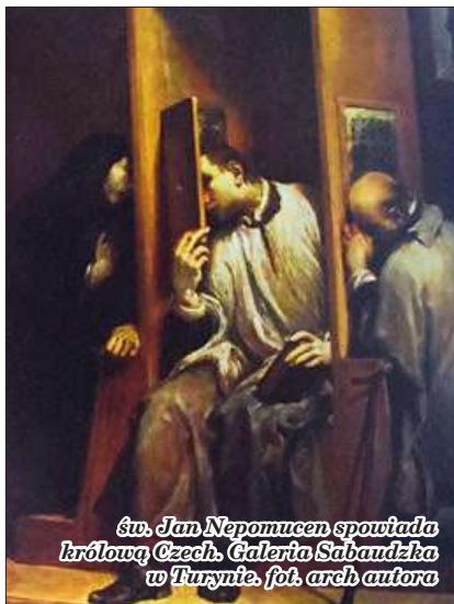
św. Jan Nepomucen spowiada królową Czech. Galeria Sabaudzka w Turynie.

W Polsce kult św. Jana Nepomucena jest powszechny od trzech wieków. Ponad kilkaset figur kapłana ubranego w komżę ze stulą i biretem na głowie można spotkać przy drogach i mostach. W kościołach, kaplicach dawnych, święty Jan Nepomuk ma swoje ołtarze, figury, obrazy, feretrony, sztandary. Jest czczony jako patron mostów