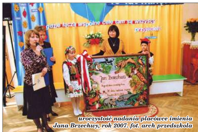
uroczystość nadania placówce imienia Jana Brzechwy, rok 2007.