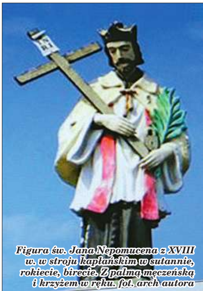
Figura św. Jana Nepomucena z XVIII w. w stroju kapłańskim w sutannie, rokiecie, birecie. Z palmą męczennską i krzyżem w ręku.

W tym czasie w Czechach panował król Wacław IV Luksemburczyk, znany z biesiadnego życia i ze swojej niechęci do papieża. Grabił też bez skrępowania dobra kościelne. Szczególny gniew żywił król wobec arcybiskupa Pragi. By umniejszyć zakres jego wła-