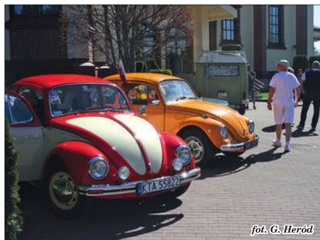
fol. G. Heród