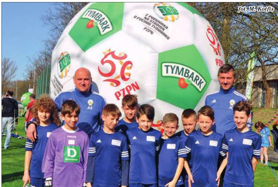
fol. M. Kotfis