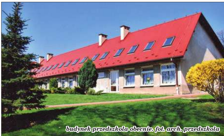
budynek przedszkola obecnie.

W przedszkolu najważniejsze były i są dzieci. Nie chodzi o realizowanie własnych ambicji, czy zarabianie pieniędzy. Tak było też pół wieku temu, co zaobserwować można zaglądając raz jeszcze do wspomnianej na początku kroniki. Warto przeczytać, jakie zadania wychowawcze znalazły się w pierwszym statucie placówki. Było to m.in. wdrażanie dzieci