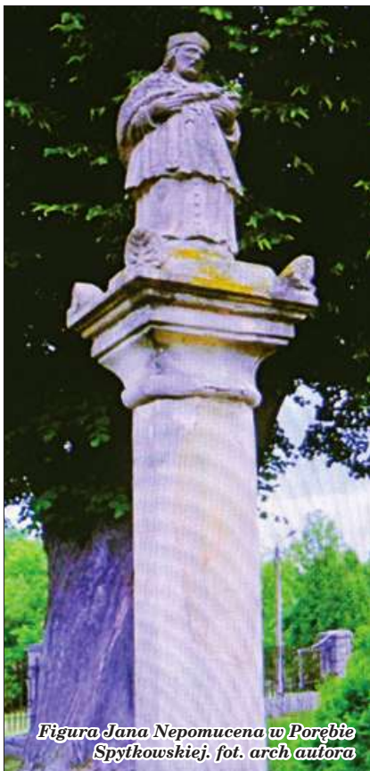
Figura Jana Nepomucena w Porębie Spytkowskiej.