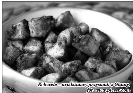
Kelewele – urodzinowy przysmak z Ghany.

W Meksyku lepiej urodzić się kobietą. Tutaj w ich żyłach nie musi płynąć błękitna krew, by mogły być księżniczkami. Dodatkowo nawet wieczna singielka będzie miała okazję poparadować w sukni ślubnej. Wszystko za sprawą quinceañera , czyli wielkiego balu z okazji piętnastych urodzin. Latynoski otrzymują w tym dniu społeczne przyzwolenie na umawianie się na randki, chodzenie na potańcówki i noszenie butów na wysokich obcasach. Dozwolony staje się również makijaż. Nic więc dziwnego, że tak im do tego dnia śpieszno. Solenizantki ubierają się w eleganckie, jasne suknie z falbankami. Na głowie obowiązkowo musi znaleźć się diadem, a w dłoniach bukiet kwiatów. Na bal zaprasza się