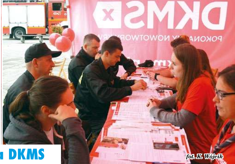
fol. K. Wójcik