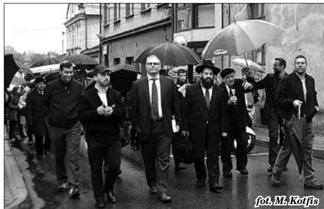
Uczestnicy Marszu idą ulicami, gdzie kiedyś mieszkali Żydzi

Podeszliśmy do budynku byłej synagogi na ul. Puszkina, gdzie znajduje się tablica upamiętniająca brzeskich Żydów zamordowanych podczas Holocaustu.