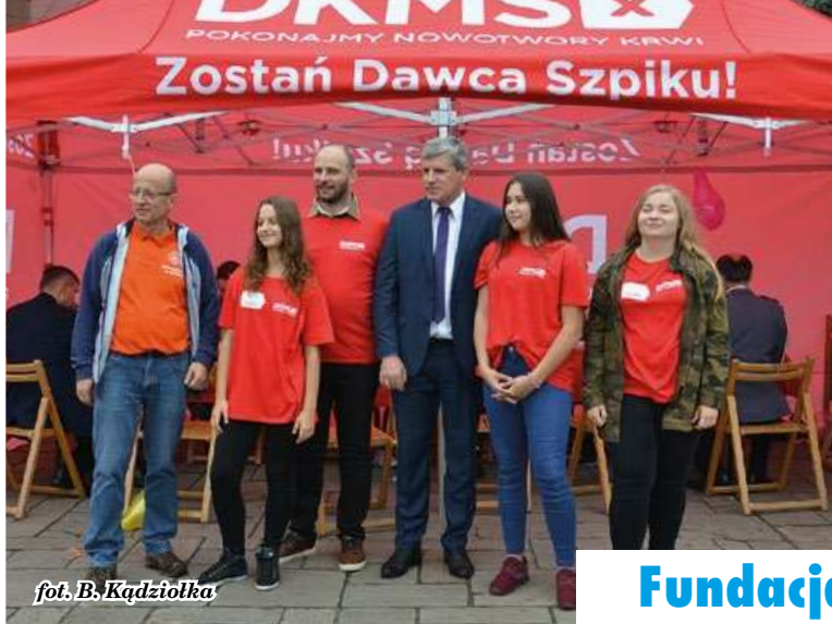
fol. B. Kądziołka