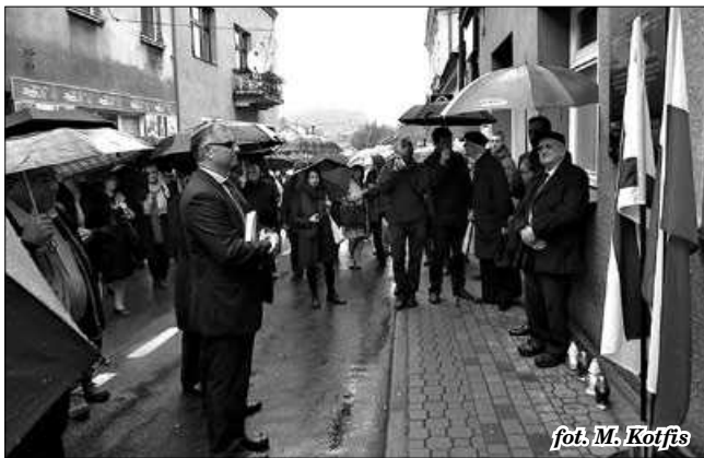
Przy budynku byłej synagogi na ul. Puzkina