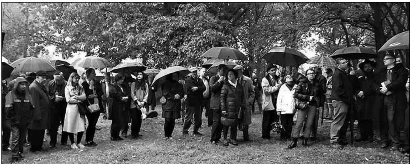
Uczestnicy Marszu Pamięci na cmentarzu żydowskim przy ul. Czarnowiejskiej