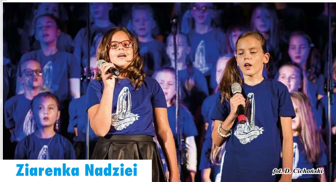
fol. D. Cichoński