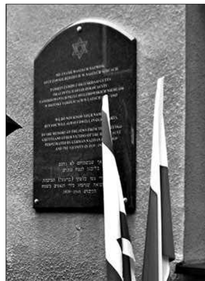
Tablica na budynku byłej synagogi w Brzesku: „Nie znamy waszych nazwisk, lecz zawsze będziecie w naszych sercach...”