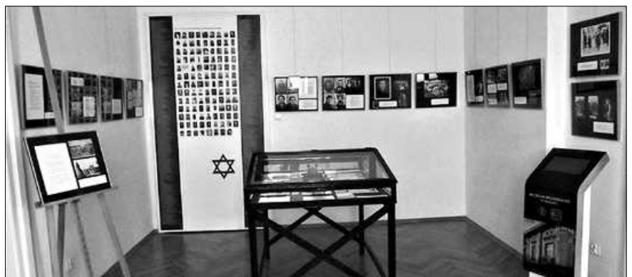
Wystawa w muzeum

Ta niewielka wystawa zawiera pewne podstawowe fakty dotyczące historii brzeskich Żydów, opowiada historię kilku rodzin, pokazuje takie obiekty jak menora, talit, kieliszki ki-