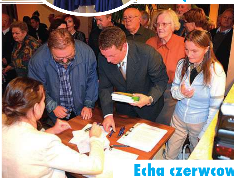
Echa czerwcowej Konferencji