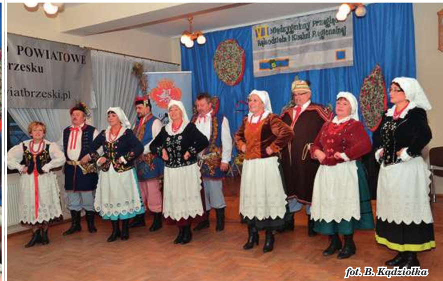
fol. B. Kądziołka