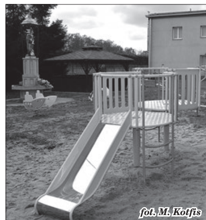
fol. M. Kotfis