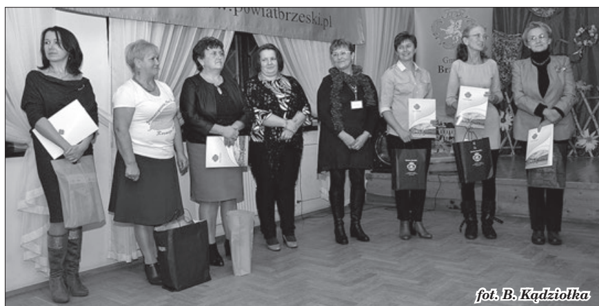
fol. B. Kądziołka