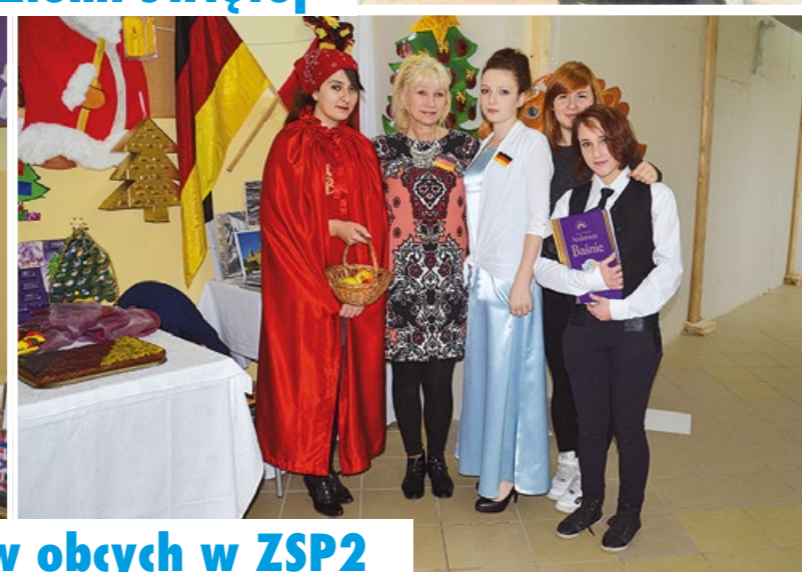
Dzień języków obcych w ZSP2