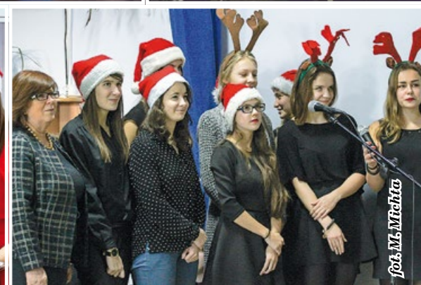
Kiermasz w ZSP1