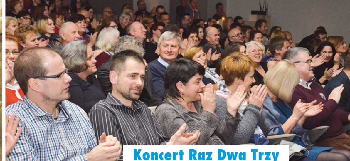
Koncert Raz Dwa Trzy