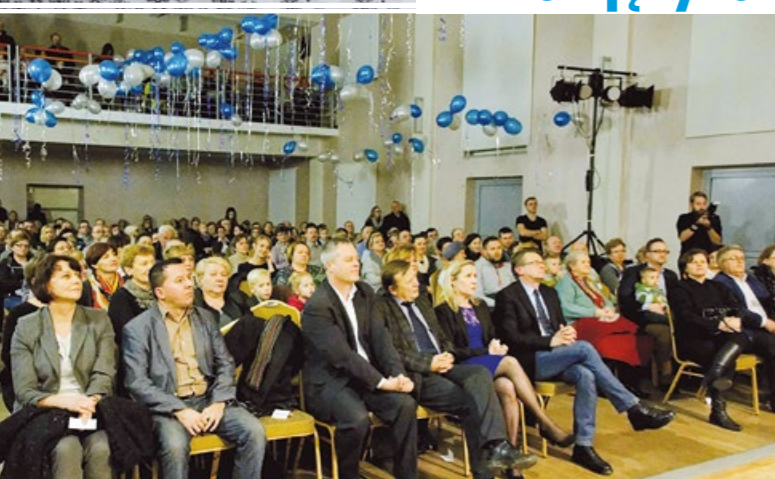
Koncert w Jadownikach