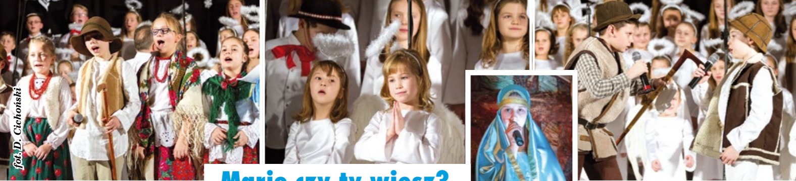
Mario czy ty wiesz?