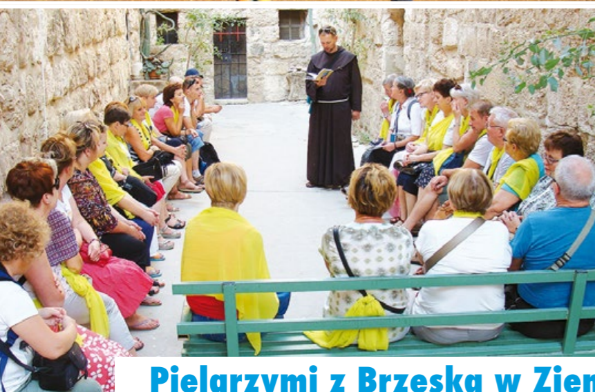
Pielgrzymi z Brzeska w Ziemi Świętej