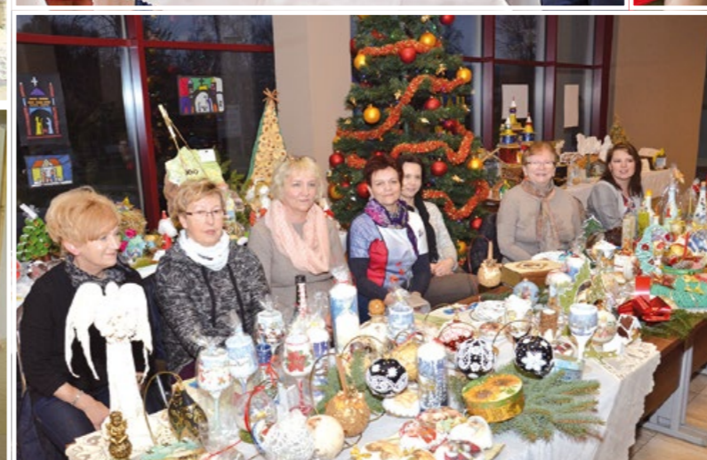
Świąteczny kiermasz w MOK