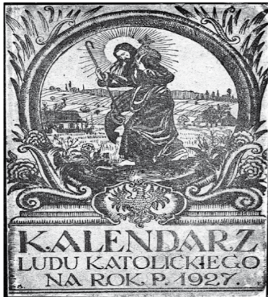
Okladka Kalendarza Ludu Katolickiego

Jeżeli kalendarz wydany został w latach wielkiej wojny, to przedstawiał także sytuację na frontach, podkreślając sukcesy wojsk poszczególnych państw zaborczych w zależności od miejsca jego wydania, negując przy tym poczynania militarne państw walczących po przeciwnej stronie.