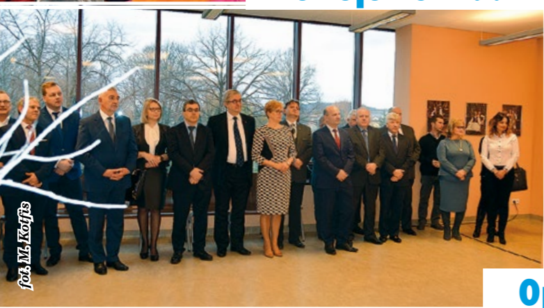
Opłatek w RCKB