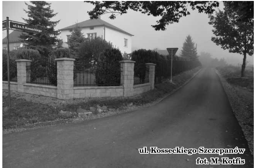
ul. Koseckiego-Szczepanów

Na ukończeniu są już prace remontowe i modernizacyjne na drogach gminy Brzesko. W roku bieżącym dzięki staraniu burmistrza, przychylności radnych oraz dużemu zaangażowaniu i pracy urzędników brzeskiego magistratu wykonano nowe nakładki oraz nawierzchnie z kostki brukowej. Również nie bez znaczenia dla poprawy infrastruktury drogowej i komunikacyjnej gminy miały negocjacje i bardzo dobra współpraca z inwestorami przebudowy linii kolejowej oraz łącznika drogi wojewódzkiej. Dzięki temu powstały nowe ciągi komunikacyjne tak przydatne mieszkańcom gminy Brzesko. - To był bardzo udany rok jeśli chodzi o remonty i budowę nowych dróg - mówi burmistrz Brzeska, Grzegorz Wawryka. - Bez wątpienia poprawi się komfort ich