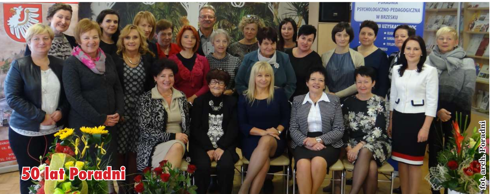
50 lat Poradni