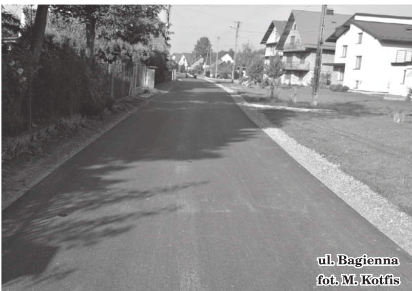
ul. Bagienna