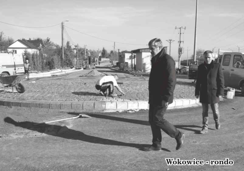
Wokowice - rondo