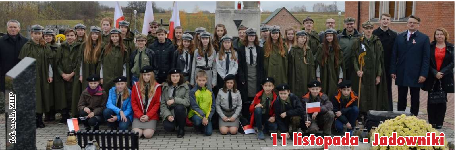
fol. arch. ZIP