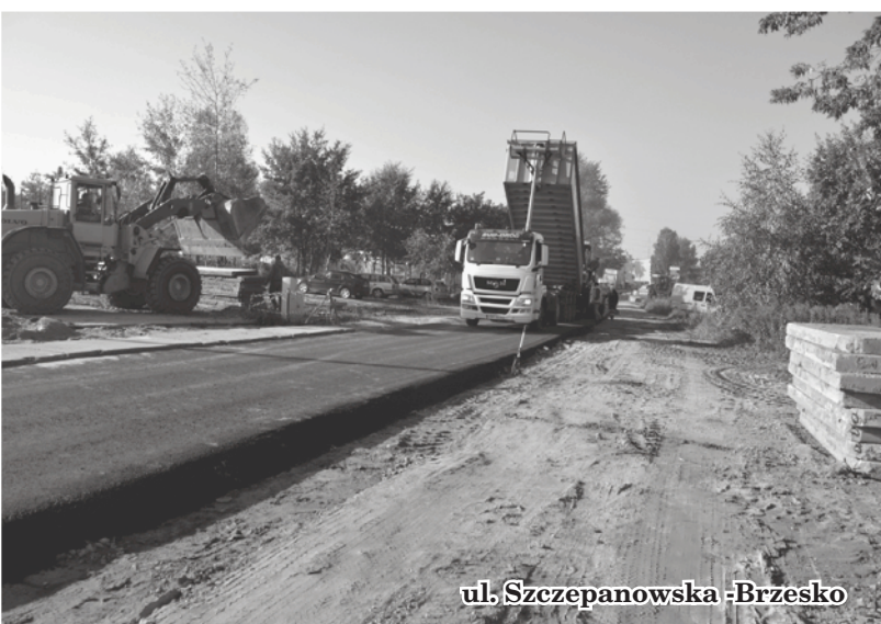
ul. Szczepanowska -Brzesko