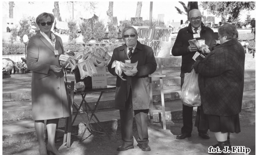
fot. J. Filip

Za Komitet Odnowy i Troski o Cmentarz Parafialny w Brzesku Jacek Filip fot.kolor