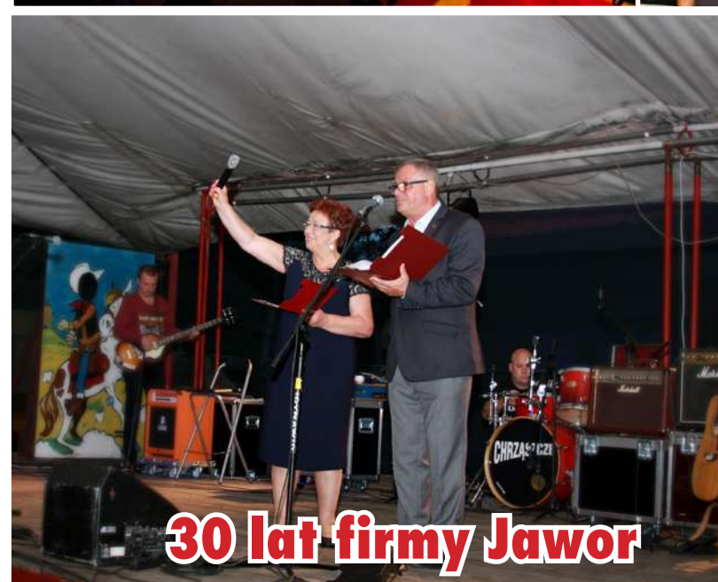
30 lat firmy Jawor