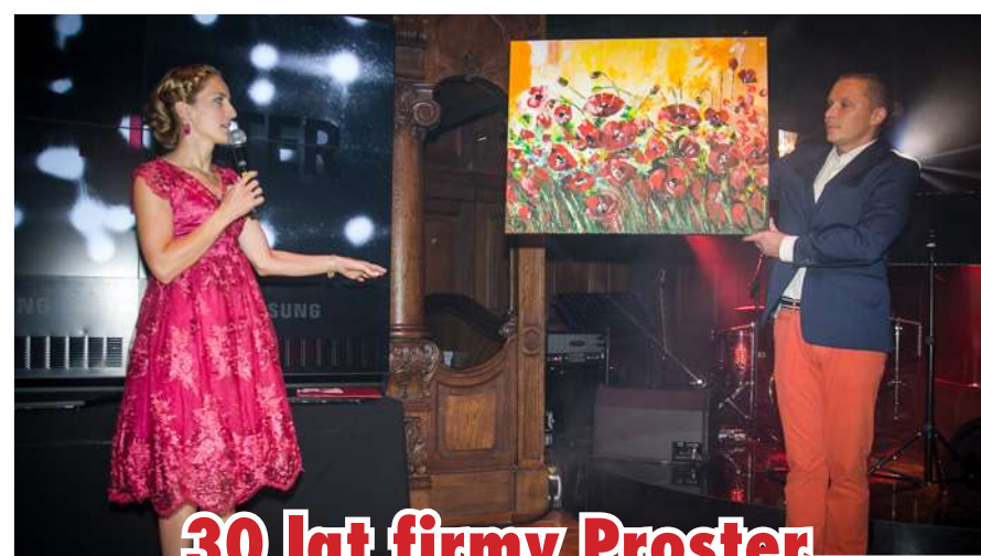
30 lat firmy Proster