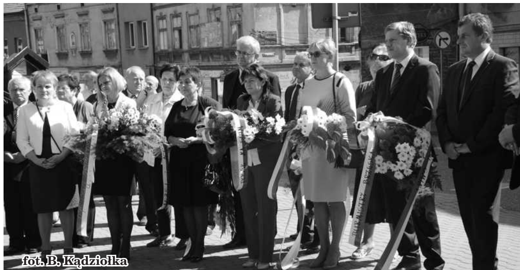
fol. B. Kądziołka

a następnie przed zgromadzonymi w sali widowiskowej RCKB wystąpiła młodzież działająca przy Miejskim Ośrodku Kultury w Brzesku, prezentując okolicznościowy program artystyczny. Z okazji 35-lecia powstania NSZZ Solidarność Komisjom Zakładowym zostały wręczone dyplomy i pamiątkowe medale. Przyznane zosta-