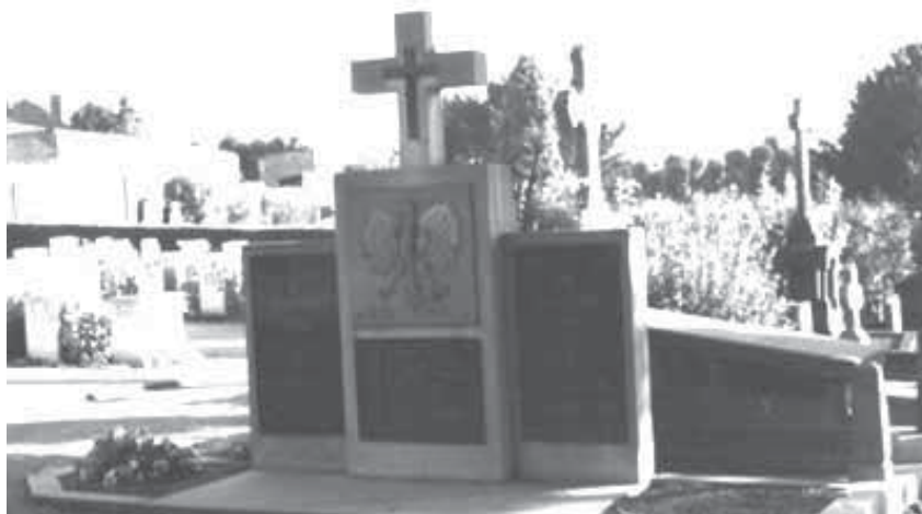
Grób polskich lotników na cmentarzu w Charleroi

Po wydarzeniach z sierpnia 1941 roku i półrocznej tułaczce przebywał w Anglii jeszcze do października 1943 roku, kiedy to już jako oficer został przydzielony do Grupy Transportowej w Kanadzie. Tam zajmował się dostarczaniem samolotów z fabryk amerykańskich i kanadyjskich do Wielkiej Brytanii, Afryki Północnej, na Bliski i Środkowy Wschód. Rok