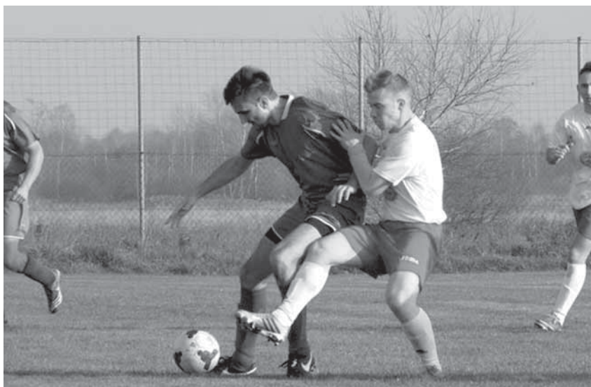
Zdjęcie z meczu Olimpia - Rylovii