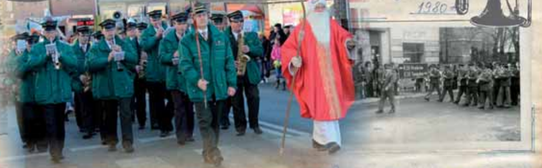
Święto Odrodzenia 22 lipca 1961