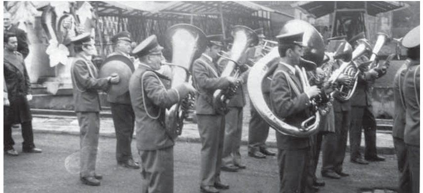
Wymarsz orkiestry z browaru podczas święta 1 maja. Lata 60-te