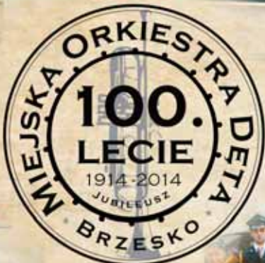
„młoda gwardia” lipiec 1974 r.