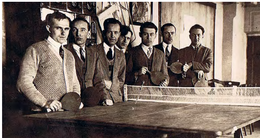
Członkowie Towarzystwa w budynku Sokoła, lata 1920-25