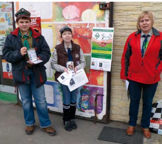
DH Czchowskie Orły