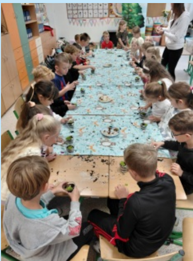
Leśne opowieści w Szkole Podstawowej w Sieprawiu str. 19