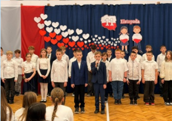
Święto Niepodległości w Szkole Podstawowej w Sieprawiu str. 19