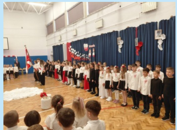
Akcja Szkoła Do Hymnu w Szkole Podstawowej w Sieprawiu str. 19