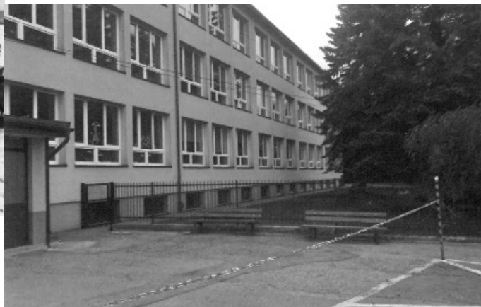
Zdjęcie z maja 2025r.