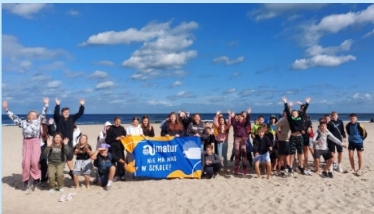
Uczniowie z Zakliczyna na Zielonej Szkole w Jastrzębiej Górze str. 28