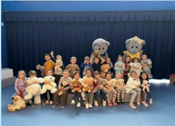
Dzień pluszowego misia w Przedszkolu w Zakliczynie str. 26