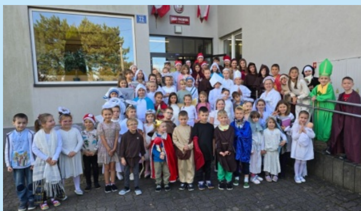
Wizyta świętych w Czechówce str. 22