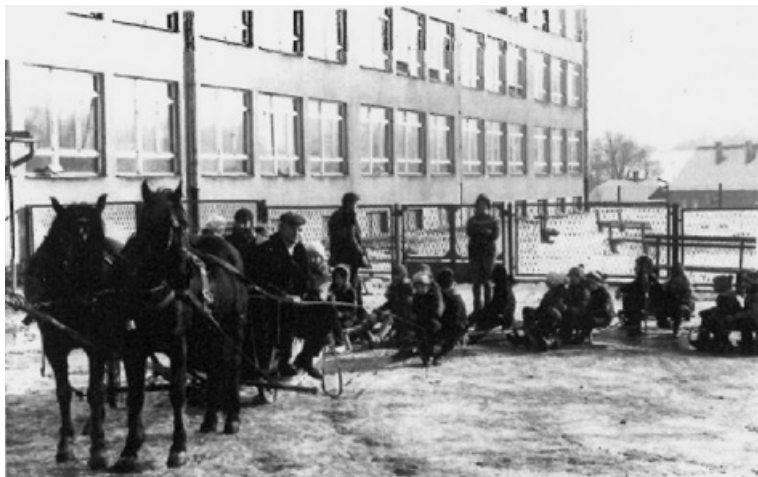
Kulig w 1968r.