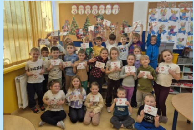
Listy do św. Mikołaja od uczniów z Czechówki str. 26