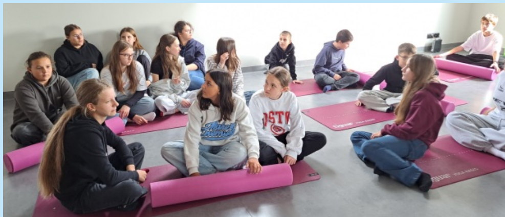
Uczniowie z SP z Sieprawia na zajęciach z doradztwa zawodowego w Reha - Duo str. 20