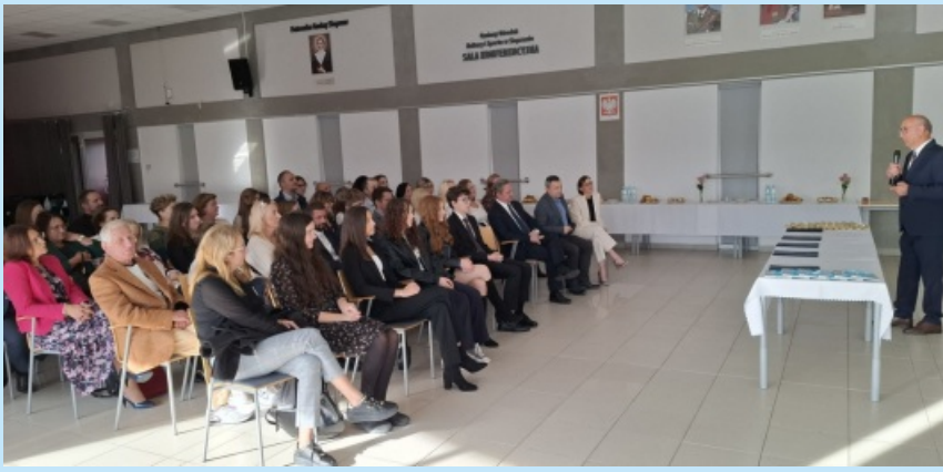
Dzień Edukacji Narodowej str. 10