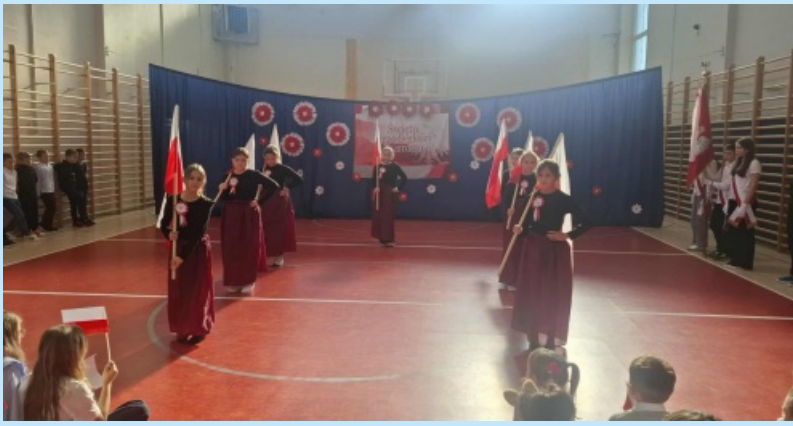
Święto Niepodległości w Czechówce str. 24