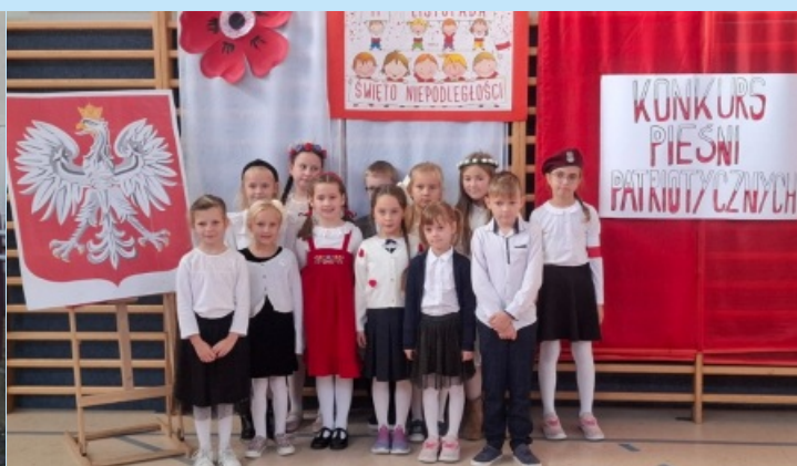
Konkurs Pieśni Patriotycznej w Czechówce str. 23