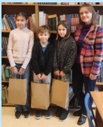
Konkurs pięknego czytania w Szkole Podstawowej w Sieprawiu str. 20