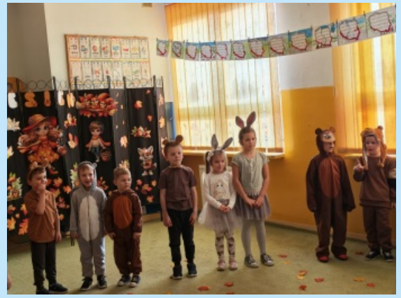
Poznajemy jesień w Czechówce str. 25