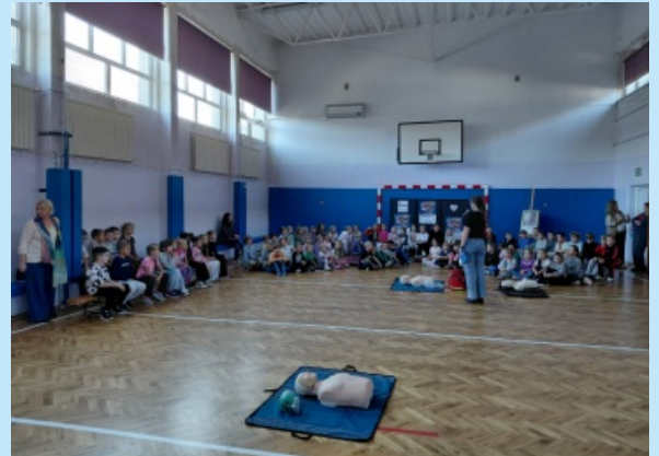
Rekord pierwszej pomocy w Szkole Podstawowej w Sieprawiu str. 18