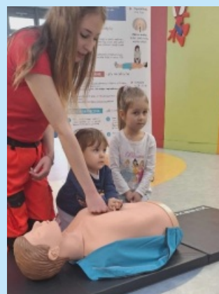
Mali ratownicy z Przedszkola w Sieprawiu str. 21