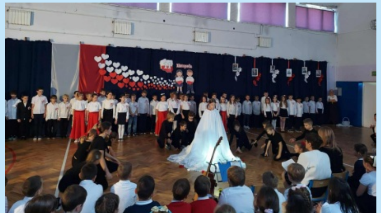
Święto Niepodległości w Szkole Podstawowej w Sieprawiu str. 19