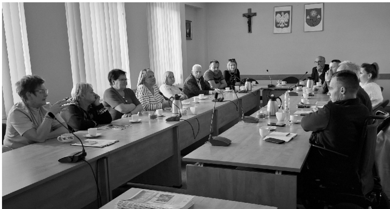
Spotkanie radnych i sołtysów z Wójtem w dniu 7 listopada br.

Radni po dyskusji postanowili, że na najbliższej sesji Rady Gminy Siepraw podejmą rezolucję sprzeciwiającą się przebiegowi trasy S7 przez Gminę Siepraw oraz przedstawiają argumentację za takim stanowiskiem.