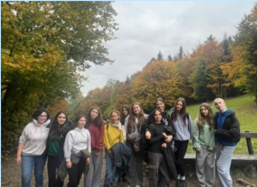
Językowa wymiana uczniów ze Szkoły Podstawowej w Sieprawiu z uczniami z Liceo G. M. Dettori w Tempio z Sardynii str. 18