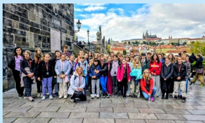
Wycieczka do Pragi - Szkoła Podstawowa w Czechówce str. 22