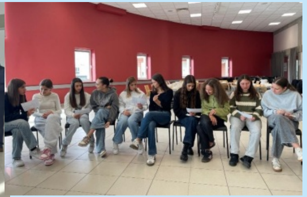
Językowa wymiana uczniów ze Szkoły Podstawowej w Sieprawiu z uczniami z Liceo G. M. Dettori w Tempio z Sardynii str. 18