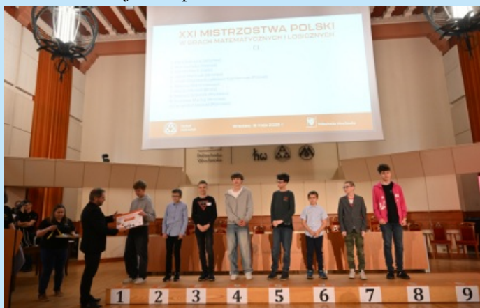
Sukcesy mieszkańca na Mistrzostwach Polski i Świata w Grach Matematycznych i Logicznych str. 20