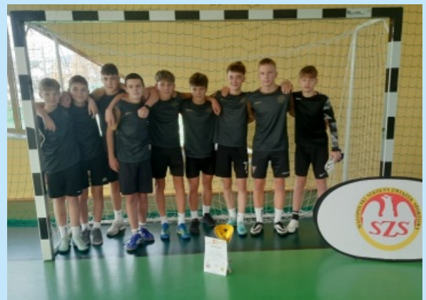
Sport w ZPO w Zakliczynie str. 29