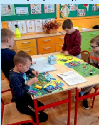
Plastuś w SP Czechówka str. 22