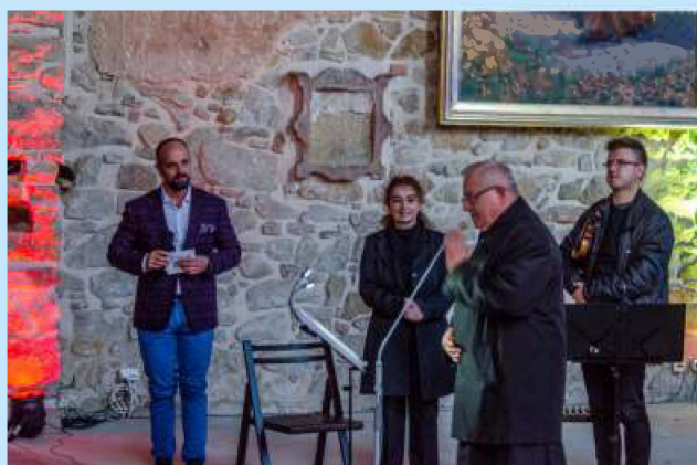
Uczta duchowa z Noro - Lim str. 18