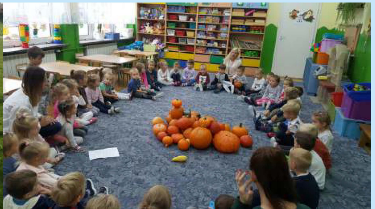
Święto dyni str. 13