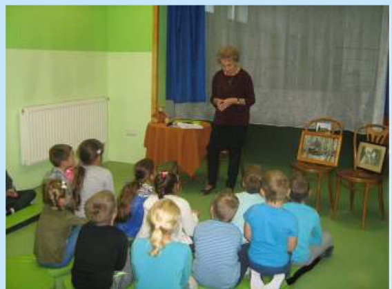
Cała Polska czyta dzieciom str. 11