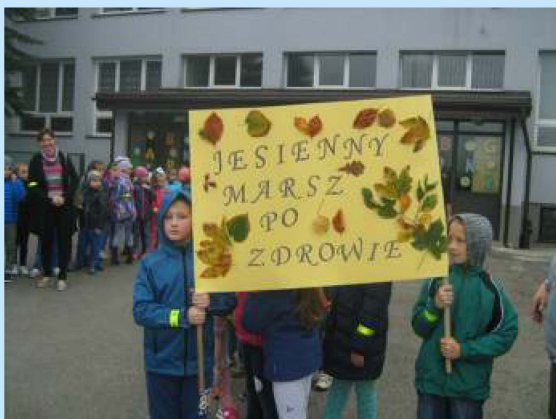
Jesienny marsz po zdrowie str. 11