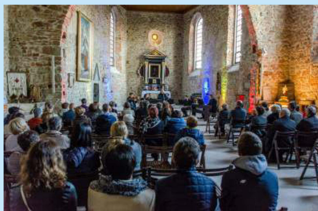
Uczta duchowa z Noro - Lim str.18