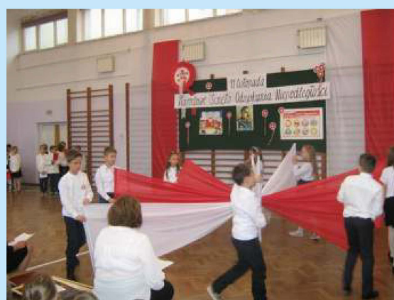
99 rocznica odzyskania niepodległości str. 10