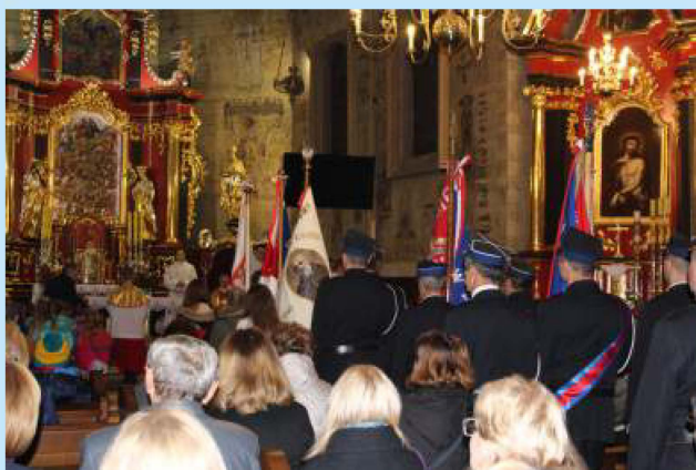
Gminne uroczystości patriotyczne str. 15