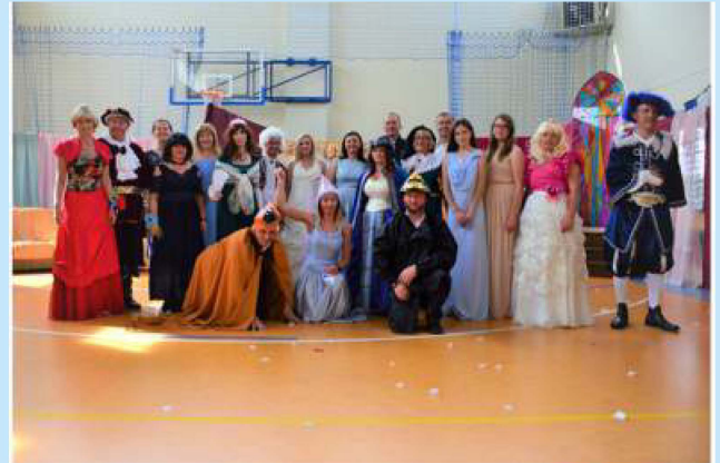
Projekt “Życie teatralne strażnicy” - sztuka w służbie integracji społeczeństwa str. 23