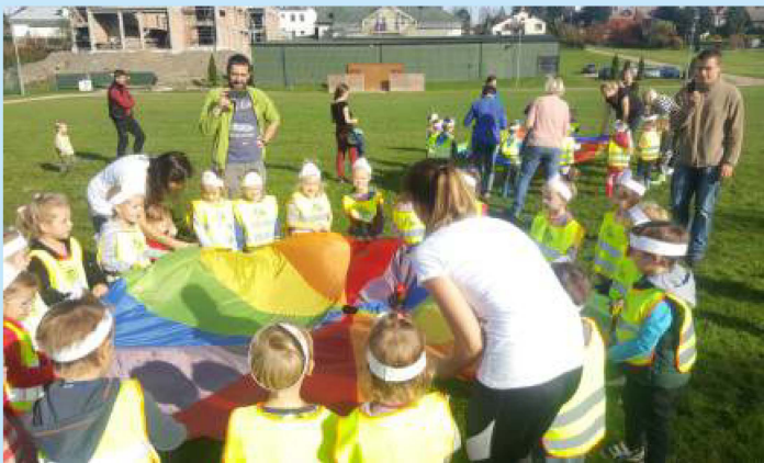
Święto pieczonego ziemniaka str. 13