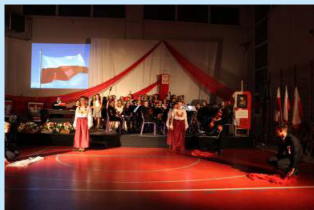
Gminne uroczystości patriotyczne str. 15