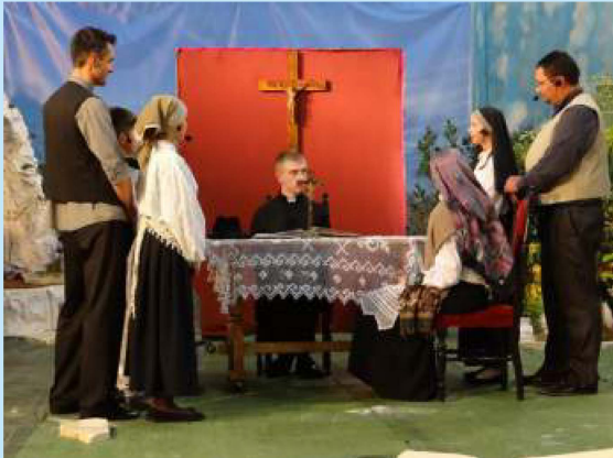
“Fatima” - przedstawienie teatralne w Łyczance str. 22