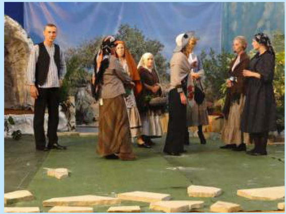
“Fatima” - przedstawienie teatralne w Łyczance str. 22