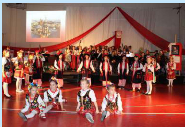
Gminne uroczystości patriotyczne str. 15