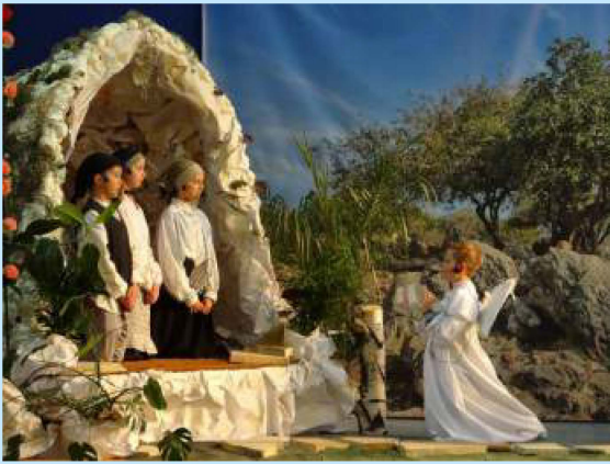
“Fatima” - przedstawienie teatralne w Łyczance str. 22