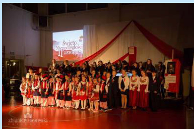
Gminne uroczystości patriotyczne str. 15