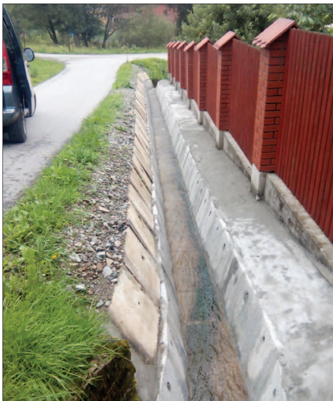
Odwodnienie drogi na os. Łącki w Łętowie