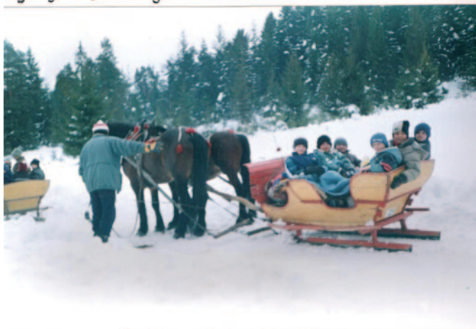
Kulig na Żarębkach.

Nie tylko na lekcjach uczniowie zdobywają wiedzę. W czasie wycieczek po najbliższej i dalszej okolicy poznają zabytki, ciekawe miejsca i mogą podziwiać piękną przyrodę ojczystego kraju.