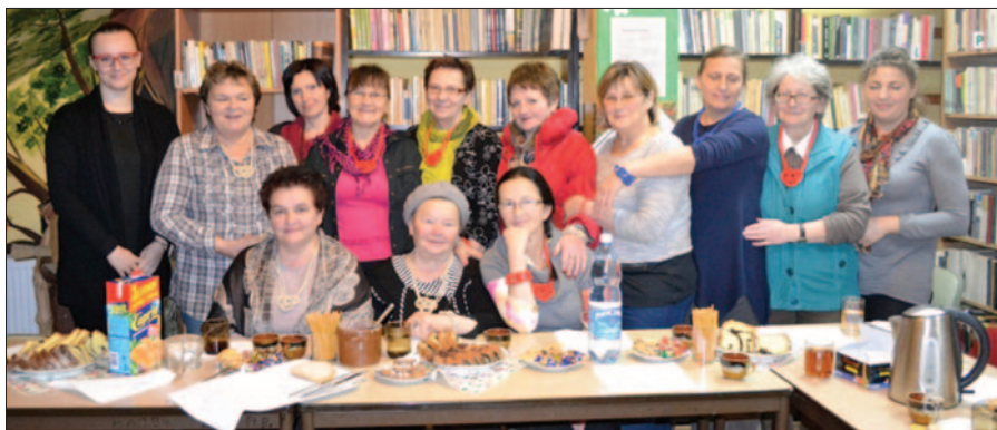
Babki z Raby na warsztatach z FIO

17 listopada Stowarzyszenie „Razem dla Regionu” zorganizowało kolejne spotkanie w ramach projektu „3xZ”.