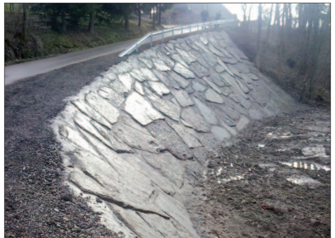
Droga Chorągwiczy w Łostówce

Wartość zadania wyniosła: 750.000,00 zł w tym udział powiatu limanowskiego w wysokości: 337.854,00 zł.