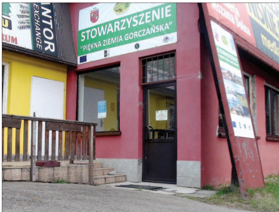
LGD Piękna Ziemia Gorczańska

Od 2 stycznia 2017r. ruszy pierwszy nabór wniosków. Przeznaczony będzie dla osób chcących otworzyć własną działalność gospodarczą. Zachęcamy wszystkich zainteresowanych mających pomysły i chcących pozyskać na ten cel dofinansowanie z Unii Europejskiej do zapoznania się z informacjami na stronie LGD. Pamiętajcie należy, że planując biznes warto znaleźć takie miejsce lub branżę, w której istnieje jeszcze pewna nisza, a tym samym zaoferować takie pro-