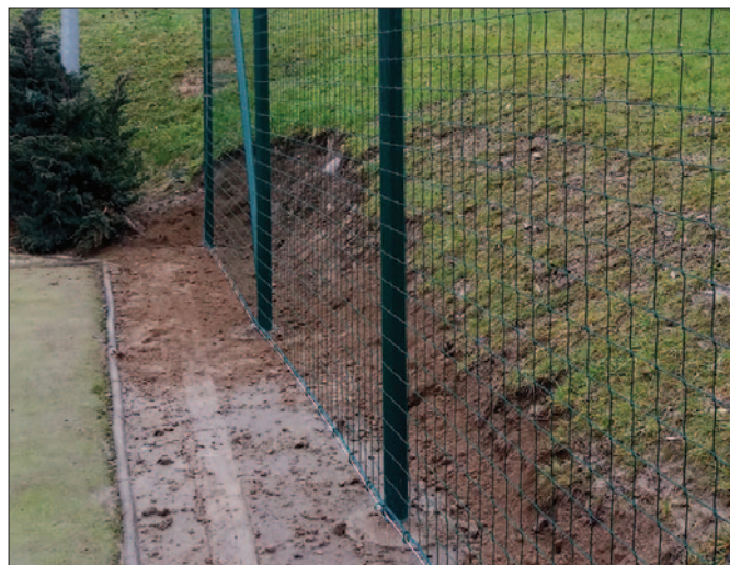
Piłkochwyły w ZSiP w Łostówce