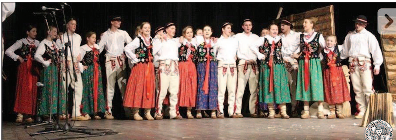
Zagórzański Zespół Folklorystyczny „Dolina Mszanki”