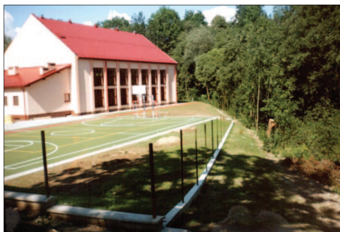
Lipiec, sierpień – trwają prace przygotowujące obiekt do użytku