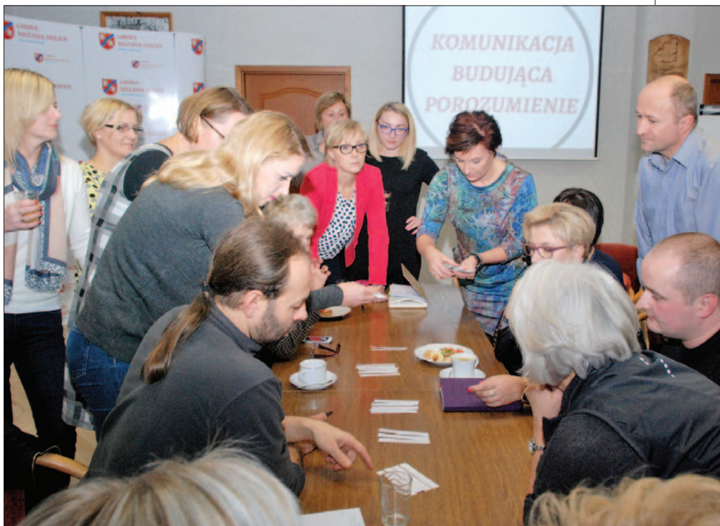
Warsztaty rewitalizacyjne w Gminie Mszana Dolna

Rewitalizacja jest kompleksowym procesem przemian społecznych, ekonomicznych, przestrzennych i technicznych służących wyprowadzeniu ze stanu kryzysowego obszarów zdegradowanych. Dawniej rewitalizacja dotyczyła jedynie miast, jednak po wejściu w życie ustawy o rewitalizacji w 2015r. swym zasięgiem objęła również tereny wiejskie.