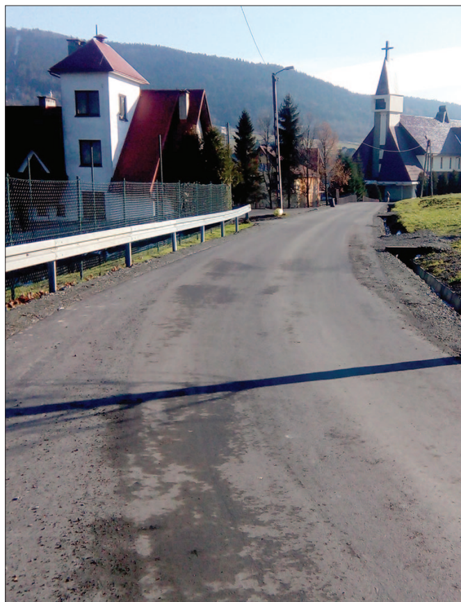
Droga Pańskie w Kasinie Wielkiej