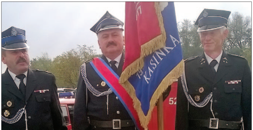
Poczet sztandarowy OSP Kasinka Mała

4) Nr XXVIII/289/2016 w sprawie uchwalenia „Programu współpracy Gminy Mszana Dolna z organizacjami pozarządowymi i innymi podmiotami prowadzącymi działalność pożytku publicznego na rok 2017”.