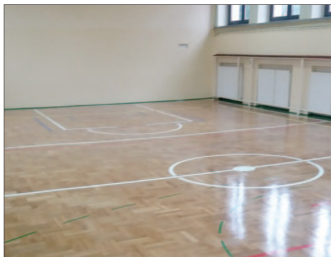
Nowy parkiet w ZPO Kasina Wielka budynek A