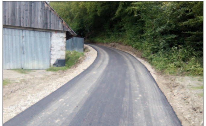
Droga na os. Kuce w Kasince Małej

Zrealizowano wspólnie z Powiatem Limanowskim zadanie pod nazwą: „Budowa chodnika dla pieszych z oświetleniem drogowym w ciągu drogi powiatowej nr 1626 K Kasinka Mała – Węglówka – Kasina Wielka w m. Kasinka Mała w km 0+094,40 – km 1+134,64”.