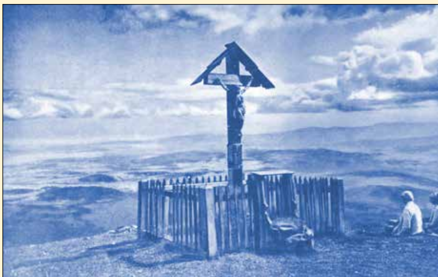
Widok spod Babiej Góry na Orawę. Wierchy 1930 r.

przewróciłem zwłoki i zepchnąłem doń, nakryłem gałęziami jałowca i świerka. Z wyciętego w lesie małego drzewka zrobiłem krzyż, na którym wyryłem nazwisko zmarłego, datę urodzenia i datę znalezienia zwłok. Nazwisko później wykułem również na największym kamieniu „grobowca”.