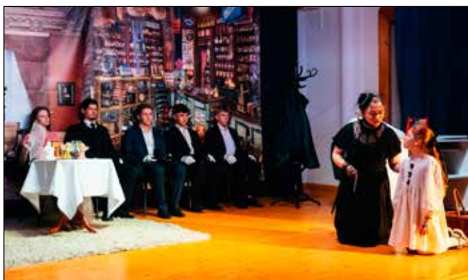
Przedstawienie „Lalki” przez młodzież Zespołu Szkół