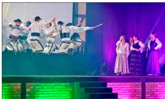
Zespół Orawiaci na koncercie w Krakowie