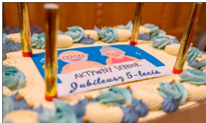
Jubileusz 5-lecia Klubu Seniora