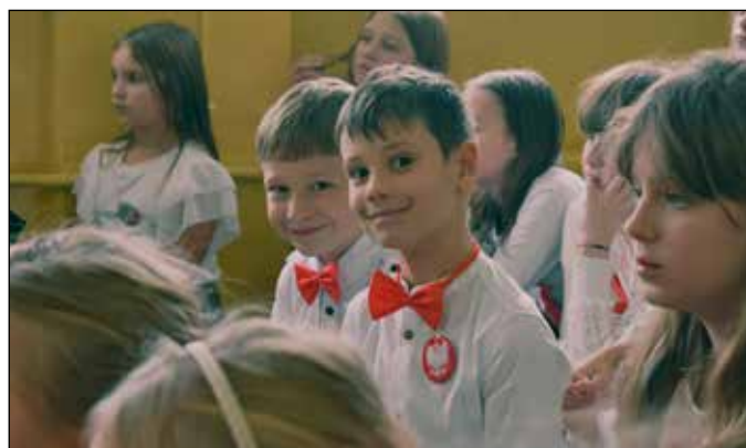
Gminny Konkurs Pieśni Patriotycznej