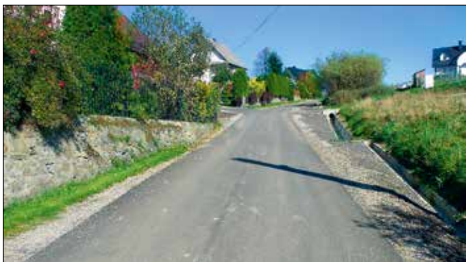
Przebudowa drogi „Na stadion” w Lipnicy Wielkiej

Trzecie z zadań współfinansowanych ze środków polegało na remoncie drogi 604603K w Lipnicy Wielkiej – Centrum. W ramach inwestycji na całej długości drogi – 300 m – została wykonana warstwa asfaltowa o szerokości 3,5 m wraz z obustronnym poboczem 0,75 m. Dodatkowo w ciągu jezdni wykonane zostało odwodnienie mające na celu przechwycenie wód opadowych. Wartość robót – 191.621,91 zł (dofinansowanie z Funduszu Dróg Samorządowych – 88.730,00 zł ).