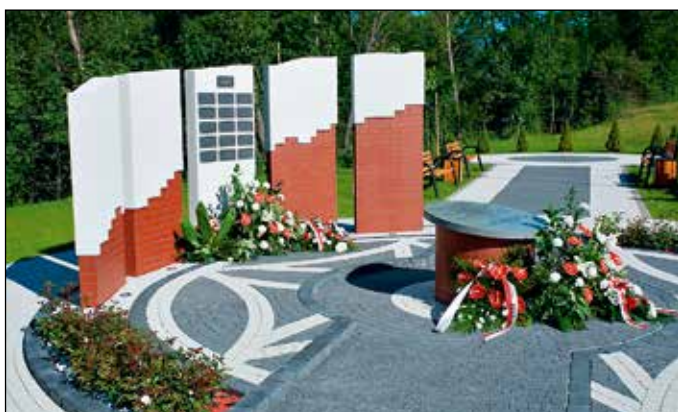
Mur „Orawskich Ojców Niepodległości”