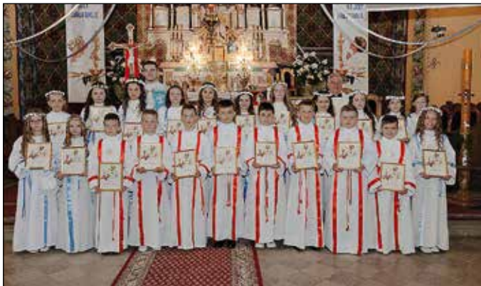
Szkoła Podstawowa Nr 2 - Centrum