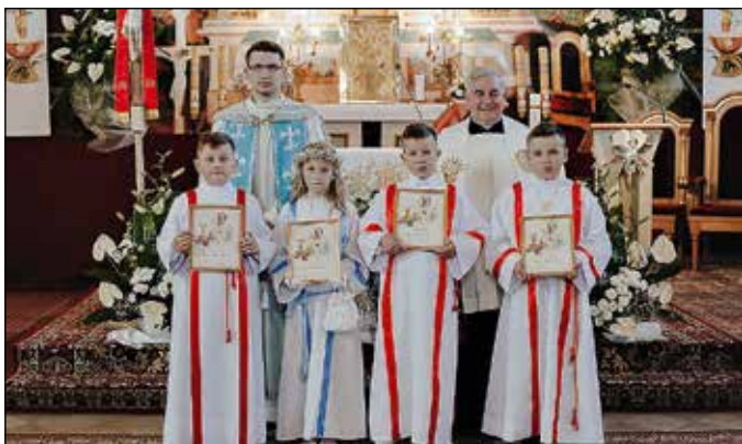
Szkoła Podstawowa Nr 4 - Przywarówka