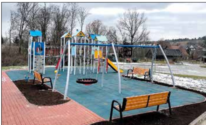
Plac zabaw przy stadionie