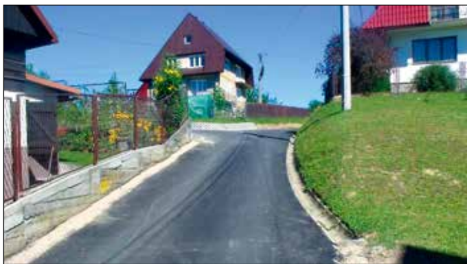
Przebudowa drogi „Na stadion” w Lipnicy Wielkiej

Dróg Samorządowych. Dzięki uzyskanemu dofinansowaniu zrealizowano przebudowę 768 metrów drogi wraz z wykonaniem jej odwodnienia. Droga zyskała na całej długości nawierzchnię asfaltową o szerokości 3,5 m wraz z obustronnymi pobocznymi o szerokości 0,75 m. Wartość robót – 583.139,48 zł (dofinansowanie z Funduszu Dróg Samorządowych – 288.914 zł ).