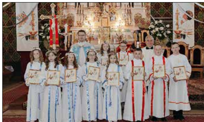
Szkoła Podstawowa - Kiczory