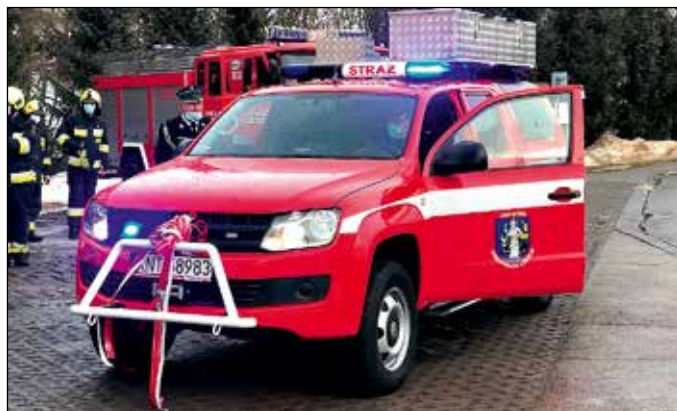
VW Amarok – SLRt – OSP Lipnica Wielka – Centrum