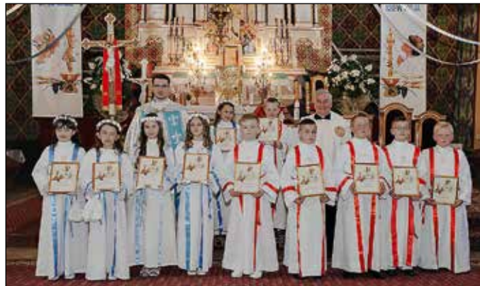
Szkoła Podstawowa Nr 3 - Skoczki