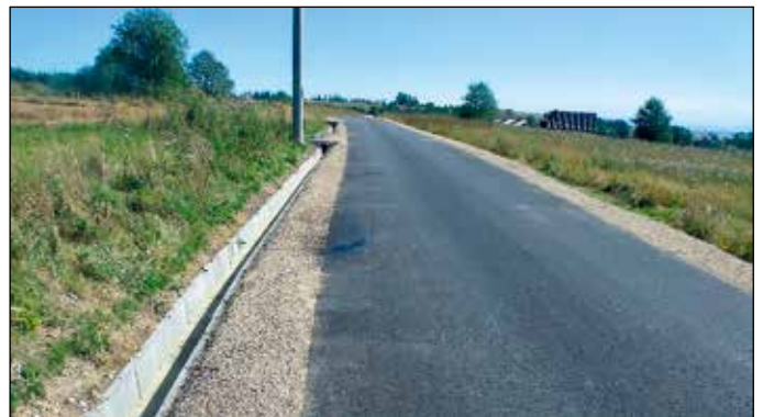
Przebudowa drogi „Na stadion” w Lipnicy Wielkiej

Przebudowa drogi „Na stadion” w Lipnicy Wielkiej, to kolejna inwestycja współfinansowana ze środków Funduszu