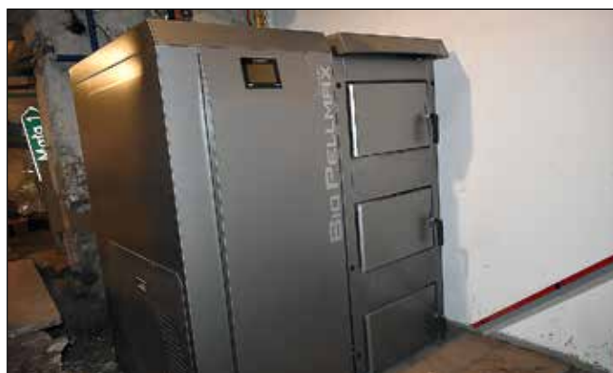
Kocioł na pellet zamontowany w budynku Urzędu Gminy