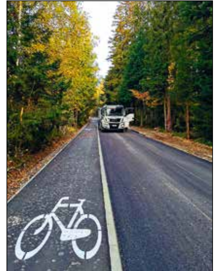
Fragment ścieżki rowerowej i remontowanej drogi Lipnica Wielka Przywarówka

Była to największa inwestycja drogowa prowadzona na terenie gminy w roku 2020. Dzięki pozyskanym ze źródeł zewnętrznych środkom udało się wybudować wyniesioną, dwukierunkową ścieżkę rowerową o szerokości 2 metrów oraz wyremontować i poszerzyć istniejącą jezdnię do parametrów 4,2 szerokości asfaltu oraz 0,5 – 0,75 m pobocza. Inwestycja została zrealizowana dzięki pozyskaniu środków z Funduszu Dróg Samorządowych oraz programu współpracy transgranicznej w ramach projektu pod tytułem: „Ochrona dziedzictwa kulturowego i przyrodniczego na wspólnej Orawie”, który został zatwierdzony do realizacji w ramach naboru do składania wniosków w ramach programu współpracy transgranicznej Interreg V-A Polska-Słowacja, Oś priorytetowa nr. 1: „Ochrona i rozwój dziedzictwa przyrodniczego i kulturowego obszaru pogranicza”. Łączny koszt inwestycji wyniósł – 1.163.376,16 zł (z czego 442.195,95 zł stanowiły środki europejskie, a 304.018,00 zł środki Funduszu Dróg Samorządowych).