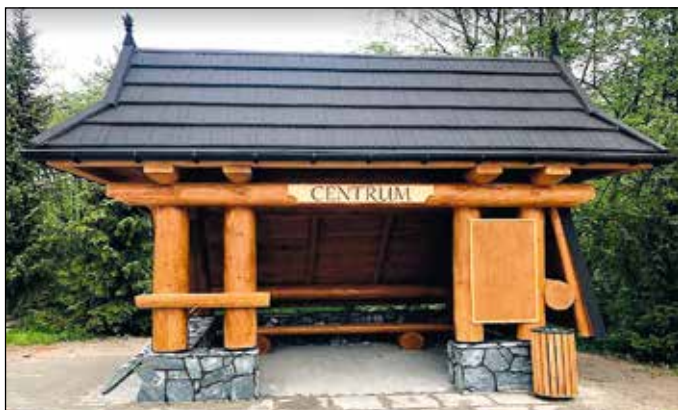
Wiata turystyczno – rekreacyjna w sołectwie Centrum