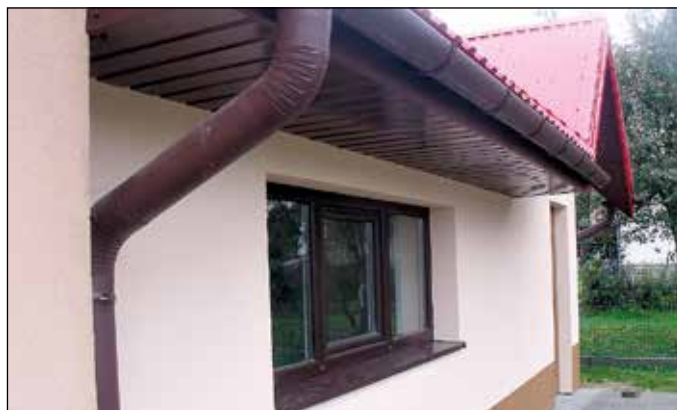
Prace zewnętrzne na budynku OSP Lipnica Wielka – Murowanica