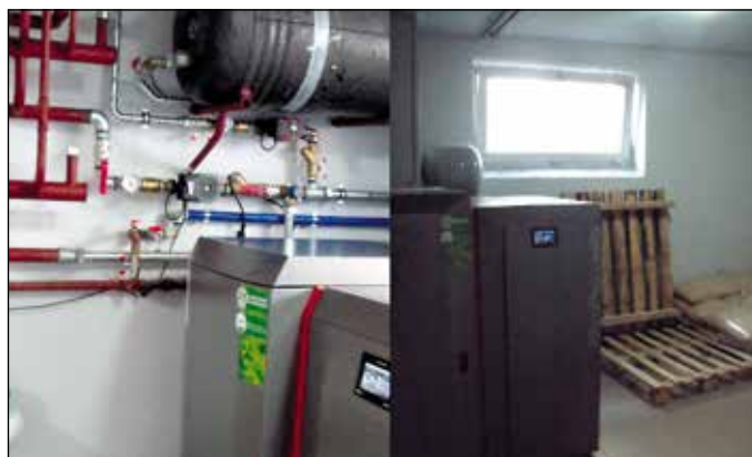
Kotłownia w budynku remizy OSP Lipnica Wielka Centrum