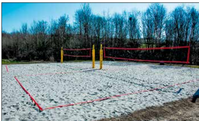
Kompleks boisk do piłki plażowej przy stadionie