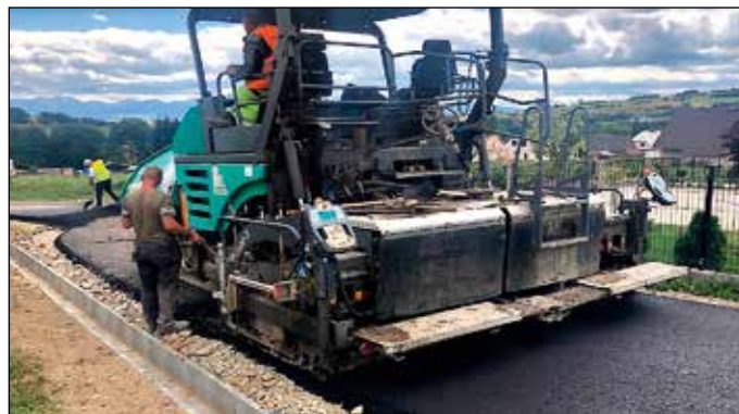
Firma „Kiernia” podczas wykonywania nakładki asfaltowej