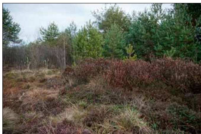
Torfowisko Otrębrowskie Brzegi końcem jesieni

przy uprawie kwiatów lub warzyw. Słyszymy o okładach torfowych, czy kąpielach borowinowych wykorzystywanych w medycynie. Oprócz wymienionych torf był i jest stosowany, jako materiał izolacyjny, a nawet wykorzystuje się go przy produkcji whisky. Torfowiska mają też swoje genius locci. Czasem może warto wybrać się na nie, zatrzymać na skraju kopuły i wyobrazić sobie w pamięci dawny świat. Odgłosy dawnej pracy przy ryciu gliny czy dorni. Poczucie przemijania ludzkiego świata. Będąc tam pamiętajmy jednak o poszanowaniu tego skrawka dawnej Orawy. Z szacunku dla minionych, ale również i przyszłych pokoleń. Pustać jest miejscem specyficz-