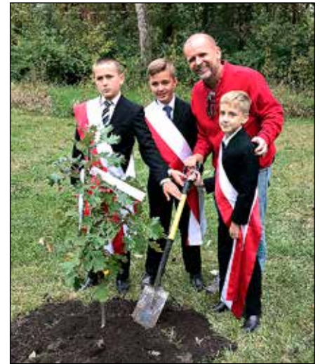
Sadzenie dębów z okazji niepodległości w szkole Jana Brzechwy

W tym roku nasza grupa orawska szczególnie cieszyła się z okazji Święta Niepodległości, ponieważ rok 2020, był rokiem, kiedy cześć Ziemi Orawy została przyłączona do Polski.