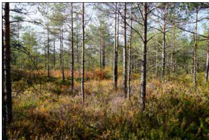
Torfowisko końcem lata

przy uprawie kwiatów lub warzyw. Słyszymy o okładach torfowych, czy kąpielach borowinowych wykorzystywanych w medycynie. Oprócz wymienionych torf był i jest stosowany, jako materiał izolacyjny, a nawet wykorzystuje się go przy produkcji whisky. Torfowiska mają też swoje genius locci. Czasem może warto wybrać się na nie, zatrzymać na skraju kopuły i wyobrazić sobie w pamięci dawny świat. Odgłosy dawnej pracy przy ryciu gliny czy dorni. Poczucie przemijania ludzkiego świata. Będąc tam pamiętajmy jednak o poszanowaniu tego skrawka dawnej Orawy. Z szacunku dla minionych, ale również i przyszłych pokoleń. Pustać jest miejscem specyficz-