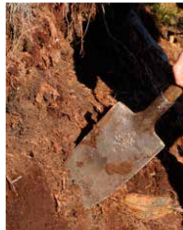
Torf na skraju kopuły

Chyźnianie podobnie, jak jabłonzanie i piekielniczanie mają swoją pustać. Chyźniańsko Pustać (Pustać Chyżne, Pustać Wysoka) znajduje się daleko za wsią, na Górnym Końcu Chyżnego. Otoczona bardzo podmokłymi terenami, porośnięta kosodrzewiną strzeże tajemnic dawnych czasów. Za nią zaczynają się rozległe lasy bagienne zwane Borami. A lipniczanie pustać? Torfowisko Otrębrowskie Brzegi nazywane Borami oraz Torfowisko Janowiackie znajdują się na styku gmin Jabłonka i Lipnica Wielka. Na pierwszym można znaleźć tak charakterystyczne dla torfowisk rośliny, jak mchy torfowce, żurawinę błotną i bagno zwyczajne. Opasane rowami odwadniającymi, zasadzone sosną, czarną olchą, a na okraj-