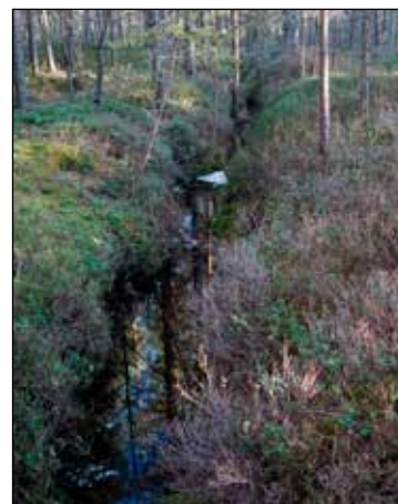
Rów odwadniający kopułę