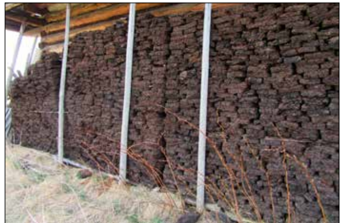
Torf ułożony za domem