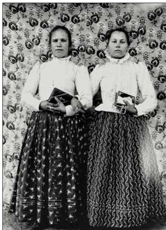
Orawianki na zdjęciach Eugeniusza Sterculi. Bronisław Piłsudski udzielił wielu cennych rad Sterculi, co do jego pracy etnograficznej, m.in. jak ma fotografować stroje, kulturę materialną, by zdjęcia posiadały walory dokumentacyjne. Dzisiaj zbiór fotografii Eugeniusza Sterculi jest cennym źródłem wiedzy o orawskiej kulturze