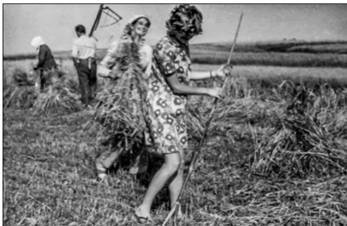
Żniwa u Jazowskich

Mężczyźni kosili kosą, a kobiety odbierały z pokosu i wią- zały snopki. Dzieci się zabierało w pole i zbierały kłosa, które się gubiły w czasie koszenia i wiązania. Mama mówiła: