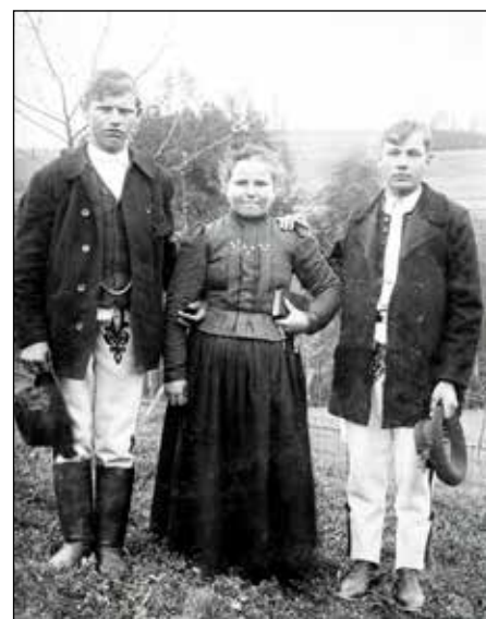
Orawianie, początek XX w.

Trudno ocenić, czy odnalezienie „goldprasy” należącej do „Apostoła Orawy” w okrągłą rocznicę – w stulecie włączenia części Orawy do niepodległej Polski, którego niestrudzonym orędownikiem był przecież Piotr Borowy, to tylko niezwykle przypadek, zrządzenie losu, czy może celowe działanie siły wyższej. Jej ogrom, bo waży ona ponad 400 kg, budzi nawet w dzisiejszych czasach respekt. Sam jej transport,