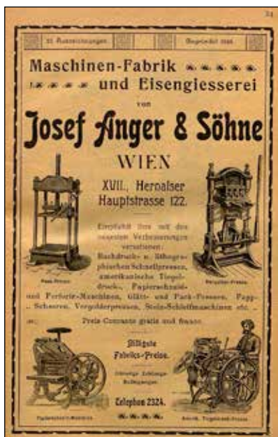
Wycinek prasowy – reklama maszyn firmy Josef Anger & Söhne; źródło: zedhia.at